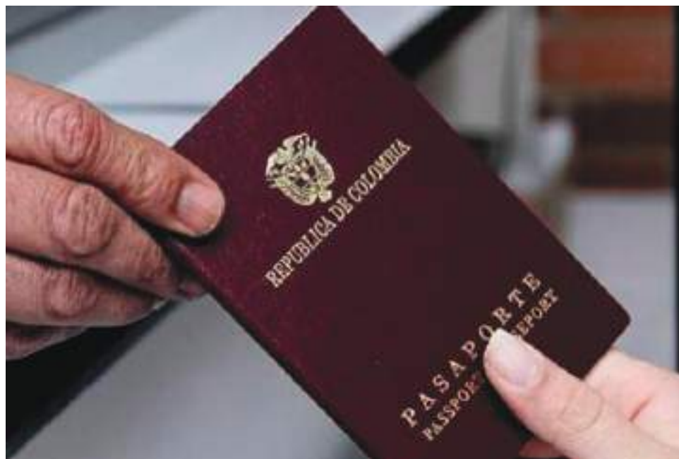
11.896 citas están planeadas hasta el mes de septiembre del año 2022.

Un 500% de sobre demanda tiene a esta fecha el Huila teniendo en cuenta que para el año 2018 se tramitaban entre 200 y 300 pasaportes, 1.684 se emitieron en el año 2021 y a corte de marzo hasta septiembre del 2022 hay 11.896 citas para expedición o renovación.