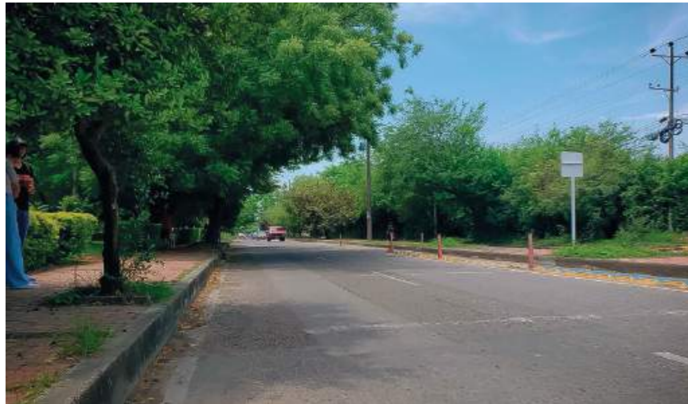
La avenida a Alberto Galindo uno de los sectores afectados por la oscuridad.