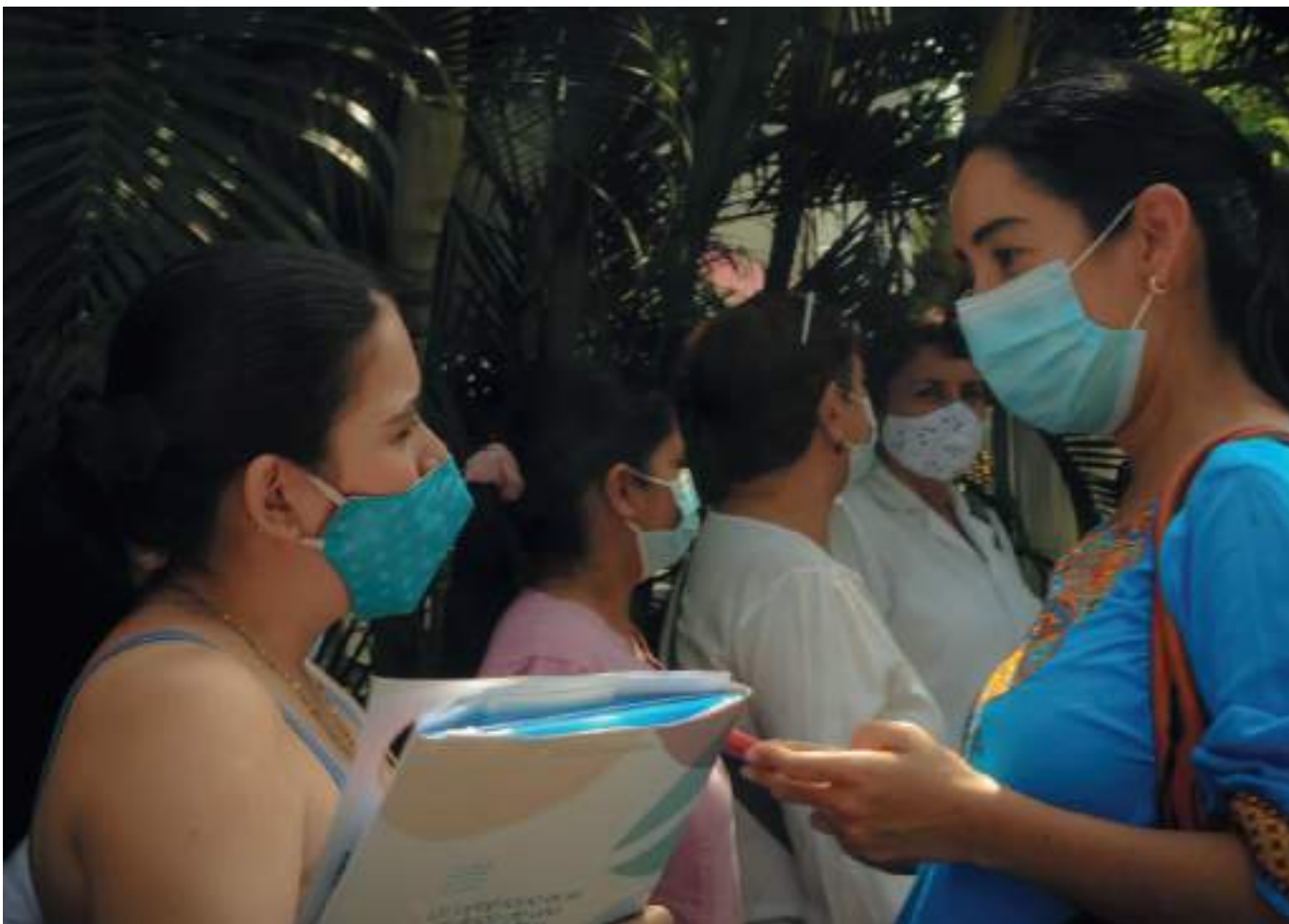
Hacen un llamado para que se les escuche y resuelva su situación.