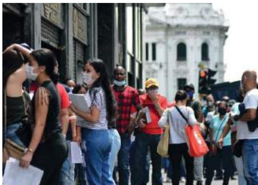
El Departamento Administrativo Nacional de Estadísticas reveló que en el segundo mes del año 1.5 millones de personas ingresaron al mercado laboral.

Las ciudades con las mayores tasas de desempleo fueron en su orden Quibdó con un 23.1%, Tunja 17.5% y Valledupar con un 16.7%. En contraste las de menor desocupación se encuentran Armenia con un 8.8%, Bucaramanga 9.6% y Villavicencio con un 10.9%.