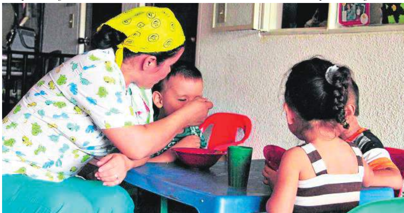
Aproximadamente 100 hogares de bienestar se están viendo afectados con esta problemática en la ciudad de Neiva. (Imagen de ambientación)

Aunque se le solicitó al Instituto Colombiano de Bienestar Familiar Regional Huila que concediera una entrevista o emitiera un comunicado de prensa explicando la situación, al cierre de esta edición no se logró obtener respuesta.