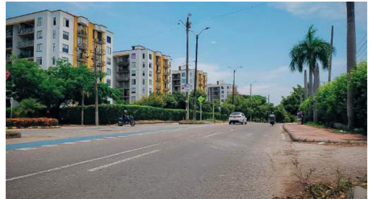
Avenida a Alberto Galindo también se encuentra a oscuras.