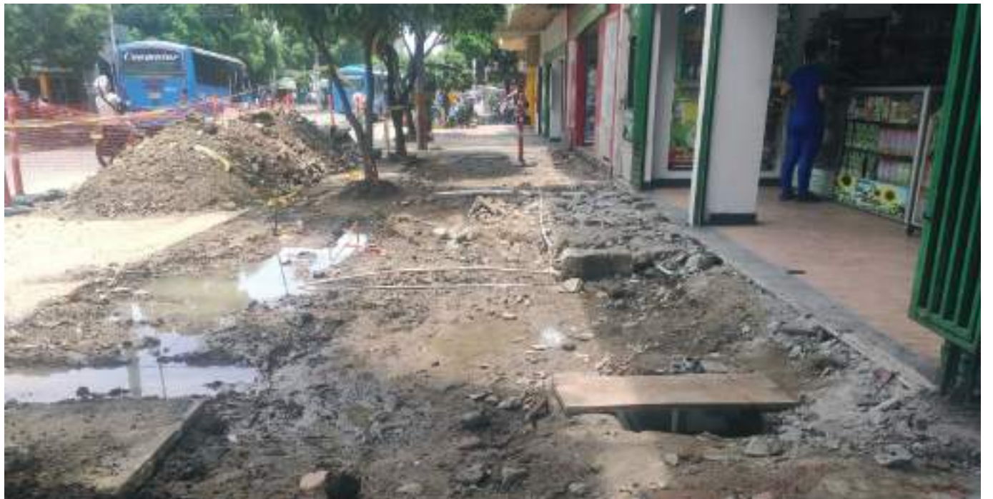
"Uno no puede caminar tranquilo, hay trancones, escombros en la vía, deberían ser más organizados, terminar una parte y seguir con la otra, no dañar las dos aceras al tiempo", manifiesta uno de los habitantes del sector donde se adelantan estas obra que ya casi completan 1 mes.

Finalmente, fue nula la comunicación con el encargado de la obra y la secretaria de Vías, pues, aunque esta Casa Editorial intentó recibir sus declaraciones, no fue posible.