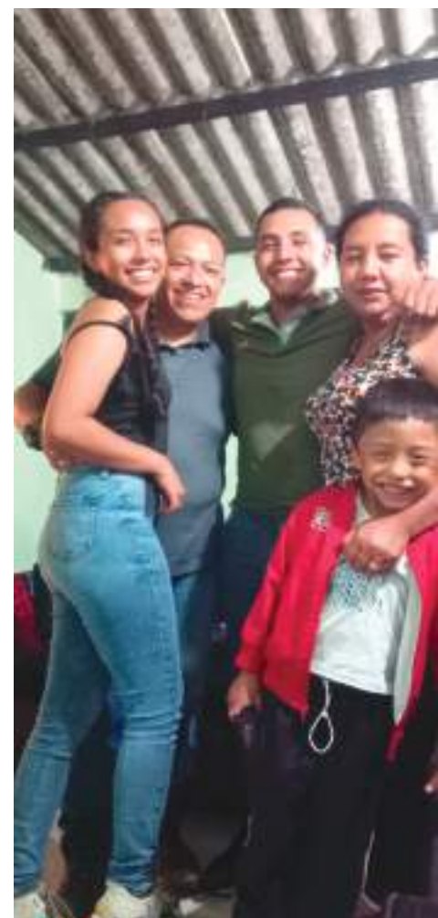
Junto a su familia, ahora vive la realidad actual.

“Al instante de la explosión, quedé de pie, por lo que creí que no me había pasado nada, miré y me vi el pie en la parte delantera normal, el daño estaba en el talón”.