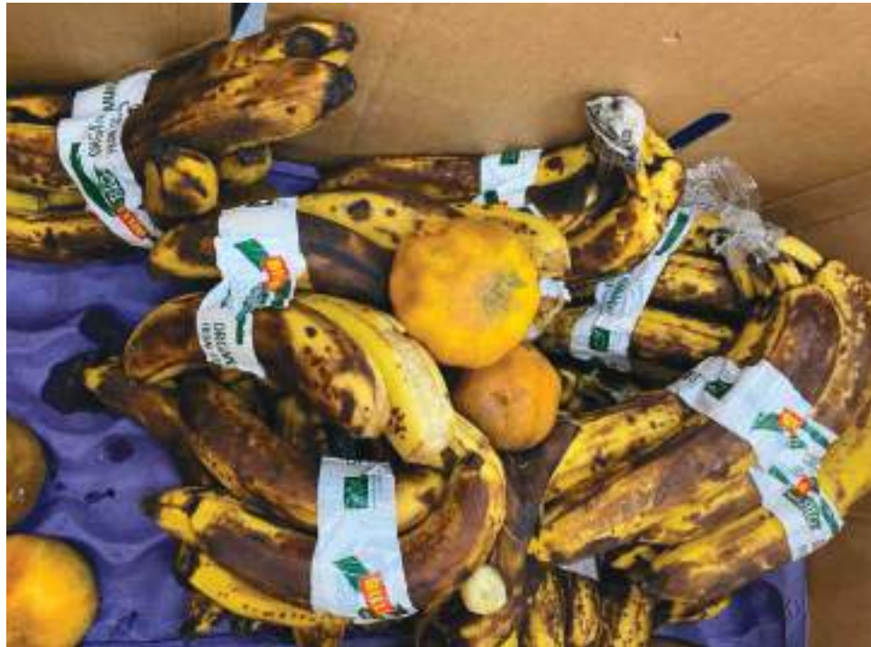
El operador Fuerza Viva, encargado de entregar las raciones alimenticias a los hogares de bienestar familiar está repartiendo alimentos en mal estado, según las madres comunitarias. (Imagen de ambientación)

Según la información proporcionada, el operador que está presentando estos inconvenientes es Fuerza Viva, el cual sólo le proporciona las raciones alimenticias a una parte de hogares de bien-