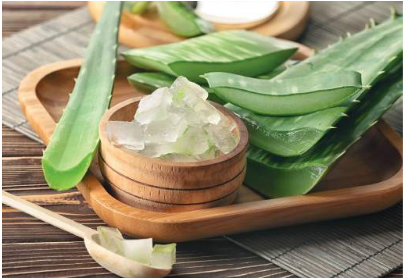
Las excelentes propiedades del aloe vera se destinan a diferentes usos.

El beneficio de usar aloe vera es que es denso en agua, por lo que es un ingrediente excelente para usar en productos para el cuidado de la piel para pieles secas y con picazón. Mantiene la piel hidra-