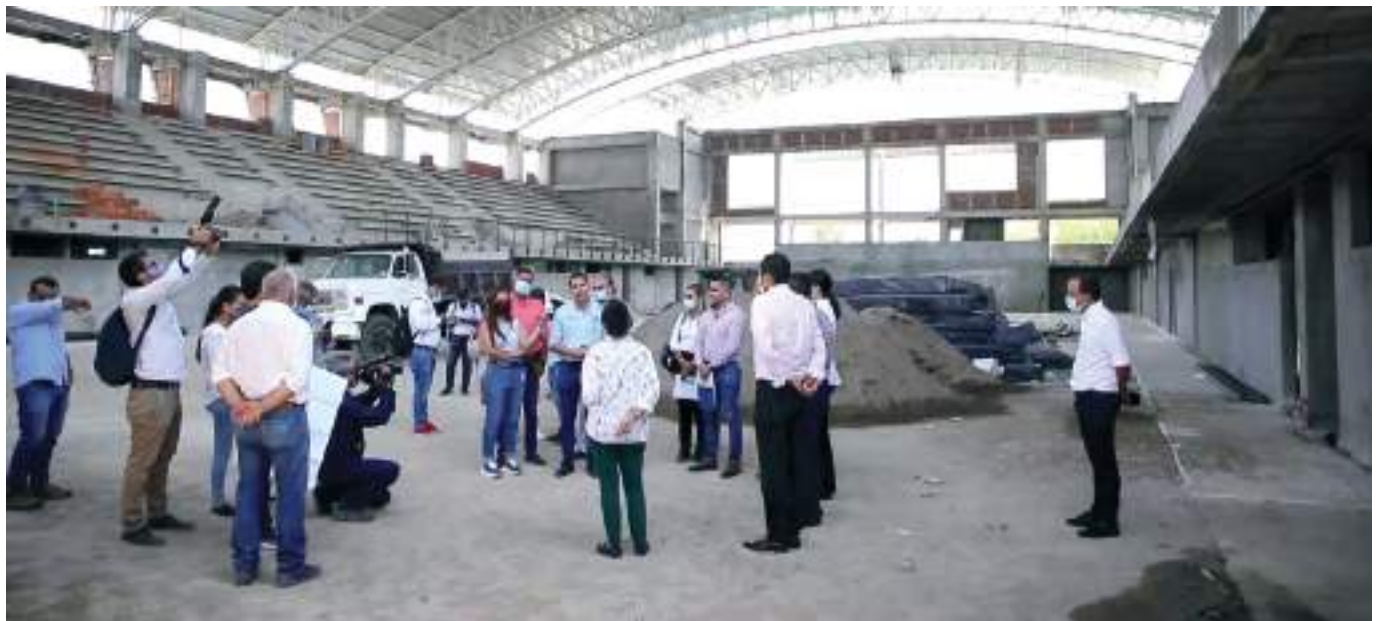
La Subdirectora del SGR visitó el Huila con el fin de verificar los diferentes proyectos que se están llevando a cabo con los dineros dispuestos por el Gobierno Nacional, dentro de los que se encuentra el estadio menor de Voleibol.

“El Huila se ha visto beneficiado con 350 proyectos por más de 900 mil millones de pesos en todo el Gobierno del Presidente Iván Duque. Como el presupuesto de regalías es bienal, para estos dos años tenemos 134 proyectos por más de 340 mil millones de pesos, sabemos que hay muchas necesidades en los territorios y la idea es utilizarlos de la mejor