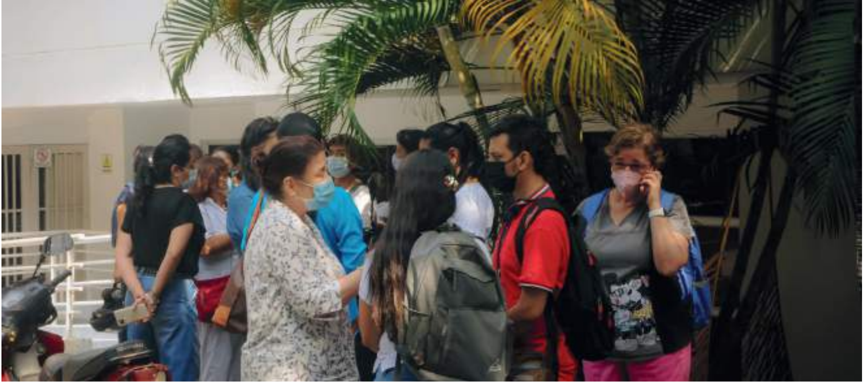
Los exempleados de Mi IPS Huila se refirieron a anomalías que tuvieron que padecer durante muchos años.

rectivas en Neiva nunca nos manifestaron nada, siempre preguntamos qué pasaba con nosotros y nunca hubo una respuesta certera. Hasta este momento hace ya quince días aproximadamente, cuando nos llegó una carta del presidente de la corporación diciéndonos que cada uno para su casa y que él nos informaba cuando nos daba información de lo que pasaría con nosotros, y hasta el momento no tenemos certeza de nada, es toda una incertidumbre, nadie nos dice nada, las directivas no se volvieron a pronunciar.”