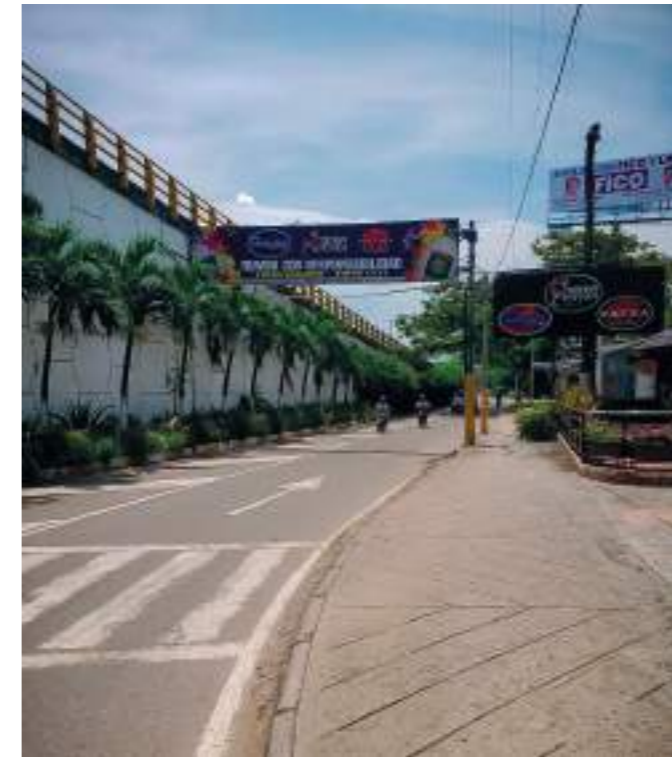
El Puente en el Tizón, a la salida a Bogotá en las noches es completamente oscuro.