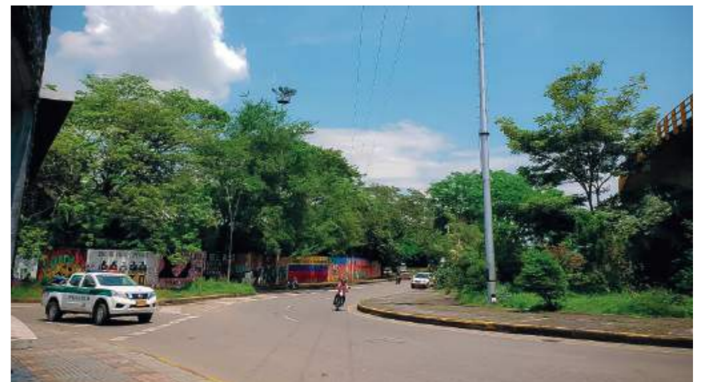
Son muchos los sectores afectados en Neiva.

“Realmente es tal el robo de cable que no damos abasto para atender la demanda por los reclamos de la ciudadanía, pero estamos en vía de solucionar estos daños”.