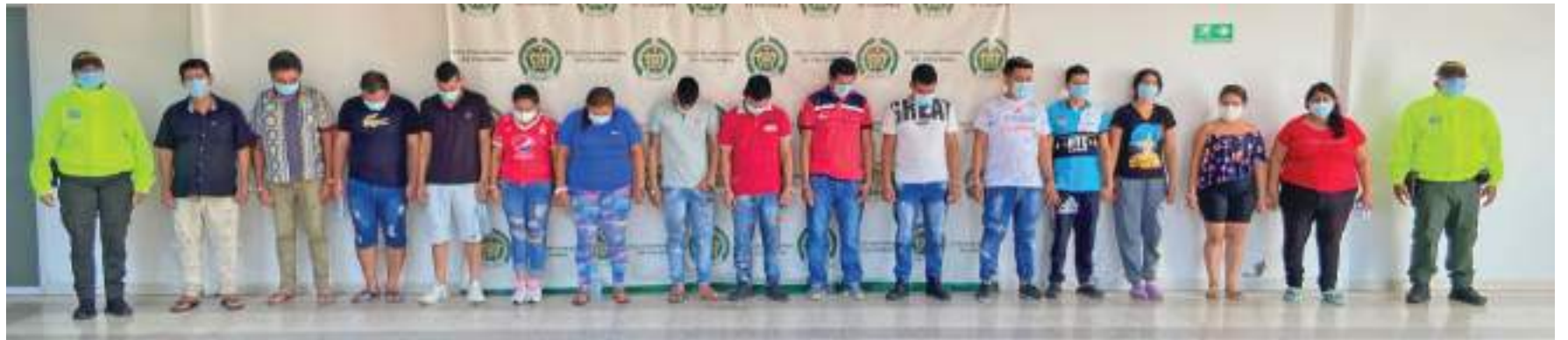
Las 15 personas capturadas por tráfico de estupefacientes y homicidio.

■ Durante varios meses, las autoridades adelantaron una exhaustiva investigación y seguimiento para dar con la desarticulación de una banda de delincuencia organizada dedicada al tráfico y comercialización de estupefacientes en las comunas de la ciudad de Neiva. Además, se les señala de la muerte de un hombre que fue hallado incinerado meses atrás.