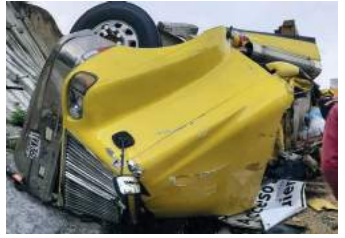
Al parecer, tuvo una falla en el sistema de frenos lo que ocasionó el siniestro.

congestión vehicular. En el choque se vieron involucradas tres tractomulas que se encontraban transitando por la zona. Las autoridades buscan esclarecer qué fue lo que sucedió realmente en los hechos que dejan como saldo esta persona fallecida.