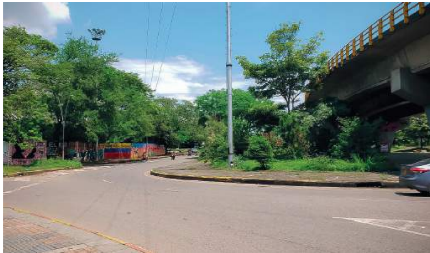
Intercambiador de la Usco también se vio afectado.

Son varios los sectores a oscuras en las comunas uno y nueve y el intercambiador del Tizón, por cuenta del robo del cableado del alumbrado público.