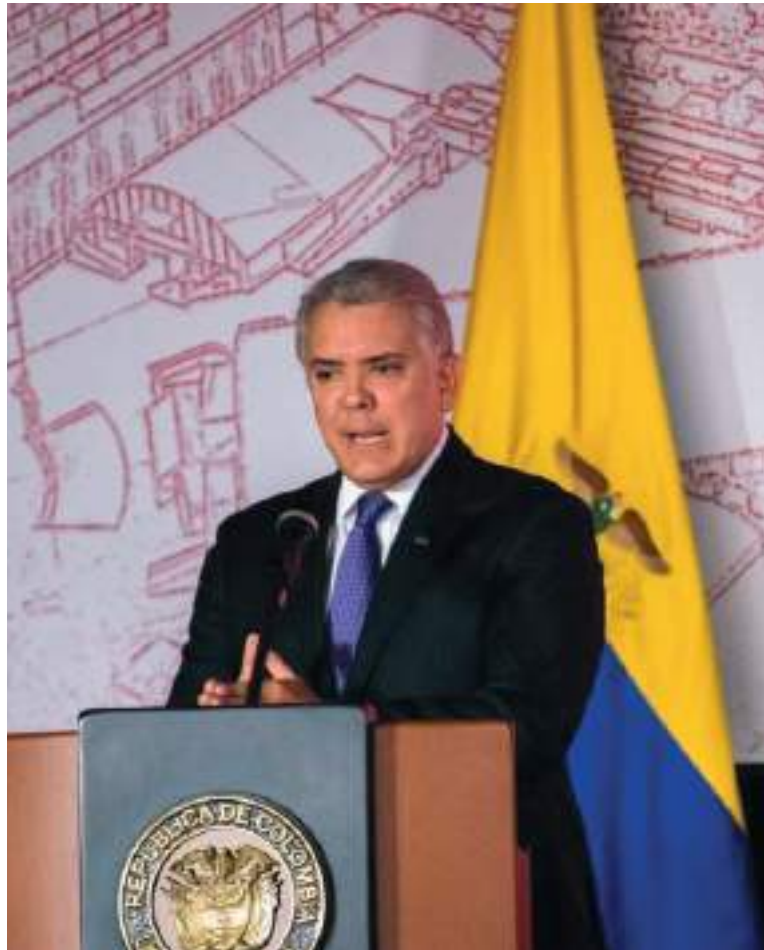
Iván Duque aseguró que personas abatidas en Putumayo estaban armadas.

De la misma manera, el jefe de Estado indicó que las Fuerzas Miliars responderán todos los requerimientos que realicen los organismos de control como es el caso puntual de la Procuraduría General de la Nación, al insistir en que “no debe quedar ningún manto de duda sobre el accionar de las autoridades”,