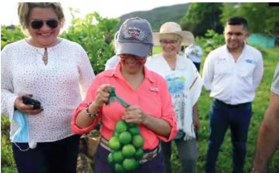
El proyecto de cosecha de cacao y de limón Tahití en el Departamento del Huila, dos apuestas productivas que generan empleo y recursos.