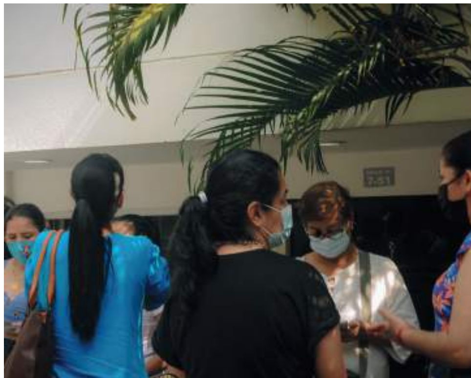
Algunos de los exempleados han entablado acciones legales independientes, pero, por ahora, no hay respuesta positiva.

jando porque ellos decían que se van a poner al día, pero es mentira, nunca pasó. La corporación Mi IPS del Huila, nos dicen que ellos dependen de Medimás y a ellos les congelaron las cuentas, entonces no se pueden poner al día con nosotros, pero eso no es un problema de ahora, es un problema de hace rato y en ese momento Medimás no estaba liquidado.”