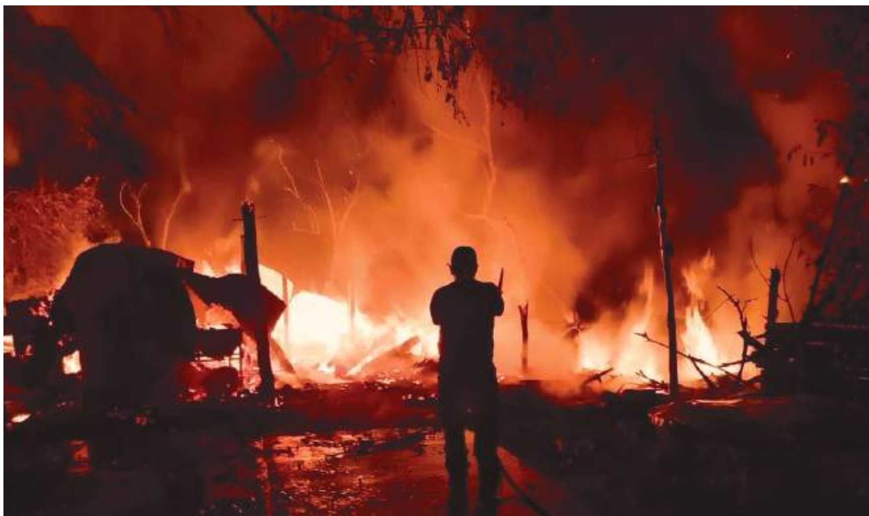
La comuna más afectada por los constantes incendios estructurales y en zonas vegetales es la Seis, que comprende todo el sur de la ciudad de Neiva.

■ Debido a los intensos calores que vivió la ciudad de Neiva en el mes de agosto y el mal actuar de las personas, se causaron alrededor de 33 incendios vegetales y en la zona urbana se reportaron otros 75. La comuna Seis y el corregimiento El Caguán fueron los lugares más afectados.