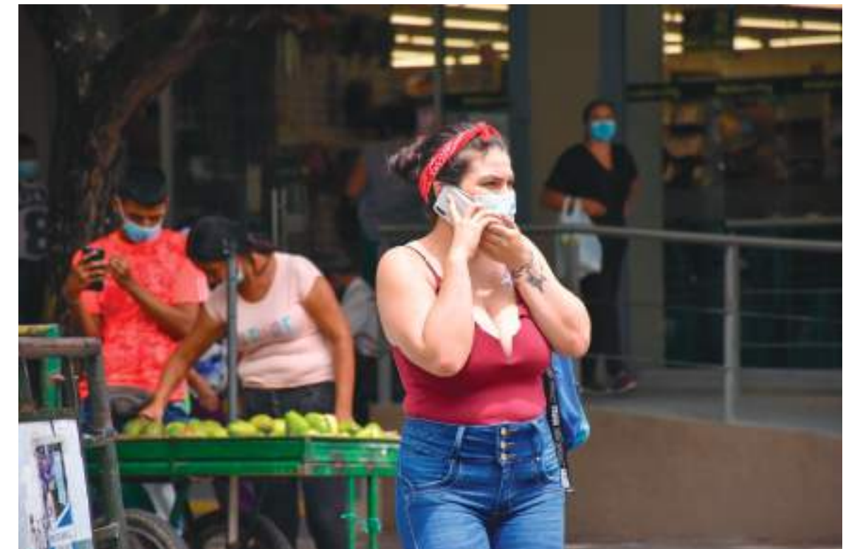
Las mujeres están preparadas para alcanzar puestos de alto rango.