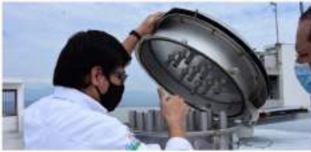
Neiva con uno de los mejores aires a nivel nacional ■ 8 Y 9 ENFOQUE