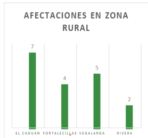
Número de casos presentado en zona rural y urbana de Neiva.

En los últimos tres meses del 2021, en la ciudad de Neiva se han venido presentando conflagraciones, donde no solo se ha visto afectada la zona vegetal que ostenta el municipio sino también las distintas comunas urbanas.