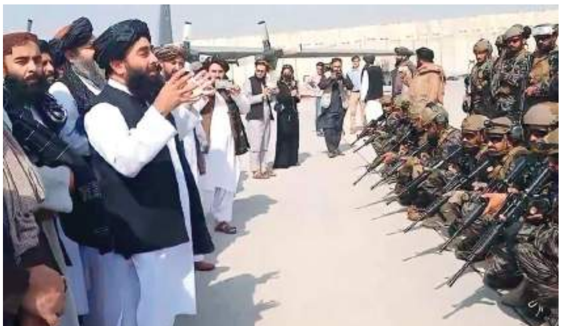
Los talibanes, nuevos gobernantes de Afganistán, se mostraron triunfales ayer en el aeropuerto de Kabul, con sus agentes de las fuerzas especiales y su bandera, tras la retirada de los últimos soldados estadounidenses.