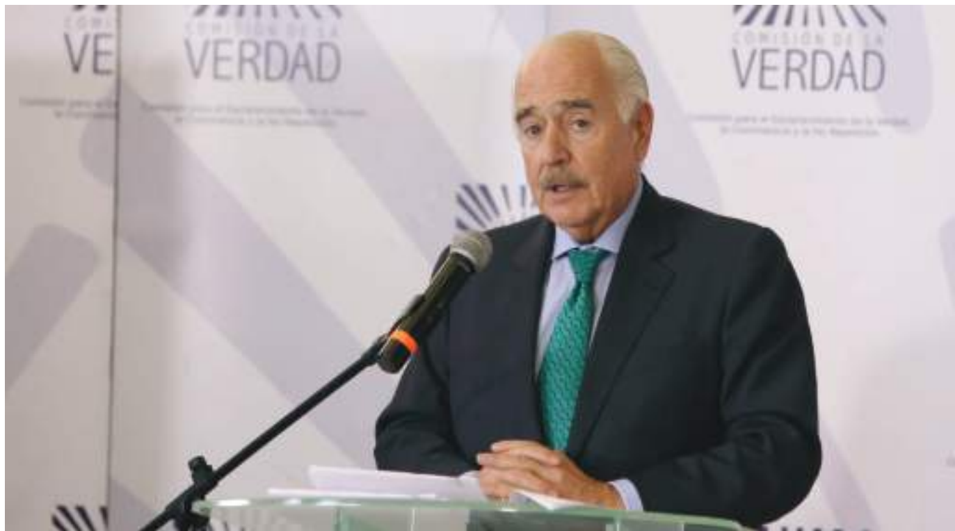
El expresidente Andrés Pastrana Arango, durante su intervención ante la Comisión de la Verdad.

Otro de los puntos que tocó Pastrana durante su intervención fue hablar sobre la famosa silla vacía, que fue conocido como el primer desplante de Manuel Marulanda contra el proceso de paz.