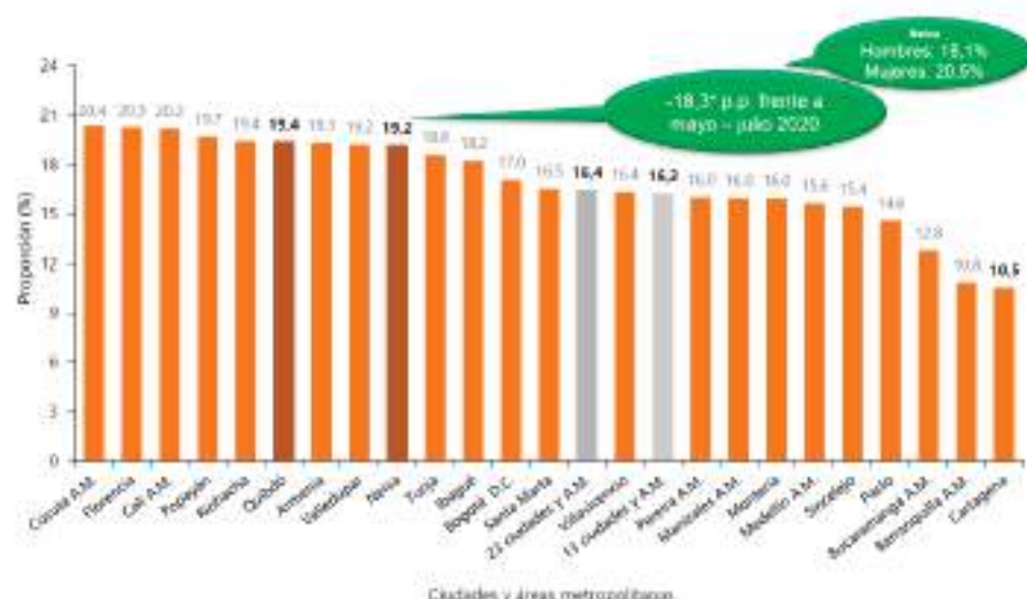
Tasa de desempleo. 23 ciudades y áreas metropolitanas (mayo-julio 2021).

Comercio y reparación de vehículos tuvo el mayor crecimiento (+644 mil) de la población ocupada nacional en julio de 2021, aportando así 3,6% a la variación nacional.