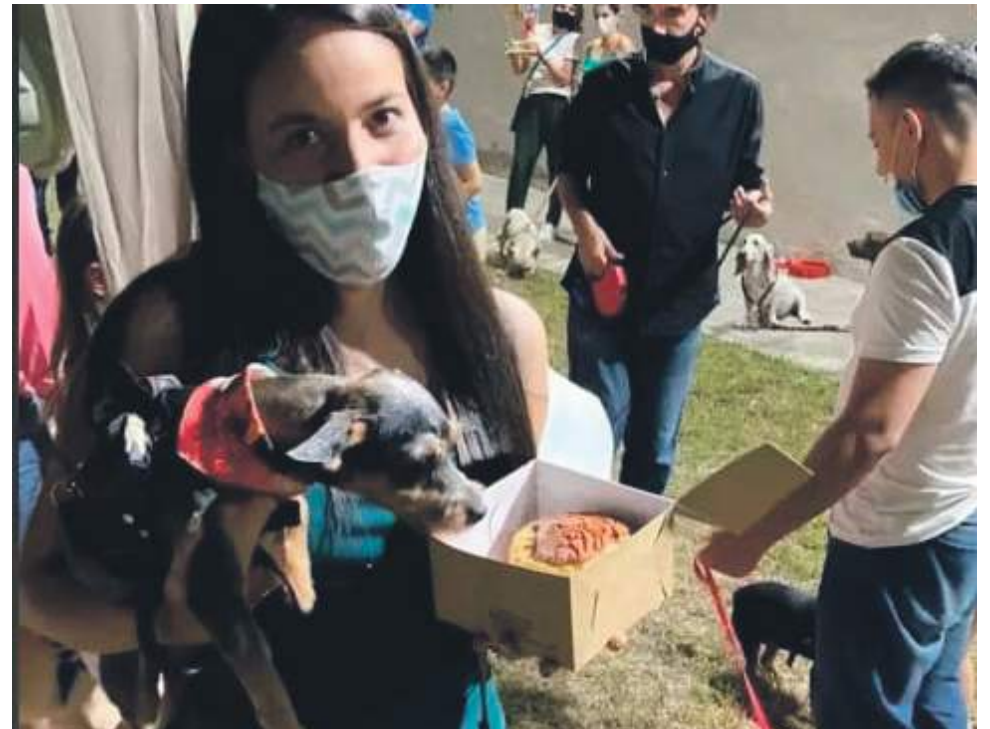
Una de las clientas en la celebración del primer aniversario.