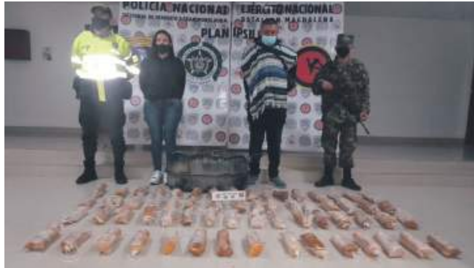
Las operaciones fueron coordinadas entre el Batallón Especial Energético y Vial y Policía, en diferentes municipios del Huila.

El Ejército Nacional y la Policía Nacional, continuarán realizando operaciones con el fin de neutralizar los diferentes eslabones de la cadena del narcotráfico y el accionar delictivo de los grupos ilegales que confluyen en el Huila.