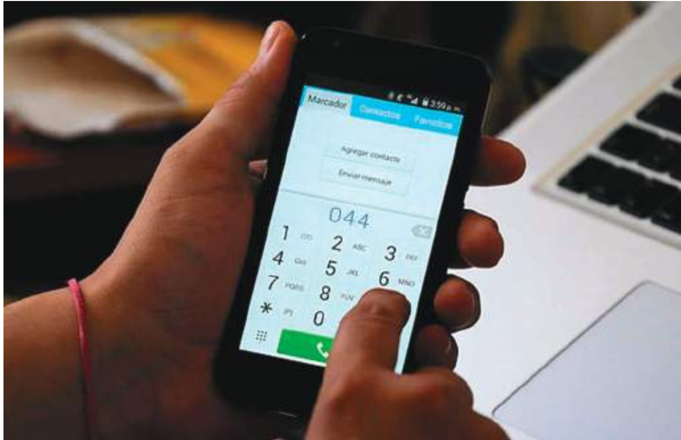
Cada usuario debe modificar los números de contacto hacia teléfonos fijos que tenga almacenados en su dispositivo o agendas digitales.

Para que usted pueda hacer una llamada desde su teléfono fijo a un número celular a partir de hoy, debe marcar directamente el número de celular al que quiera llamar sin ningún tipo de prefijo ni dígito adicional.