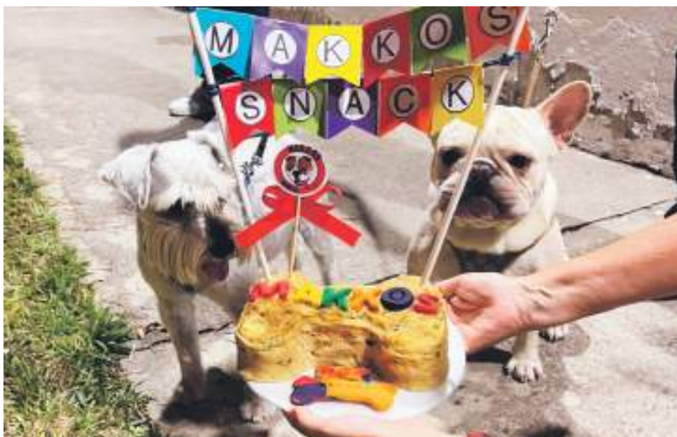
Los peluditos reciben todo un paquete en su celebración.