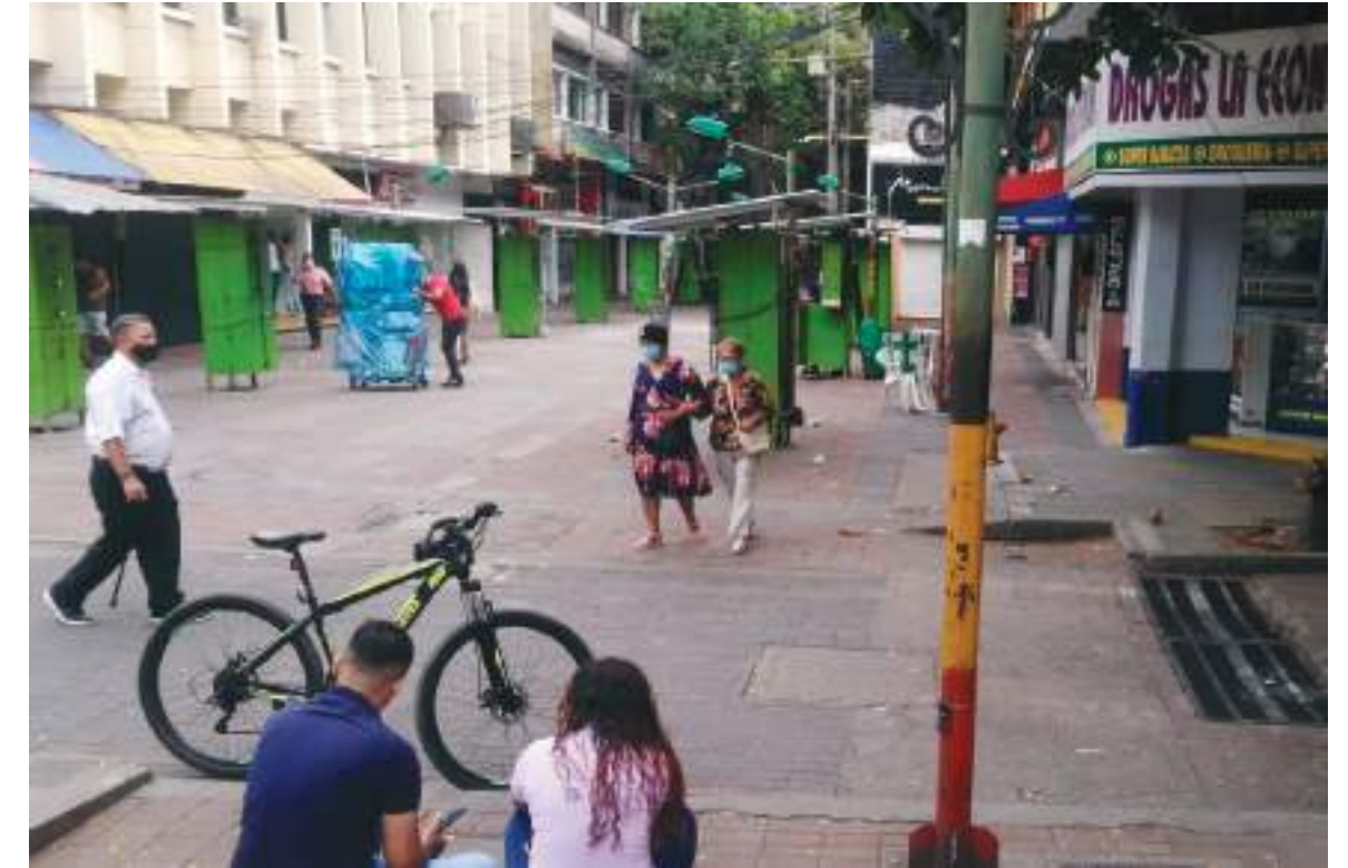
Muchas no solo no trabajan, sino que tienen que esperar alternativas.

En resumen, a medida que los gobiernos van dando forma a políticas para lidiar con las repercusiones de la crisis global de la pandemia, es urgente que pongamos a las mujeres trabajadoras en igualdad de condiciones que los hombres trabajadores