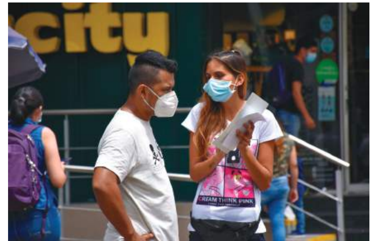
Las jóvenes buscan su lugar en cada espacio.

El Gobierno Nacional lanzó el primer proyecto tipo de regalías con enfoque de género con la idea de permitir a las entidades territoriales ahorrar tiempo y costos en la formulación de proyectos productivos para mujeres.