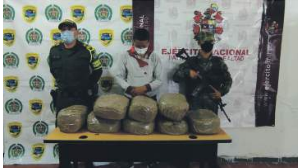
El Ejército Nacional y la Policía Nacional, continuarán realizando operaciones con el fin de neutralizar los diferentes eslabones de la cadena del narcotráfico.

En el sur del Huila, las labores contra el narcotráfico fueron adelantadas por tropas del Batallón de Infantería N° 27 Magdalena de la Novena Brigada y personal de Tránsito y Transporte del Departamento de Policía Huila.