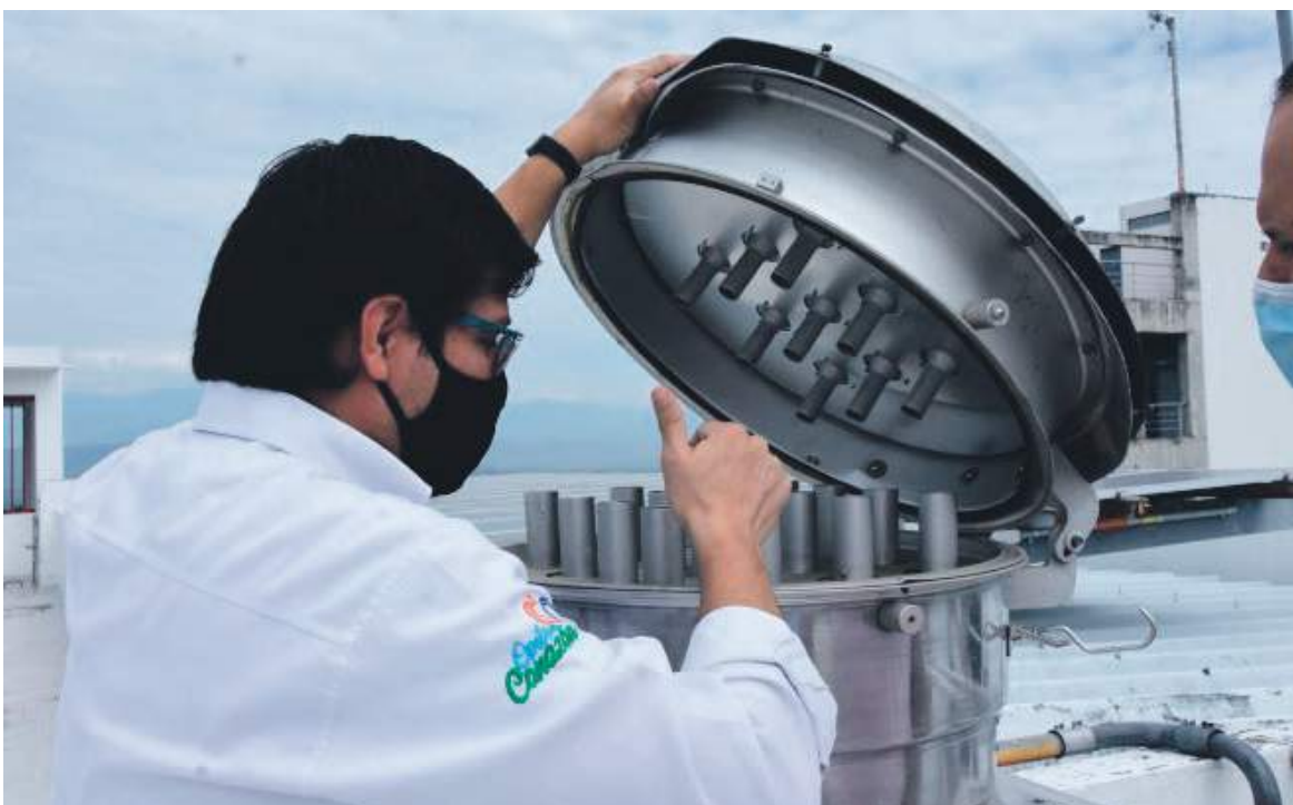
En Colombia hay 203 estaciones que monitorean los factores contaminantes, y estas determinan cuándo las ciudades deben encender las alarmas.

Dicho elemento se puede definir como un conjunto de equipos de monitoreo de los contaminantes atmosféricos, que se encuentran instalados en un lugar de interés con el propósito de determinar niveles y calidad de aire. Esta infraestructura debe estar acompañada de todas las actividades necesarias para su buen funcionamiento, dentro de las cuales se puede mencionar la operación por personal calificado, programas de mantenimiento preventivo, un sistema de administración de información que permita una correcta validación de los datos, entre otras.