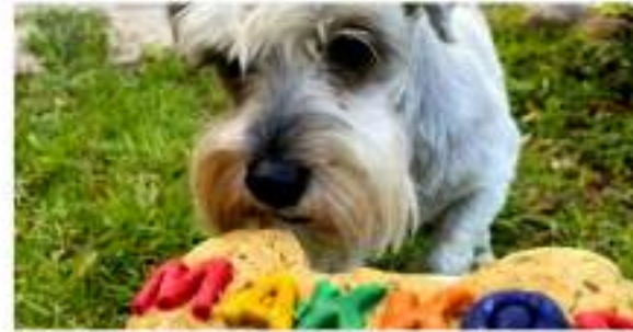
Makko's Snack, alegría y celebración para los peluditos ■ 12 Y 13 CRÓNICA