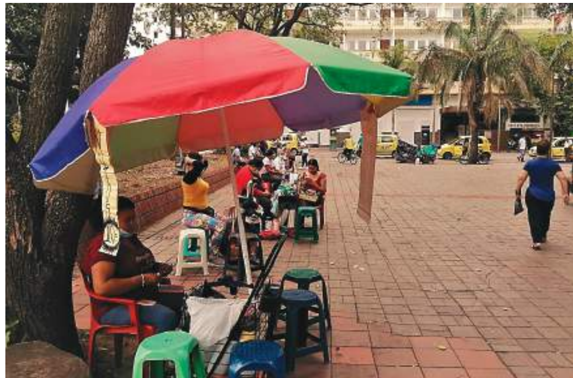
Para muchas al igual que los hombres el rebusque es la alternativa.