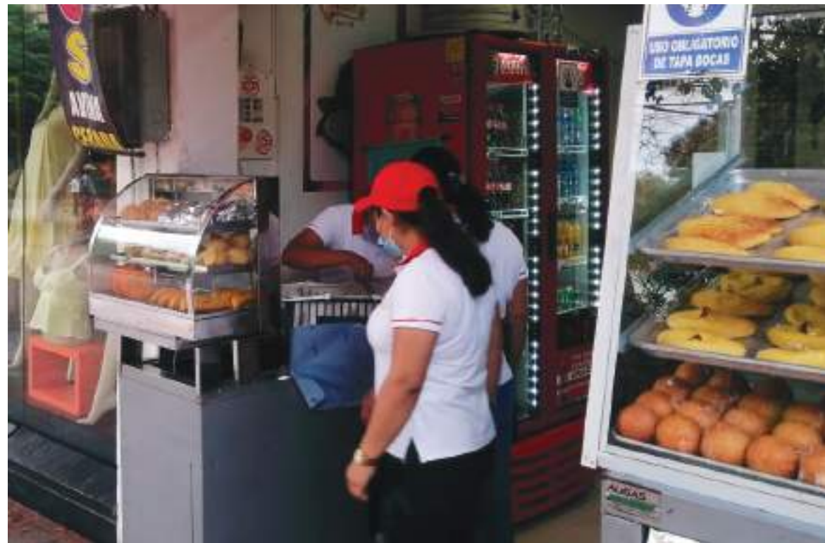
Piden que haya más oportunidades y formalidad en el trabajo.