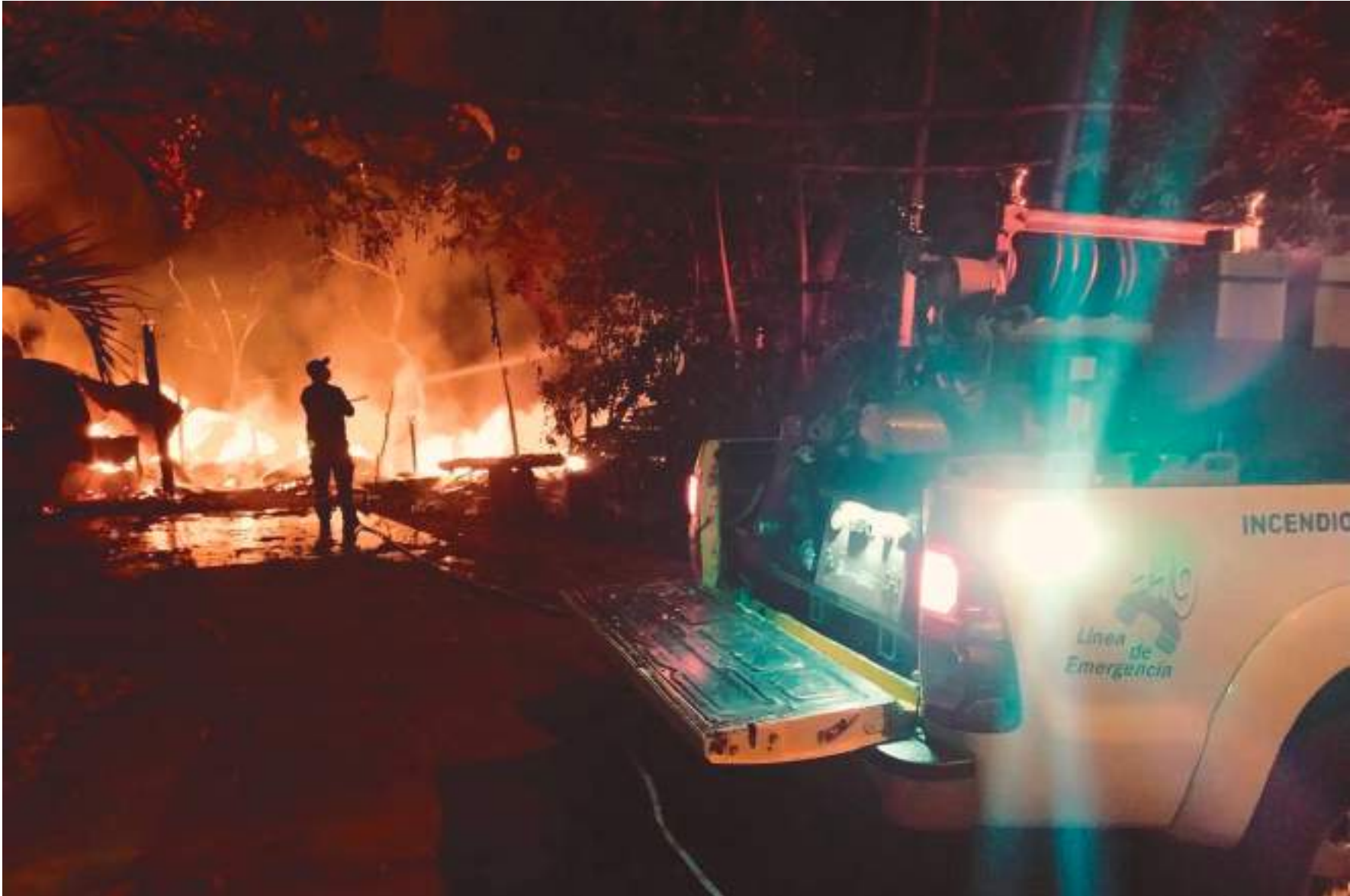
La Comisión de Incendios Forestales se implementó con el fin de hacer el seguimiento, control y coordinación frente a los incendios de cobertura vegetal y forestal.

meses estos han destruido y están afectando en gran manera la flora y fauna que existe.