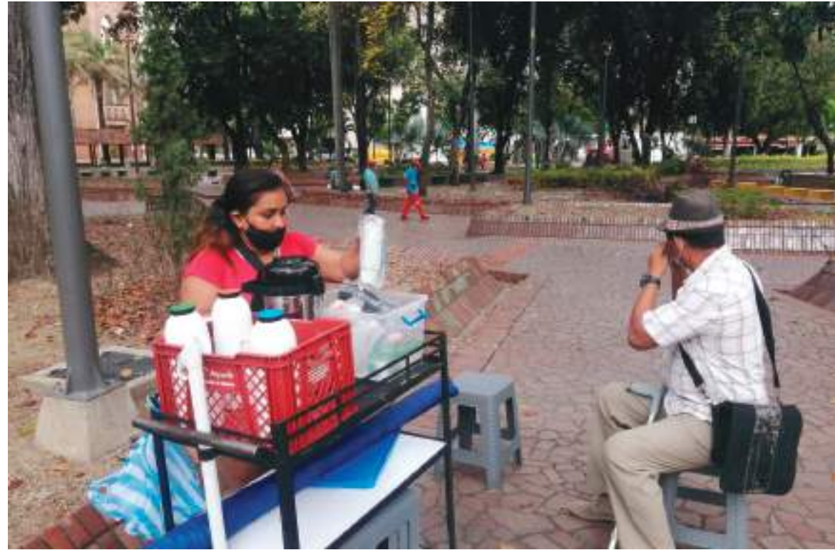
Las mujeres han sido las más afectadas con la pérdida de su trabajo por la pandemia.