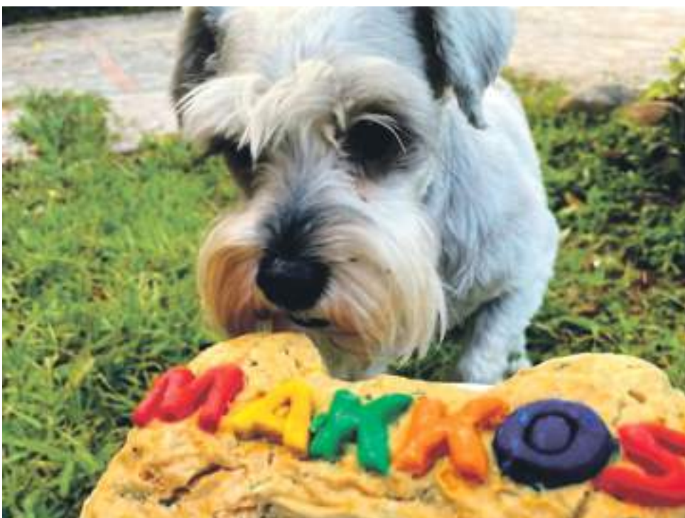
Las sorpresas son permanentes para las mascotas

“Yo si lo veo qué ha ido creciendo de tal manera que estamos albergando la posibilidad incluso de desarrollar este emprendimiento en Texas en los Estados Unidos”.