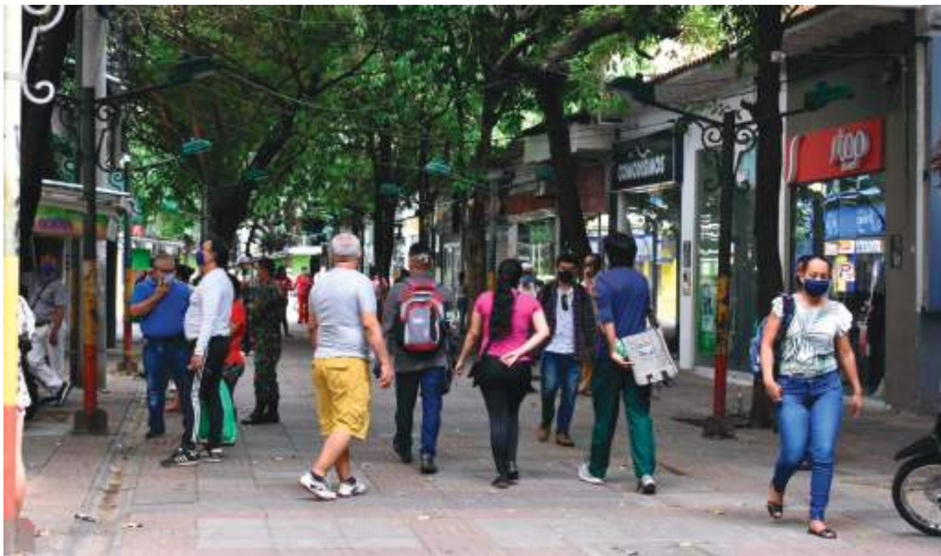
El total de mujeres ocupadas a nivel nacional se incrementó 23,0% en comparación con julio de 2020; por su parte, el número de hombres ocupados aumentó 12,3%.

Por su parte, Otras cabeceras contribuyeron con 3,8% con un total de 5,2 millones de ocupados; las ciudades de Tunja, Florencia, Popayán, Valledupar, Quibdó, Neiva, Riohacha, Santa Marta, Armenia y Sincelejo contribuyeron con 1,3% a la variación nacional dado que su total