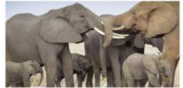
Kenia aumenta su población de elefantes de sabana ■ 20 CONTRAPORTADA