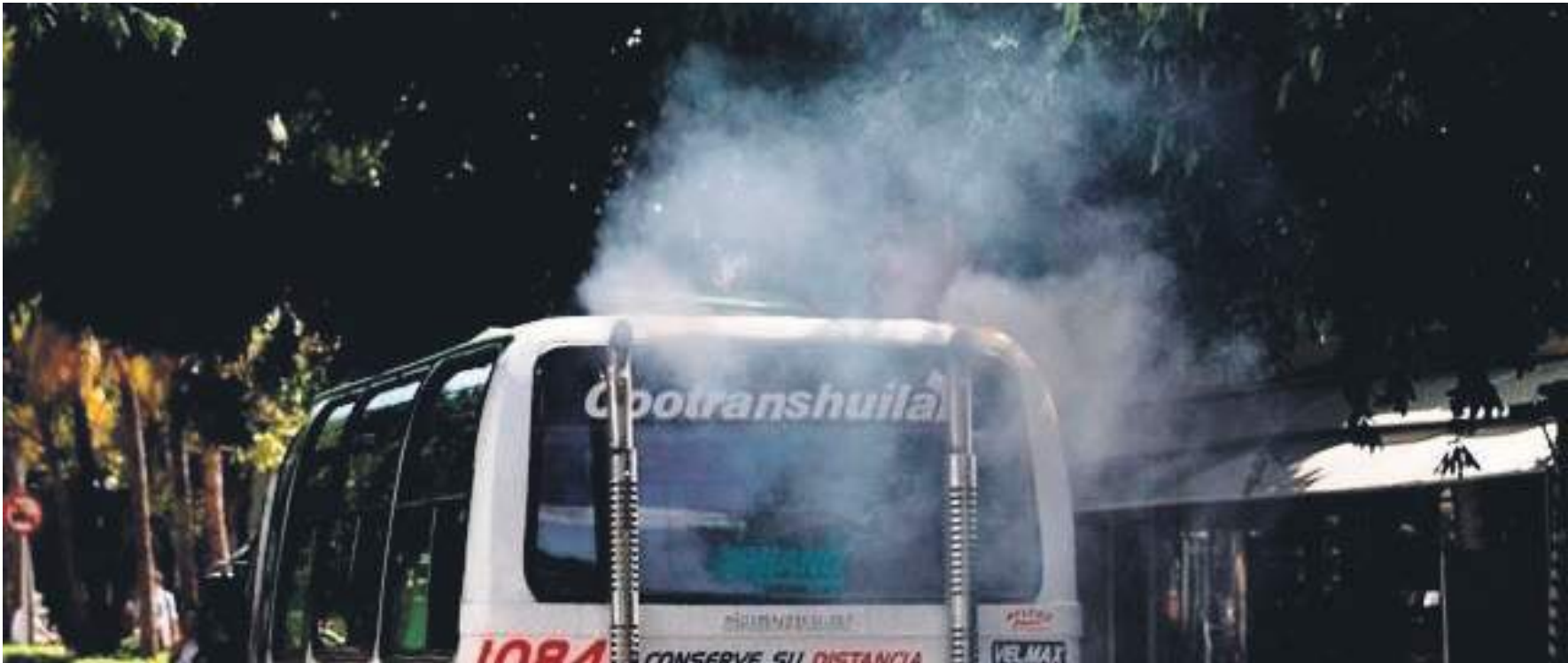
Mediante campañas se genera una mayor sensibilización a la comunidad frente al medio ambiente.

Por ello, se han realizado distintas jornadas también de concientización en el municipio, ya que, según el funcionario ante esta ley hay desacato a la norma, por cultura y por falta de conocimiento.