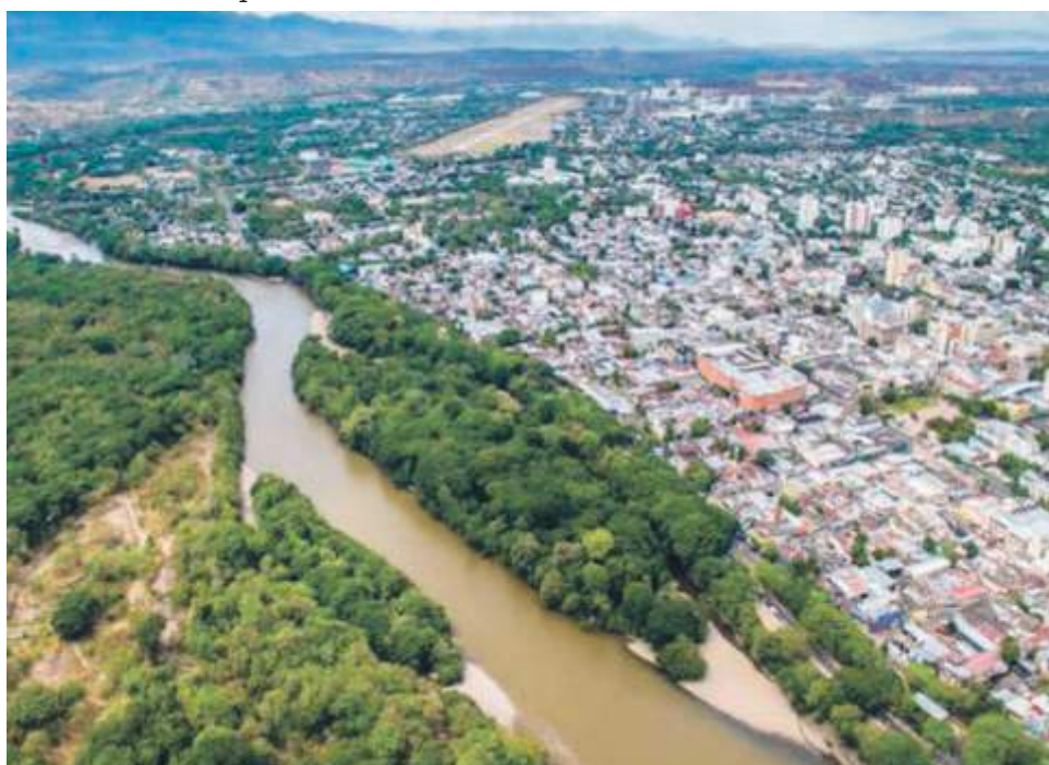
La calidad del aire que ostenta Neiva tiene una concentración promedio de 28 microgramos sobre metro cúbico de PM10 (contaminante atmosférico).

“Lo que más contamina en estos momentos en la ciudad de Neiva, en cuanto a la actividad sonora es el vendedor ambulante que utiliza altoparlante para la promoción y venta de los productos y el incumplimiento de los bares, gastrobares y discotecas donde emiten ruido a altos volúmenes”, sostuvo.