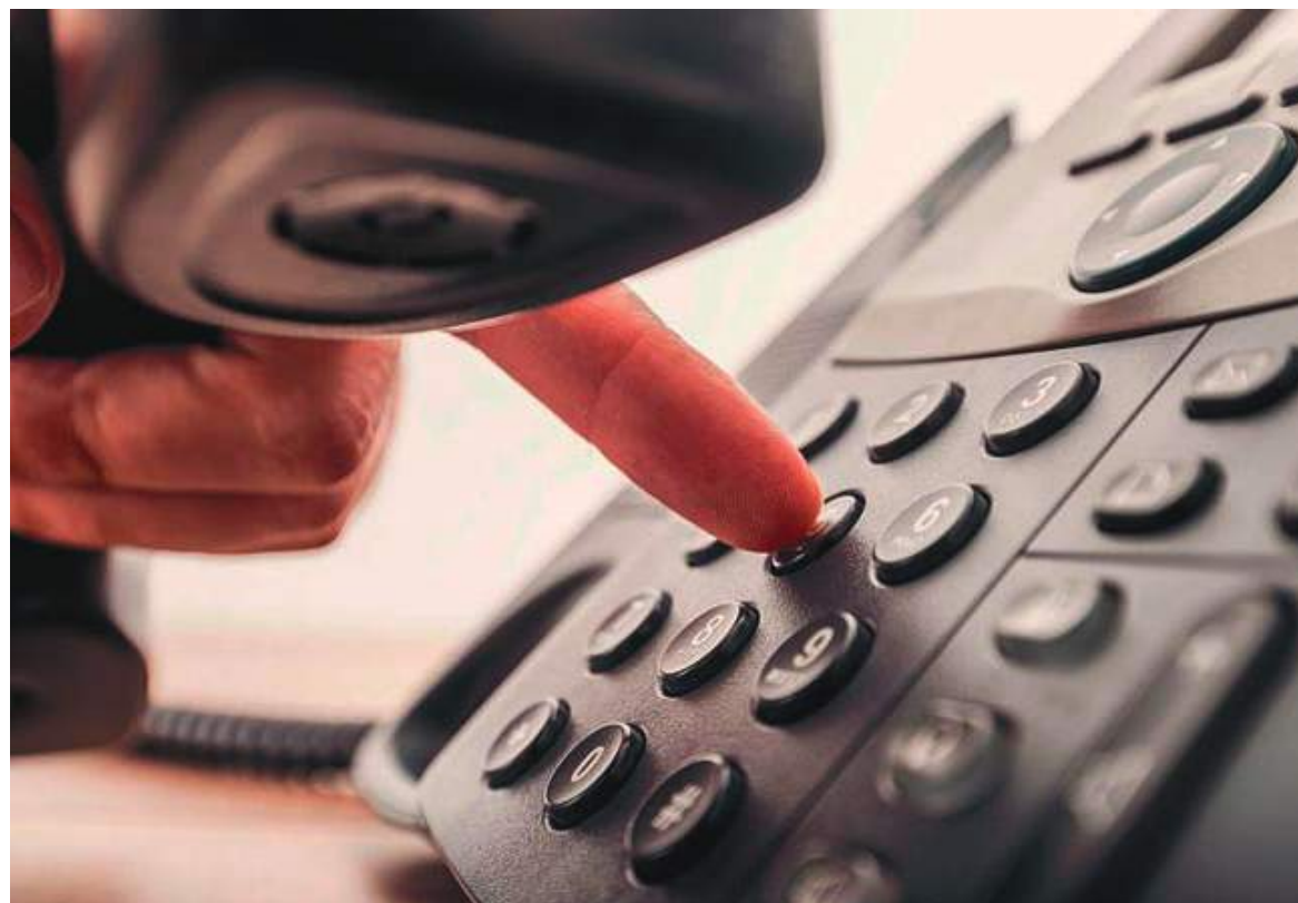
El país dispondrá de un esquema unificado en el que se marcarán 10 dígitos para hacer todo tipo de llamadas desde teléfonos fijos y celulares a cualquier número telefónico de Colombia.

El esquema se modifica porque la marcación telefónica es de diferente longitud, dependiendo del tipo de llamada: 7 dígitos para llamadas fijas locales, de 10 y 12 dígitos para llamadas de larga distancia nacional, de 12 dígitos de fijo a móvil y de 10 dígitos de móvil a fijo y entre móviles.