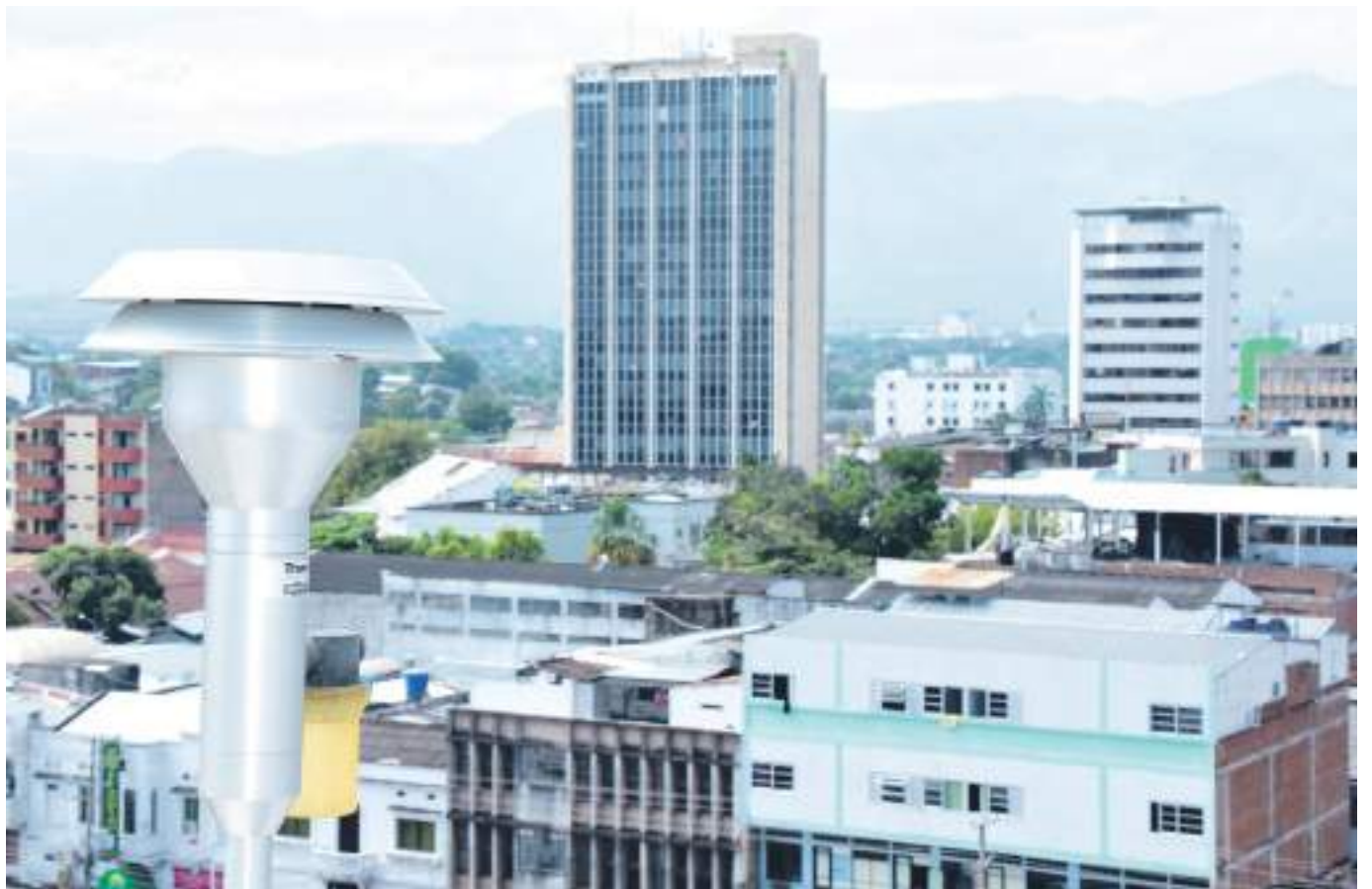
El Ideam, aseguró que Neiva es una de las ciudades que mejor calidad de aire tienen según los registros de las estaciones que reporta la entidad a nivel nacional.

Asimismo, expresó que se da a conocer la importancia y el cuidado y de la calidad del aire mediante campañas, adicionalmente se realiza junto con la autoridad ambiental Corpora-