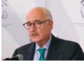
Andrés Pastrana Arango

El expresidente inició su comparecencia ante la Comisión de la Verdad, entregando una carta firmada por los excapos del 'Cartel de Cali', en la que confiesan que financiaron la campaña presidencial de Ernesto Samper Pizano.