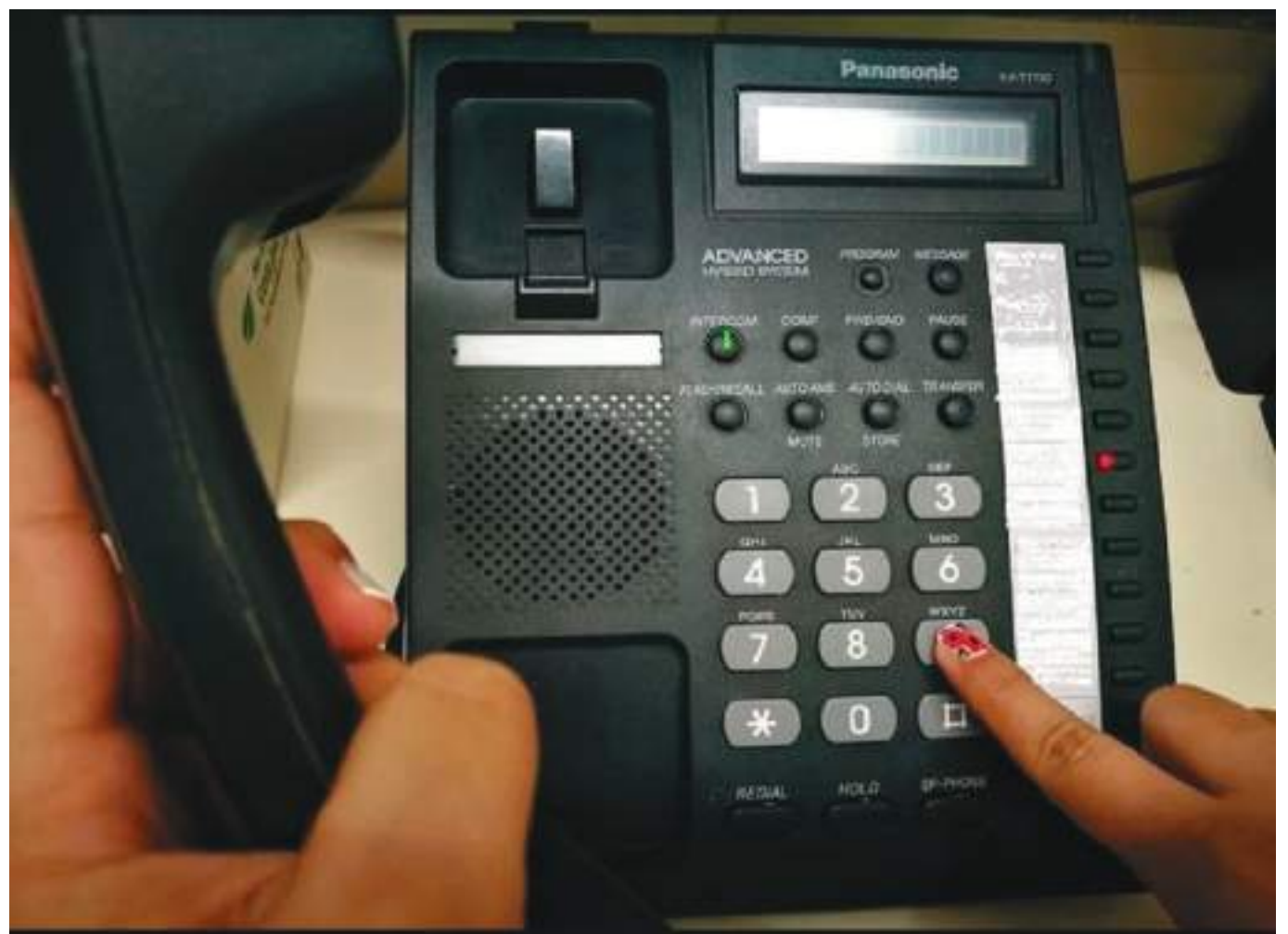
Para que usted pueda hacer una llamada desde su teléfono fijo a un número celular a partir de hoy, debe marcar directamente el número de celular al que quiera llamar sin ningún tipo de prefijo ni dígito adicional.

Ahora desde la nueva regulación, el país dispondrá de un esquema unificado en el que se marcarán 10 dígitos para hacer todo tipo de llamadas desde teléfonos fijos y celulares a cualquier número telefónico de Colombia.