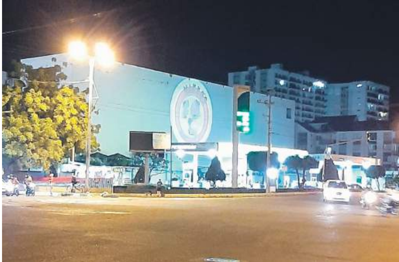
Publicidad que proyectan a gran escala en Neiva.

Sobre las fiestas, “la primera fue virtual, estábamos en pandemia no nos podíamos reunir y fue buena y exitosa. La del primer aniversario si fue presencial, se guardaron todos los protocolos, cada peludito iba con su correa y cada dueño estuvo pendiente de su mascota en un campo abierto. La organización fue perfecta. Se hicieron las recomendaciones