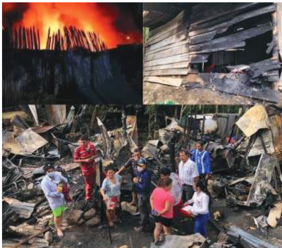
Entre las zonas rurales, el corregimiento El Caguán es el más afectado.

Por ende, se realizó un llamado donde expresó que es necesario que la población tome conciencia de lo importante que es contar con un buen ecosistema en el municipio de Neiva y que debido a los incendios ocurridos estos últimos