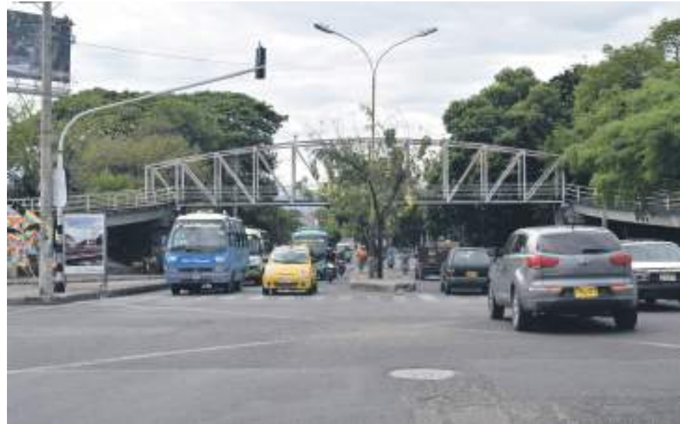
Neiva es una de las ciudades más ruidosas de Colombia.

Por ello el Ministerio de Ambiente, es consciente del desafío de esta problemática y de-