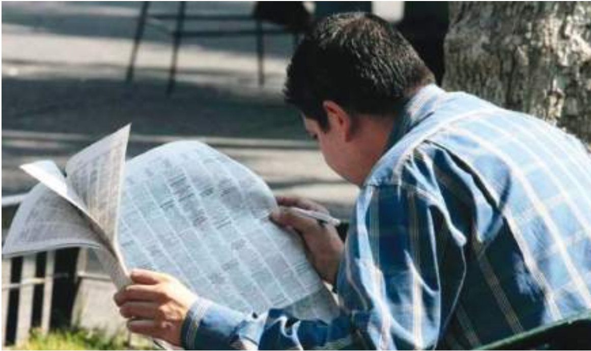
Neiva tuvo el mejor desempeño con una disminución de 18,3% en su tasa de desempleo frente al periodo mayo-julio de 2020.