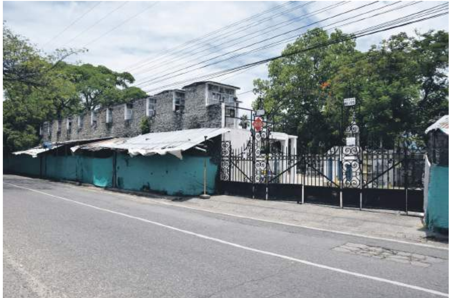
La decisión la adoptó la Sección luego de realizar una audiencia pública este martes en Neiva.

solo resultan esenciales para evitar el daño de los cuerpos, sino que tienen por objeto cooperar con las demás instituciones del Sistema Integral para la Paz y otras agencias del Estado para evitar la afectación de los derechos de las víctimas del delito de desaparición forzada con ocasión del posible traslado del Cementerio Central de Neiva.