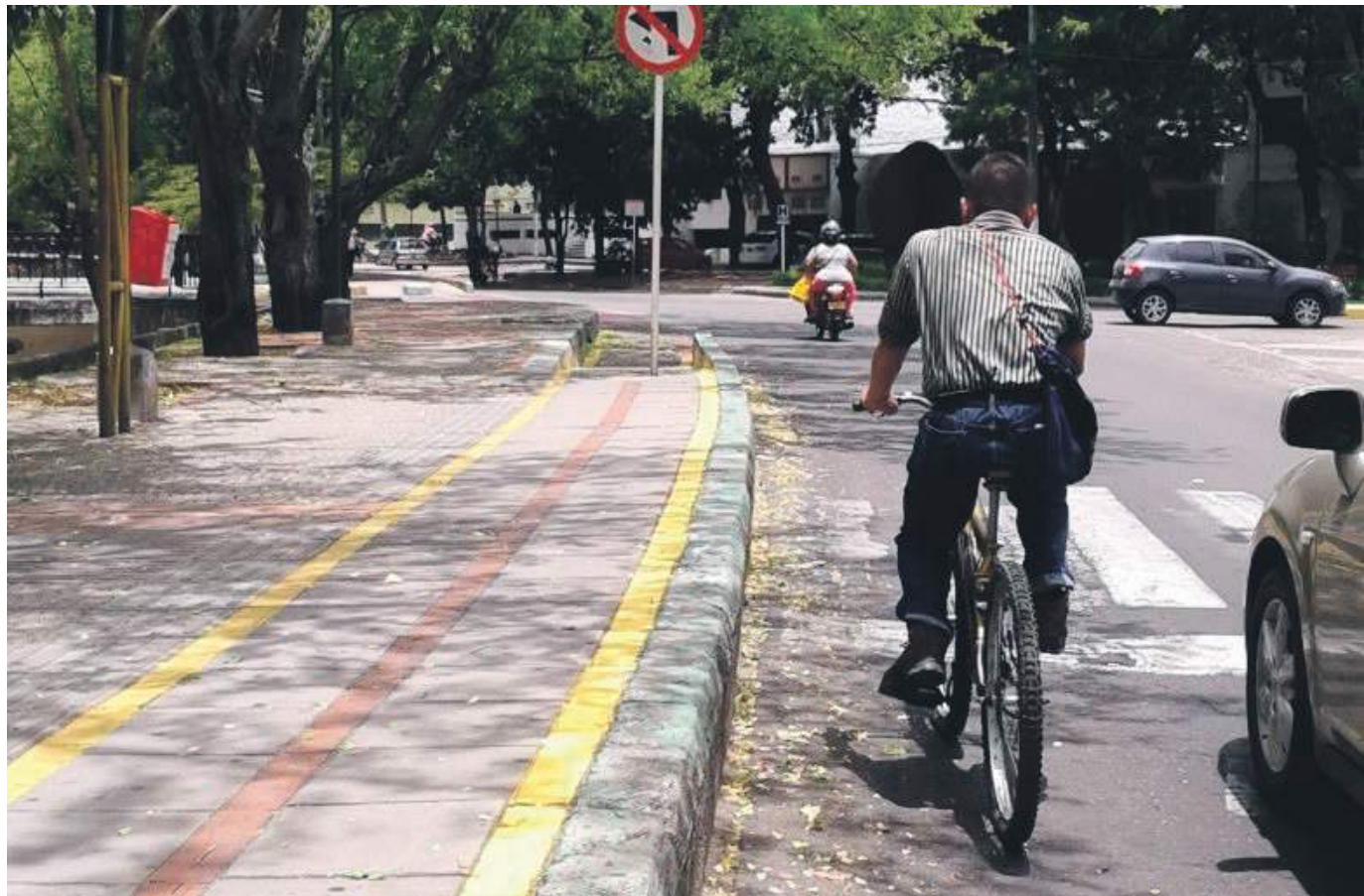
La Secretaría de Movilidad ha venido haciendo campañas en pro de una mayor concientización.

“Aunque transportarse en bicicleta hacia el trabajo u otro lugar de la ciudad Neiva representaría grandes beneficios para mi salud como para el mismo planeta, realizar dicha práctica dentro de la capital huilense representa un verdadero desafío; el aumento de la inseguridad limita poder movilizarse con confianza y tranquilidad, además, el insuficiente carril de las bicicletas (ciclo ruta) obliga a transitar por la malla vial deteriorada y peor aún, compartir el carril con motocicletas y con automóviles del servicio público que no respetan las normas de tránsito, ni mucho menos la vida de las personas que nos encontramos transitando en bicicleta...”