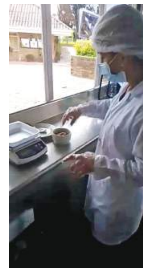
Momento de elaboración de una receta para integrar cada alimento por cantidad de gramos.

los niños se ha avanzado, sin embargo, a veces por falta de tiempo de los padres se opta por alimentos de paquete, por bebidas azucaradas que para nada contribuyen a una buena alimentación y nutrición. Ahí hay un vacío todavía y hay que seguir trabajando en ese aspecto de la educación alimentaria.