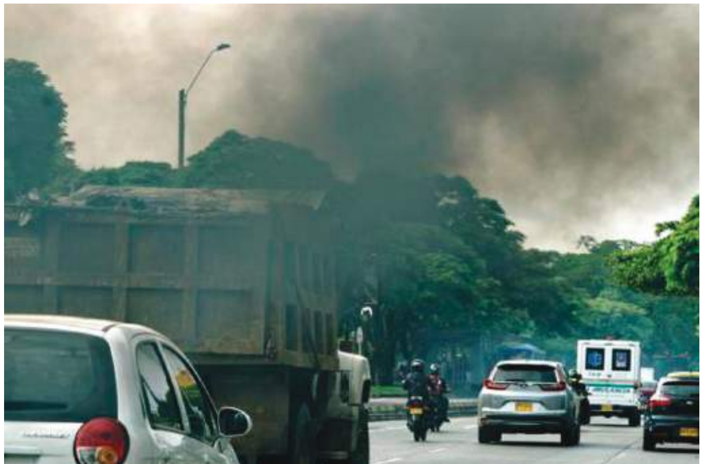
Los vehículos nuevos de servicio público, así como motocicletas y similares, se someterán a la primera revisión técnico-mecánica y de emisiones contaminantes.

Para reportar los ‘vehículos chimenea’, las personas que deseen reportar las emisiones contaminantes que producen, podrán hacerlo en cualquier momento, a cualquier hora y de manera sencilla. Tomar la fotografía en donde se evidencie la placa del ‘vehículo chimenea’ y escribir a través de WhatsApp 317 402 9245. Automáticamente llegará un mensaje para ingresar un formulario, donde se pueden dejar los datos o enviar la fotografía de manera anónima en el enlace enviado al