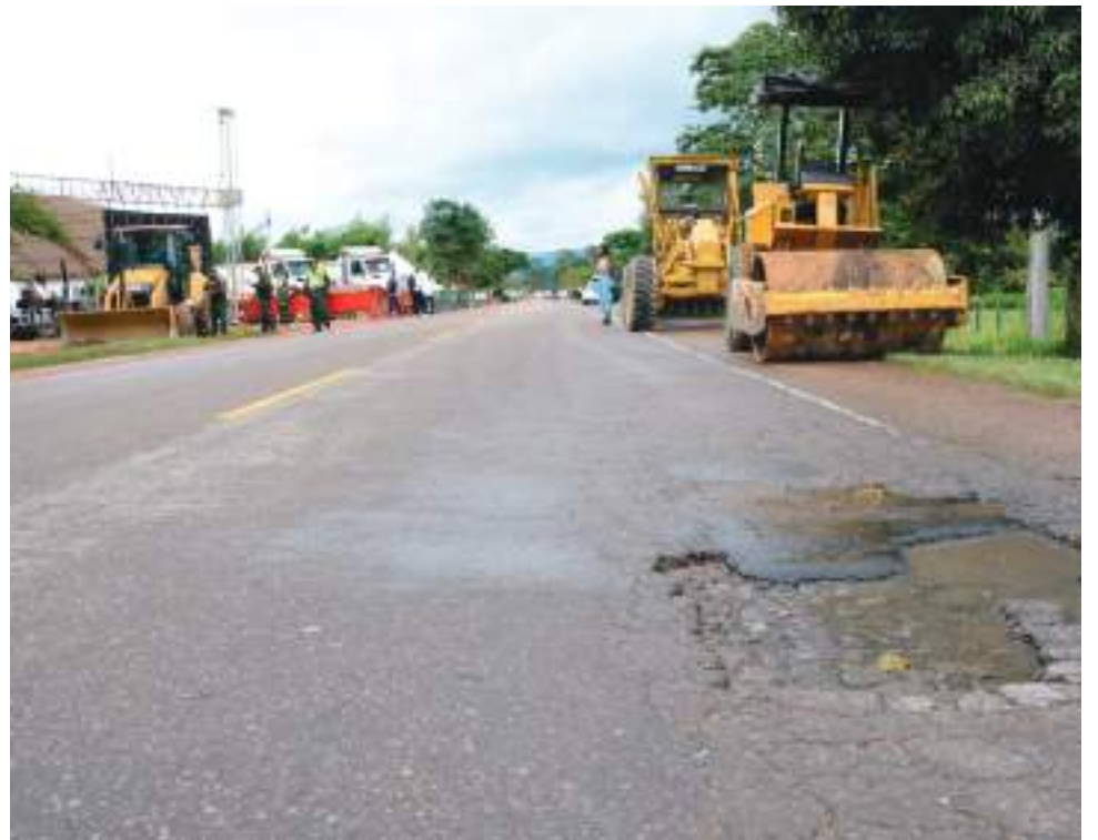
El mandatario de los huilenses anunció que tiene prevista una cita técnica con los concesionarios para revisar en detalle el cronograma, valores y proyección de la obra.