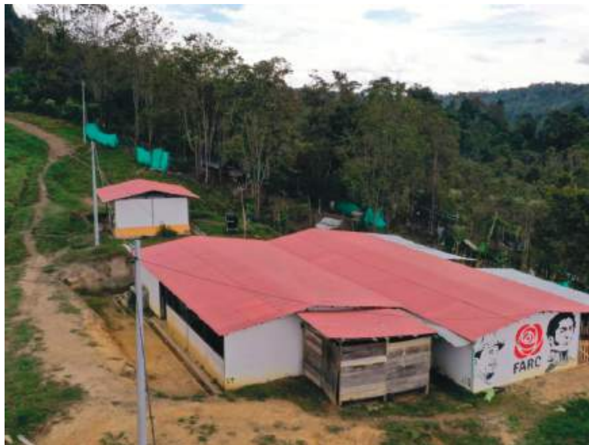
El director de la ARN sostuvo que se tienen previsto distintos proyectos para un futuro con esta población junto con las administraciones gubernamentales.

“Nosotros nos encontramos en la construcción de unos planes de desarrollo y de acción de la mano con los excombatientes y las entidades locales para avanzar en los procesos de consolidación no sólo desde el punto de vista productivo sino todo lo que tiene que ver con la sostenibilidad de construir sobre lo construido, las garantías de reversibilidad para que en este proceso sigamos avanzando por muchos años más, y así generemos todas las certidumbres a los excombatientes de que este es un proceso que en el marco de garantías y de acceso a los derechos nos permite articular tanto con las administraciones departamentales y municipales todo una oferta de servicio que necesitan ellos para avanzar en sus proyectos productivos y en su formación académica pero obviamente con todo el compromiso de unos actores institucionales que desde lo local y desde lo nacional vienen trabajando en logros muy concretos, en una paz que se refleja a partir de proyectos productivos y en todo el compromiso que se ha mantenido desde el Gobierno Nacional y distintas administraciones”, sostuvo.