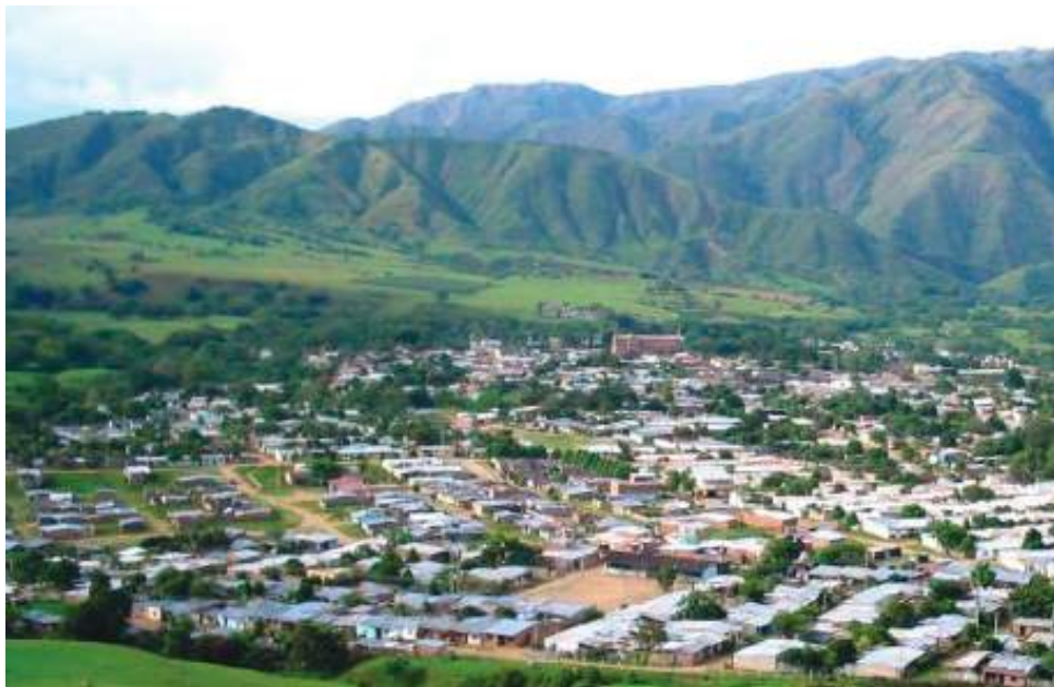
Existen alrededor de 351 personas excombatientes que tienen proyectos propios o de carácter colectivo.

En el territorio opita se han reportado más de 93 casos de riesgos y amenazas hacia esta población de excombatientes.