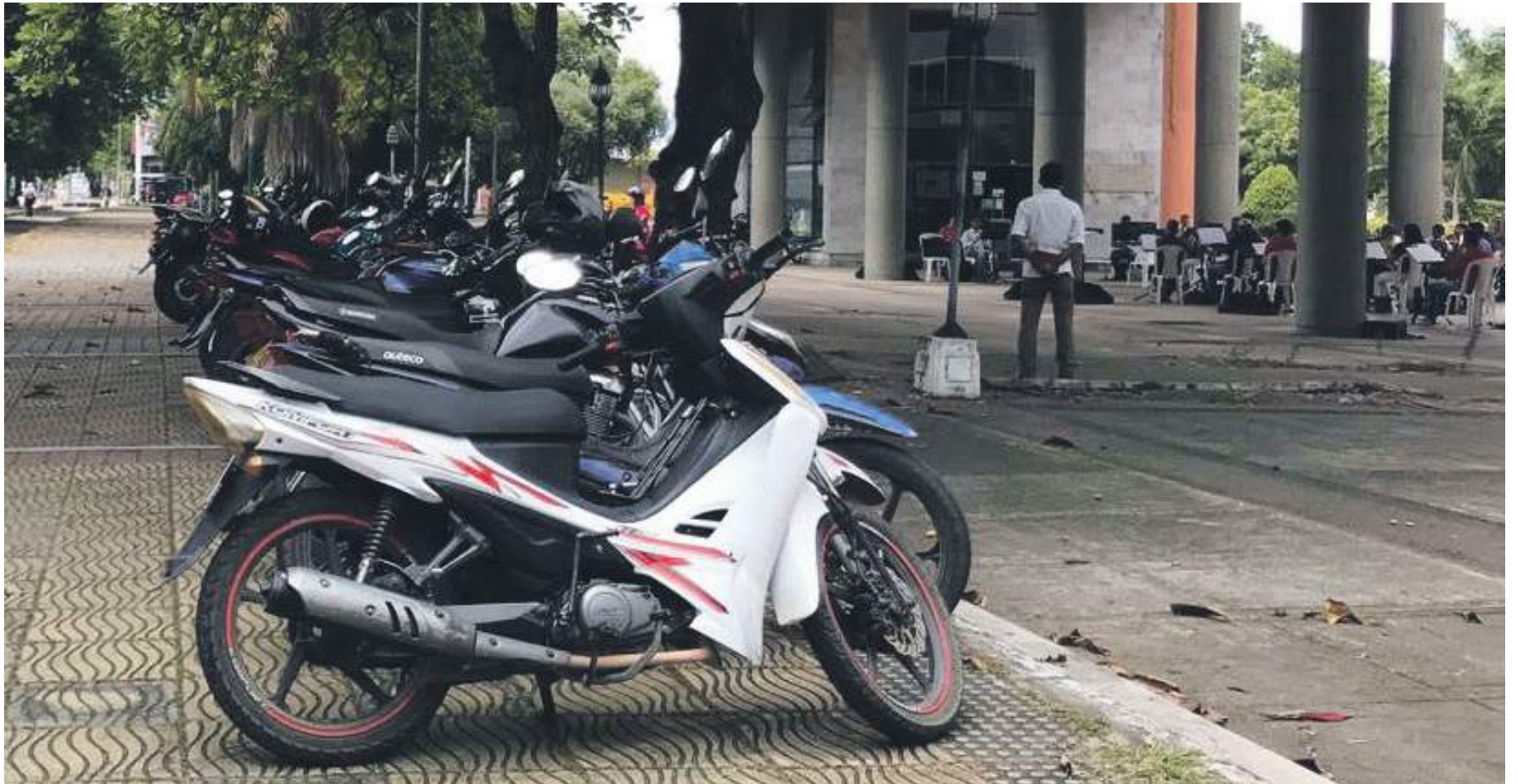
En la ciudad de Neiva se ha evidenciado últimamente la poca conciencia vial que tienen los conductores por las diferentes calles, avenidas y carreteras del municipio.

■ La falta de conciencia vial de algunos conductores de la ciudad de Neiva ha hecho que día tras día se vea afectada la movilidad por las distintas calles del municipio, se evidencian carros en el centro parqueados en lugares prohibidos y motos en carriles de las ciclo rutas. La ciudadanía expresa que las vías no fueron hechas para un futuro y que se están quedando pequeñas las carreteras para tanto automóvil.