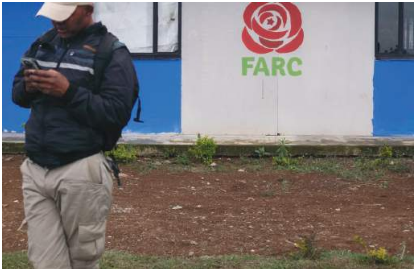
En el Huila aproximadamente hay unos 500 excombatientes. 102 mujeres y 398 hombres vienen avanzando en su proceso de reintegración.

“En el departamento del Huila aproximadamente hay unos 500 excombatientes que vienen avanzando en su proceso de reintegración, en Neiva hay más de 159 personas que están realizando distintos proyectos que hemos articulado desde la alcaldía municipal para su sostenibilidad económica, el 100% de ellos se encuentran afiliados a la salud, eso nos da un marco de cómo hemos venido hablando con el Ministerio y desde la articulación con las distintas entidades para poder avanzar en los procesos de la mano con las administraciones locales que también han sido fundamental