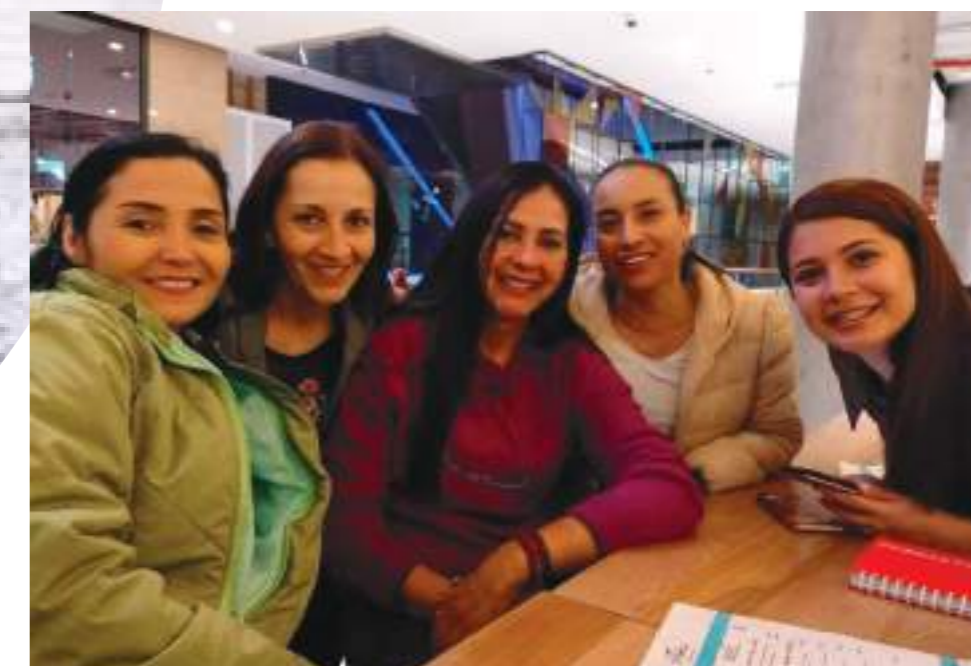
Grupo de trabajo en una de las intervenciones en Neiva.

Por último, aprovecha la sanción de la ley de comida chatarra para que la tengamos muy presente y veamos en los empaques de los alimentos, los ingredientes sobre todo los que están etiquetados. Es importante conocer lo que se va a consumir, alimentos procesados o bebidas azucaradas que son los que realmente hacen más daño que beneficio para la salud”, concluye.