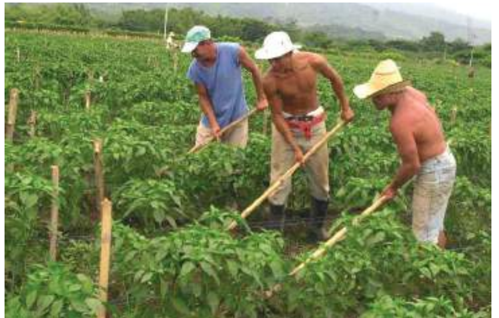
En el Huila aproximadamente hay unos 500 excombatientes. 102 mujeres y 398 hombres vienen avanzando en su proceso de reintegración.