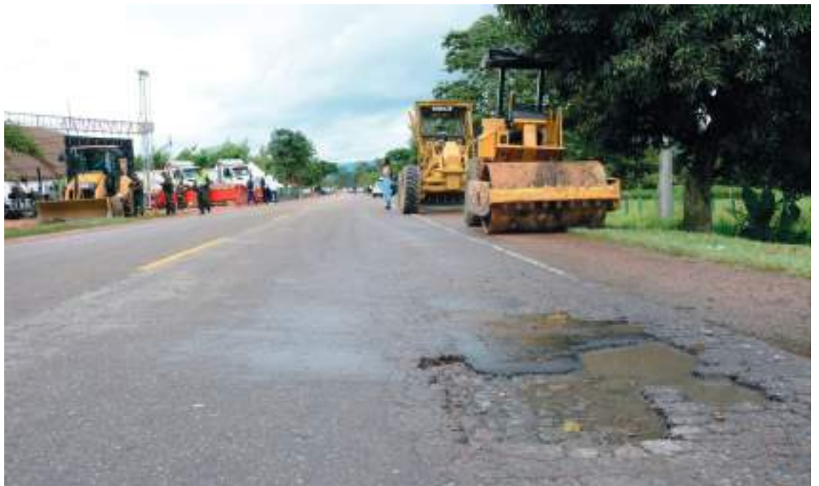
Esta histórica obra que iniciará en los próximos días permitirá mejorar la competitividad y el desarrollo del departamento para que el Huila siga creciendo.