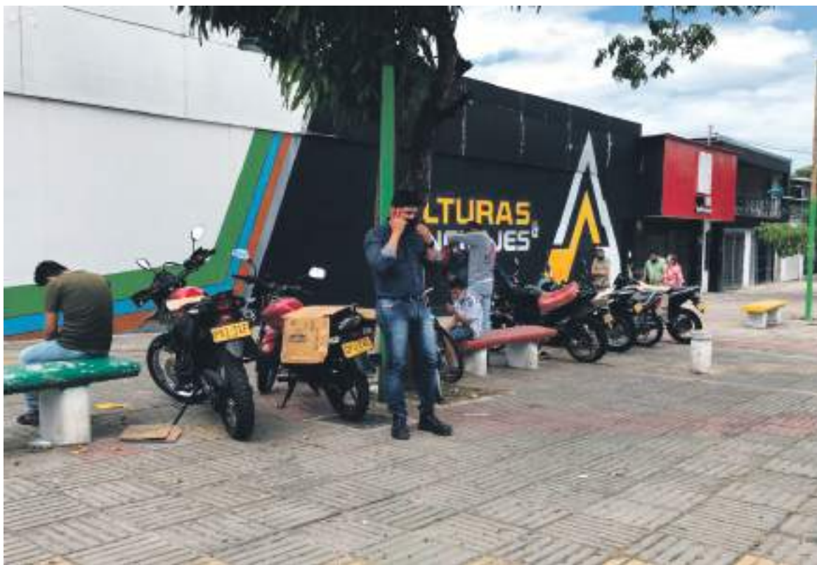
Ciudadanos manifiestan que el embotellamiento que se presenta es por las angostas vías.