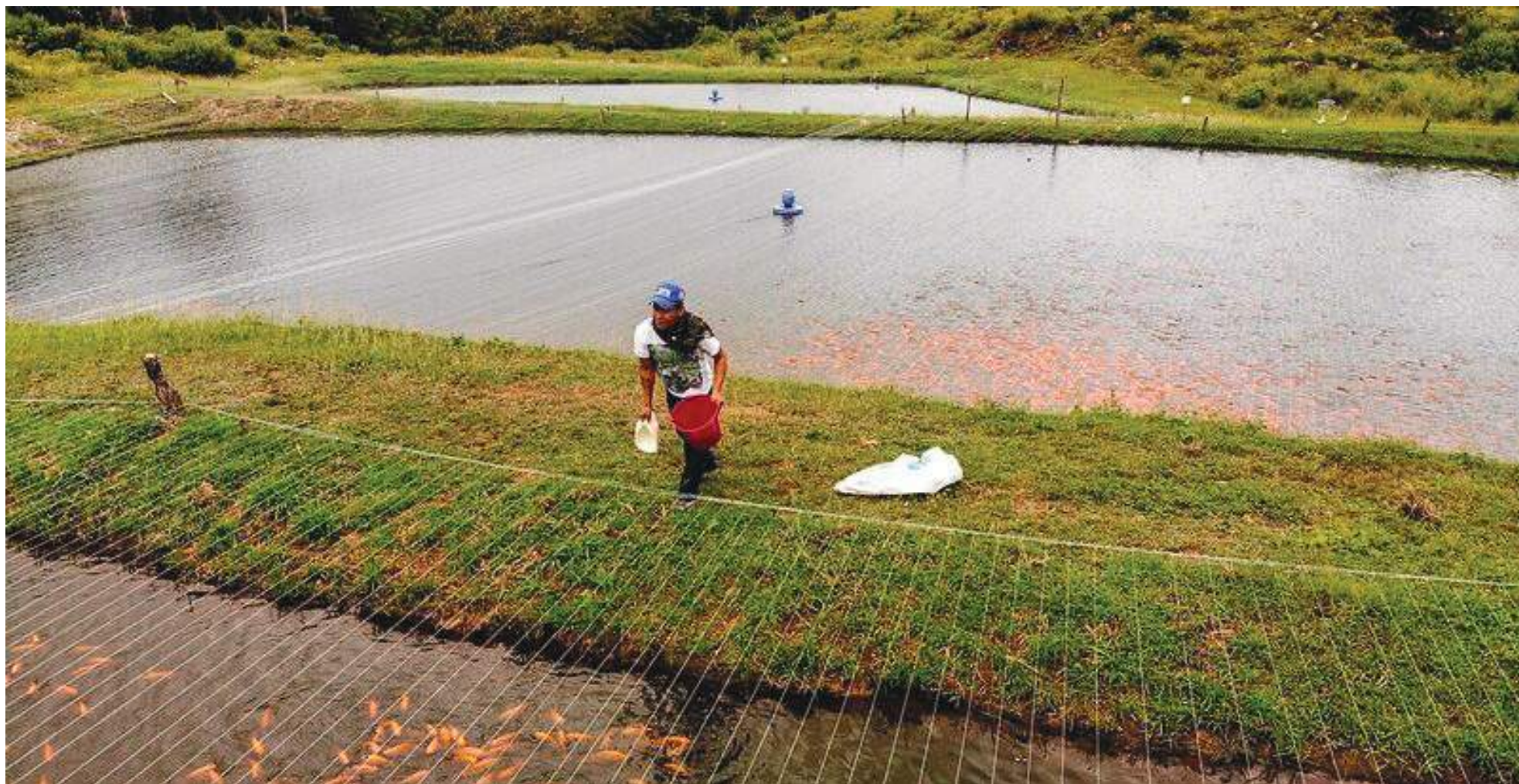
En el territorio opita se han reportado más de 93 casos de riesgos y amenazas hacia esta población de excombatientes de las cuales 31 son de Algeciras.

Este proyecto ha sido fortalecido con la entrega provisional, a través del arrendamiento de un predio con cerca de 400 hectáreas de extensión ubicado entre los municipios de Teruel y Palermo, transferido por el Gobierno Nacional por medio de la Sociedad de Activos Especiales (SAE) en diciembre del año 2020 donde se ponen en marcha varios quehaceres productivos de ganadería semi-intensiva, producción agropecuaria y capricultura - producción de leche de cabra, apicultura y granja integral, entre otros.