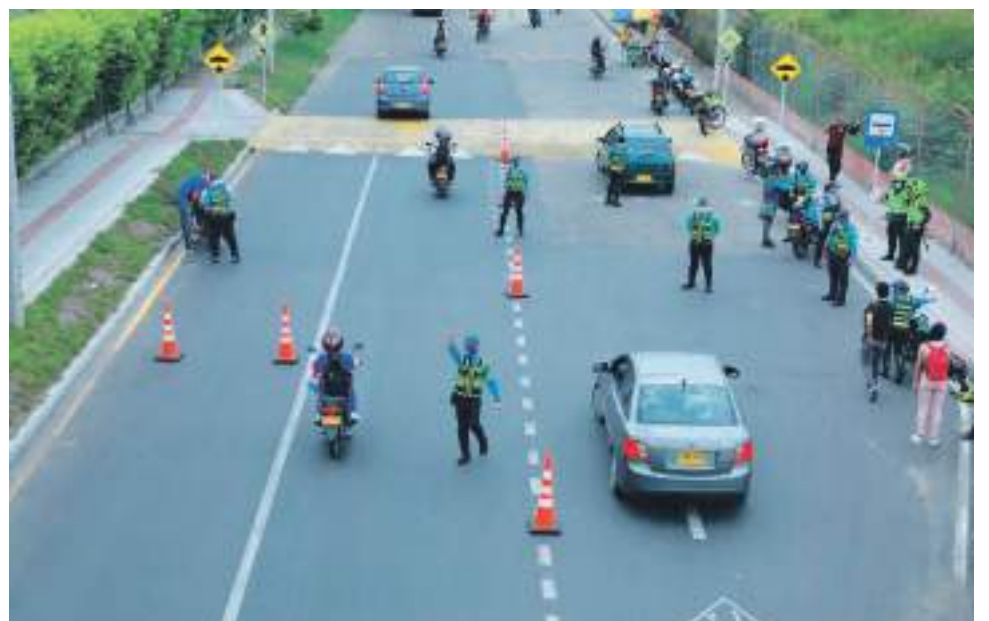
Carros mal parqueados obstruyendo vías se observan en el centro de la ciudad día a día.

Por otro lado, se han venido presentando un sin número de quejas presentadas por parte de