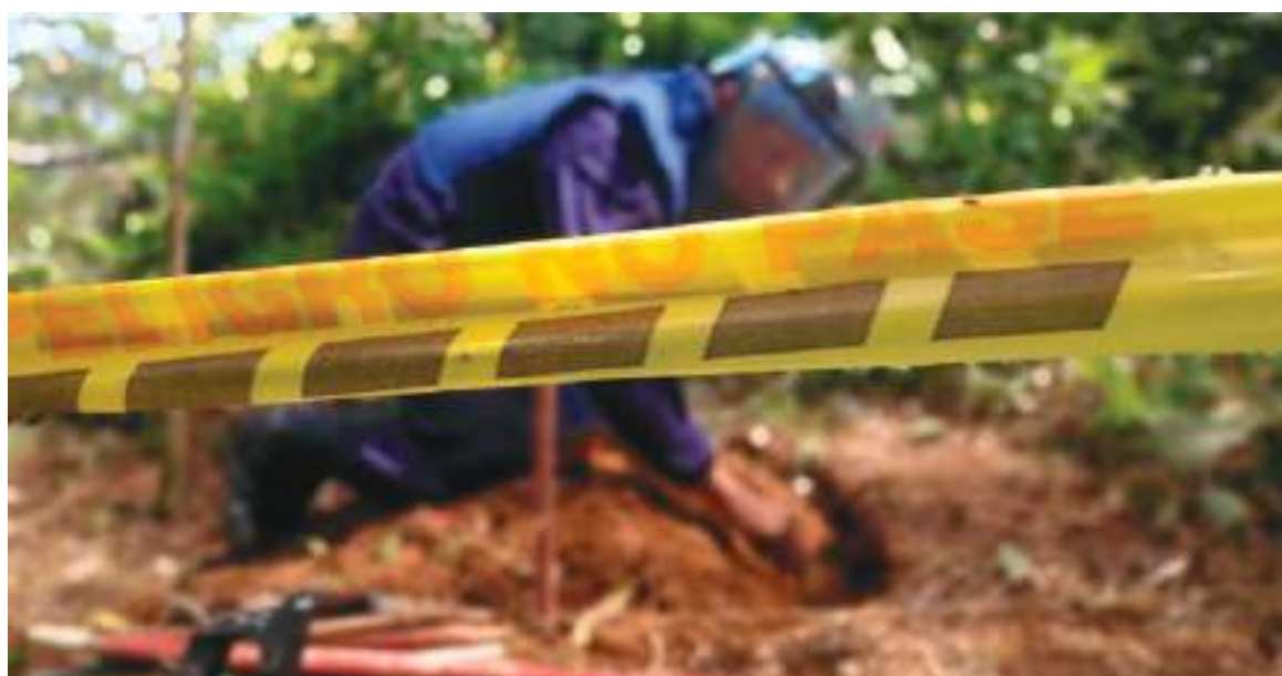
Según los datos del informe, se han presentado 263 víctimas en todo el país entre las que hay 21 menores de edad.

ció el avance en el desminado humanitario por parte de los compromisarios del Acuerdo Final de Paz de 2016, las antiguas Farc-EP y el Estado Colombiano.