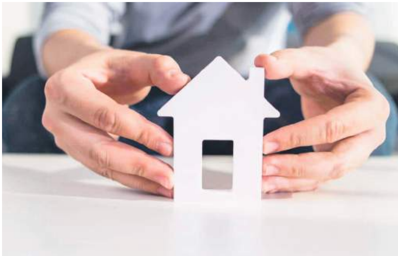
Percepción de los consumidores sobre situación del país y del hogar.

Fedesarrollo, reportó en su análisis mensual un aumento en la disposición que los colombianos tienen para comprar una vivienda. El análisis de julio, dejó ver un aumento en el indicador de disposición a comprar vivienda, pues se ubicó en -2,9%, lo que equivale a un incremento de 21,0% frente al mes anterior.