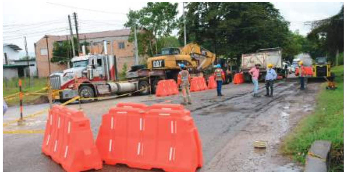
El departamento del Huila logró la cesión del contrato de la ruta la Ruta 45 Neiva - Pitalito - Mocoa - Santana.

Teruel Huila, 11 de agosto de 2021 SEGUNDO AVISO