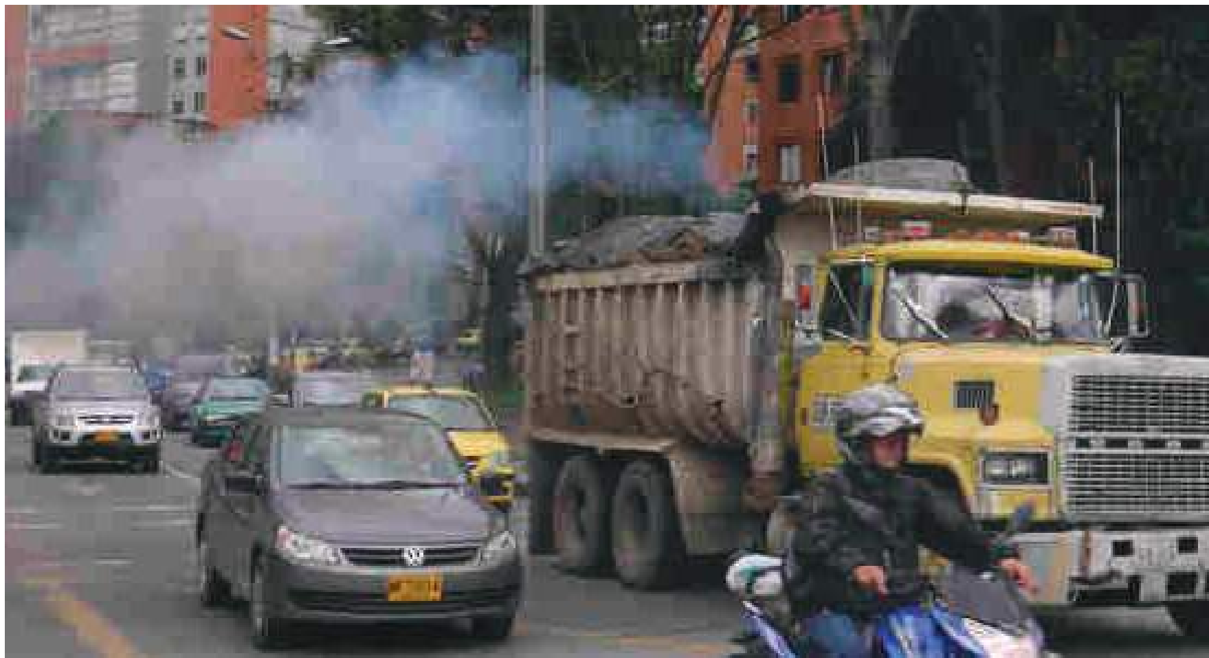
'Transporte sin Humo' significa mejor calidad del aire en las ciudades, un aire más limpio para respirar.

dad del aire. Es por eso que al habilitar esta plataforma para las denuncias se lograrán "tener mejores cifras y tomar mejores decisiones".