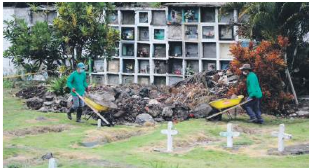
La Sección ordenó al Instituto Nacional de Medicina Legal, así como a la Parroquia de La Inmaculada Concepción, remitir la información respecto de la actualización de bases de datos.

La Sección ordenó al Instituto Nacional de Medicina Legal, así como a la Parroquia de La Inmaculada Concepción, remitir la información respecto de la actualización de bases de datos e informar acerca del estado del Cementerio Central de Neiva. Además, el