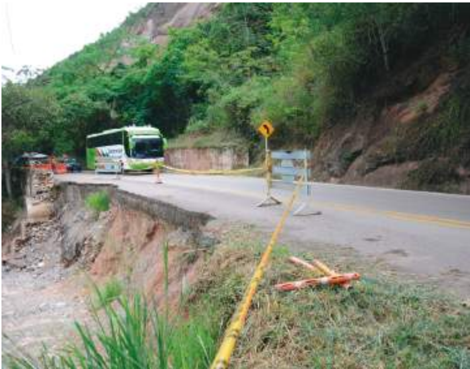
Esta histórica obra que iniciará en los próximos días permitirá mejorar la competitividad y el desarrollo del departamento.

■ Esta histórica obra que iniciará en los próximos días permitirá mejorar la competitividad y el desarrollo del departamento para que el Huila siga creciendo.