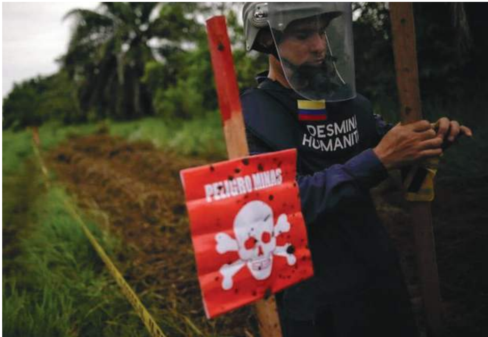
En 2020, el CICR registró que 389 civiles y combatientes fueron víctimas de artefactos explosivos a lo largo del año.