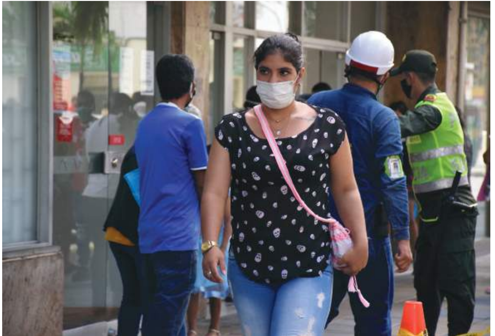
Ayer se confirmaron 15 fallecimientos.

El Ministerio de Salud y Protección Social reportó, este martes 10 de agosto, 3.948 casos nuevos de covid-19 en Colombia. En las últimas 24 horas se procesaron 53.904 pruebas de las cuales 23.734 son PCR y 30.170 de antígenos.