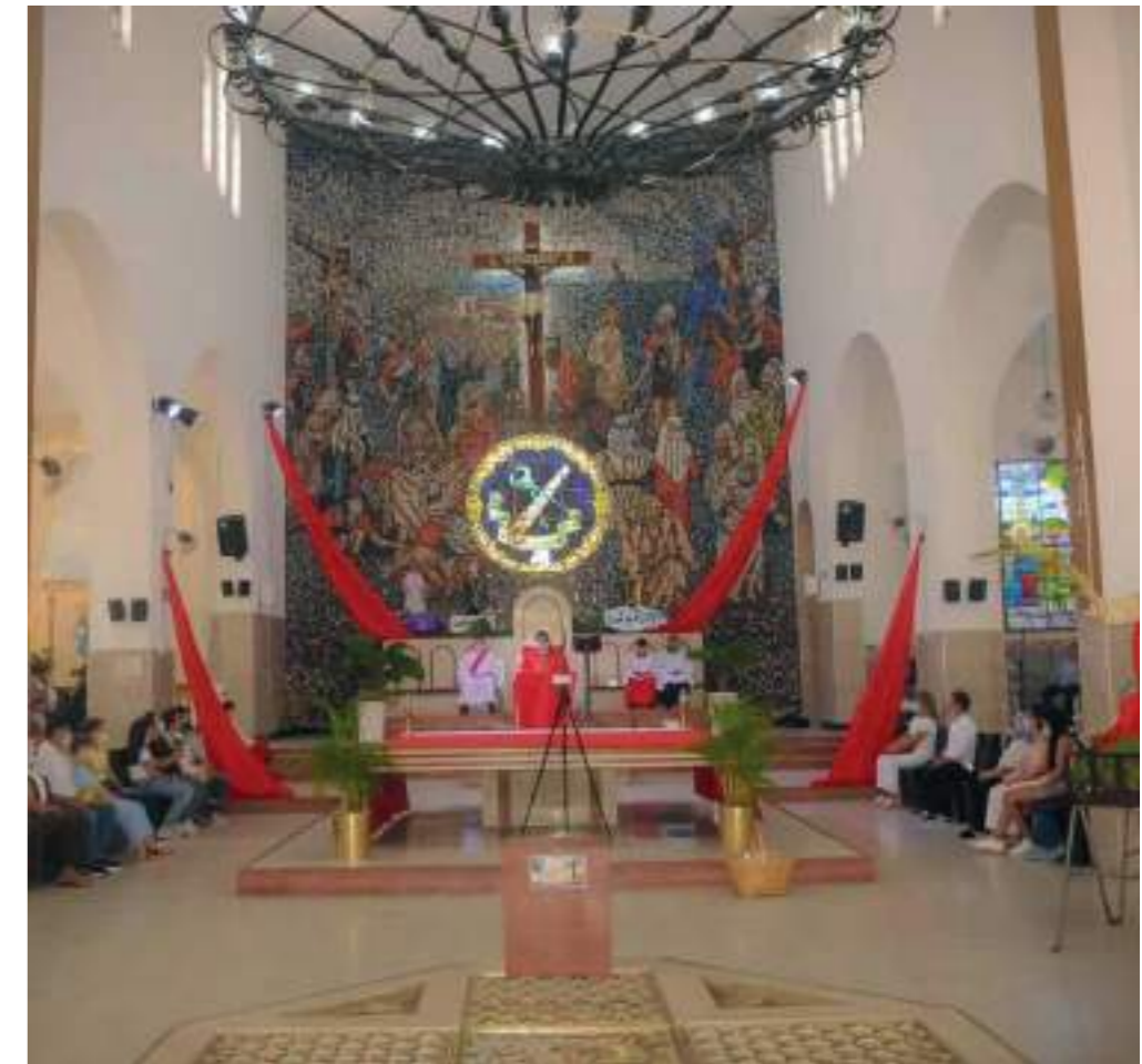
El jueves se celebra la institución de la eucaristía.

está consumado, y Padre en tus manos encomiendo mi espíritu”, son esas siete palabras.