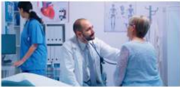
¿Cuál es el panorama de Colombia en la ruta de atención de Enfermedades Raras? ■ 16 SALUD