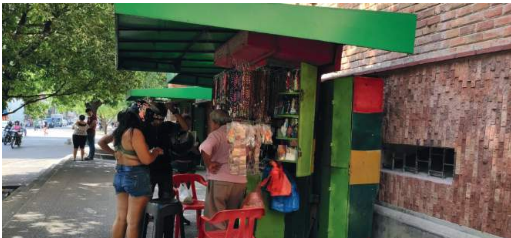
Esta época se convierte en la salvación para comerciantes de artículos religiosos que vienen atravesando por fuertes afectaciones y hoy logran aumentar ventas del 30%, 40% y hasta 50%.

Pese a la competencia sana y comercial del gremio ubicados principalmente en el centro de la capital huilense, exactamente en la carrera 4 entre calle 6 y 8, todos registran buenas ventas, y reina el fervor de los católicos que celebran la Semana Mayor.