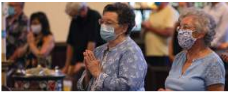
Durante esta Semana Santa se recomienda a los huilenses conservar el distanciamiento social y usar el tapabocas en sitios con alta afluencia de personas para evitar aumento de contagios.

A la fecha se han diagnosticado 100.322 casos positivos de Covid19 en el Huila, de estos se han recuperado 96.325 y han fallecido 3.514.