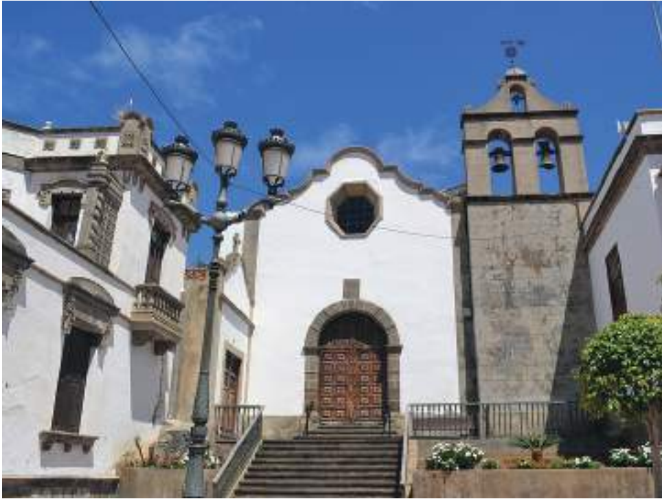
A parte de ser la capital arqueológica del Huila, San Agustín también es un atractivo lugar religioso.