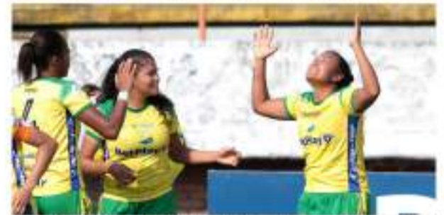
Atlético Huila Femenino le ganó 2 a 0 al Junior ■ 12 DEPORTES