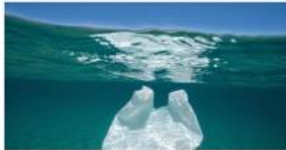
Los plásticos biodegradables no se degradan más fácilmente en el mar ■ 20 CONTRAPORTADA