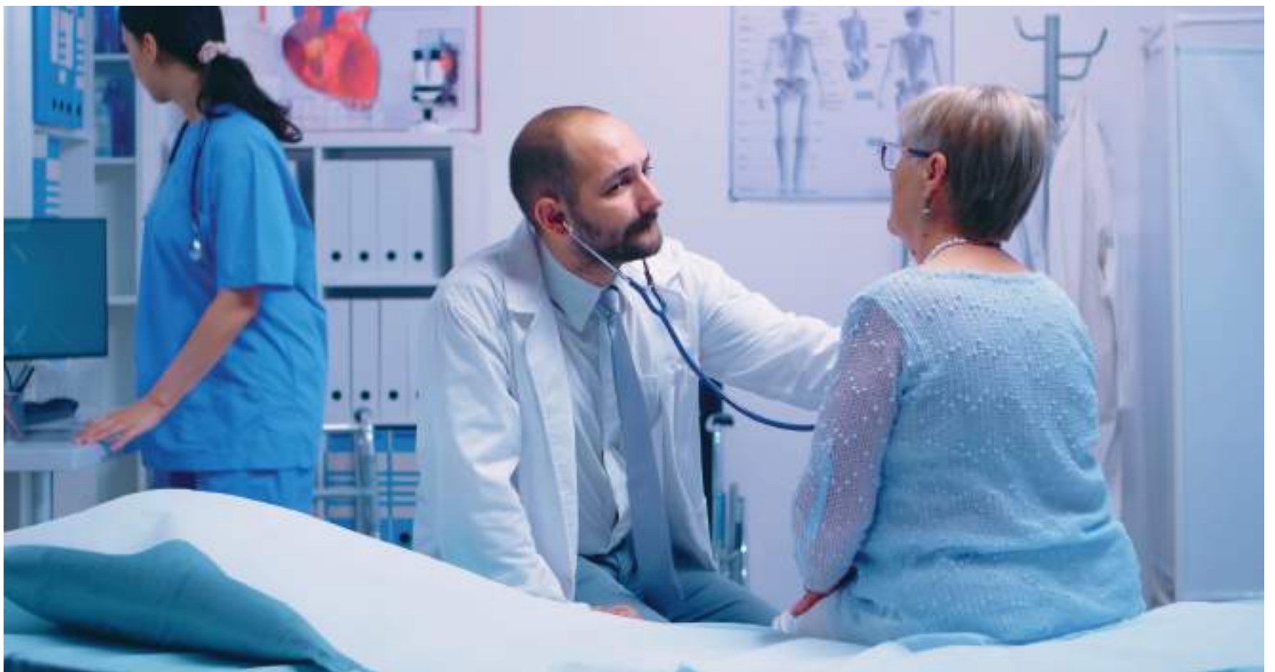
De acuerdo con el Ministerio de Salud, en Colombia existen 2.198 enfermedades consideradas raras codificadas.

■ En Colombia se registran más de 58.000 casos de pacientes confirmados y existen 2.198 enfermedades consideradas raras codificadas. Ante este panorama, el desafío a nivel nacional es fortalecer la generación de información y sensibilización, además de financiación pública y facilidades de acceso de manera oportuna a tratamientos y medicamentos.