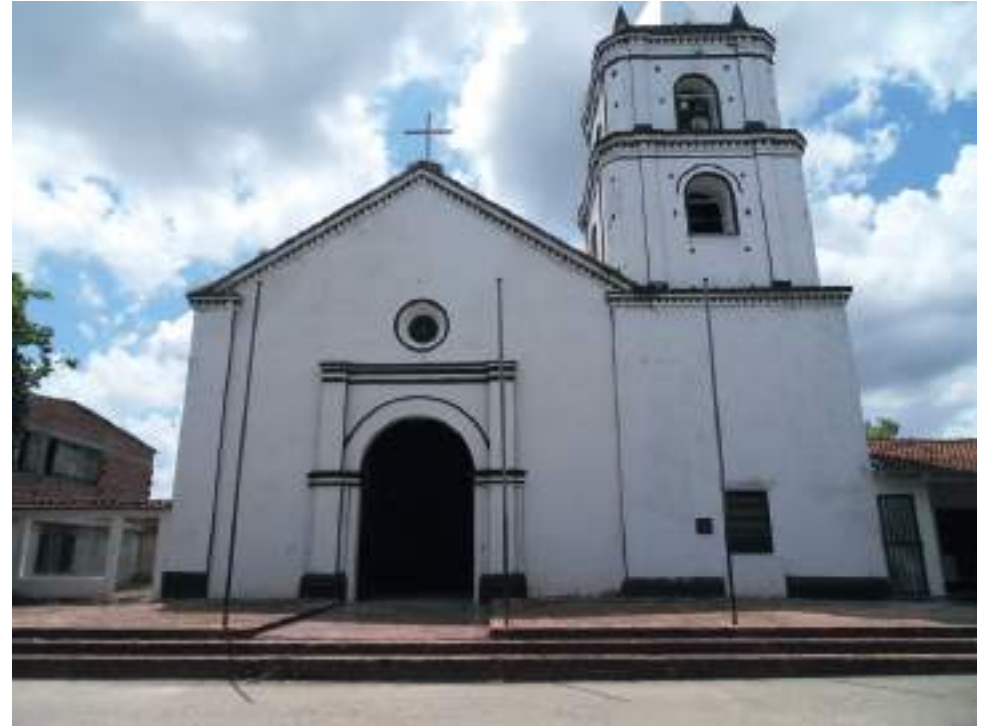
Villavieja cuenta con la iglesia más antigua del departamento, "Capilla Santa Barbara".

ta Rosalía donde se acostumbra a realizar el viacrucis haciendo el recorrido por el corregimiento del Caguán donde está el tradicional santuario de San Roque, entre otros lugares, que suelen recibir con mayor afluencia la visita de los turistas que llegan por esta época.