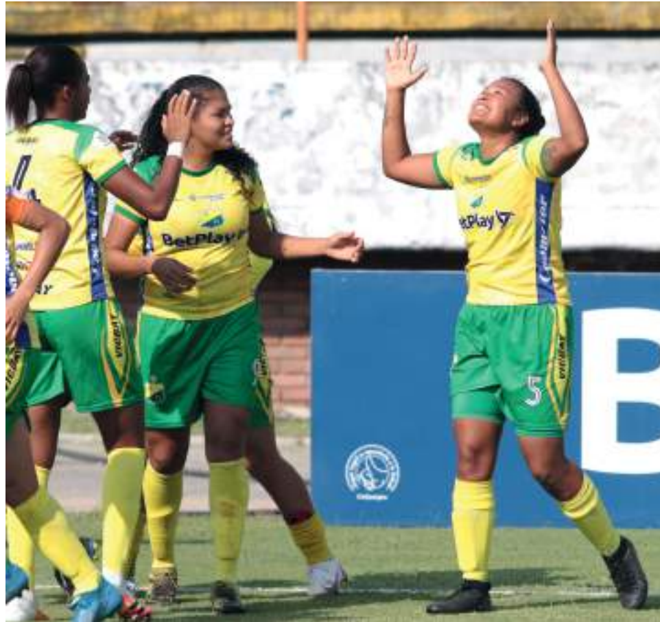
Huila femenino celebra un nuevo triunfo en esta oportunidad ante el Junior.

La pelota en su mayoría fue las visitantes, las cuales se caracteri-