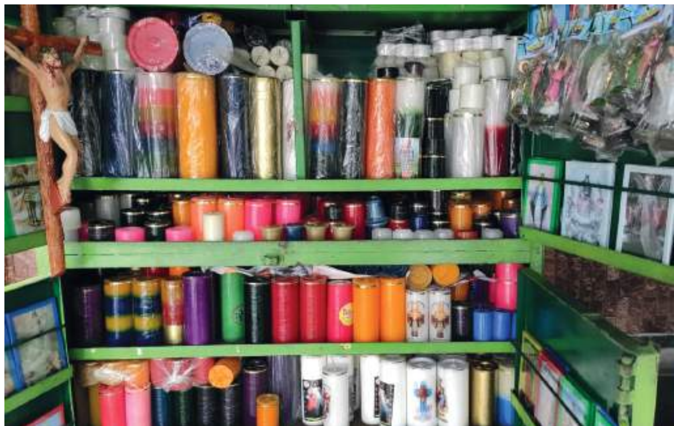
Todos estos productos vienen en aumento continuamente desde la pandemia.

Finalmente, los artículos que más se venden son: el cirio Pascual, viacrucis, camándulas, novenas, imágenes religiosas y veladoras. Sin embargo, todos estos productos continúan en aumento.