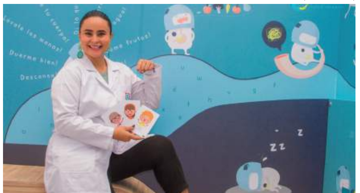
La recomendación de esta experta es a que las Instituciones Educativas cuenten con un psicólogo para cada ciclo y con esto se fortalece la ayuda y el acompañamiento emocional que tanto requieren los niños.

Les ayuda a decir no tolero esto, eso que estas haciendo no me gusta, no estoy cómodo. Esto es fundamental porque ahora hablamos de situaciones de bullying en el colegio, pero también hay abusos sexuales en estos entornos y esto está relacionado con la participación de personas adultas y pasa porque no les hemos dado las herramientas para que los niños sepan qué no les gusta y tampoco les hemos enseñado a verbalizar. La educación emocional en los niños es prevención.