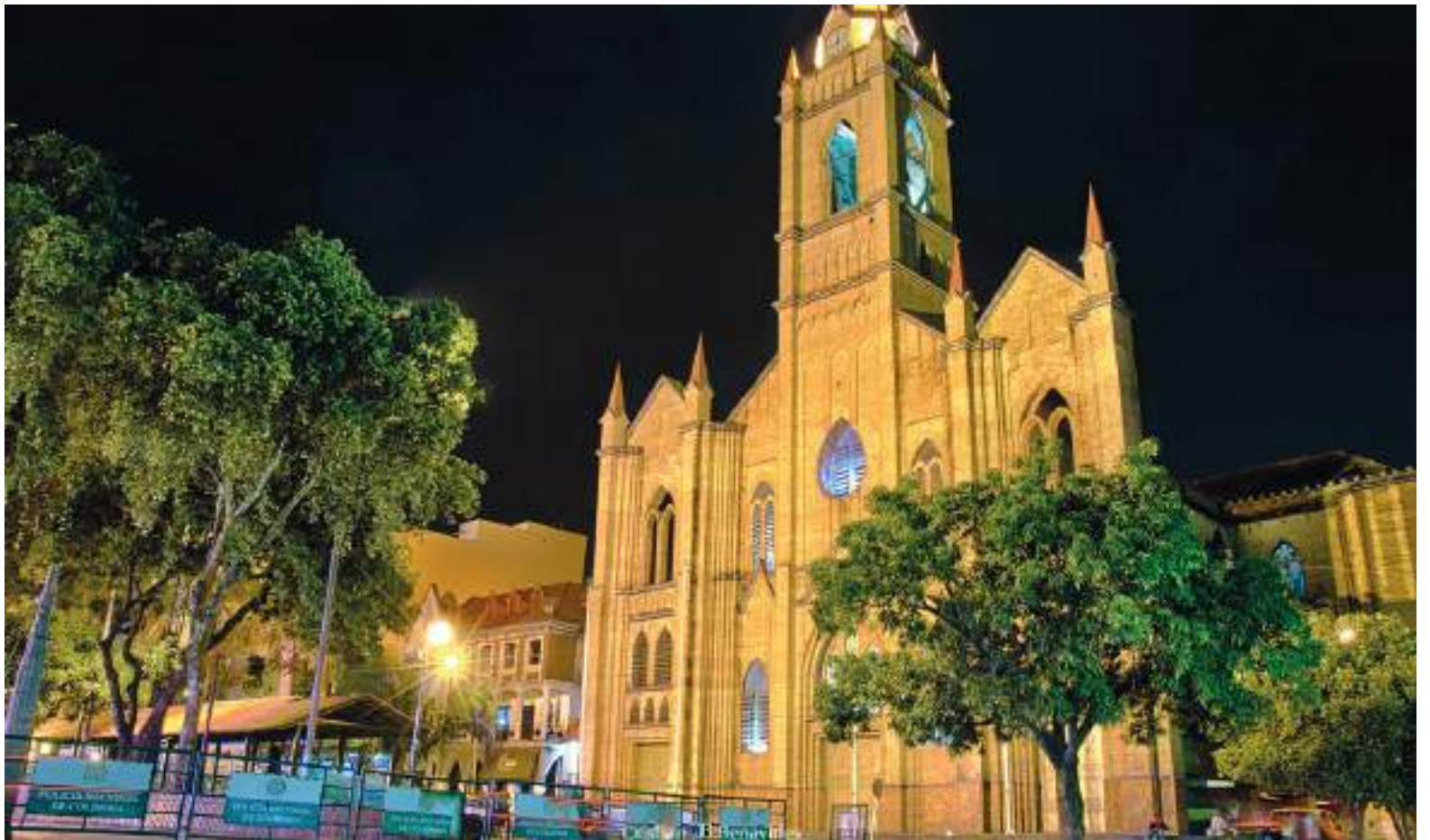
La Catedral de la Inmaculada Concepción de Neiva es una de las iglesias más emblemáticas del departamento.

“Los invitamos a ser parte de una de las celebraciones más grandes de nuestra región, que es la Semana Santa, la cual simboliza el amor y la fe de todos sus peregrinos. El departamento del Huila, tiene una excelente oferta cultural y religiosa, representada a través de la historia en las dife-