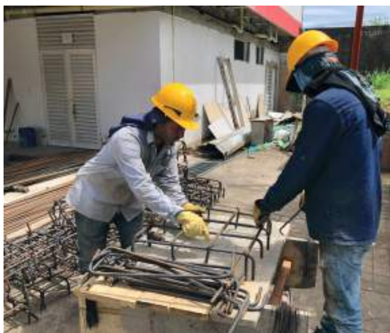
Un arduo trabajo se adelanta para cumplir con el lapso de entrega del Centro Atención Integral Materno Infantil CAIMI.

■ Luego de darse a conocer la terminación del Centro de Atención Materno Infantil 'CAIMI', ahora, se evidencian avances significativos con tan solo dos semanas de trabajo. La obra se realiza mediante un convenio firmado entre la Secretaría de Salud de Neiva y la ESE 'Carmen Emilia Ospina', además, cuenta con la vigilancia de líderes comunales y los veedores de salud.