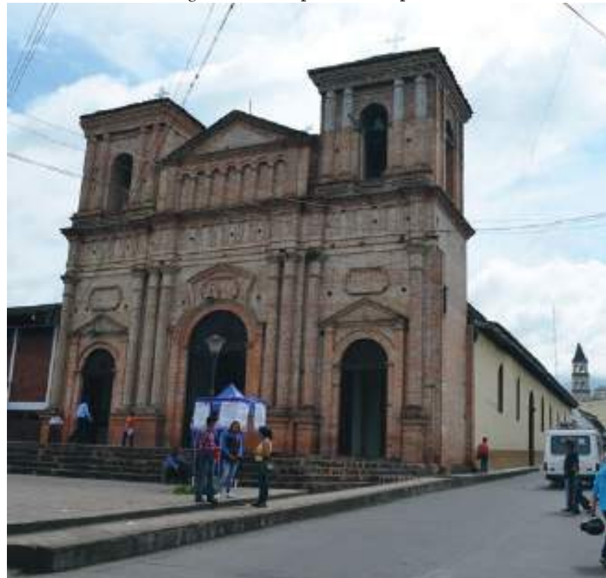
Garzón y Nátaga tienen como atractivo turístico religioso dos de las iglesias más representativas del departamento del Huila.

"La invitación es a que disfruten de toda la programación de Semana Santa en familia utilizando tapabocas en los recintos cerrados, siempre pensando en el bienestar de todos".