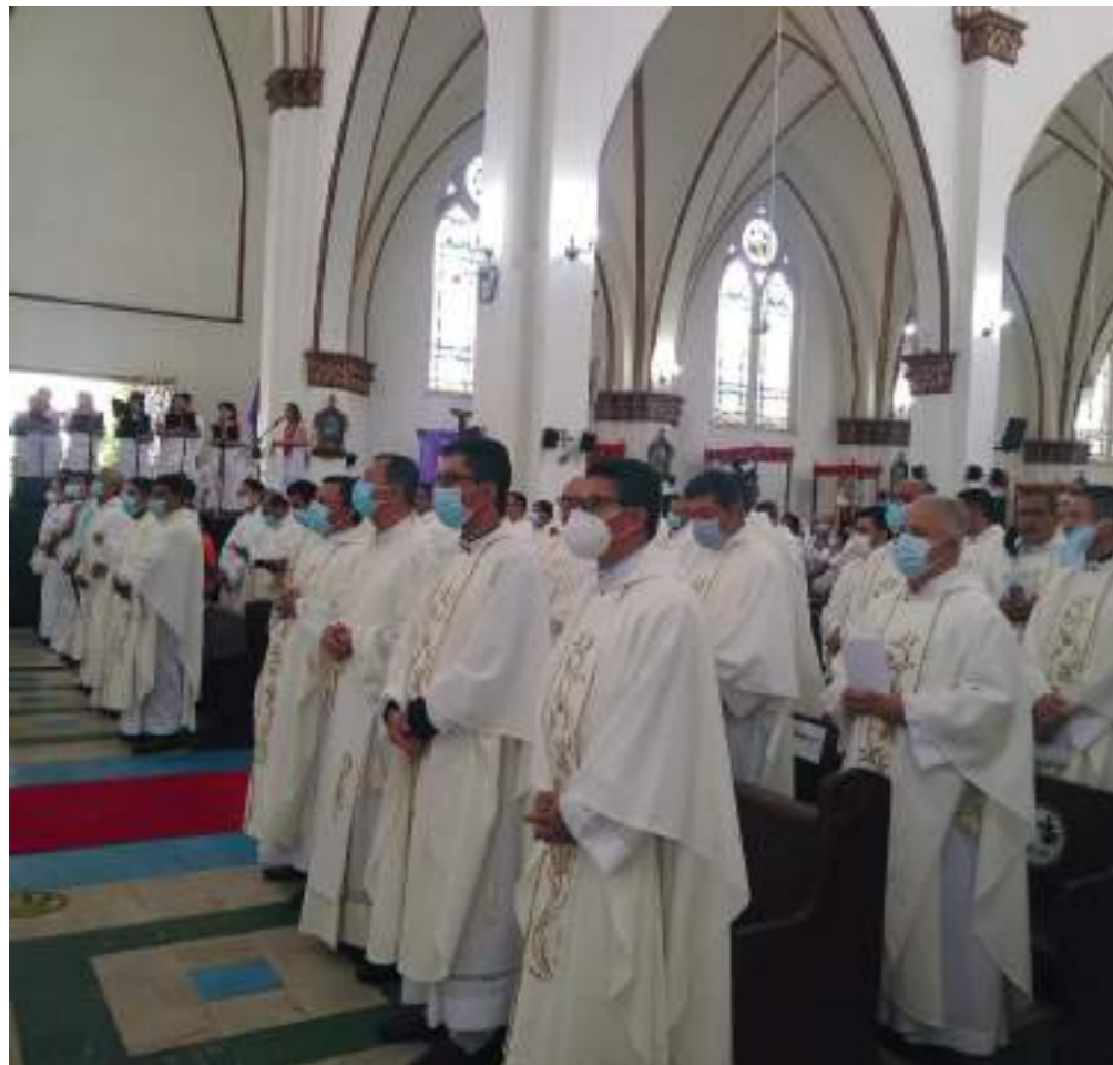
El Martes Santo se realiza la misa Crismal.