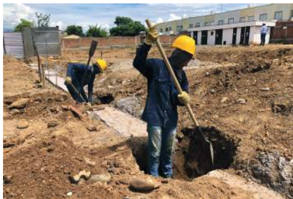
El plazo para la entrega de la terminación de la primera fase del CAIMI es de seis meses.

Tras dos semanas de iniciados los trabajos, ya se notan los avances en el cerramiento, construcción de parqueaderos, revisión y adaptación de redes hidráulicas y de energía.