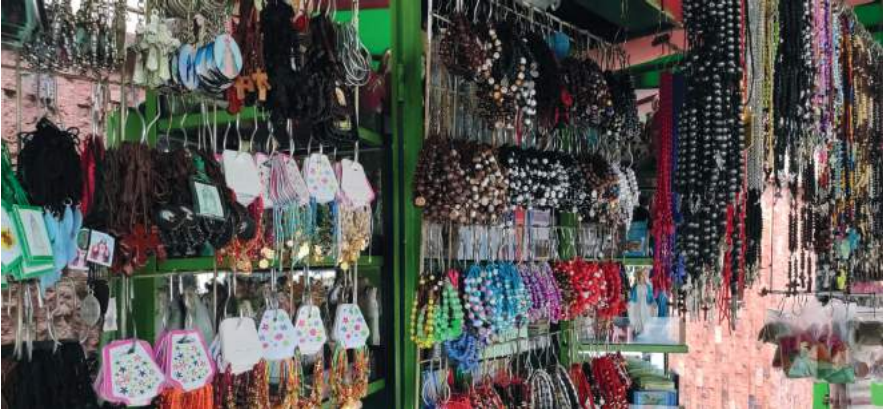
Los artículos que más se compran son: el cirio pascual, viacrucis, camándulas, novenas, imágenes religiosas y veladoras.

pricipiando bien y veo que a los otros también les está yendo bien a pesar de que tenemos productos similares. Aquí es la parte donde más se vende porque hay varios puestos del mismo producto. Las ventas se han aumentado un 30% o 40%. Desde que el comercio no cierre y siga todas las precauciones de seguridad, yo creo que la economía mejorará.”