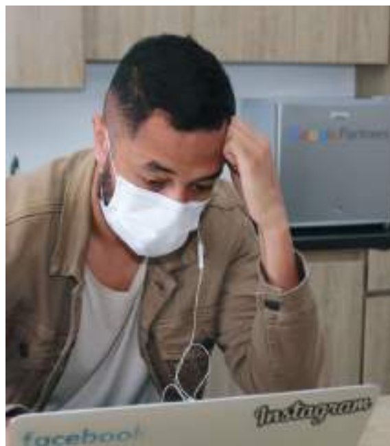
En esta modalidad, el empleador y trabajador no interactúan físicamente, desde su inicio hasta su terminación, la comunicación se realiza de manera remota.

El oficio establece que el trabajador puede ser citado en 3 eventos particulares: (i) verificación de los estándares que deben cumplir las herramientas y los equipos de trabajo, (ii) cuando se requiera instalar o actualizar manualmente en los equipos de trabajo algún tipo de software, programa, aplicación o plataforma y (iii) para adelantar el proceso sancionatorio o disciplinario.