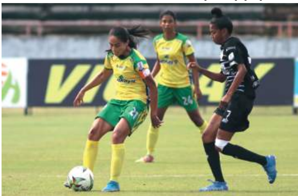
El juego fue bien disputado durante los 90 minutos.