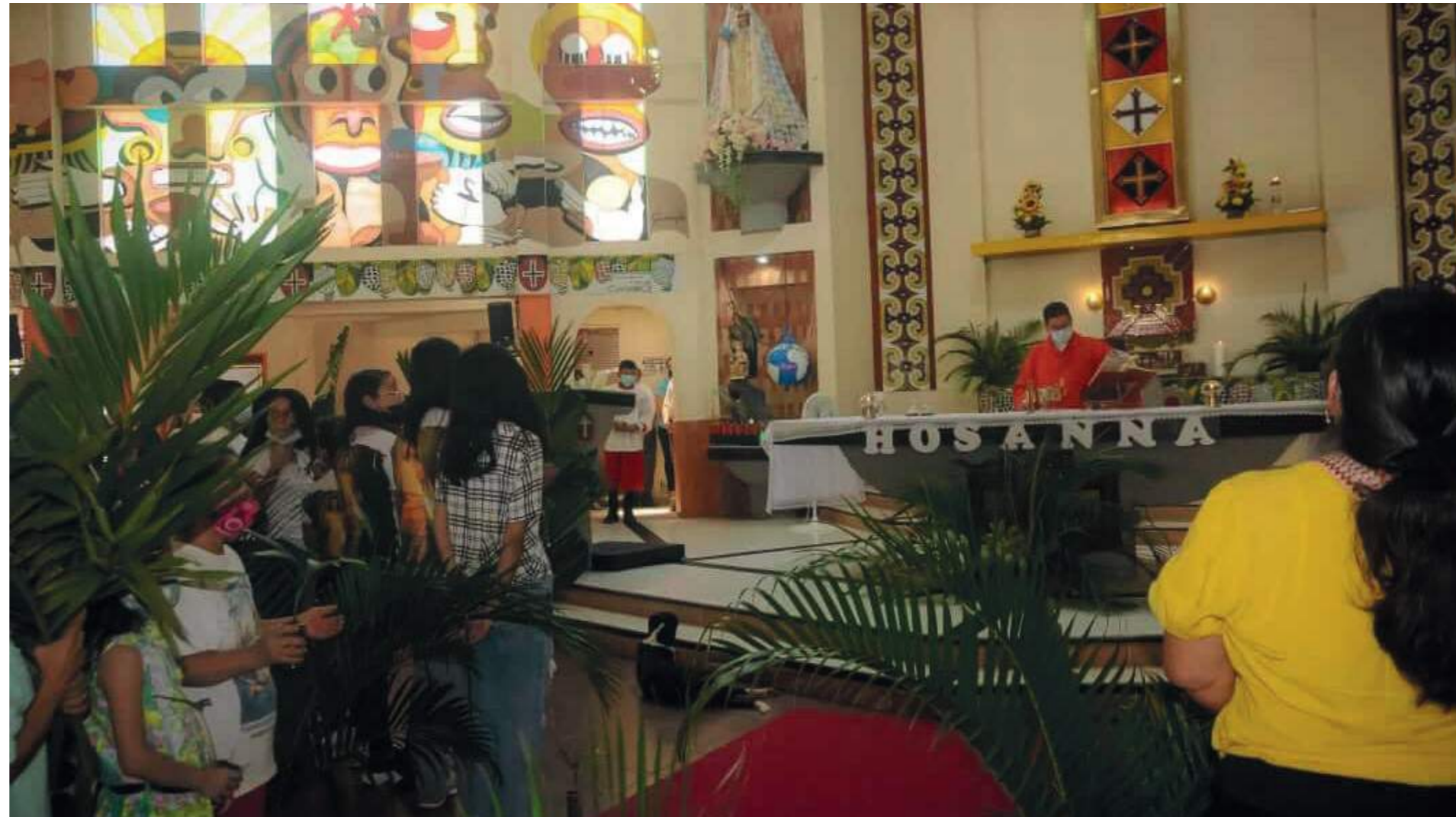
La Semana Santa se inicia el domingo de ramos.

“Los fieles se acercan al templo a rezar el Viacrucis, luego viene el acto central que nos dejó Jesús en la cruz con el sermón de las Siete Palabras, es el testamento que nos dejó. En el caso de nuestra parroquia nos reuniremos a las siete de la noche para hacer esta celebración”, sostiene. “Perdónalos Señor porque no saben lo que hacen, hoy estarás conmigo en el paraíso, hijo he ahí a tu madre, madre he ahí a tu hijo, Dios mío Dios mío ¿por qué me has abandonado?, tengo sed, todo