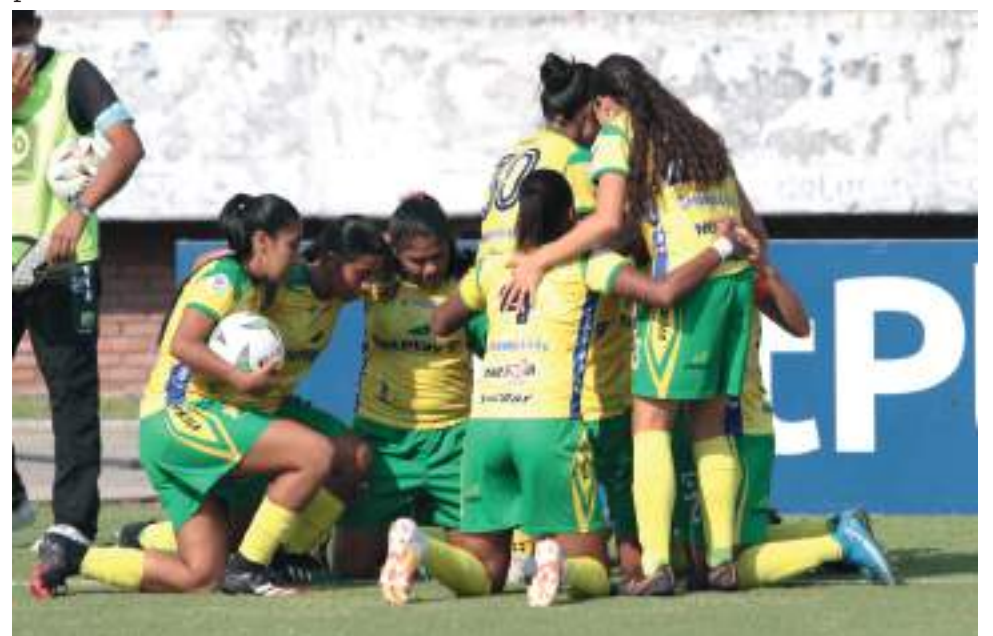
Las opitas esperan seguir celebrando para meterse a las finales.

Con este triunfo ante el Junior, las locales sueñan con un cupo en las ocho mejores, con el trabajo que vienen cumpliendo de la mano del técnico Douglas Calderón.