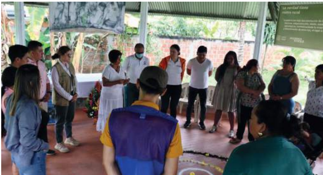
Escuchar a las víctimas y a firmantes del acuerdo de paz ha sido clave para desarrollar el informe final.

“Nos hemos enfocado en lograr identificar esos hechos que han constituido violaciones a derechos humanos, infracciones al derecho