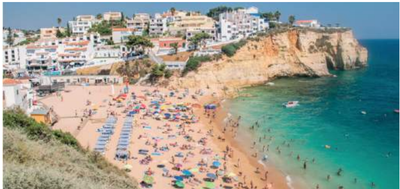
La vacunación es el factor de seguridad más importante para viajar, ya que los viajeros no vacunados tienen más probabilidades de enfermarse y transmitir el covid-19.

Aún así, la tendencia general en el nivel de riesgo ha sido a la baja en gran parte del mundo en las últimas semanas, y África en particular ha visto caer sus evaluaciones de riesgo.