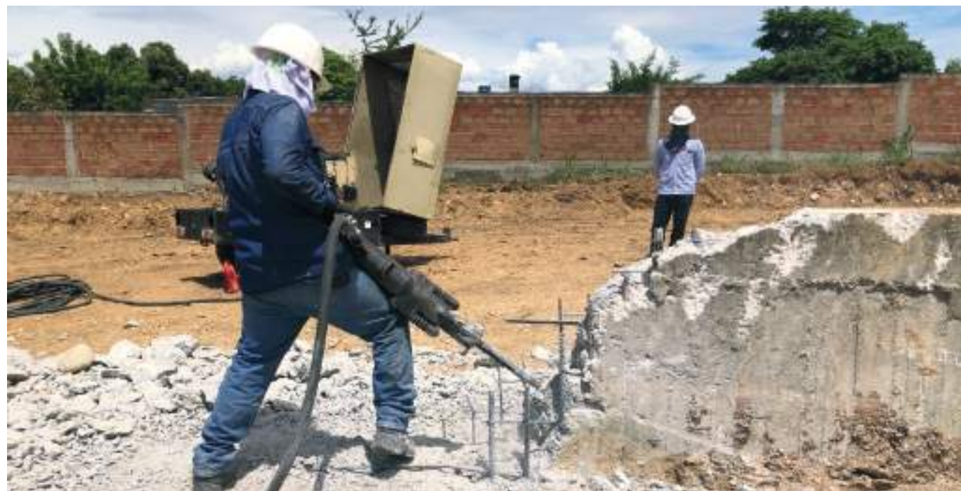
Esta obra se realiza mediante un convenio firmado entre la Secretaría de Salud de Neiva y la ESE 'Carmen Emilia Ospina'.

Finalmente, la obra se realiza mediante un convenio firmado entre la Secretaría de Salud de Neiva y la ESE 'Carmen Emilia Ospina', y cuenta con la vigilancia de un gran número de líderes comunales y de los veedores de salud. Por ahora, la comunidad sigue expectante para observar una