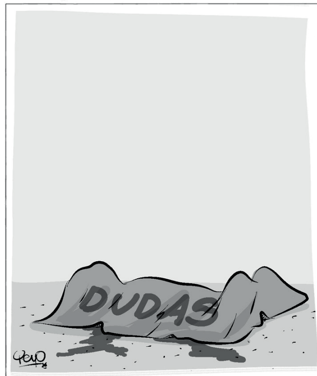
PUTUMAYO, MANTO DE DUDAS

El departamento presenta un gran potencial de atractivos turísticos y por ser un paso intermedio a los que posee la región surcolombiana. Para ello debemos mejorar la infraestructura vial que se encuentra bastante deteriorada. Otro detonante es la inseguridad ciudadana que impide que los turistas se sientan seguros y tranquilos cuando deambulan por las vías públicas y visitan los gastrobares por el temor a ser atacados. Igualmente, las Tics se deben masificar. Debe existir una política pública para masificar acciones tendientes a mejorar el servicio al cliente, difusión amplia de la oferta hotelera y gastrobares, entre otros factores para fortalecer el sector turístico en esta región. Hay que aprovechar los principales atractivos relacionados con el ecoturismo, los cuales se pueden alternar, para que propios y extraños disfruten y contribuyan a dinamizar la dinámica productiva de la región huilense.