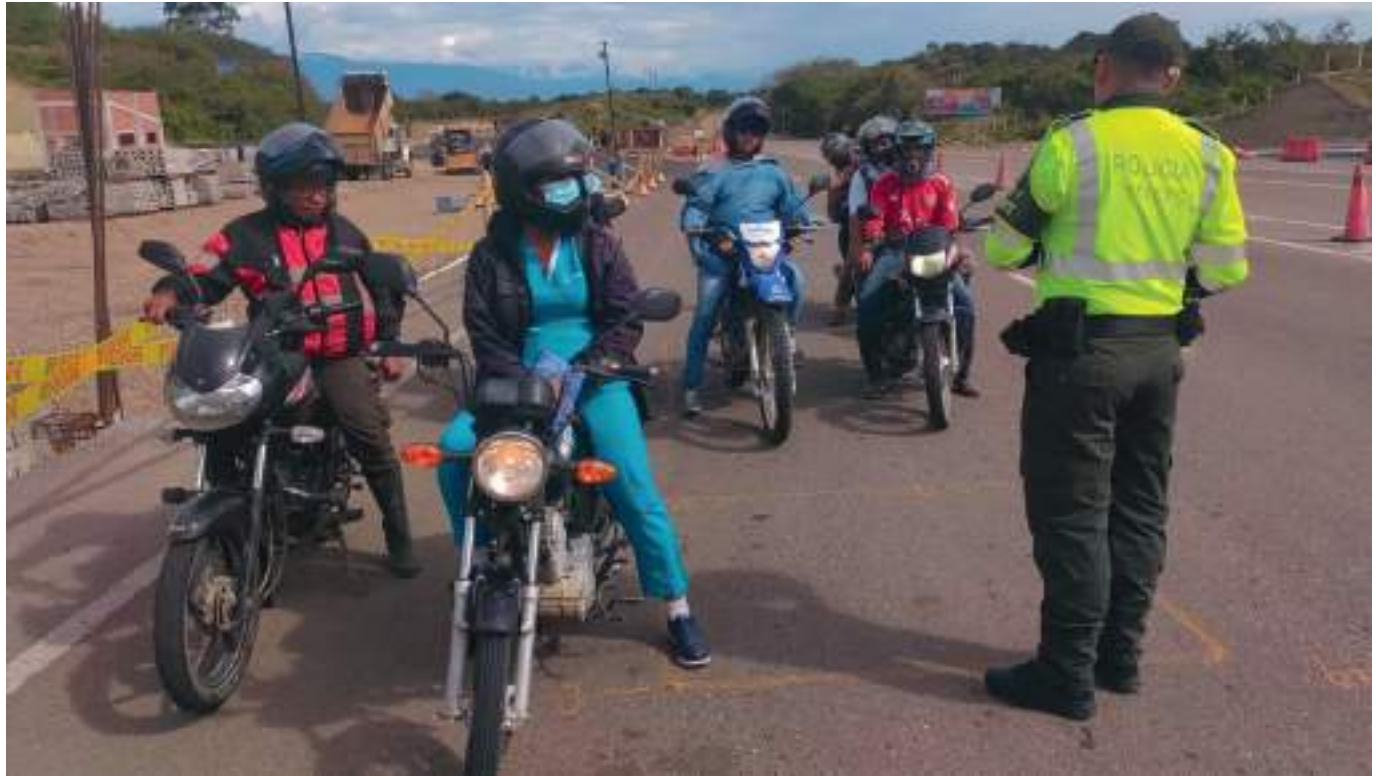
En este 2022 se han hecho 15,284 órdenes de embargos a personas que adeudan a la oficina de tránsito y que nunca han pagado la obligación de la multa aplicada.

Ahora bien, de acuerdo con la directora del Instituto de Transporte y Transito del Huila, se está identificando que en la región todavía hay actores viales que se movilizan sin los documentos requeridos y no están cumplien-