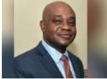
Luis Gilberto Murillo

Fue designado por Gustavo Petro como embajador de Colombia en Estados Unidos. Así lo confirmó el presidente electo en su cuenta de Twitter, quien destacó en el anuncio que este cargo diplomático será asumido por un “afro del Chocó”. Pese a que Murillo, exgobernador del Chocó, era el más sonado para ocupar este cargo y, de que Petro aseguró en medios que él sería su apuesta para esta embajada, se dudaba sobre la posibilidad de que llegara a este cargo debido a que tiene nacionalidad estadounidense y las normas de ese país interfieren con esta designación. Murillo fue fórmula vicepresidencial de Sergio Fajardo en las recientes elecciones presidenciales.