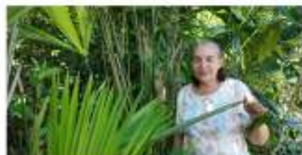
Arrancó primer emprendimiento con iraca en el Huila