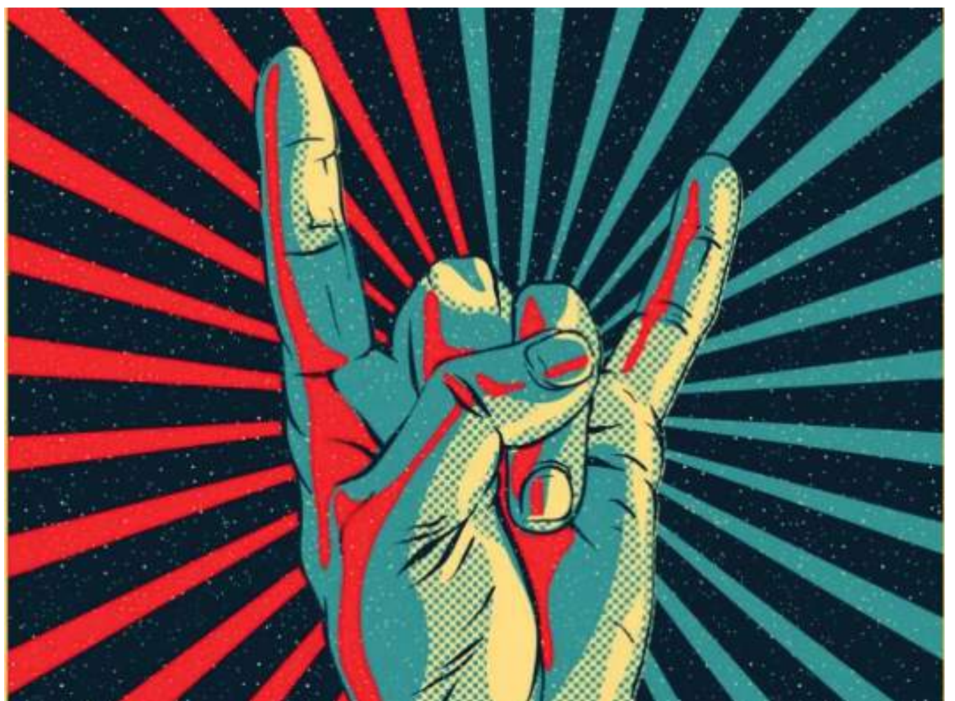
Ponerle play una y otra vez a tu canción favorita en inglés es una gran estrategia para ampliar tu vocabulario y mejorar tu pronunciación.

Academia Canadiense de Cultura Oriental y Occidental, se dividieron a estudiantes universitarios en tres grupos y cada uno tomó clases de inglés bajo diferentes esquemas: el grupo 1 tuvo un instructor que utilizó exclusivamente música durante la lección, el grupo 2 aprendió con música la mitad del tiempo y el grupo 3 no estuvo expuesto a música durante la clase.