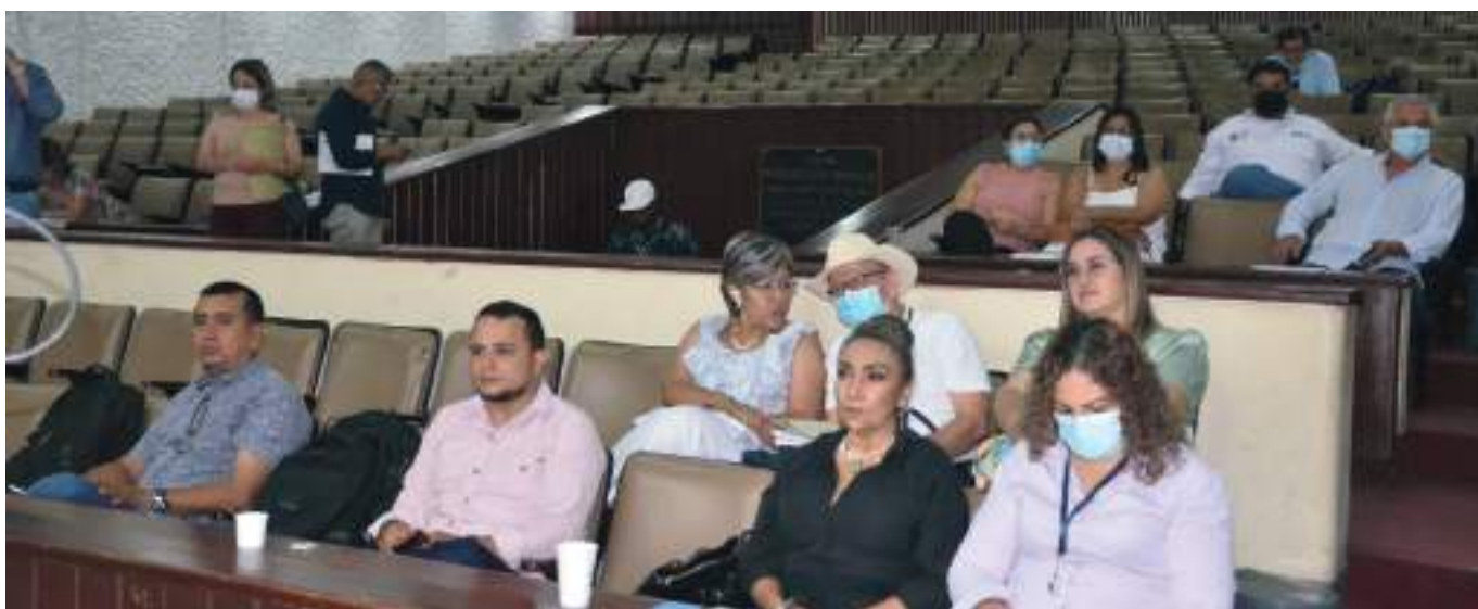
Dentro de las secretarías que se presentaron el común denominador es que la mayoría de los proyectos están sin iniciar su ejecución.

Según reveló el diputado citante, existen 142 proyectos financiados con esta fuente que corresponde a $376.427.000.000, de los cuales 89 los ejecuta el Departamento, y 53 algunas empresas de servicios públicos, Ministerios y Municipios.