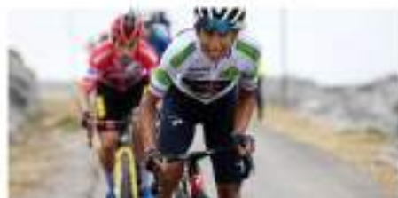
Cara y sello del ciclismo en Colombia