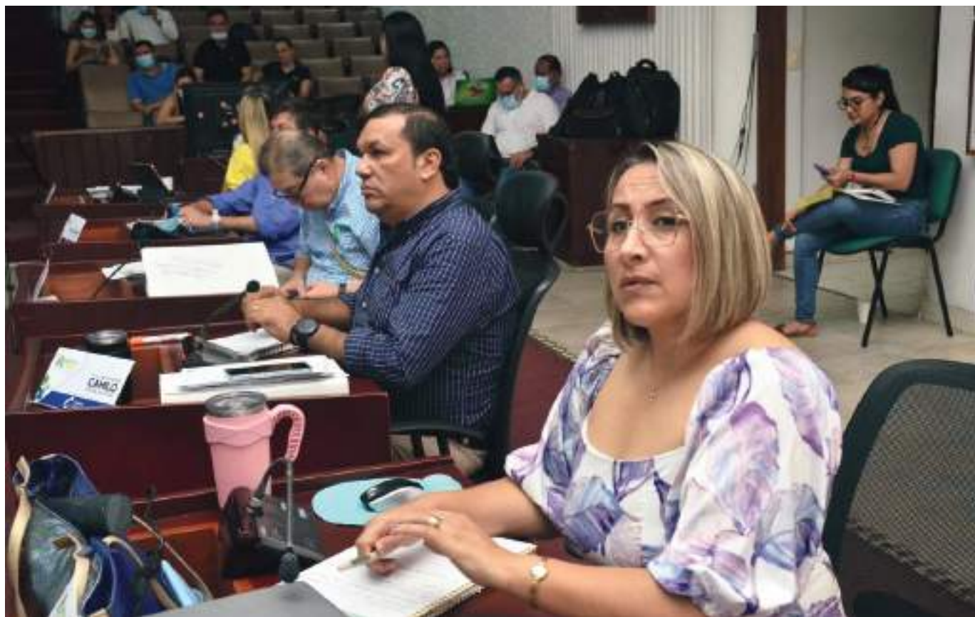
Diputados evaluaron la inversión presupuestal por recursos de regalías de 10 secretarías de la Gobernación del Huila.

70 mil millones se han destinado para hacer realidad el proyecto de construcción de la ESE Hospital Departamental San Vicente de Paúl, de los cuales 25 mil millones fueron comprometidos por el gobierno departamental y cerca de 45 mil millones fueron asignados por el Ministerio de Salud y Protección Social.