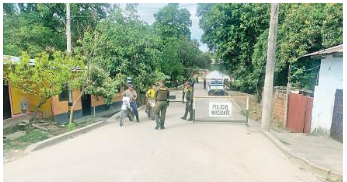
El documento compuesto por 8 artículos entró a regir el pasado 8 de julio y tendrá vigencia hasta el 31 de diciembre del año en curso.

El Municipio de Campoalegre también está definiendo un nuevo decreto especialmente de movilidad para en cierta medida, poder contrarrestar los hechos que están alterando el manual de seguridad y convivencia ciudadana.