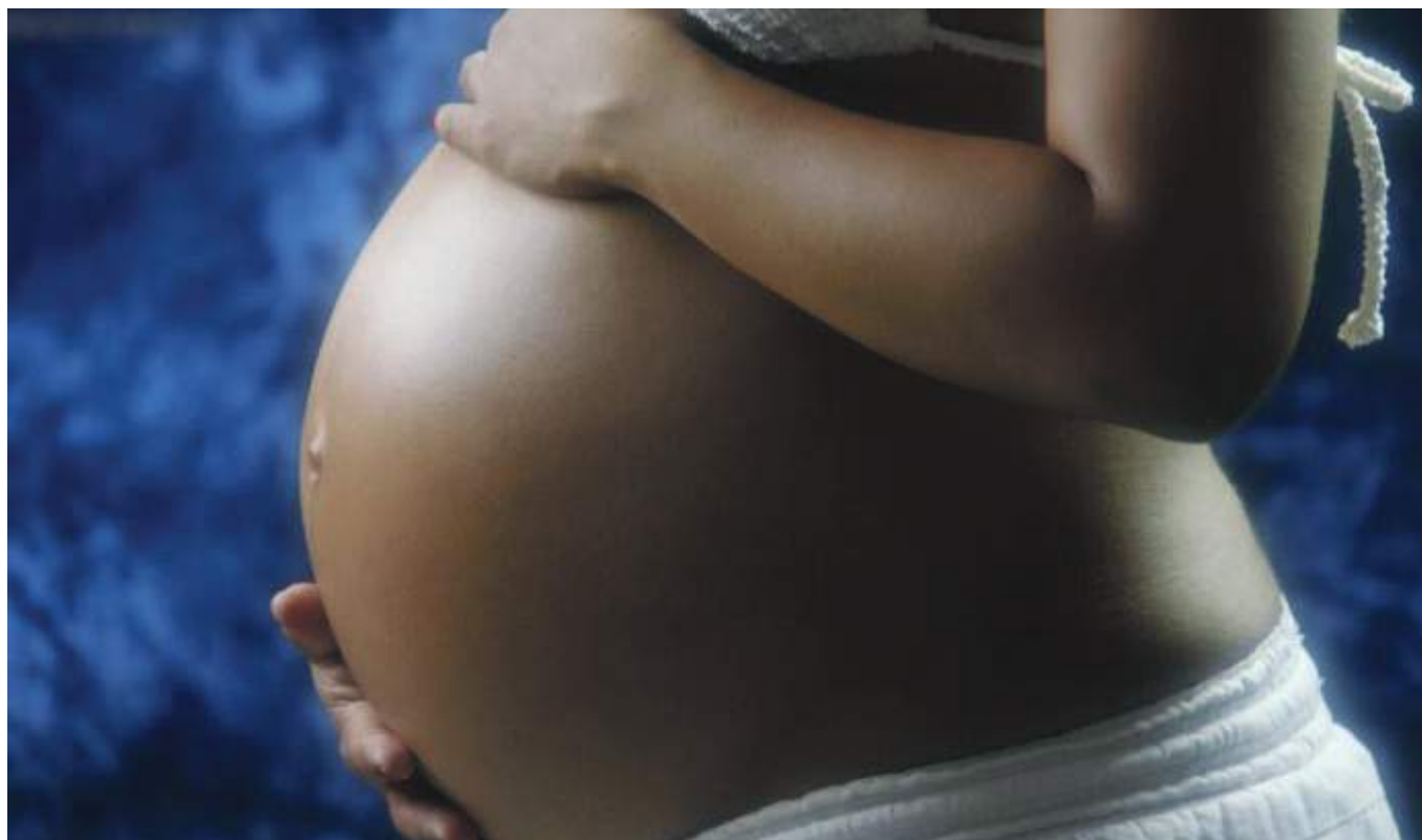
Durante el embarazo, la trombofilia puede causar complicaciones como hipertensión, preeclampsia, desprendimiento de placenta, restricción del crecimiento fetal y aborto retenido.

“Por ser una enfermedad silenciosa solo aparece cuando el paciente sufre consecuencias graves, como trombosis, embolismo pulmonar, ACV (accidente cerebrovascular), entre otros problemas.