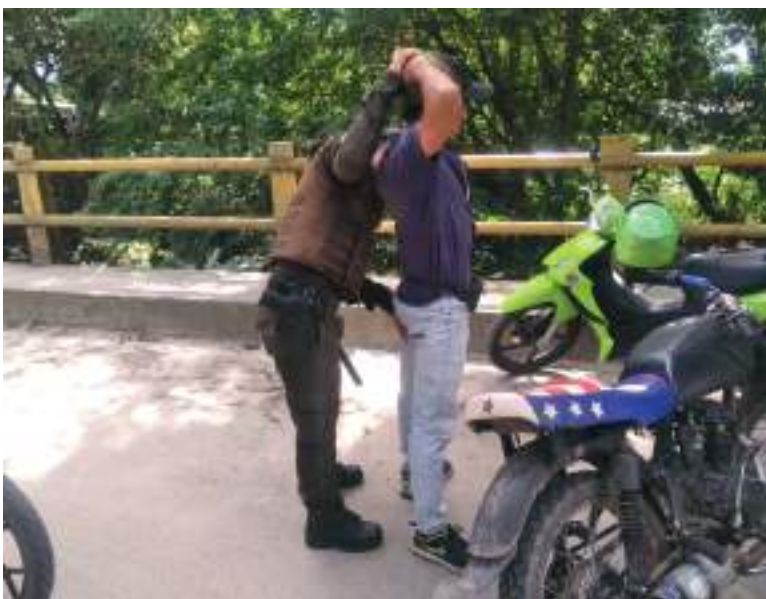
Los hechos de sangre registrados en las últimas semanas han aumentado la inseguridad en la capital arrocerera del Huila.

- La octava insta a los organismos de seguridad del Estado y autoridades civiles a hacer cumplir lo dispuesto en estos artículos para lo cual deberán realizar operativos de rigor y proceder a aplicar las medidas correctivas.