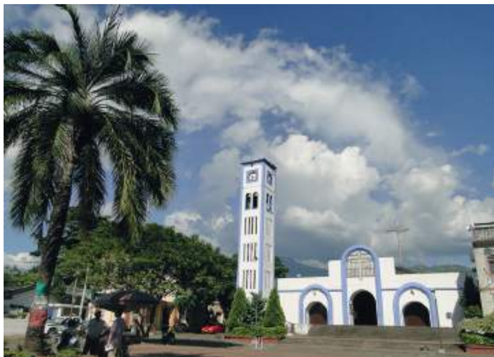
Tras los hechos de violencia registrados durante el transcurso del año en Campoalegre, el municipio se vio obligado a implementar un decreto con medidas pertinentes.

Estos hechos de sangre registrados justamente han sido rechazados por la administración municipal porque han cobrado la vida de muchos ciudadanos, sin embargo, en el momento estos casos se encuentran en proceso de investigación. Aunque ya se han realizado algunas capturas de varios responsables por medio del pago de recompensa, los últimos flagelos presentados, siguen siendo materia de investigación. Hasta el mes de marzo se capturaron