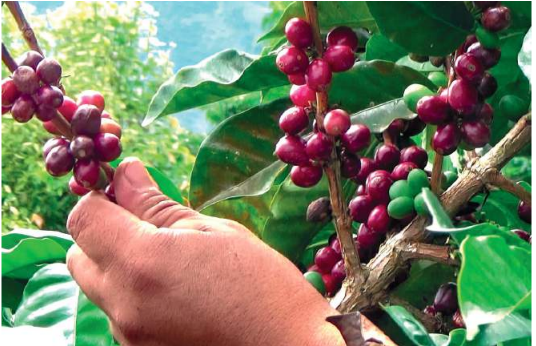
Se logra advertir un mensaje de confianza a los productores que pueden seguir teniendo en los organismos cooperativos a los que están vinculados.

■ Si bien es cierto se atraviesa por una situación de mercado compleja a nivel nacional e internacional, los caficultores no esperan, ni han pedido recursos de apalancamiento al ente seccional, dado que su dinámica empresarial les permite atender sus compromisos, en una relación en donde los caficultores deben mantener la reciprocidad con la cooperativa.