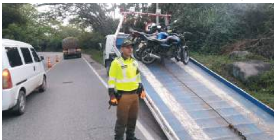
En promedio cada fin de semana se imparte 60 comparendos, y la mayoría es por no portar el documento de conducción.

Finalmente, el año más álgido es la vigencia del 2016 dado que allí fue donde hubo gran imposición de órdenes de comparendo.