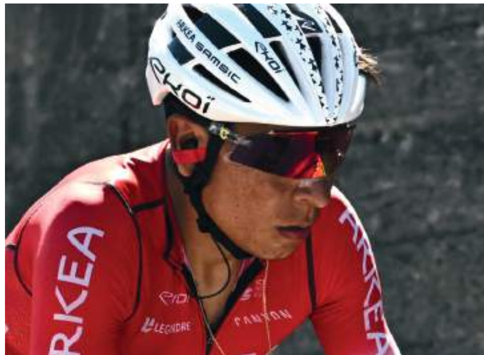
Nairo Quintana, una de las cartas colombianas en el Giro Ibérico.