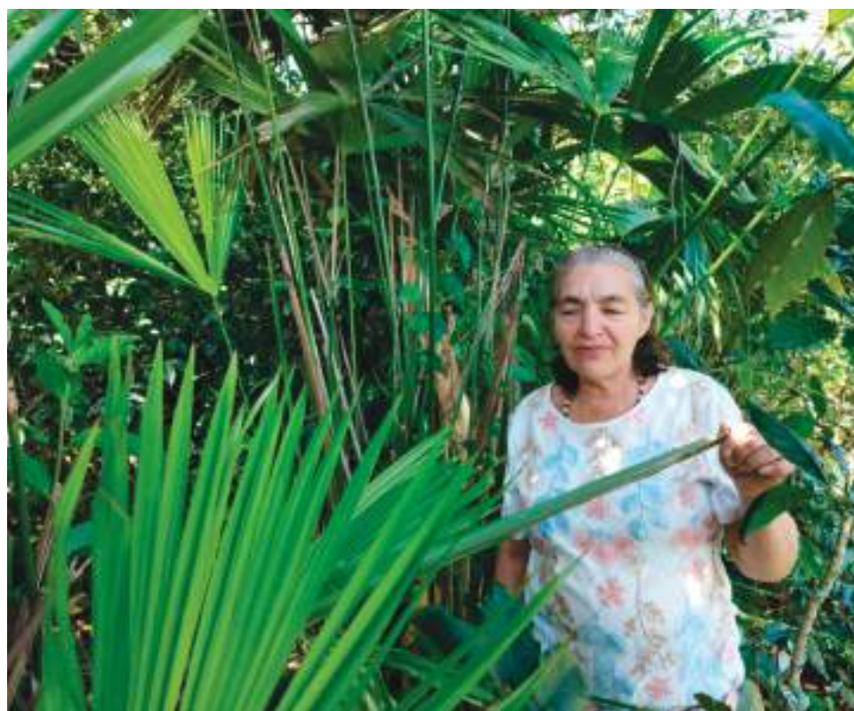
Con este emprendimiento, mujeres de todas las edades han tenido la posibilidad de hacer realidad este interesante proyecto.