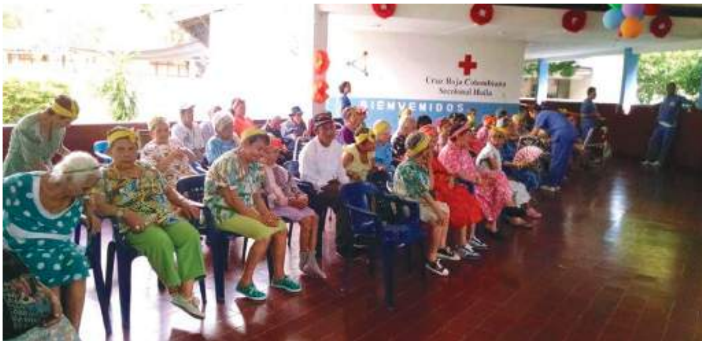
Los abuelos que se encuentran como pacientes y residentes del Hogar de Ancianos San Matías, padecen de diferentes patologías médicas y su alimentación depende exclusivamente de este asilo.