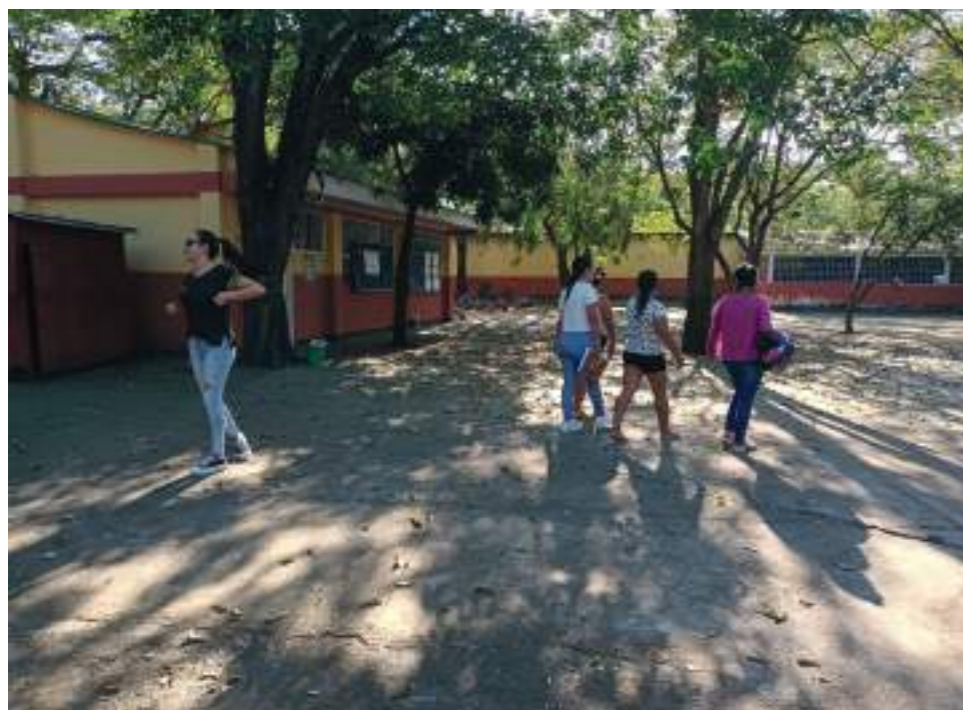
Padres de familia recorren las instalaciones en el momento de las denuncias.