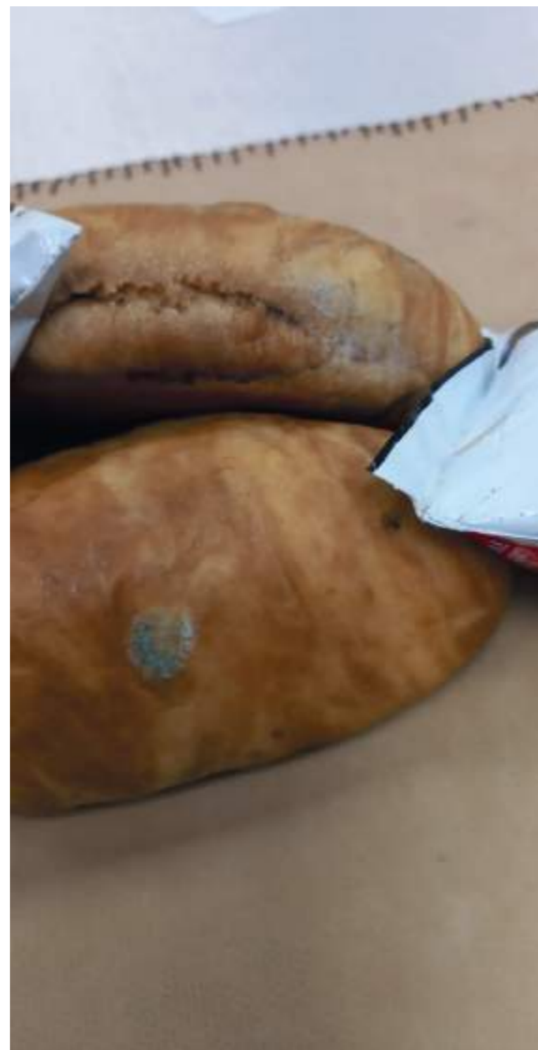
Panes en malas condiciones que detectaron los padres de familia.