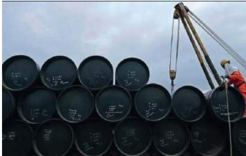
El crudo ha caído desde principios de junio.

El crudo ha caído desde principios de junio debido a los crecien-