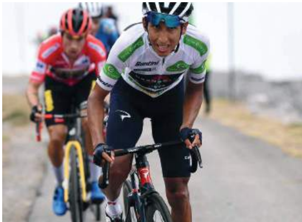
Egan Bernal definitivamente no irá a la Vuelta a España.

Mientras se desvanecen las esperanzas de ganar el Tour de Francia, en el que solo tomaron la partida tres colombianos, siendo el de mejor figuración Nairo Quintana ahora en la posición 12 de la general, el ciclismo colombiano comienza a preparar su avanzada para la Vuelta a España. Egan Bernal que se esperaba reapareciera descartó su participación.