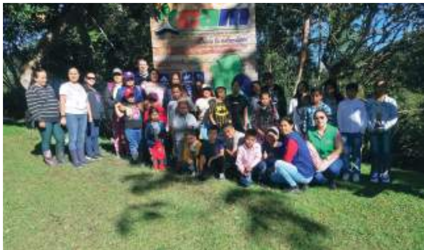
La autoridad ambiental del Huila obtuvo un resultado de 88.35 incrementando la calificación en 5.83% respecto a la medición del año 2020, ubicándola en el rango sobresaliente.

“A partir del cálculo del índice, la CAM obtuvo un resultado de 88.35 incrementando la calificación en 5.83% respecto a la medición del año 2020, ubicándola en el rango sobresaliente”, dice el informe del Ministerio de Ambiente y Desarrollo Sostenible dado a