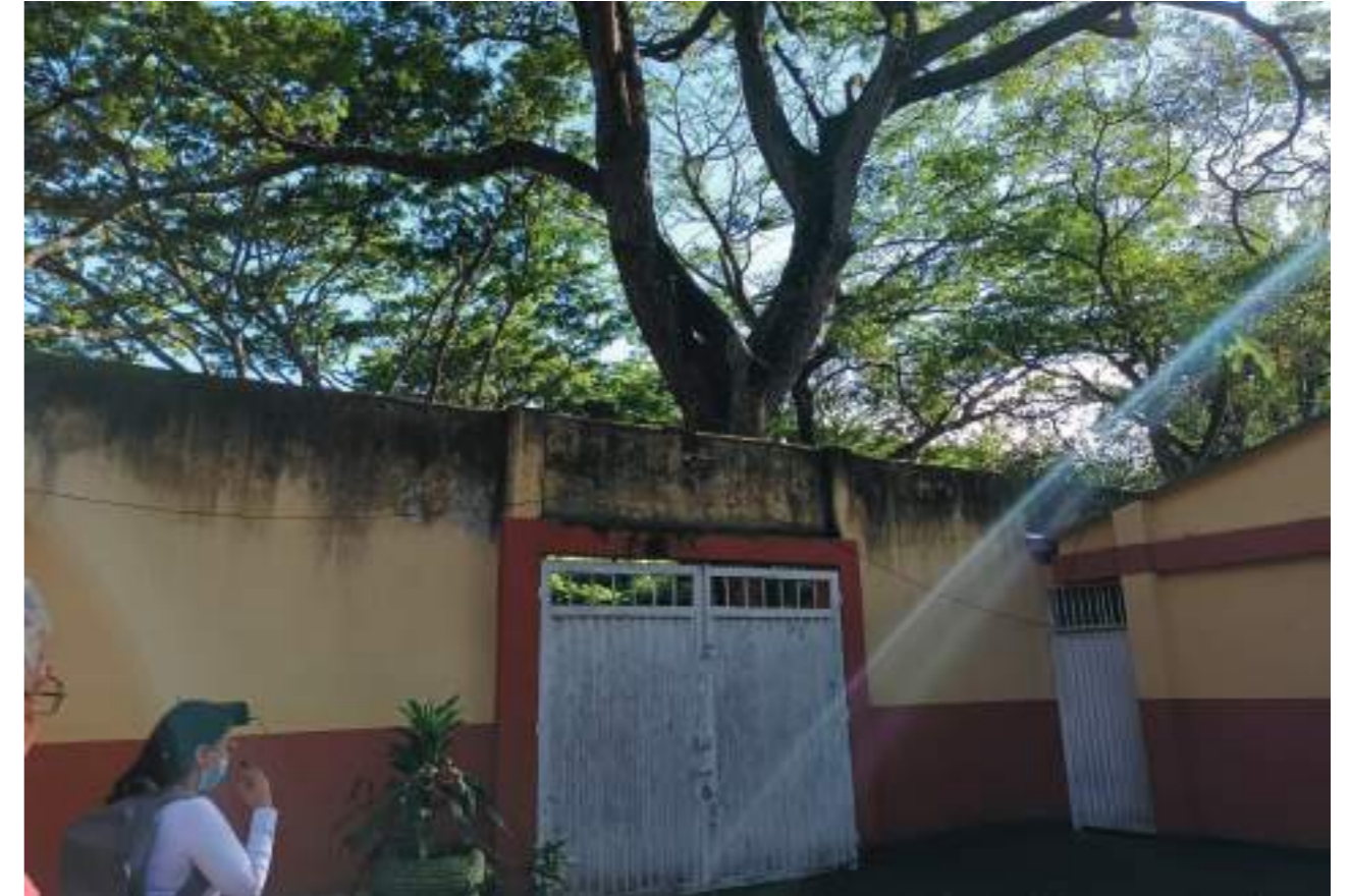
Árbol externo que amenaza con colapsar y generar una tragedia.