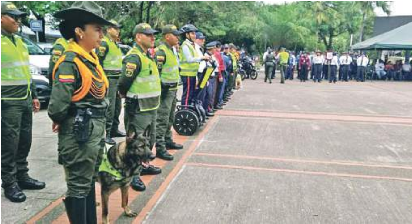
El dispositivo de seguridad de la Policía está implementado en todo el departamento, pero han hecho énfasis en Pitalito y Campoalegre por la complejidad que afronta.

las actividades para disminuir estas problemáticas de inseguridad que enfrentan y así garantizar la tranquilidad de los habitantes. De ahí que, el decreto seguirá vigente durante las fiestas precisamente para prevenir cualquier situación que pueda alterar el orden público.