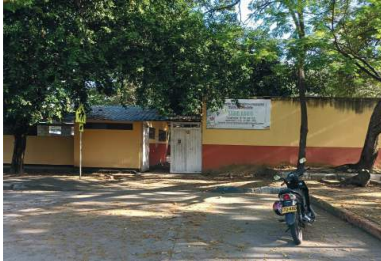
Fachada de la sede El Lago de la Institución Educativa Tierra de Promisión.

“Panes mohosos, avena pasada, hay solo dos aseadoras para toda la institución, tampoco hay celador”