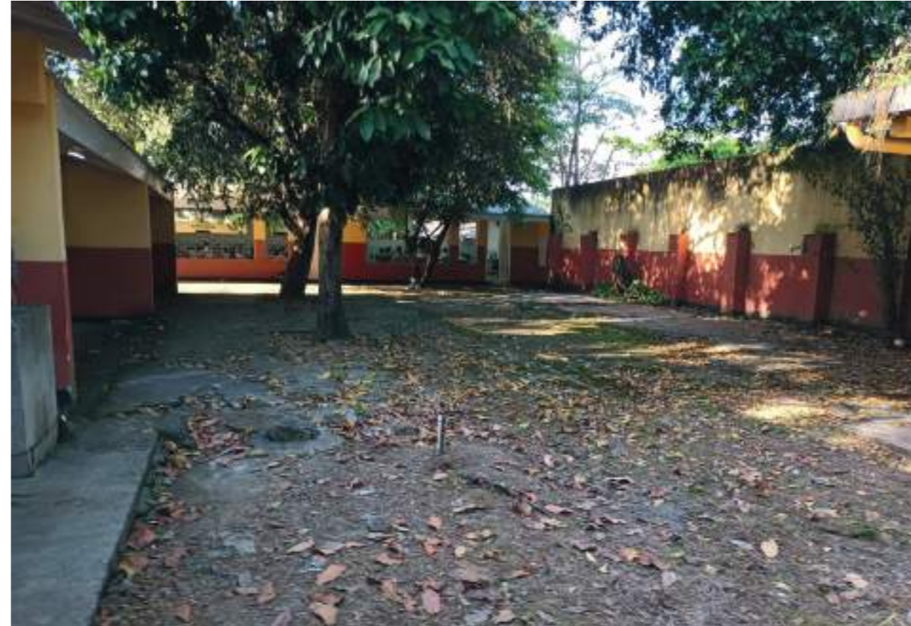
Patio con suelo en mal estado y sucio, no hay aseadoras.