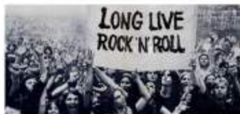
Día Mundial del Rock