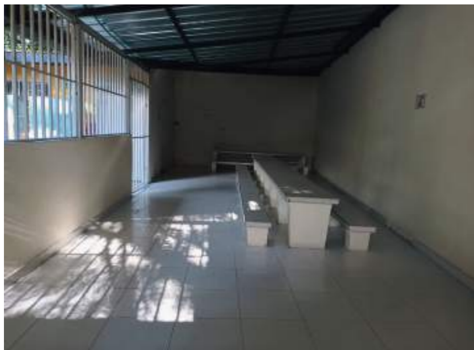
Lugar del comedor en donde sirven la merienda o desayuno.