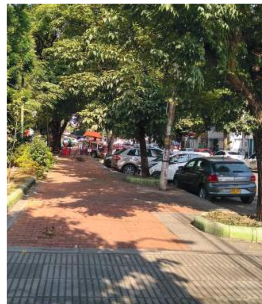
Sector de la calle 18 con venta de cafés especiales.