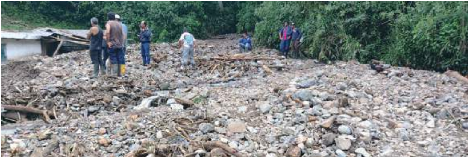
En zona rural del municipio de Elías, una creciente de la quebrada La Seca causó derrumbes y afectaciones en la vía principal así como en varias viviendas.

armazón para dar paso a los vehículos mientras llegaba al sitio los bomberos.