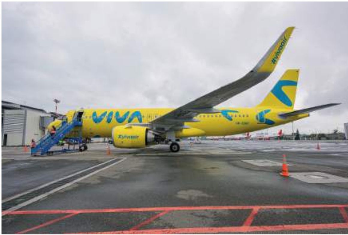
Esta articulación se realiza con el fin de seguir generando oportunidades para los neivanos, así como también el crecimiento turístico de la región.

Neiva para conectarse con todos los actores comerciales y administrativos de la ciudad, en pro de fortalecer la ruta Neiva-Cartagena que empieza a operar el 23 de marzo, para la Alcaldía de Neiva a través de la Oficina de Internacionalización y todas las dependencias encargadas de desarrollo económico, turístico, comercial y emprendimiento de la ciudad, es muy importante que esta ruta se convierta en una ruta