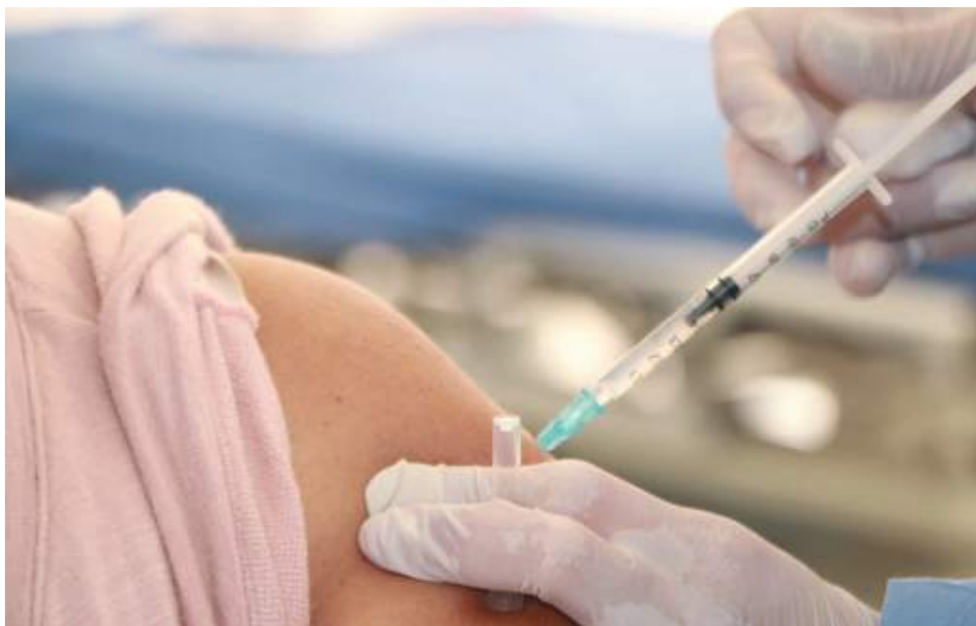
Yaguará, Elías, Tesalia, Villavieja, Neiva y Paicol, cuentan ahora con menor población en riesgo de sufrir consecuencias graves frente a contagios del virus SarsCov2, gracias a las coberturas de vacunación alcanzadas.

Campoalegre, Baraya y Hobo son los otros tres municipios que más se acercan a alcanzar de igual manera esta cobertura.