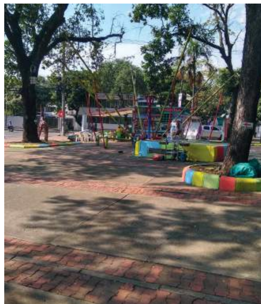
Zona aledaña a los juegos mecánicos para niños.