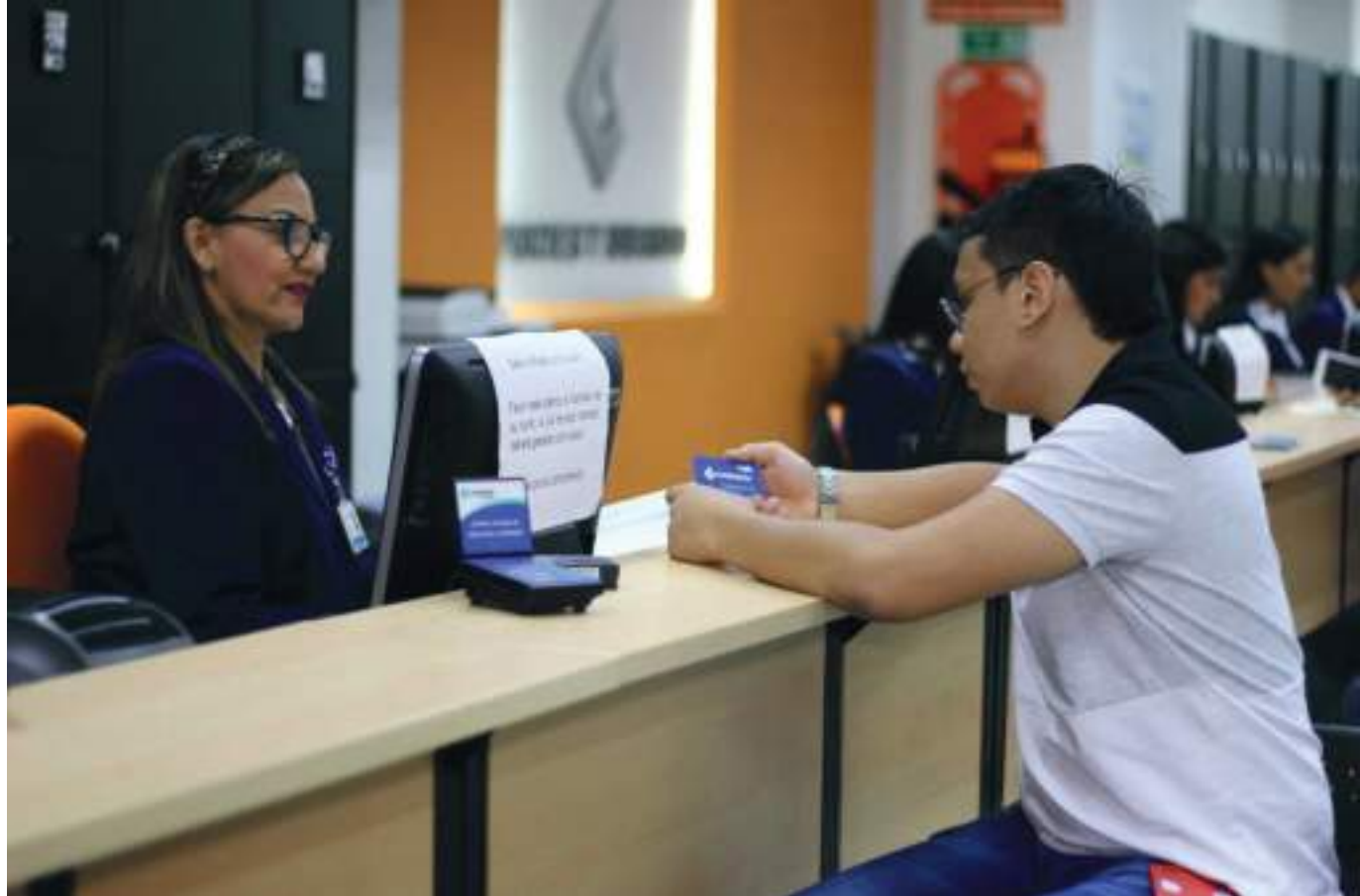
La cuota para este año estará entre los 31.281 y los 63.410 pesos, para el Huila será de 40.700 pesos.

En caso de muerte de una persona a cargo por la cual el trabajador estuviere recibiendo subsidio familiar, se pagará un