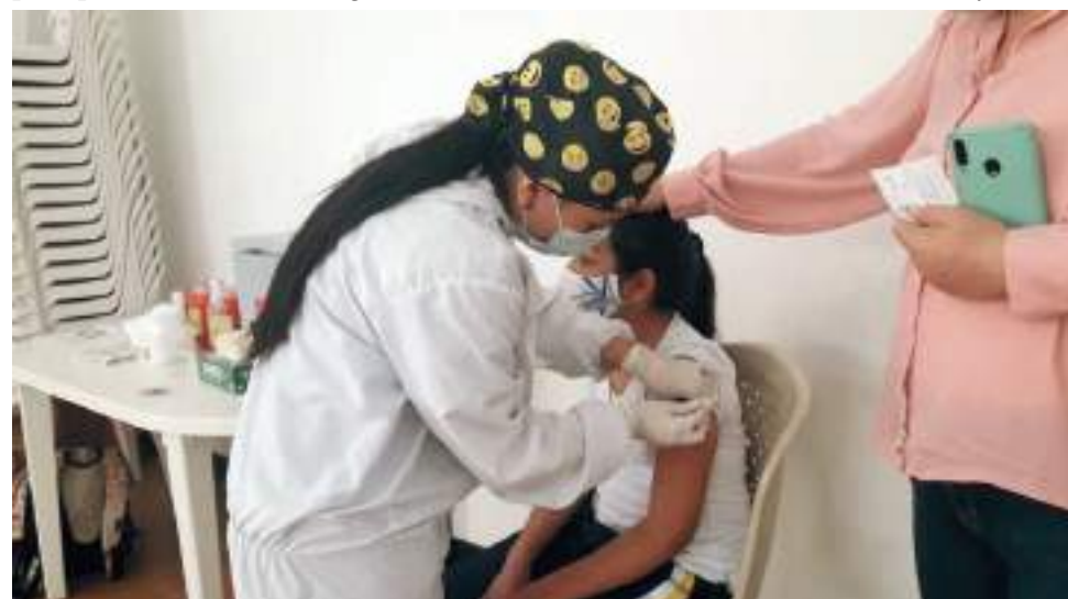
Jornadas de vacunación en las instituciones educativas, se desarrollan en Pitalito, donde aún hay cierto rezago en la cobertura.

La mayoría de habitantes de Neiva (71%) que se debían vacunar contra el Covid-19 ya están