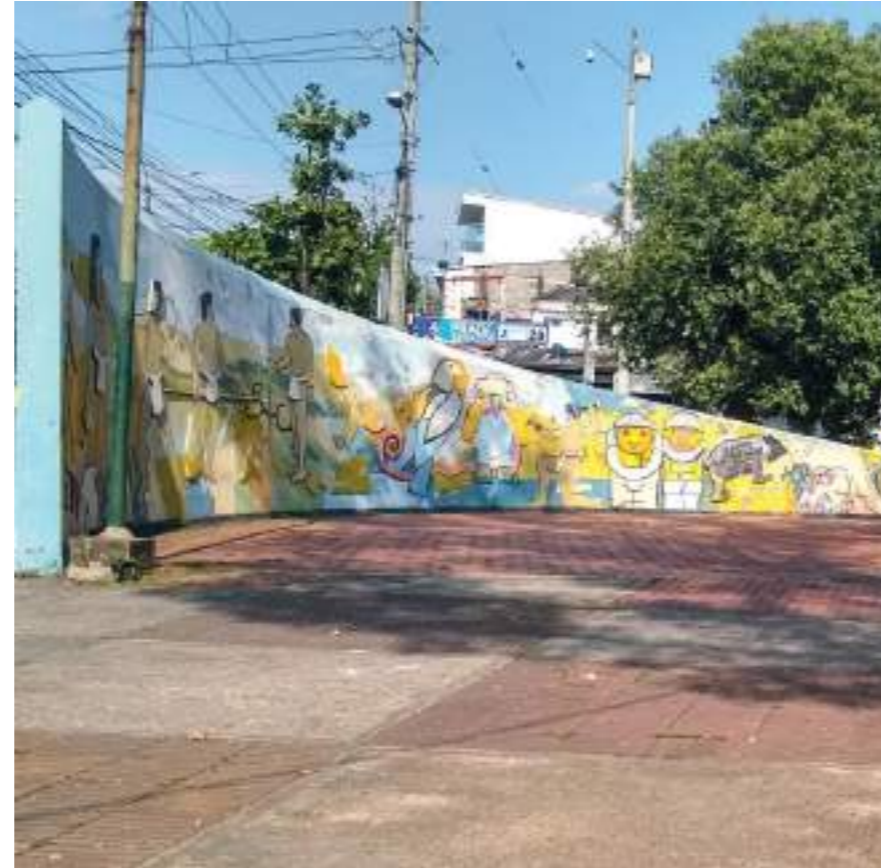
Entrada al parque Leesburg por la calle 21 con carrera 7.

En medio de las reflexiones que nos entregaron quienes laboran o simplemente comparten ocasionalmente en el parque Leesburg o del Amor y la Amistad en el barrio Quirinal, encontramos mucho de razón en el sentido que es de los pocos lugares al aire libre de Neiva en los que se puede departir sin tener que pagar o con una baja inversión como la compra de un chocado, un helado o un tinto.