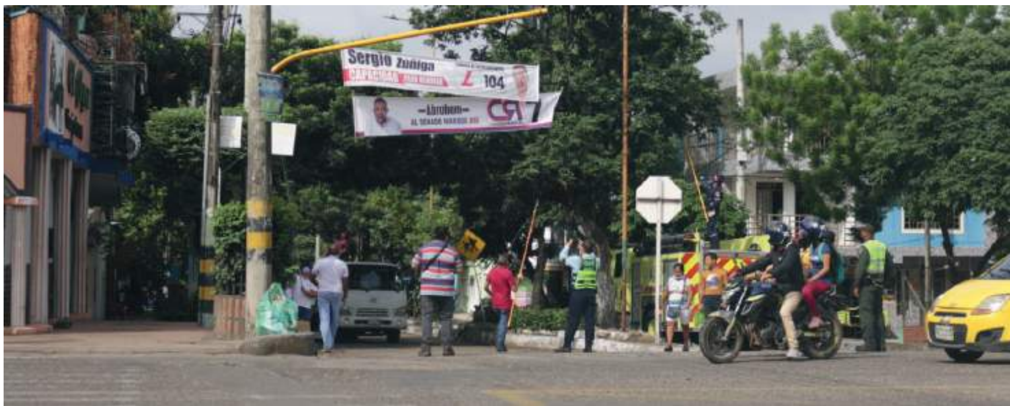
La Procuraduría General de la Nación emitió una alerta, porque en al menos 273 municipios del país no se ha regulado el uso de propaganda electoral.

■ La procuradora Margarita Cabello le llamó la atención a los alcaldes pues en algunos municipios se estaría ubicando publicidad política en edificaciones del Estado.