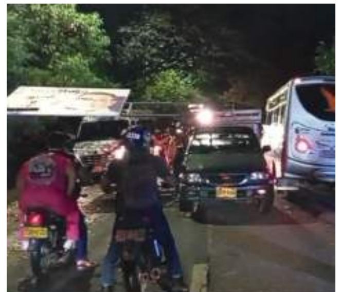
Viviendas destechadas, árboles caídos, suspensiones de energía eléctrica, fueron algunas de las emergencias que causaron las torrenciales lluvias acompañadas de fuertes vientos, al final de la tarde de ayer martes.