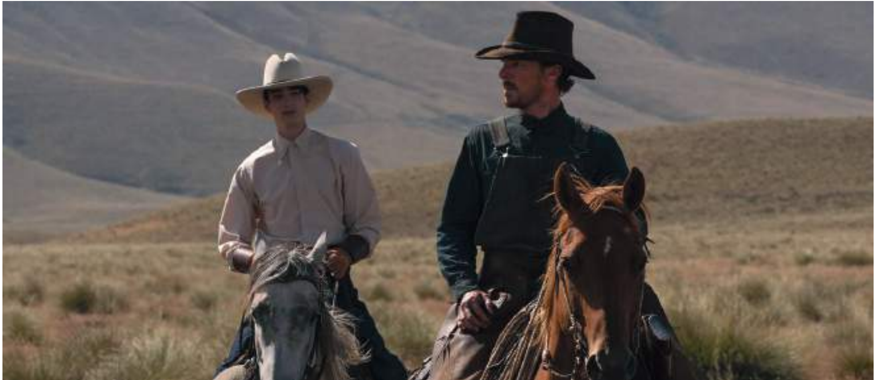
'El poder del perro' puede ser la gran ganadora de la noche, es la más nominada con 12 menciones.

■ 'El poder del perro' probablemente ganará la Mejor Película, y Kirsten Dunst finalmente obtendrá lo que se merece.