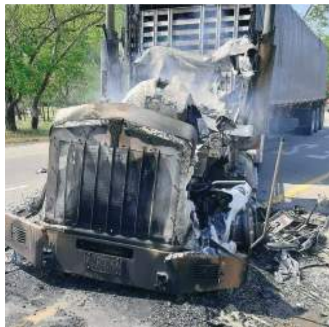
Incineraron algunos vehículos de carga pesada que transitaban en la vía entre Pelaya y Curumaní, mantienen en alerta a la comunidad y autoridades. Esto ocurrió en el sector de la Floresta.