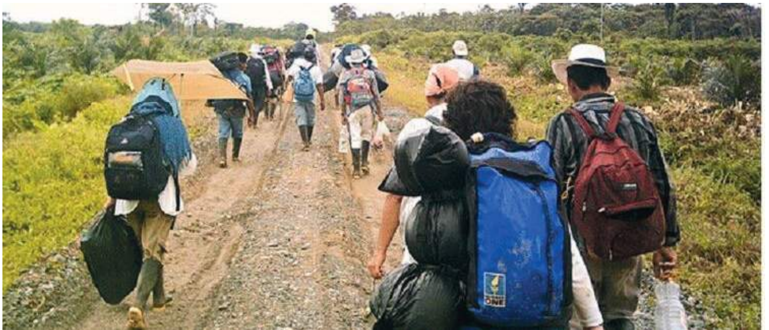
La violencia que se ha disparado este año en Colombia ya deja un número alto de víctimas.

En el caso de Arauca, donde se reporta la situación más crítica,