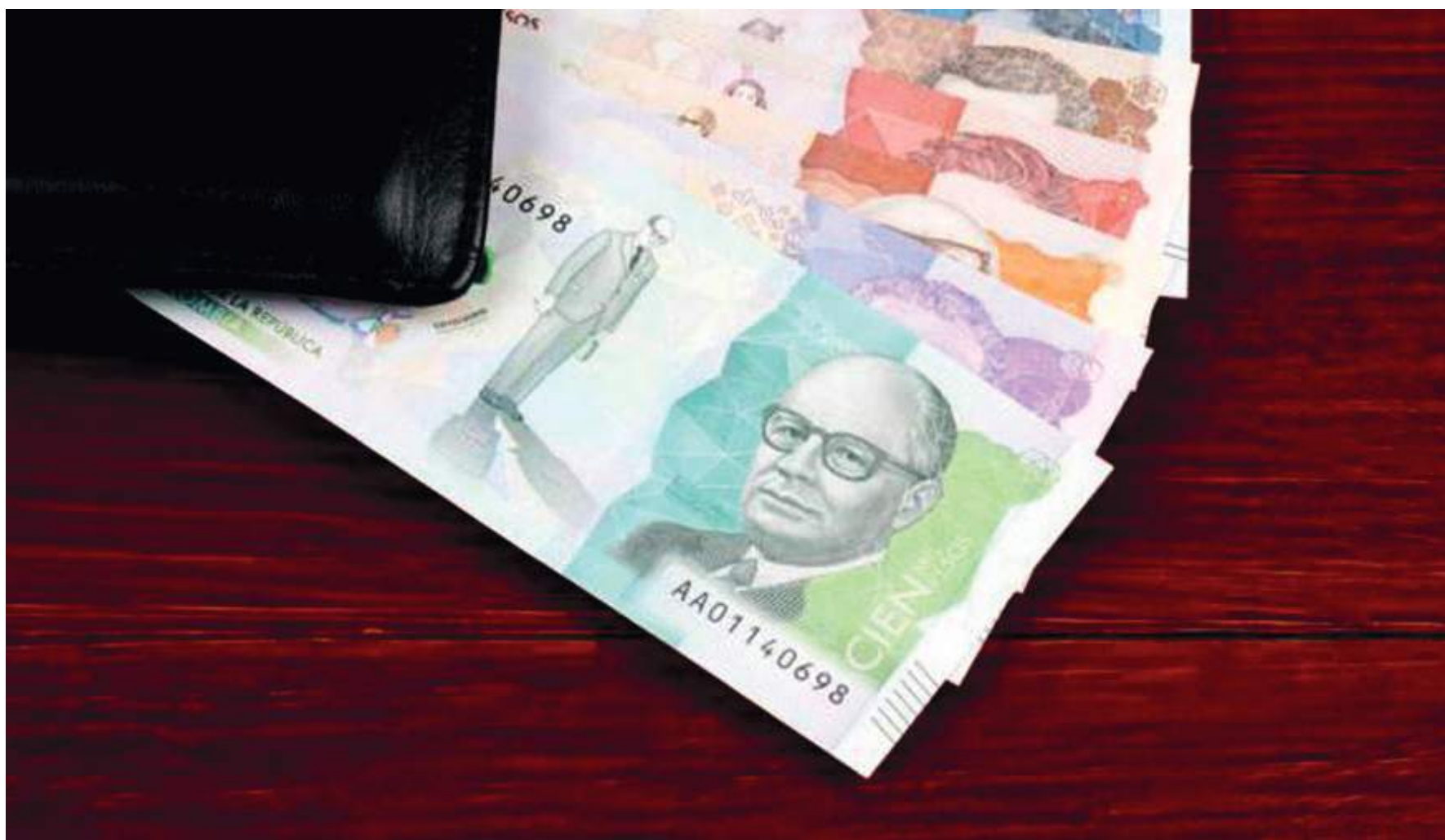
Al mes de febrero, la Caja de Compensación Familiar del Huila, Comfamiliar Huila, cuenta con 44.741 afiliados con cuota monetaria.

■ El apoyo económico está destinado para trabajadores con menores ingresos y sus familias. El valor de cada cuota dependerá del departamento y la zona de residencia, bien sea rural o urbana. La cuota para este año estará entre los $31.281 y los 63.410 pesos, que la recibirán los trabajadores que ganan máximo cuatro salarios mínimos mensuales. Los trabajadores del Huila recibirán $40.700 por beneficiario.