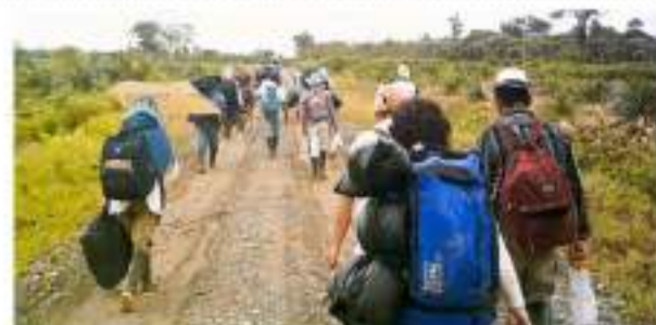
"En enero se presentaron 17 desplazamientos masivos en Colombia"