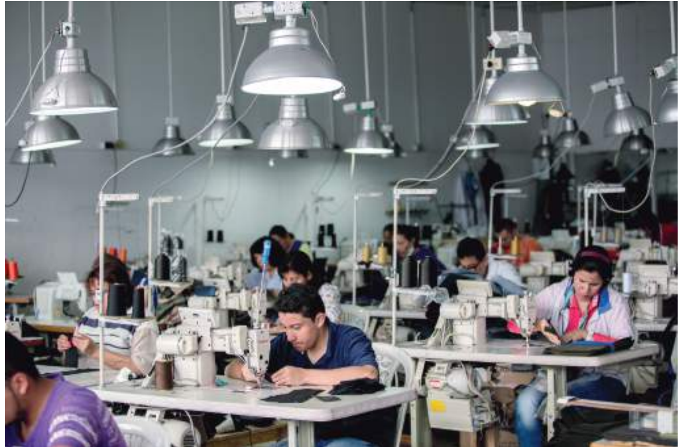
El valor agregado de las industrias manufactureras creció 11,7%.

Para el año 2021, el valor agregado de la agricultura, ganadería, caza, silvicultura y pesca crece 2,4%, en su serie original, respecto al mismo periodo de 2020. Esta dinámica se explica por los siguientes comportamientos: Cultivos agrícolas transitorios; cultivos agrícolas permanentes; propagación de plantas (actividades de viveros, excepto viveros forestales); actividades de apoyo a la agricultura y la ganadería y posteriores a la cosecha; explotación mixta (agrícola y pecuaria) y caza ordinaria y mediante trampas; y actividades de servicios conexas crece 3,9%, Cultivo