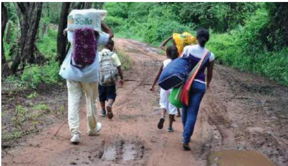
En este punto del país la violencia se ha disparado porque los grupos subversivos han intensificado sus combates con el fin de quedarse con el territorio.

“Nosotros, como Institución Nacional de Derechos Humanos, hemos estado realizando acompañamiento permanente a las comunidades y articulando las ayudas humanitarias que requieren en esta complicada situación, pero todos debemos hacer más, empezando por reiterar el mensaje a los grupos armados ilegales de mantener al margen de cualquier confrontación a la población civil, que es la principal causa de esta crisis, y dar estricto cumplimiento al Derecho Internacional Humanitario”, concluyó Camargo.