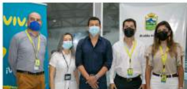
Nueva ruta Neiva- Cartagena empezará a operar en marzo