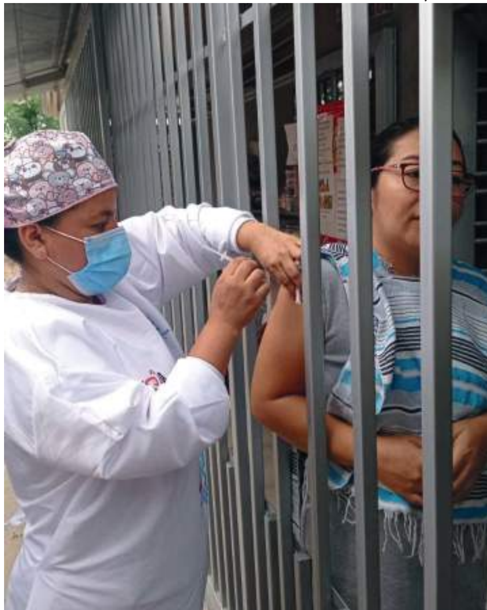
En Neiva se llega con las vacunas hasta la casa de las personas que la necesitan, como estrategia de lograr la inmunización.

De esta manera, el Gobierno ha garantizado disponibilidad continua de biológicos en Colombia, avanzando en la vacunación masiva y la reactivación segura, con coberturas altas en toda la población, especialmente en los grupos de riesgo.