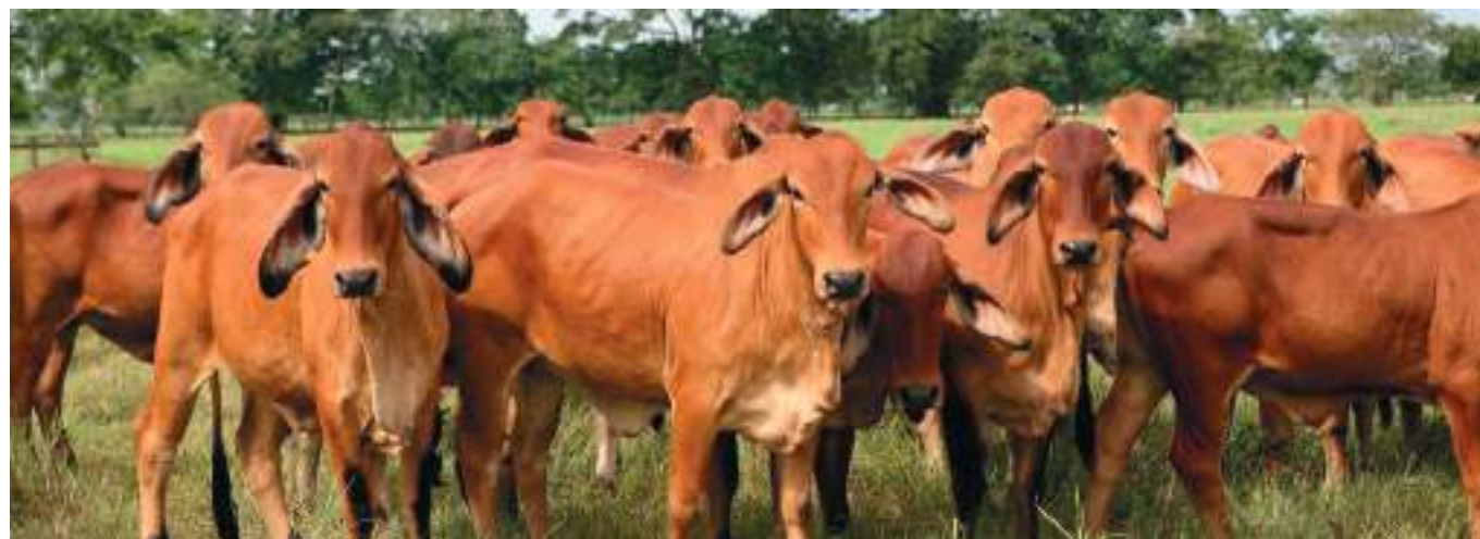
El valor agregado de la agricultura, ganadería, caza, silvicultura y pesca crece 2,4%.

Fabricación de productos metalúrgicos básicos; fabricación de productos elaborados de metal, excepto maquinaria y equipo; fabricación de aparatos y equipo eléctrico; fabricación de productos informáticos, electrónicos y ópticos; fabricación de maquinaria y equipo n.c.p.; fabricación de vehículos automotores, remolques y semirremolques; fabricación de otros tipos de equipo de transporte; instalación, mantenimiento y reparación especializado de maquinaria y equipo crece 0,03% y Fabricación de muebles, colchones y somieres; otras industrias manufactureras crecen 4,6%.