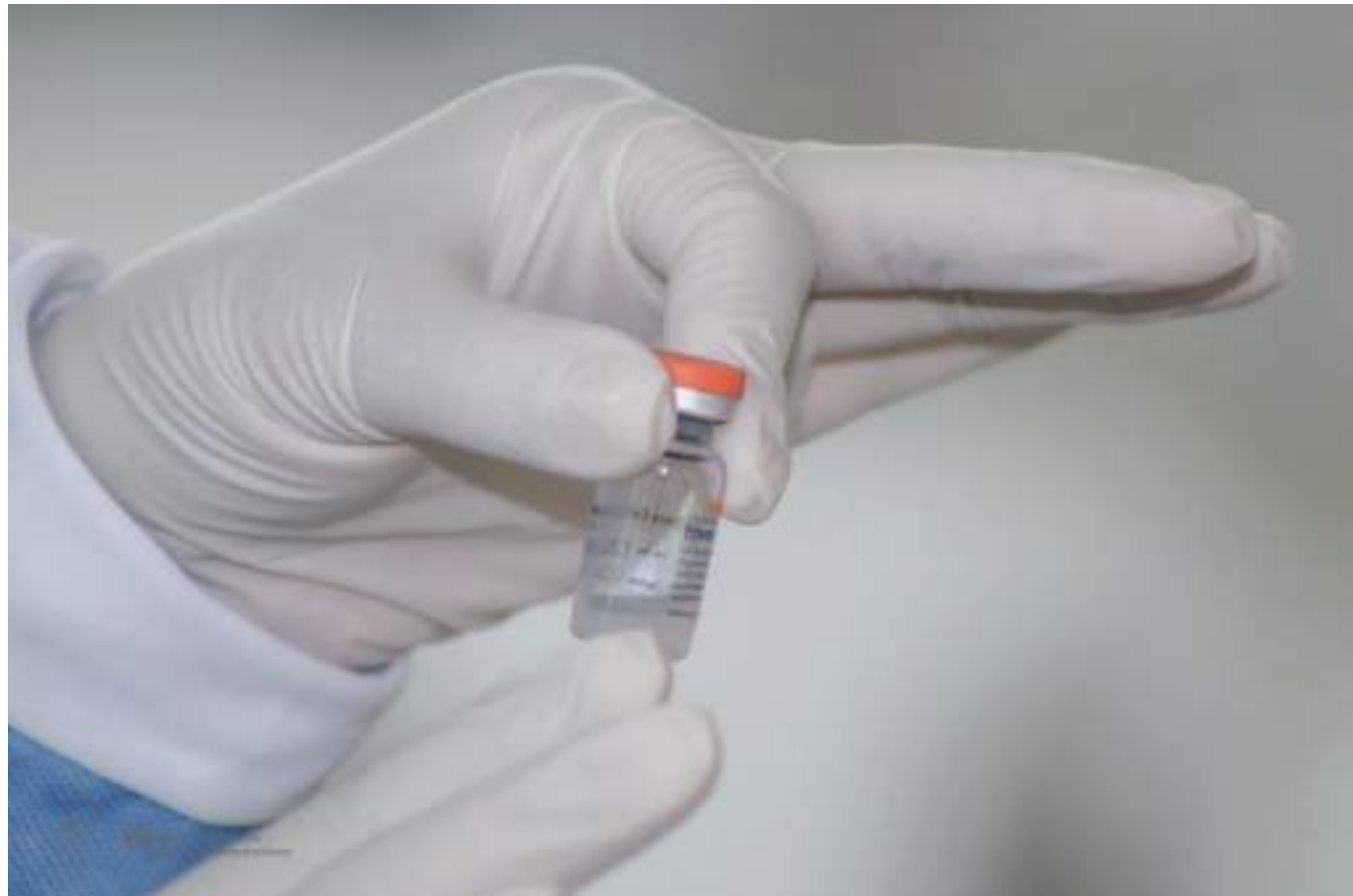
El Huila y Colombia cuenta con disponibilidad de vacunas.

La funcionaria también se refirió a las medidas de bioseguridad que se deben seguir guardando para evitar los contagios. “Tenemos que seguir cuidándonos porque lamentablemente el virus tiene muchas variables, obviamente debemos entender que el proceso de vacunación tendrá que darse en un periodo que establecerá el Ministerio de Salud, que puede ser de entre seis meses y un año para continuar con la periodicidad. Recuerden que los biológicos de las vacunas salen cada año, teniendo en cuenta las variantes de las cepas que se manejan para cada patología”, concluyó Rivas