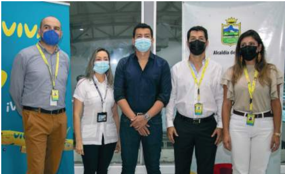
El equipo directivo de la Aerolínea Viva estuvo en Neiva reunido con actores gremiales.

“Queremos movilizar unos 55 mil pasajeros, con lo cual esto es muy bueno para la región, muy bueno para los habitantes de Neiva. El éxito de esta ruta no se logra si no se tiene esa unión entre lo público, lo privado, la Cámara de Comercio, las alcaldías, pymes, el emprendimiento y nosotros como aerolínea, prestar un buen servicio y unas buenas tarifas para que esta ruta sea exitosa, pero si no lo hacemos entre todos, si cada uno de los actores no ponen su granito de arena, es muy difícil sostener estas rutas a largo plazo, pero yo sé que lo vamos a lograr, Viva tiene como filosofía, lo que llamamos el ‘Efecto Viva’, reducir las tarifas en un 35% o 40% de los precios que hasta hoy existen en la región como conectividad, así que es una apuesta que tenemos y sé que nos va a ir muy bien”, concluyó el Director Comercial de la aerolínea Viva.