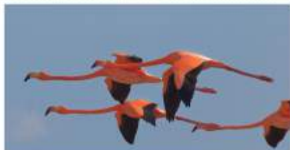
El icónico flamenco rosa de Florida regresa a casa