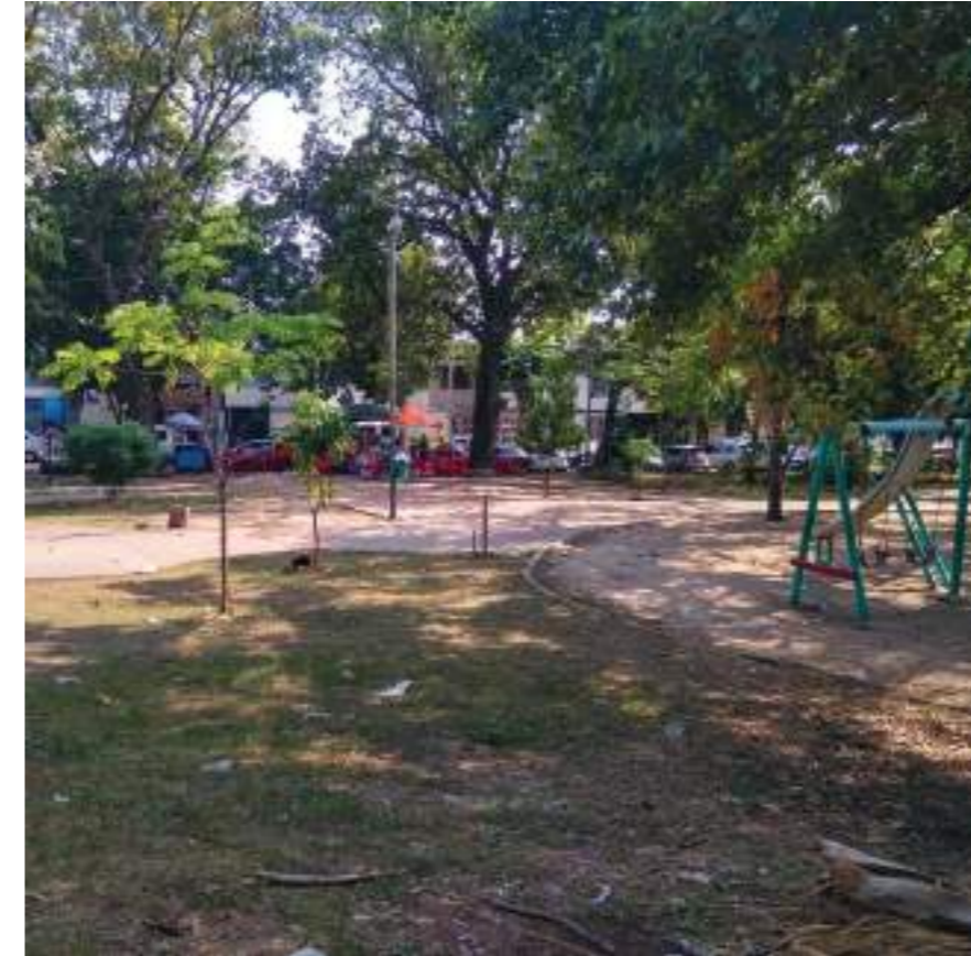
Zonas verdes y senderos en el parque del Amor y la Amistad.