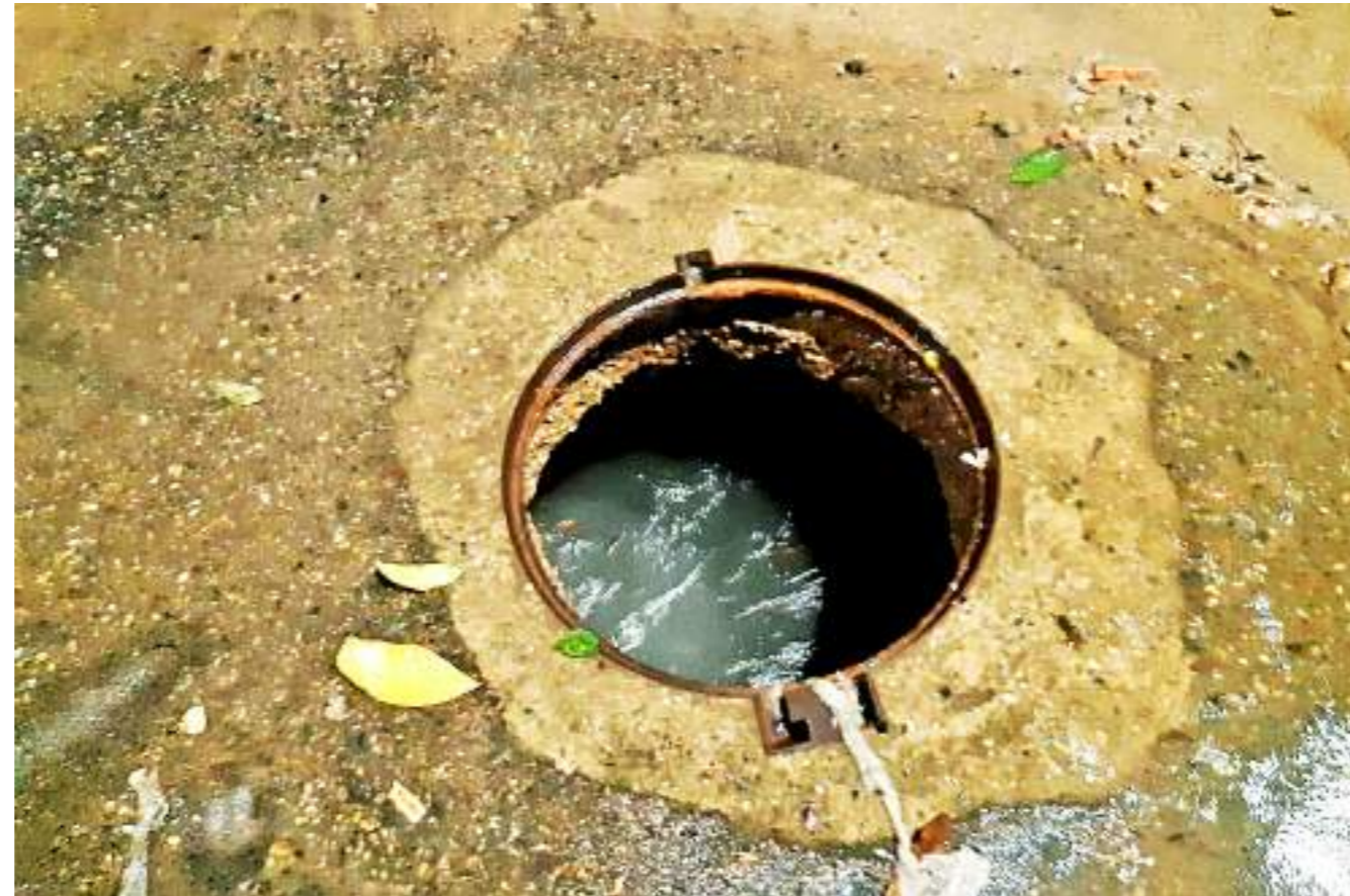
Las alcantarillas se colapsan y generan inundaciones en las casas y calles.