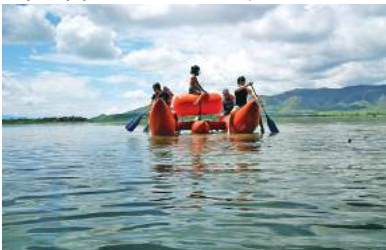
Así se ve uno de los turistas en el prototipo.

Hay muchos interesados en el proyecto, pero como le dije por ahora no se vende, solo espero crecer un poco más y disfrutar de este invento que sirva para mejorar el turismo de aventura. Cuando se comience la venta y concesión, la idea es que haya unos cien en el país, concluye.