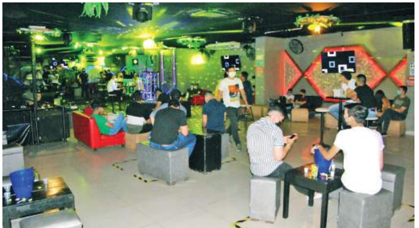
La Asociación de bares y gastrobares han señalado su inconformidad por los horarios de los desfiles, que según ellos nos favorece en las ventas.

El descontento con el horario establecido de los desfiles se da