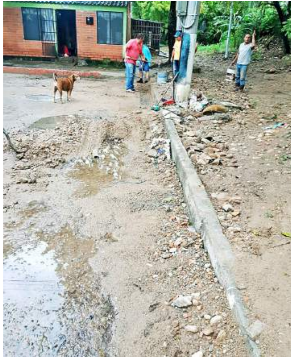
La vía principal se ha visto deteriorada como consecuencia de las crecientes.