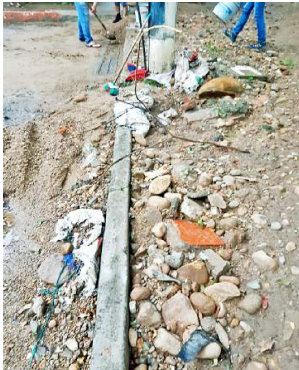
Ya no quedan vestigios del pavimento por esta vía.