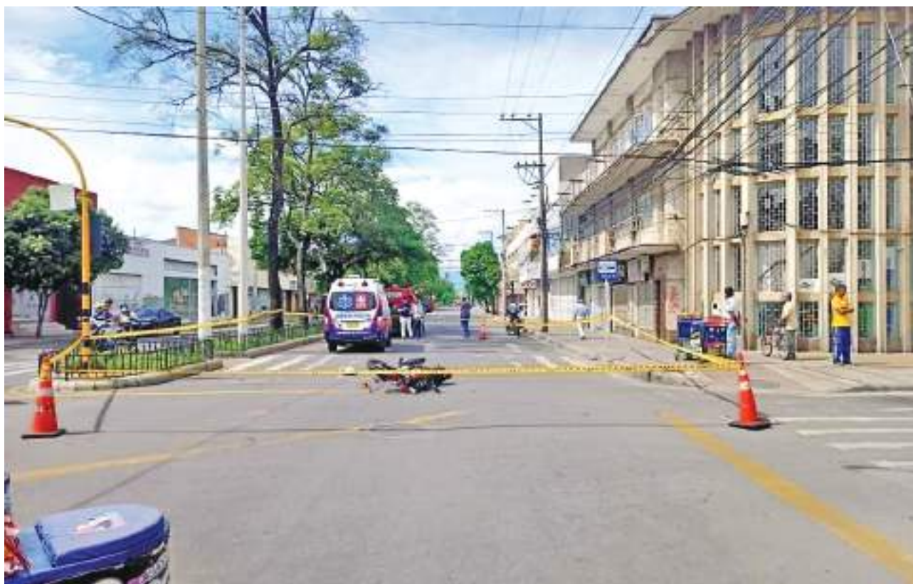
El trágico accidente de tránsito dejó un hombre muerto y una mujer herida. El choque se registró en la mañana de ayer domingo sobre la carrera Séptima de la ciudad de Neiva.

Pese a que víctima fue llevada a un centro asistencial, lamentablemente falleció. Al parecer el vehículo de emergencias sería de la empresa Care 7/24, de la clínica de Clínica de Fracturas y Ortopedia, dueños a su vez de la polémica empresa de ambulancias Saludlaser, que ya ha cobrado la vida de varios ciudadanos en circunstancias similares.