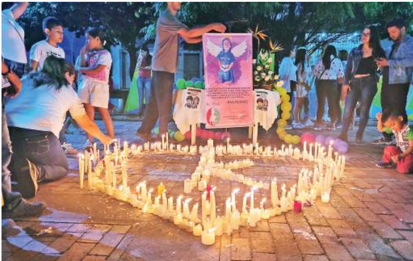
La comunidad pide justicia en este hecho y pidió seguridad y acompañamiento en la zona por parte de la Policía Nacional.

“Nosotros no sabemos si eran pareja o no, no habíamos escuchado eso hasta ahora que pasó lo de la niña porque inclusive ese muchacho había sido el marido de la hermana menor de ella. Esos rumores están, pero no sabemos qué pasó ahí”