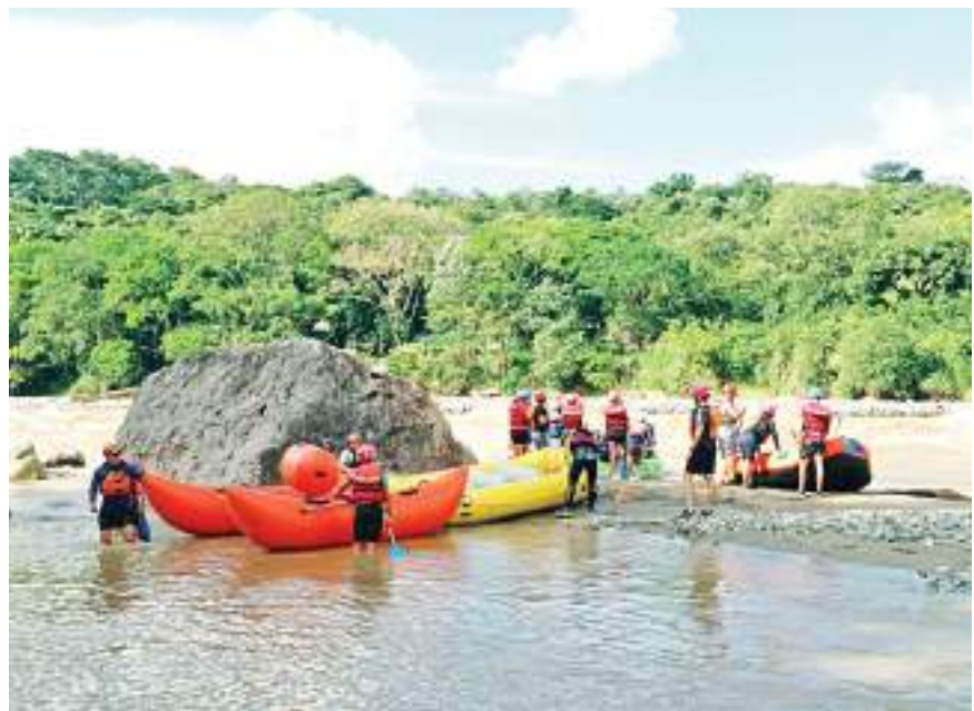
Unas 50 personas participaron en las pruebas para obtener la patente.