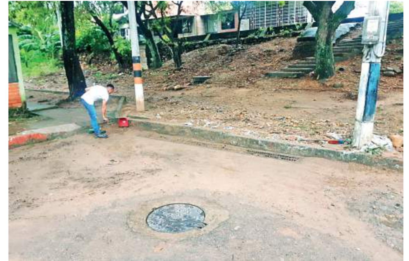
Los vecinos están pendientes de mantener en buen estado el entorno.

En Altos del Limonar, lo que para muchos era una solución de vivienda, se convirtió en un problema. Ojalá en el corto plazo haya noticias que cambien el panorama y la situación de los quejosos.