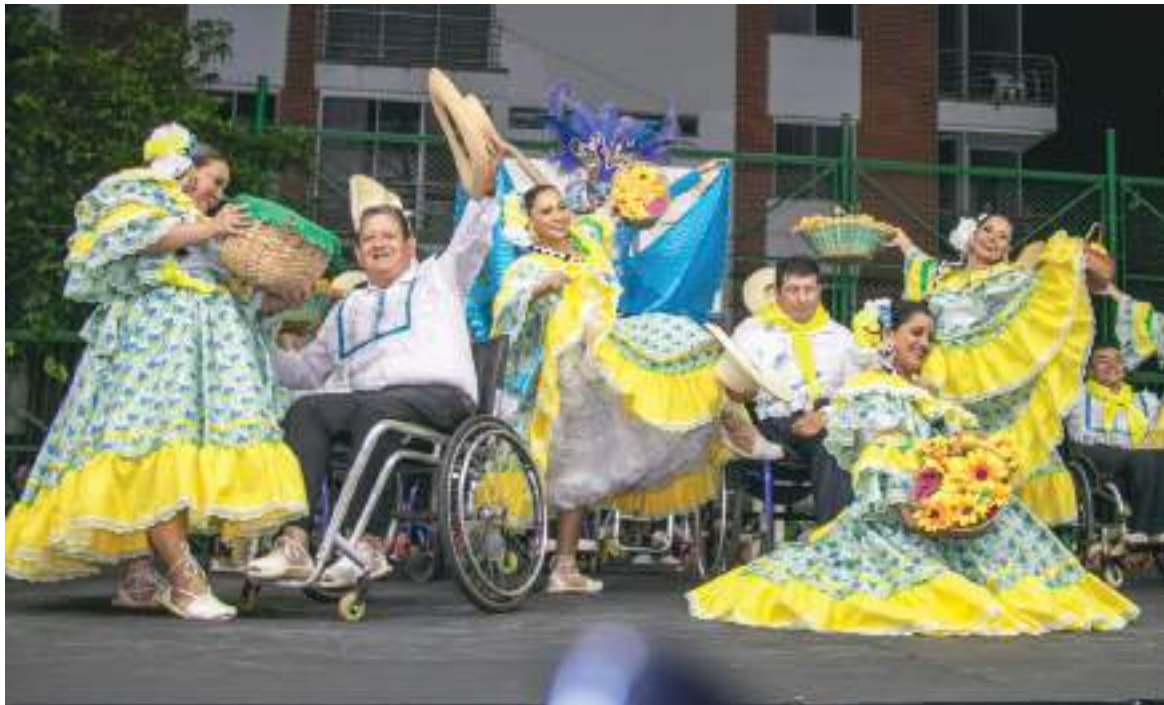
La reactivación presencial de las festividades permitió que los huilenses vuelvan a sentir la magia del San Pedro y San Juan.

■ Con la Ronda 9 de San Antonio, Vegalarga y Río Las Ceibas, finalizaron las rondas sampedrinas de Neiva, que permitieron escoger el ramillete de 22 candidatas que se disputarán la corona del 'Reinado Popular'.