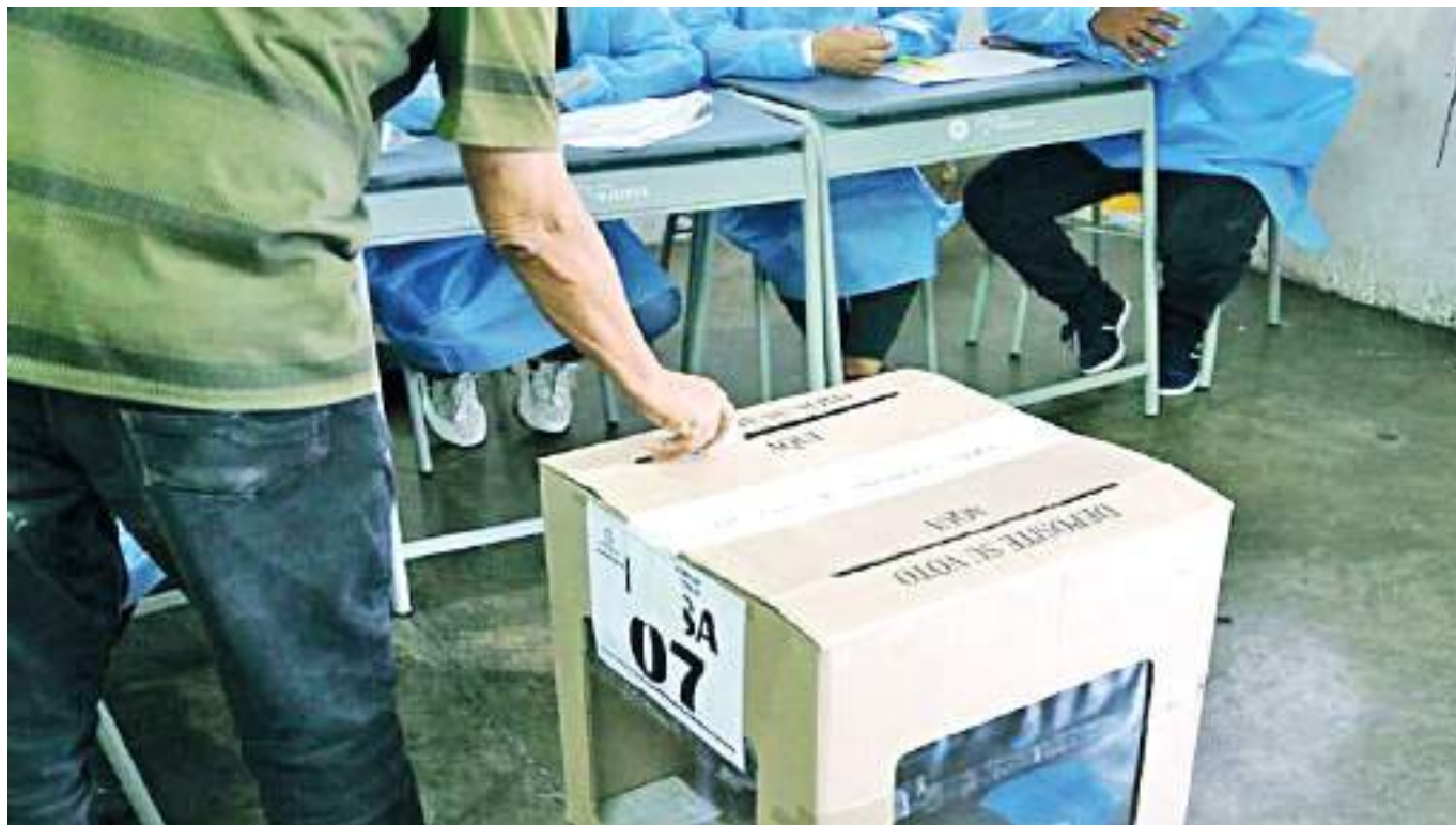
Actualmente, el departamento tiene un potencial de 882.955 votantes y las mesas que se van a instalar son 2.307.

En consecuencia, extendió un mensaje de tranquilidad a la ciudadanía, insistiendo en que, “La Registraduría ha tomado muchas medidas ante este nuevo proceso electoral, es más, el pasado sábado estuvimos haciendo un simulacro de preconteo, esto con el fin de evaluar las comunicaciones, la funcionalidad del software y en este simulacro se contó con el acompañamiento necesario para ayudar a que el proceso sea realmente blindado. Decirle a la ciudadanía que desde ya deben ir