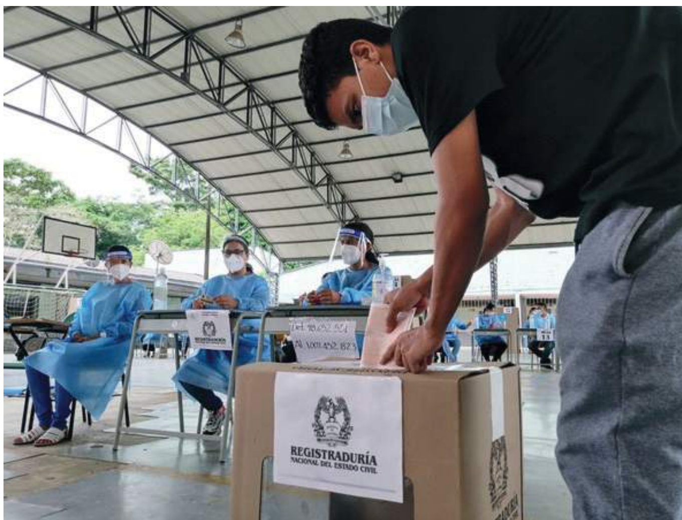
En total se instalarán 233 puestos de votación, de los cuales 125 en zonas rurales y 108 en cascos urbanos.

Además, invitó a la comunidad a adoptar un buen comportamiento en la jornada y acatar las normas impuestas por los mandatarios locales, como, la ley seca, prohibición de armas de fuego y vehículos con escombros. “Todo esto nos va a ayudar a mantener y generar las condiciones necesarias de seguridad para que los habitantes de todo el departamento se trasladen libremente el domingo de elecciones. Es así como tenemos la próxima semana el seguimiento de comité electoral para determinar y garantizar el normal desarrollo de esta jornada.”, puntualizó el Coronel.