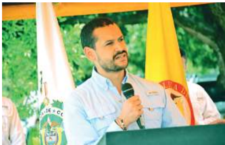
Daniel Palacios Martínez, ministro del Interior, anunció una gran inversión en materia de seguridad ciudadana para el Huila.

La inversión fue por $629 millones de pesos, y las motocicletas estarán a disposición de la Policía Metropolitana de Neiva para fortalecer la seguridad y atención oportuna. Así mismo se anunció la entrega para el próximo mes de julio de 680 camisetas balísticas