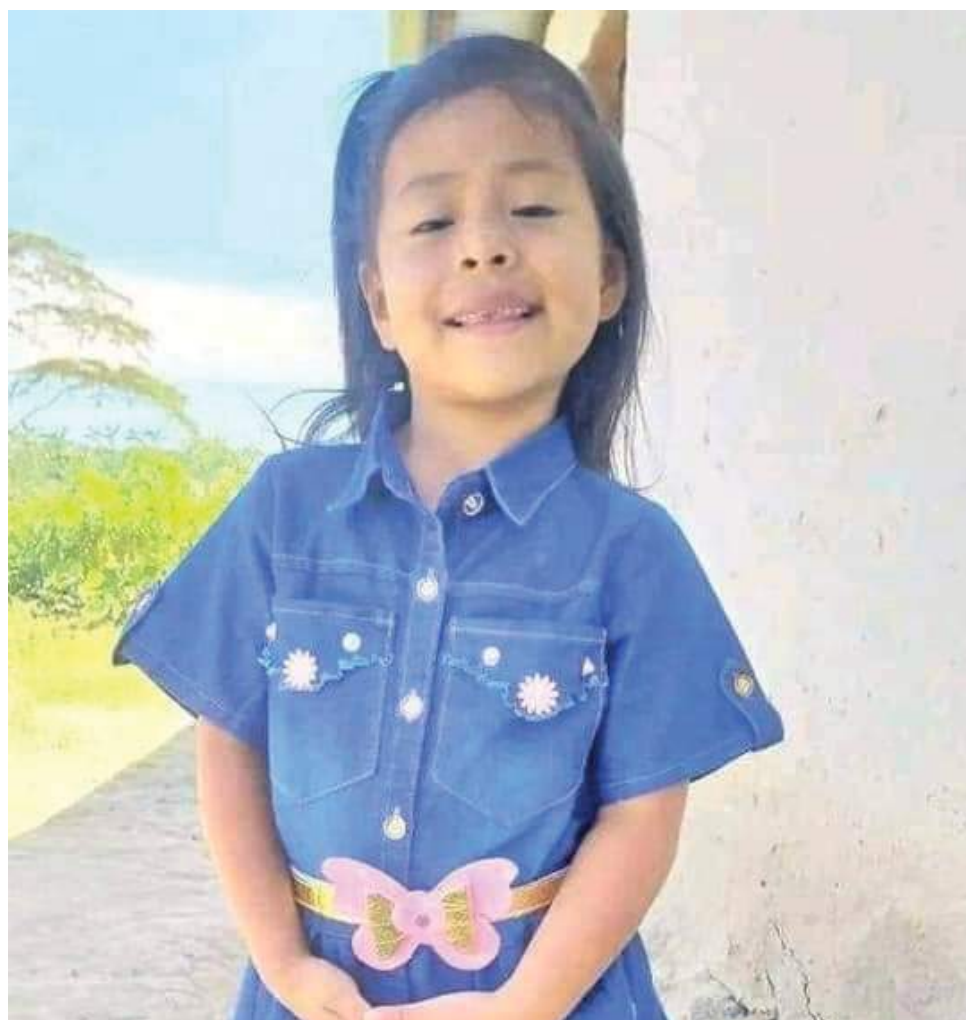
La menor de 5 años de edad fue vilmente asesinada. El presunto responsable ya estaría en manos de las autoridades.

Según lo que se conoció por fuentes extraoficiales, el dictamen de Medicina Legal estableció que la menor no fue abusada sexualmente y que habría muerto por asfixia. Según la tía de la menor, ésta fue encontrada “amordazada, con un trapo en la boca, le habían atado los pies con una cabuya hasta la altura de la cintura”.