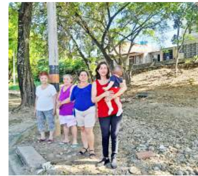
Son familias que luchan por lo que les ha costado sacrificio y trabajo.

Este es solo uno de tantos casos que se presentan en Neiva y en todo el país en donde, muchos por solucionar su necesidad de tener vivienda propia, compran y no observan en detalle en dónde o a dónde se están metiendo y las posibles afectaciones a las que se pueden enfrentar con el paso del tiempo.