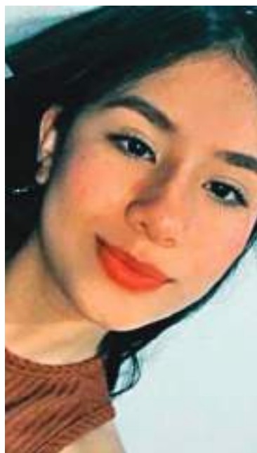
La niña de 13 años, habría tomado la lamentable decisión de atentar contra su propia vida.