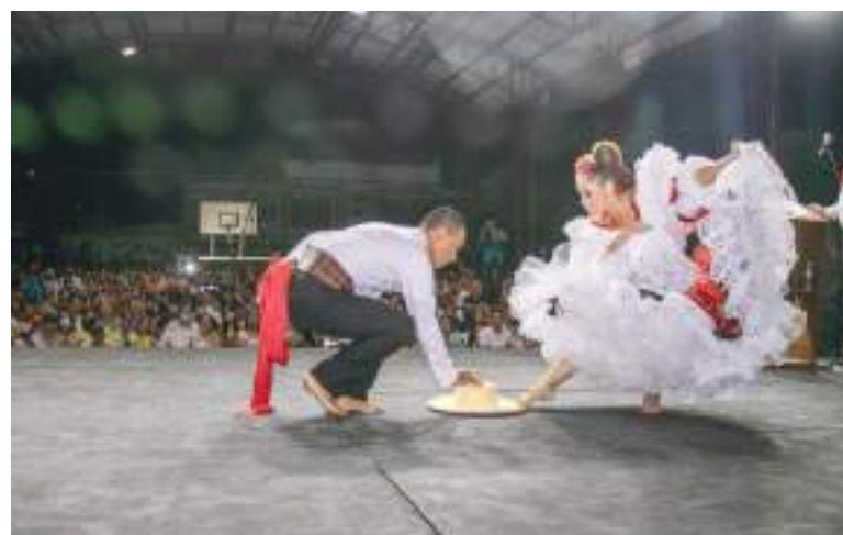
De esta manera, también se da inicio oficial al 'Festival del Bambuco en San Juan y San Pedro 2022'.

Durante el desarrollo de las rondas los fines de semana, las comunidades se congregaron en los barrios y corregimientos indicados para ovacionar a las candidatas que los representaron. Asimismo, tuvie-