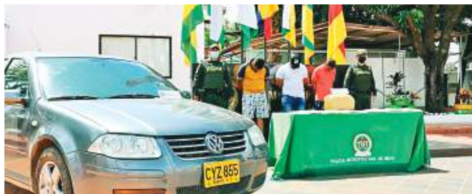
Los delincuentes se movilizaban por un sector del barrio Las Palmas, cuando fueron interceptados por la Policía.