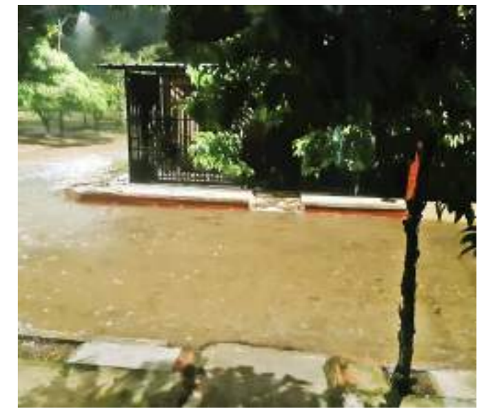
Estado de las calles en momentos de intensas lluvias.