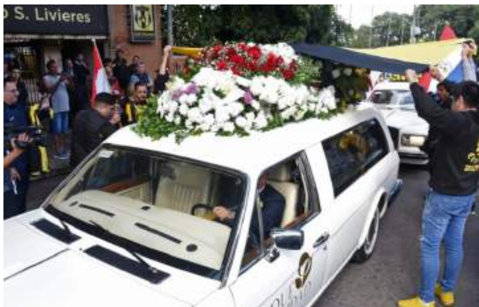
El último adiós al fiscal Marcelo Pecci

Pecci, que esperaba un hijo, se caracterizó por investigar con firmeza casos del crimen organizado y era considerado como la mano derecha de la fiscal general Sandra Quiñonez.