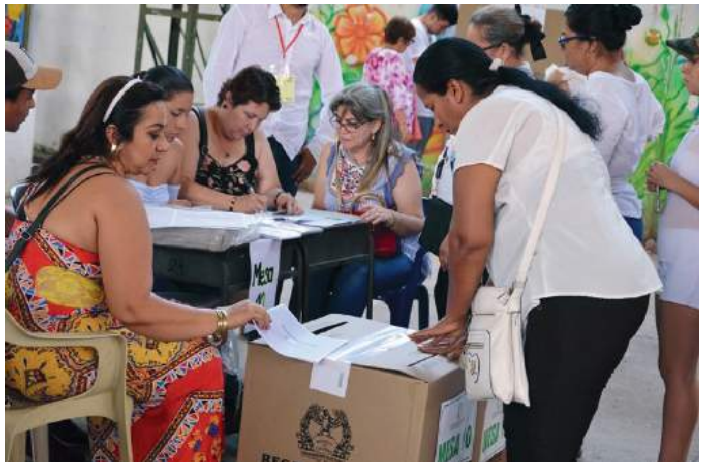
Se está exactamente a 23 días de vivir un momento coyuntural para el país, pues el 29 de mayo del 2022 se llevarán a cabo las elecciones presidenciales.

“Justo se les dio prioridad a los funcionarios públicos para ser seleccionados jurados de votación, de la misma forma, jurados que postularon las diferentes campañas políticas, después la empresa privada y finalmente, también hay algunos alumnos de universidades. En esta oportunidad las capacitaciones tendrán ciertas variaciones, serán más didácticas,