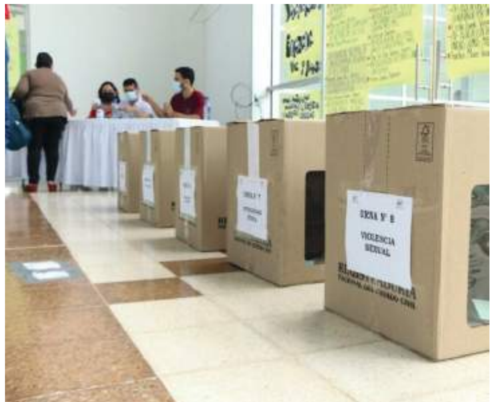
Ya hay nueva base de jurados de votación que se sortearon en cada una de las registradurías municipales.

Explicó también que los jurados de votación tienen una responsabilidad muy importante en la jornada electoral y de incumplirla recibirán sanciones severas. “Inicialmente tienen que estar desde la 7:00 A.M., en los puestos de votación, ellos son los encargados de recibir el kit electoral, todos los elementos que van a tener en disposición para poder cumplir con el ejercicio de votación, además, son los que van a atender a todos los sufragantes, exigirles las cédulas de ciudadanía, entregar la tarjeta electoral para que ejerzan ese derecho y