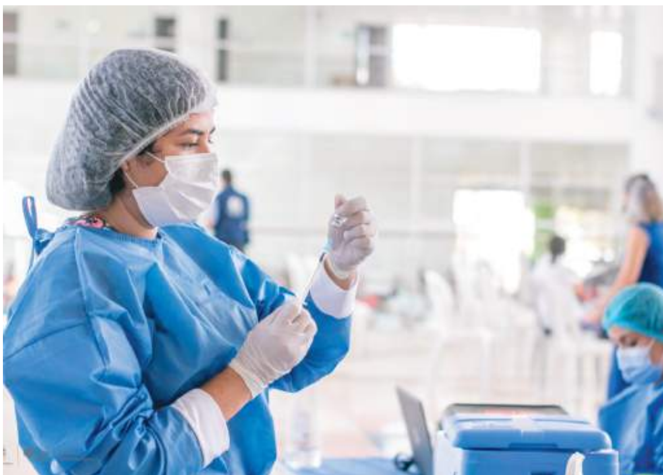
En Neiva el programa de vacunación ha avanzado exitosamente, pero no se puede bajar la guardia.

En América se estima que las ECNT son responsables de cuatro de cada cinco muertes anuales, el 35% de las cuales se consideran prematuras (en personas de 30