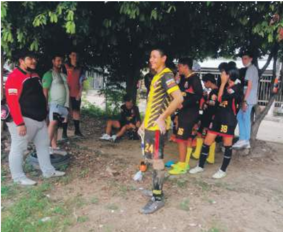
Los juegos de diferentes torneos son una alternativa nocturna ahora.

Son 120 deportistas que entrenan en diferentes jornadas, de lunes a viernes de 6 a 8 y 30 de la noche. Los fines de semana se juegan partidos de los diferentes torneos.