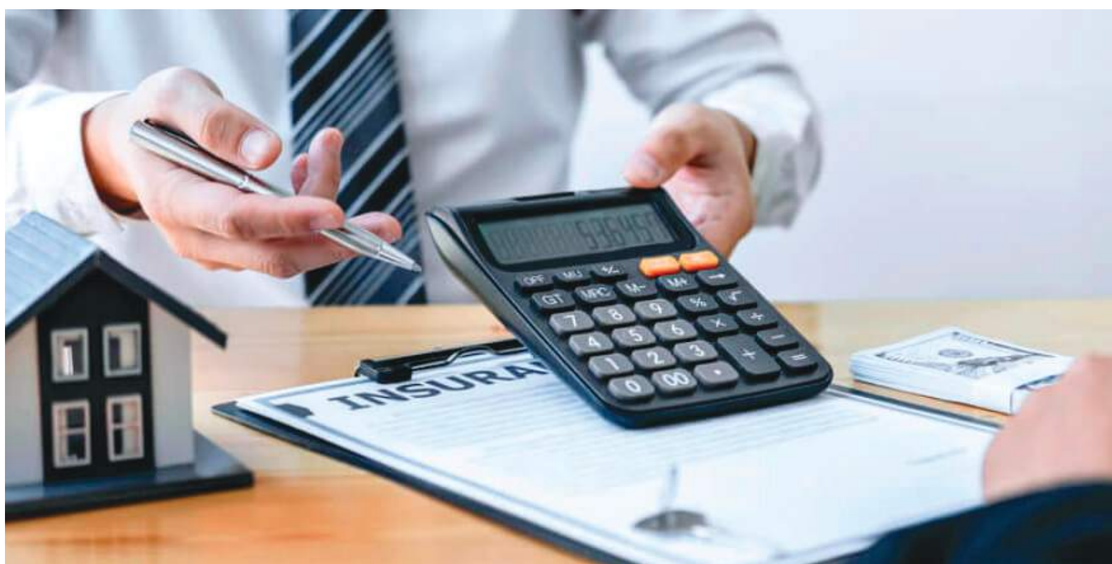
Como todos los inicios de año, el aumento en productos y servicios empieza a ser una constante en cada hogar colombiano.

incrementar el canon de arrendamiento, deberá informarle al arrendatario el monto del incremento y la fecha en que se hará efectivo, a través del servicio pos-