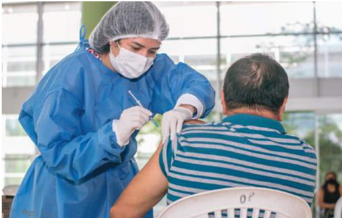
El Ministerio de Salud busca que a 31 de enero, el 80% de la población en Colombia tenga al menos una dosis, el 63% de segundas dosis, y se cuente con 5,8 de dosis de refuerzo.

Mientras tanto en el departamento del Huila continúan avanzando los contagios de manera acelerada. Entre viernes y sábado se confirmaron 7 personas fallecidas por causa del virus Sarscov2; y 23 municipios acumulan conta-