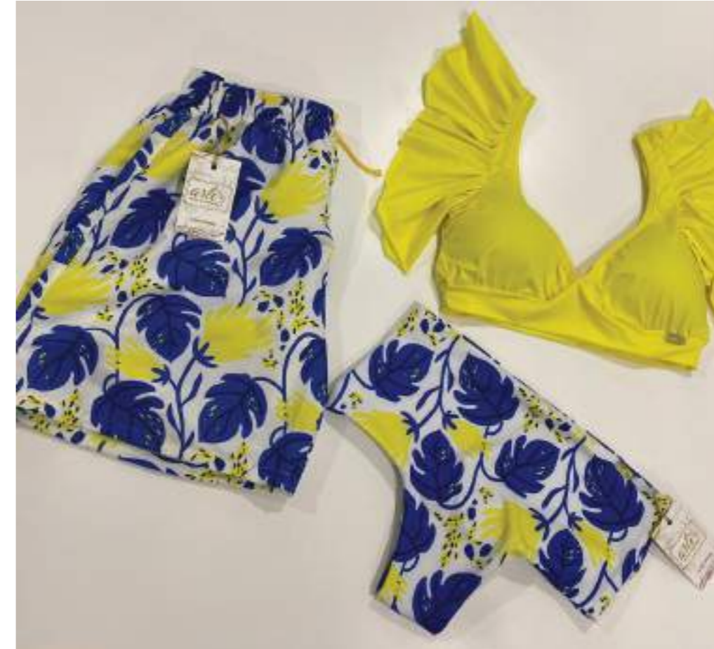
La gran variedad de diseños y colores son una característica de la empresa.