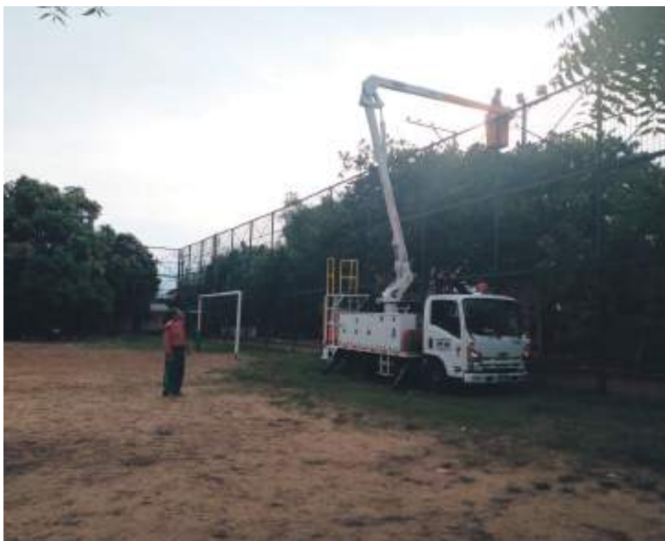
La empresa de alumbrado público entregó la iluminación artificial de la cancha del Limonar parte alta.

Se proponen realizar reunión con la empresa transportado-