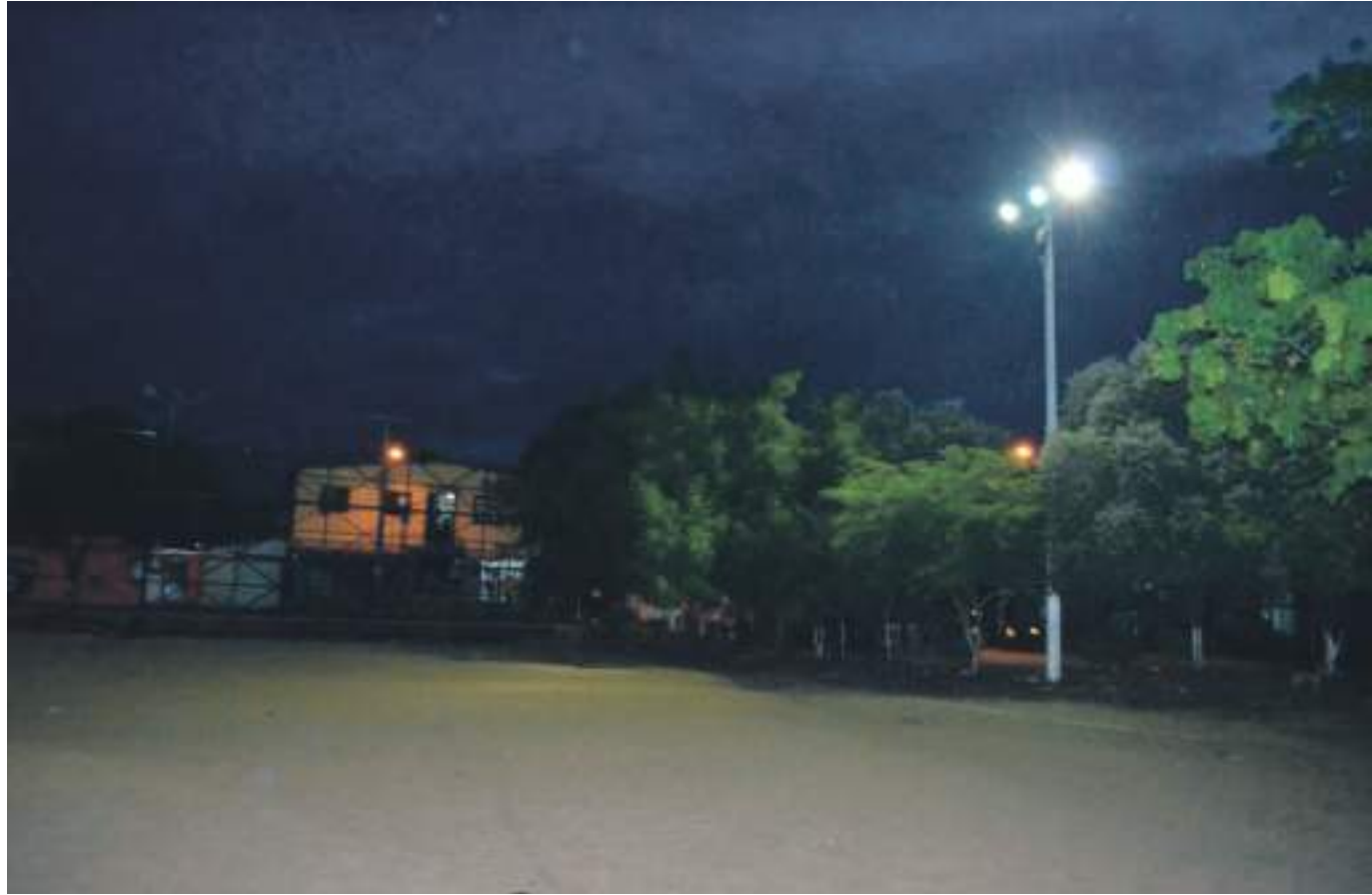
Aspecto de parte de la iluminación artificial en el Limonar.

Los trabajos los recibieron en compañía de quienes a diario asisten a practicar o entrenar en la cancha para estar listos de cara a los campeonatos que organice la liga o la secretaria de deportes de la ciudad. En esta oportunidad tanto los jóvenes como los responsables de la pre-