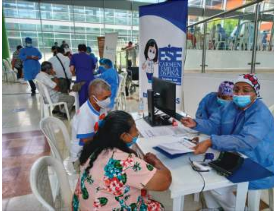
En el Huila, se han aplicado un total de 1.435.389 dosis en todo el departamento, significando un cumplimiento del 96,7%.

“Adelantamos esta estrategia dentro del plan integral por la seguridad ciudadana, donde nos desplazamos a las calles, nos volcamos al microcentro de la ciudad de Pitalito para generar visitas a los diferentes sectores económicos, donde es importante continuar el cumplimiento de protocolos de bioseguridad, y además dar