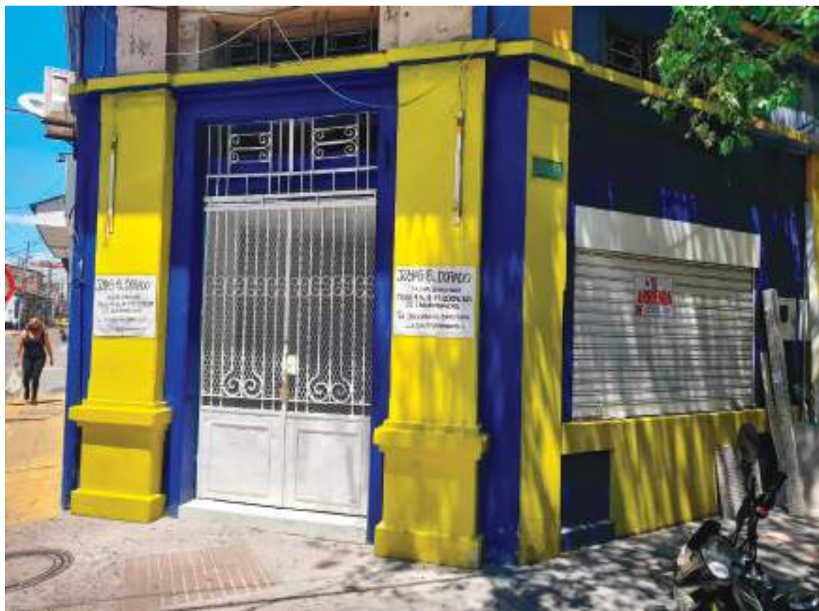
Si usted paga una renta mensual de un millón de pesos, el porcentaje de aumento equivalente a este canon de renta es de $56.200.