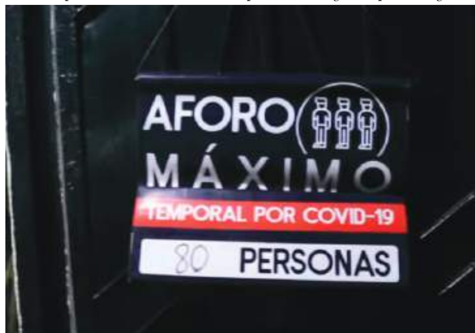
En municipios como Pitalito, se adelantan estrategias de control a los protocolos de bioseguridad en los sectores de la economía, a la par con el avance en lograr el cumplimiento en el plan de vacunación.

De acuerdo con el reporte de Secretaría de Salud del Huila, con corte de 14 de enero de 2021, de 1.484.710 del total de dosis asignadas en los 37 municipios, se han aplicado un total de 1.435.389 dosis en todo el departamento, significando un cumplimiento del 96,7%.