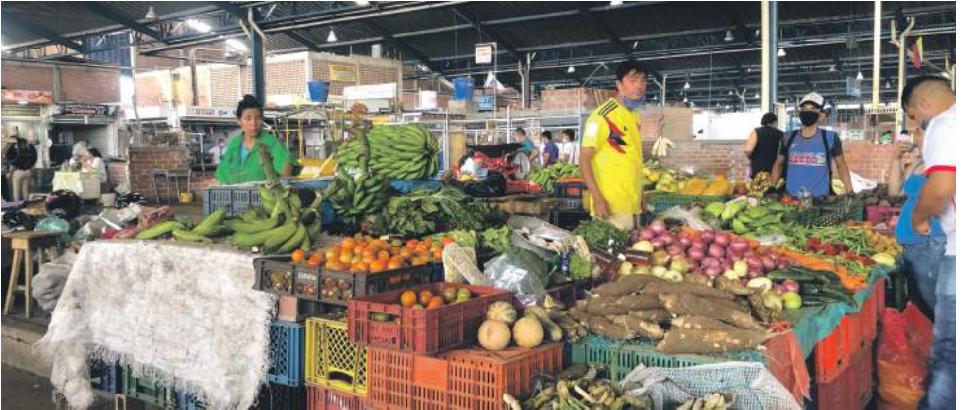
Esta problemática está afectando con más intensidad a las familias de escasos recursos.