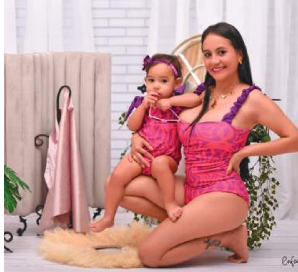
Los productos de Arli están pensados para todas las personas de la familia.