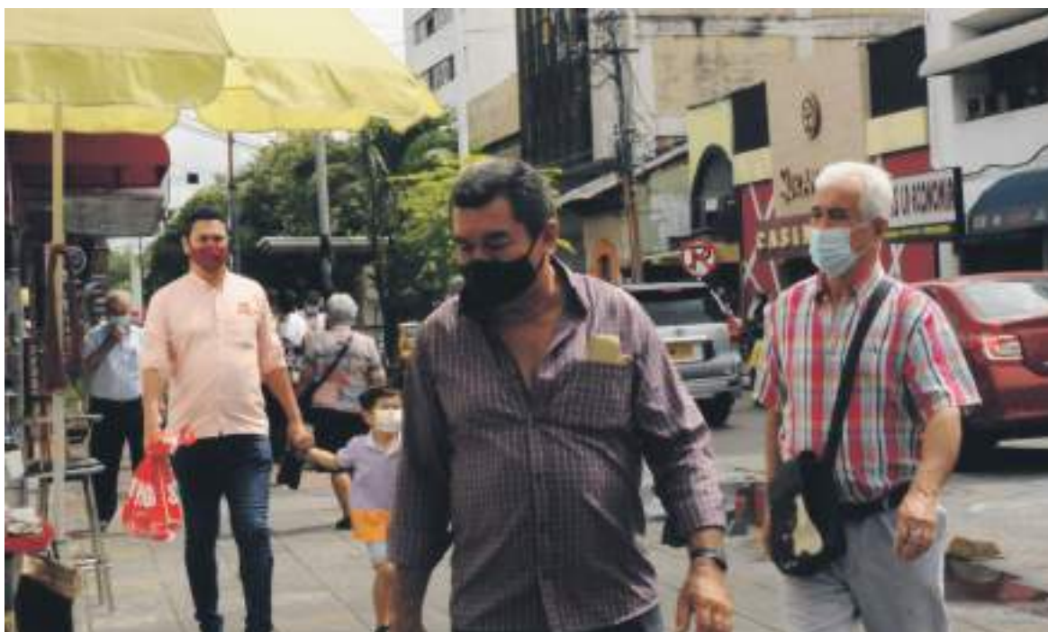
De acuerdo con el reporte 1.113 casos se registran activos, de los cuales 1.034 se encuentran en atención ambulatoria en casa con recomendación de aislamiento.

De igual manera, durante el último día se aplicaron un total de 307.314, de las cuales 112.631 corresponden a la segunda inyección mientras que otras 17.606 fueron monodosis.