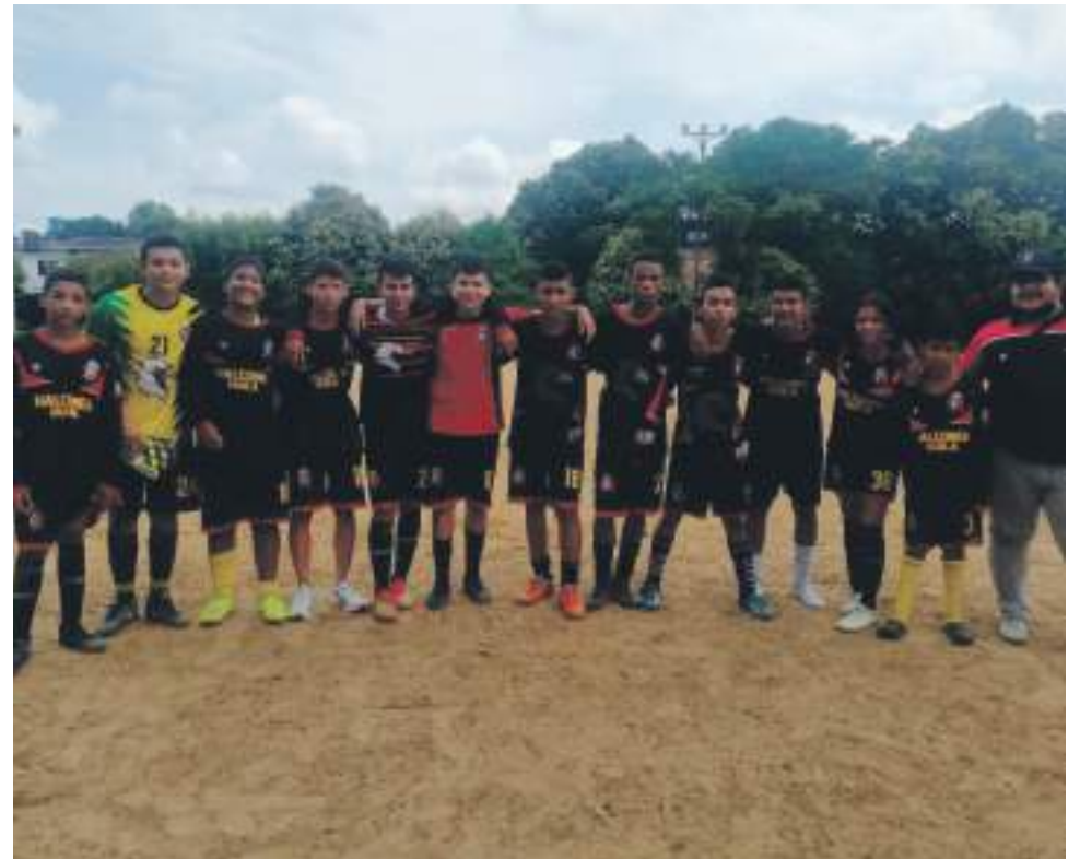
El deporte es sinónimo de integración