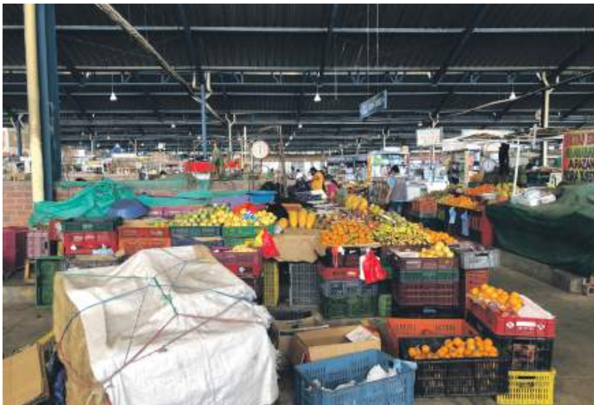
Los productos que más subieron su precio fueron tomate (10,17%), papas (9,88%) y yuca para consumo en el hogar (4,03%).

En casos particulares dio ejemplos de Cali y Bogotá, ciudades en las que anteriormente un ‘corrientazo’ estaba en $7.000 y $9.000 pesos, respectivamente, y ya se encuentran casos de menús a $9.000 y $11.000 pesos en cada caso, respectivamente.