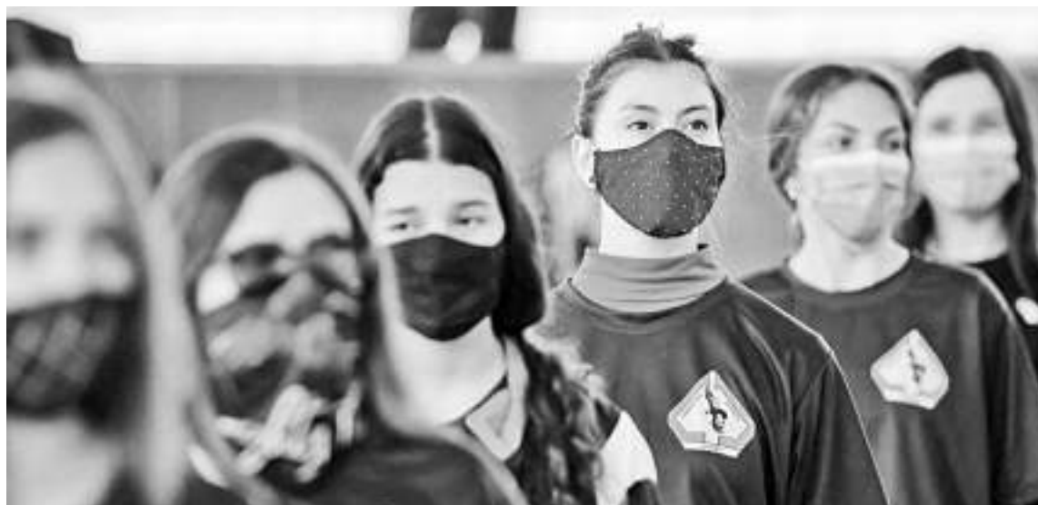
Los Campamentos forman a sus jóvenes participantes como personas integrales para asumir retos y responsabilidades.

El programa de Campamentos Juveniles tiene como objetivo garantizar el derecho a la recreación en la adolescencia y juventud y fortalece procesos de formación experiencial a través de sus 5 ejes temáticos: (1) crecimiento personal, voluntariado y liderazgo, (2) técnicas campamentales, (3) recreación y cultura, (4) prevención y salud y (5) consciencia