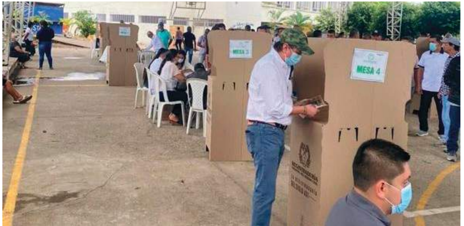
Todo está listo para la segunda vuelta presidencial en Neiva y el Huila.

En compañía del viceministro para la Estrategia y Planeación del Ministerio de Defensa, Jai-