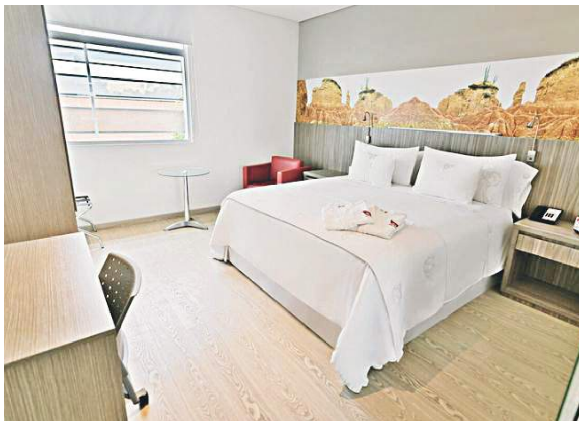
El Huila cuenta con cerca de 650 establecimientos hoteleros que se representan en unas 7.500 habitaciones y 12.000 camas.