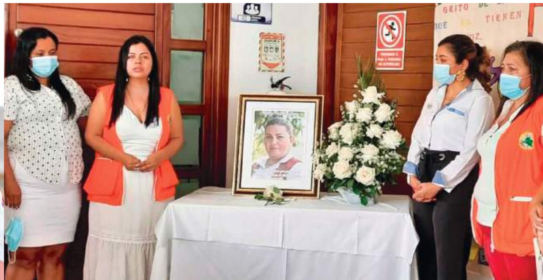
Las balas terminaron apagando en su corazón el anhelo de "ser la voz de los que no tienen voz" en los departamentos de Huila y Caquetá.