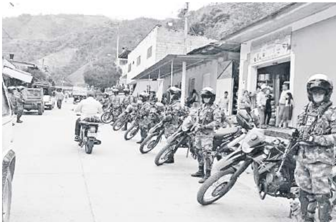
Serán casi 1.800 policías que integrarán el dispositivo de seguridad para hoy.

A la par la Fuerza Pública, mantendrá puestos de control permanentes, toma de antecedentes, patrullajes aéreos y terrestres tanto diurnos como nocturnos, presencia de personal encubierto en zonas estratégicas del departamento y una comu-