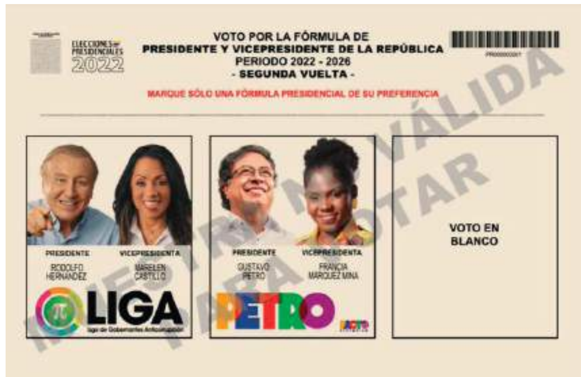
Este es el tarjetón para la segunda vuelta que les será entregado a los votantes.