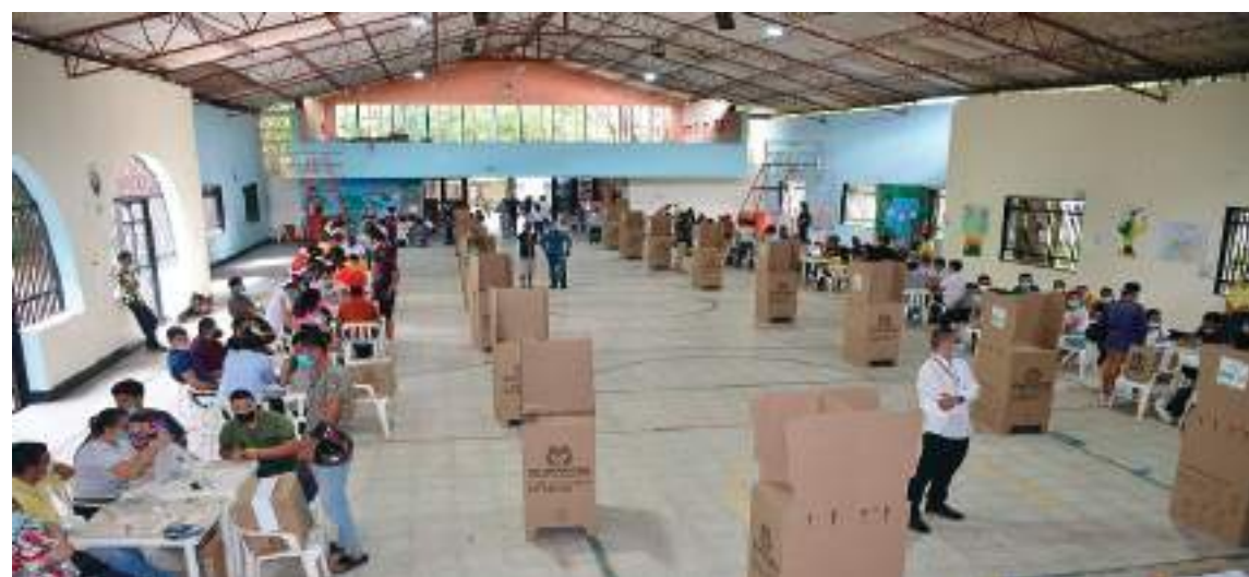
Están habilitados en el Huila, 233 puestos de votación.