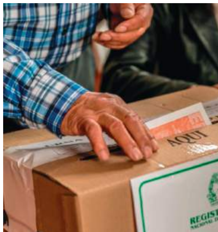
Los ciudadanos podrán acudir a las urnas desde las 8:00 de la mañana de este domingo.

cia Nacional haciendo un trabajo conjunto con la fuerza aérea.