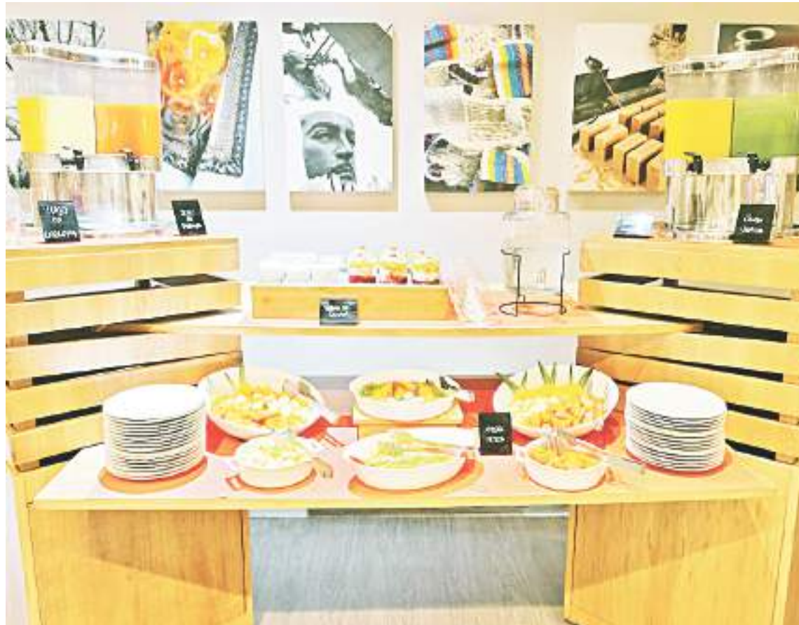
Los establecimientos se encuentran 100% listo para arrancar una jornada prometedora.

- Tratar de desplazarse por zonas que estén salvaguardadas por las autoridades competentes para evitar un incidente que pueda manchar la visita a la región.