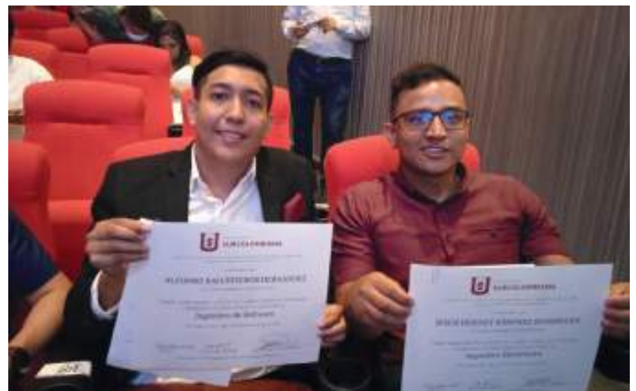
Felicitaciones y éxitos en esta nueva etapa de logros.