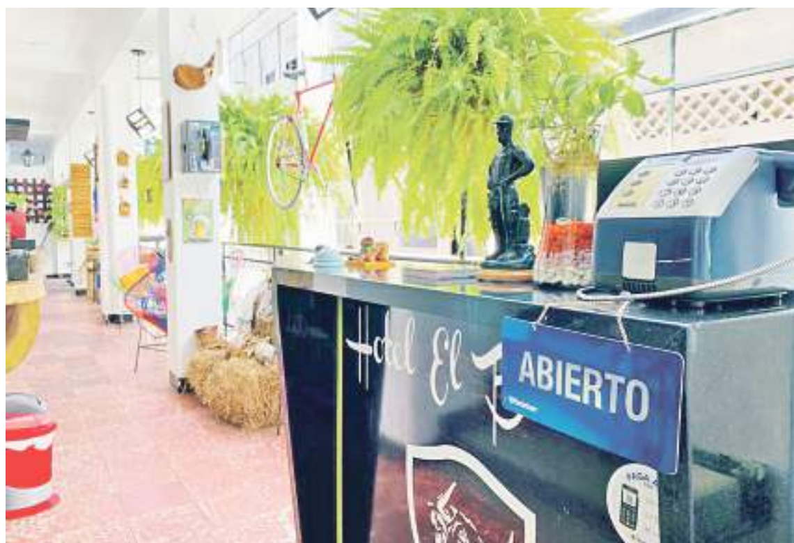
El sector hotelero invitó a propios y turistas a disfrutar las maravillas de la región huilense.

Finalmente, invita a propios y turistas a disfrutar las maravillas de la región más allá de las festividades de San Pedro y San Juan, pues la idea es aprovechar otra serie de espacios que les generen una experiencia que los motive a volver en algún momento.