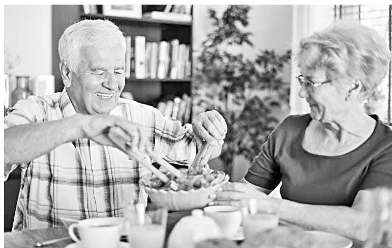
La alimentación saludable y bien equilibrada puede ayudar a las personas que padecen de incontinencia. Se recomienda evitar alimentos como productos lácteos, alimentos grasosos, comidas picantes, bebidas alcohólicas o con cafeína para mejorar su condición.

La neuromodulación es uno de los tratamientos que pueden ayudar a combatir la incontinencia.