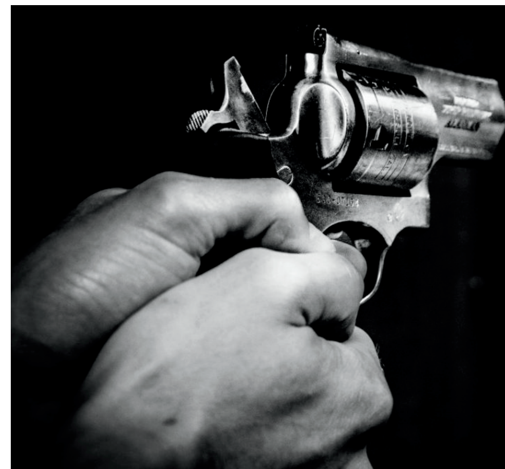
Ocho balas alcanzaron su humanidad, cuando se encontraba sentada en el antejardín de su vivienda en Neiva.