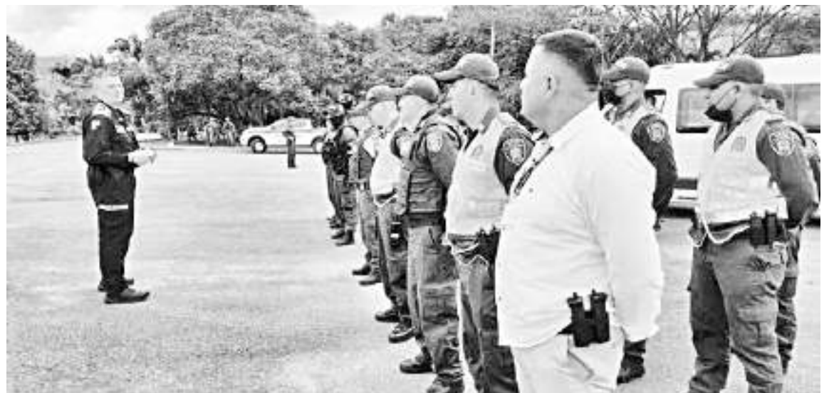
Ejército hará presencia en la zona rural y vías que conectan al departamento con Cauca, Tolima y Caquetá.

En riesgo alto, los municipios donde se tienen indicios de una alta probabilidad de ocurrencia de hechos de violencia cometidos por grupos armados ilegales, en el marco del proceso electoral, así como aquellos donde se registra la consumación de dichas amenazas.