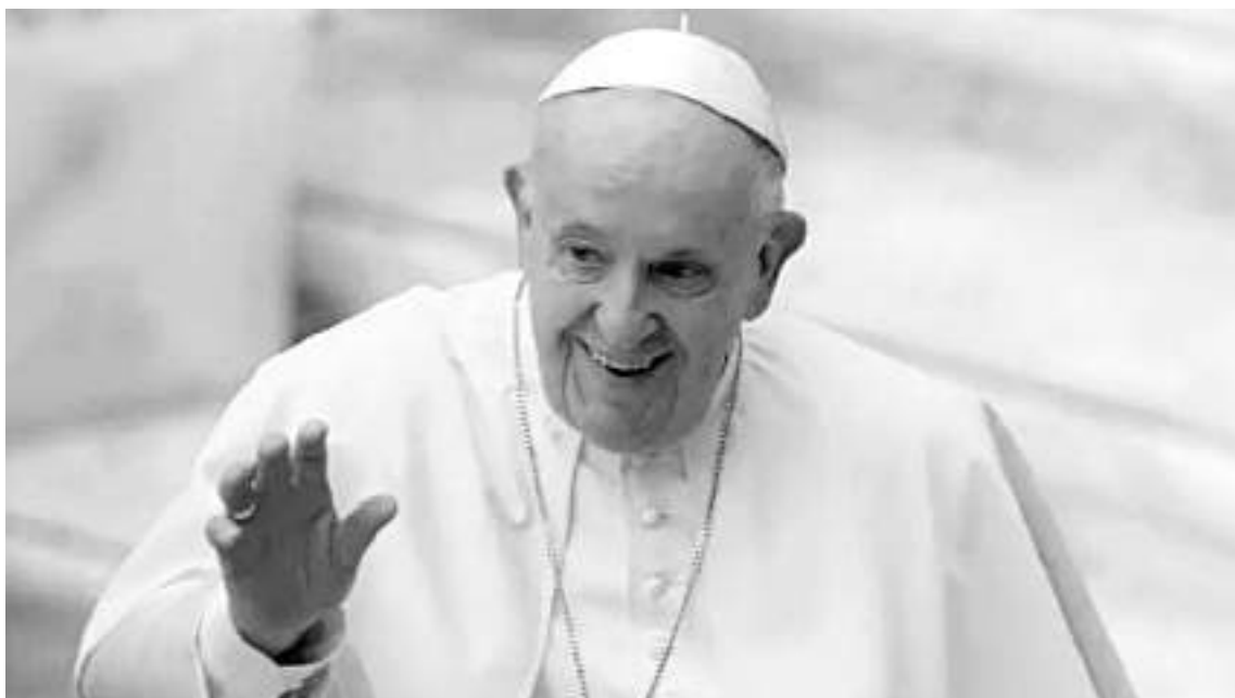
Papa Francisco en el Vaticano.

El Papa Francisco dijo además que “el Dhammapada (NDR: escrito sagrado budista) resume así las enseñanzas de Buda ‘evitar el mal, cultivar el bien y purificar la