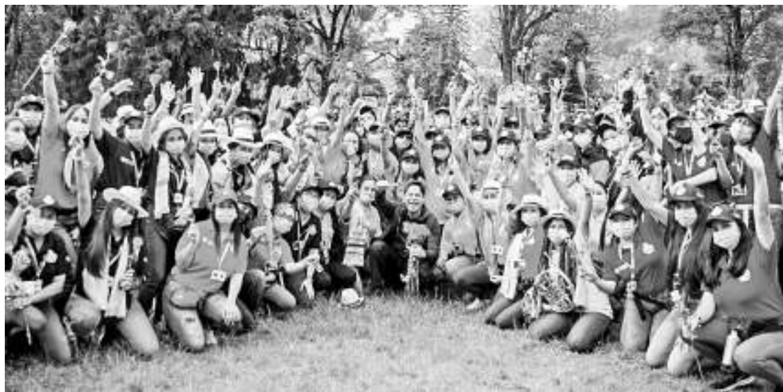
Los Jóvenes se integran para aprender a ser líderes de la sociedad y cuidadores de la naturaleza y la herencia ancestral.

pamento Juvenil se hará en el municipio de Isnos, una región en donde existen unos parques arqueológicos que permitirán que los jóvenes, conozcan la importancia de nuestros ancestros, sus prácticas y el desarrollo de Colombia desde el Huila”, agregó.