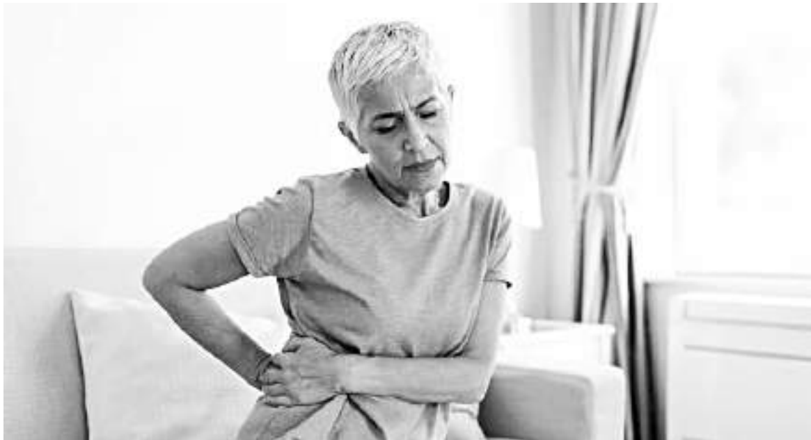
La incontinencia es una afección que tanto hombres como mujeres soportan en silencio.

La persistencia de este tabú provoca que empeore una situación que tiene tratamiento, sobre todo cuando se trata a tiempo. Por ello, en marco de la Semana Mundial de la Incontinencia, Medtronic se une a la iniciativa mundial que busca posicionar en la agenda pública varios puntos importantes como lo son el romper los tabúes y la vergüenza al momento de hablar de incontinencia y animar a pacientes y cuidadores a buscar ayuda para sus síntomas de manera activa y oportuna. Existen comunidades de pacientes como Retoma el control ( www.retomaelcontrol.com ), que brindan visibilidad, orientación y esperanza a quienes están viviendo con esta condición con herramientas, información y tips para identificar qué tipo de incontinencia se tiene, cómo buscar ayuda y cómo afrontarla.