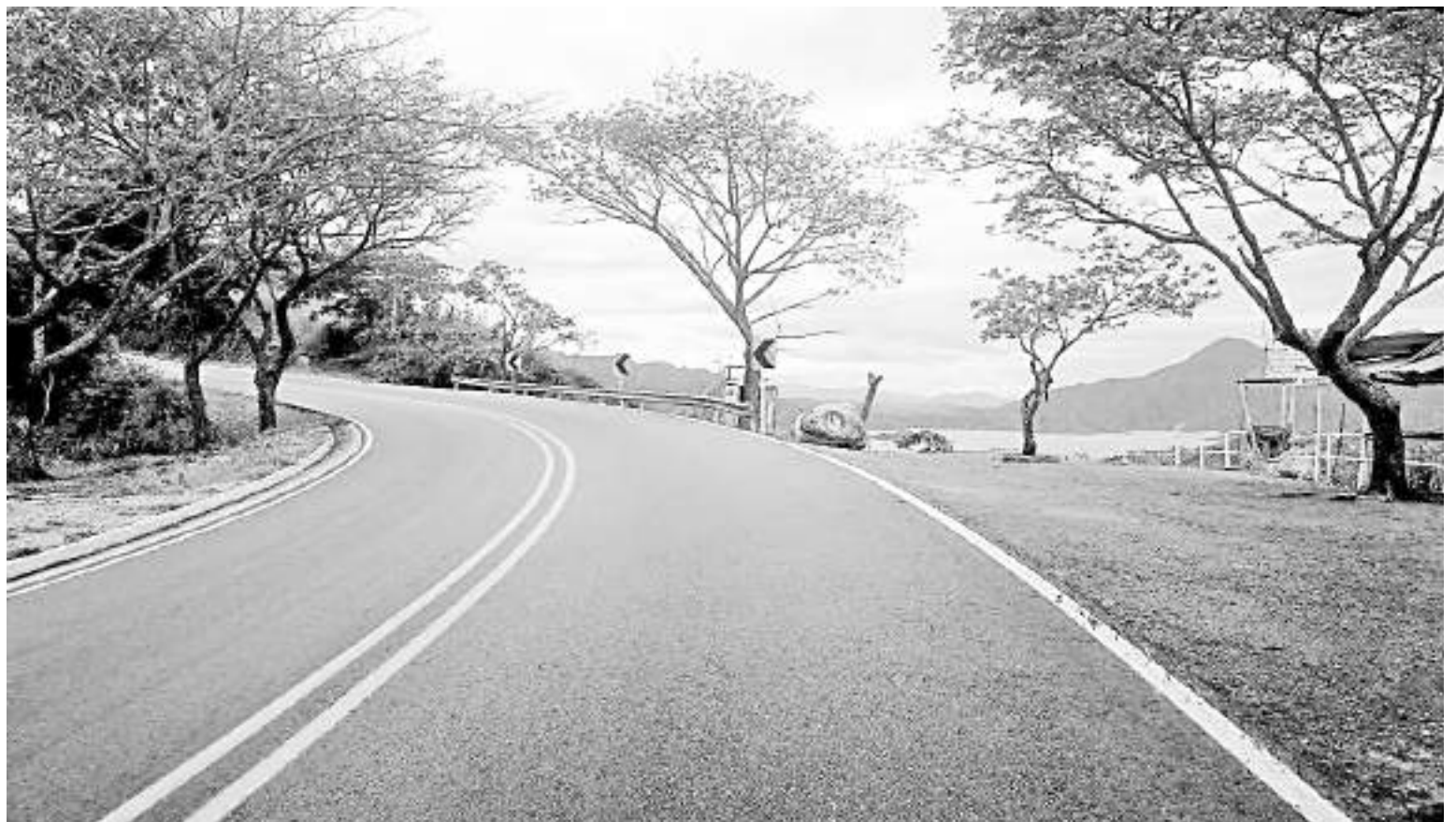
Se confirmó que el valor original adjudicado para ejecutar las obras de doble calzada de la vía Neiva - Pitalito - Mocoa - Santana será, al principio de $1,5 billones de pesos.

terio de Transporte, en la época, se conoció que el valor originalmente adjudicado para ejecutar las obras de doble calzada de la vía Neiva – Pitalito – Mocoa – Santana, con sus respectivas variantes en los municipios de Hobo, Gigante, Timana y la solución definitiva del paso por el sitio de Pericongo, fue de $3,64 billones de pesos.