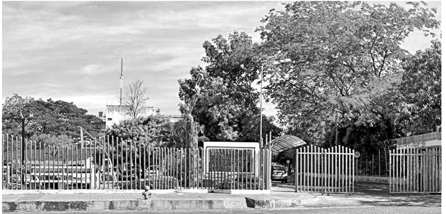
La docente de la Universidad Surcolombiana recibió amenazas esta vez vía Whatsapp.

tentes, que no les gustaba la dinámica de trabajo, que semestre tras semestre repetían las mismas materias. Llegaron incluso a ponerle precio a mi vida, porque según versiones le estaban pagando a alguien más de un millón de pesos para que me asesinaran", afirmó la maestra.