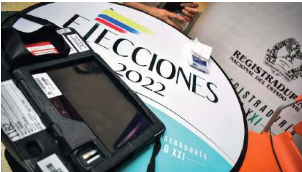
La delegación espera ser acreditada por el Consejo Nacional Electoral y se registrará bajo los criterios y lineamientos de trabajo electoral que impartirá la MOE.

Así mismo, al final de la jornada de elecciones del próximo 13 de marzo, se emitirá un docu-