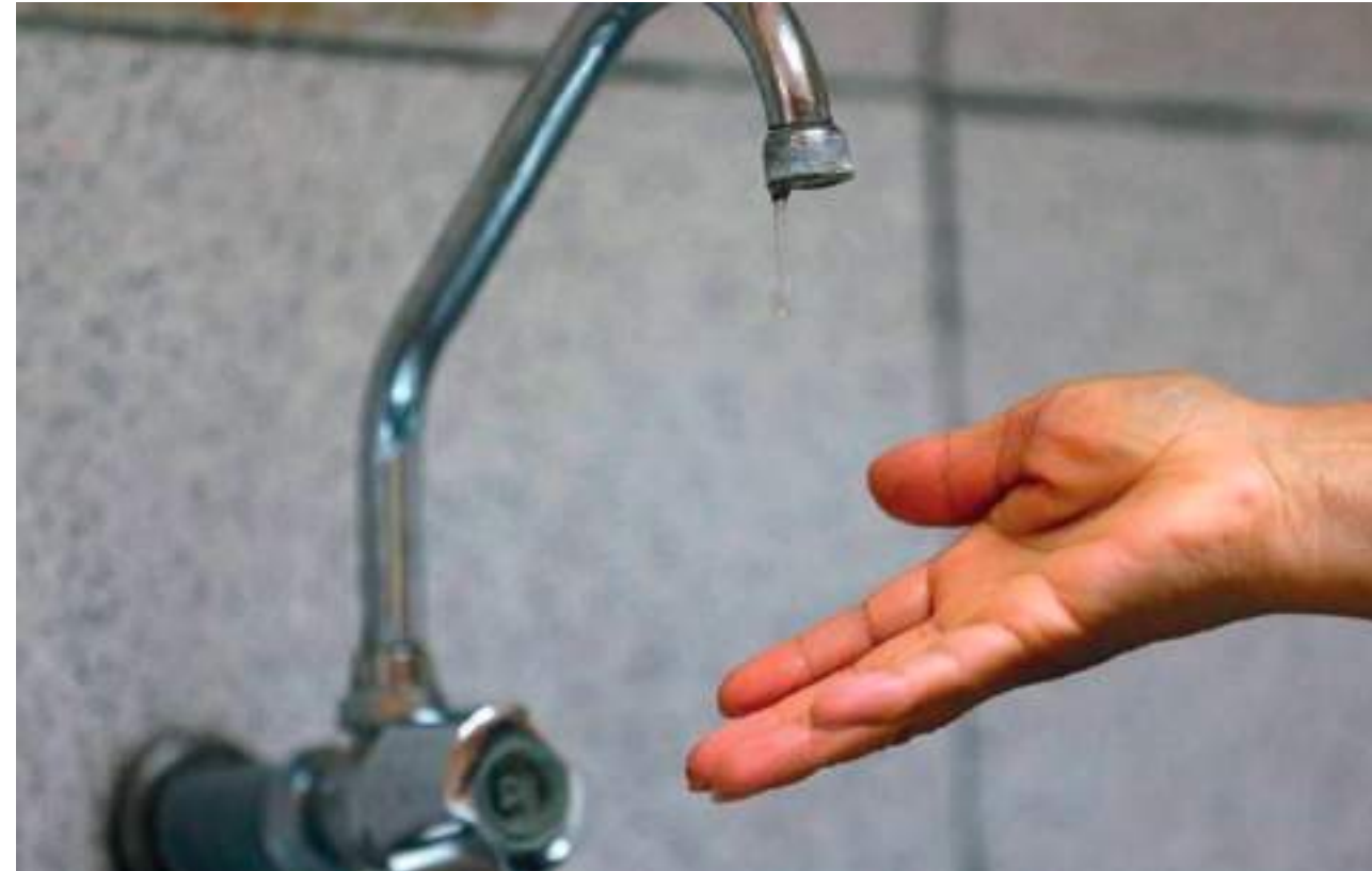
Por más de 72 horas estuvieron sin agua en la comuna seis de Neiva.