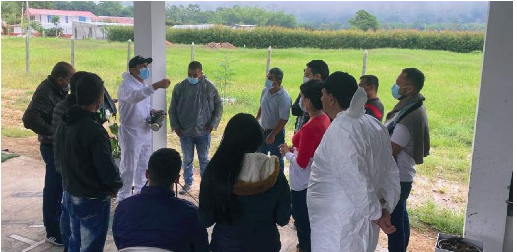
El pico de contagios inició en diciembre de 2021 se espera que se extienda hasta junio de 2022.

“Reforzamos las acciones de inspección, vigilancia y control para mitigar el posible brote; recordamos a la comunidad evitar el estancamiento de agua limpia, ya que en un centímetro cúbico pueden crecer zancudos, el huevo del zancudo puede tardar hasta dos años en desarrollarse”