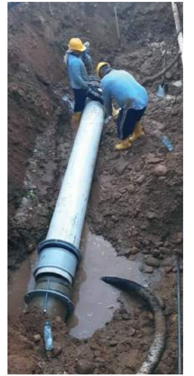
Tubería principal como esta en mantenimiento fue la causante de la suspensión.

Asimismo, se pidió a la comunidad comprensión por la suspensión adelantada dado que son trabajos que se tienen que realizar para garantizar el óptimo servicio de agua para los neivanos.