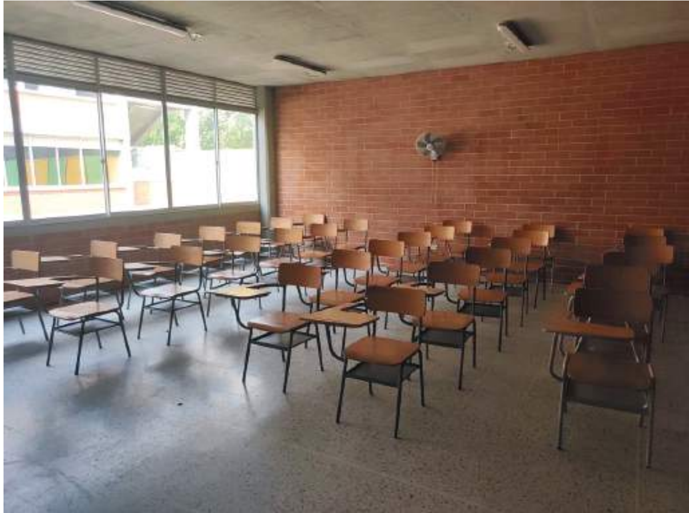
Los pupitres que faltaron en el inicio de clases presenciales en la Institución Educativa Claretiano Gustavo Torres Parra, finalmente llegaron hace algunos días para el servicio de los estudiantes.