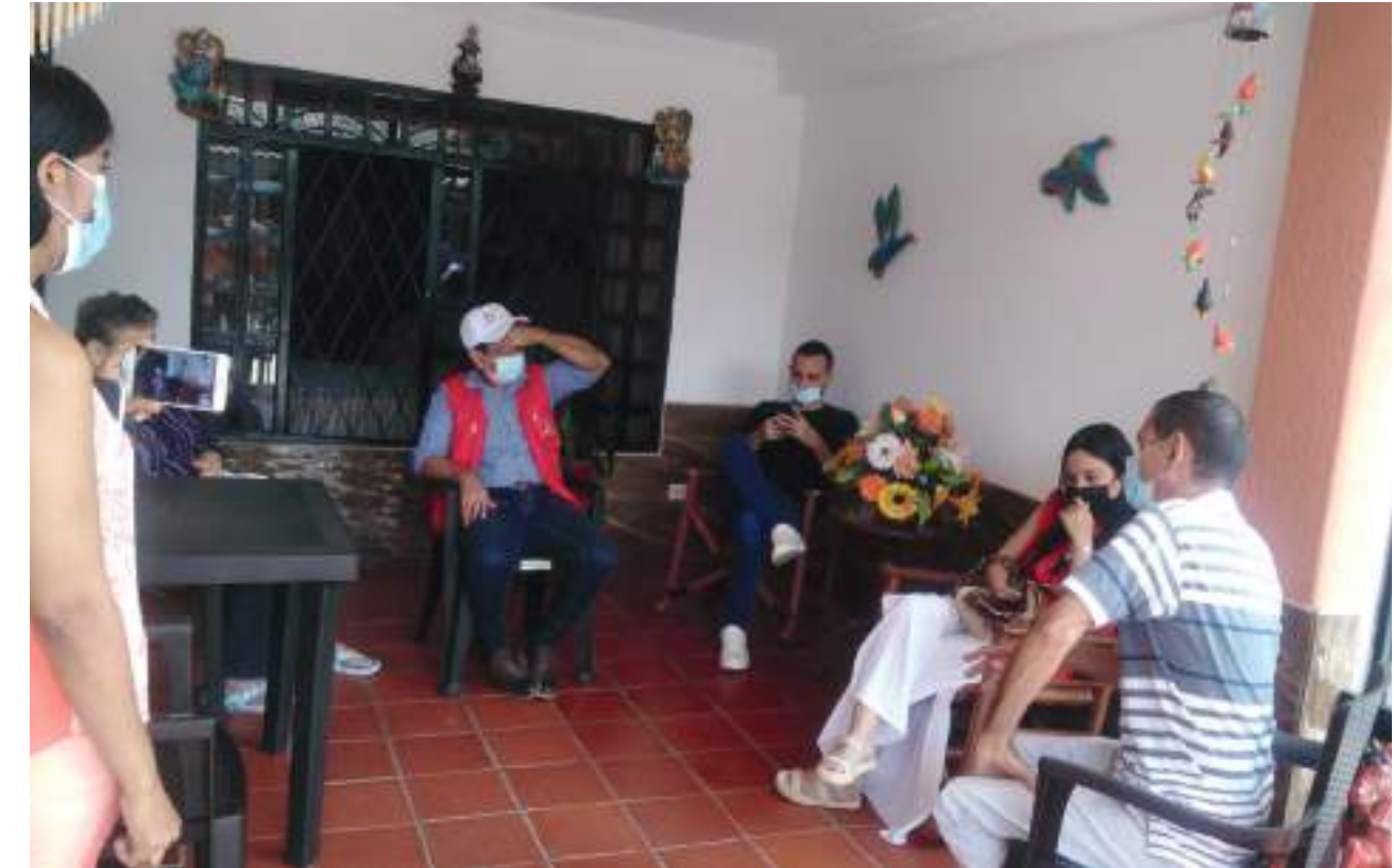
Vecinos de Manzanares reunidos en búsqueda de soluciones.

Desde el pasado martes los habitantes de cerca de 55 barrios de la Comuna Seis de Neiva estuvieron sin el servicio de agua potable. Aunque conocían de la suspensión lo que no tenían previsto es que un nuevo daño prolongara los trabajos por lo que el servicio comenzó a restablecerse desde el jueves al medio día.