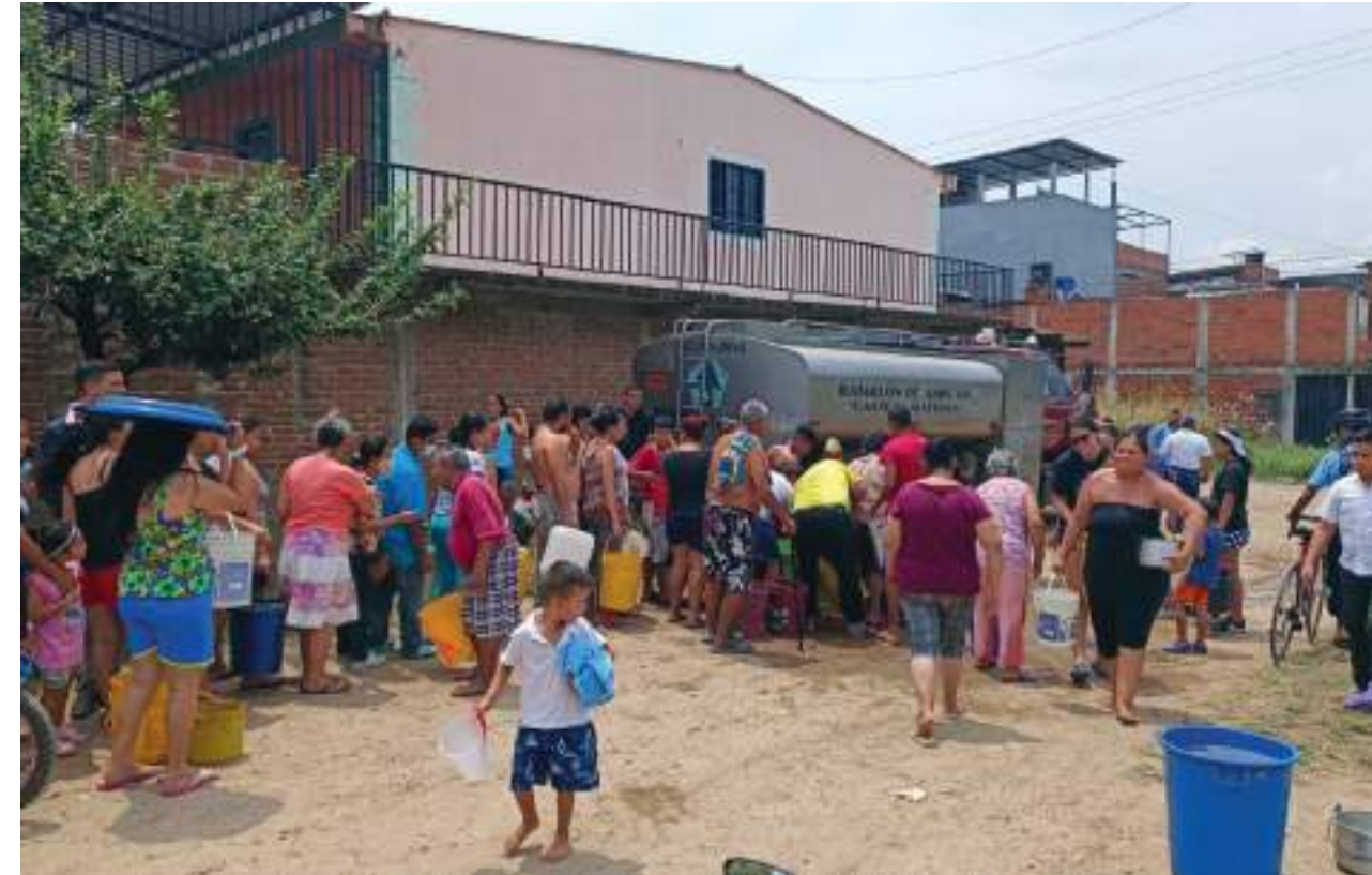
Con carro tanques se llevó agua a algunos sectores.