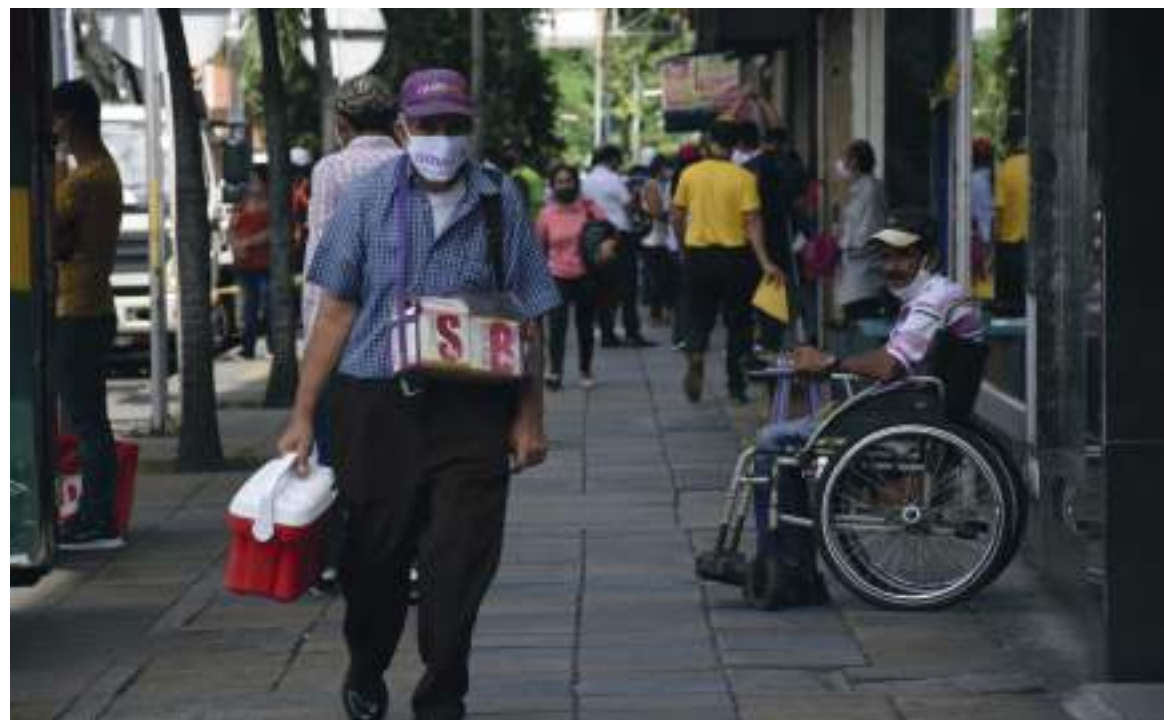
La Sala de Análisis del Riesgo para la vigilancia epidemiológica del evento Covid-19 reportó 60 casos nuevos en 10 municipios.

De igual manera, durante el último día se aplicaron un total de 234.077 vacunas, de las cuales 57.303 corresponden a la segunda inyección mientras que otras 14.495 fueron monodosis.