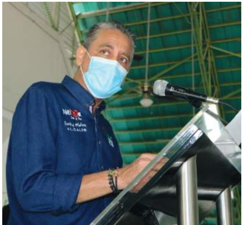
La Administración Municipal anunció que elevará la decisión del Juzgado a consulta ante el Tribunal Superior de Neiva.