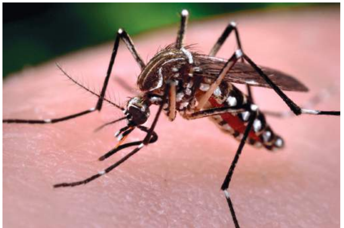
26 de los 37 municipios del Huila han reportado casos de dengue. Esta es una enfermedad que se puede prevenir si se siguen las recomendaciones de las autoridades de salud.

Según datos oficiales, el 98% de los casos de dengue con signos de alarma fueron tratados intrahospitalariamente y el 83% de los casos de dengue grave fue tratado en una unidad de cuidados intensivos. La incidencia de dengue departamental es de 31 casos por 100.000 habitantes en riesgo, encontrándose por encima de la tasa nacional que es de 14.1 casos por 100.000 habitantes.