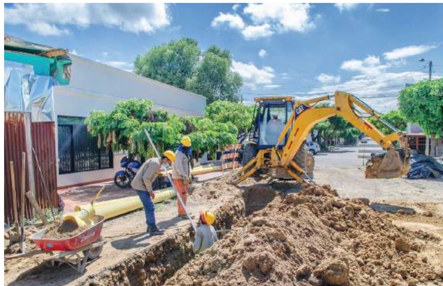
Operarios de las Ceibas realizando trabajos en las redes de agua.