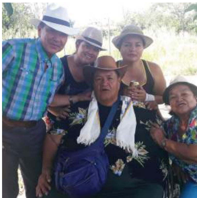
En los buenos tiempos alcanzaba para departir en familia.

Es la vida de un hombre que desde niño ha pasado toda clase de dificultades, pero que siempre ha estado dispuesto a salir delante de la mano de Dios, uno debe dar gracias por cada día que amanece y puede respirar, vivir, compartir con su familia y sus amigos, concluye.