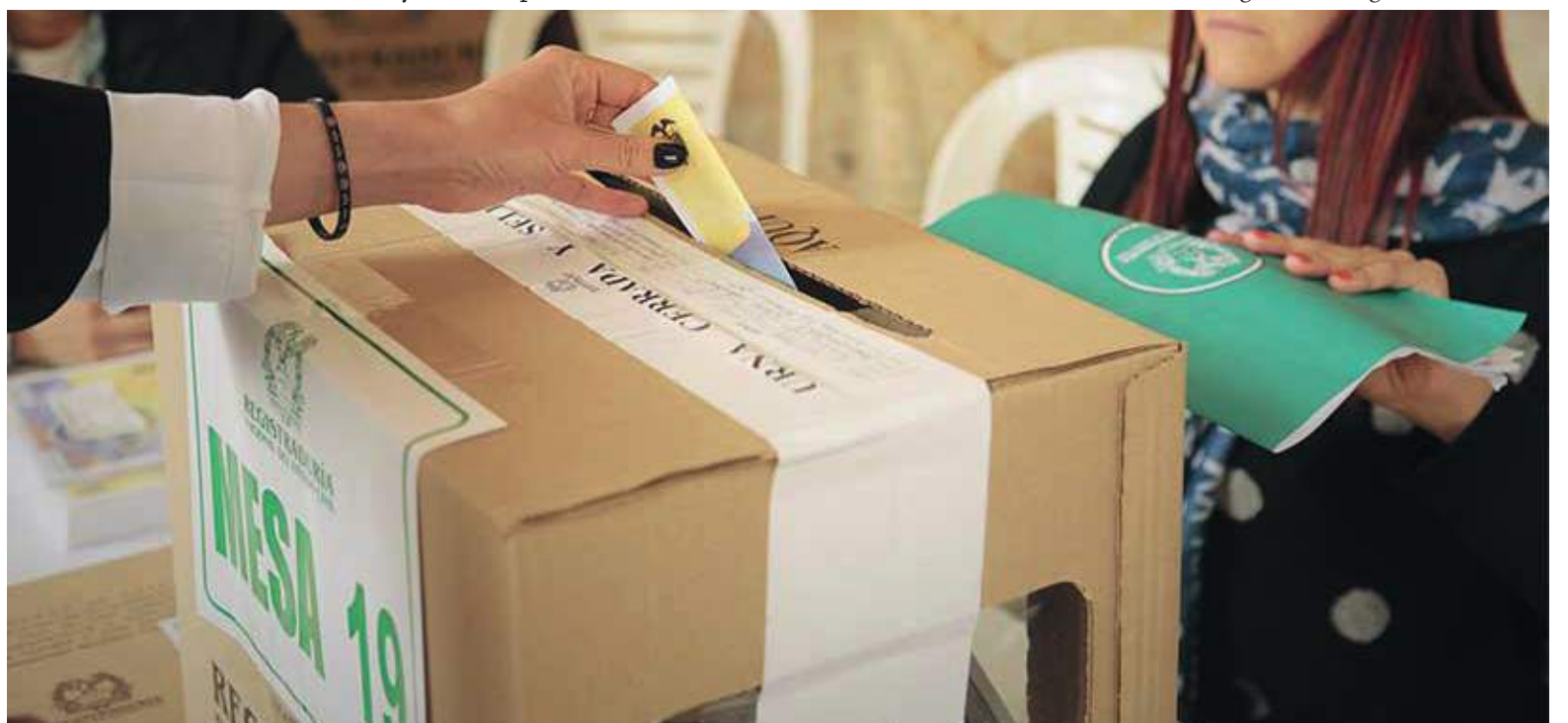
La misión estará conformada por 54 hombres y 31 mujeres, entre sindicalistas y defensores de derechos humanos, que fueron convocados por la organización sindical internacional UNI Global Union.

Así mismo confirmó el Instituto Nacional Demócrata de los Estados Unidos que busca velar por la seguridad de las instituciones democráticas en el mundo. “Con esto completaremos ocho misiones de observación electoral y tres de acompañamiento técnico al software de escrutinio”, sostuvo el registrador Vega.