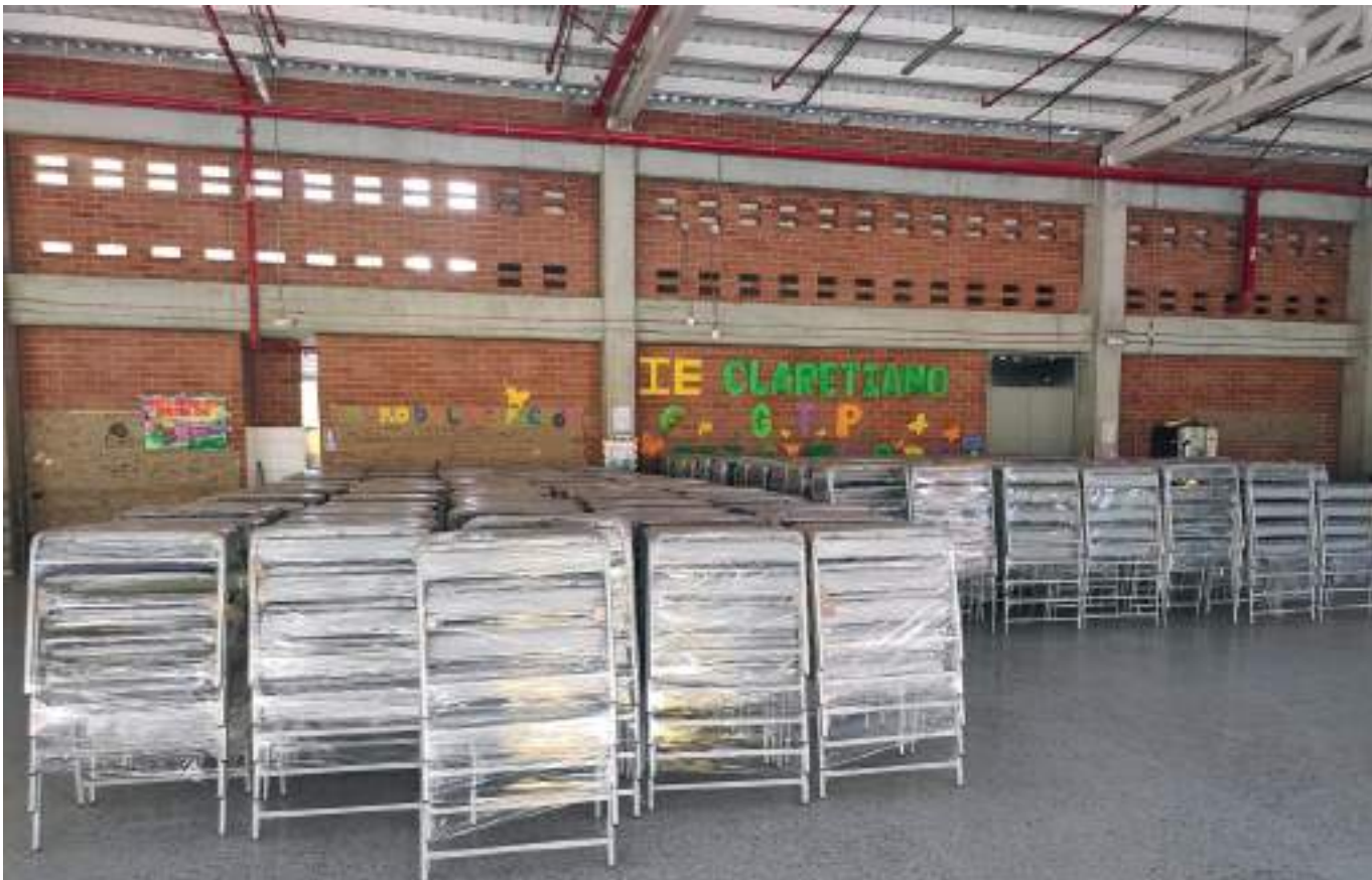
Guardas de tránsito hacen presencia para controlar la movilidad y solucionar el caos que se presentaba al ingreso y salida del colegio. También se han solucionado los problemas de servicio de agua potable, y de estancamiento de aguas residuales.

Mencionó que continúa por resolver el acondicionamiento del restaurante escolar para que empiece a funcionar, así como la dotación los laboratorios y el techo del polideportivo, que por el momento tendrá una polisombra.