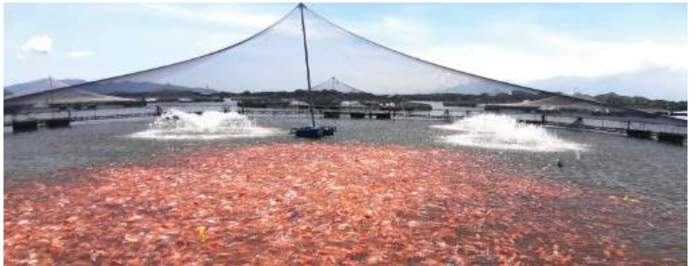
El más reciente informe del Ministerio de Agricultura y Desarrollo Rural, da cuenta que el departamento del Huila aumentó en 5.411 toneladas de pescado con respecto al año 2020.

En establecimiento de Unidades de Producción Agropecuaria los departamentos de Huila con 2.273, Meta con 1.457 y Tolima con 2.441, representan en conjunto el 17% de las UPA con presencia de acuicultura, donde se concentra el 58% de la produc-