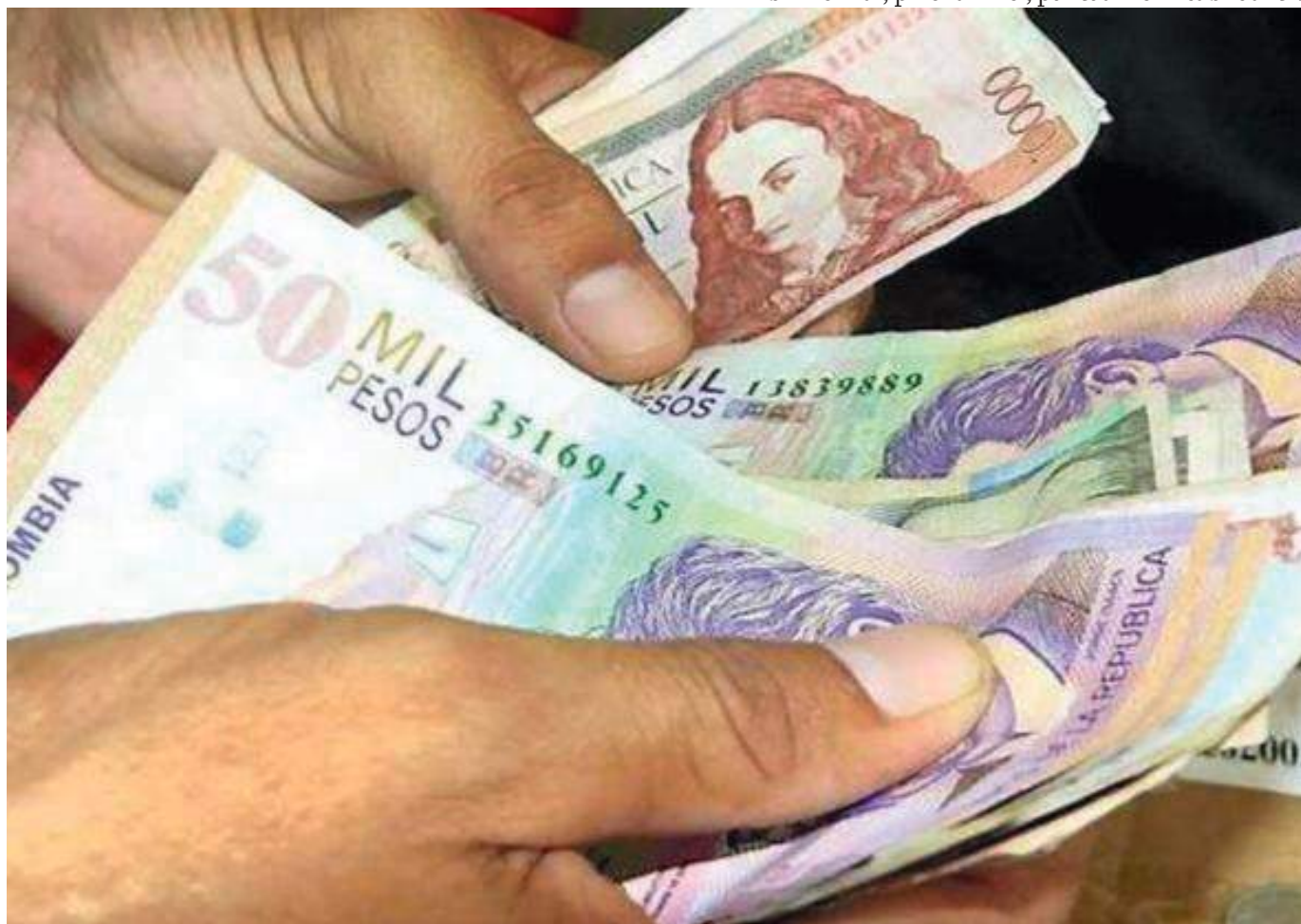
70 millones de pesos ya canceló el Concejo de Neiva a la Universidad de Cartagena por la realización de la prueba que está teniendo cuestionamientos.

“Ahora no sabemos, ¿se perdió la plata? Yo todo me imaginaba menos que de los postulados ninguno fuera idóneo. No tenemos terna y el contrato ya se acaba, además la Universidad no está obligada a repetir ningún proceso porque ya hizo su parte, bien o mal, pero la hizo”, puntualizó el cabildante.