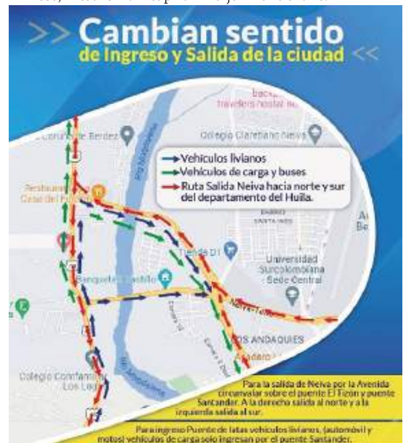
Así quedaron establecidas las rutas para entrada y salida de la ciudad.