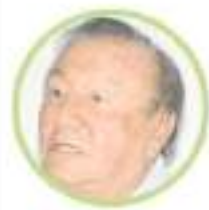
RODOLFO HERNÁNDEZ Liga de Gobernantes