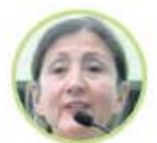
INGRID BETANCOURT Verde Oxígeno