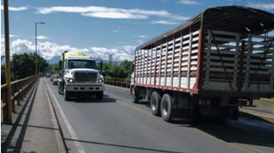
El puente Santander antiguo o llamado puente de latas, quedó deshabilitado para salir de la ciudad. Para el caso de vehículos de carga pesada deberán ingresar a la ciudad por el puente Santander.

■ Autoridades recomiendan tomar la vía que pasa por encima del puente de El Tizón para la salida de la ciudad, con el fin de descongestionar el tráfico vehicular sobre la glorieta. Mientras tanto ya iniciaron los trabajos de reparación del puente sobre Río Frío en Rivera.