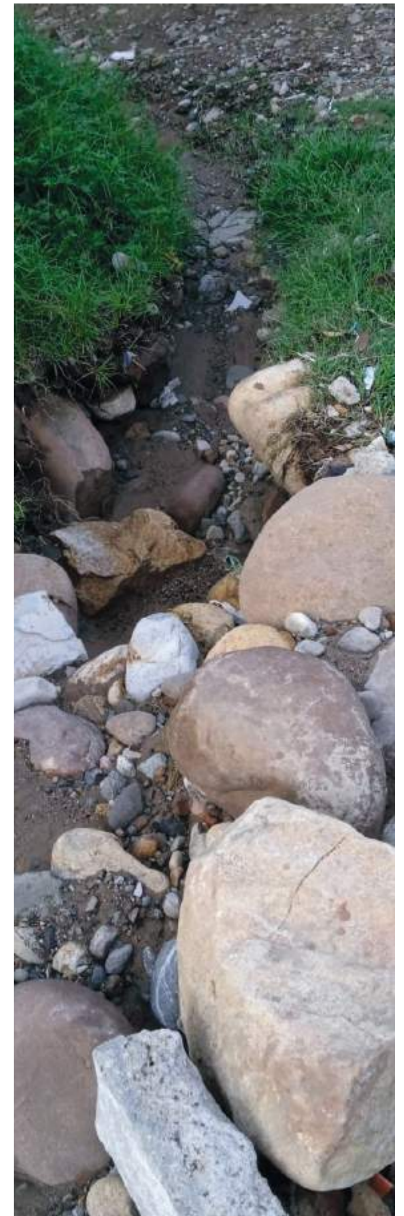
La vía parece el lecho de una quebrada.

De esta manera, la comunidad de La Victoria pide el arreglo de la calle 19 desde la carrera 57 a la 64. Insisten que la última comunicación sobre el particular la recibieron en agosto 21 del año pasado, en donde les dicen que la vía que necesitan les pavimenten será incluida en el plan de pavimentaciones en la medida que existan los recursos y materiales, previa inclusión en la base de datos y solicitudes de la comunidad de Neiva. Mientras tanto, siguen esperando a que esto suceda,