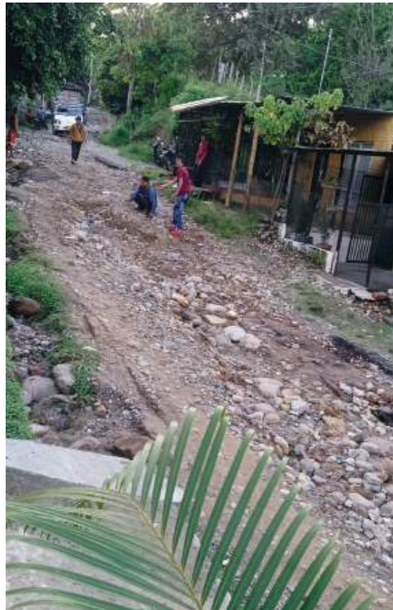
Los moradores tratan de tapan los huecos con piedras y arena.