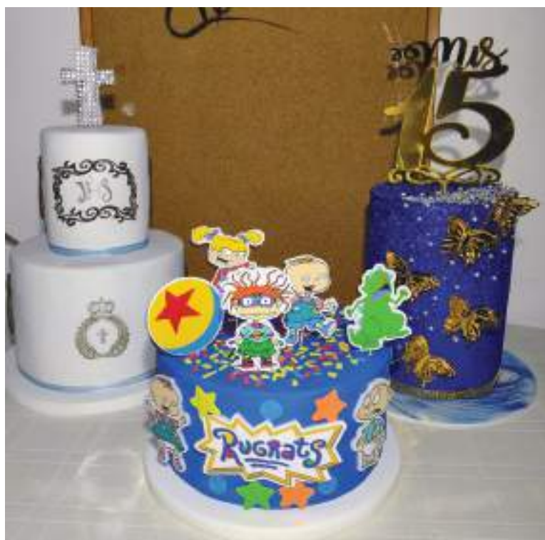
Los motivos son diversos.

La pueden buscar cómo Facebook como Maye Creación, “hay fotos videos y la gente puede ver cómo es mi trabajo, también me pueden contactar al celular 315-666 6920.