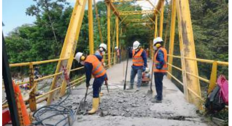
La evaluación realizada por parte del personal especializado de la Secretaría de Vías e Infraestructura del Huila determinó que el daño presentado en el puente ubicado sobre el Río Frío no tenía problemas estructurales.