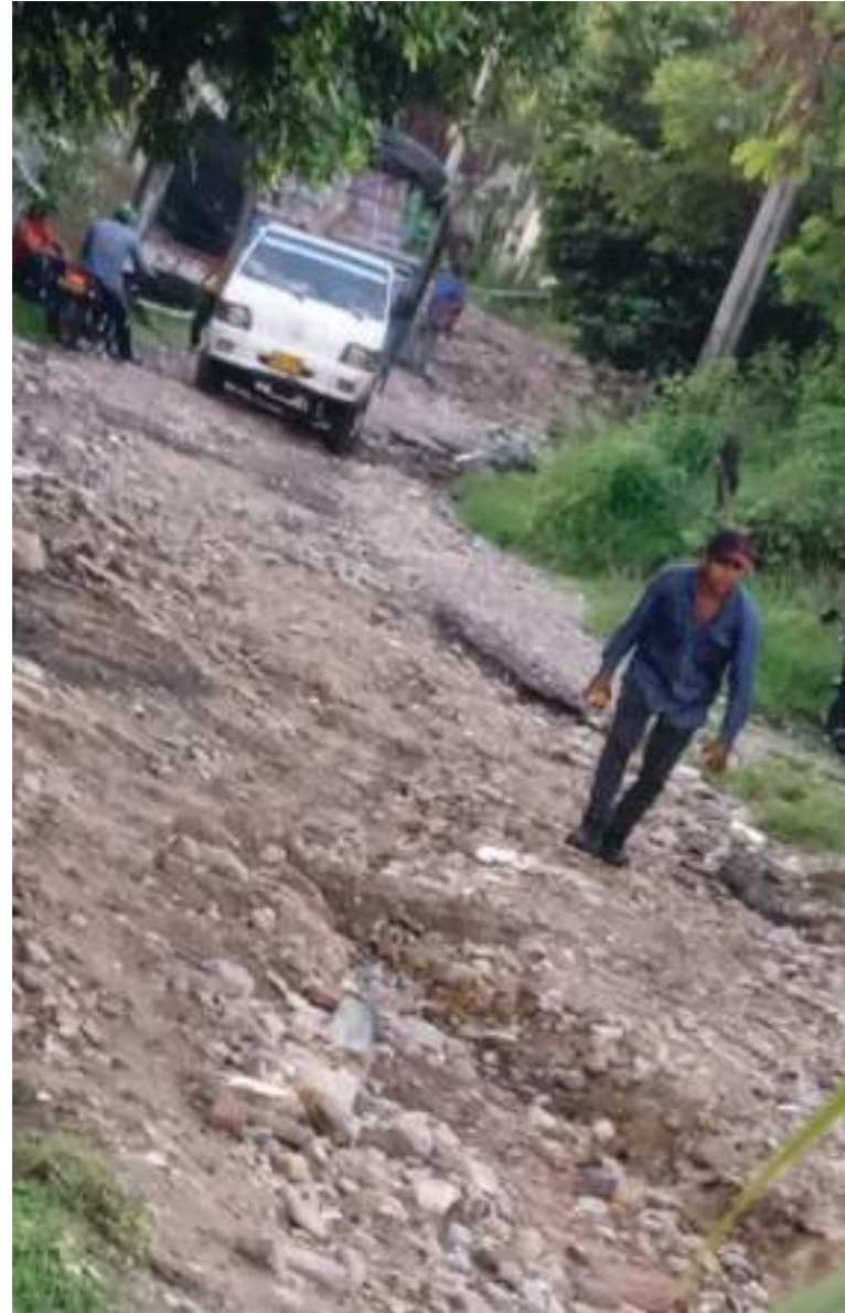
Mal estado de lo que se puede considerar la vía de La Victoria.