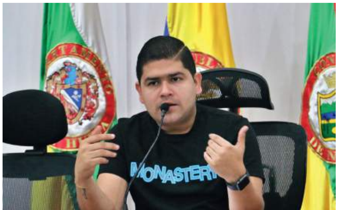
Concejales de Neiva se han manifestado sobre denuncias de presuntas irregularidades en el proceso de aplicación de la prueba realizada por la Universidad de Cartagena a los aspirantes a Contralor Municipal.