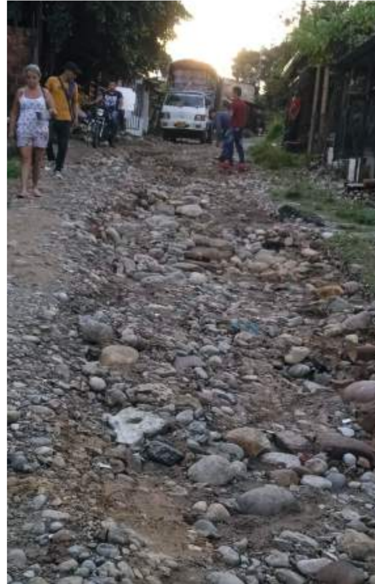
Las lluvias se han llevado lo poco de alistado que se había hecho.