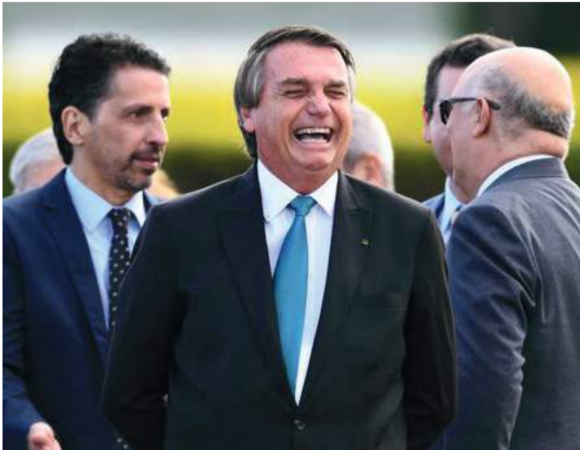
El ministerio de Justicia brasileño concedió a Jair Bolsonaro la medalla al “mérito indígena”, otorgada a personalidades que actúan por el bien de estas comunidades.

El año pasado, la APIB denunció a Bolsonaro ante la Corte Penal Internacional (CPI) por su “política anti-indígena”, a la que califican de “genocidio” y “ecocidio”, especialmente durante la pandemia, que provocó la muerte de más de 1.200 indígenas.