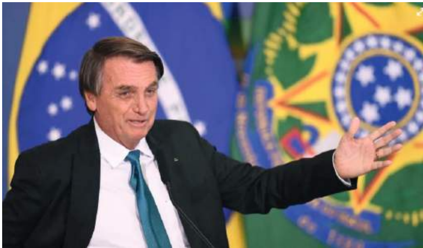
En 2021, Jair Bolsonaro fue denunciado ante la Corte Penal Internacional (CPI) por su “política anti-indígena”, que provocó la muerte de más de 1.200 indígenas durante la pandemia.

También la primera diputada indígena de Brasil, Joenia Wapichana, manifestó su “repudio” al jefe de un gobierno que lleva tres años “de muchos retrocesos y ataques a los derechos de los pueblos indígenas”.