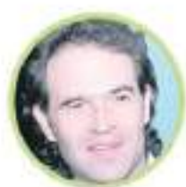
FEDERICO GUTIÉRREZ Equipo por Colombia