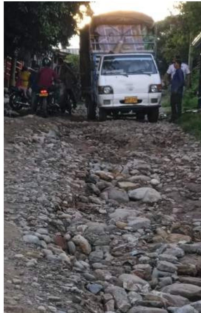
El paso de vehículos es casi imposible.