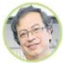
GUSTAVO PETRO Pacto Histórico