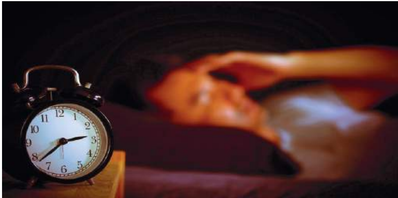
Las estadísticas demuestran que el promedio de horas de descanso para una persona ha disminuido en un 13 % desde 1942. De tener 7,9 horas de descanso, pasaron a ser tan solo 6,8.

Como seres humanos la necesidad de dormir es la misma: restaurar el cerebro y el cuerpo, pero, la mujer por cuestiones biológicas presenta algunas diferencias a la hora de mantener el sueño. Según la investigación realizada por la universidad Loughborough de Inglaterra, (donde se encuestaron a 210 hombres y mujeres de la misma edad), las mujeres