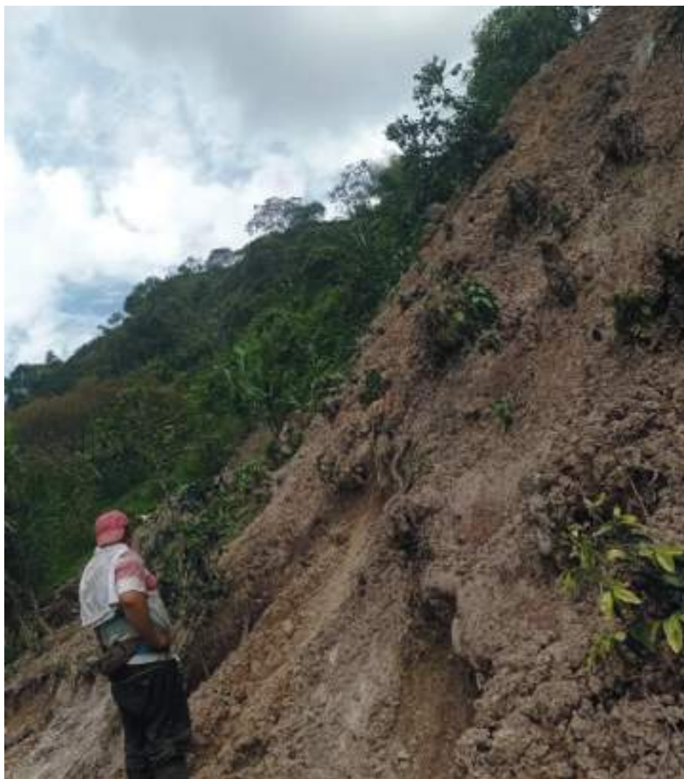
El Municipio de Pitalito, es uno de los mayores afectados en los cultivos de café.

Escuela de café “LA AURORA” corregimiento de Bruselas. De igual manera se comprometió a crear un fondo nacional para superación de afectaciones a caficultores por emergencias invernales, así como a la construcción del Jardín Botánico como centro