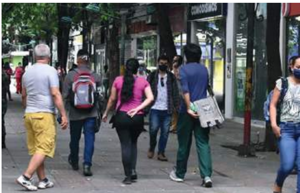
47 casos se registran activos, de los cuales, 34 personas son atendidas en el servicio de hospitalización general, 1 persona se encuentran en cuidados intensivos y 12 se encuentran en casa.

El más reciente reporte del Ministerio de Salud también señala que hasta las 11:59 del martes 15