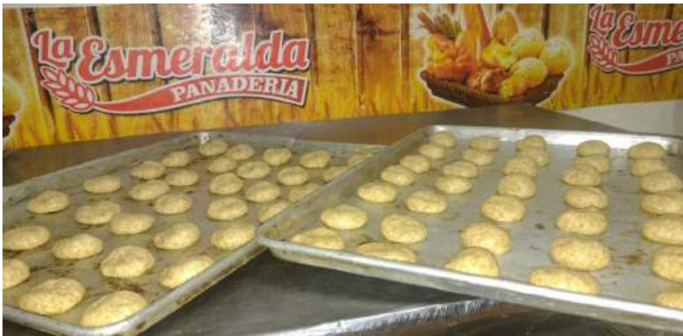
Lamentablemente algunas empresas hacen recorte de personal y el desempleo a nivel local, departamental y nacional incrementa.

"No es por avaros ni por llenarnos los bolsillos es por fuerza mayor que subimos los precios. Y los negocios deben dar utilidades de lo contrario dejarían de ser negocio. El sector panificador está pasando por una crisis como nunca antes se había visto o por lo menos en los 22 años que llevo con la empresa nunca se había visto una situación como está".