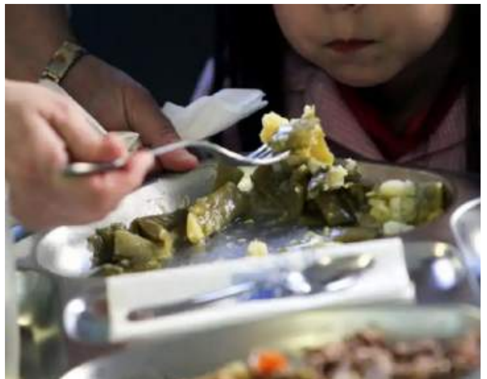
Los ayunos están desaconsejados durante un episodio de gastroenteritis.

-Consulta sobre probióticos al farmacéutico: los probióticos son alimentos que contienen microorganismos vivos que repoblan la flora intestinal y acortan la duración de la diarrea.