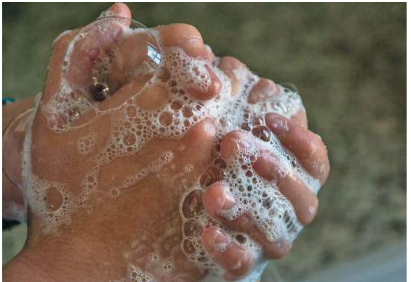
Extremar la higiene es vital para evitar el contagio de enfermedades víricas.

Maset recuerda que los lactantes "deben continuar la lactancia materna o el tipo de leche habitual, sin alterar la fórmula y ante cualquier duda, consultar con el pediatra".