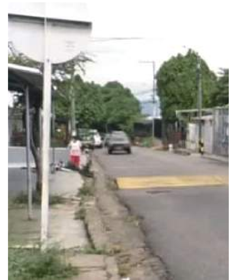
Reuniones entre las autoridades y la comunidad se realizarán esta semana.