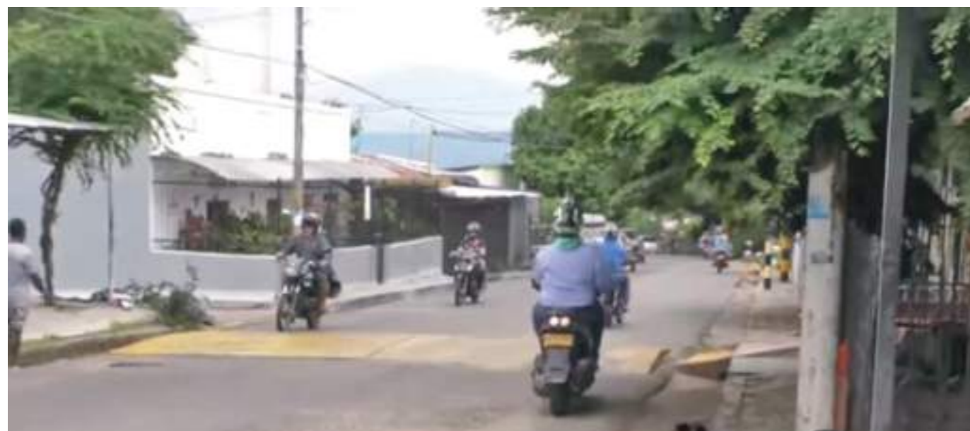
La vía funciona actualmente en los dos sentidos.