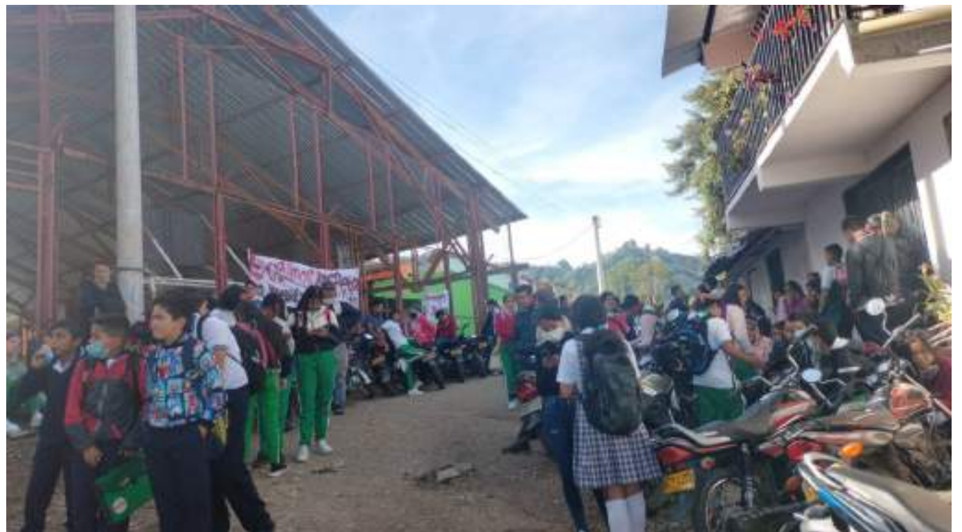
Según indicaron los padres de familia, seguirán en plantón hasta que la decisión sea derogada por parte de la Secretaría de Educación Departamental.

De igual manera, la Secretaria de Educación Departamental aseguró que está dispuesta a vigilar de cerca las actuaciones del rector, pero que todos deben respetar esa decisión administrativa.