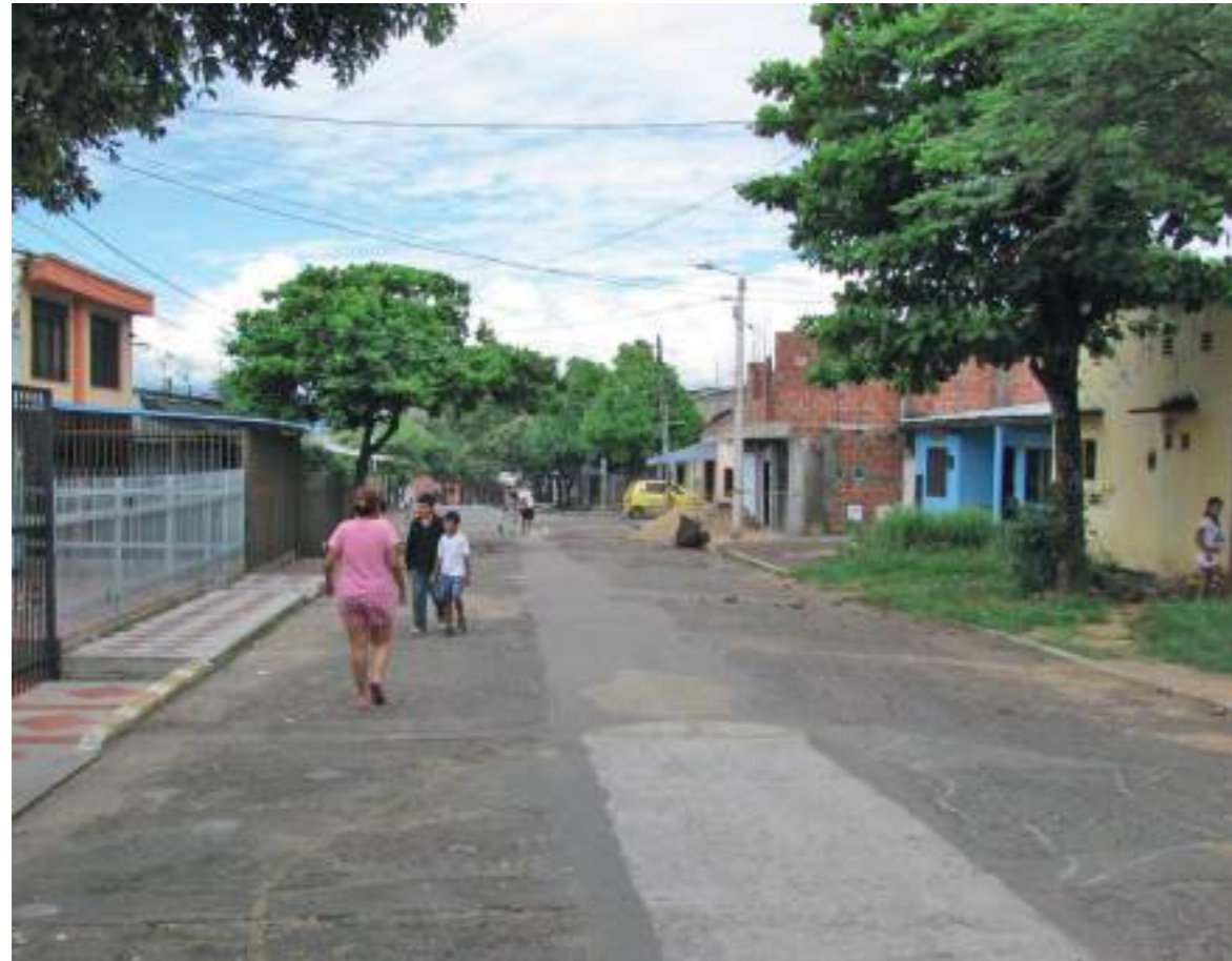
Calle 39 en controversia en Monserrate.