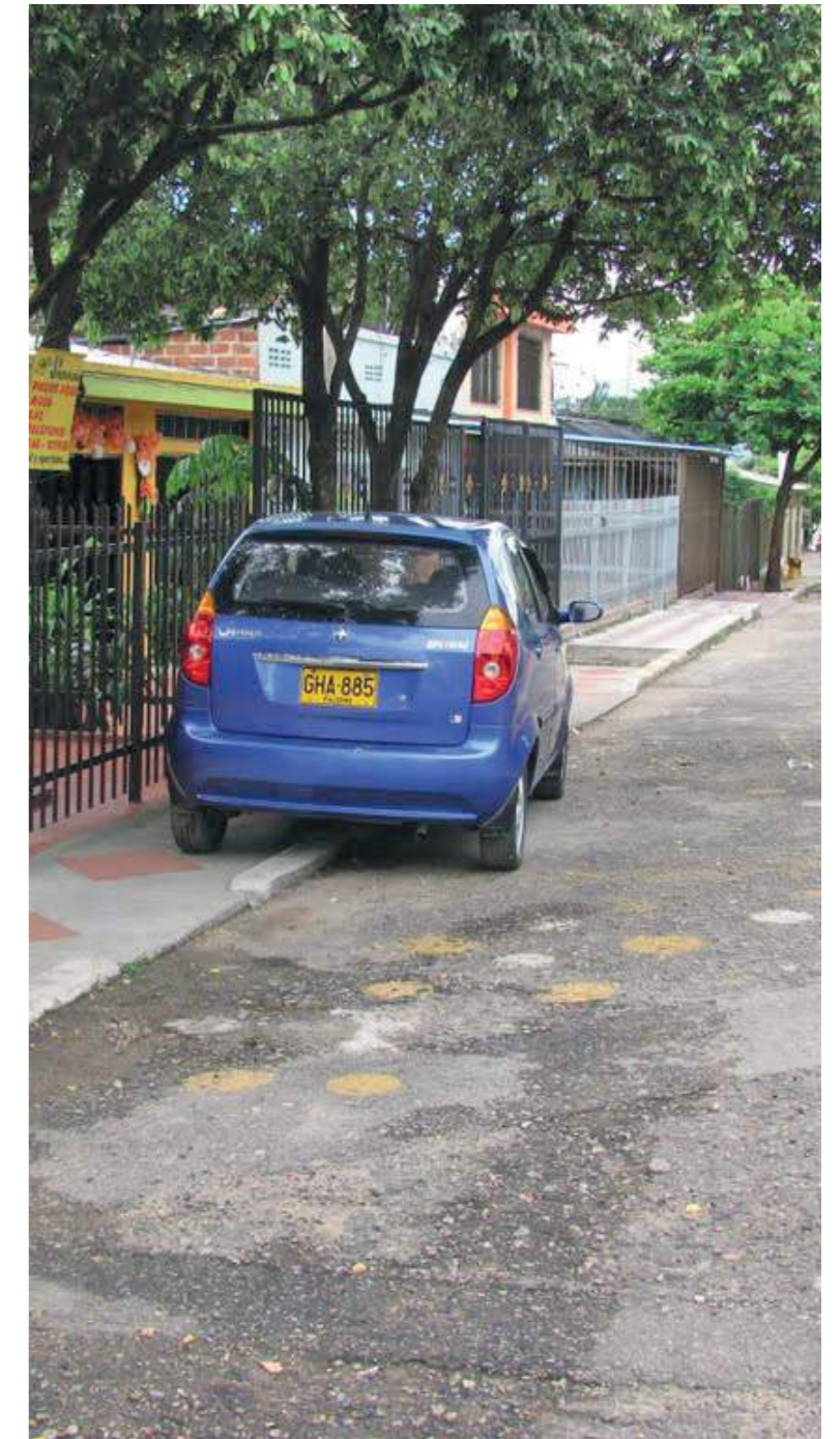
Los vecinos dicen que con la medida deben dar una vuelta larga para llegar a sus residencias.

El otro interrogante que le surge a la comunidad es por qué pasaron cerca de siete años para que se recordara el fallo y el obligatorio cumplimiento. Diario del Huila sigue pendiente de este caso que afecta a los residentes en uno de los sectores populares de la comuna cinco en la capital del Huila.