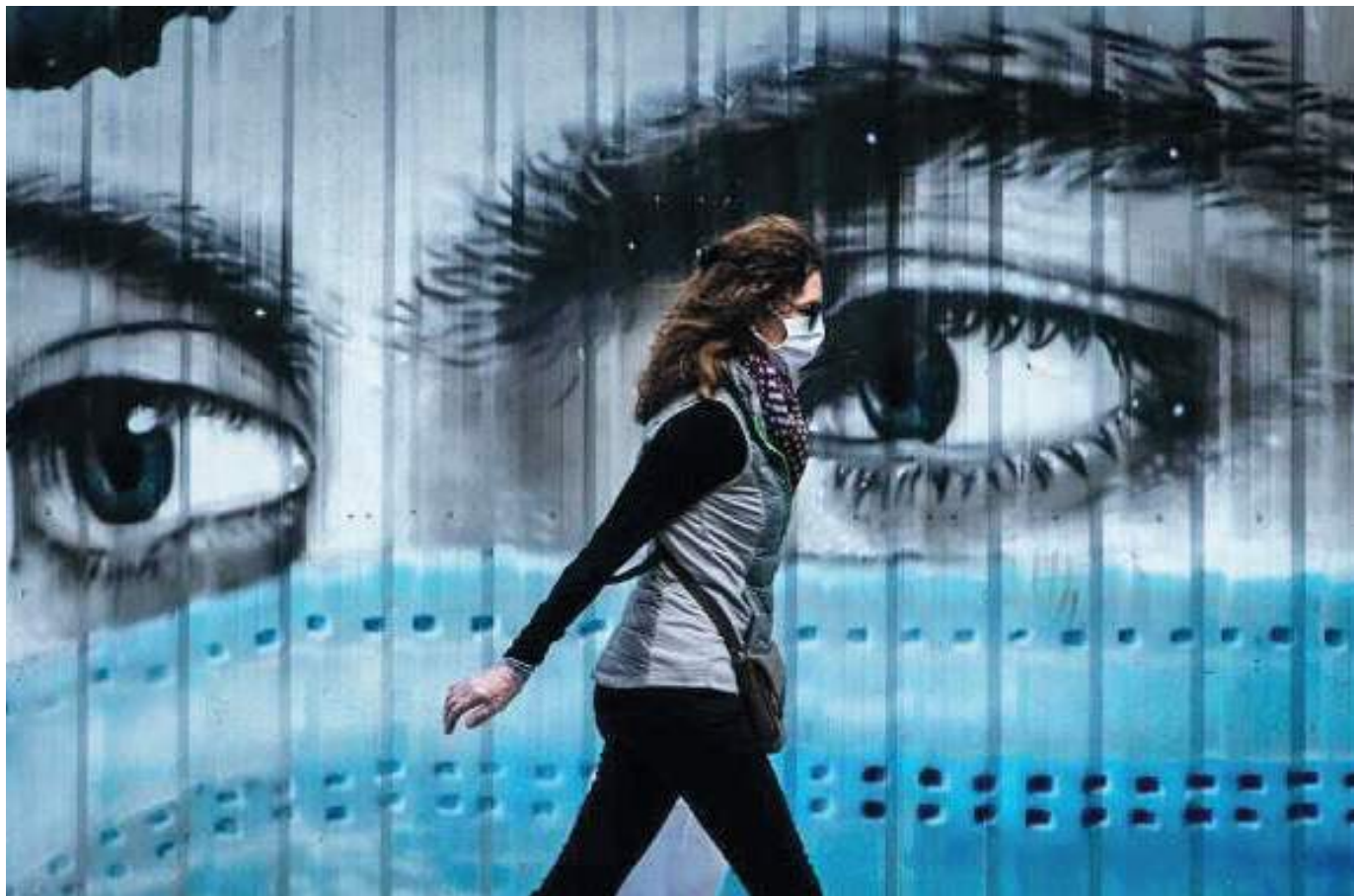
Las mascarillas, en el país de España, dejan de ser obligatorias en interiores y algunos centros de trabajo.

En todo caso, un sitio cerrado, mal ventilado y con mu-