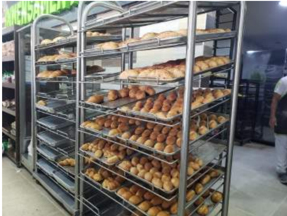
Durante los últimos meses los comerciantes del producto se han enfrentado a varias dificultades por el incremento periódico de los insumos primarios del producto.