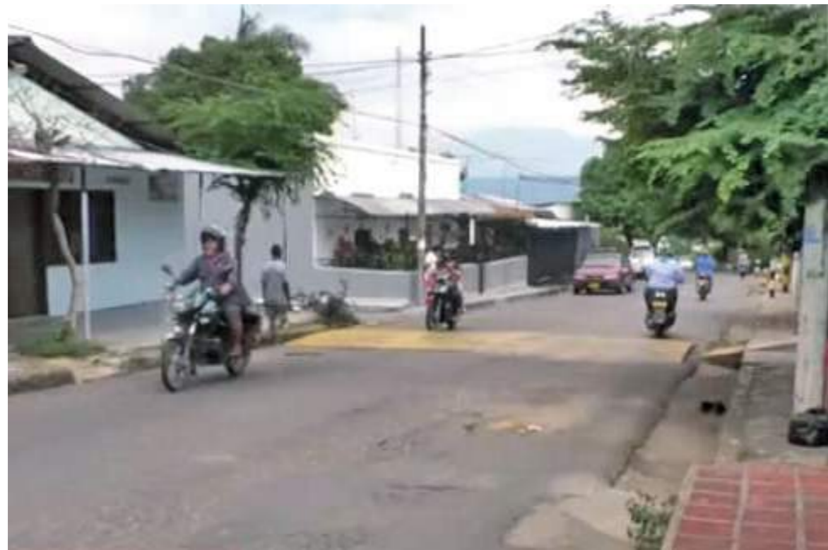
El fallo dice que la vía debe quedar habilitada solo para vehículos que van bajando.