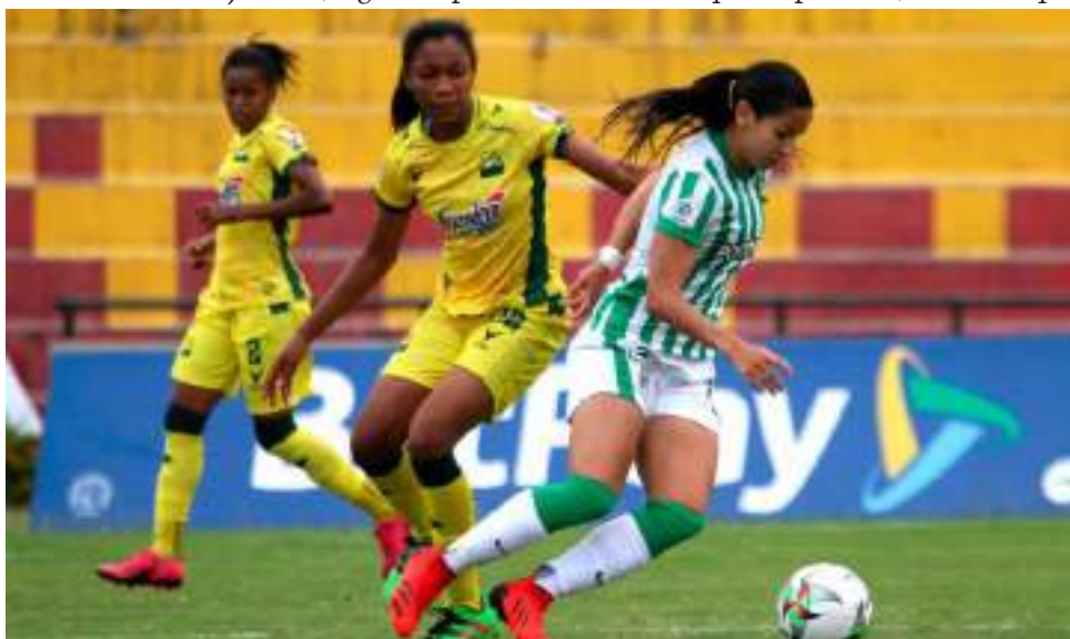
El juego fue muy cerrado y disputado ante todo en el medio campo.

Entretenido y parejo partido regalaron ambas instituciones, las cuales se dedicaron a cuidar más la zona defensiva que a buscar las oportunidades de gol claras.