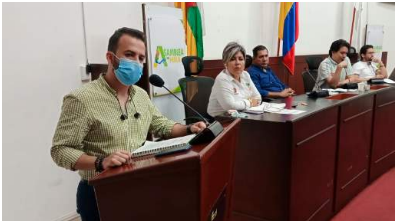
Secretaría de Educación Departamental y el equipo de supervisión PAE asistieron al debate de control político en la Asamblea Departamental del Huila.

Así las cosas, los requerimientos de los diputados citantes es que se puedan adecuar las sedes de las 12 Instituciones Educativas que no pueden tener el servicio de alimentación preparada en sitio y que por lo tanto deben hacerse de manera industrializada y duplica los costos.