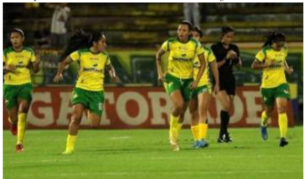
El Huila deberá ganar los tres juegos que le restan para pensar en clasificar.