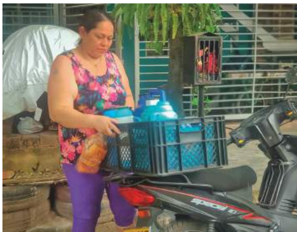
La calle es su oficina de trabajo y la venta informal es la herramienta que le permite sobrevivir.

Actualmente, vive en el barrio Limonar junto a