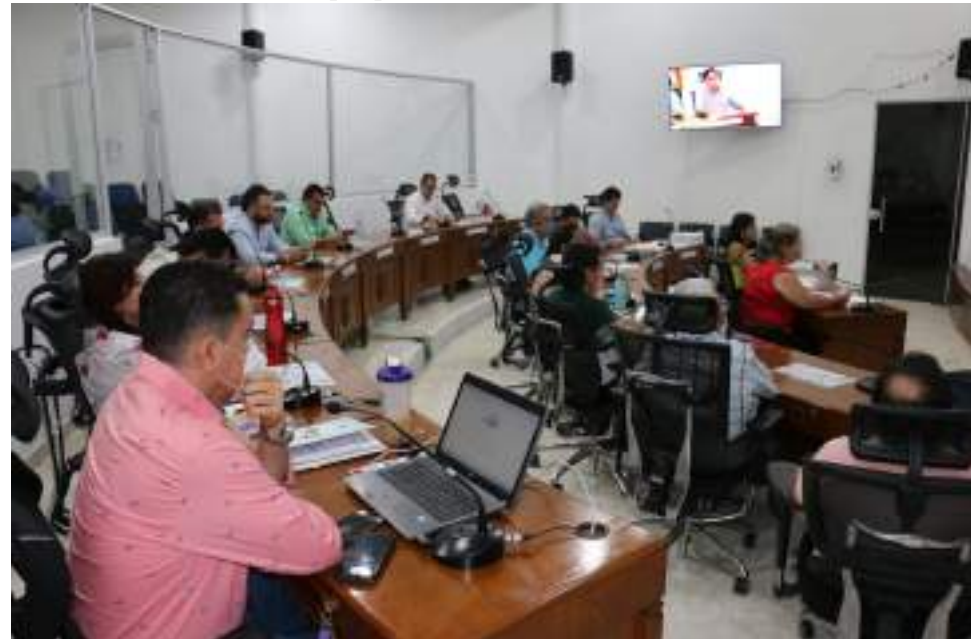
Los concejales de Neiva tuvieron la oportunidad de escuchar en un nuevo debate las condiciones de contratación de los trabajadores de la salud.

Además, resaltó que hay “infinitud de instituciones públicas que tienen acuerdos de formalización con el Ministerio del Trabajo para blindarse de demandas. El gerente debió ponerse la bata para defender a los trabajadores y las trabajadoras, no solamente a la ESE”.