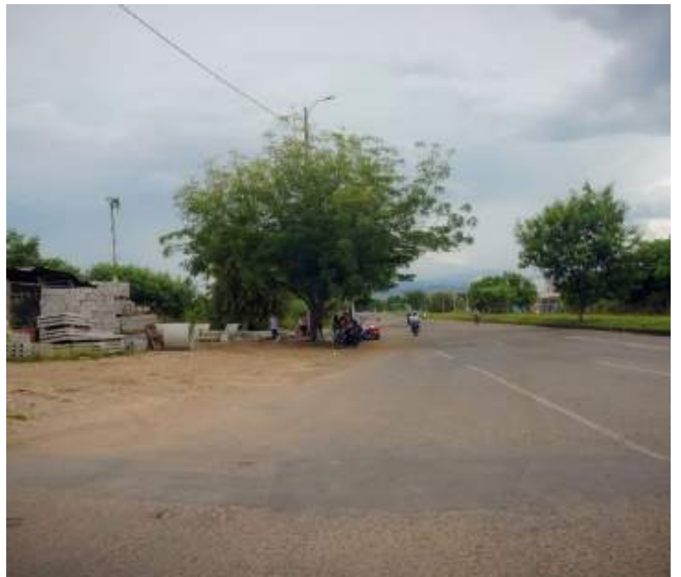
Una denuncia en contra de la empresa JPL Servicios S.A.S de Neiva, se adelanta actualmente ante la Fiscalía General de la Nación por homicidio culposo.

El accidente ocurrió el sábado, 2 de abril a las 10:15 de la mañana, según un video de seguridad que recuperaron. Al día siguiente, domingo 3 de abril lo ingresaron a la cirugía de UCI, allí duró esa semana y el viernes 8 de abril a las 2:30 A.M., la llamaron para comunicarle