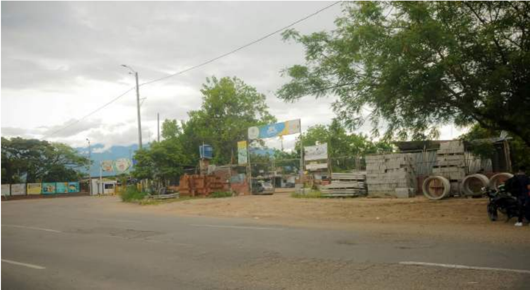
Mientras avanza la investigación, la empresa se ha mantenido en silencio.

que lamentablemente su padre había fallecido.