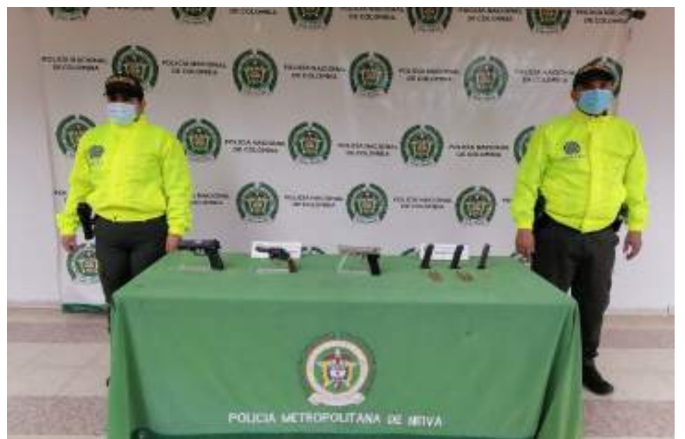
Armas y munición incautada en el barrio Buenos Aires, al parecer es utilizada para cometer asaltos y homicidios.