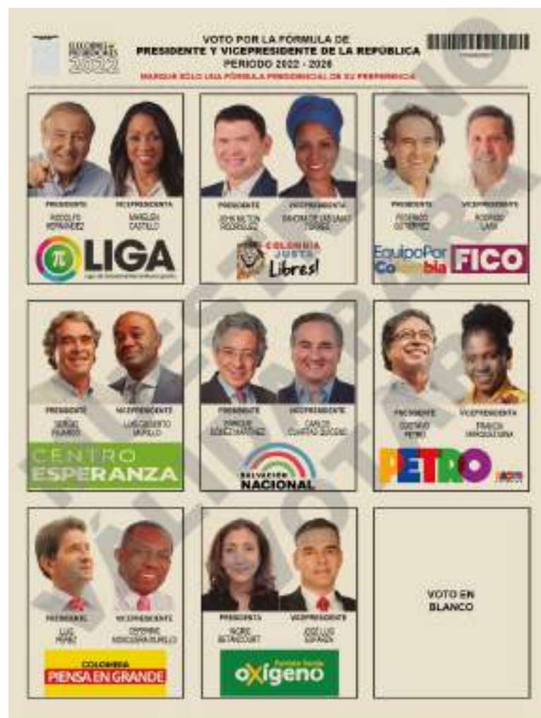
El registrador nacional, Alexander Vega Rocha, presentó en la Subcomisión de Orden Público para las elecciones del 29 de mayo la tarjeta electoral y el formulario E-14 para presidente y vicepresidente de la República.

Esto, luego de que la Registraduría hiciera una auditoría interna, de la se desprendió un informe remitido a la Fiscalía y la Procuraduría sobre las fallas el proceso de transmisión de resultados que de forma inédita tuvo una diferencia nunca antes vista entre los resultados preliminares del preconteo de votos.