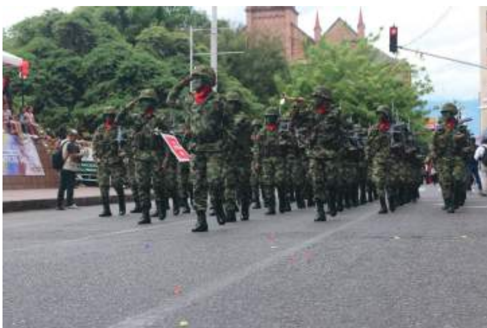
Las autoridades invitan a la ciudadanía a participar de la jornada con la camiseta tricolor o blanca.

Los soldados de la Novena Brigada, integrantes de la Policía Nacional, de la Fuerza Aérea, organismos de socorro, las instituciones educativas y en general el pueblo huilense, rinden tributo a tan significativa fecha, la que marcó la libertad de los colombianos.