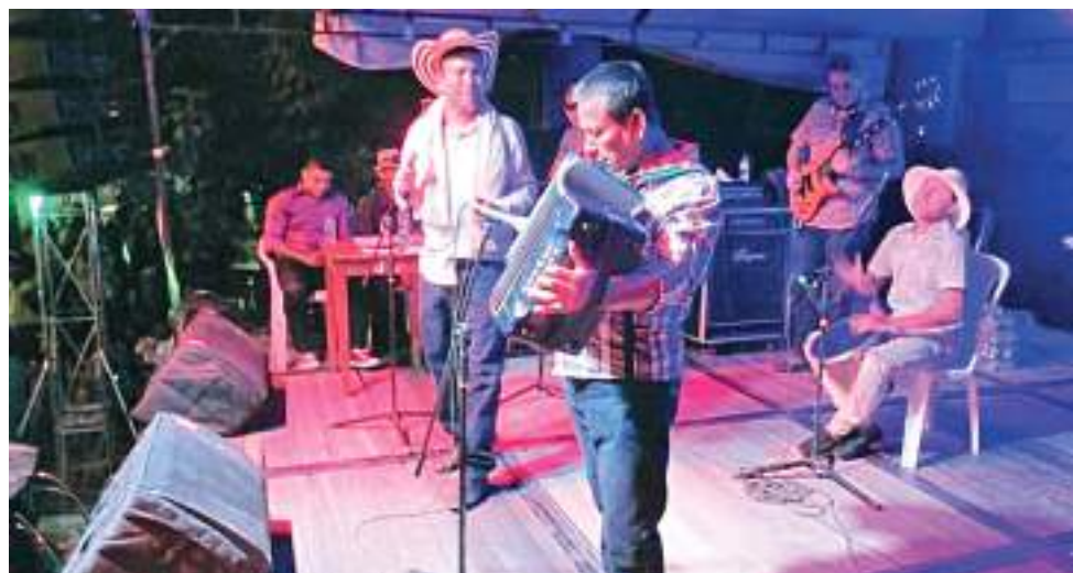
La música vallenata estará presente como desde hace 16 años.

Después de dos años de ausencia vuelven de manera presencial las tradicionales fiestas del 20 de julio en Velú, Tolima con la versión XVI del festival de acordeones.