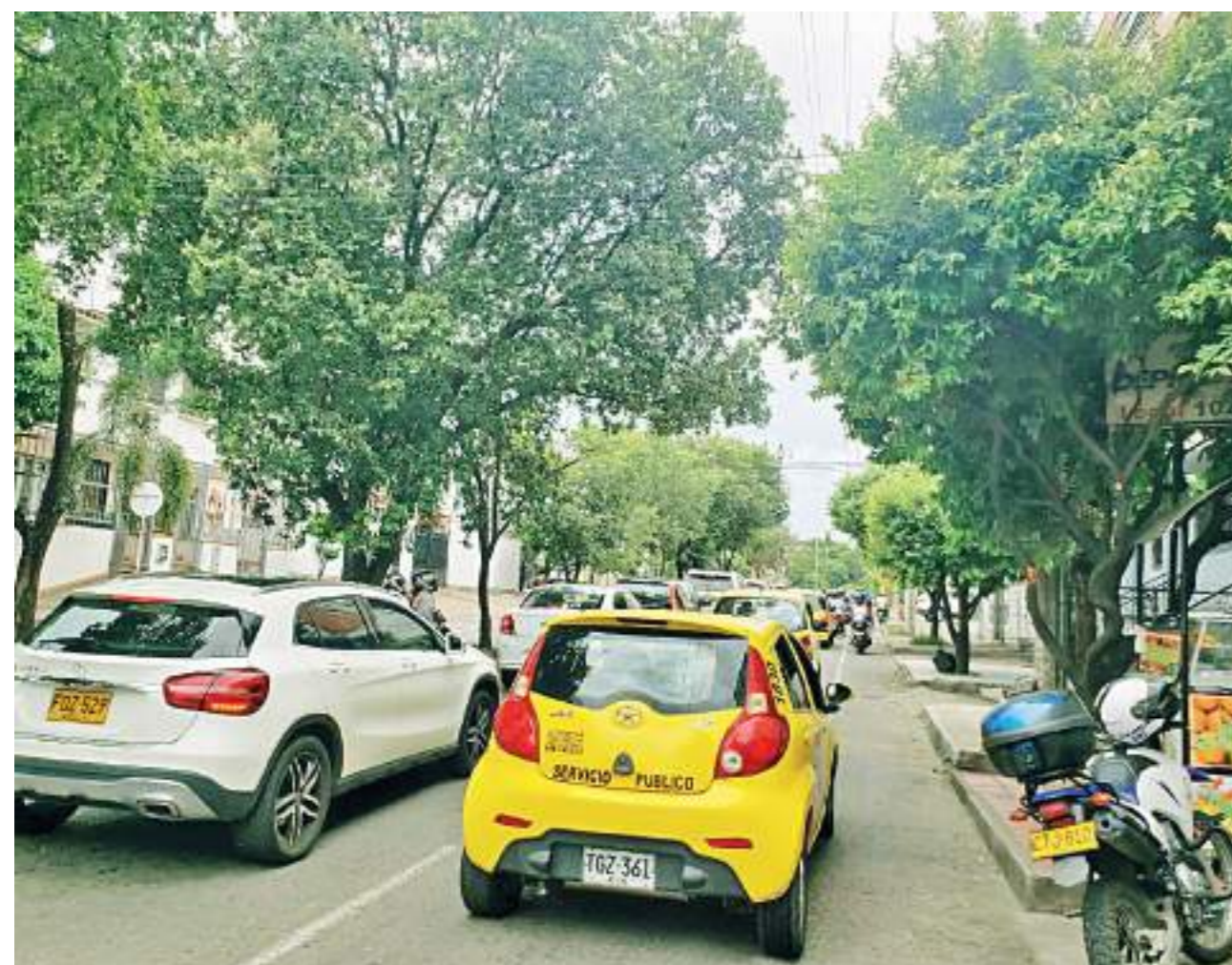
A la hora pico el trancón se forma en los dos sentidos.

Los permanentes trabajos que se realizan en el marco de la recuperación de la malla vial, sumados a intervenciones de redes de acueducto y alcantarillado, son motivo de permanentes reclamos por parte de los neivanos. Se agrega a esto el aumento del parque automotor que crece a una velocidad mayor que las vías. La movilidad en Neiva se dificulta sobre todo en las horas pico.