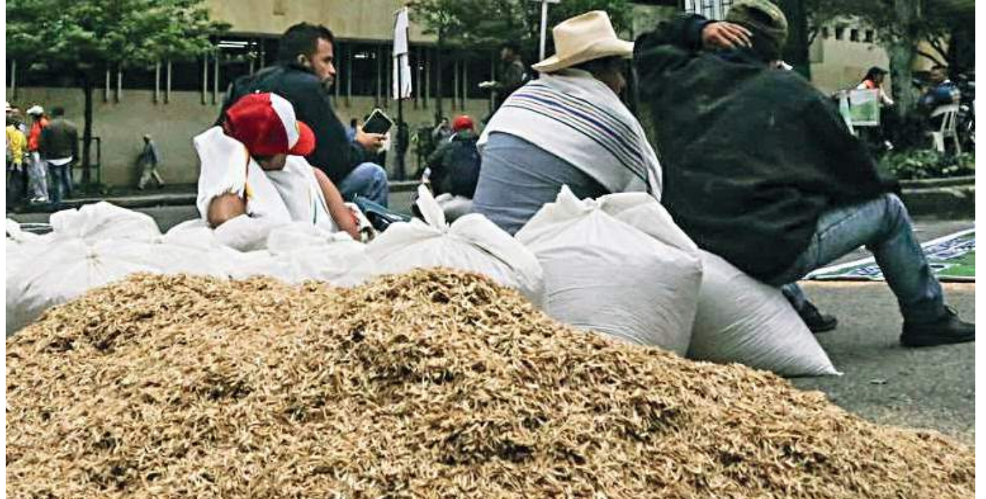
La libra de arroz podría estar en el mercado a $2.600 con una alta variación según las últimas semanas.

“Nosotros hemos decidido sembrar algodón por dos razones, una