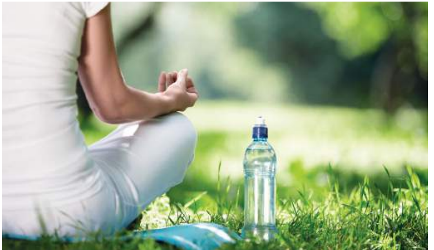
Desarrollar hábitos de vida saludables, incluso en la adultez, es clave para el manejo y prevención de la fibromialgia.