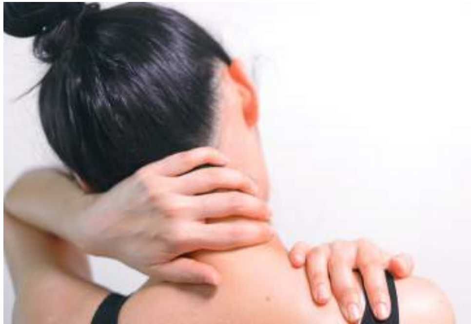
La fibromialgia causa un dolor generalizado, es decir crónico, en varias partes del cuerpo, por más de seis meses; sumado a fatiga y sueño no reparador.