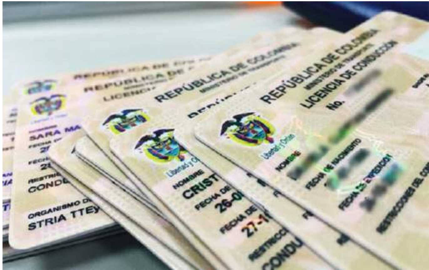
Preocupa la desinformación de la ciudadanía que no está haciendo el trámite para la refrendación del documento.

“La invitación es que no esperen a que les llegue la fecha límite a aquellos que tienen esa condición especial, sino que lo hagan inmediatamente, porque generalmente se pueden presentar demoras o retrasos por la congestión del sistema debido a la alta cantidad que se tiene que hacer renovación. Nosotros queremos hacer un llamado muy especial a todos los ciudadanos porque realmente la cifra de renovación que se requiere en el departamento es muy alta. Por favor, es importante que se pongan al día y no esperen a que todo se congestione porque es importante que por cualquier vía que se desplacen le den cumplimiento al Código Nacional de Tránsito”,