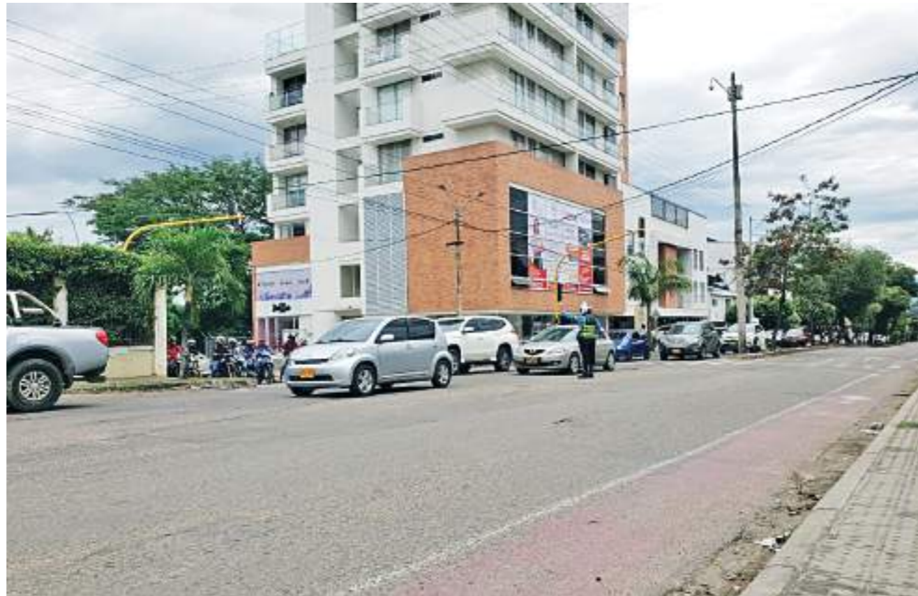
Calle 8 con 32 en el oriente de Neiva, lugar de permanentes trancones.

Una de las versiones que encontramos sobre el sentido único de la vía solo subiendo, es que residentes de las Brisas y Prado Alto fueron los que pidieron que la dejaran solo de esa manera porque era tal la afluencia de carros y motos a la hora pico, que se demoraban hasta una hora para poder ingresar a sus lugares de residencia.