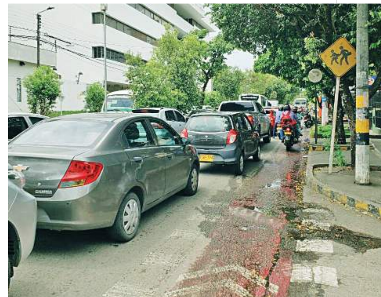
Fila de vehículos frente a la sede de CorHuila en Prado Alto.

En el momento de la visita, hacia el mediodía en plena hora pico, se pudo observar una larga fila de vehículos en los dos sentidos, y a una sola agente de tránsito.