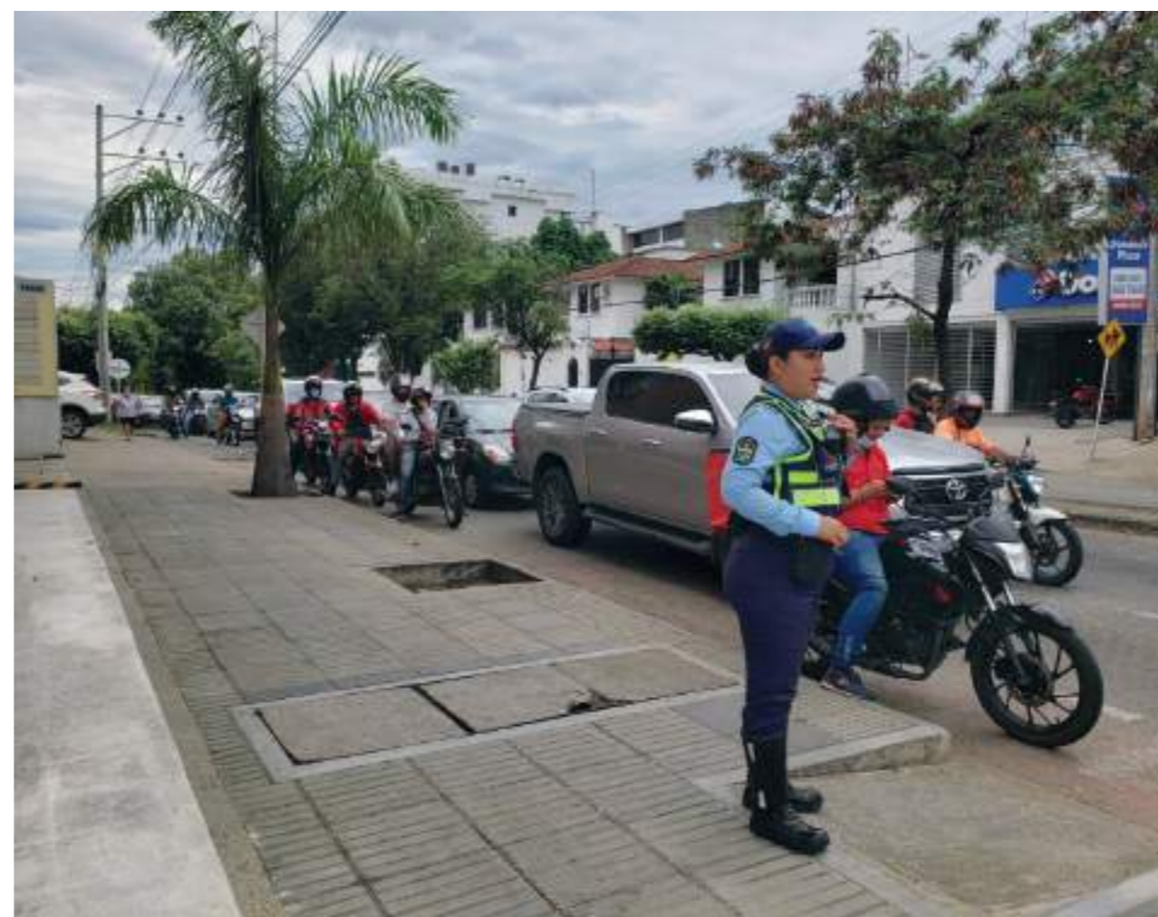
Agentes de tránsito hacen presencia en las horas de mayor afluencia de vehículos.