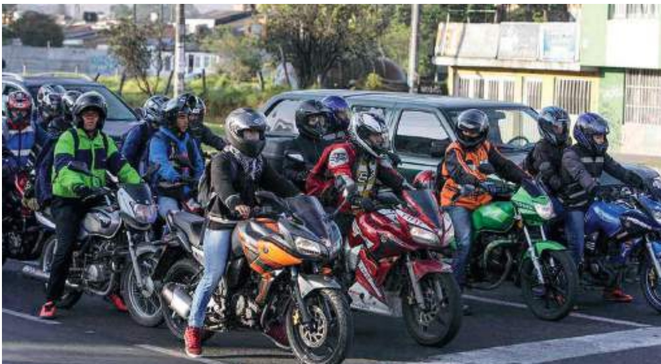
Más de 7.000 comparendos que se han impuesto durante los últimos 5 años por la licencia de conducción en el departamento huilense.

En el Huila hay alrededor de 400 mil personas que tienen pendientes la renovación de las licencias de conducción y los ciudadanos pueden realizar esa tramitología en cualquier organismo de tránsito. Por eso, los invitan a ejecutar la renovación de documento.