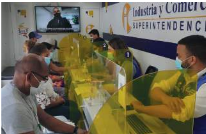
A través de la Ruta del Consumidor, la Entidad ofrece orientación gratuita a los ciudadanos en temas relacionados con la protección de sus derechos como consumidores.

La Ruta del Consumidor es una iniciativa que busca llegar a todas las ciudades y municipios de Colombia a través de cinco (5) unidades móviles (buses y camionetas), que recorren el territorio nacional brindando orientación a los ciudadanos en materia de derechos del consumidor, los cuales involucran desde la compra de un producto o servicio, la