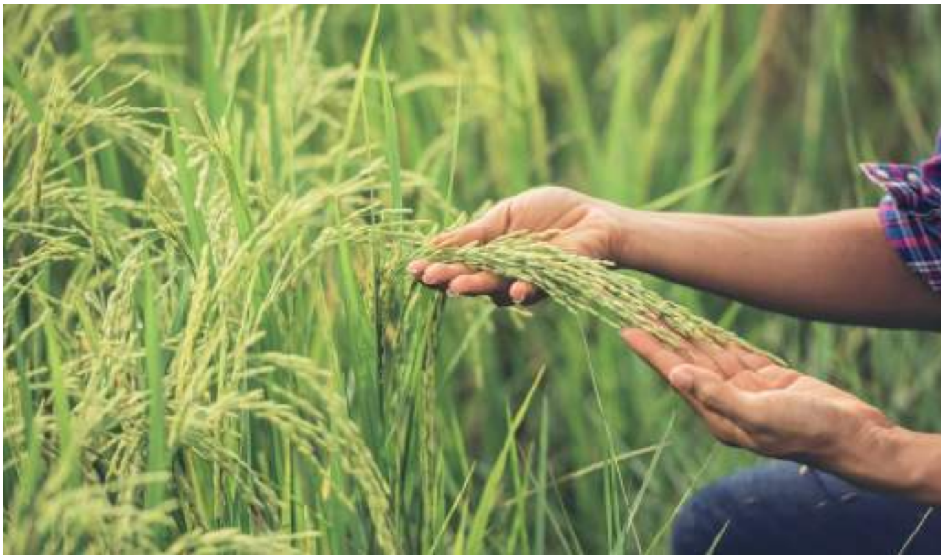
Cultivadores de arroz estarían trabajando a “pérdidas” tras los altos costos de producción y el bajo costo de la carga del cereal.

Este panorama en conjunto y sumándole el accionar de los