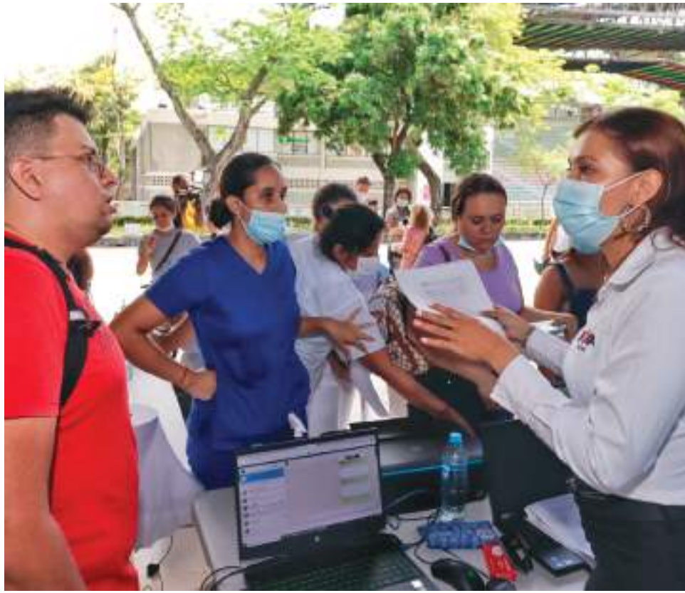
El proceso de inscripción dio inicio el 14 de julio de 2022 y se extenderá hasta el próximo 31 de diciembre

trado en el núcleo familiar a niños, niñas y adolescentes menores de 18 años.