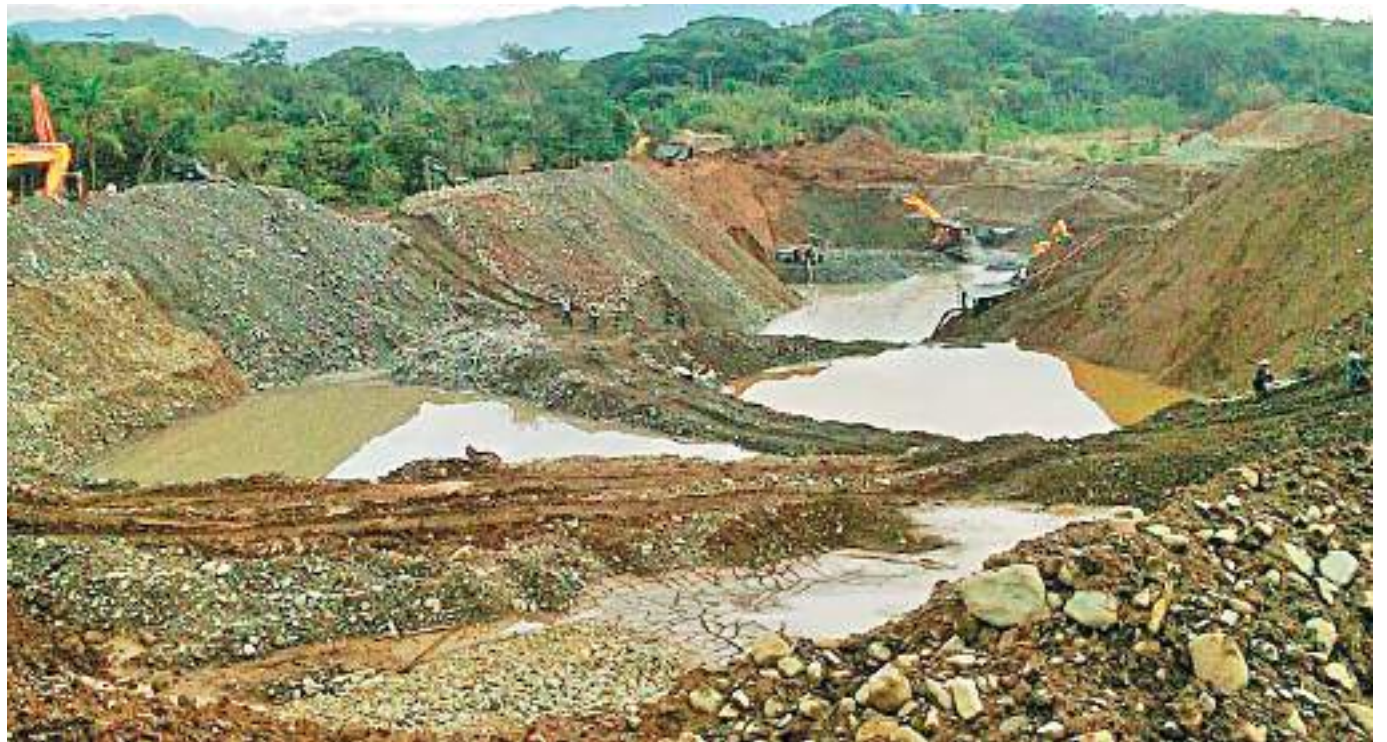
43 proyectos de minería y explotación de material en las principales fuentes hídricas se estarían por llevar a cabo en el Huila.