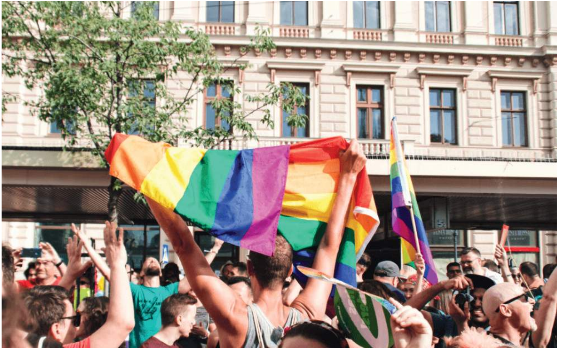
En los últimos años, el debate acerca de algunos términos y construcciones en el lenguaje ha sido muy habitual.

■ Le damos 5 claves para entender en qué estado se encuentran los idiomas en su camino hacia la igualdad y la inclusión. Desde el español, hasta el inglés, el francés o la situación en los países nórdicos.