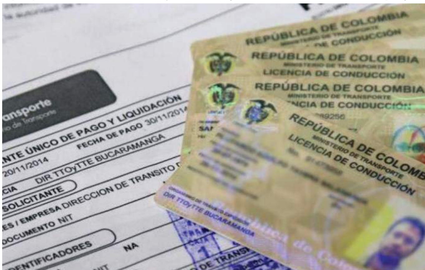
Alrededor de 4 millones de colombianos se les vencía la licencia de conducción entre el 1 y 31 de enero del 2022.

“En este momento, el panorama en el Huila es complicado dado que la gente está bastante desinformada, lo que genera poca asertividad en el cumplimiento de la norma. Sin embargo, teniendo en cuenta el aumento de guardas de tránsito en la región se espera el cumplimiento de la norma y que la gente decida realizar el trámite.”