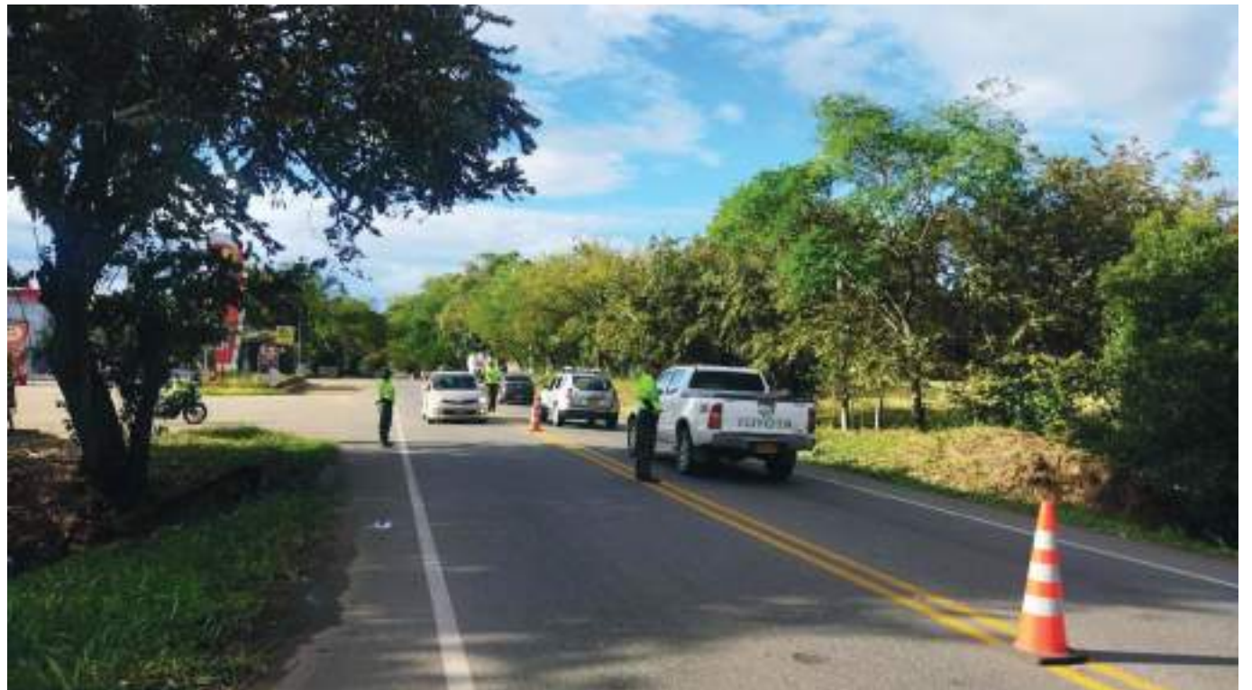
A la fecha, en la presente vigencia 2022 el Instituto de Transporte y Tránsito del Huila ha hecho cerca de 4.036 licencias entre iniciales y renovación.

Tras estudiar la demanda presentada ante el Alto Tribunal, se decidió de manera unánime declarar la inconstitucionalidad del artículo 11 de la Ley 2161 de 2021, considerando la violación al principio de consecutividad e