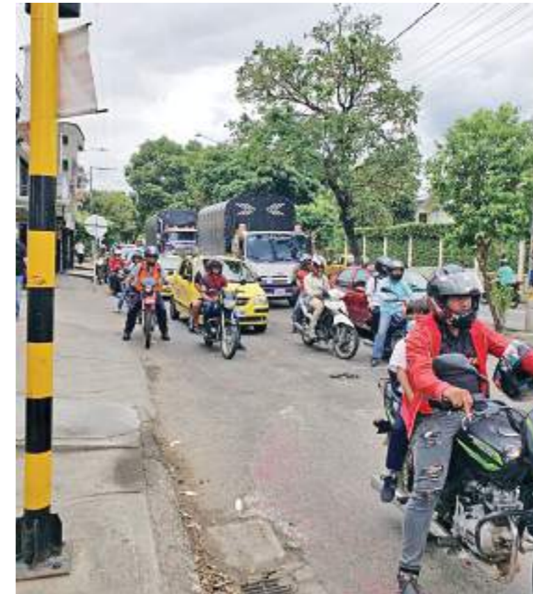
Los motociclistas se movilizan en gran proporción.