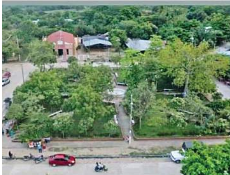
Velú centro poblado en límites del Tolima y el Huila.