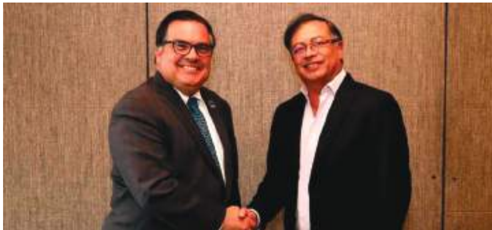
El embajador (e) de Estados Unidos en Colombia, Francisco Palmieri, se reunió ayer con el presidente electo, Gustavo Petro, previo a la reunión que se hará con la delegación de EE.UU. el próximo jueves.

Este encuentro se realizó como antesala de la reunión bilateral que tendrá el presidente Petro el próximo jueves con dos enviados del mandatario estadounidense, Joe Biden, quien se ha mostrado dispuesto a entablar