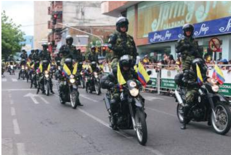
Luego de dos años vuelve el icónico desfile militar del Día de la Independencia.

Entre tanto, a las 9:00 de la mañana está previsto el inicio del tradicional desfile Militar, de Policía e interinstitucional y además contará con la participación de las bandas marciales de las instituciones educativas, Bomberos,