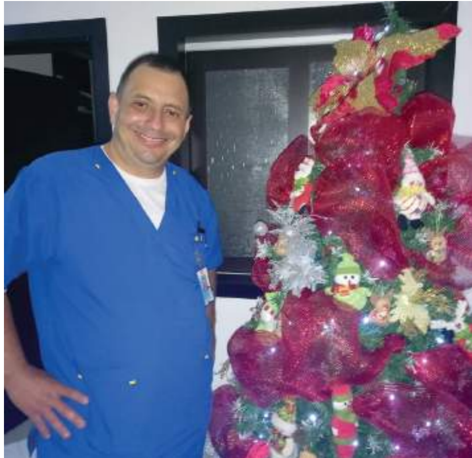
Su profesión necesita ante todo vocación de servicio, dice.