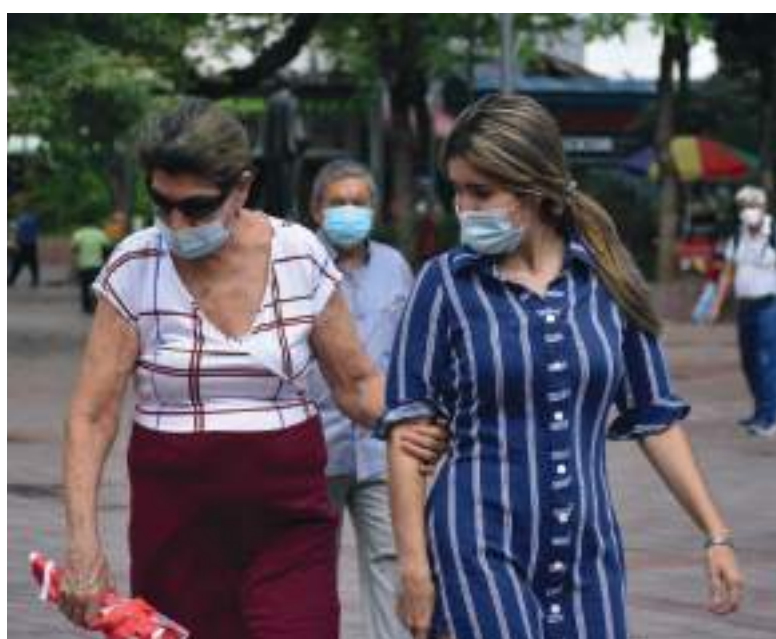
Nueve personas fallecieron hoy en el Huila como consecuencia de los síntomas graves de Covid-19.

De igual manera, durante el último día se aplicaron un total de 102.787 vacunas, de las cuales 38.522 corresponden a la segunda inyección mientras que otras 7.340 fueron monodosis.