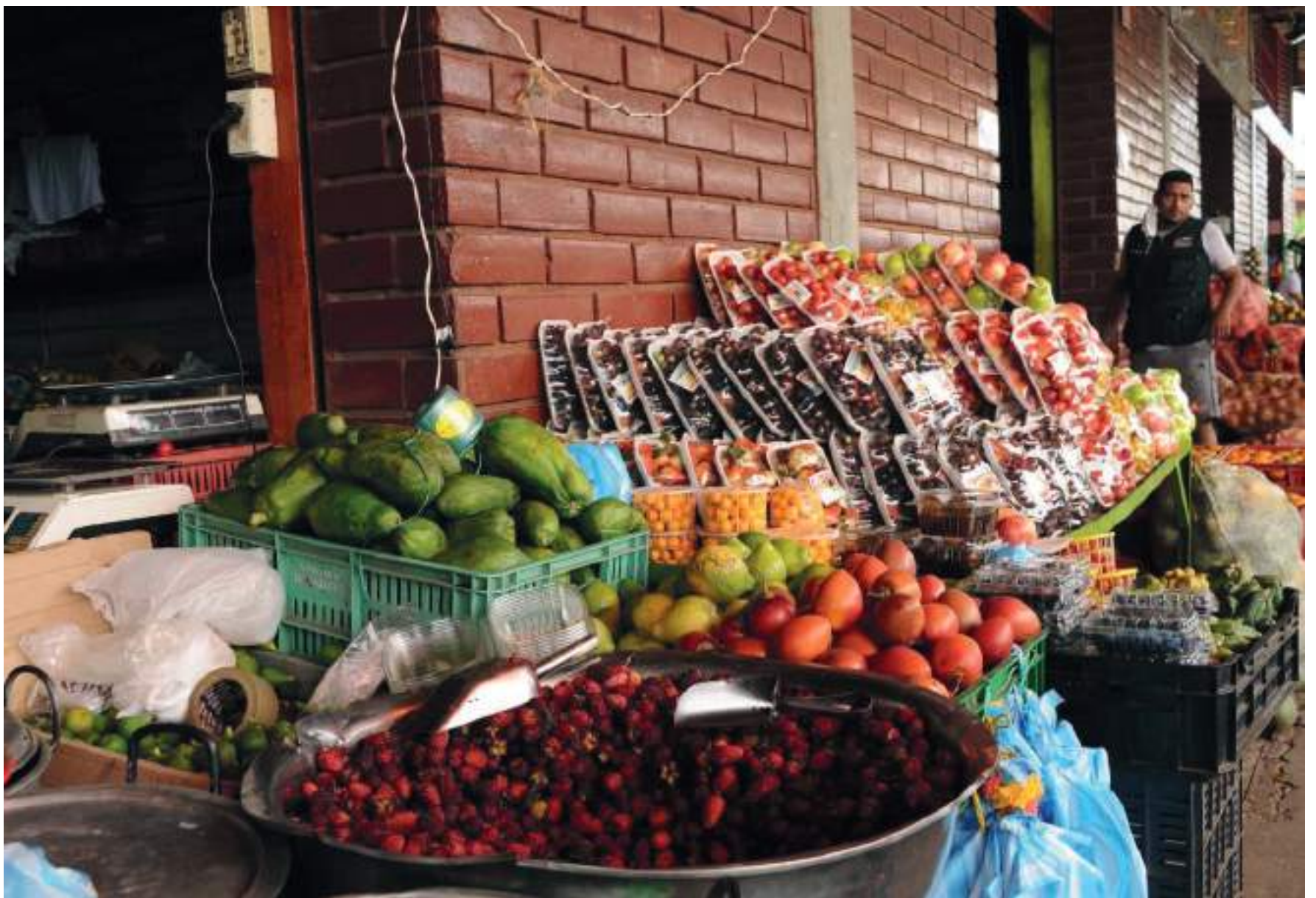
El principal efecto que se busca es frenar las alzas de los precios de la canasta familiar, que el año pasado se incrementaron en 5,62%.

■ Desincentivar el consumo y mayores costos de los créditos, entre los efectos del aumento de la tasa de interés. En los créditos a corto plazo, y en los corporativos, la transmisión de tasas se verá de manera más rápida. Los factores que llevaron a la junta a tomar esta decisión tienen que ver con la rapidez en el crecimiento de la inflación. La subida de las tasas de interés tiene la intención teórica de hacer un poco más escaso el dinero y de encarecer los créditos.