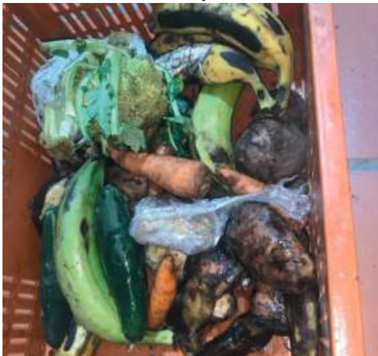
Padres de familia manifiestan el mal estado de cómo llegaron los productos.

El ente de Control identificó con los reportes oficiales, que durante el 2021, un total de 11 ETC es decir 11,45%, presentaron suspensiones del servicio resaltando que las principales causas de la suspensión, son debido a la falta de planeación, la falta de garantía de la prestación del servicio durante todo el calendario académico y problemas de orden públicos