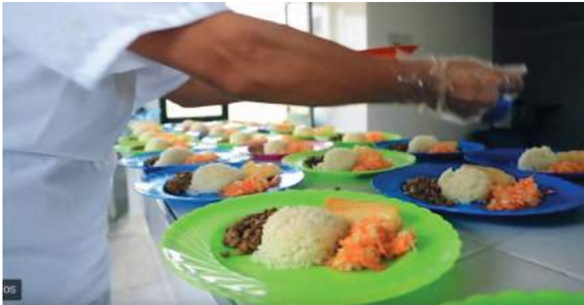
Pitalito y Neiva, están entre las ETC con mayores incumplimientos del PAE durante el año 2021, según informe de la Contraloría General de la República.

Mientras que en Pitalito, el retraso en el inicio del PAE fue de 90 días, y se hizo prestación de este servicio solo 109 días. “Inicia tarde la atención de PAE. No garantiza continuidad en la prestación del servicio para los 180 días del calendario escolar en