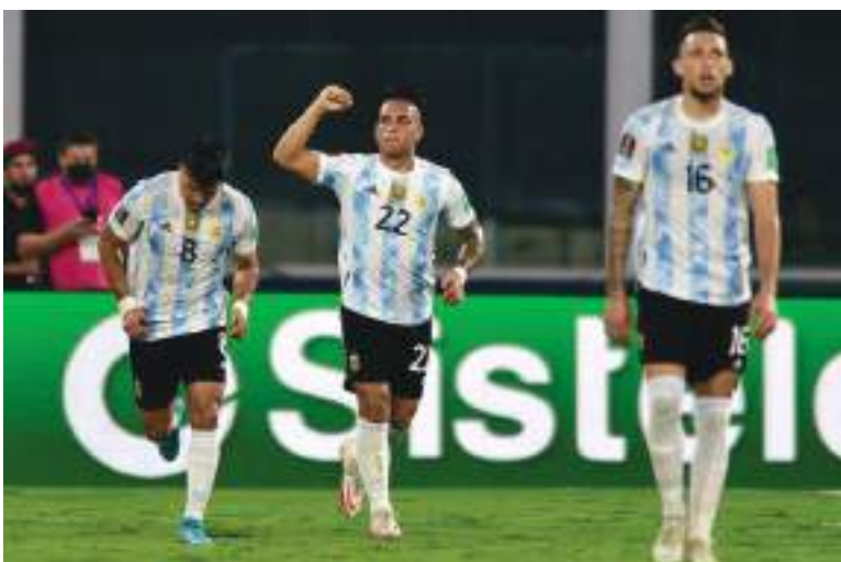
En la próxima fecha Colombia enfrenta a Bolivia.

Colombia cada fecha más lejos del mundial de Catar. Los orientados por Reynaldo Rueda cayeron 0 a 1 ante Argentina y dependen de otros para clasificar.