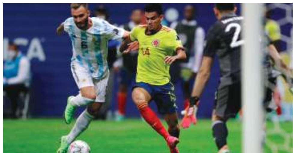
Colombia no tuvo ideas, la creación y el gol no aparecen