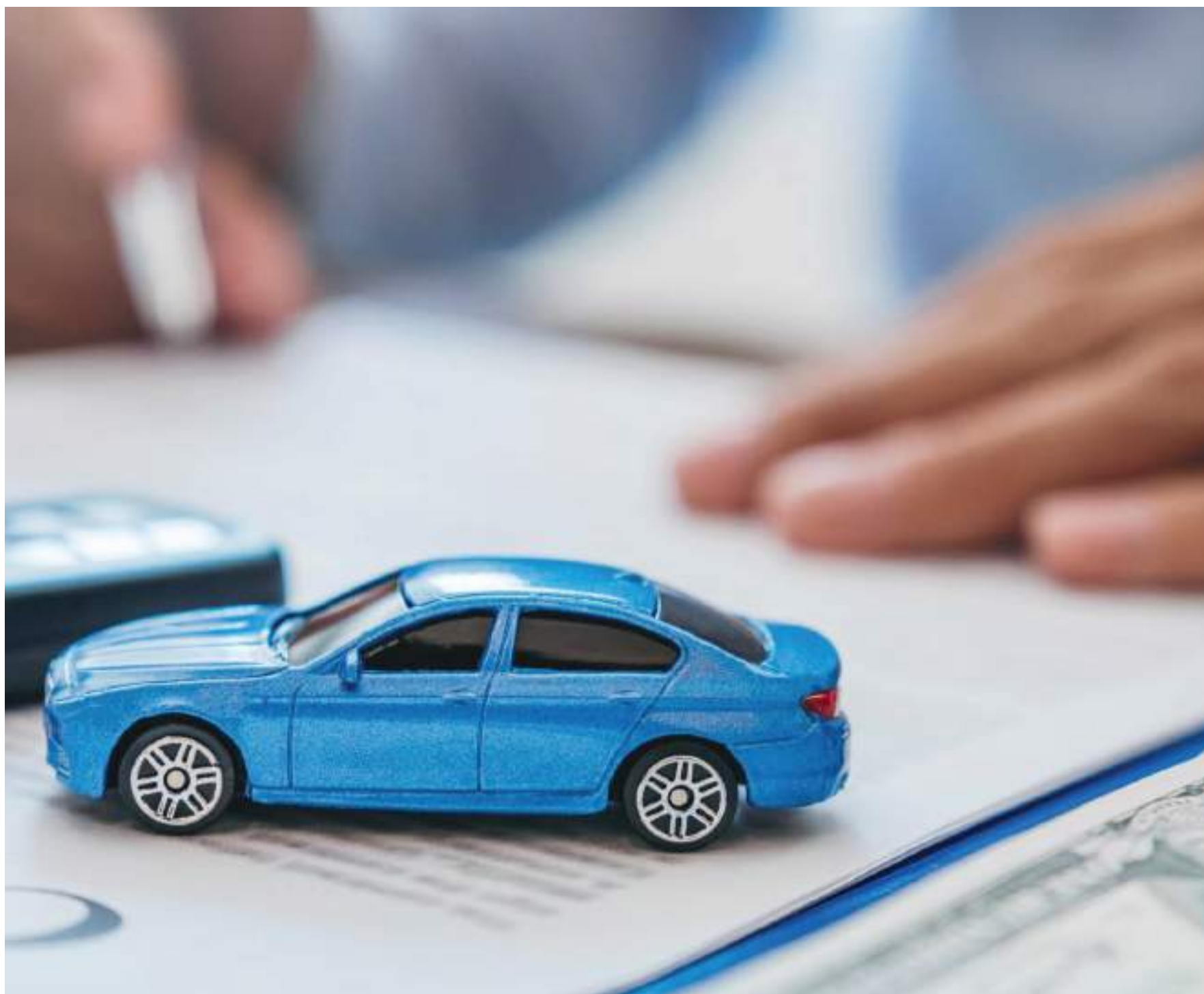
En los créditos de largo plazo, como los de libre inversión, de vehículo o hipotecario, la transmisión de las tasas será más lenta.

Encarecer el crédito y el consumo puede ser una apuesta arriesgada en momentos en los que la economía tenderá a desacelerarse. Pero, también hay que atacar la inflación que, si se deja crecer, termina empobreciendo a los asalariados, lo que tampoco es para nada deseable. La subida de tasas obedece más que nada a una visión ortodoxa de la economía en la que la herramienta en la que más confían para controlar la inflación es la tasas de interés.