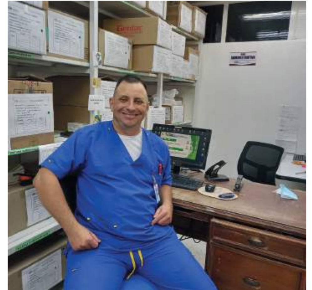
En su lugar de trabajo dispuesto a atender a la gente.