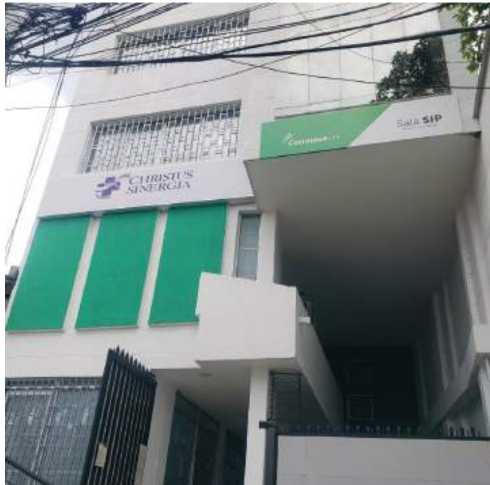
Tras la distribución, los usuarios de Coomeva EPS en liquidación podrán conocer a qué EPS fueron asignados ingresando a Consulta afiliados asignados a otras EPS.

A partir de este martes, también empezó a contar el tér-