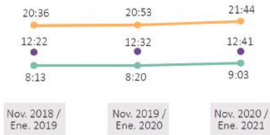
Tiempo semanal dedicado a actividades de cuidado indirecto.

El Covid-19 ha tenido efectos diferenciados por sexo en materia de cuidado. En particular, las cifras presentadas podrían indicar que la pandemia afectó más a las mujeres que a los hombres, pues si bien ambos aumentaron sus