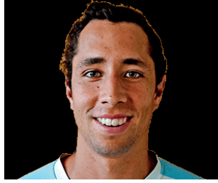
Daniel Galán Avanzó a octavos de final del ATP 250 de Córdoba, el colombiano derrotó en dos sets al boliviano Hugo Dellien.