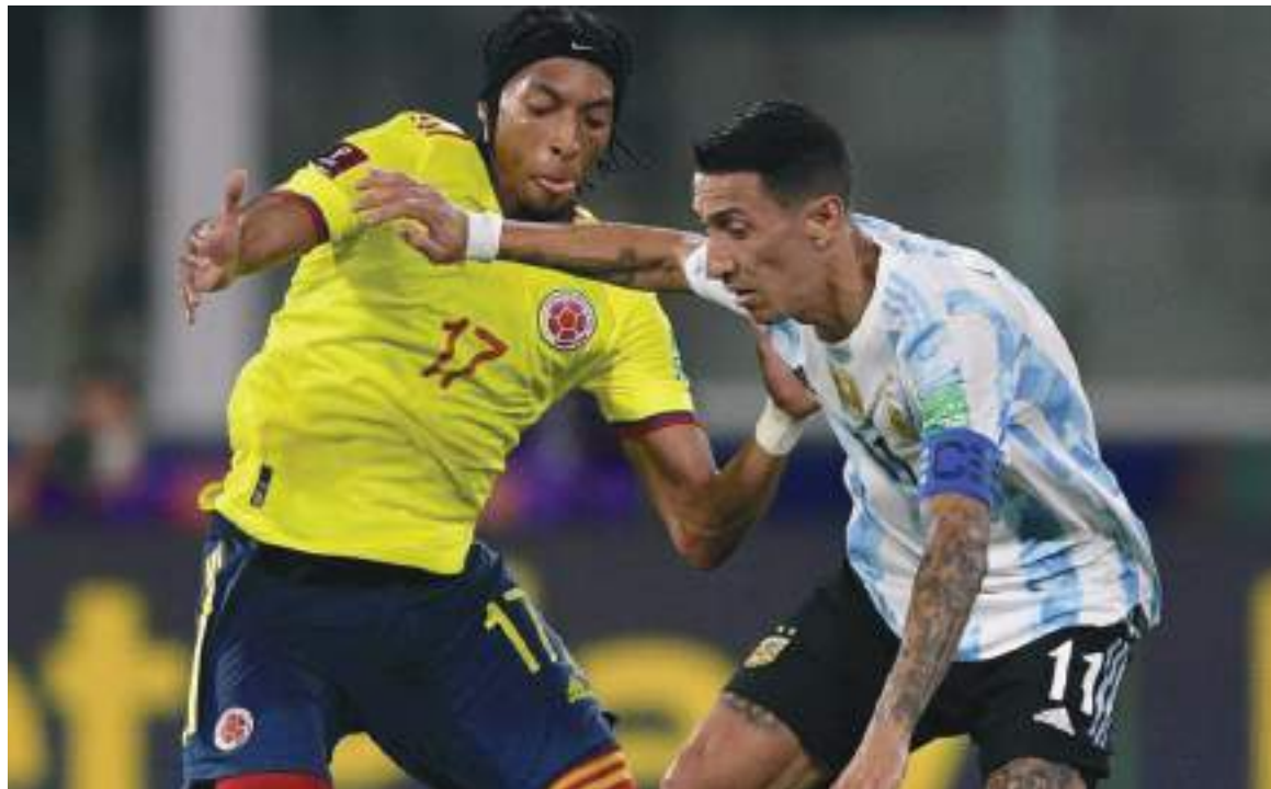
Argentina venció a Colombia y se mantiene invicta

El primer asomo de Colombia fue al minuto 13 con una salida rápida de Borja, que desbordó y encontró a Luis Díaz por el me-