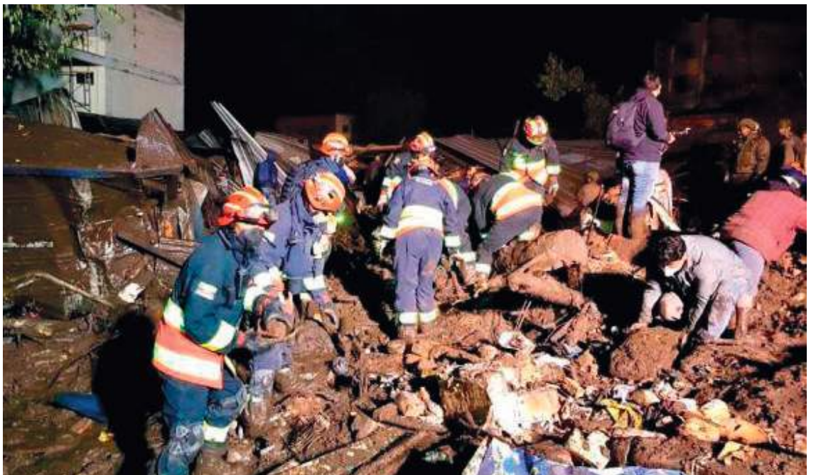
Un alud que se produjo en Quito, tras las lluvias más intensas de las dos últimas décadas, dejó al menos once muertos, nueve desaparecidos y 32 heridos tras arrasar una cancha deportiva del Huila.