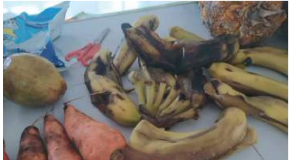
En condiciones como estas han llegado los alimentos para la preparación de las comidas en sedes educativas de La Plata, Iquira y Villavieja.

generados por el Paro Nacional. “Seis ETC (Quindío, Duitama, Ibagué, Magdalena, Nariño, Huila) pese a que tuvieron un inicio oportuno suspendieron entregas. Preocupa más al ente de control, 5 ETC (Lorica, Neiva, Sincelejo, Córdoba, Montería) las cuales adicionalmente a que no tuvieron un inicio oportuno presentaron suspensión del servicio”, señala el reporte.