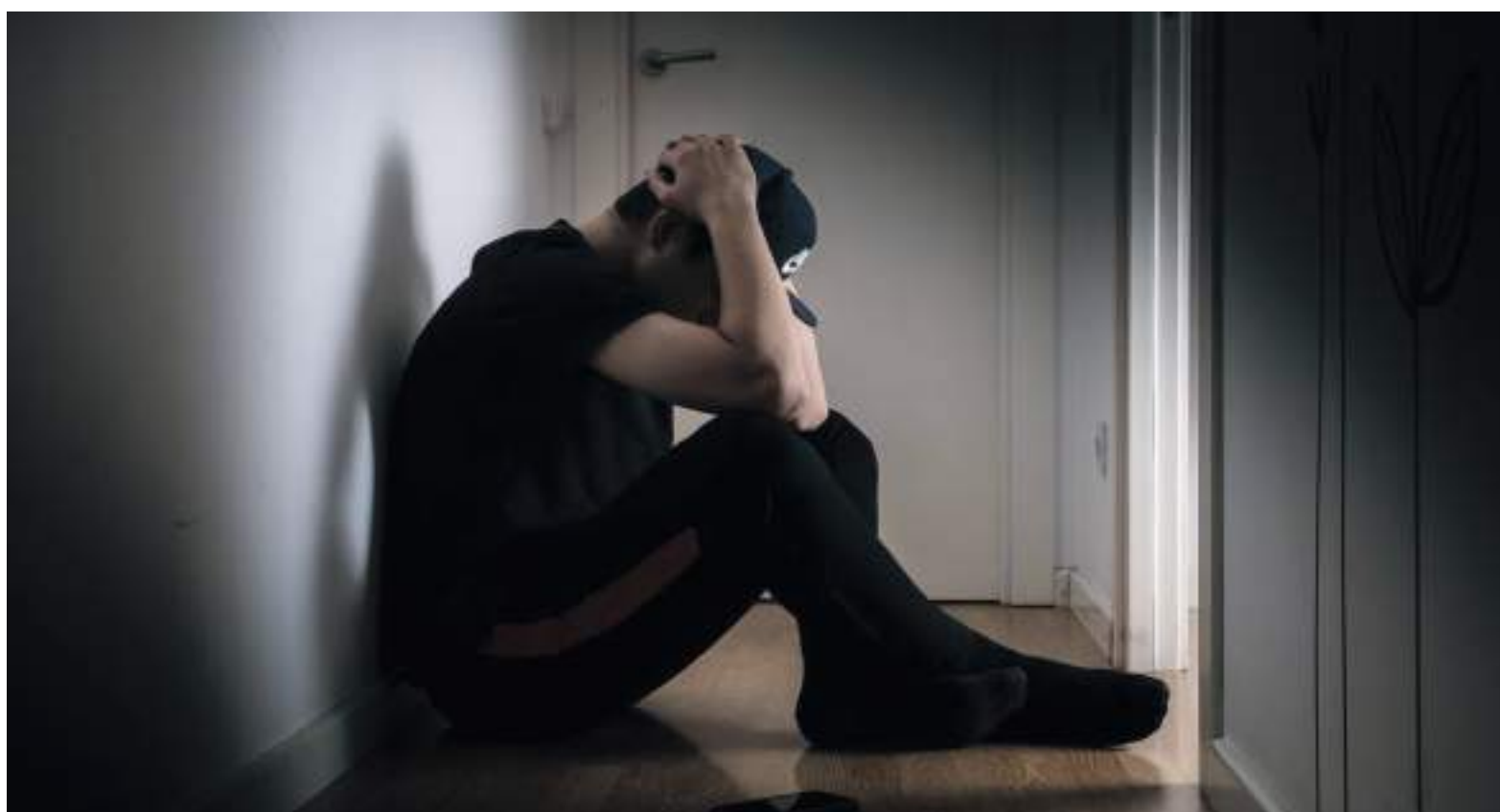
El encierro que generó la llegada de la pandemia de covid-19 al país provocó la agudización en los problemas de salud mental.

co, médica auditora de Ecoop-sos EPS, explicó que, “el proceso de motivación, conciencia emocional y el carácter de las personas depende de la interacción con otras, por lo que, la