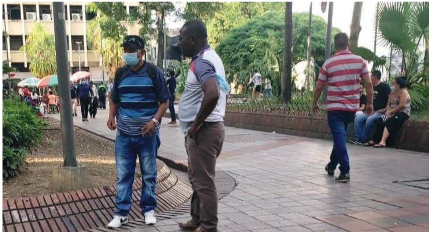
Según el Dane la tasa de desempleo en el 2020 fue la más alta en la última década. Para las mujeres, fue de 20,4%, y para los hombres, de 12,7%, lo cual data una brecha de género de 7,7%.

Es claro que el Covid-19 ha derivado en grandes cambios en las dinámicas del trabajo familiar y en las tareas del hogar y de cuidado. Las medidas de distanciamiento social junto con los confinamientos, derivaron en el cierre de centros de cuidado infantil, guarderías y colegios, lo cual generó que tanto madres como pa-