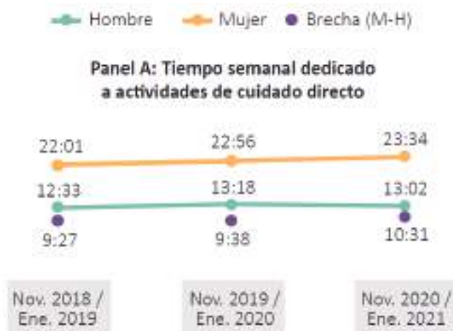
Tiempo semanal dedicado a actividades de cuidado directo.

tiempos de cuidado, los tiempos de las mujeres aumentaron más que los tiempos de los hombres. En las publicaciones mensuales de la Encuesta de Pulso Social (EPS) del DANE, la mayoría de mujeres encuestadas han reportado sentir una sobrecarga de tareas domésticas.