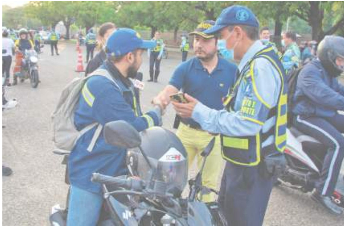
El secretario de Movilidad hizo pedagogía en las calles.