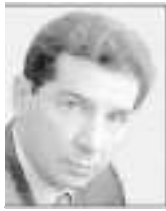
JOSÉ FÉLIX LAFAURIE RIVERA