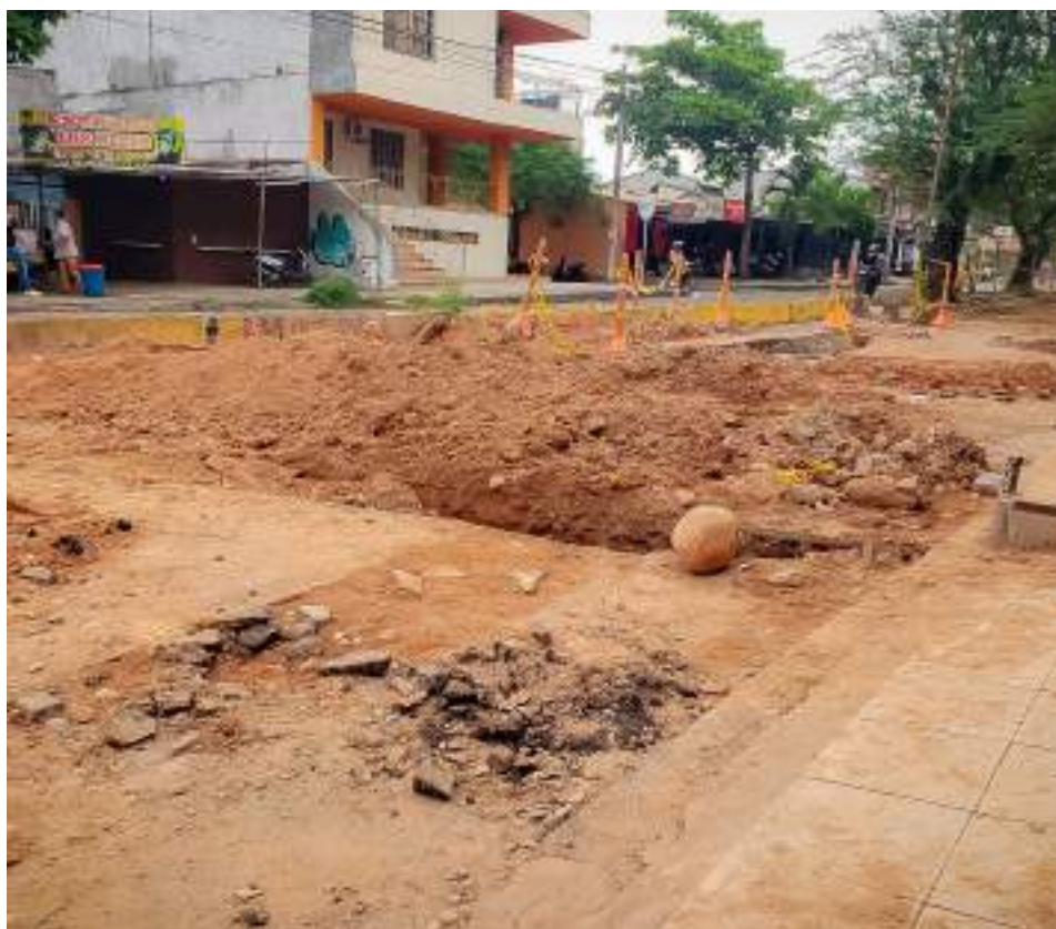
Los más afectados son los comerciantes.

respectivo seguimiento para adelantar las labores de reparación, buscando que retorne el servicio de agua a las viviendas de los sectores afectados”.