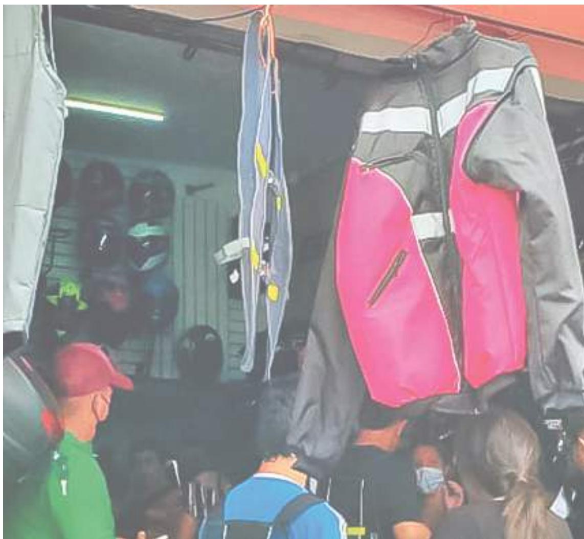
La norma no establece un modelo específico, ni que el chaleco lleve la placa de la moto, solo exigen una prenda reflectiva.

Así pues, también manifestó cómo se llevó a cabo ese proceso pedagógico de la norma, “Como fue un proceso de sensibilización y educación se tomaron registro en mes y medio. Se sensibilizaron 460 personas aproximadamente, según la revisión que tenemos en movilidad. La expectativa es que tengan mucha cultura y cumplan con las normas