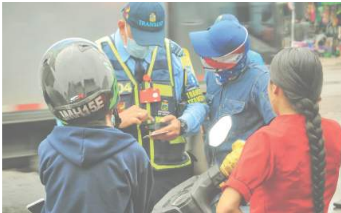
Durante este fin de semana el comparendo continuará siendo pedagógico, pero al inicio de la próxima semana entrará a regir con multa económica.

y código nacional de tránsito, así que, esperamos que acaten esta normatividad sancionatoria con el fin y buscar una regulación en la ciudad”.