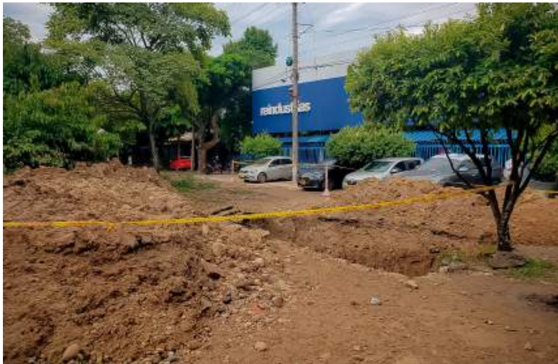
Sector de la carrera 16 donde se presentó la rotura de un tubo de 30 pulgadas.