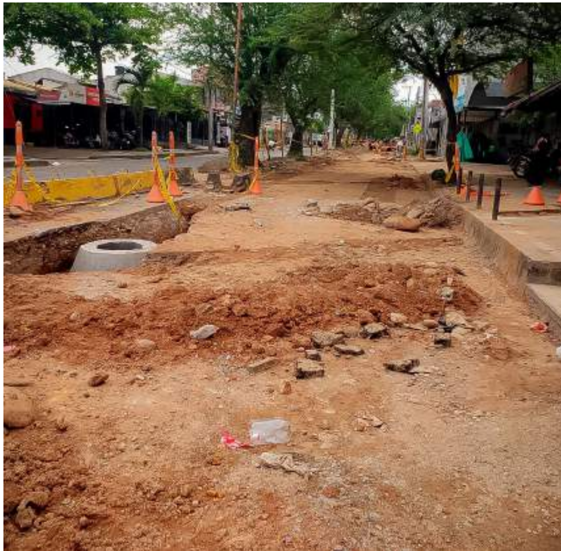
Trabajos de reparación en la zona oriental cerca a Olímpica.

“Se suman ahora los constantes daños generados durante los trabajos de reposición de redes, que es una necesidad sentida en buena parte de la ciudad, hay que reconocer, pero no entiende uno, los permanentes daños que se producen por la alta presión. Malos materiales, mala instalación, ¿qué será?”, se