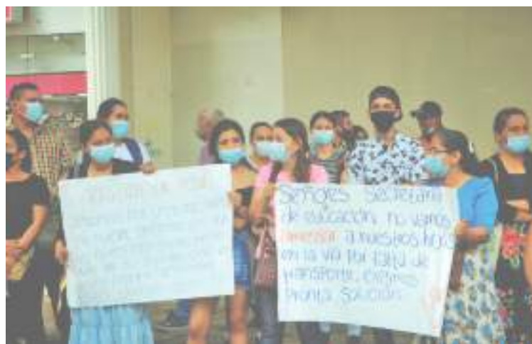
Una comitiva del Corregimiento de Guacirco se acercó hasta la Alcaldía Municipal a pedir el cumplimiento de los servicios que necesita la Institución Educativa Jairo Mosquera Moreno

“Nuevamente enfatizo a los alcaldes que deben llevar a cabo como prioridad el proceso de caracterización para identificar a los niños y las niñas que presentan por diversas circunstancias, riesgo de abandono de sus estudios y poder hacer esa inversión de transporte escolar para lo cual el Gobernador tiene listo recursos de regalías”, manifestó