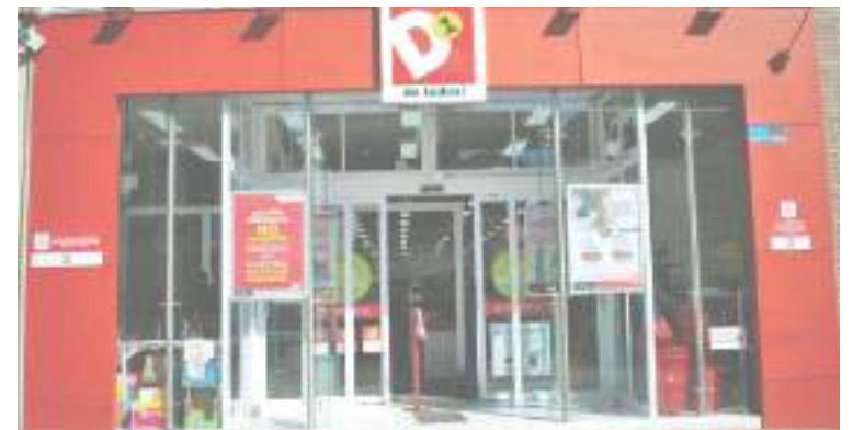
Anunció que dejará de llamarse Koba Colombia S.A.