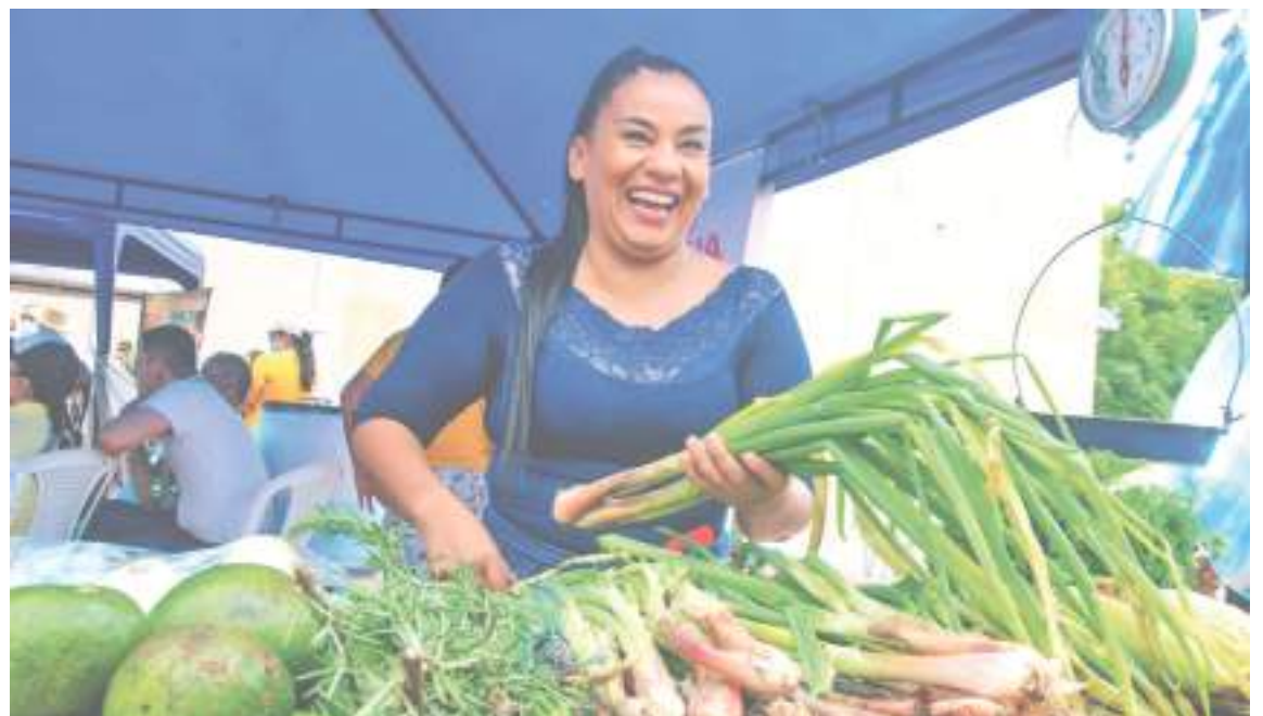
El mercado campesino ha logrado apoyar y fortalecer a los productores del Huila que se han visto fuertemente afectados por las lluvias atípicas presentadas.

En la Plaza de Banderas de la Gobernación del Huila se congregaron más de 40 productores y empresarios de la región, quienes buscan seguir creciendo de la mano de productos innovadores, en el primer mercado campesino del año.