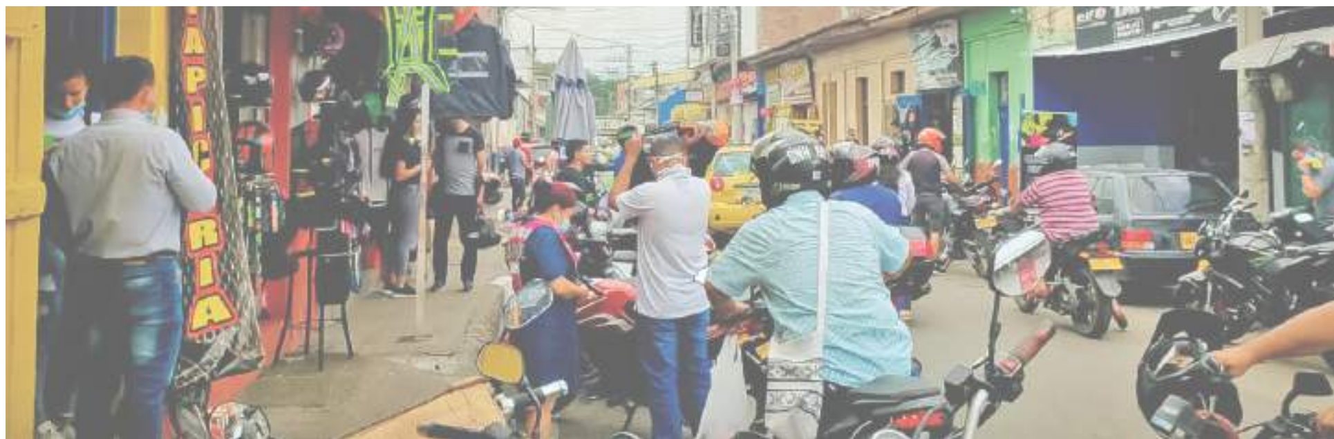
Panorama en el centro de la ciudad de Neiva, horas previas a la implementación sancionatoria de la ley, que finalmente continuó siendo pedagógica, hasta este próximo lunes.