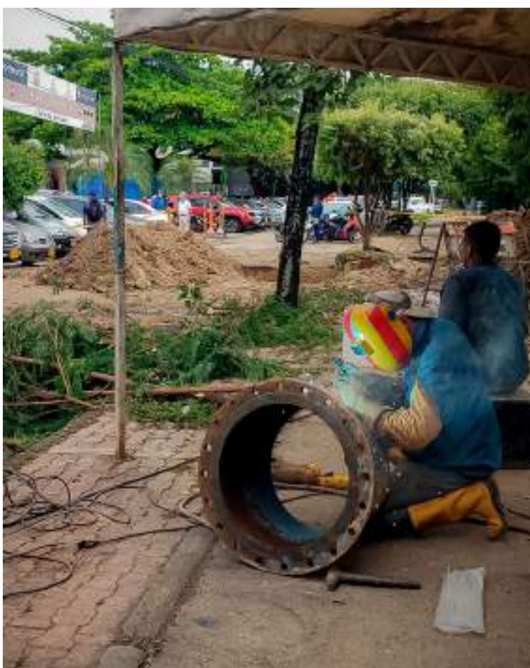
Trabajos de reparación adelantados en la zona.