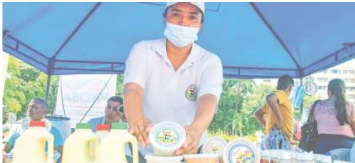
Toda clase de dulces, productos lácteos y demás ricuras naturales se exhibieron en este evento.