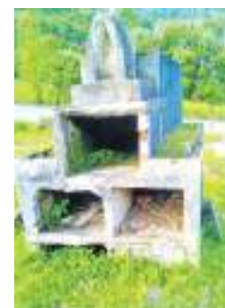
Una bóveda sin nombre

Nota: hay otros restos mortales sin identificar, los interesados acercarse a la oficina de la parroquia de Nuestra Señora del Carmen de Santa María Huila, de lo contrario los restos van a fosa común.