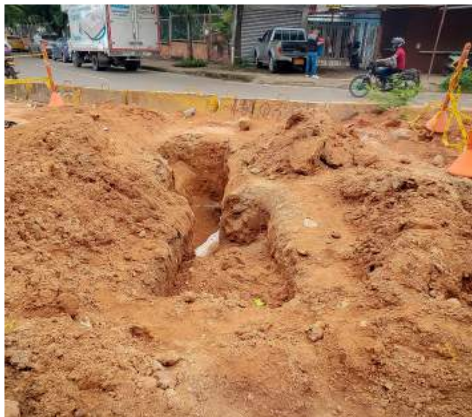
Los trabajos forman parte de la restitución de redes en la ciudad de Neiva.