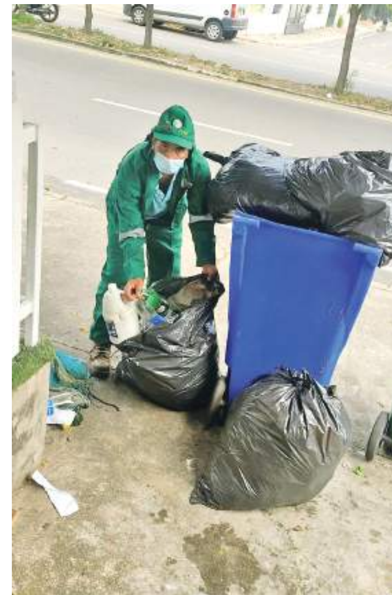
En sus ratos libres, compone versos inspirados a su oficio de recuperador.

Disfruta de su vida y le gusta la idea de poder ayudar a mejorar el medio ambiente por medio del reciclaje, que asegura, “deberíamos practicarlos todos”.