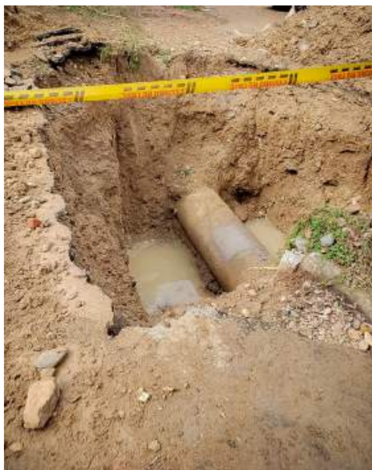
Tubo reparado listo para ser tapado y poder abrir la válvula.

diario vivir. “Ojalá que haya una pronta solución, porque ya nos ha pasado, que dicen que listo que, en una hora, que en 12 o 24 horas y hemos llegado a 36 y 48 horas sin servicio de agua potable”, dice.