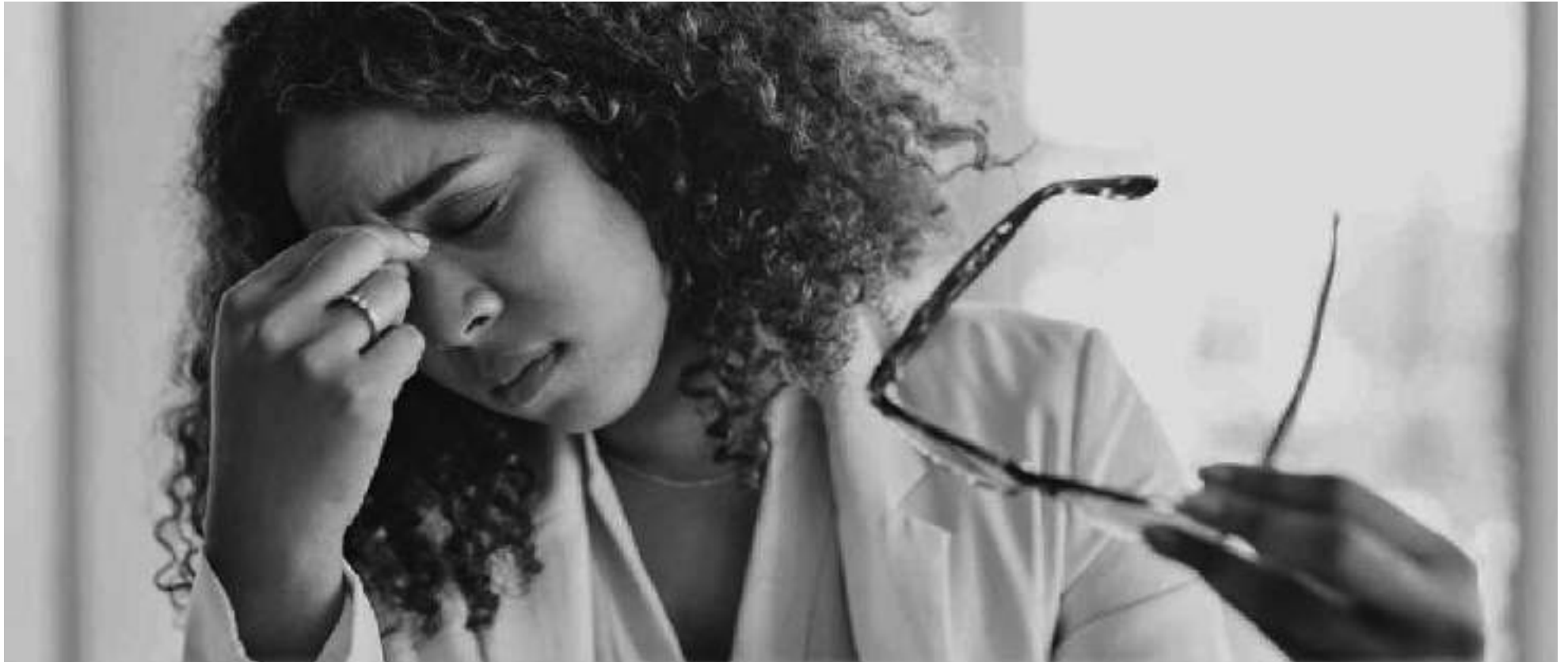
Las frutas y verduras contienen altas cantidades de vitaminas y nutrientes que ayudan a preservar la salud de los ojos.