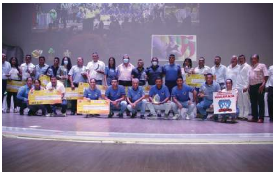
El Gobierno Departamental realizó la entrega del Plan de Estímulos “Huilenses de Oro y Gloria del deporte Huilense” en una gala protocolaria llevada a cabo en el Teatro Pigoanza. ¡Felicitaciones a todos los ganadores!