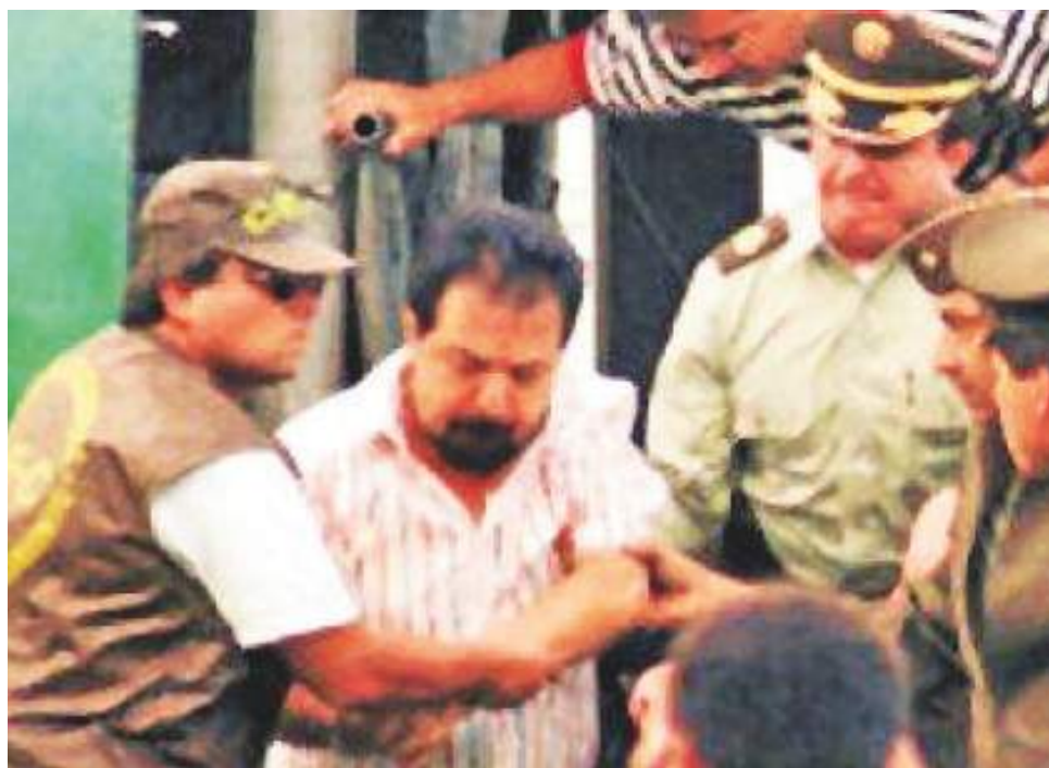
Rodríguez Orejuela fue extraditado a Estados Unidos en 2004, y tenía orden de libertad para el 2 de septiembre del 2030.

Rodríguez aparece como uno de los cerebros de uno de los capítulos más graves de la política del país: el ingreso de dineros ilegales a la campaña presidencial del entonces candidato Ernesto Samper Pizano, que dio origen al proceso 8.000 y que puso en su momento a dar explicaciones a fun-