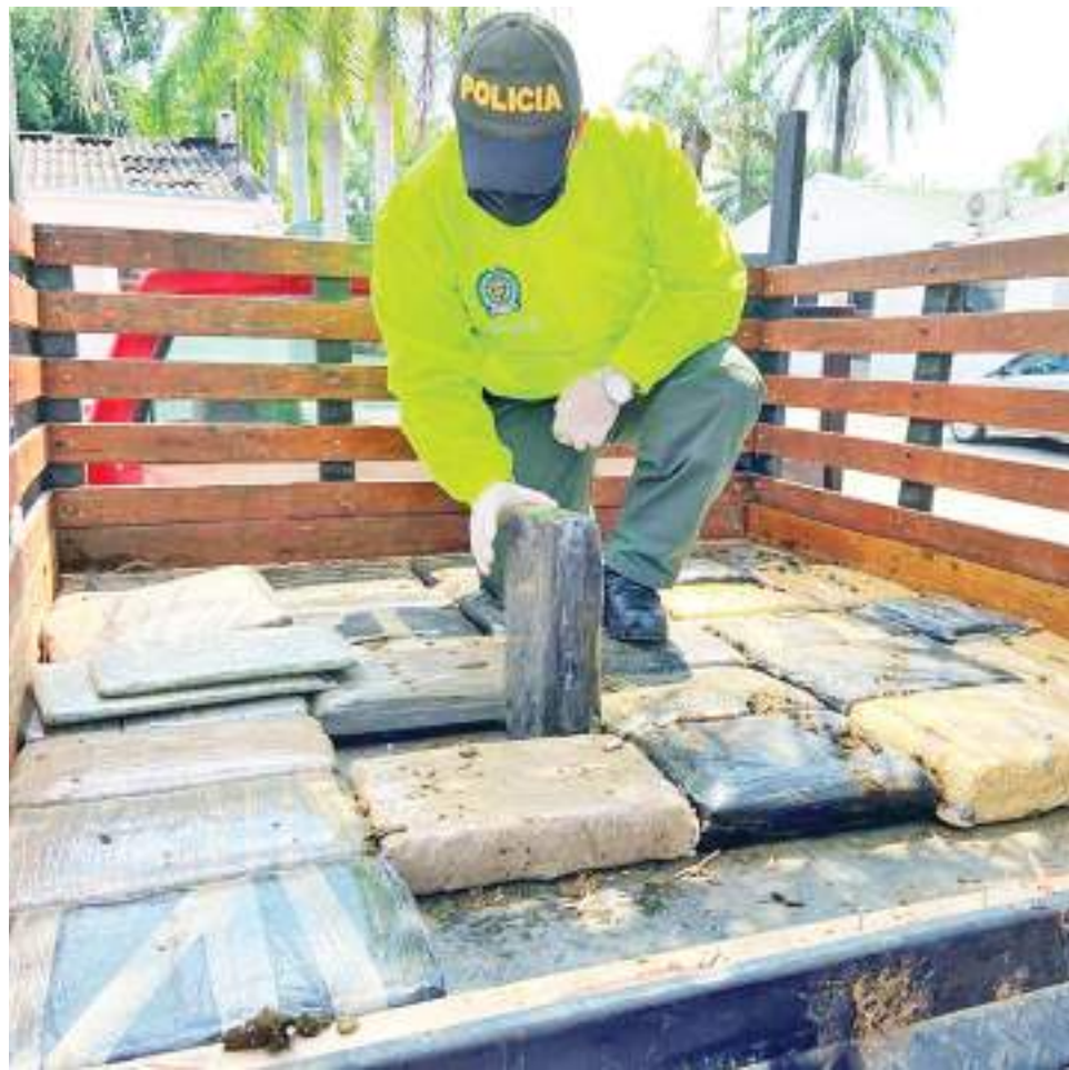
La incautación de estupefacientes ha sido uno de los logros más importantes del año 2022.

Para el caso de delitos sexuales, en el 2021 se registraron 172 y este año van 137, un 20% menos. “Para estos casos tengo que de-