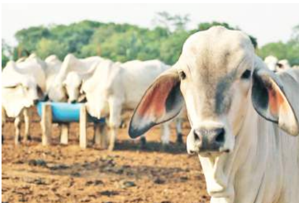
Se busca que la actividad ganadera en el Huila se maneje bajo un enfoque de paisaje ganadero sostenible.

Las ventas externas de bienes no mineros estuvieron impulsadas por los productos agropecuarios y alimentos, que llegaron a US$4.022 millones, el valor más alto para un periodo enero-abril en la historia.