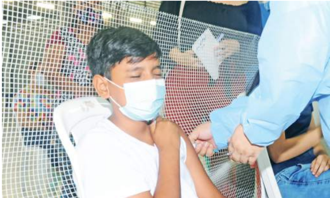
Todos los menores de edad deben ser vacunados para evitar posibles síntomas graves en posibles contagios por Covid-19.

Al tener un contagio con sintomatologías más agresivas es cuando se ve representado un problema especialmente para quienes aún no han recibido la inmunidad. “Sí o sí la invitación a todos los papás es a que por favor llevemos los niños a los puntos de