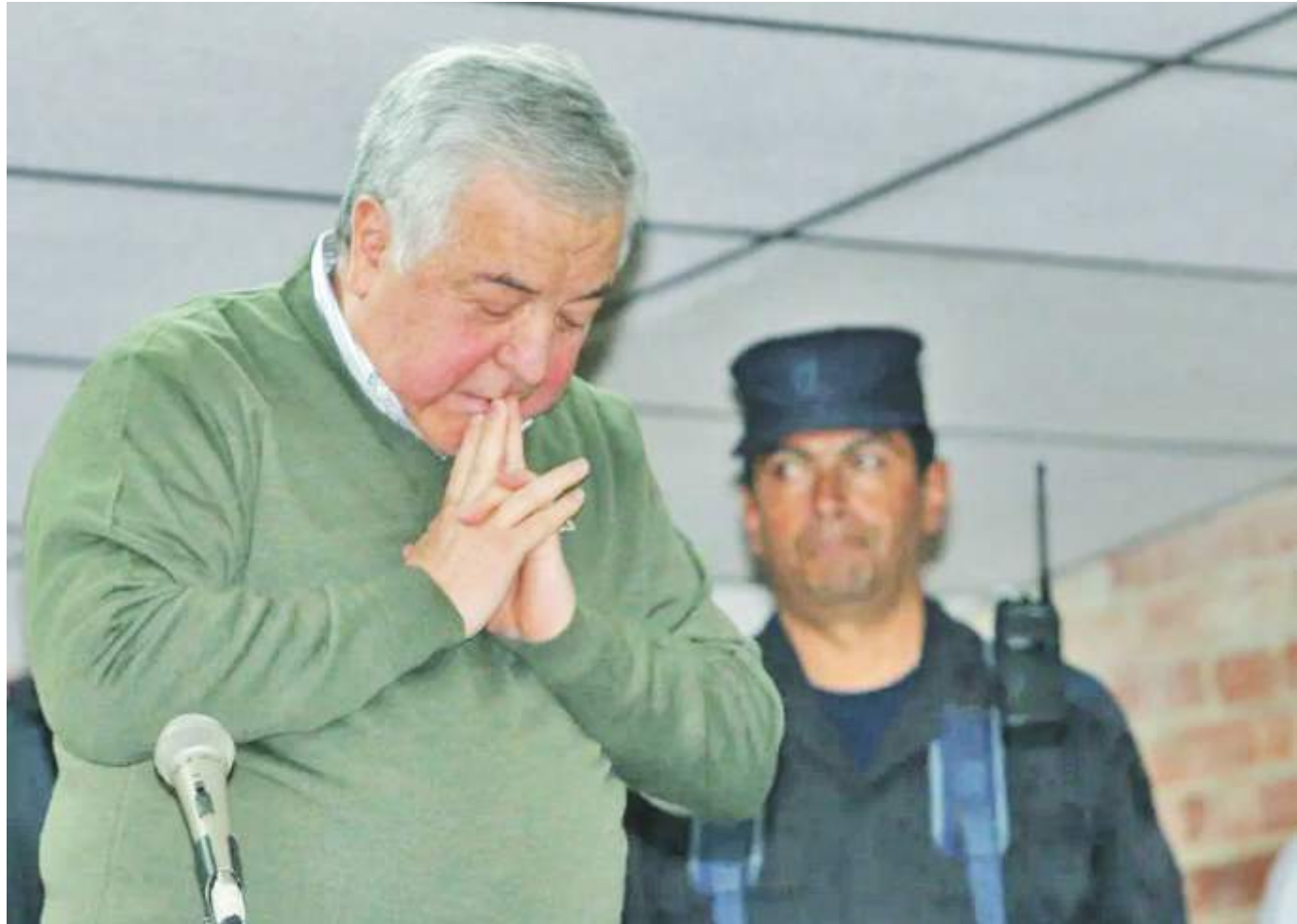
A los 83 años de edad y mientras cumplía una sentencia de 30 años de prisión por narcotráfico, el excapo murió por "una complicación por un linfoma cerebral".

Parte de su fortuna proveniente de actividades ilegales terminó siendo legalizada en cientos de empresas como Drogas la