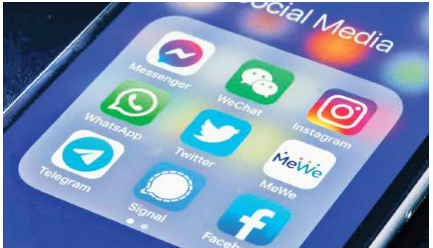
Se tomaron como referencia los hábitos de consumo de 154 personas de entre 18 y 72 años.

Al otro grupo de participantes se le pidió tomar un descanso de una semana, en la que permanecieron alejados de