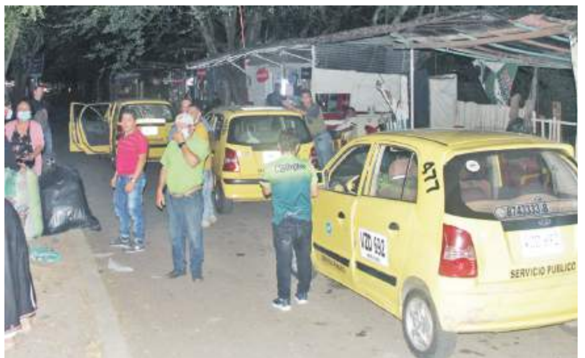
Por ahora, se iniciará con los diferentes controles para evitar que los conductores de servicio de transporte público desembarquen los pasajeros en este punto del norte de la capital huilense.

Finalmente, por ahora, se iniciará con los diferentes controles para evitar que los conductores de servicio de transporte público desembarquen los pasajeros en el norte de la capital huilense, si no, que lleguen directamente a la Terminal de Transportes.