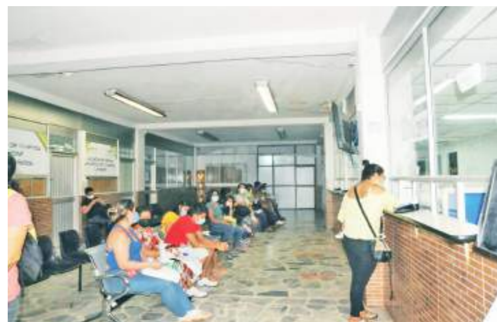
Los usuarios en Neiva pueden acudir a las oficinas del Sisbén en el tercer piso de Los Comunerios.