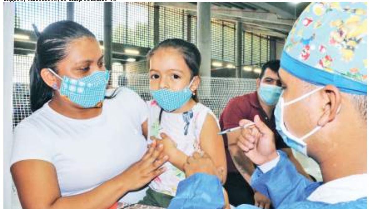
En las festividades sampedrinas los menores de edad se deben cuidar y proteger y la menor manera de hacerlo es vacunándolos.

“Hay que recalcar que un caso grave de infección por Covid-19 puede generar muchos problemas en los niños de salud y emocional por tener que sentirse solos, en aislamiento o en atención intrahospitalaria, entonces ojalá todos los papitos hagamos conciencia de eso y vacunemos los niños”, confirmó.