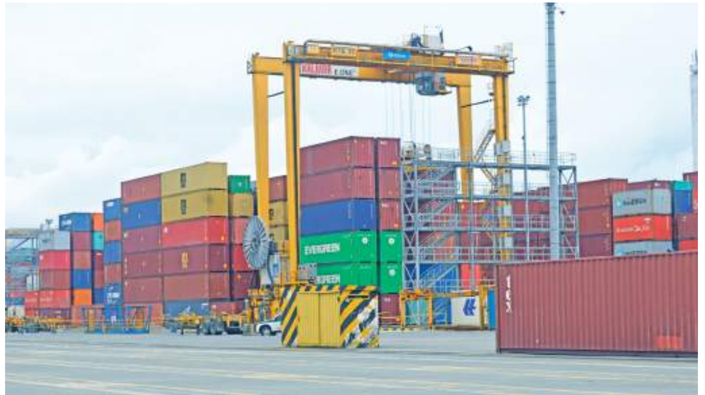
En el periodo entre enero y abril de este año las exportaciones de bienes no minero energéticos alcanzaron los US$7.183 millones.

“El comportamiento de las exportaciones de bienes no minero