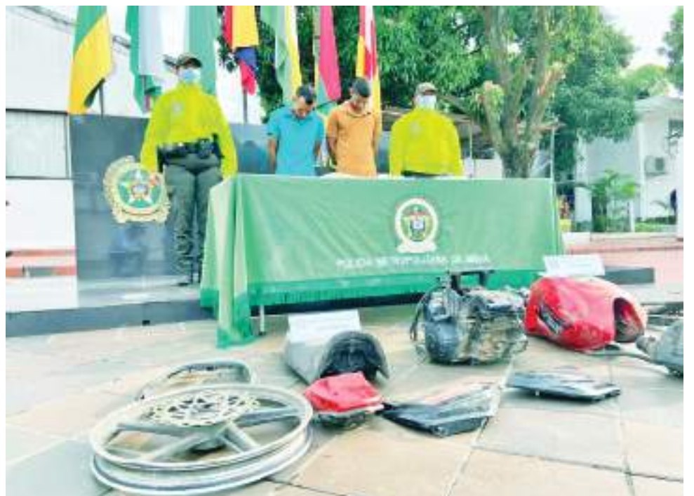
El robo de vehículos o motocicletas para ser deshuesadas es uno de los delitos que también afecta a la ciudad.

“El mensaje es claro, un delincuente puede robar una vez, dos y tres veces, pero va a ser capturado, la Policía Metropolitana le envía ese mensaje, que no crean que se vana salir con la suya porque nuestra capacidad investigativa es contundente. Contra ellos vamos. No piensen que van a seguir afectando a la comunidad cometiendo hurto y no va a pasar nada. Los bandidos no tienen cabida y si lo hacen saben las consecuencias que les acarrea participar en hechos delictivos”, concluyó el comandante de la Policía Metropolitana.