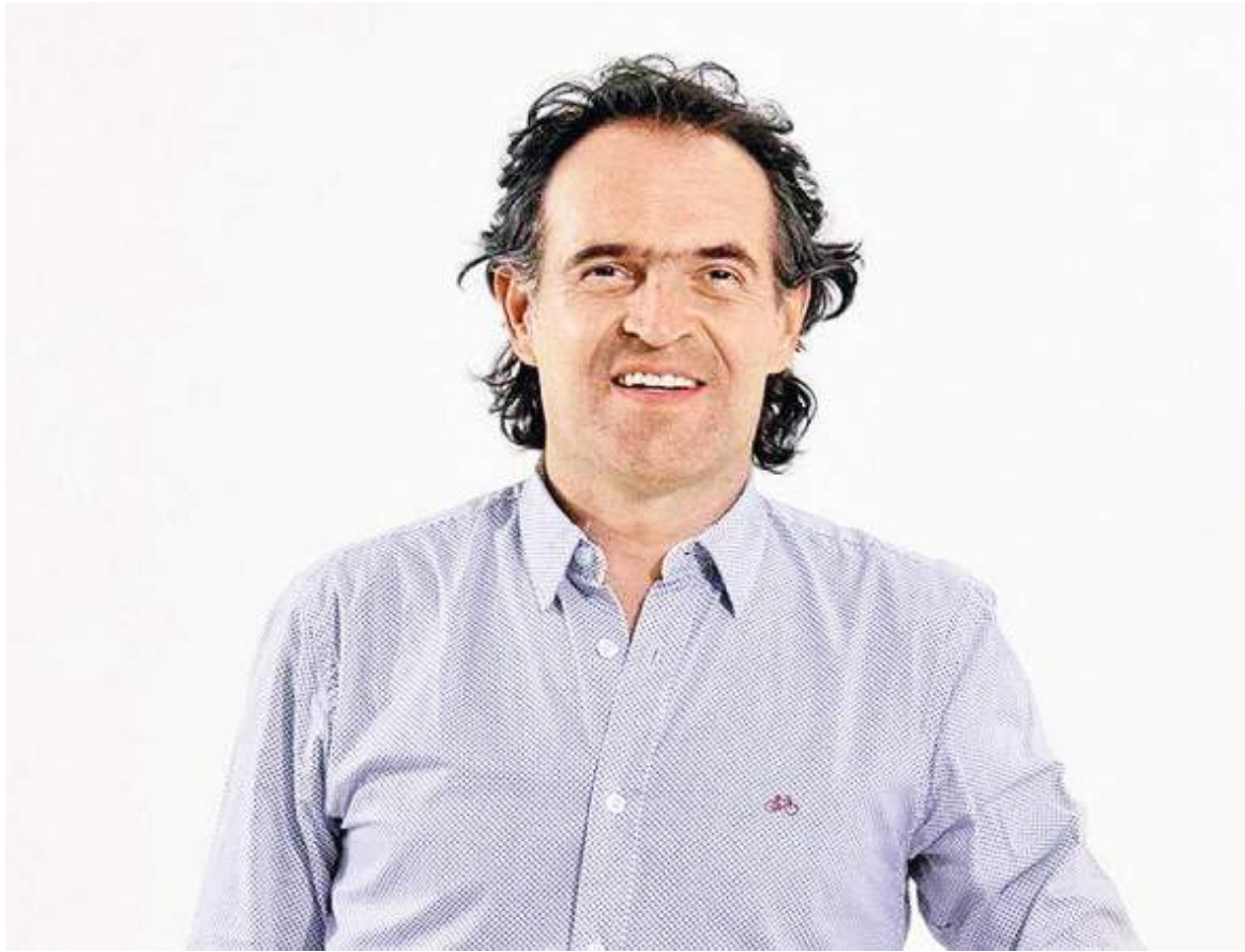
La investigación surgió por una presunta participación política de apoyo al entonces candidato presidencial Federico Gutiérrez, durante un evento organizado por la Federación Nacional de Municipios, el pasado 7 de abril en Cartagena.

llegan algunos candidatos, unos de manera presencial y otros de manera virtual, y se hacen algunas arengas donde se pronuncia el nombre de uno de los candidatos a la presidencia y la procuraduría considera que eso es una falta disciplinaria”, recordó el alcalde municipal.