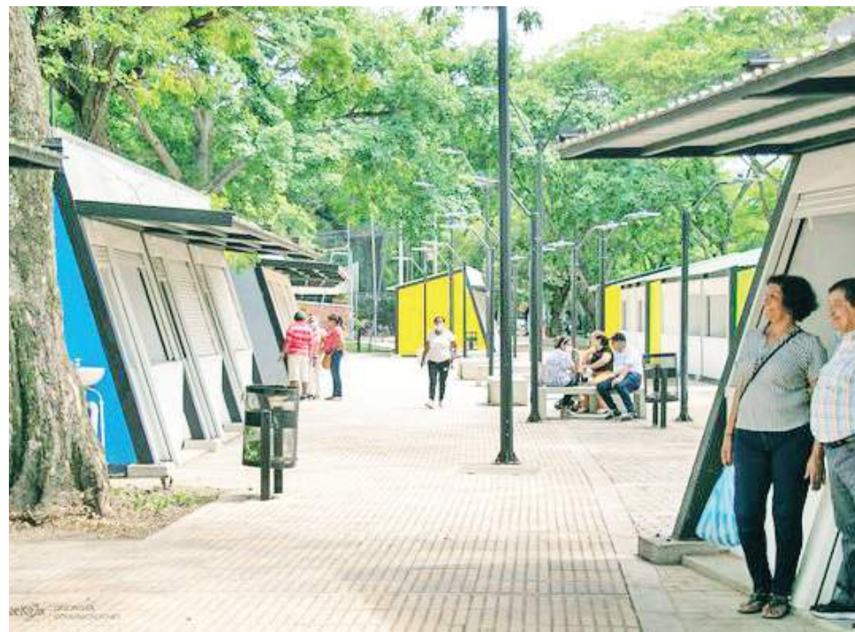
70 locales comerciales fueron entregados en la zona del Malecón del río Magdalena con el fin de reactivar la economía de las familias neivanas y de la ciudad.

Los propietarios de estos locales deberán a partir del otro