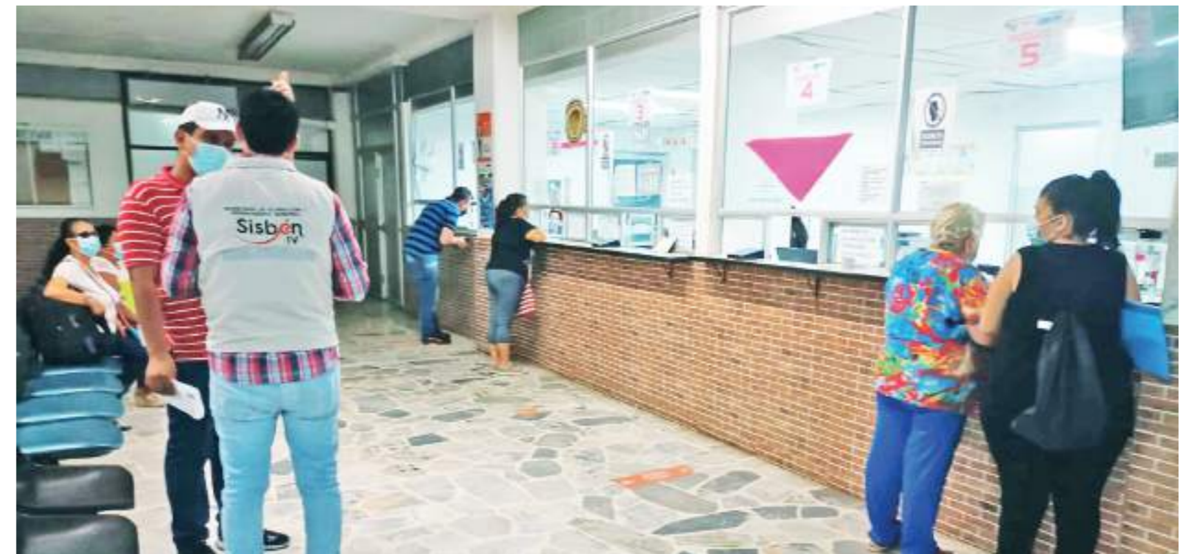
Entre 200 y 300 personas acuden a la dependencia a diario.

Por no haber hecho aún la transición al Sisbén 4, en Neiva están en riesgo de quedarse sin servicio de salud unas 50 mil personas.