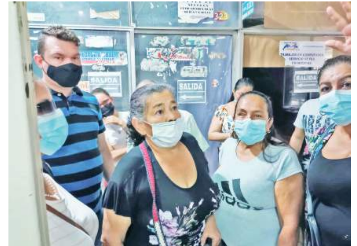
Son muchas las personas que desconocen si siguen en la base de datos.