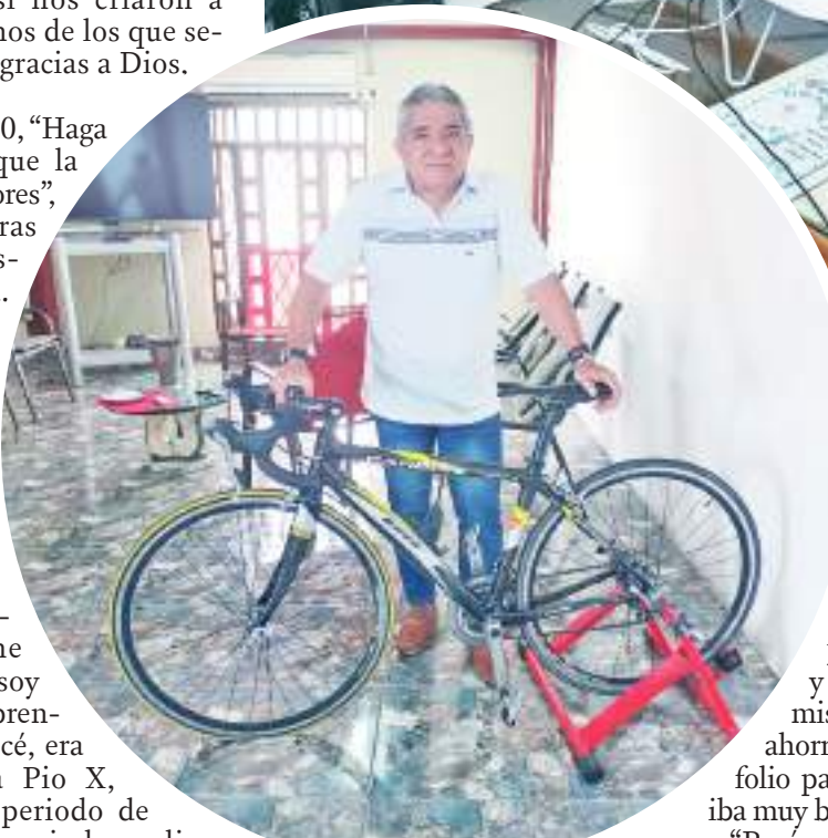
Es un agradecido de Dios y de la vida.

tricia, Ingeniera Civil”. A manera de anécdota relata que, para darles estudio a sus hijos con mucho esfuerzo, acudió al ICETEX y cuando le aprobaron el crédito ya se estaban por graduar. “Gracias a Dios nos salvamos de caer en ese préstamo”.