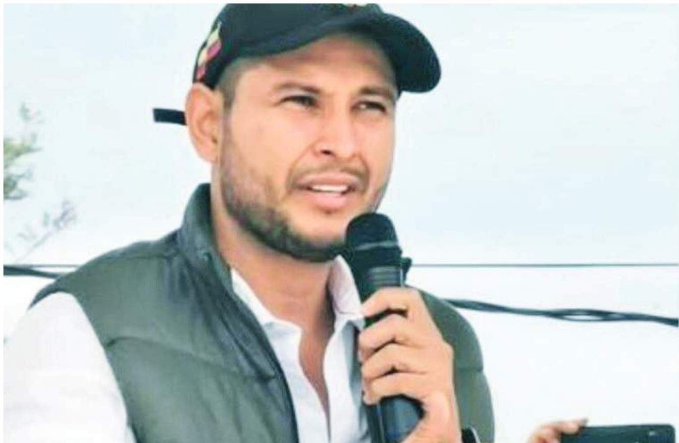
La Procuraduría General de la Nación levantó la medida y el mandatario logró retomar su cargo desde el 1 de junio.

Los funcionarios inhabilitados son: alcaldes, secretarios de despacho, gerentes de empresas sociales del Estado E.S.E, funcionarios de empresas de servicios públicos y corporaciones autónomas regionales, personal administrativo y académico de instituciones de educación superior y establecimientos educativos y funcionarios de Registradurías.