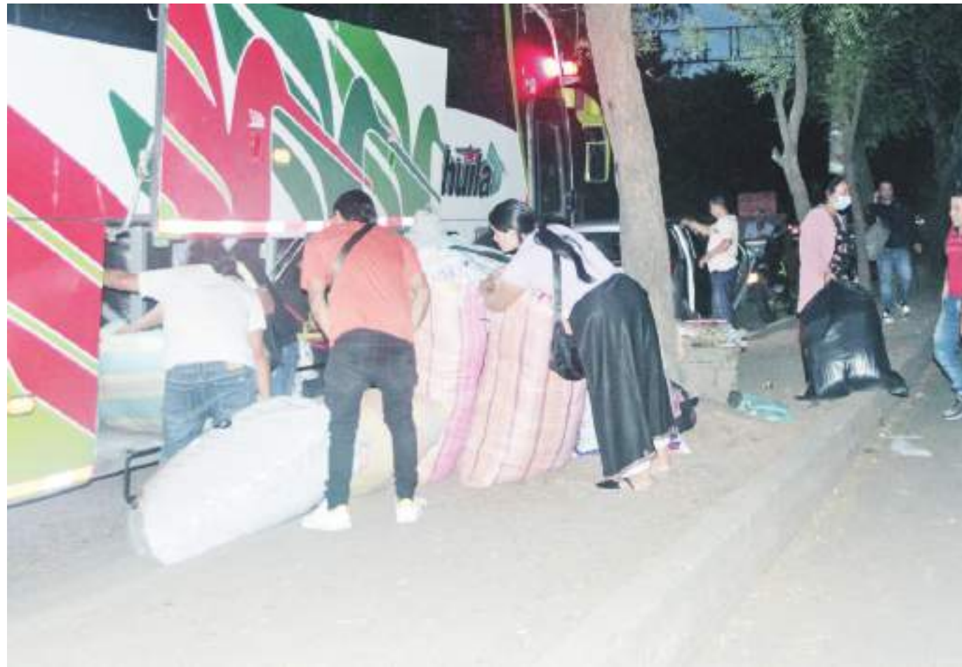
Durante los últimos días se dio a conocer el inimaginado fin del 'Terminalito' de Neiva.

Por esta razón, desde la secretaría de Movilidad se le informó a la gerente del Terminal de Transporte de Neiva y a los transportadores intermunicipales y departamentales que el único lugar de cargue y descargue de los pasajeros, sería precisamente dentro de la Terminal de Transporte. Los conductores que no acaten estas medidas serán sancionados por incumplir la normatividad.