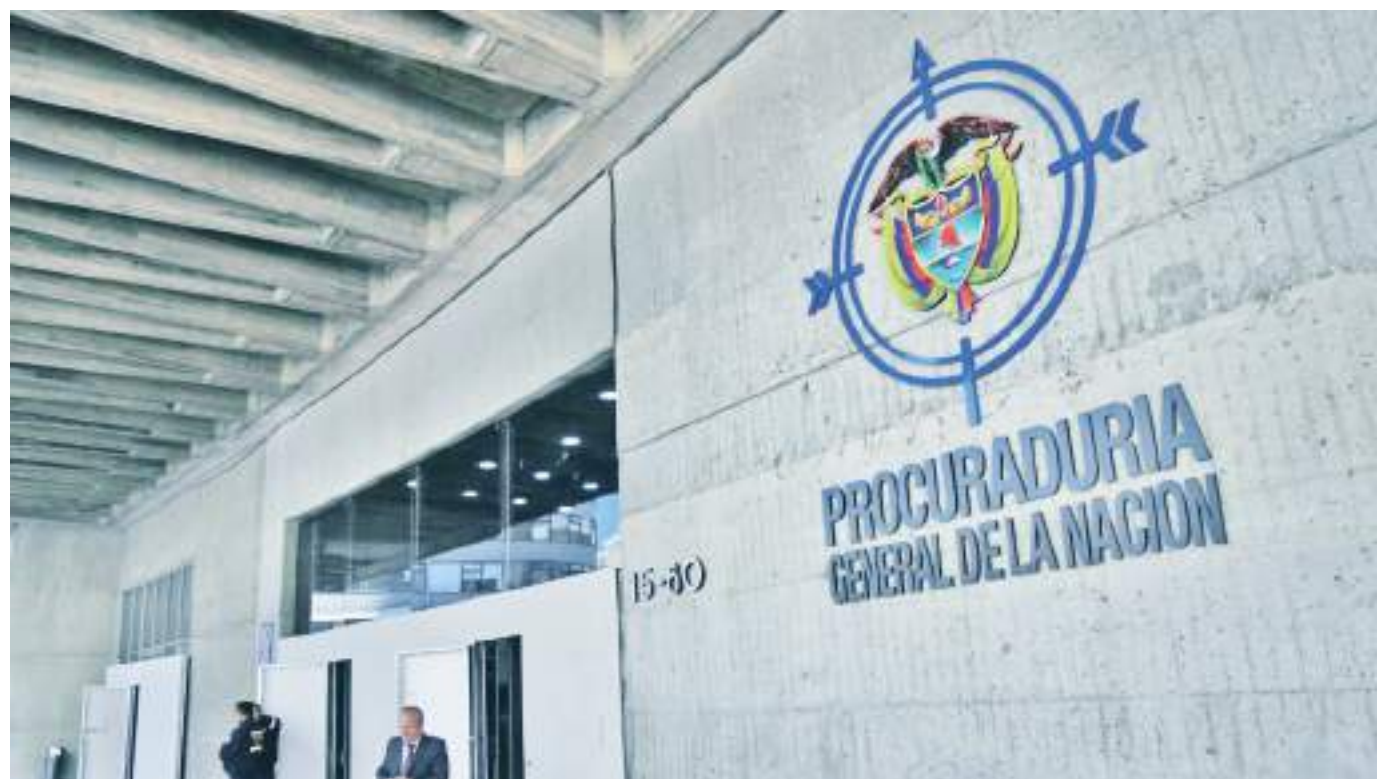
El órgano de control detalló que esa medida la tomaban en concordancia a que posiblemente se podría volver a presentar en camino a las elecciones presidenciales.

“Es de conocimiento público el tema de la suspensión provisional de mi cargo que fue hace ocho días, en donde la Procuraduría presenta las medidas cautelares de suspensión, teniendo en cuenta una denuncia que hace el senador Iván Cepeda, en donde hay unos videos que captura unos medios de comunicación en donde estamos en una reunión privada con más de 800 alcaldes. Allí