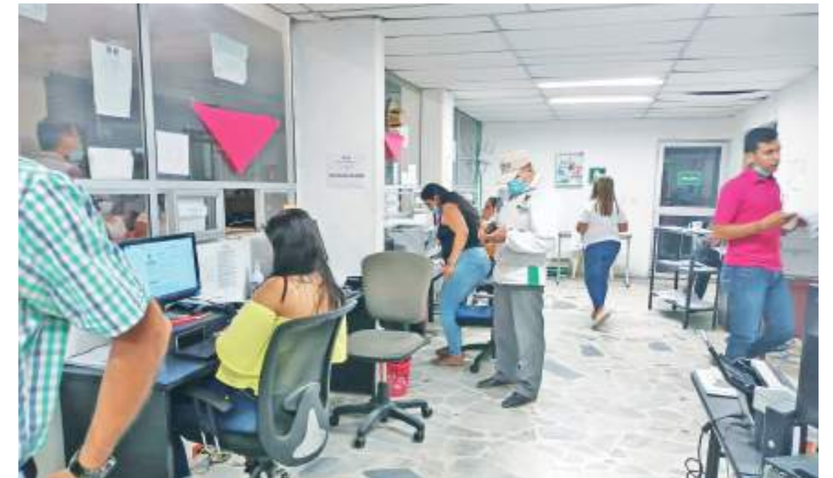
Son varios los funcionarios dispuestos a atender a los usuarios.