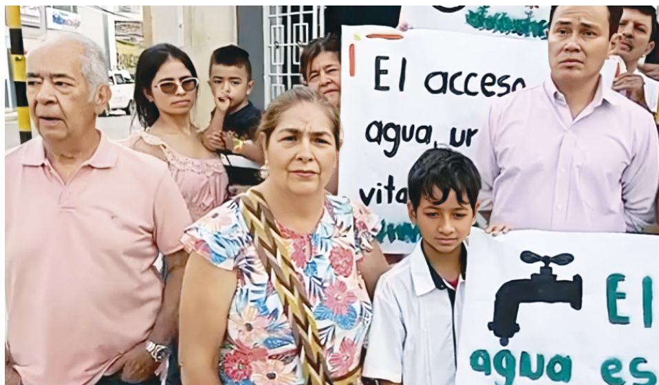
Manifestación por el derecho al agua.

Y entre enero y diciembre del 2023, hubo 2046 manifestaciones de conflictividad social en 446 municipios de 31 departamentos del país, el 13% de ellos ocurrió en Bogotá. Comparada la cifra con la del 2022, cuando se registraron 1.427 eventos, el aumento fue del 43%, según los datos recolectados.