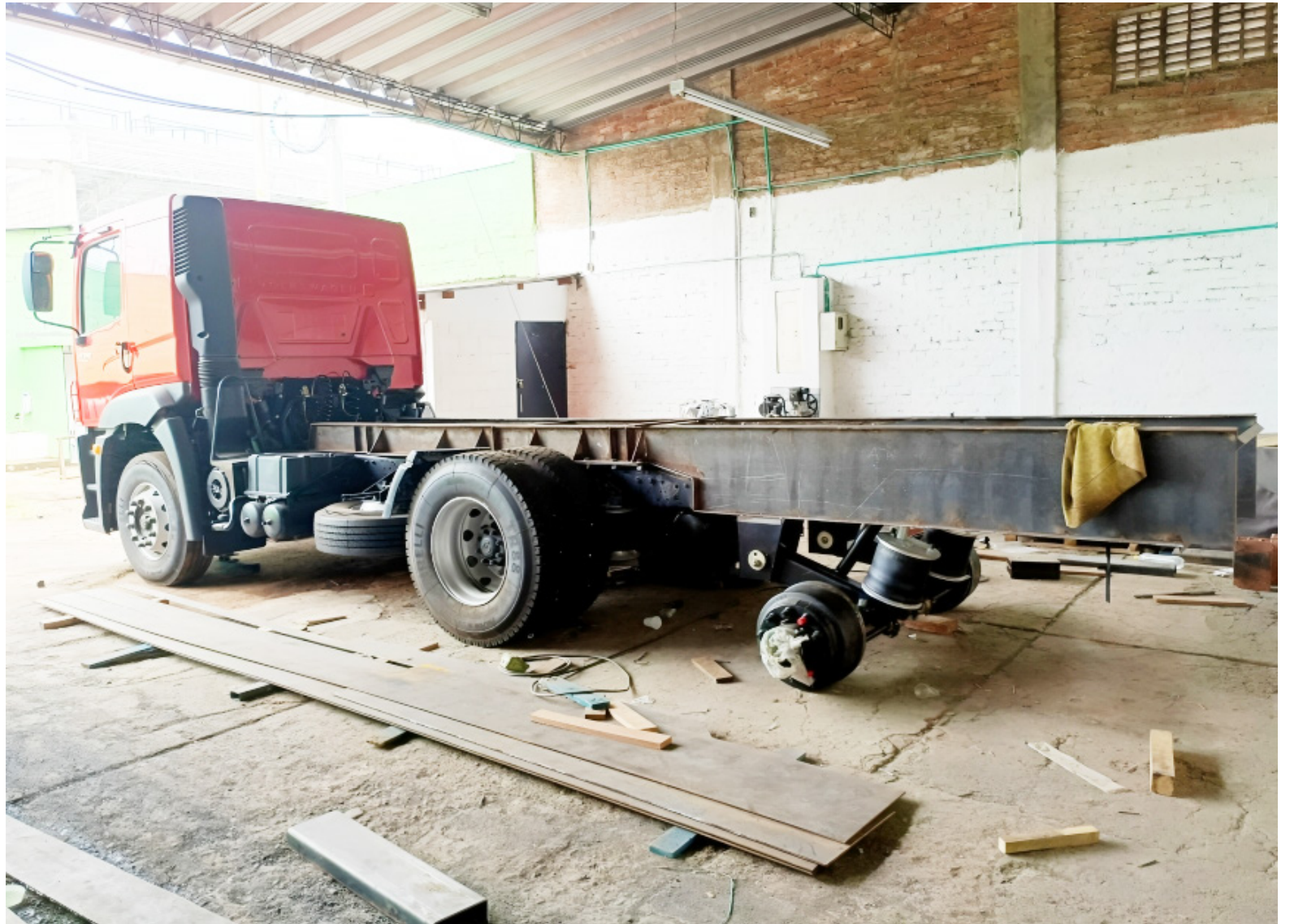
En octubre de 2023, la gobernación del Huila suscribió un contrato por 4.356 millones de pesos para la compra de seis camiones tipo cisterna para los cuerpos de bomberos del departamento.

Los investigados también habrían incurrido en incumplimientos al no supervisar ade-