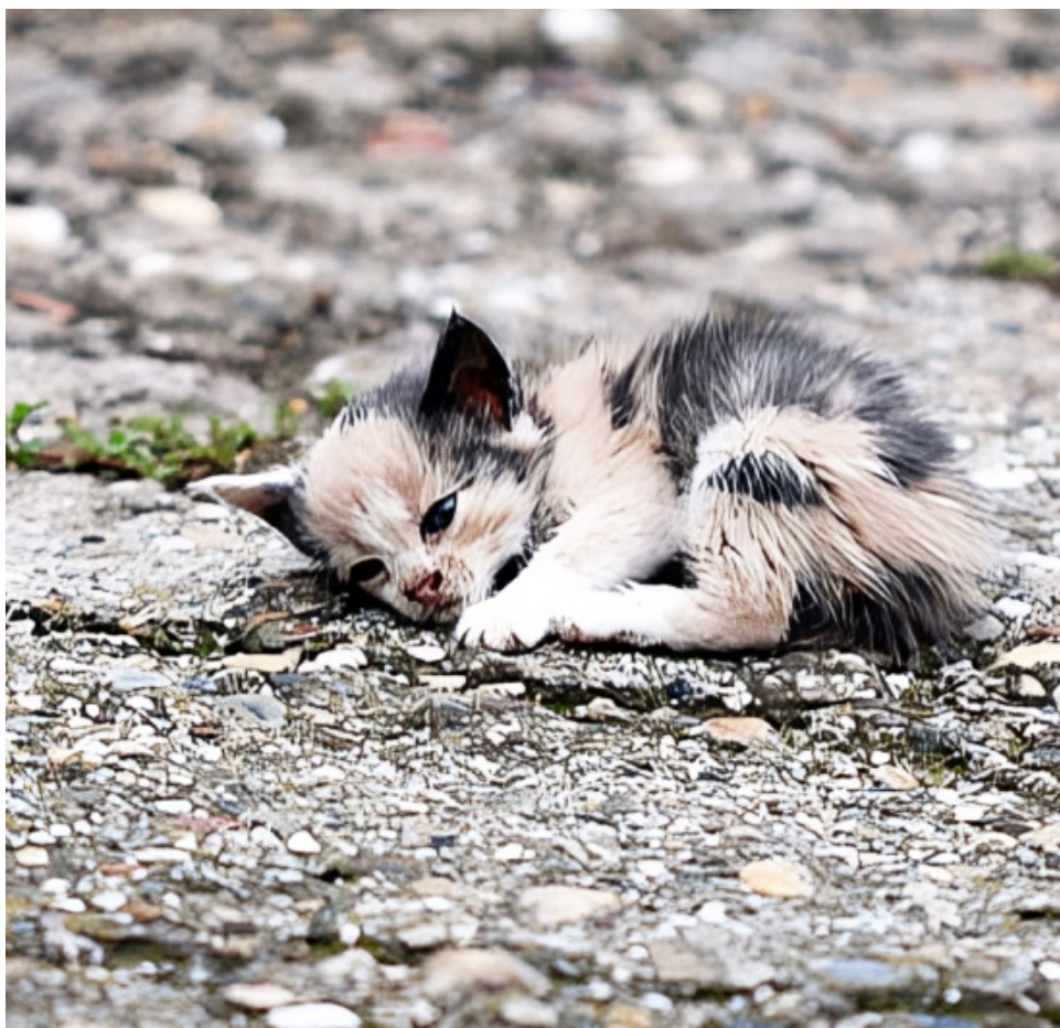
La proliferación de animales abandonados genera riesgos sanitarios.

El Plan Anual de Inversiones asignó un total de $315.837.965 para la atención de animales abandonados en Neiva en 2024.