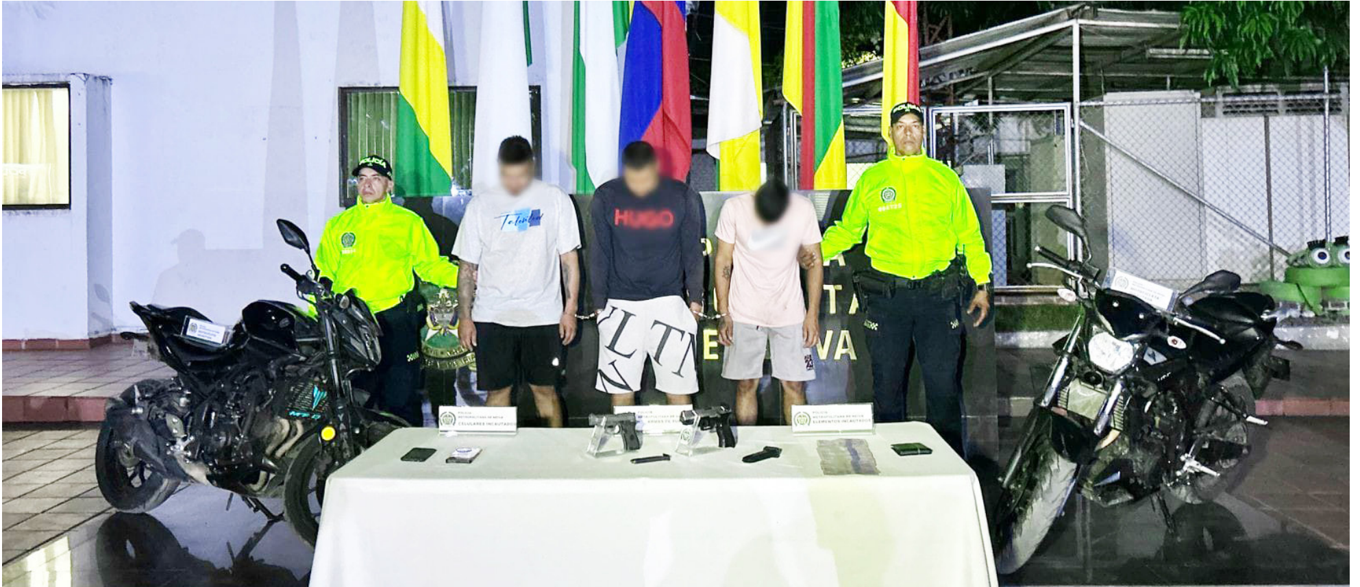
Detenidos por el hurto de $30 millones en la Zona Industrial.

■ Ante los casos de fleteo registrados en Neiva, las autoridades de Policía, invitaron a la ciudadanía que hace retiro de importantes sumas dinero en los bancos, que soliciten el acompañamiento de los agentes, pues en varios de los casos perpetrados, los investigadores determinaron que las víctimas no habían pedido el servicio de acompañamiento.