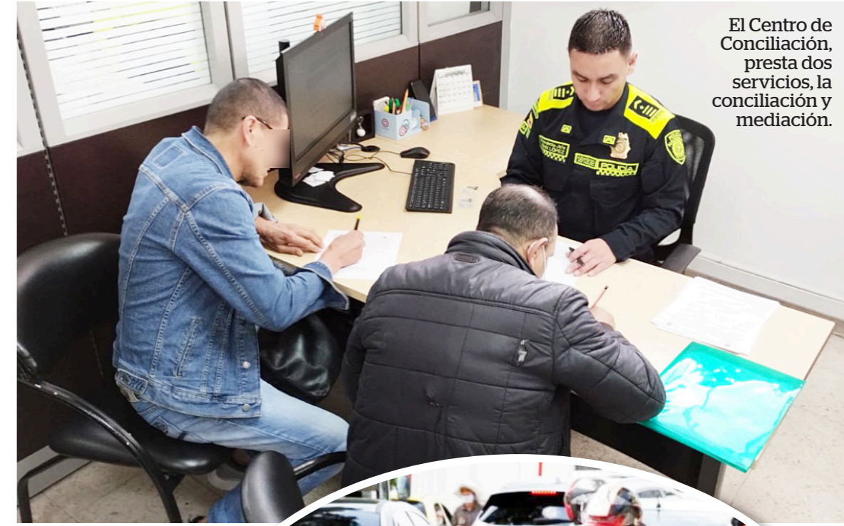
El Centro de Conciliación, presta dos servicios, la conciliación y mediación.