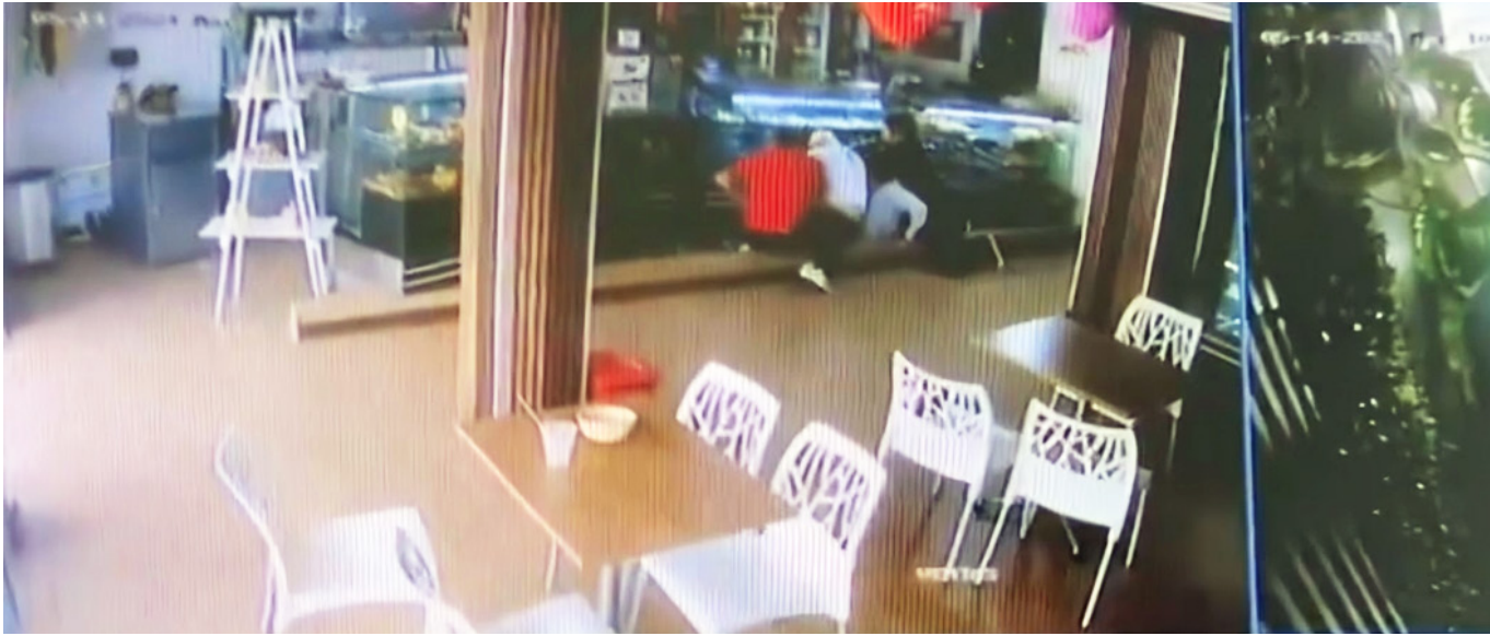
En un intento de fleteo, fue asesinado el presunto asaltante.

hechos victimizantes, una reducción de dos situaciones”.