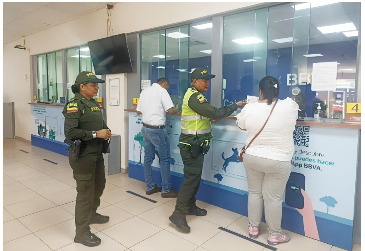
En esta temporada decembrina, recomiendan solicitar el acompañamiento policial que es gratuito.

El coronel Alexander Castillo, comandante de la Policía Metropolitana de Neiva señaló: "en lo relacionado a los casos ocurridos en el área Metropolitana, en el año 2023, se registraron seis, igual número de hechos se presentaron en este periodo de 2024. Y en lo que corresponde a esta vigencia, van cuatro hechos victimizantes".