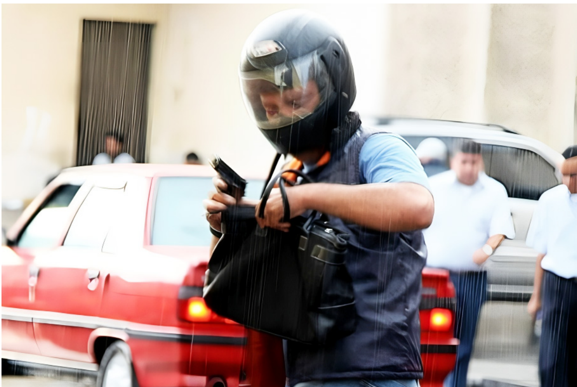
Los atracadores utilizan armas de fuego y si la víctima no les da el dinero, lo hieren o asesinan.

Y según las investigaciones, estos delitos lo materializan estructuras criminales especializadas en esta clase de robos. “Donde una persona a la que denominan, ‘marcador’, quienes hacen ron-