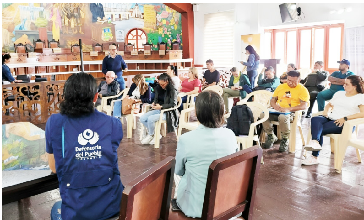
La mayoría de los casos, las protestas y conflictos ocurridos durante el año anterior, se resolvieron a través de las vías del diálogo.