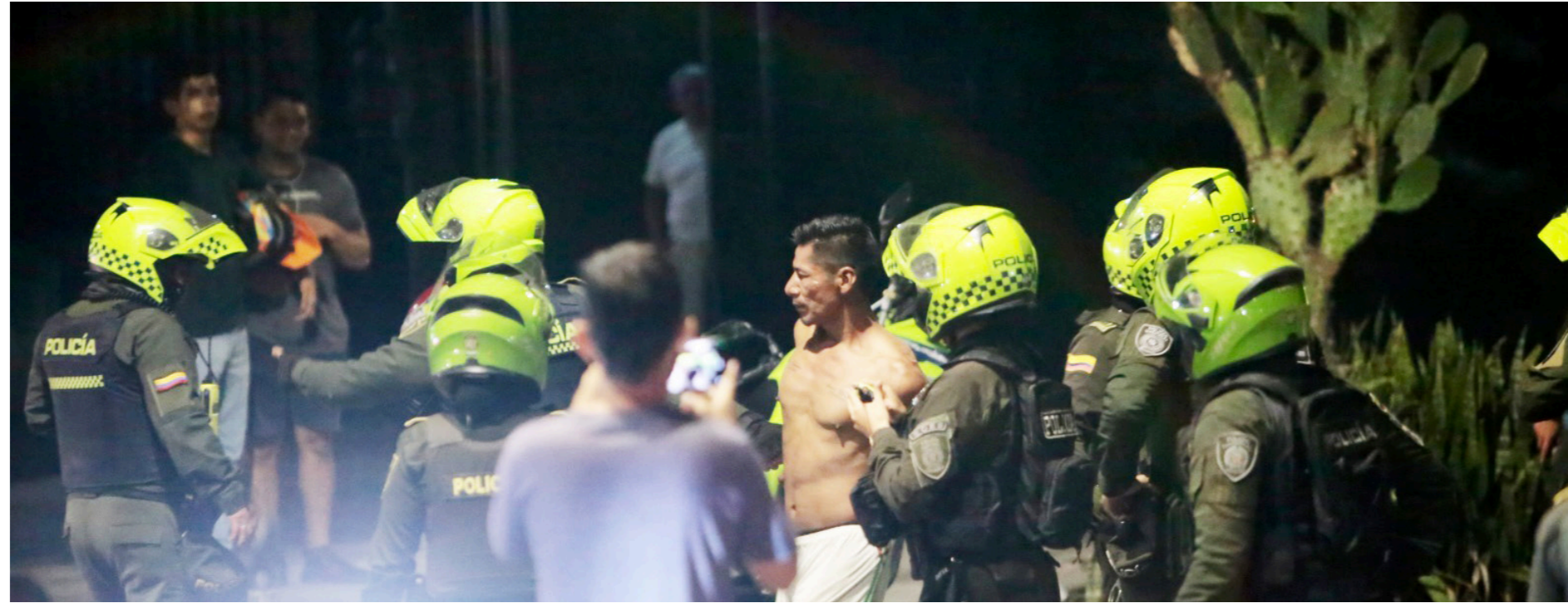
Detenido por las autoridades en la gresca que se dio en el barrio Falla Bernal.

Ahora, en el Huila, el panorama no es muy distinto al de la capital opita, puesto que las investigaciones han permitido conocer, que las peleas callejeras, se dan bajo el efecto del consumo de bebidas embriagantes, y principalmente se presentan en la zona rural del departamento del Huila.