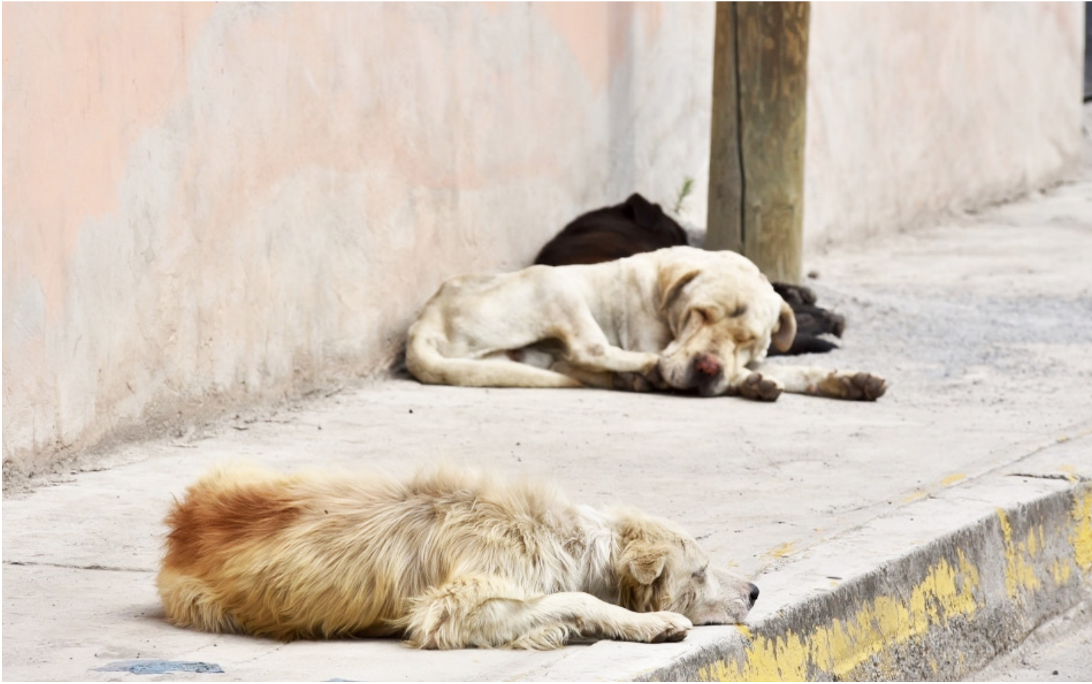
Las fundaciones buscan reducir la cantidad de animales en situación de calle.

Neiva. Esta unidad permitirá realizar esterilizaciones, vacunaciones, y servicios de desparasitación, beneficiando a los animales que residen en los asentamientos y barrios con mayor índice de abandono. Sin embargo, aunque este recurso ayuda a aliviar temporalmente la problemática, la comunidad y los concejales reiteran que no sustituye la necesidad de un Centro de Bienestar Animal.