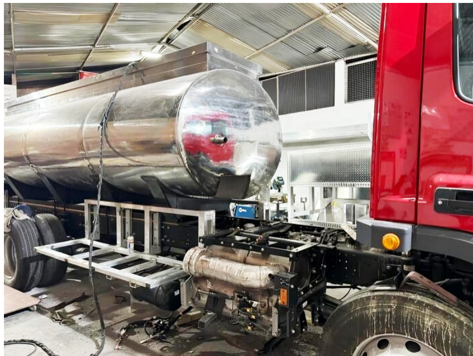
El Ministerio Público indaga una aparente irregularidad en el proceso de compra y una falta disciplinaria en los deberes de los funcionarios.

cución de este proyecto. Además, se revisará el manejo del Fondo Departamental para la Gestión del Riesgo de Desastres y se verificará si se han aplicado los mecanismos de control y las pólizas de garantía requeridas en un contrato de esta naturaleza.