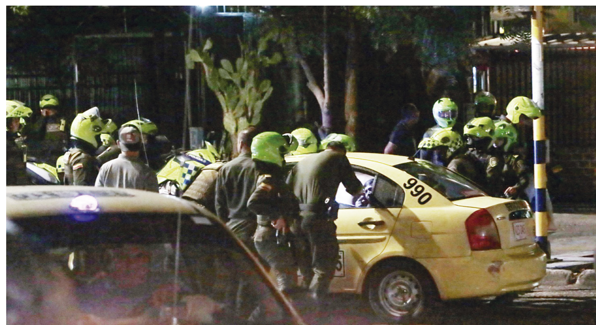
Ante el número de personas involucradas llegaron más refuerzos.

más personas involucradas, y terminaron en plena vía pública agrediendo, inclusive interrumpieron el paso vehicular", dijo una testigo del hecho.