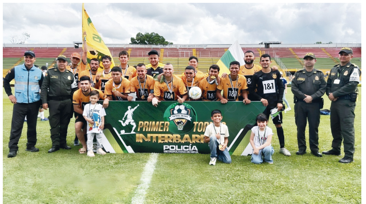
Clausura del Primer Torneo Interbarrios 2024, organizado por la Policía Metropolitana de Neiva con el apoyo de la Alcaldía Municipal.