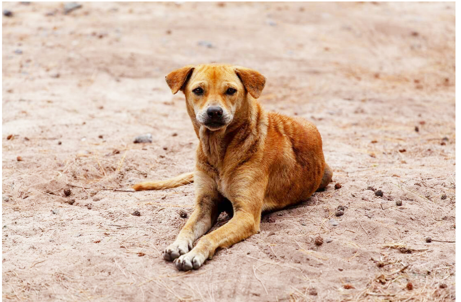
El debate resalto la importancia de construir el Centro de Bienestar Animal.