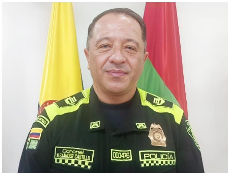
Coronel Alexander Castillo, comandante de la Policía Metropolitana de Neiva.

Asimismo, el oficial se refirió al hurto de los $396 millones, y en estos casos hay un común denominador en los casos ya mencionados y es que en este caso las víctimas, no solicitaron el acompañamiento policial para realizar los movimientos financieros, ar-