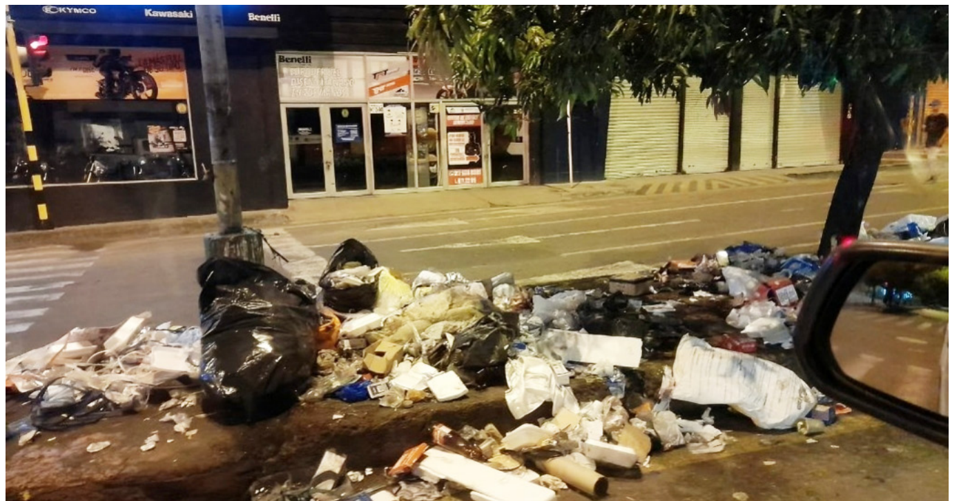
Neiva, queda en emergencia cuando se presenta el cierre de la vía que conduce al relleno sanitario.

Los principales conflictos sociales que se han registrado en el país, fueron por condiciones laborales (20%), fallas en la prestación de servicios públicos domiciliarios (20%), derecho a la vida, la libertad y la integridad (14%), derecho a la educación (14%), por presencia e inversión estatal (7%), por múltiples derechos (6%) y por transporte (5%).