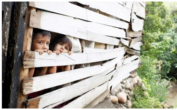
Atención infantil en crisis