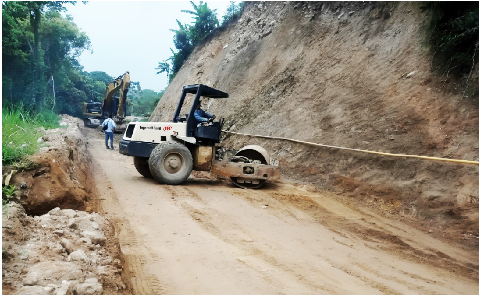
Vía que va del centro poblado de Gallardo al municipio de Suaza, sin terminar.