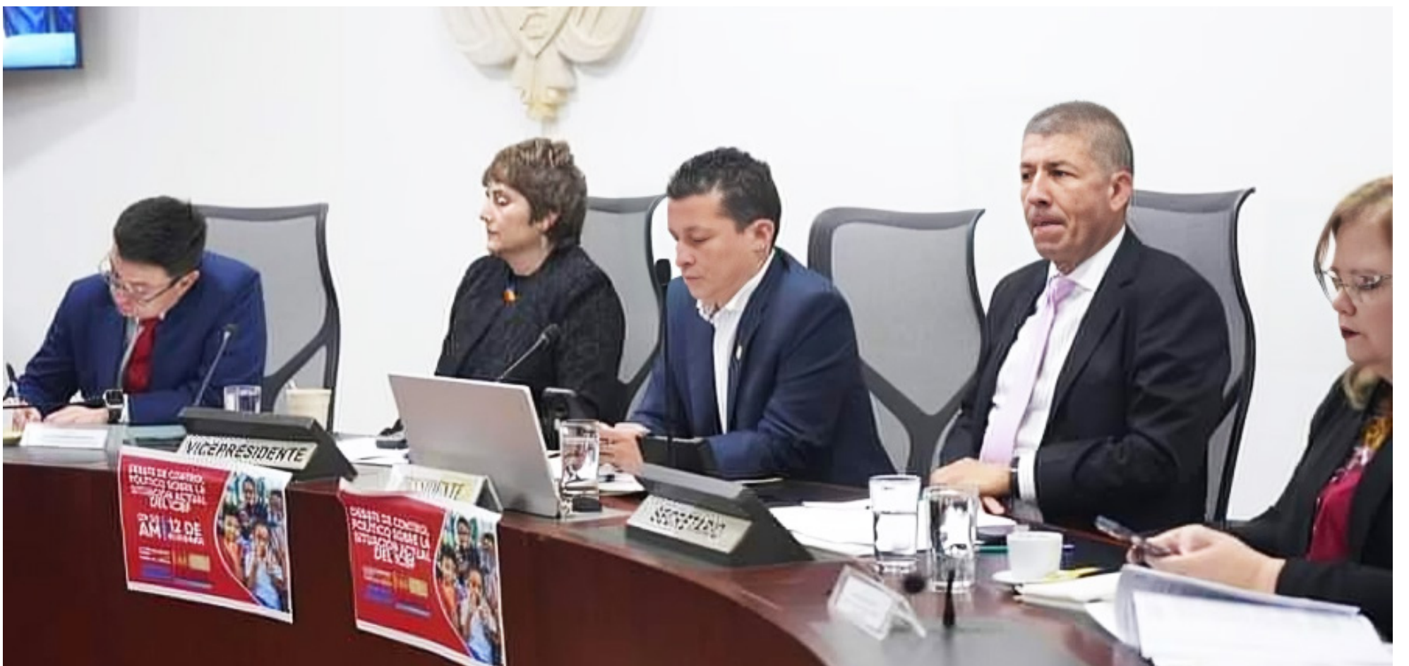
Cámara de Representantes analizó la situación de la infancia en Colombia.

El debate concluyó con un llamado por parte de la representante a la acción para que se refuercen los recursos destinados a la infancia en el Huila, se apoye a las madres comunitarias y se implementen medidas para frenar la violencia y el reclutamiento forzado reiterando que el Huila no puede quedar atrás en los esfuerzos por garantizar una infancia digna para todos sus niños, niñas y jóvenes.