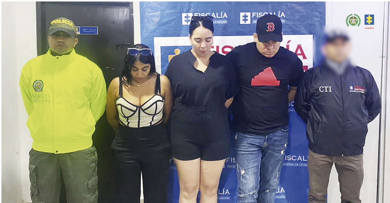
Neiva fue uno de los focos principales de la red 'Los Mágicos', quienes lograron captar a decenas de familias con planes turísticos falsos.

■ Más de 130 familias en Colombia, incluidas decenas de Neiva, fueron víctimas de la red de estafa 'Los Mágicos', una organización que operaba bajo la fachada de una agencia de viajes y ofrecía paquetes turísticos falsos. Las autoridades lograron capturar a cuatro de sus integrantes, quienes habrían defraudado a sus clientes por más de 300 millones de pesos.