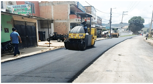
'Lupa' a obras viales departamentales