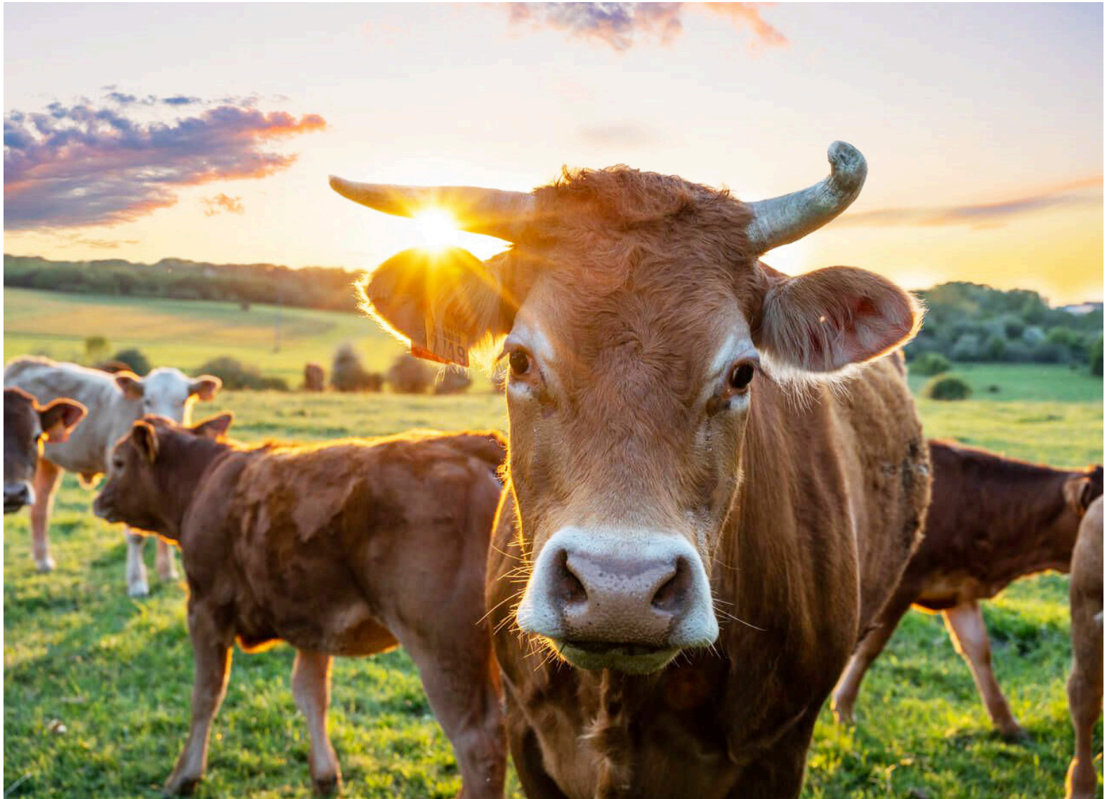
En varias ciudades del país, la principal actividad económica es la ganadería.

Colombia es un país con una profunda tradición ganadera, y en muchas de sus regiones, la ganadería no solo es la principal actividad económica, sino también una forma de vida para miles de familias. A lo largo del país, los vastos llanos y las montañas han sido testigos del crecimiento y la consolidación de este sector que sigue siendo un pilar fundamental de la economía nacional. Aunque el país ha tenido que adaptarse