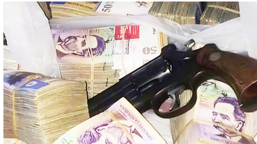
Los reclutadores 'seducen' a los menores con armas de fuego, motos, celulares y dinero.