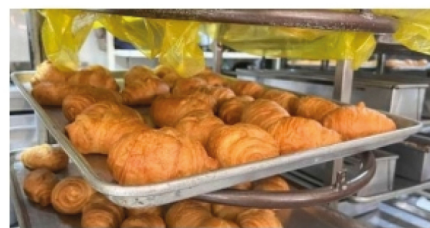
Panaderos del Huila, afectados por bajo consumo ■ ECONOMÍA 6-7