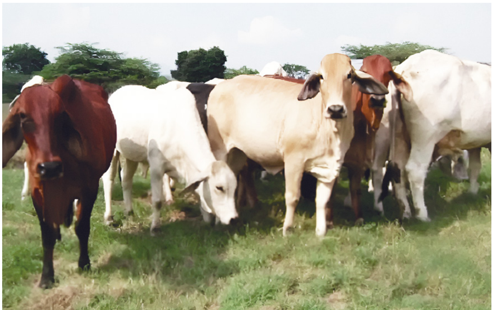
En departamentos como Vichada, Casanare y Caquetá, la ganadería supera a la población.

La concentración ganadera en departamentos como el Huila refleja el peso de este sector en la economía nacional, a pesar de la reciente caída en la exportación de ganado y los desafíos de productividad.