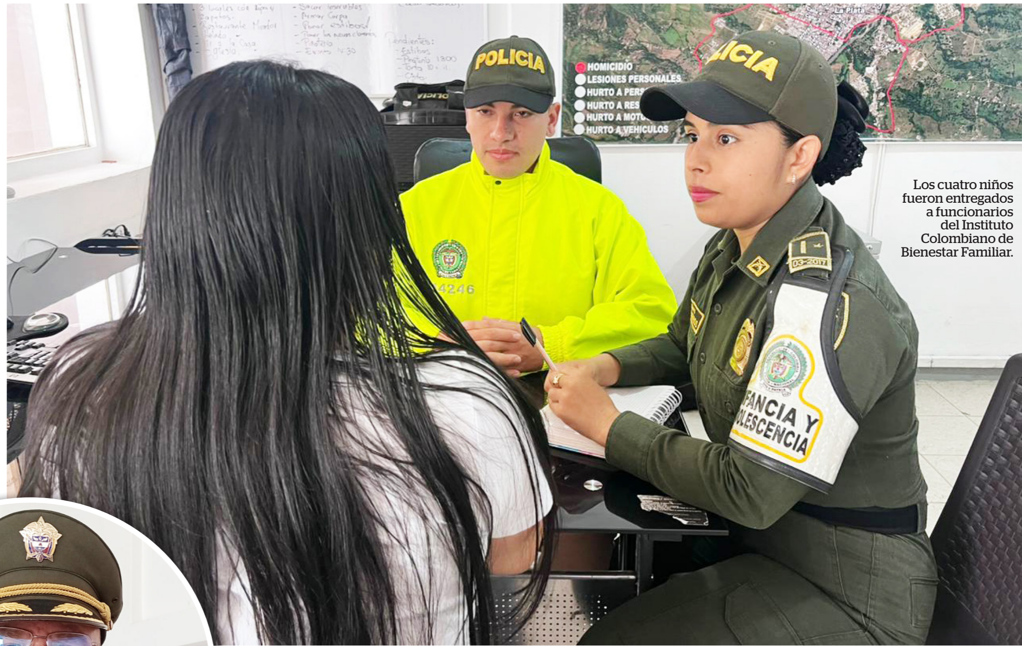
Los cuatro niños fueron entregados a funcionarios del Instituto Colombiano de Bienestar Familiar.

es más difícil que se involucren en el conflicto armado, en cambio los menores de edad, se convierten en objetivos de fácil acceso por su vulnerabilidad. Por ende, desde las instituciones, se han aliado para prevenir el reclutamiento forzado. "Además, porque es truncar un proyecto de vida, seducir a través de una