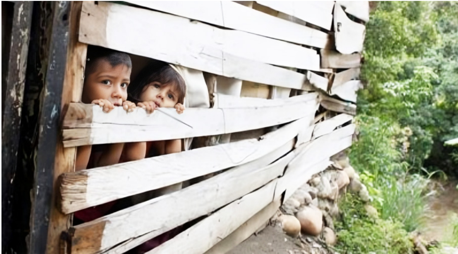
Disminución en programas sociales dirigidos a la infancia en el Huila.

■ En un contexto de creciente preocupación por la atención a la infancia y la vulnerabilidad social en diversas regiones del país, el 12 de noviembre se realizó un importante debate de control político en la Cámara de Representantes. Este debate abordó temas fundamentales para el bienestar infantil y social a nivel nacional, sin embargo, la ausencia de representantes de la Gobernación del Huila en un espacio tan relevante reflejaría desconexión con los desafíos que enfrentan la juventud y niñez del departamento.