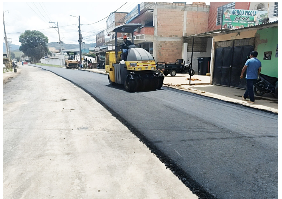
Rehabilitación de 3.32 kilómetro del corredor vial Pitalito - Palestina.