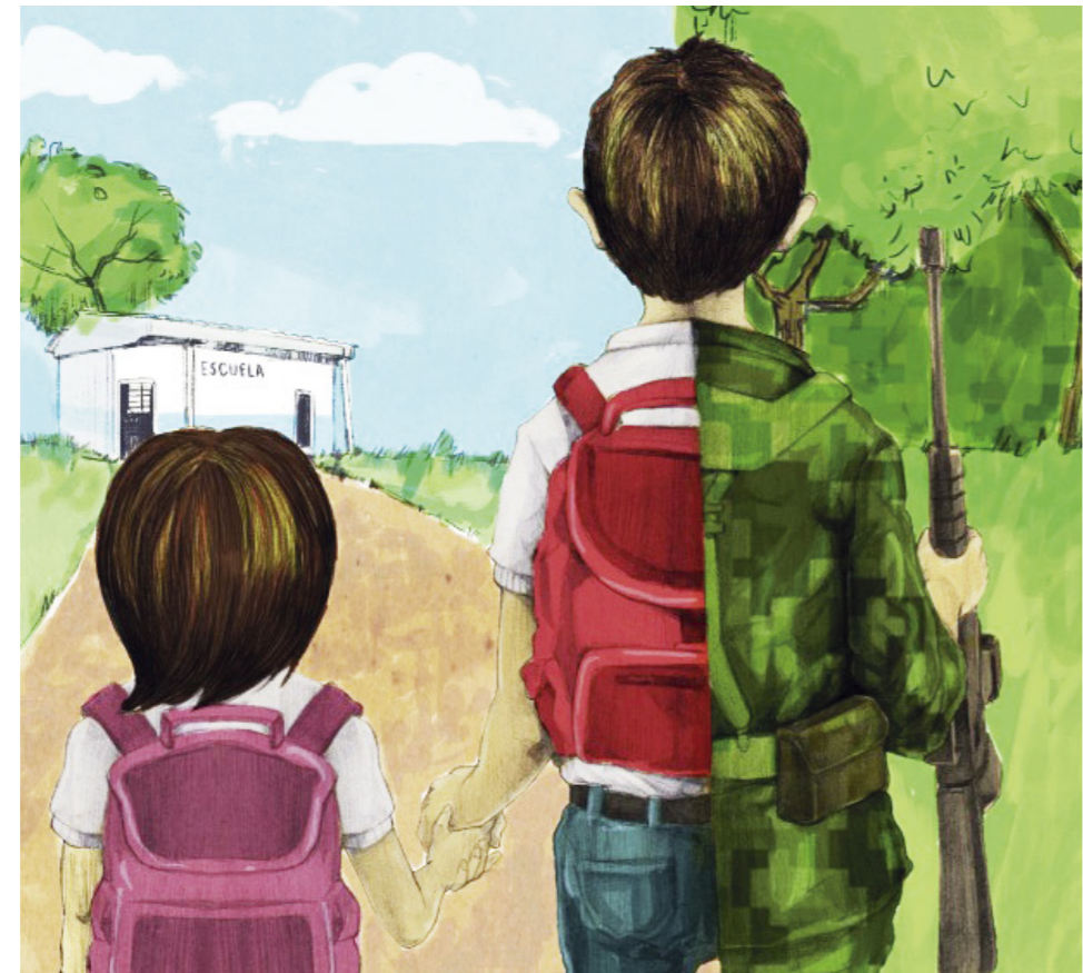
Neiva, tiene actualmente 10 casos de menores desvinculados, lo que quiere decir, que sí se están llevando a los niños.

de funcionarios del Instituto Colombiano de Bienestar Familiar". "En este sentido, la Policía Nacional, viene realizando acciones para que todos los niños, niñas