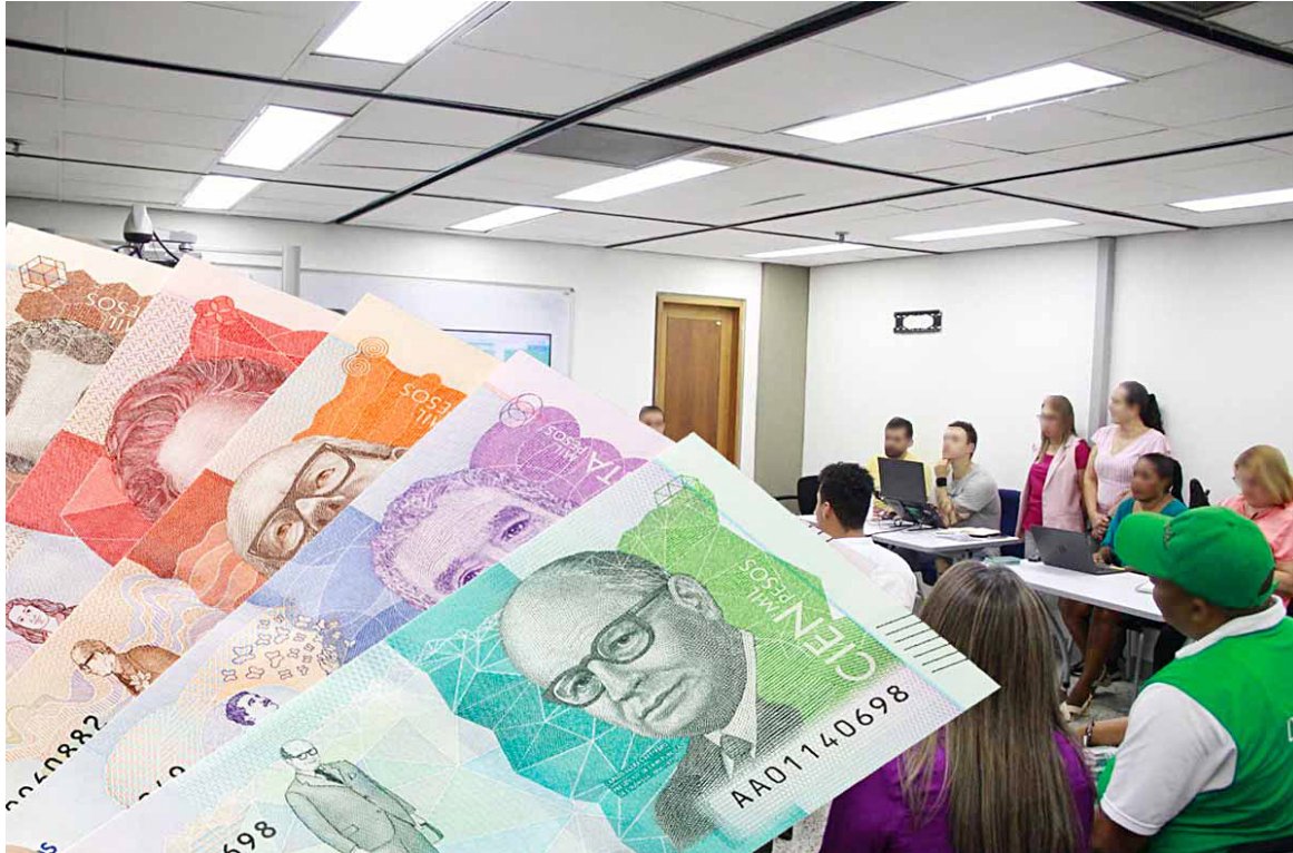
La ley especifica que el cálculo de la prima para estos trabajadores debe basarse en el salario mínimo legal mensual vigente.

Este modelo de cálculo permite una mayor equidad y garan-