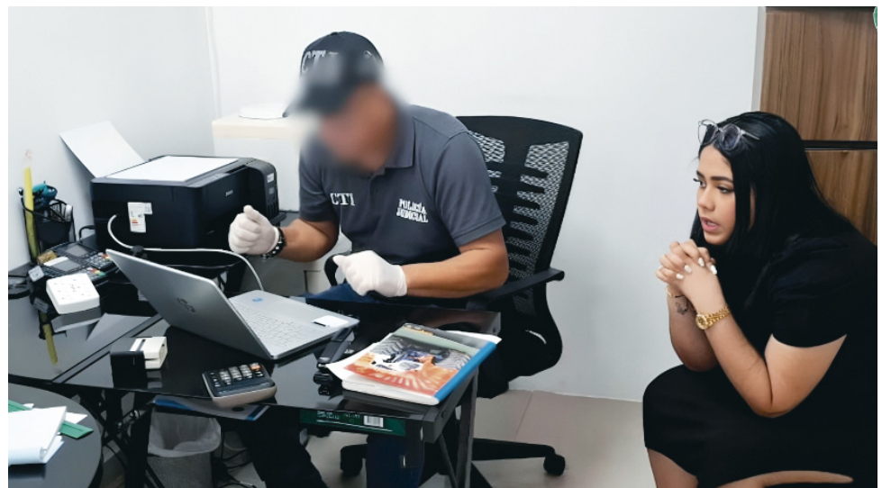
Los cuatro capturados por el fraude de 'Los Mágicos' enfrentan cargos de concierto para delinquir y estafa en modalidad de masa.

Con la captura de los responsables de 'Los Mágicos', se espera que las autoridades refuercen las acciones para proteger a los ciudadanos y evitar que otras familias pierdan sus ahorros por redes criminales que, bajo fachadas legales, engañan a los colombianos. Aún queda la expectativa de recuperar al menos una parte de los fondos defraudados para resarcir a las familias que hoy enfrentan la dura realidad de ver cómo sus sueños de viaje y descanso quedaron truncados.