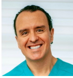
Adonis Tupac Ramírez

El papel de un artista con millones de seguidores en redes sociales es complejo y fascinante, especialmente en una época en la que las redes digitales moldean gran parte de la percepción pública y del consumo de información. Si bien su música puede ser lo que inicialmente atrae a las personas, el alcance de un cantante con millones de seguidores va más allá del entretenimiento. Su influencia se extiende a la moda, la política, los derechos humanos y, en última instancia, a la construcción de identidad y valores en la sociedad.