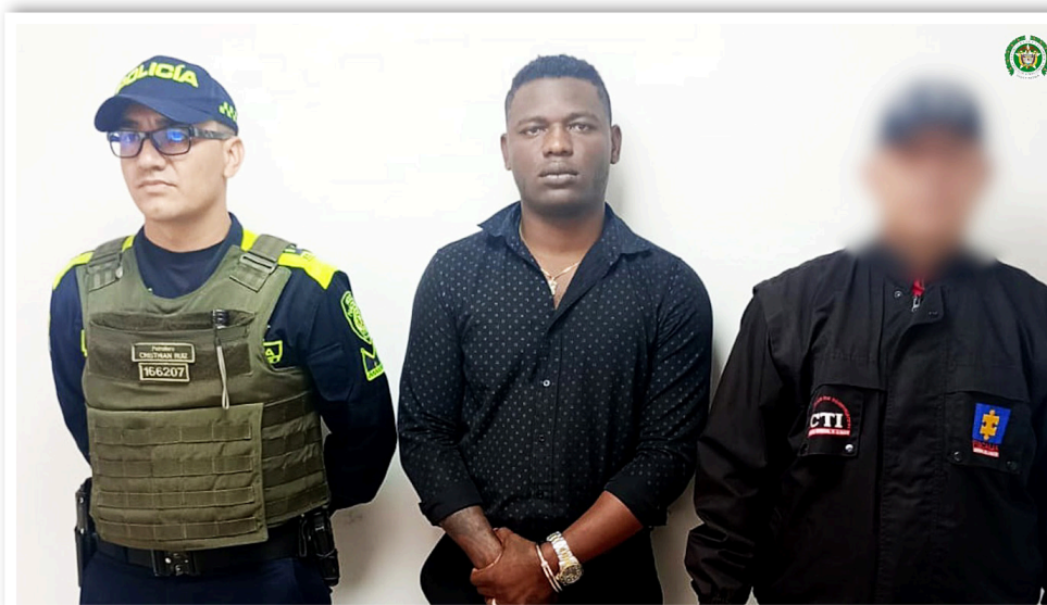
Las víctimas de 'Los Mágicos' en Neiva y otras ciudades perdieron entre uno y seis millones de pesos, con la promesa de un viaje que nunca llegó.

Las familias afectadas, en su mayoría de clase trabajadora, amas de casa, conductores y adultos mayores, habían reu-