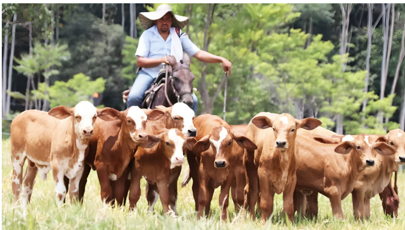
En el llano hay una amplia cantidad de ganado cebú.