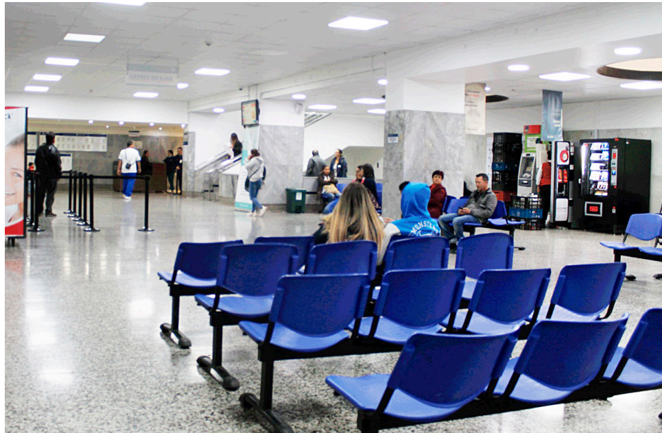
La falta de recursos financieros ha impactado la disponibilidad de medicamentos esenciales, señala Afidro.