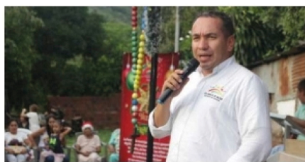
'Es necesario un rediseño institucional de la personería de Neiva' ■ ENTREVISTA 2-3