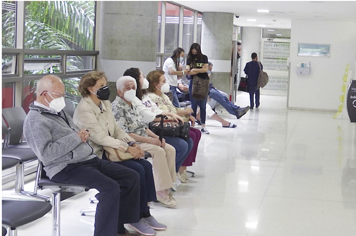
Los altos costos y el déficit financiero amenazan la sostenibilidad del sistema de salud en Colombia, advierte Anif.