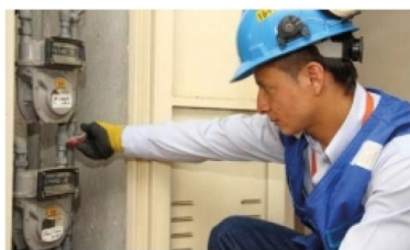
Quejas por el costo del servicio de reconexión de gas ■ INFORME 4-5