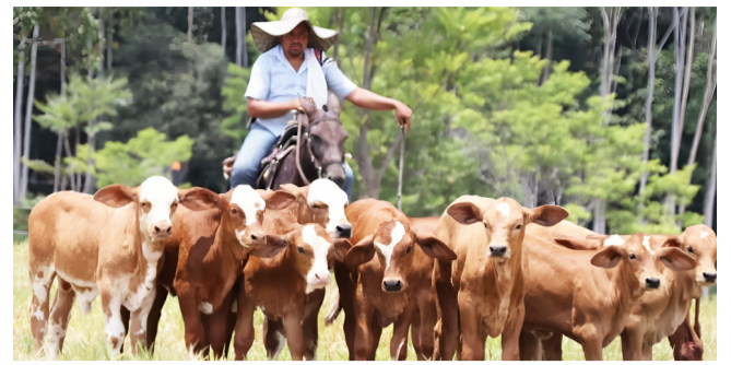
En el Huila se tiene más ganado que población