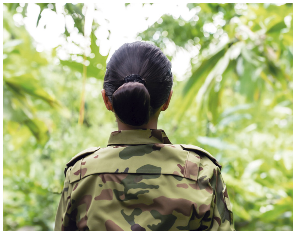
Los reclutadores enamoran a las niñas y les hacen creer que tienen una relación amorosa para que ingresen a las 'filas'.