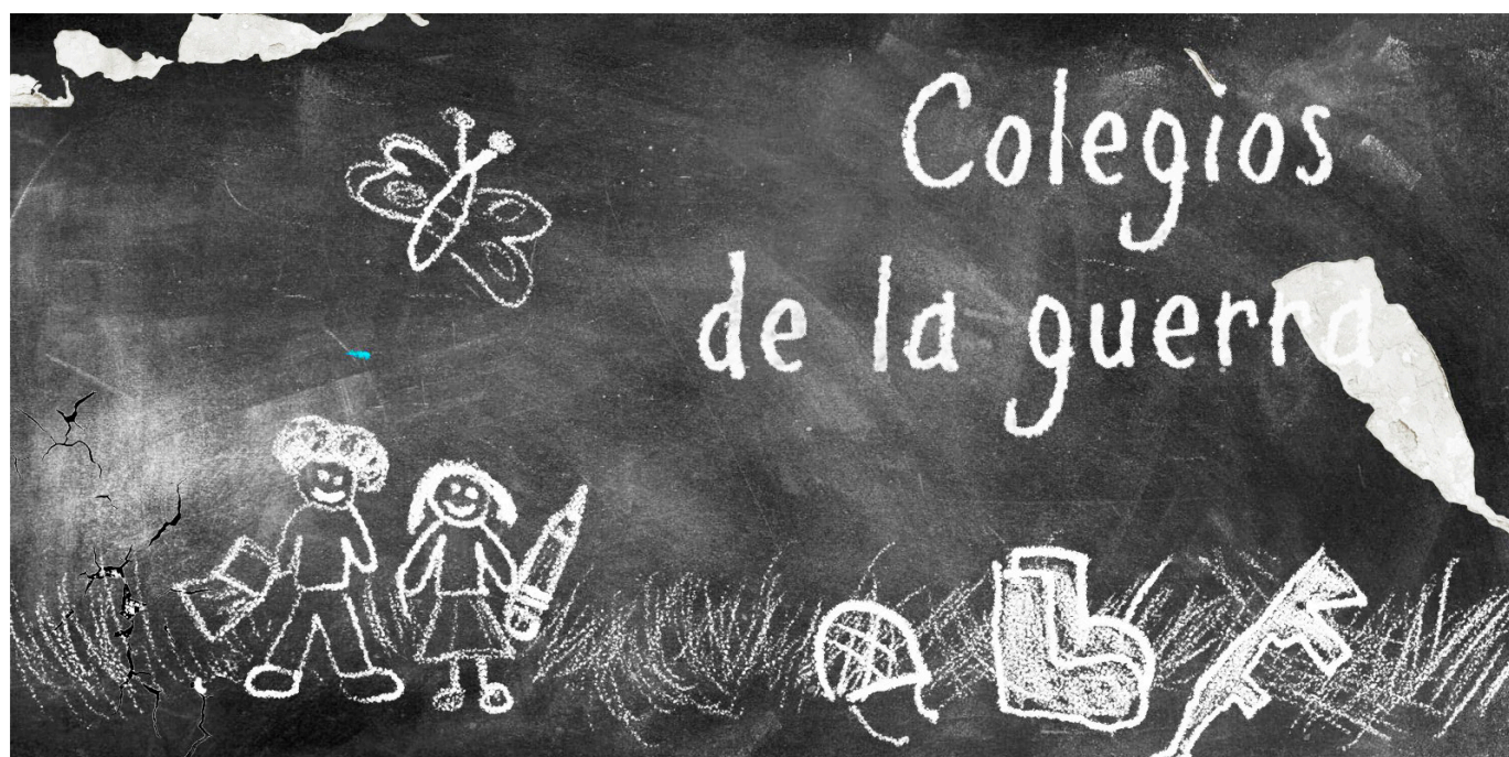
En cuanto a la estrategia de ‘Escuelas Seguras’, se priorizaron los nueve municipios que se encuentran en las Alertas Tempranas.