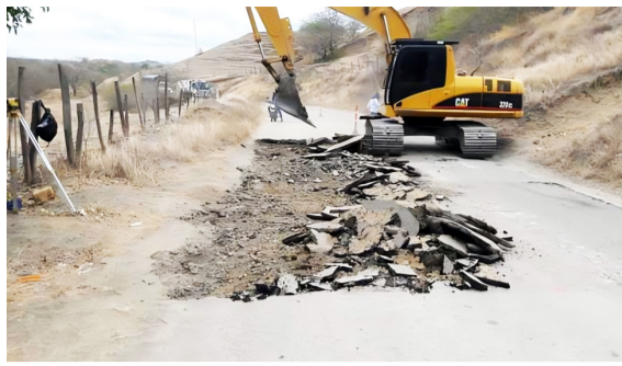
Errores interpretativos de estudios y diseños terminan en atrasos viales