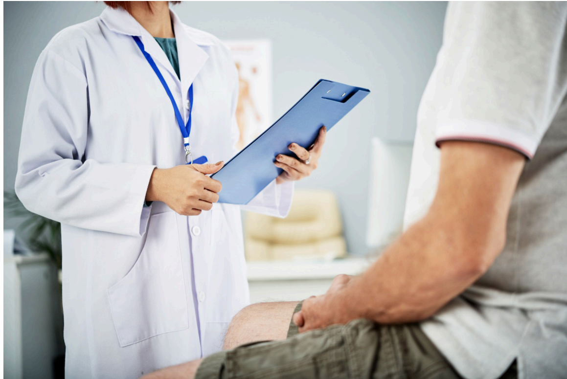
Cada vez más hombres en Colombia optan por la vasectomía, un método rápido, seguro y efectivo para la planificación familiar.

Bogotá lidera la demanda de estos procedimientos, concen-