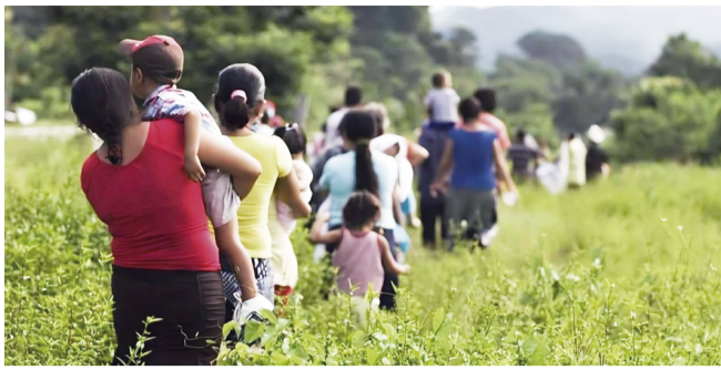
'Cruda' radiografía del conflicto armado en el Huila