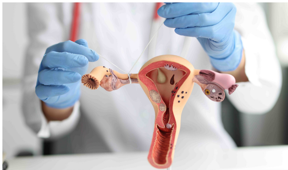
La región central del país registra un notable aumento en el número de vasectomías realizadas, destacándose Huila, Tolima y Meta.

En lo que va de 2024, más de 18.000 hombres se han realizado la vasectomía en Profamilia, lo que representa un aumento del 25% desde 2020. De este total la IPS ha realizado 3.689 vasectomías en los departamentos de Tolima, Huila, Boyacá, Arauca, Casanare, Caquetá y Meta.