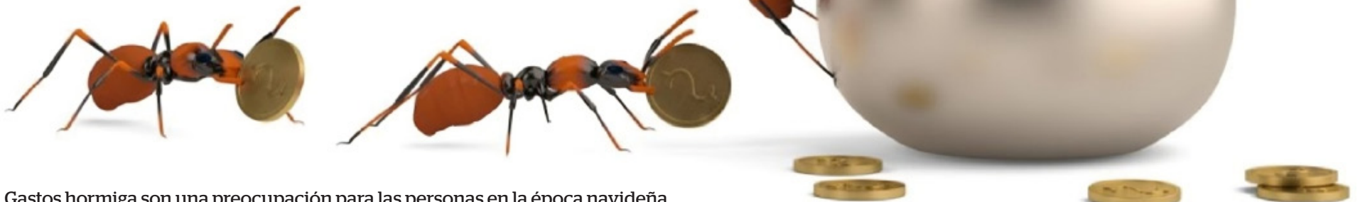
Gastos hormiga son una preocupación para las personas en la época navideña.

■ La magia de la Navidad puede convertirse en un dolor de cabeza financiero si no controlamos los pequeños gastos que parecen insignificantes, pero que al acumularse afectan gravemente el presupuesto. Aprende a identificar y evitar los “gastos hormiga” para cerrar el año con estabilidad económica.