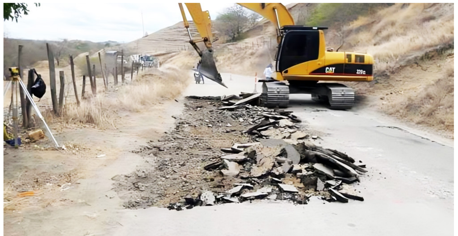
En la vía Cucará-Villavieja, descubrieron que se deben hacer de nuevo los estudios de suelo en puntos críticos, la topografía y revisar los estudios y diseños.

“Solo en materia de infraestructura vial, son 22 proyectos, sin embargo, hay otras dependencias que se encuentran analizando los planes que se encuentran a su cargo. Y en cuanto a la posible sanción, es el paso que no queremos dar. Por ejemplo, las obras van en un 10%, 20%, primero los sancionan, al no enviarle más dinero para su culminación, porque si con los primeros recursos no mostraron avances, no les giran más. Por eso preocupa el mal manejo que se la ha dado a los recursos de las regalías, y producto de ello, termine castigada la actual Administración Departamental”, puntualizó el funcionario.