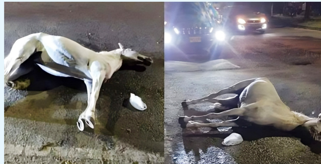
El maltrato a caballos en medio de las cabalgatas, se vienen registrando desde años atrás sin que se tomen medidas.