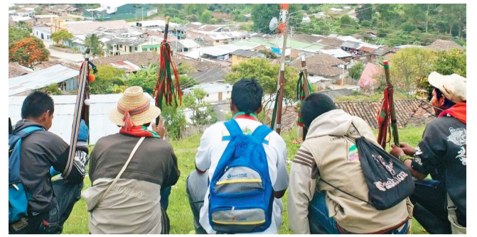
Millonaria inversión para población víctima