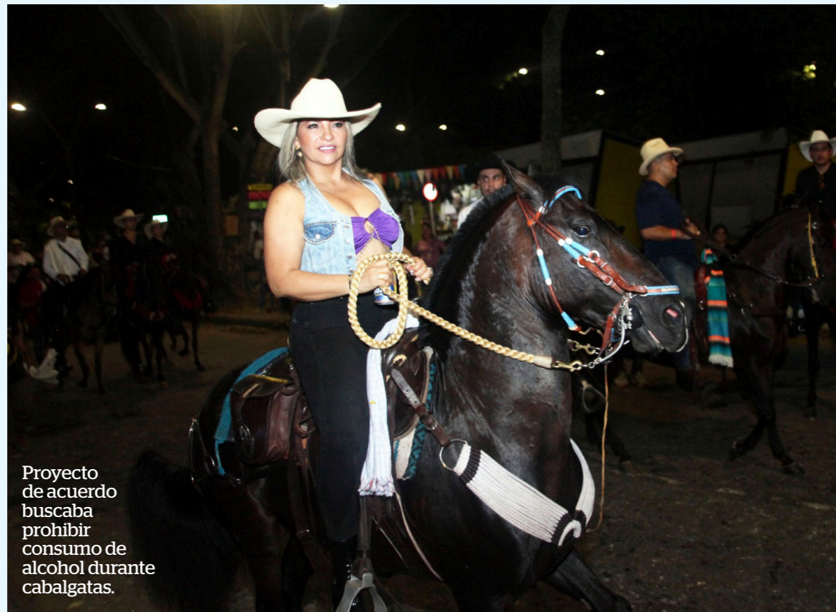
Proyecto de acuerdo buscaba prohibir consumo de alcohol durante cabalgatas.