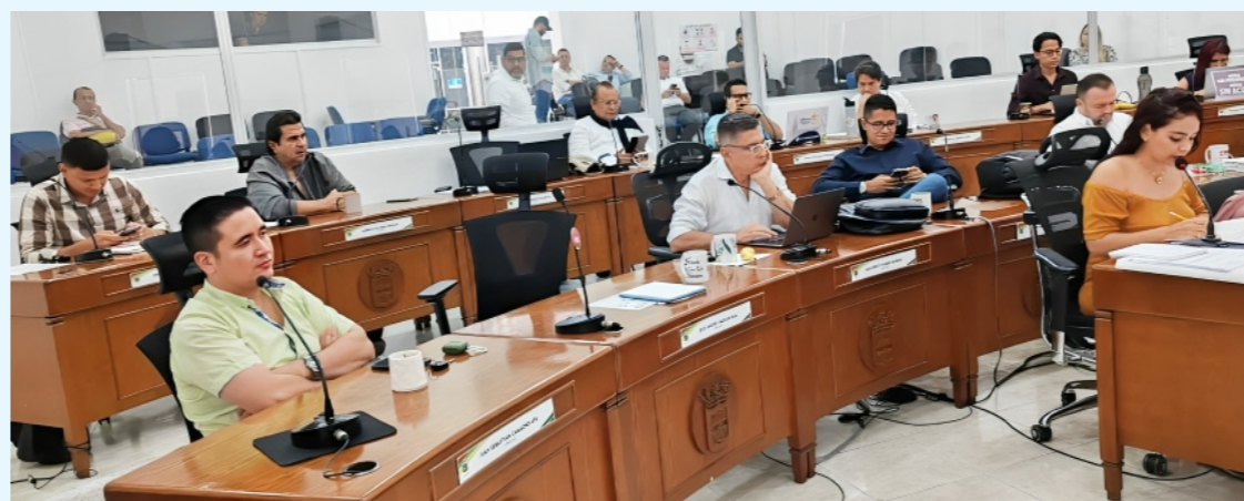
Mañana jueves se retomará este importante debate.