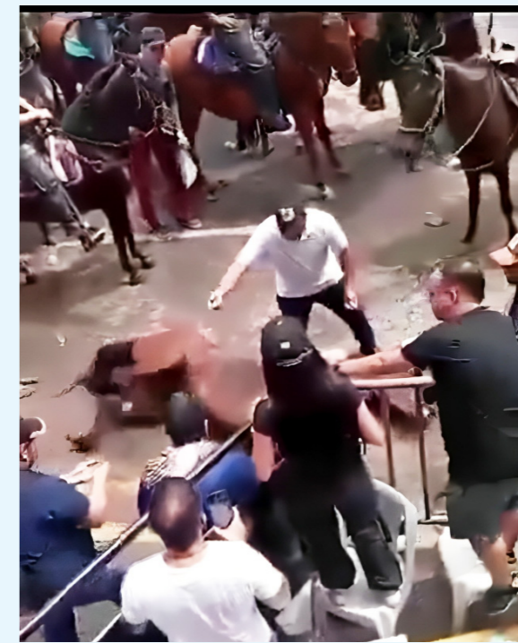
Varios casos de maltrato animal se registraron en San Pedro de 2024 en Neiva.

medida legal y de conciliación entre la tradición de las cabalgatas y la protección de los derechos de los animales.