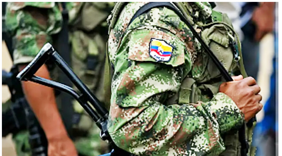
Profesores y estudiantes, en ocasiones son intimidados por los ‘armados’ cerca de las instituciones educativas.

torios, a la instalación de la Mesa. Tomando los plazos de ley”, indicó la funcionaria.