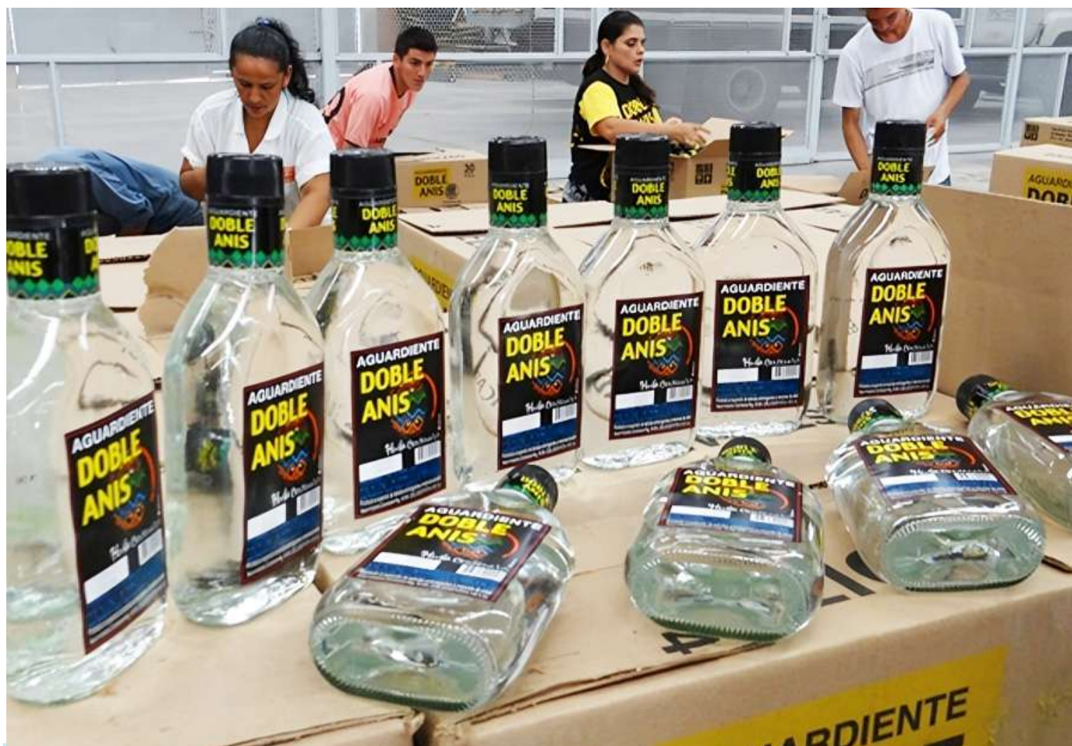
La controversia judicial se desató luego de la liquidación unilateral proferida por el Departamento.

El Consejo de Estado estableció tres puntos claves en su decisión. El primero de ellos tiene que ver con el desconocimiento del precedente judicial: la Sala enfatizó que los precedentes vinculantes