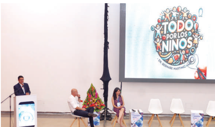
Casos muy complejos de cardiopatías congénitas en niños y adultos sorprendieron a los asistentes.

mos que nuestros equipos cumplan con los protocolos más exigentes, asegurando una atención interdisciplinaria y segura para los pacientes.”