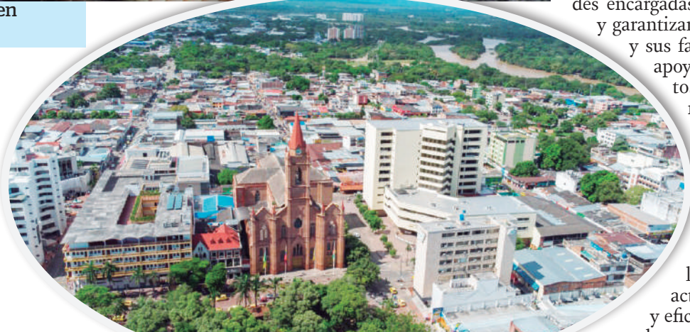
Neiva, Pitalito, La Plata y Garzón lideran las cifras.

Cada desaparición en el Huila no es solo una cifra, es una persona, una familia y una comunidad que sufre sino el reflejo de un cambio urgente en las políticas de seguridad y justicia en el departamento. La solidaridad, el compromiso de las instituciones y la colaboración de la ciudadanía serán claves para enfrentar este fenómeno y garantizar que cada persona desaparecida pueda ser encontrada, ya sea viva o fallecida, y que se haga justicia por aquellos que no tienen voz.