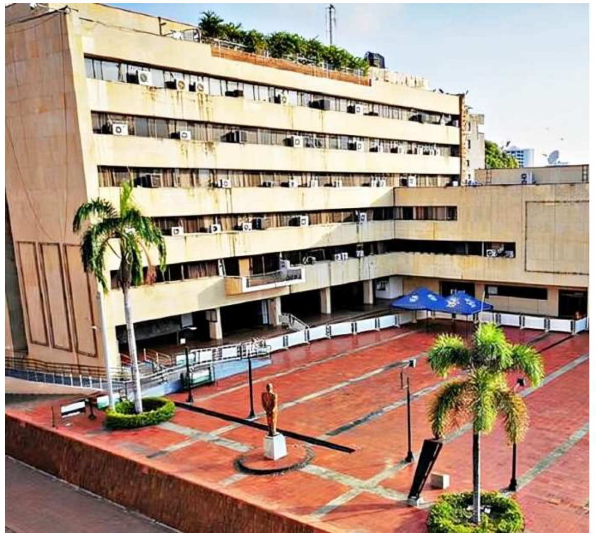
El Departamento liquidó unilateralmente el contrato de concesión en 2009.