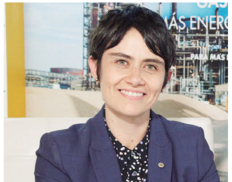
Figura de la semana

Veá columna completa en www.diariodelhuila.com