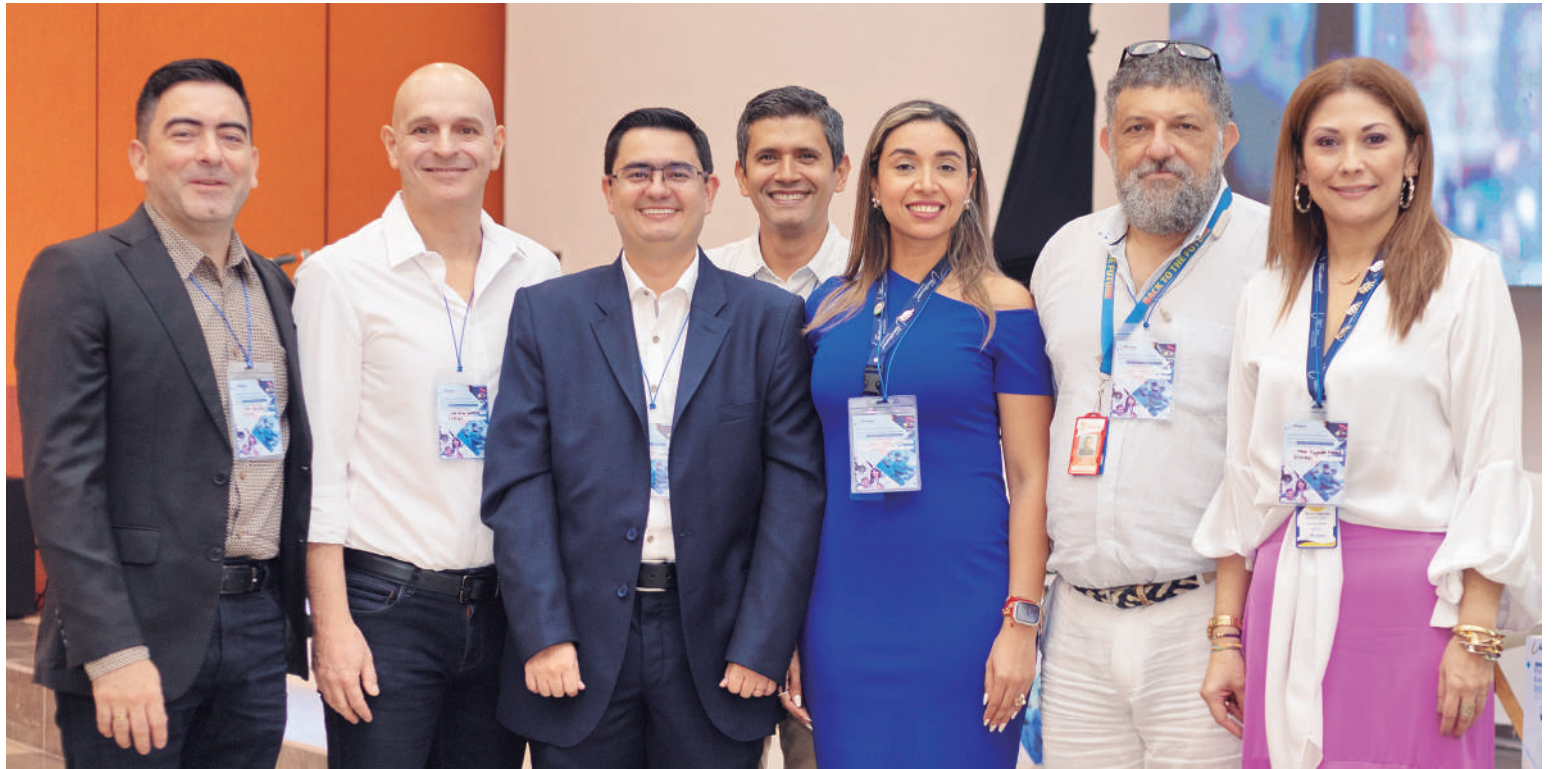
Grupo de especialistas de Clínica Medilaser participando como ponentes en el evento académico que se realizó en el Club Los Lagos de Comfamiliar del Huila.

“Trabajar en salud es complejo, por eso en Medilaser garantiza-