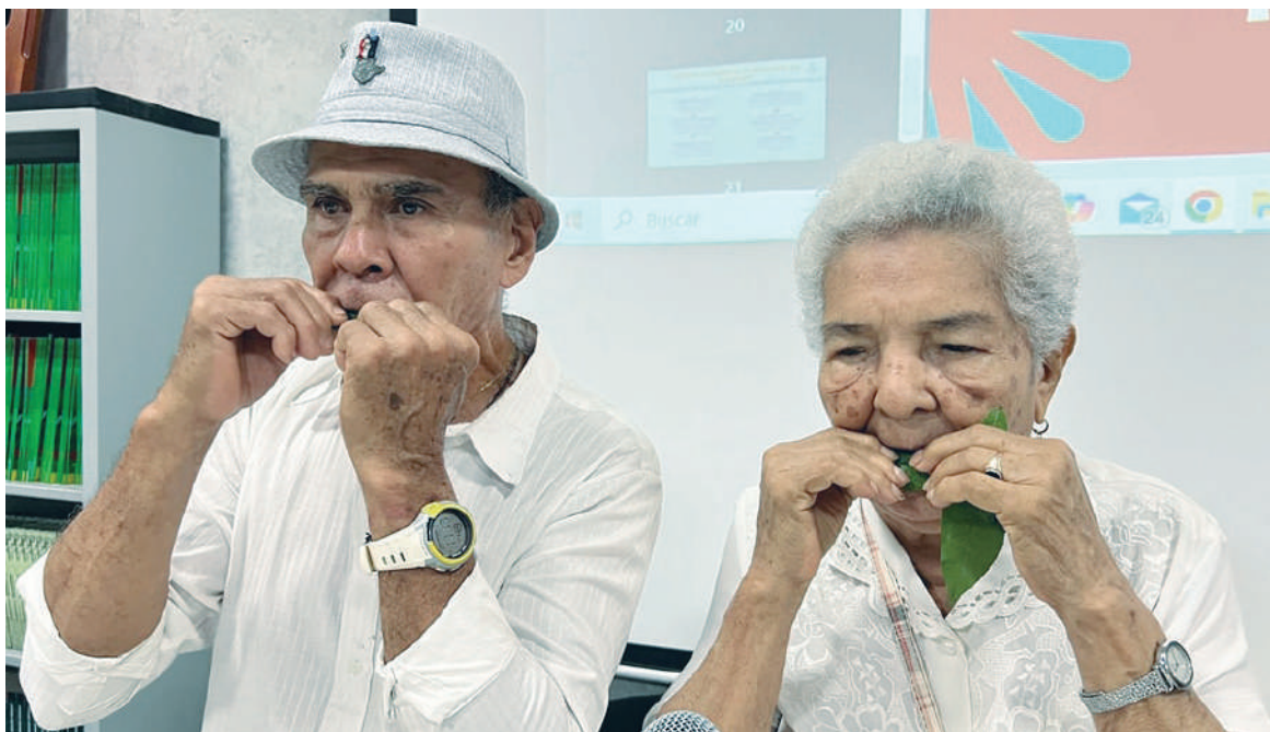
Imagen del día

Con el apoyo del Ministerio de las Culturas, se ha celebrado la primera reunión del Plan Especial de Salvaguardas, con el objetivo de proteger y preservar nuestras tradiciones. Desde la Secretaría de Cultura, hemos estado trabajando en la elaboración de este plan con el enfoque de rescatar el ecosistema que rodea nuestras fiestas en San Juan y San Pedro, como el rajaleña, la Interpretación de la hojita y otras expresiones culturales.