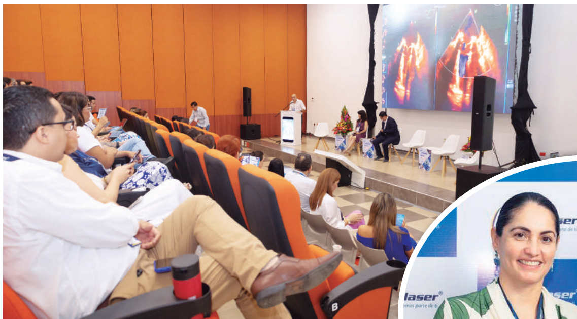
El encuentro se convierte en un referente de entrenamiento de alta complejidad en la región.

dan de nuestros pacientes estén a la altura de los estándares más exigentes.»