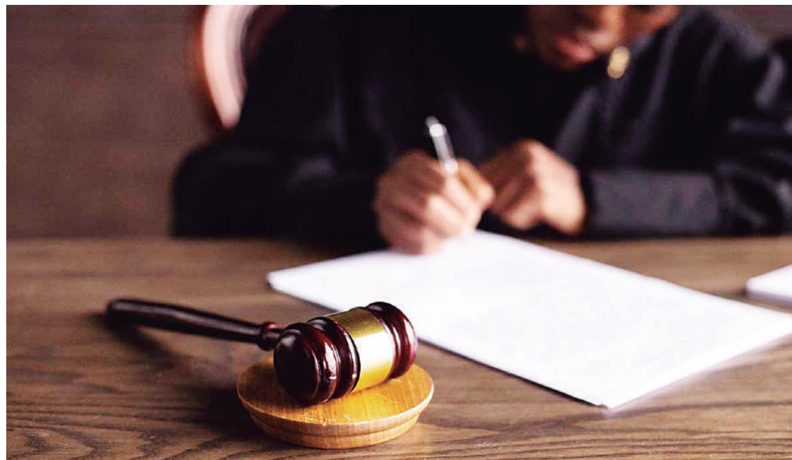
La justicia, les dijo, hay una trabajadora que tenía una garantía aforal, figura que debía ser respetada y no lo hicieron.