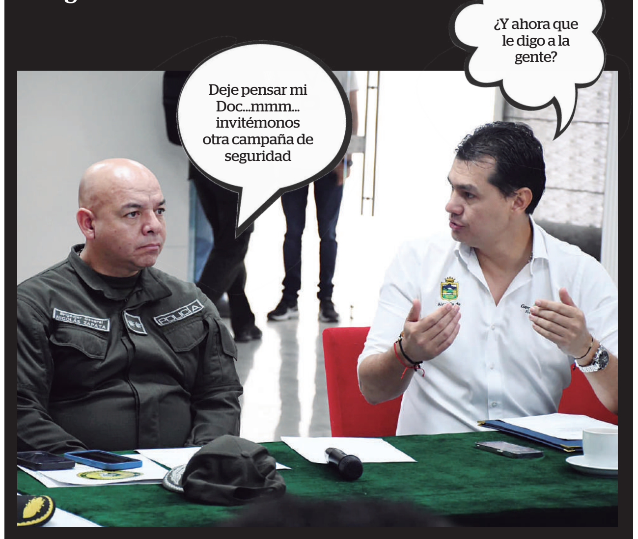
Imagen de la Semana

tes se encuentran divididos entre ver esta inversión como el gran impulso para Neiva o una jugada arriesgada que podría terminar en elefantes blancos. La pregunta es: ¿es este un paso hacia el futuro o solo una apuesta arriesgada que podría dejar a la ciudad pagando la factura de un sueño demasiado grande? Mientras algunos aseguran que la inversión será la clave para una infraestructura moderna y una calidad de vida mejorada, otros ya están alertando sobre los posibles efectos secundarios de tan altos compromisos financieros. ¿Qué pasará en el segundo debate? El futuro de Neiva podría estar en juego.