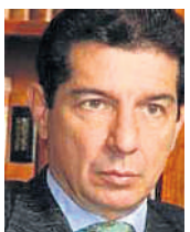
JOSÉ FÉLIX LAFAURIE RIVERA