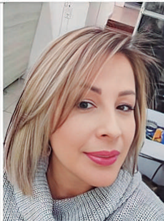
En lo que va del 2024, se han registrado 210 casos de desapariciones en el Huila.

sonas han sido localizadas, lo que equivale al 33.8% de las desapariciones. Aunque la mayoría de los casos corresponden a personas que han sido encontradas con vida (6 personas), los 5 casos de personas fallecidas reflejan que no todas las desapariciones terminan con un desenlace positivo. La angustia de los familiares de las personas desaparecidas es indescriptible, ya que cada día que pasa sin noticias es una condena de incertidumbre.