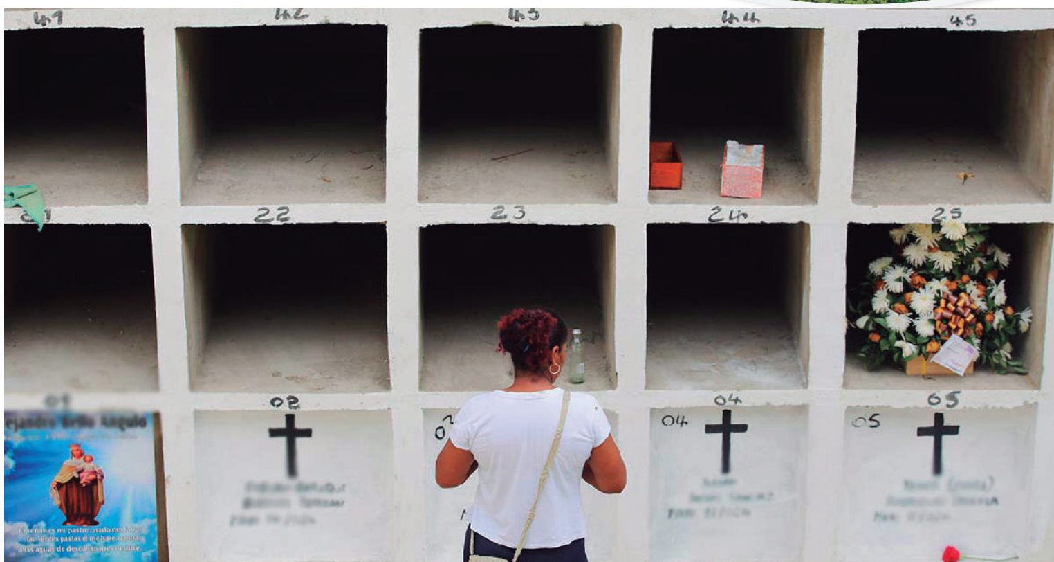
71 personas han sido localizadas, de las cuales 66 vivas y 5 han sido encontradas sin vida.

para enfrentar este fenómeno, como la Ley de Víctimas y el Sistema de Búsqueda Urgente, los resultados han sido limitados. El sistema judicial enfrenta serias dificultades para esclarecer los casos, y la coordinación entre las fuerzas de seguridad y las autoridades civiles continúa siendo deficiente en muchas regiones, lo que agrava la situación. En este contexto, el Huila no es una excepción, ya que las diná-