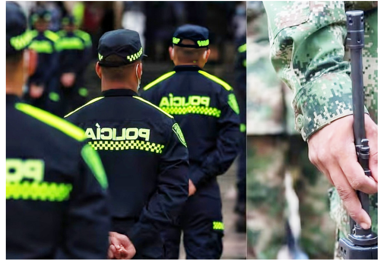
Y a pesar de la seguridad existente siguen los desplazamientos forzados, reclutamientos y amenazas.

Asimismo, la líder hizo un llamado al Gobierno Nacional, y Departamental, para que tengan acciones y así contrarrestar esta problemática, “no queremos estrategias de ‘papel’, y que, a los compromisos contraídos en los consejos, se les hagan el respectivo seguimiento para que se cumplan”.