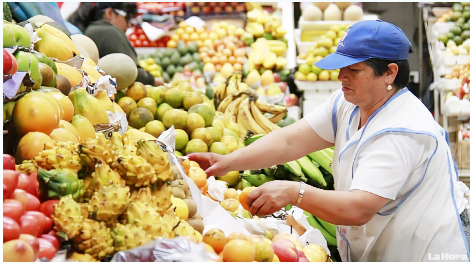
Se espera que esto motive a más colombianos a endeudarse, aunque esta expectativa depende de qué tan seguros se sientan financieramente.