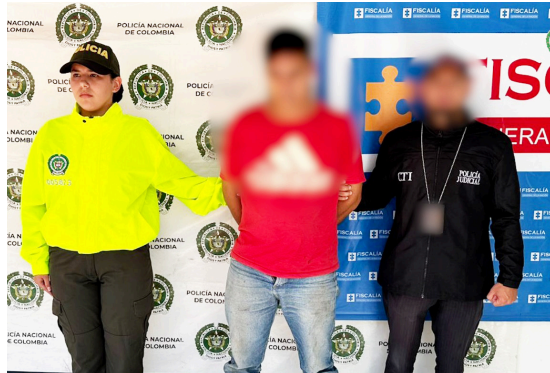
Alias 'El Tigre' capturado.

Según la investigación, este individuo habría accedido de una menor el pasado 1 de junio del presente año, en un potrero ubicado en inmedia-