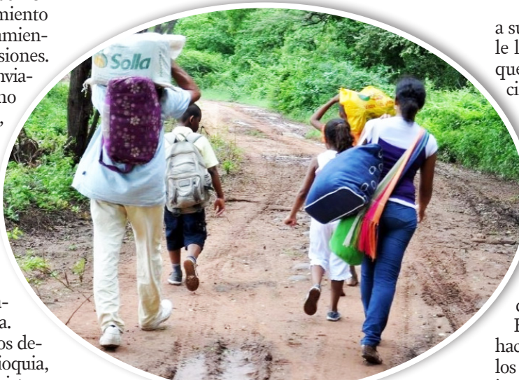
Una familia huilense debió salir de la región, porque los 'armados', le iban a reclutar a su hija.

del Conflicto Armado y Población Vulnerable (Viccoar), develó: "tenemos 15 líderes sociales amenazados, incluso conocimos el caso de una familia que abandonó el Departamento, dejando absolutamente todo, porque le iban a reclutar a una de sus hijas".