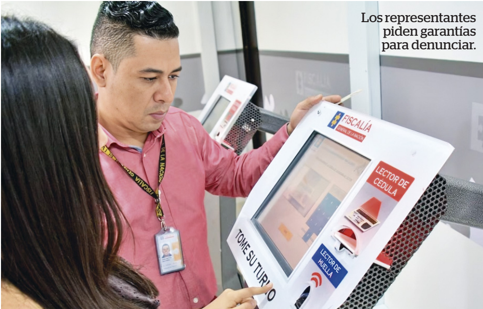
Los representantes piden garantías para denunciar.

“Tememos que existen más de 15 líderes, lideresas y personas que ejercen estas labores en varias zonas rurales, vienen siendo objeto de amenazas, primero porque están abanderando causas, visibilizan las problemáticas y segundo por ser dueños de establecimientos comerciales, cuentan con ingresos mensuales, y a quienes les han llegado mensajes de texto”, expresó la funcionaria.