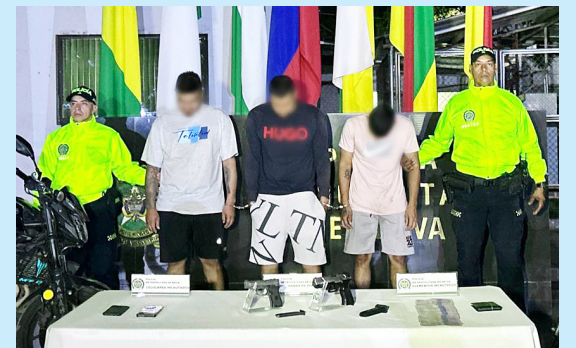
Alias 'Cejas', 'Véliz' y 'Camilo' capturados.

Los presuntos delincuentes fueron capturados en la comuna 6 de la capital Opita, donde las autoridades encontraron parte del dinero robado, dos armas de fuego tipo pistola y dos motocicletas de alto cilindraje que habrían sido utilizadas para la huida.