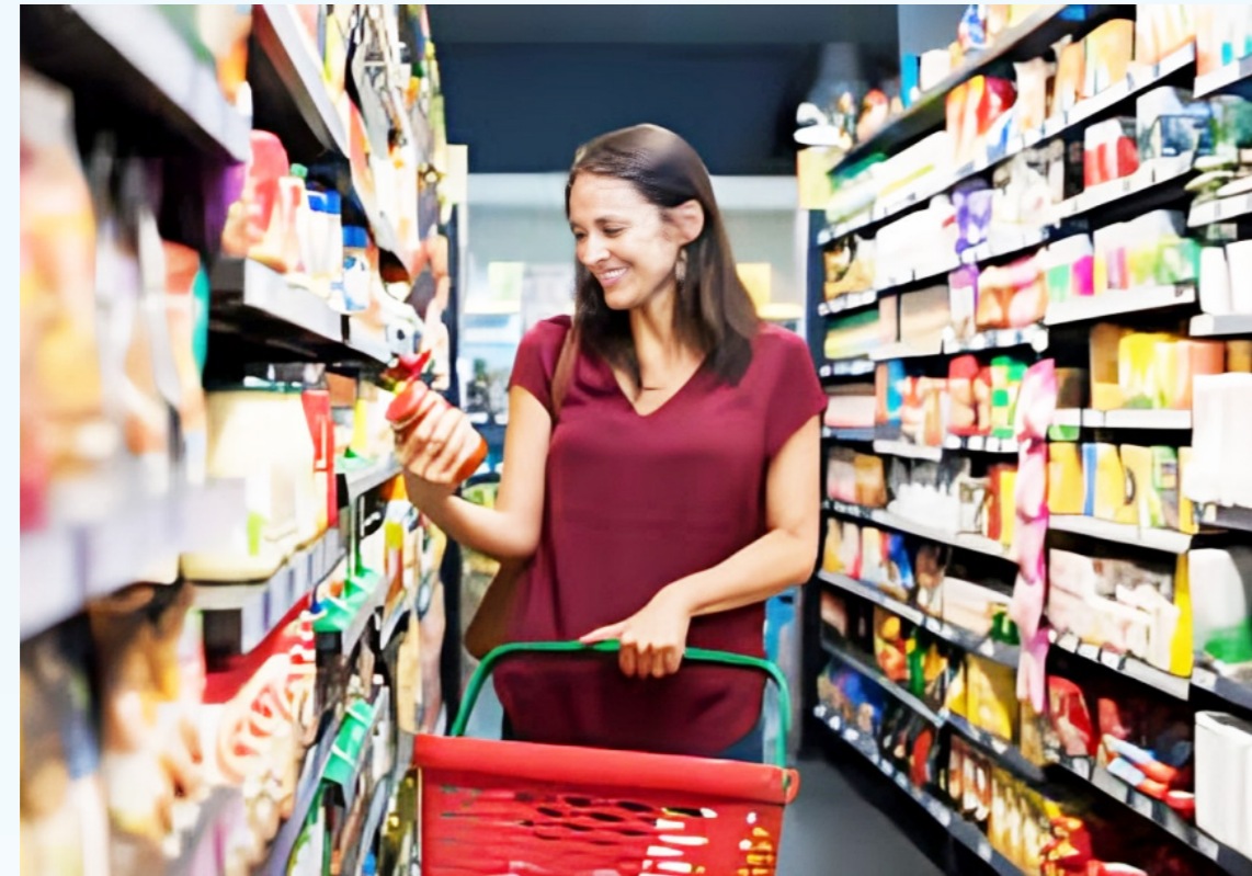
La comercialización de productos más económicos bajo la marca del propio establecimiento ha ganado terreno en los hogares colombianos, ofreciendo calidad a un precio más accesible.

El ajuste hacia un consumo más estratégico también está relacionado con una búsqueda activa de la funcionalidad. Los colombianos, en su mayoría, se están inclinando por compras que no solo sean más económicas, sino que también ofrezcan un retorno claro en términos de utilidad. Este tipo de consumo puede observarse particularmente en la preferencia por