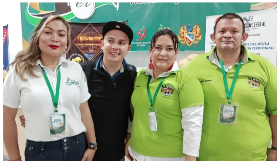
Empoderamiento de la mujer en el turismo rural