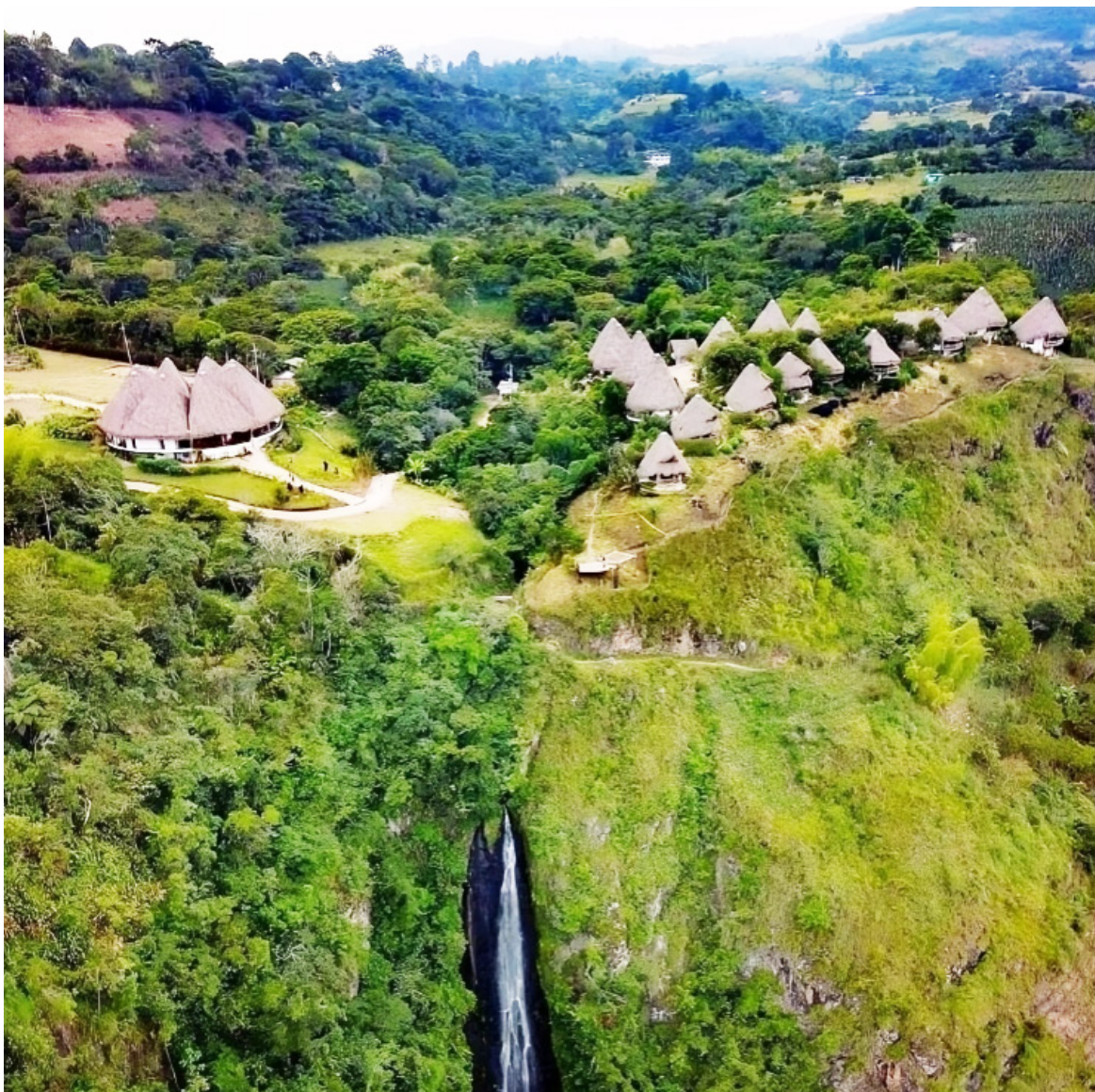
Es una de las grandes apuestas del Huila.

Los criterios de selección también incluyeron la singularidad y representatividad de atractivos turísticos en el mercado internacional, las acciones que llevan a cabo en sostenibilidad social, ambiental y económica; la gobernanza y desarrollo turístico, y la infraestructura turística con la que cuentan.