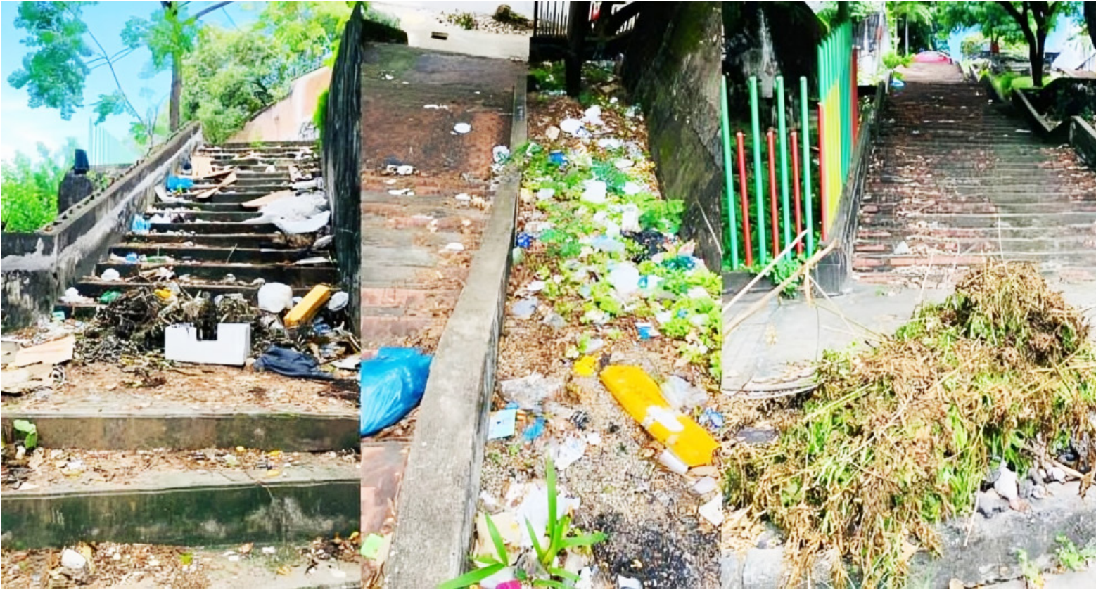
La cultura ciudadana de conservación es limitada.

infraestructuras dañadas, superficies irregulares o falta de luz en las noches.