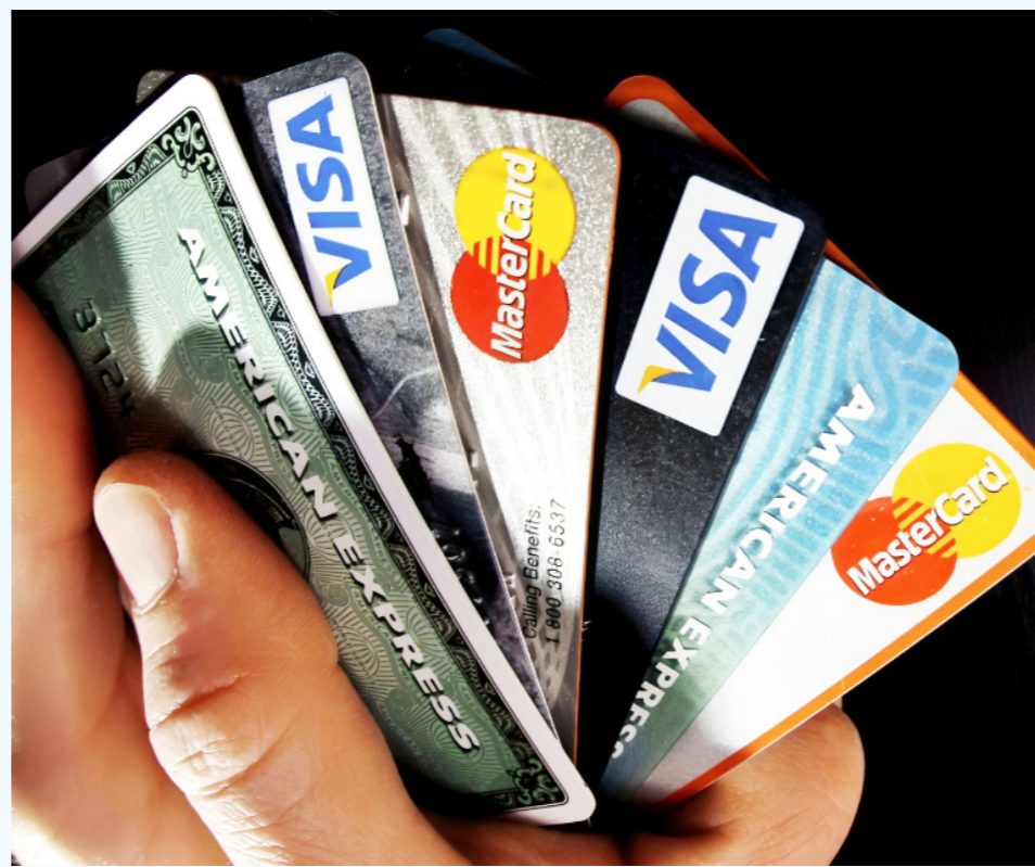
En Colombia se han realizado varios esfuerzos para incentivar el consumo, entre ellos la reducción de tasas de interés.

La búsqueda de un balance entre el ahorro y la calidad también