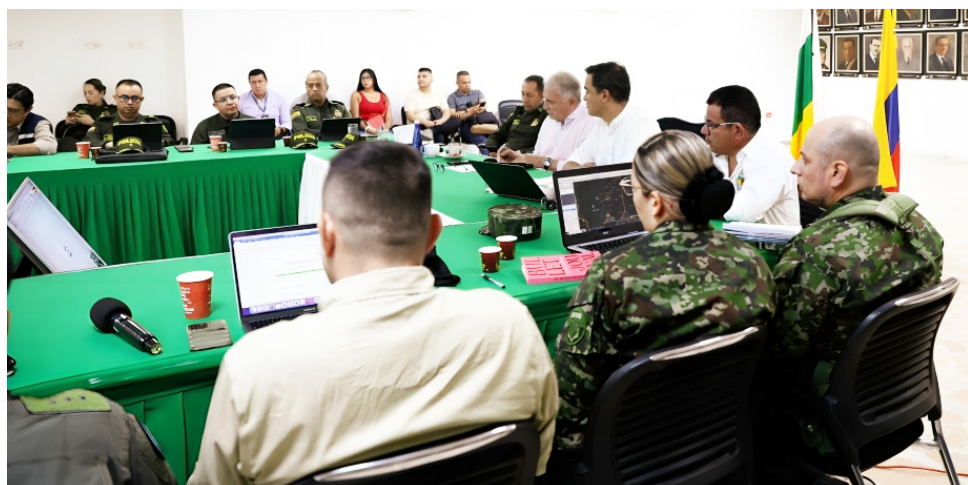
Los voceros pidieron ser escuchados en los consejos de seguridad.