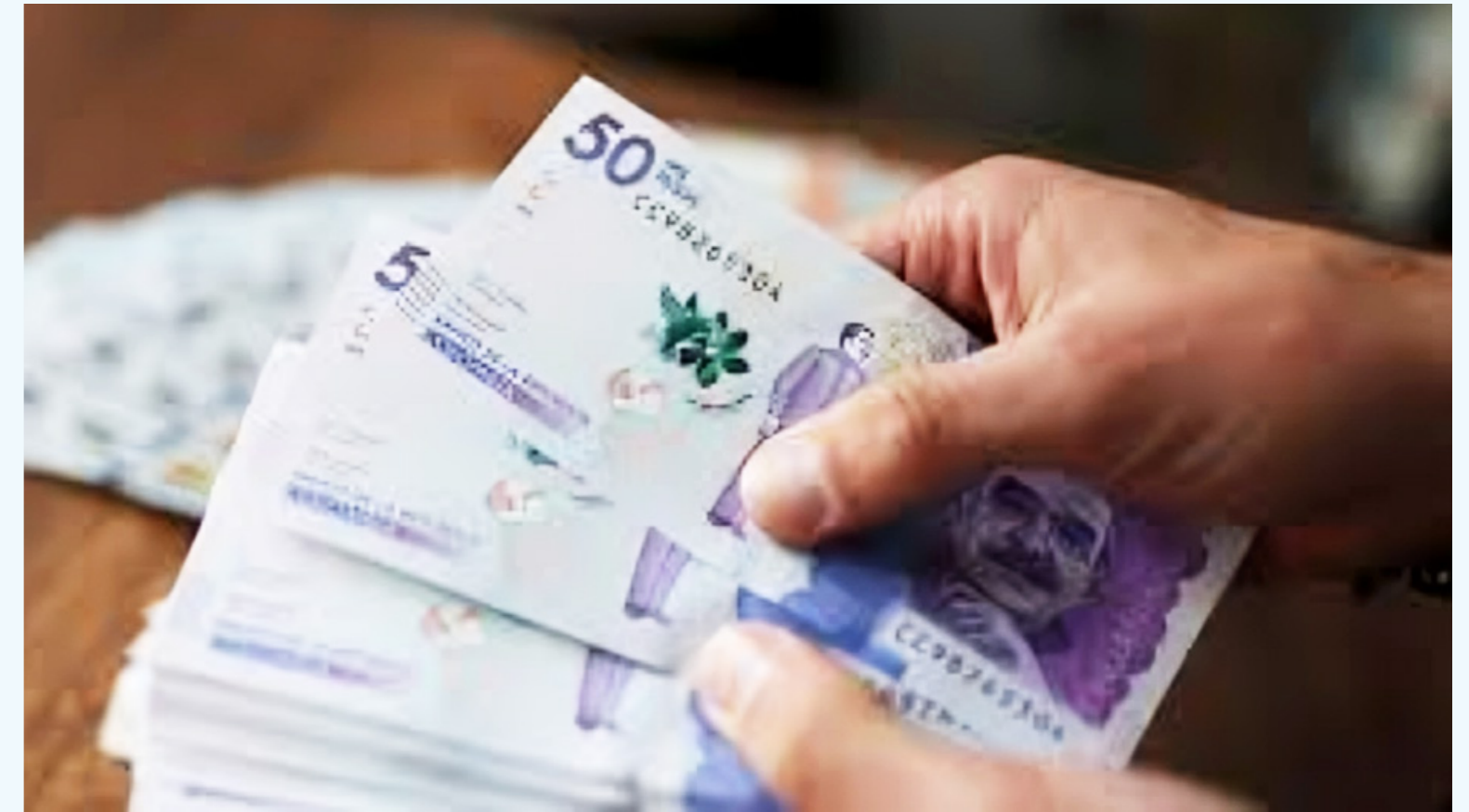
La inflación, el aumento en el costo de vida, los altos precios de productos básicos y la incertidumbre económica han obligado a los colombianos a ser más intencionales en cómo gastan.

ha puesto en evidencia la demanda por tamaños de productos que ofrezcan una mejor relación costo-beneficio. El informe muestra que el 39% de los encuestados en Colombia espera que los fabricantes ofrezcan tamaños más grandes de productos a un menor costo por porción, mientras que un 13% prefiere tamaños más pequeños y asequibles. Esta demanda, de un lado, responde a la necesidad de los consumidores de obtener más por su dinero, pero también refleja una predisposición a cambiar de marca o elegir productos en presentaciones más grandes si el precio es adecuado.