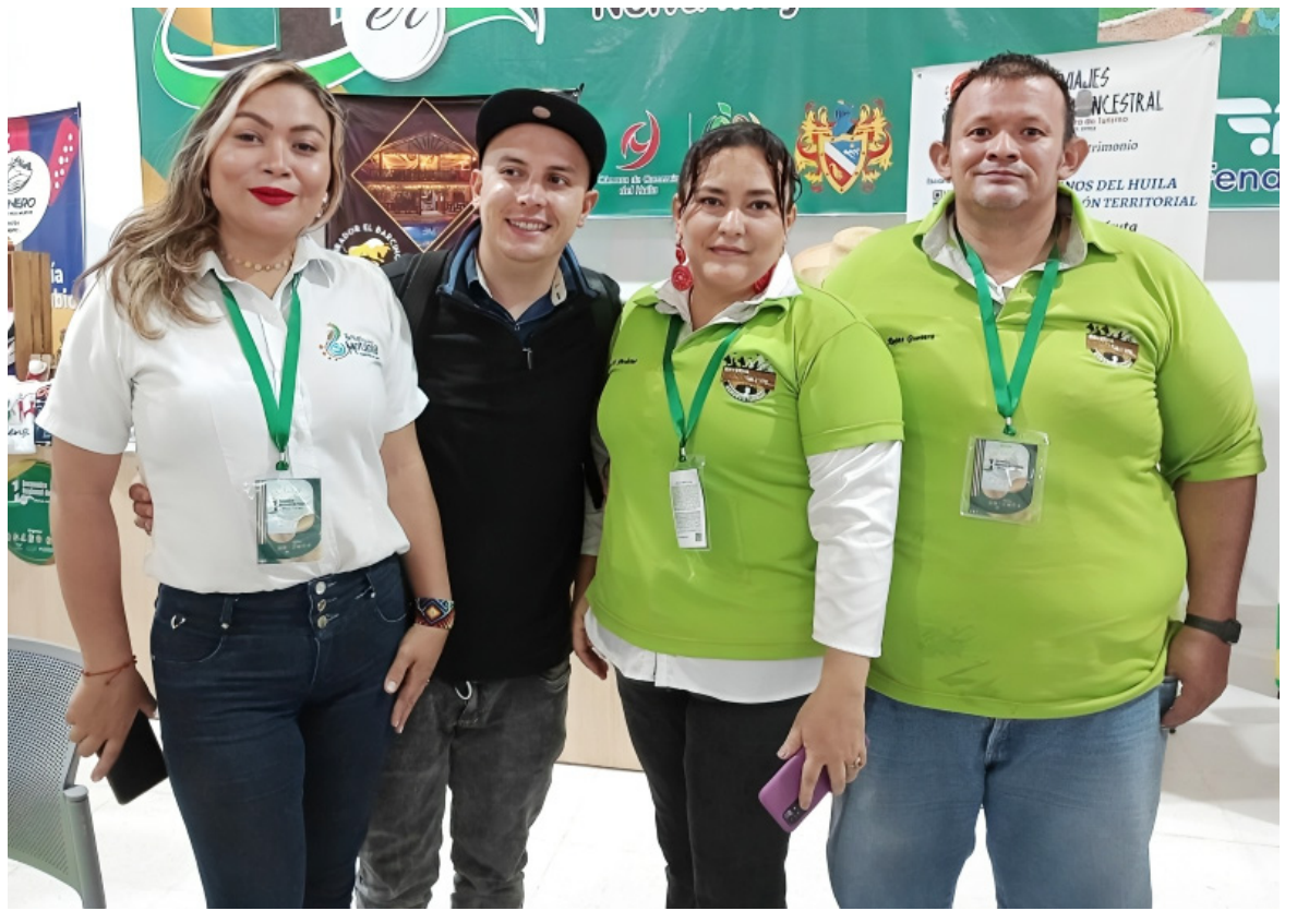
El turismo rural ayuda a que la mujer del campo tenga sus propios recursos.

El 67 % de los participantes son adultos (de 27 a 59 años), el 25 % jóvenes (18-26 años) y el 9 % son adultos mayores (60+ años). El 22 % del grupo pertenece a la población campesina y el 23 % se define como mujeres rurales. Además, 26 % de todas las iniciativas se dedican al ecoturismo, seguidas del alojamiento (14 %) y el turismo comunitario (10 %).