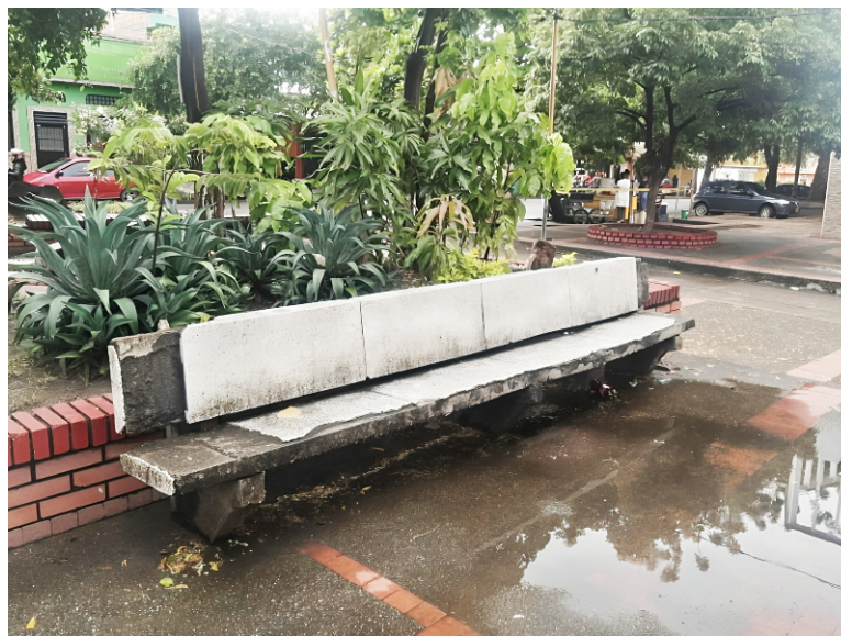
Mantenimiento preventivo es esencial.

“El turismo es uno de los sectores más golpeados por la falta de atención”, afirmó el concejal. “La ciudad pierde atractivo para los turistas, lo que repercute directamente en la economía local. Es urgente cambiar la percepción de los visitantes