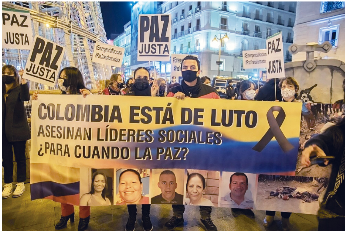
Según Indepaz, a la fecha van 148 líderes sociales y defensores de derechos humanos ultimados en este 2024.