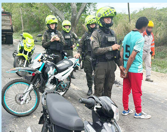
Alias ‘Haider’ capturado.

Durante el recorrido, las unidades policiales observaron al sujeto movilizándose en una motocicleta marca Viva R 115 de color negro. Al notar la presencia de las autoridades, el hombre intentó darse a la fuga, pero fue interceptado metros más adelante. Al realizar la verificación de la placa en el sistema de la Policía, se confirmó que la motocicleta contaba con un reporte por hurto.