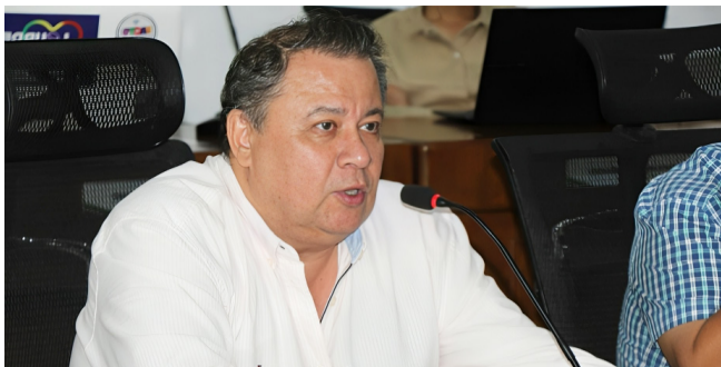
Falta de mantenimiento urbano en Neiva