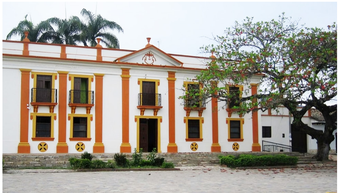
El municipio de Paicol, se encuentra entre los más bonitos para hacer esta clase de expediciones.