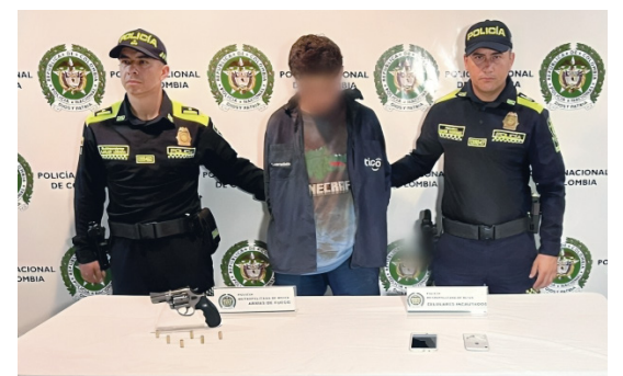
Hombre capturado por la Policía.

Al recibir la alerta, una patrulla de vigilancia del CAI Periodistas se movilizó rápidamente hacia la zona industrial, donde interceptaron a dos individuos en una motocicleta Yamaha de color negro. Al notar la presencia policial, los sospechosos intentaron escapar y sacaron un arma de fuego tipo revólver, disparando contra los agentes. No obstante, los uniformados lograron reaccionar rápidamente y reducir a los hombres, disparando a