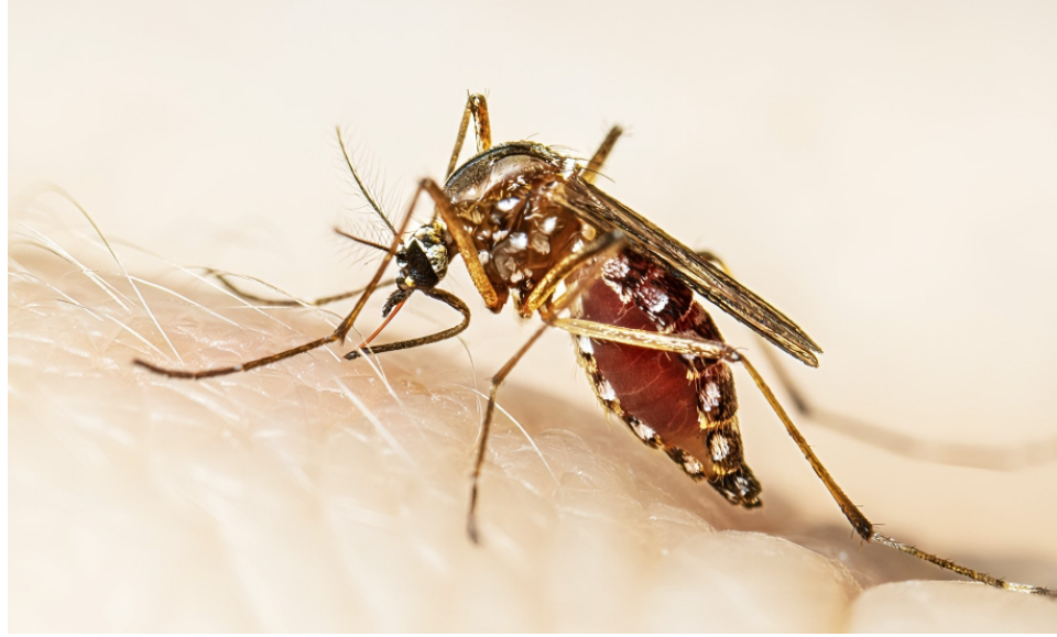
El dengue, transmitido por el mosquito Aedes aegypti , se intensifica con fenómenos climáticos como El Niño y La Niña.

En Colombia, el dengue sigue un patrón estacional influenciado por fenómenos climáticos como El Niño y La Niña, que alteran las condiciones de lluvia y temperatura, creando el ambiente ideal para la proliferación del mosquito transmisor. Hasta la última semana de agosto de 2024, el Ministerio de Salud y Protección Social confirmó 115 muertes asociadas al dengue, un recordatorio de la urgencia de redoblar esfuerzos en las zonas más afectadas y aumentar la concien-