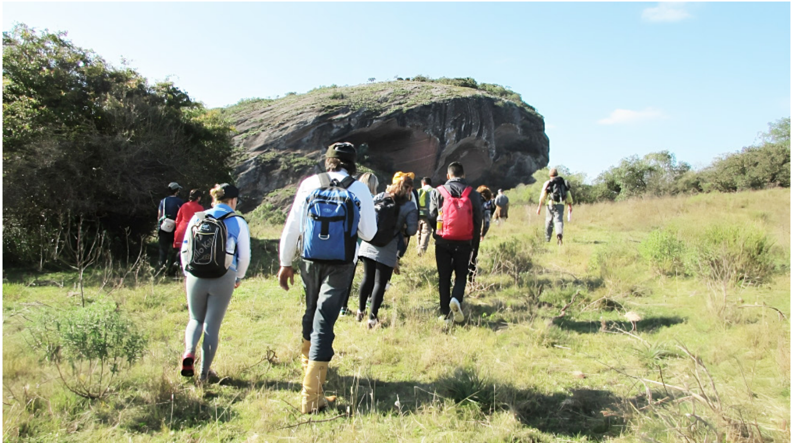
El turismo rural en el país carioca, ya lleva 30 años de desarrollo.