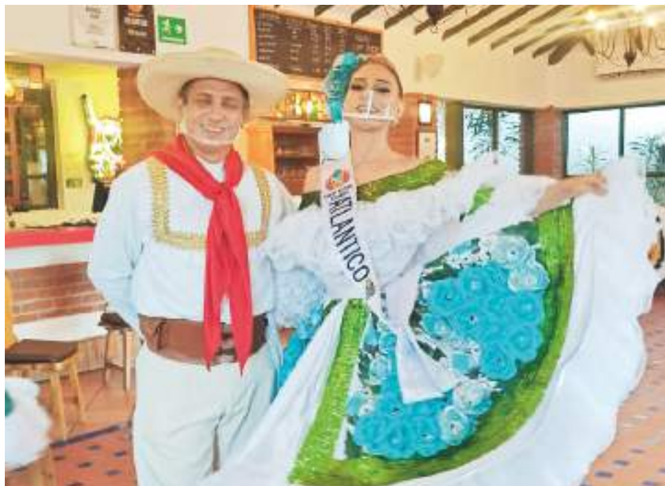
El bailarín está preparando a la Señorita Atlántico.

“Hemos elevado una solicitud al Secretario y a la directora de Corposanpedro para que se mantenga el número de tres que se había acordado hace tres