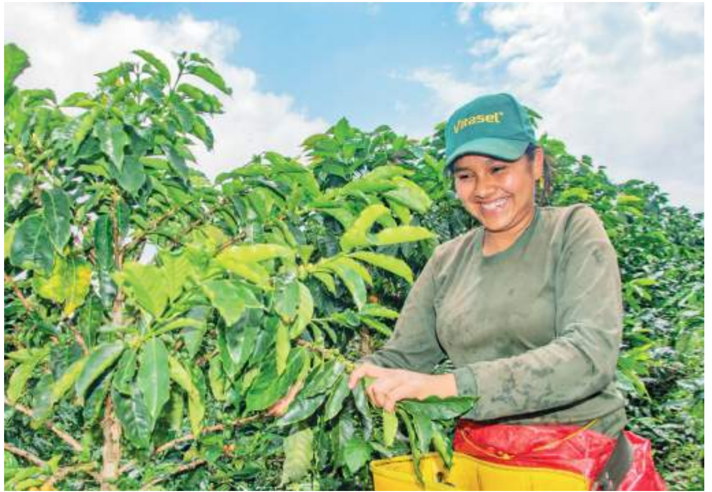
Las diferentes Líneas Especiales de Crédito (LEC), amplió este año el monto hasta por $40 millones.

■ Debido al éxito alcanzado con la línea de crédito para jóvenes y mujeres rurales al cierre de 2021, que logró colocar cerca de 1.450 créditos por un monto superior a los $11.000 millones, el Gobierno Departamental decidió ampliar el portafolio para que otros grupos poblacionales también puedan acceder a recursos a través de la Línea Especial de Crédito LEC Huila - Finagro.