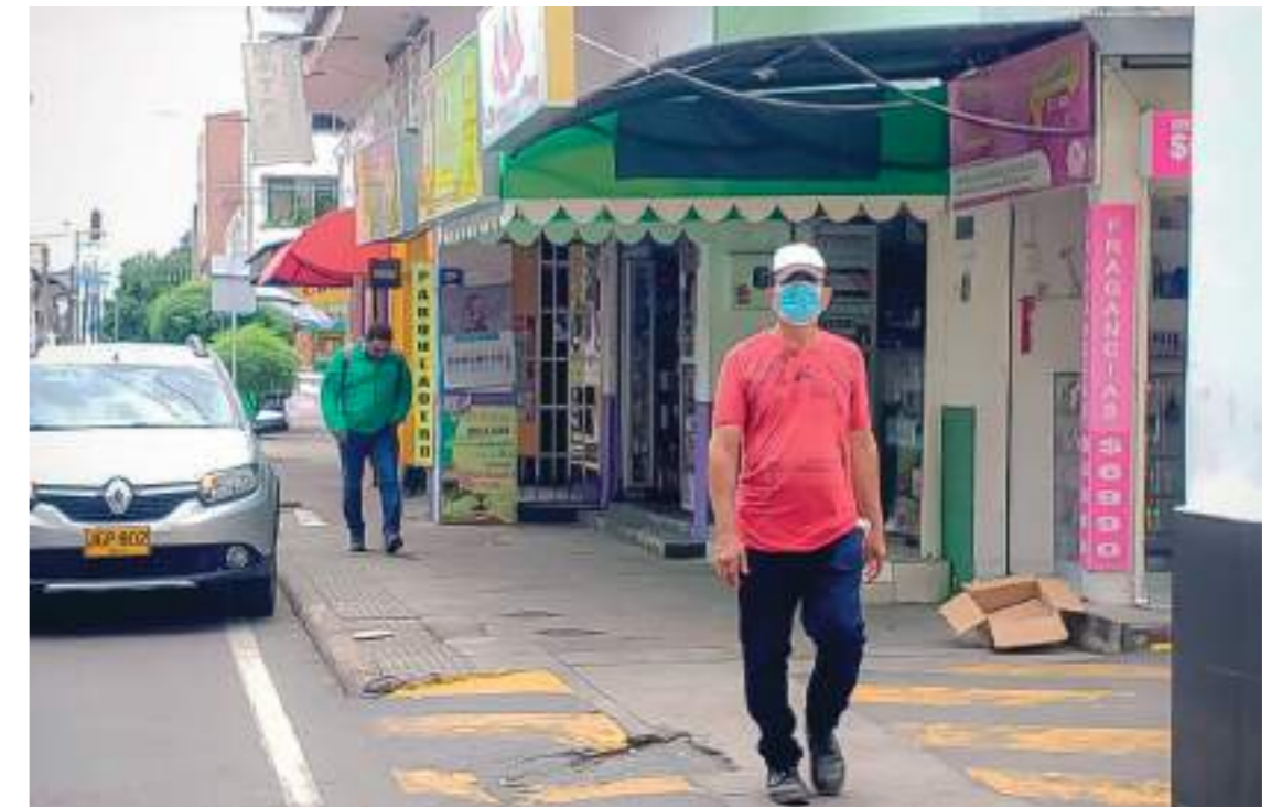
La calle de la belleza, ofrece la posibilidad de caminar para acceder a cada local.

Este lugar también es conocido como el rincón de la belleza, pues en medio de la calle, hay comerciantes independientes que además de ofrecer sus productos también aplican tratamientos faciales, tratamientos capilares, diseño de ceja, depilación, aplicación de pestañas y sobre todo la aplicación y diseño de uñas.