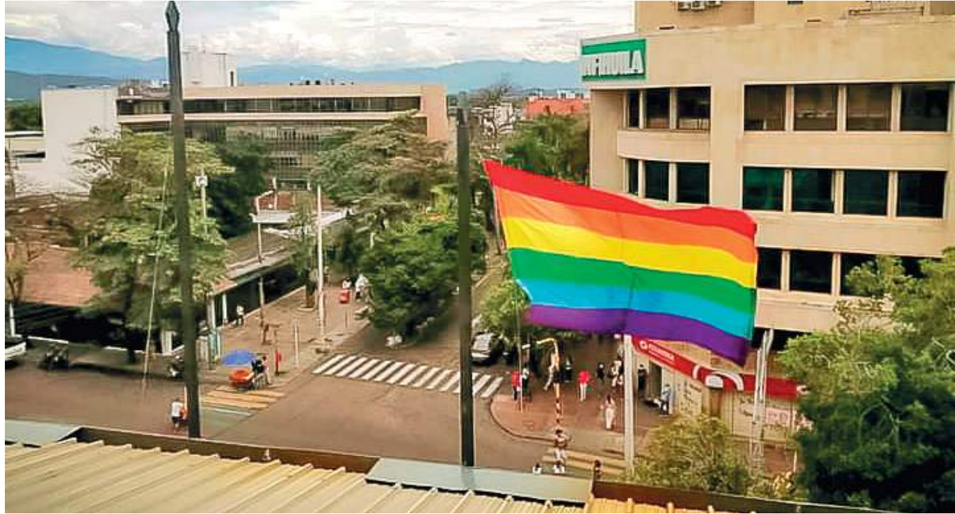
A la población sexualmente diversas les ha tocado no ser tan visibles en diversos espacios, por miedos a ser violentados.

Respecto al acoso estudiantil que se presenta en algunas instituciones, agregó que, “a los primeros que hay que abordar es a los educadores, en lo que tiene que ver con la deconstrucción de imaginarios y eliminación de prejuicios de los docentes, para poder trabajar estos problemas de acoso escolar. Esperamos avanzar en eso este año, para poder hacer procesos directos. Los estereotipos llevan a dividir más la sociedad, pero ahora la juventud ha cambiado y quieren crear sus propios constructos sociales y nosotros tenemos que respetar esa evolución del ser humano. Cada ser humano es una sexualidad y decide cómo vivirla, eso es lo que se debe respetar, en su libre desa-