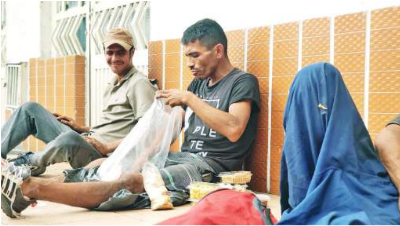
Neiva cuenta con cerca de 440 habitantes según el DANE. Muchos de ellos no son de la ciudad, pero llegan acá por ser “un buen vividero”.