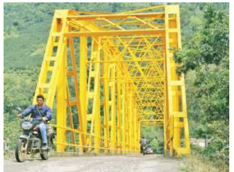
La intervención del Puente Oritoguz, constituyó la pintura de la infraestructura y los trabajos de rehabilitación, que permitieron mejorar la movilidad y llevar bienestar a los habitantes de los municipios y veredas vecinas de Elías, Saladoblanco y Oporapa.

Asimismo, se conoció que el gobierno departamental prepara una serie de inversiones para rehabilitaciones viales con Placas Huellas, pavimentaciones y mantenimiento de infraestructura vial que llegarán a diferentes municipios del Huila, las cuales contribuirán al desarrollo de la región.