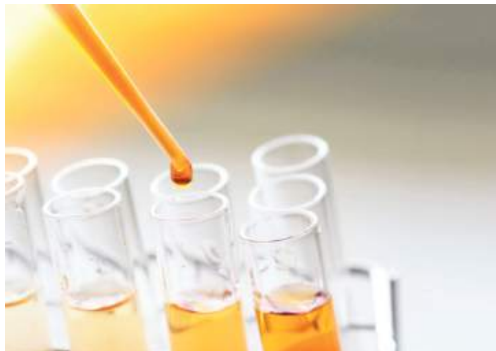
Los científicos han identificado varias bacterias en muestras de orina de hombres que desarrollaron cáncer de próstata agresivo.

"Se necesitan más estudios para establecer cómo estas bacterias están involucradas en el crecimiento del cáncer de próstata, pero esta investigación podría ayudar a generar nuevas herramientas de detección y prevención que ayudarían a reducir el impacto de estos cánceres en la sociedad", concluyó.