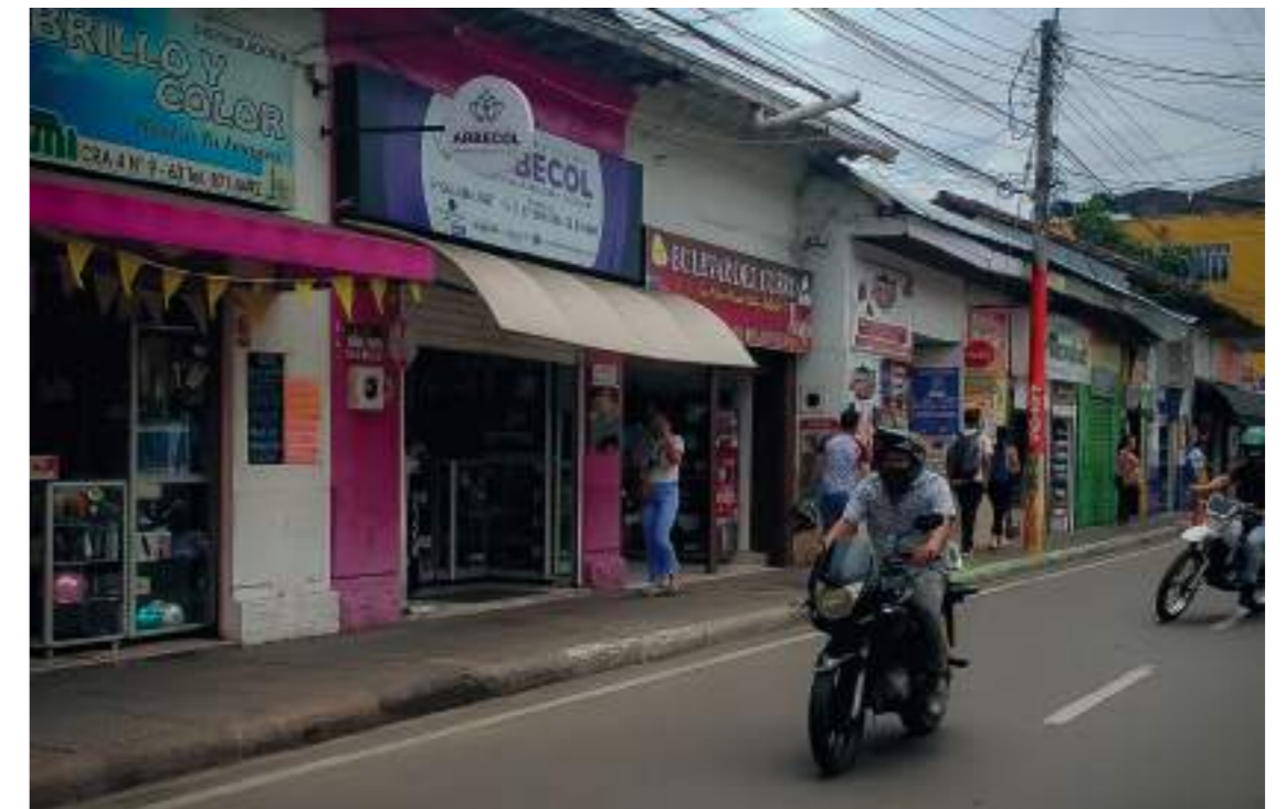
Los nombres de los comercios son variados.

“Aquí le ofrecemos toda clase de productos tanto nacionales como extranjeros, los tratamientos para el cabello, el cuidado de la piel, el arreglo de manos y pies entre otros”.