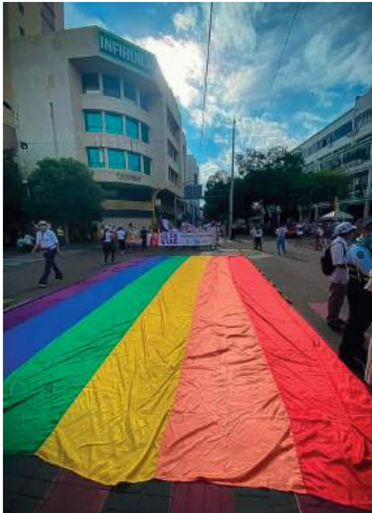
Aunque en el Huila no hay reportes específicos de agresiones físicas en los últimos años, sí se evidencian ataques psicológicos y verbales.

Asimismo, el integrante de la organización mencionó que les ha tocado no ser tan visibles en diversos ámbitos, por los miedos que los aquejan. "Uno de los hechos más reiterativo se da en asis-