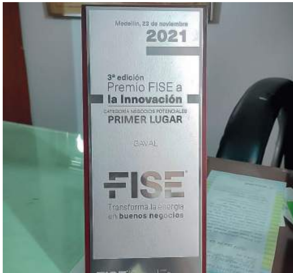
Se consagró como la ganadora de la 'Feria Internacional del Sector Eléctrico', en la categoría 'Negocios Potenciales'.

Tras una amplia trayectoria de formación y la alta probabilidad de ganar, decidió participar de la 'Feria Internacional del Sector Eléctrico' y postularse el año pasado cuando se abrió la convocatoria, al Premio a la Innovación del año 2021, en la categoría de 'negocios potenciales'. "Vi que tenía opción de ganar y me atreví a hacer esta postulación del proyecto. Nos tocó hacerla en octubre