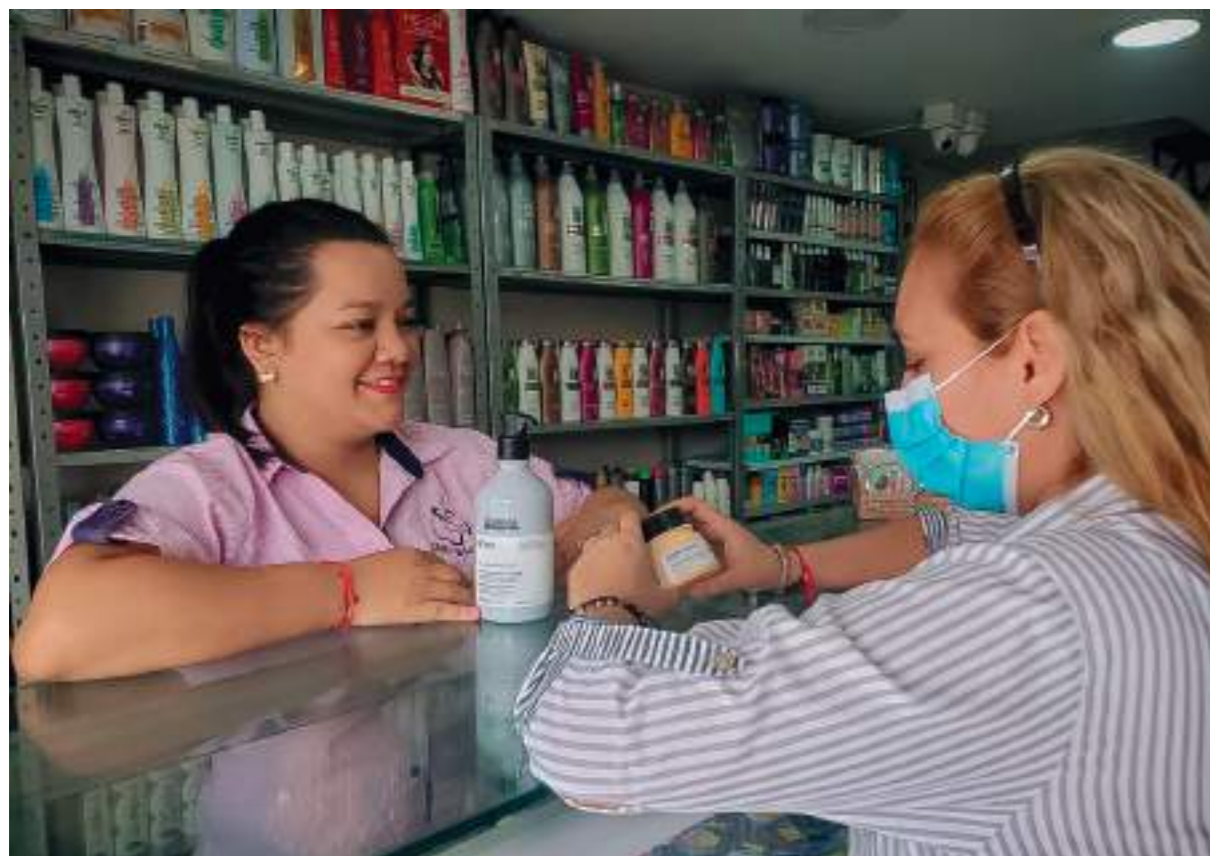
La calle de la belleza en Neiva se encuentra entre las calles 9 y 10 con carrera 10.

En pleno centro de la ciudad de Neiva, en la carrera 4 entre calles 9 y 10 se encuentran toda una variedad de almacenes dedicados a la venta de productos relacionados con la belleza, conocido como “La calle de la belleza”.