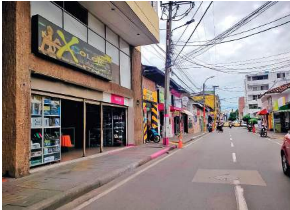
La calle de la belleza en Neiva se encuentra entre las calles 9 y 10 con carrera 10.