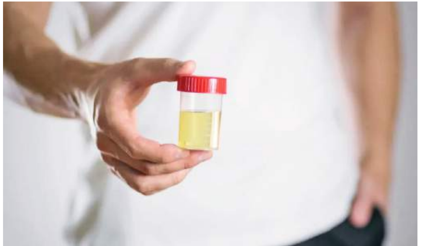
Aunque el hallazgo es prometedor, es muy pronto para saber si las bacterias son causantes de los casos de cáncer de próstata.

Identificaron cinco tipos de bacterias que eran comunes en muestras de orina y tejido de hombres cuyos cánceres final-