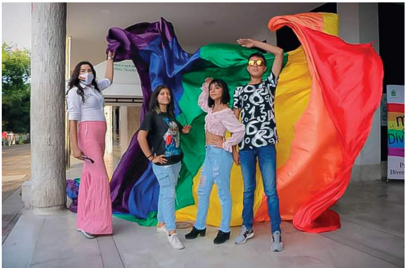
En 2021 y 2022 se logró avanzar en capacitaciones a servidores públicos de la gobernación del Huila y las diferentes alcaldías del departamento.