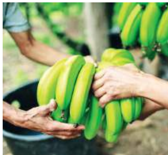
Todo el sector del agro huilense podrá acogerse a este beneficio.

Para la LEC Inclusión Financiera, la línea está diseñada para beneficiar a pequeños productores incluyendo a los productores de agricultura campesina y familiar y comunitaria, para siembra de cultivos de ciclo corto, sostenimiento de cultivos perennes, transformación y comercialización de la producción agropecuaria, adquisición de maquinaria y equipo, e infraestructura, con plazos de hasta 3 años.