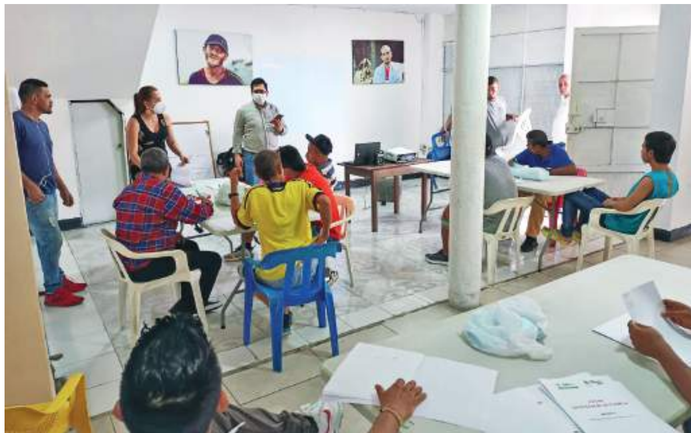
En la casa de apoyo para el habitante de calle se reciben diversos talleres y se realizan unidades productivas.

De los cuatro a los seis meses de permanencia en la casa de apoyo, los profesionales que los atienden empiezan a verificar qué tan preparados están para iniciar un proceso de reincorporación haciendo medición de los niveles de ansiedad y sacándolos a las calles.