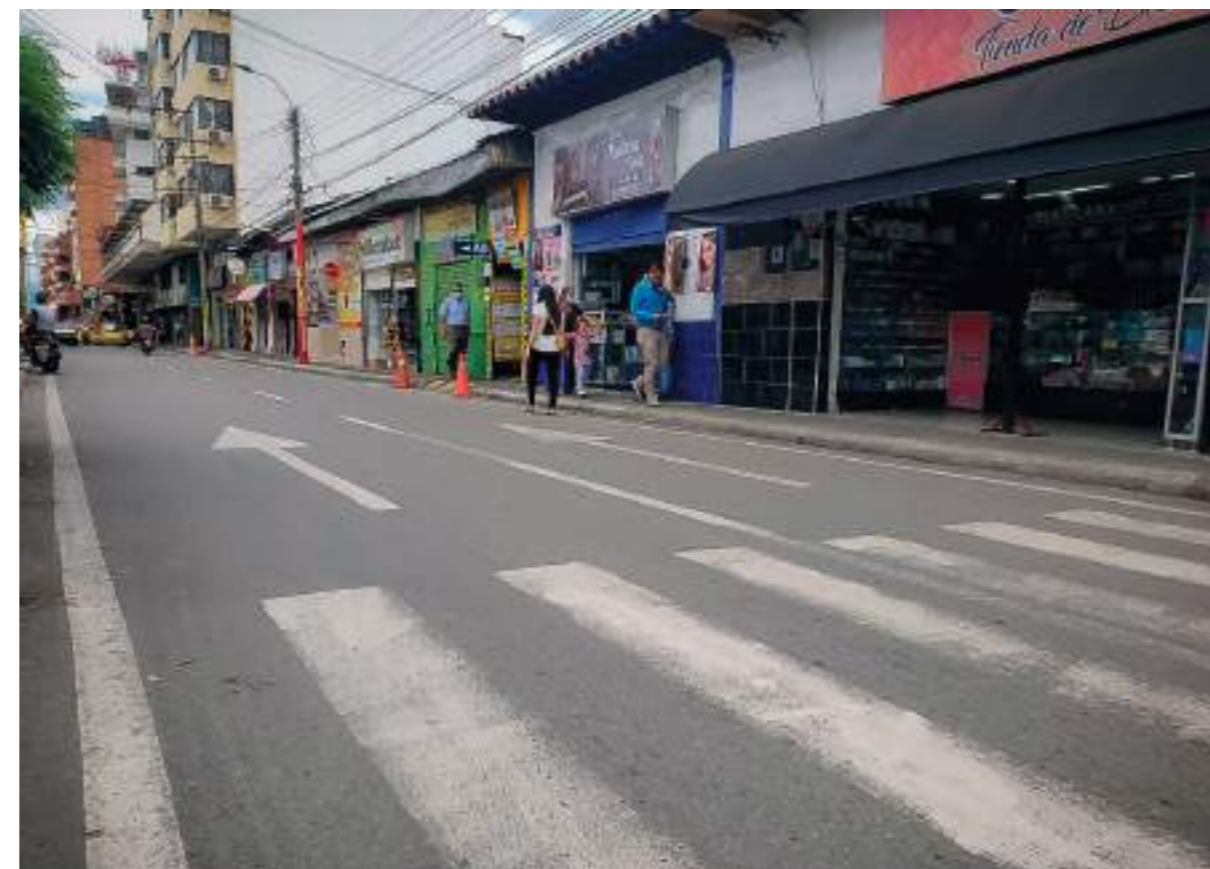
Uno de los aspectos a resaltar es la facilidad de acceso a la zona.