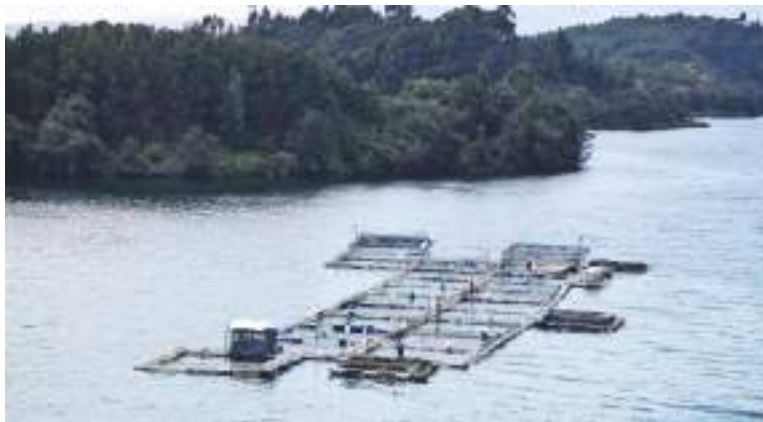
Los departamentos con la mayor producción piscícola durante el 2021 fueron: Huila, Meta, Tolima, Córdoba y Antioquia.

La tilapia fue la especie más cultivada en 2021, representando el 58% de la producción nacional. Le sigue la cachama, con el 19%, mientras que la trucha, el 16%. El cultivo de otras especies -como el bagre y el bocachico-