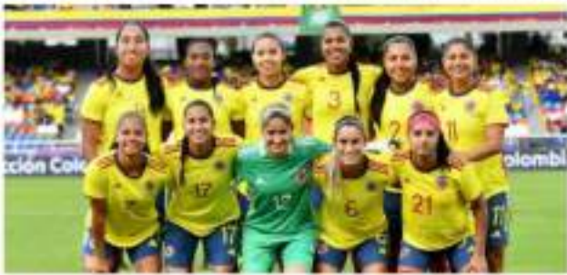
Selección Colombia femenina sigue su preparación de cara a la Copa América ■ 14 DEPORTES