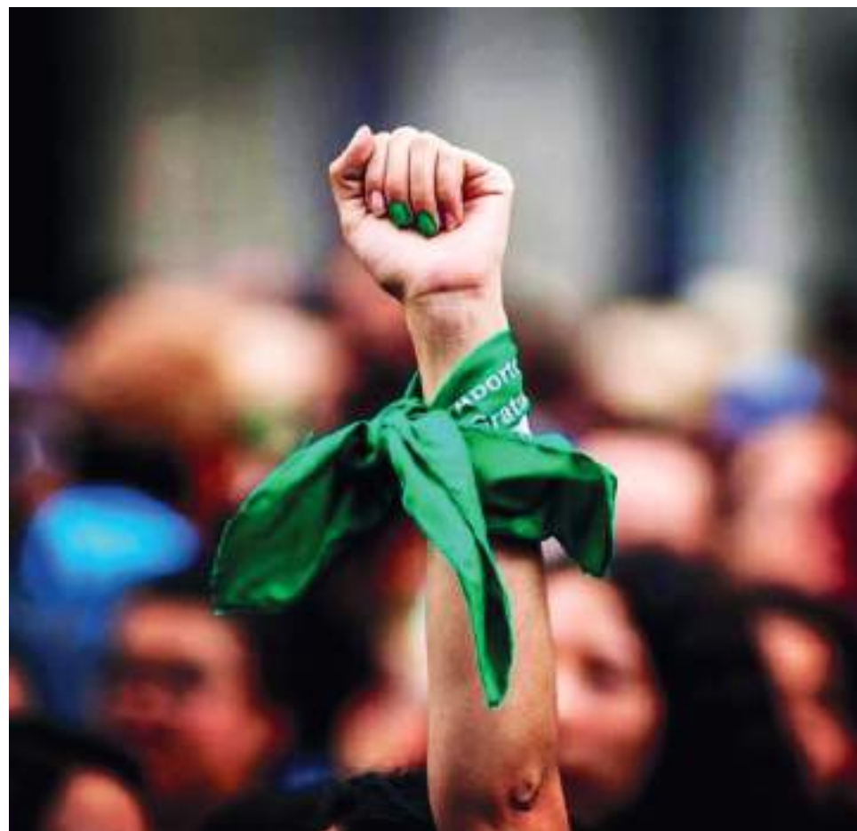
La Corte Constitucional sentenció que la conducta del aborto solo será punible cuando se realice después de la vigésimo cuarta (24) semana de gestación.

Por ello, las más felices por este fallo al que consideran un gran logro, son los movimientos de mujeres en todo el país, que defendieron y acompañaron esta iniciativa, como la Red Huilense de Defensa y Acompañamiento en Derechos Sexuales y Reproductivos - RHUDA. “Estamos seguras de que esta decisión va a impactar positivamente en la vida de miles de mujeres, niñas y adolescentes de nuestro departamento y en todo el país. Sabemos que es un avance en el reconocimiento de la libertad y la autonomía reproductiva de las mujeres. Sin embargo, desde el Movimiento Causa Justa de la red Huilense, seguiremos insistiendo en la importancia de despenalizar por completo el acceso a la interrupción voluntaria del embarazo,