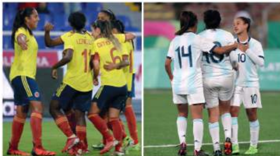
Esta noche en la ciudad de Bucaramanga se enfrentan a Argentina en juego amistoso.