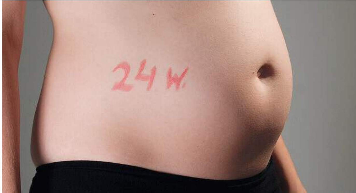
El Ministerio de Salud, confirmó que el aborto es una de las principales causas de morbilidad, discapacidad y mortalidad materna en el país.

“La Constitución Colombiana dice que la vida es el derecho fundamental de todo los ciudadanos, y de ahí parten los demás derechos, que son defendidos en Colombia y en todo el mun-