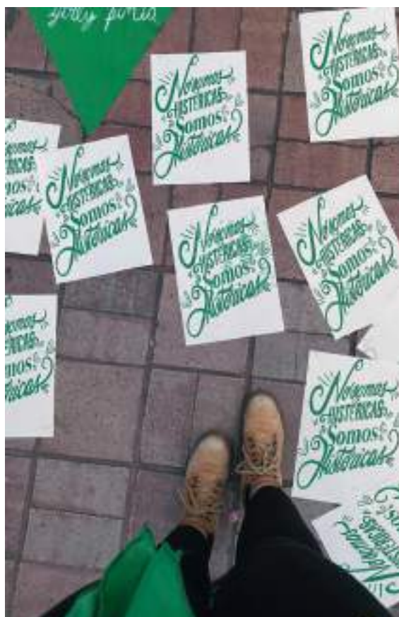
El fallo generó júbilo en algunos sectores pero también el rechazo de otros.

Por el momento, se estudiaría si un referendo puede ser viable para este fin.