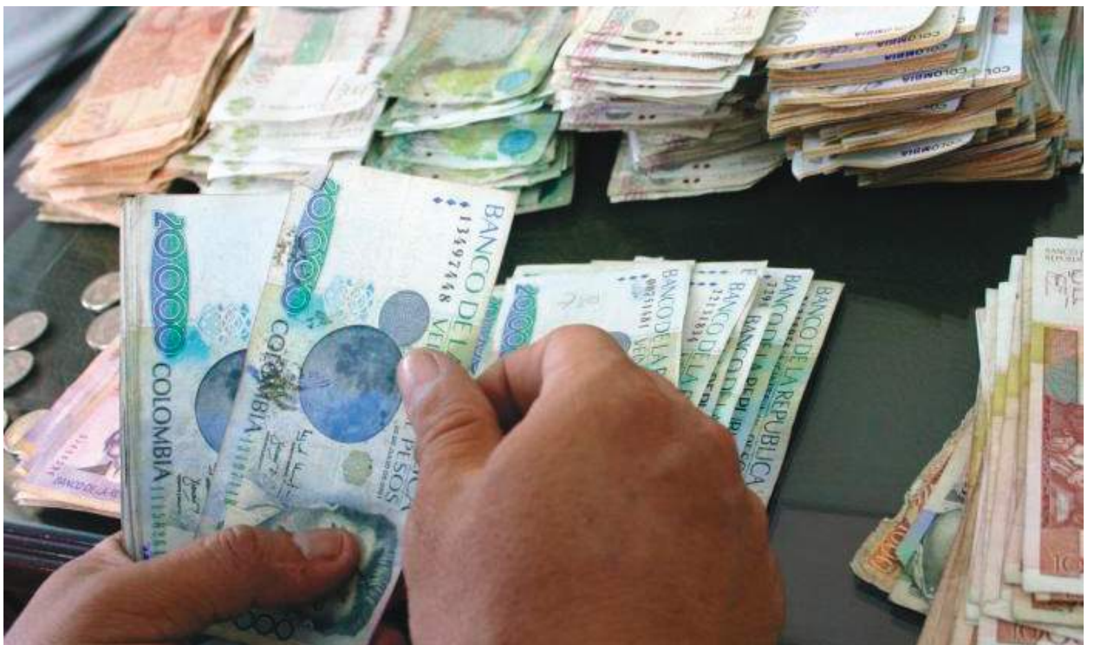
En enero el total de la deuda bruta del Gobierno descendió a $720,58 billones, $3,7 billones menos que los $724,58 billones que se registraron al cierre de 2021.

Reyes además advirtió que, “a largo y mediano plazo no se debería cantar victoria, se necesita sí o sí una reforma tributaria para cumplir con las metas de reducción de deuda que se tienen, sobre todo si se espera mantener los programas que se lanzaron en la pandemia”.