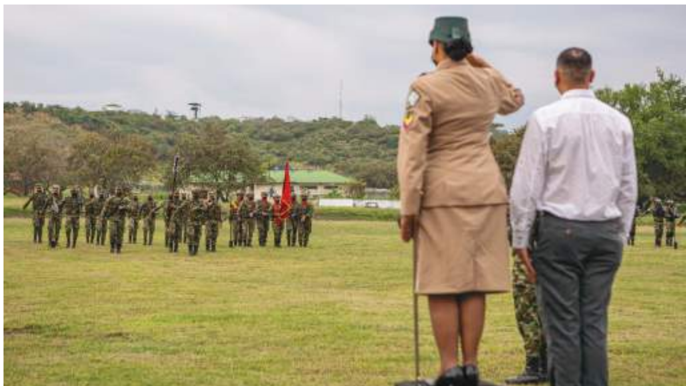
Recuerda con gratitud y admiración a aquellos héroes de la Patria que ofrendaron su vida en el cumplimiento del deber.

“Las aliento para que sigan demostrando y aportando lo mejor de ustedes para el beneficio de todos. Además de ser multimisión somos multifacéticas y debemos cumplir siempre de la mejor manera, dejando el alto el nombre de la mujer militar.