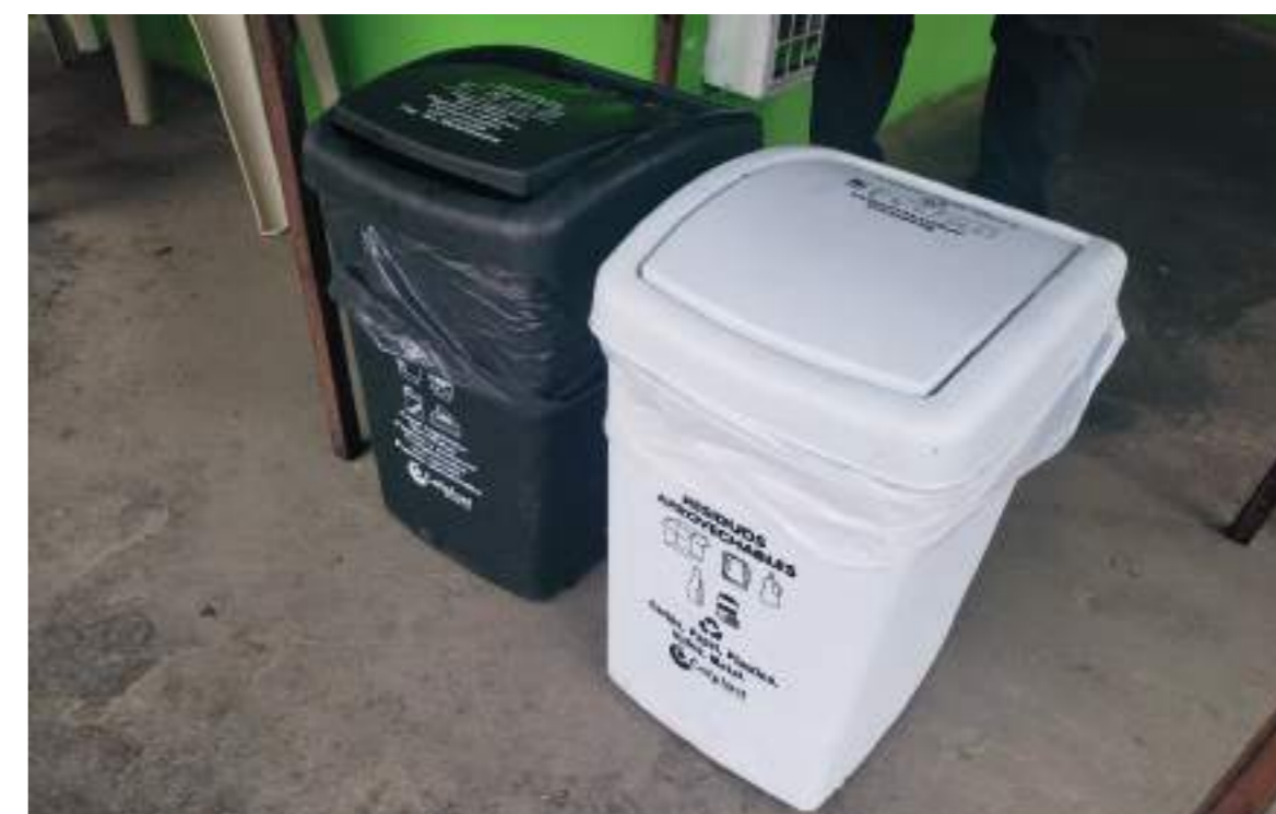
Recipientes marcados como ayuda adicional.

■ Con campañas de concientización, la administración de Neiva hace cumplir la Resolución municipal 0172 del 2021, que empezó a regir desde el primero de enero del presente año, que establece el nuevo Código de Colores para la separación de residuos en la fuente, y que adopta la Resolución nacional 2184 de 2019.