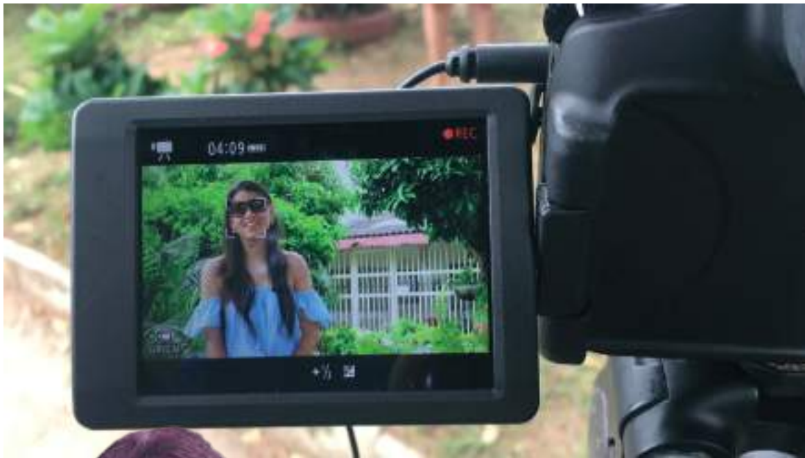
Realizando su trabajo para “Cuarentiando”.

La inspiración de la región conoce perfectamente el poder de la palabra y a pesar de ser tímida, sus frases son interminables y acertadas. Sin embargo, es un