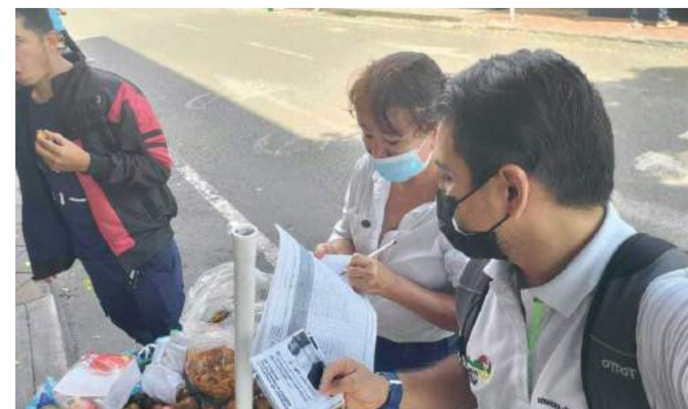
Los vendedores informales también reciben la capacitación.

En las comunas 3 y 4 de Neiva, correspondientes a la zona del microcentro de la ciudad, se mantiene este mes la campaña para dar a conocer el Código de Colores