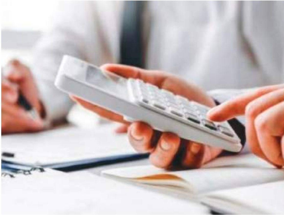
En puntos porcentuales la reducción fue de 0,5 %, y según información, sería la primera contracción en la deuda en cuatro meses.

Otro punto que detalla el reporte de deuda bruta es el perfil de las fuentes de financiamiento de la misma, en las cuales la mayoría corresponde a Títulos de tesorería, TES, de corto y largo plazo por un monto de $391 billones, que representan el 54,3 % de la deuda bruta. Sobre los bonos externos precisa que se adeudan $141,86 billones que equivalen