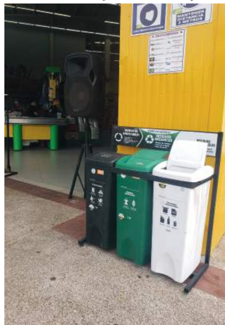
El sector comercial ha ido implementando la medida.

Para el secretario de Medio Ambiente, Octavio Cabrera Cante, En el municipio de Neiva, el proceso de aplicación de esta nueva reglamentación empezó, con base del Plan de Gestión Integral de Residuos Sólidos PGIRS.