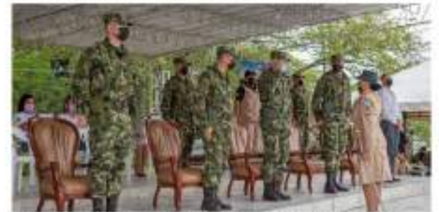
Con honores se retiró primera mujer en ocupar el cargo de Sargento Mayor en Huila ■ 9 REGIONAL