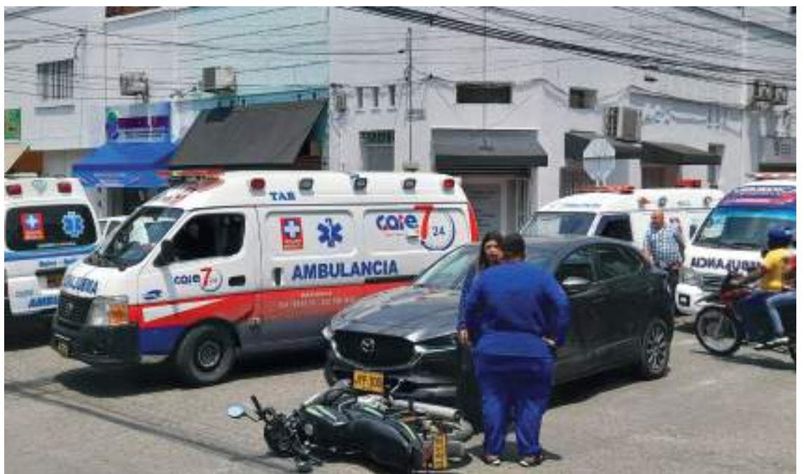
Se presentó un accidente de tránsito en la calle 11 con carrera sexta. Dos personas que se movilizaban en una motocicleta, resultaron heridas luego de protagonizar un accidente con un automóvil.