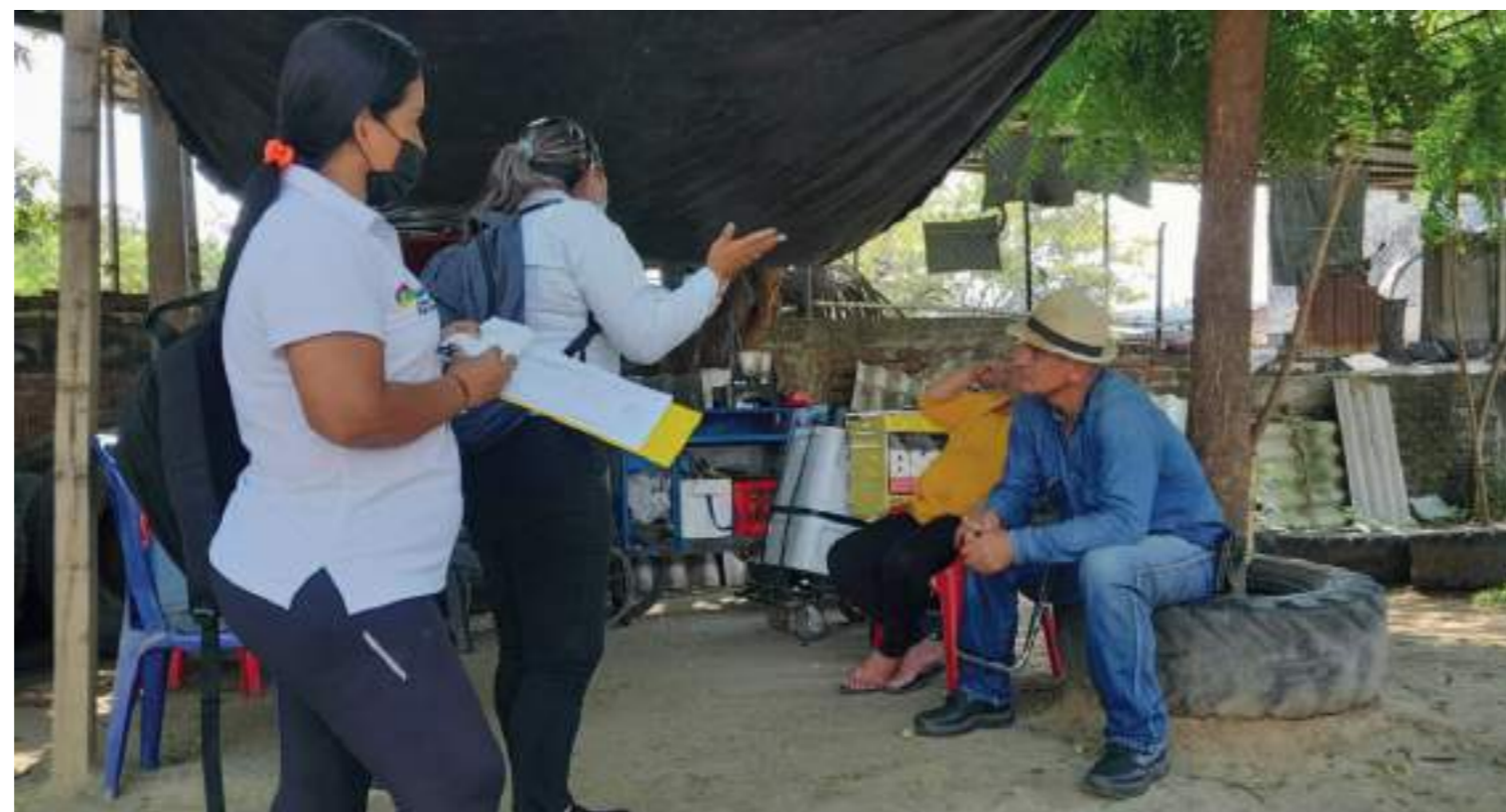
La campaña del código de colores se adelanta por las comunas de la ciudad.