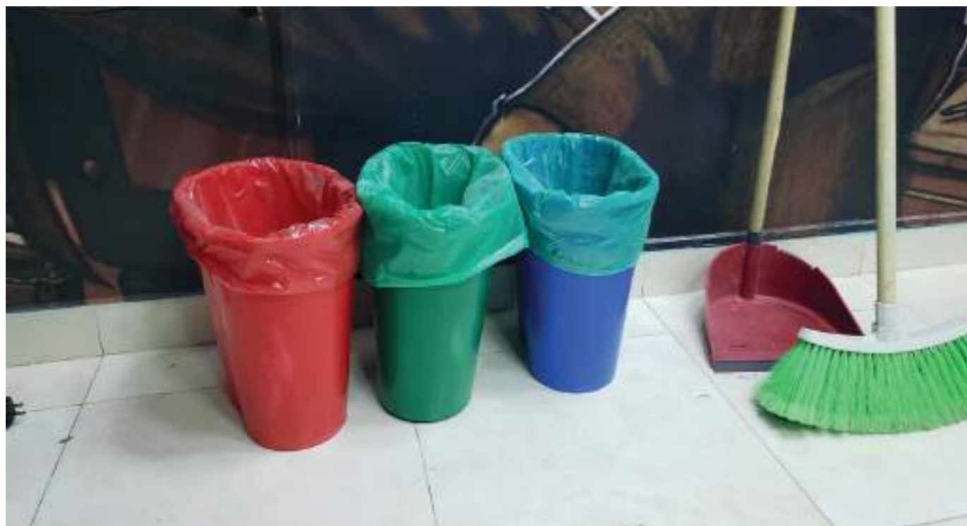
Algunos implementan la recolección con otros tres colores.