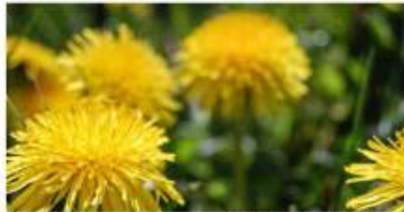
Alertan de la desaparición de plantas comestibles ■ 18 CONTRAPORTADA