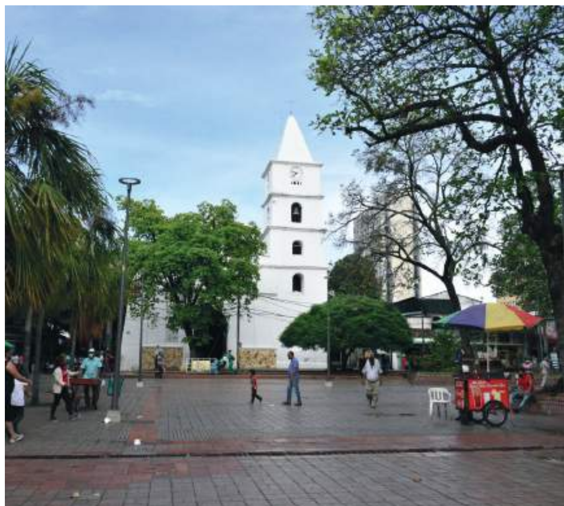
Se registra disminución de ocupación hospitalaria en servicio de atención general y cuidados intensivos.