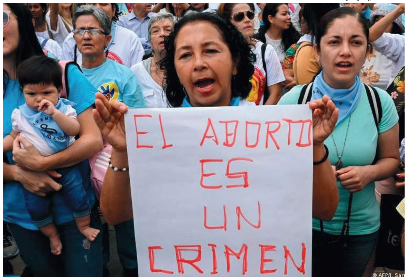
Colombia se pone por encima de la mayoría de países del mundo en permitir el aborto en una etapa del embarazo más avanzada.

“Estamos llamados a respetar coherentemente la vida, desde la gestación hasta la muerte natural. Y para nosotros los creyentes, fuera de ser un derecho fundamental es un don de Dios, y seguiremos, anunciando, defendiendo y promoviendo la vida humana”.