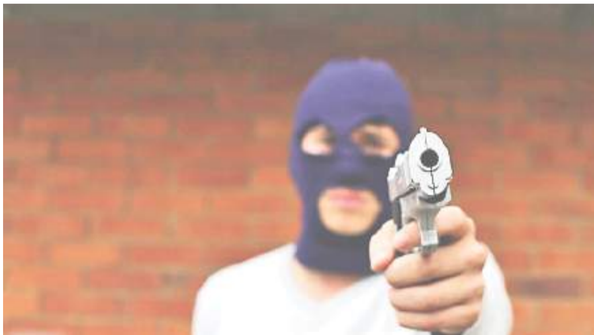
Decreto que regula el uso de armas traumáticas en el país ya se firmó.

“Hemos evidenciado como en el último año, particularmente después del vandalismo y los bloqueos, como en las calles aparecieron las armas traumáticas, unas armas iguales a las armas de fuego normales que comen-