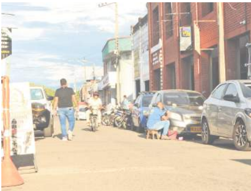
Es normal ver arreglar vehículos en plena calle

A comienzo de los años sesenta comenzó la transformación ur-