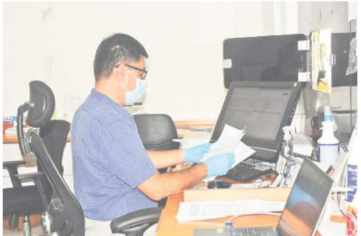
El sobrecosto salarial que asumieron los empleadores del país en 2020 fue de alrededor del 68,18%.

te, se detectó que 17,3 personas tuvieron licencia no remunerada por aislamiento, distanciamiento social o Covid-19, con o sin auxilio vital.