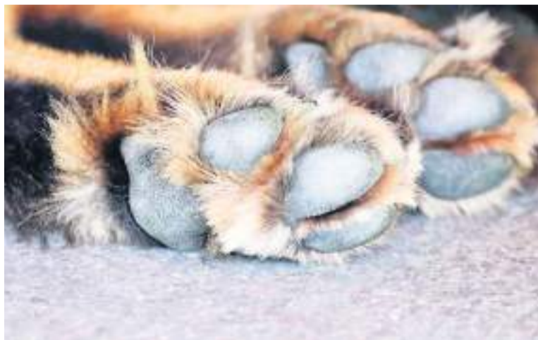
El abandono animal puede también generar sanciones.

Agregó también que en cuanto a las personas que no están respondiendo por el cuidado animal de compañía, “buscamos a la Policía Ambiental, para que se aplique las sanciones pertinentes, teniendo en cuenta que la tenencia responsable mediante campañas educativas en todas las comunas son las que hacen