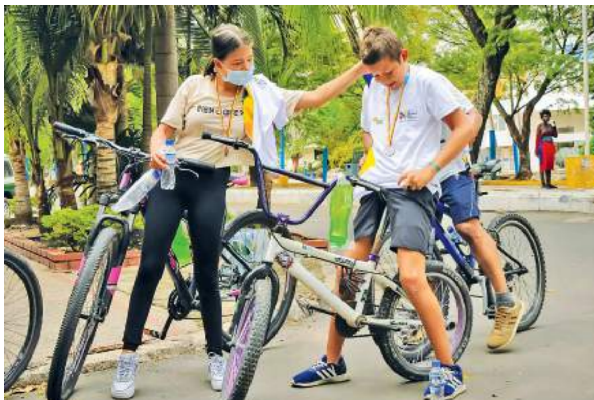
Los niños fueron protagonistas en esta actividad.