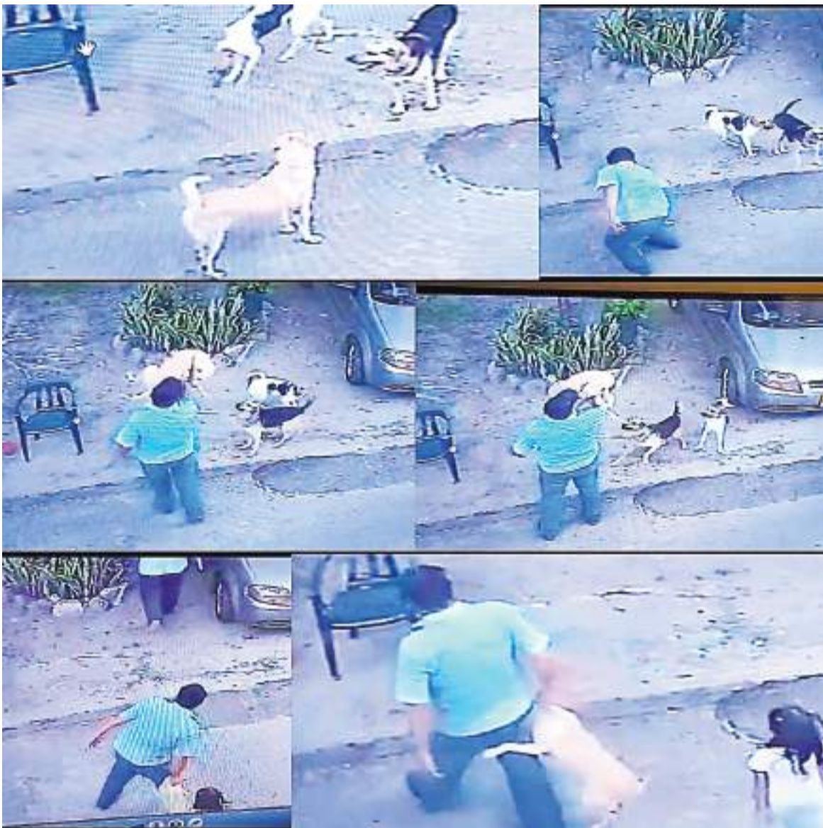
Un nuevo caso de maltrato animal se presentó esta vez en el barrio Fronteras del Norte.

A la opinión pública fue expuesto un video de maltrato animal donde se presencia a un hombre agredir a un canino, la comunidad sostiene que este tipo de hechos se vienen presentado de manera seguida, por el cual, llaman a las autoridades competentes a tomar acciones.