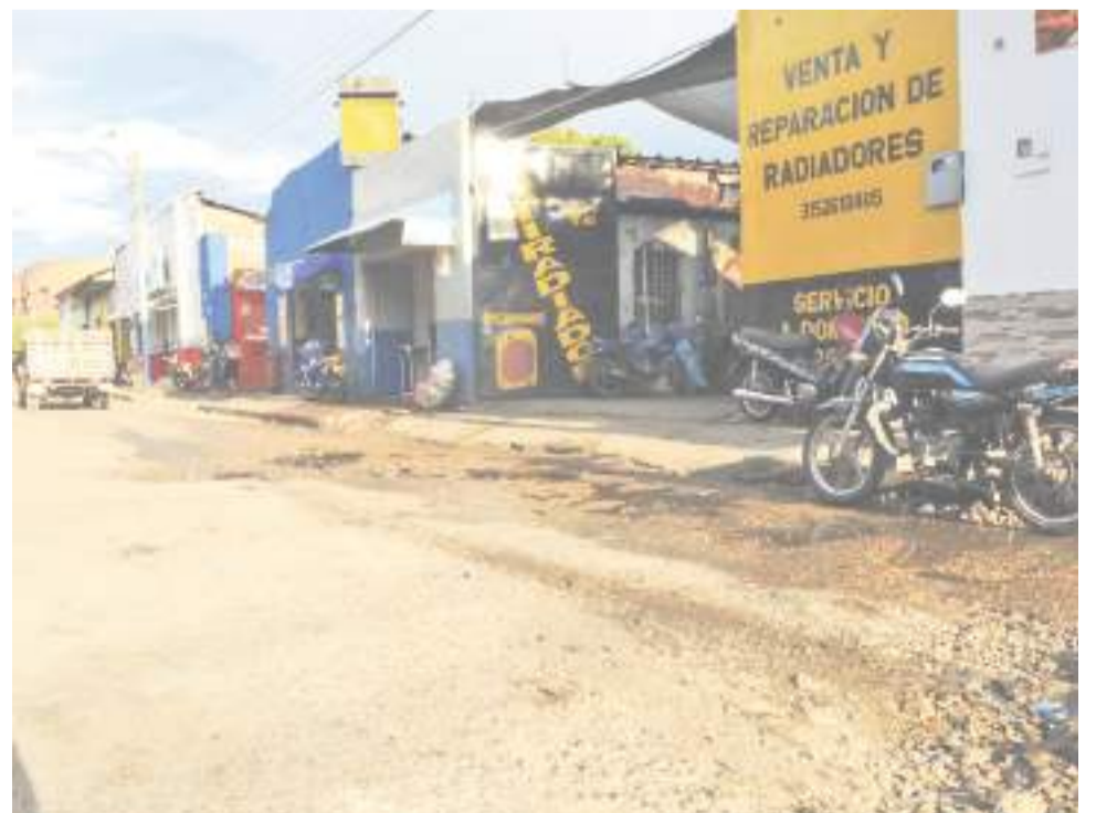
La oferta es variada, desde lujos, repuestos y reparaciones.