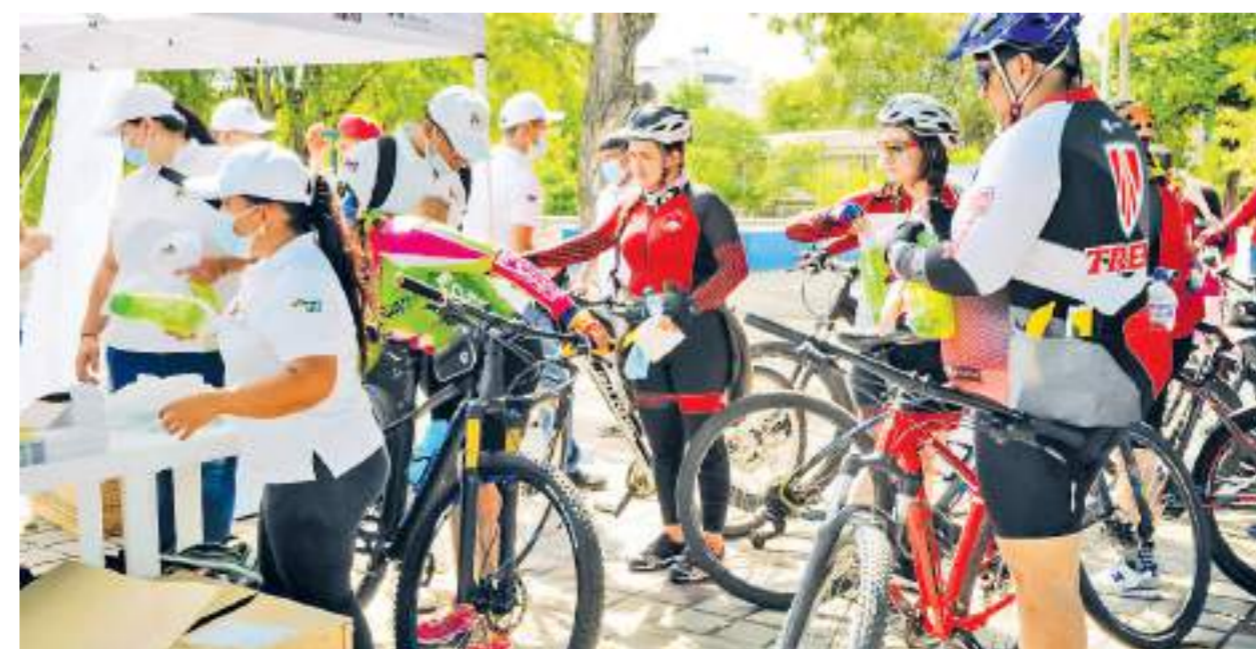
"Cada domingo vamos hacer diferentes ciclorutas con el fin de incentivar esta actividad".