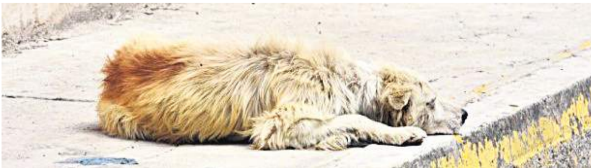
“En Neiva el maltrato animal se ha venido aumentando”

y buscan responsabilidad de los animales que andan en las calles realmente”.