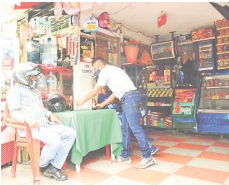
En Colombia hay alrededor de 450.000 tiendas de barrios.

En Colombia existen alrededor de 450.000 tiendas de barrio, estos negocios generan alrededor de 1.750.500 empleos, y venden en promedio $305.758 al día. Según estudios, estos negocios han perdurado debido al desarrollo sociocultural que se genera, y el vínculo que se crea entre vendedor y comprador.