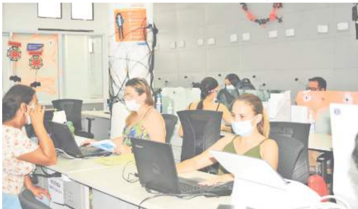
83,4 personas fueron sospechosas de tener el virus, tuvieron ausentismo e incapacidad.

Allí se muestra también que 38,3 personas fueron casos confirmados de Covid-19 pero no tuvieron incapacidad o esta fue rechazada, y otras 17,3 personas estuvieron en aislamiento preventivo obligatorio sin prestar sus servicios, con remuneración y no tenían preexistencias. Finalmen-