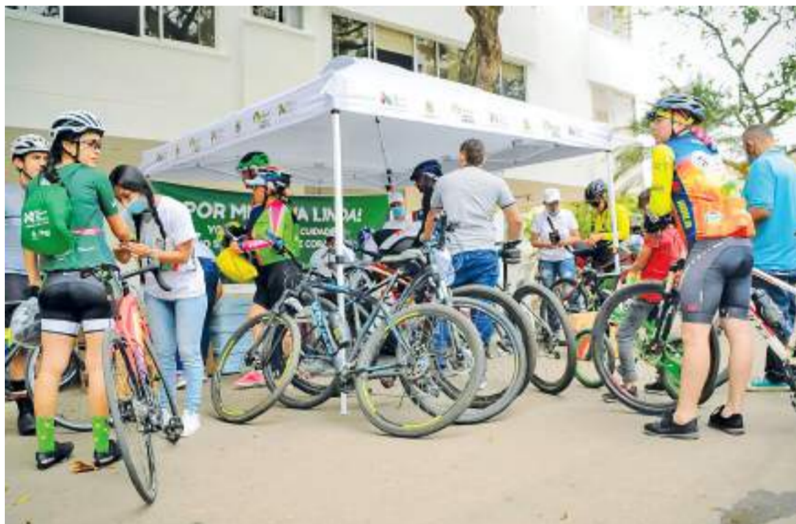
Muy buena acogida a tenido esta campaña de la administración.