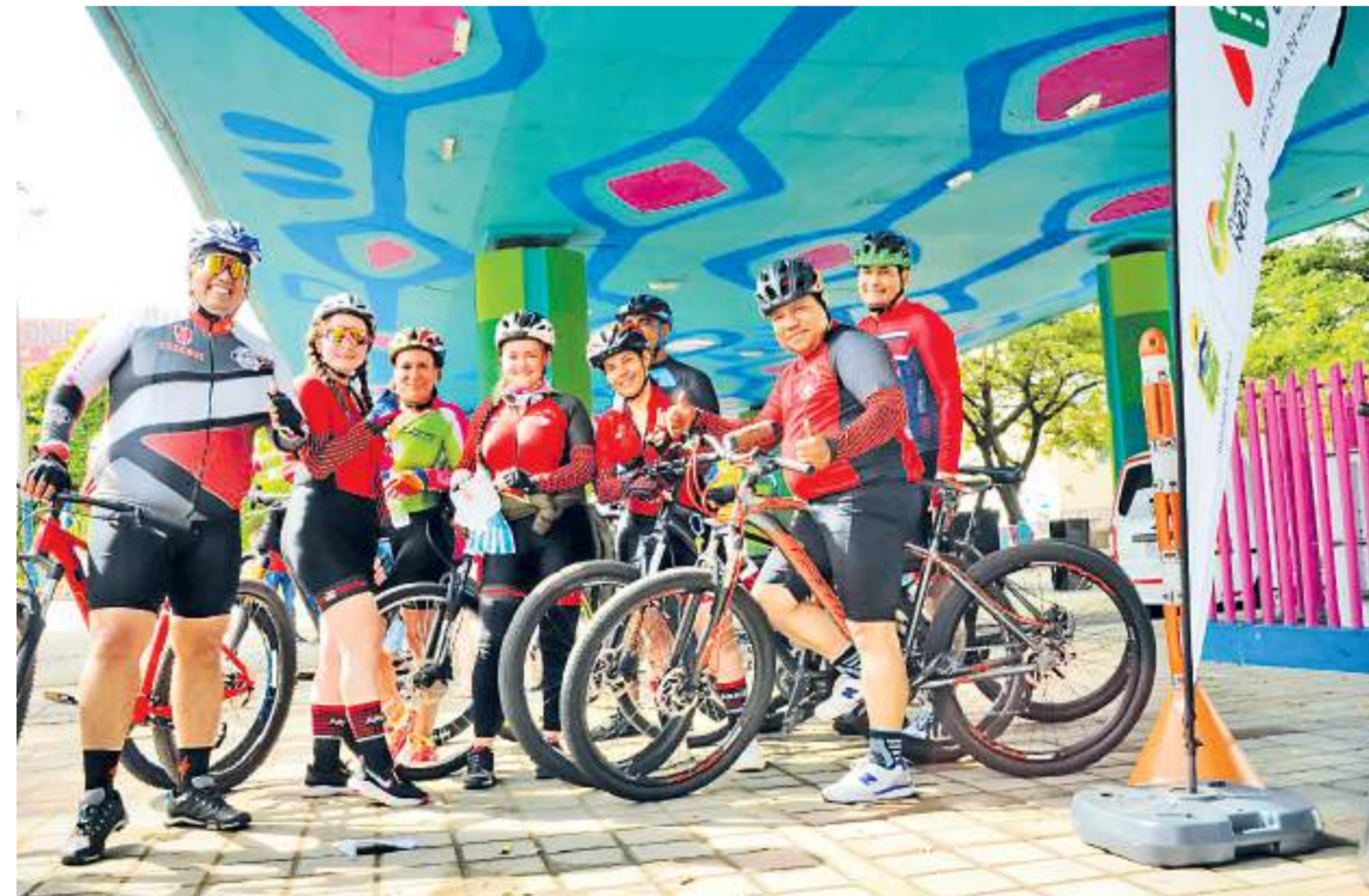
El pasado domingo se llevó a cabo la primera cicloruta en la capital opita.