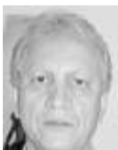
ANÍBAL CHARRY GONZÁLEZ

Nuestro código penal consagra el delito de prevaricato, que etimológicamente significa actuar de manera torcida por parte de un servidor público que en ejercicio de sus funciones profiere decisión manifestamente contraria a la ley, lo cual no solo es reprochable desde el punto de vista punitivo sino ético, que se encuadra por supuesto en el campo de la corrupción que es plaga bíblica en el país convertida en el régimen imperante en el establecimiento, que acude con impudicia no solo a violar la ley sino la misma Constitución trocada en rey de burlas por los que acuden manidamente a mencionarla como inviolable, pero que en la práctica no tienen ningún empacho en violarla para satisfacer sus torcidos intereses, como ha ocurrido en el Congreso de la República amparados en la inviolabilidad de los votos y opiniones de sus integrantes.