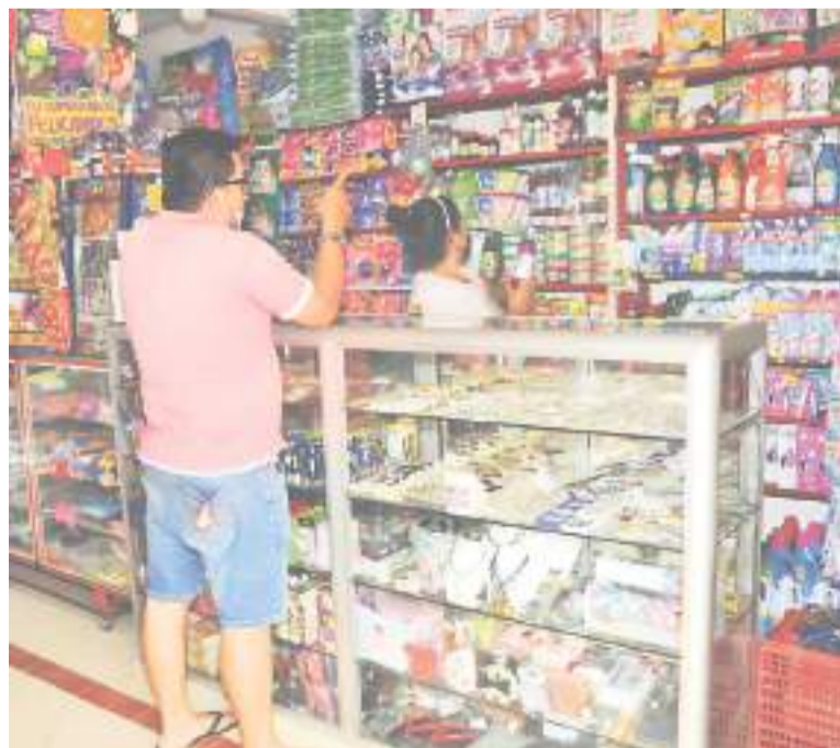
La mitad de los tenderos son mujeres, que en su mayoría son madres cabeza de hogar y su edad promedio está oscilando por los 42 años.