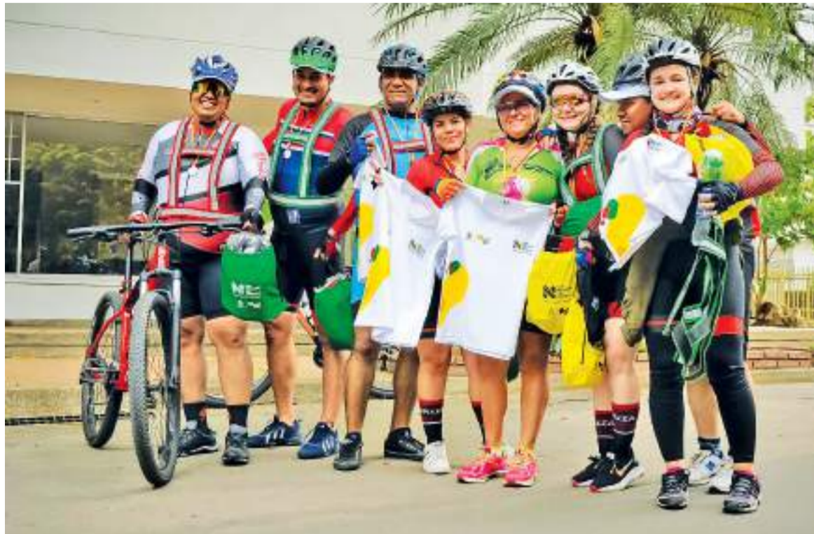
Esta campaña cuenta con diferentes actividades, cada una enfocada a cada actor vial.

» "Es una campaña de educación vial donde el principal propósito es comenzarle a cambiarle el chip a las personas".