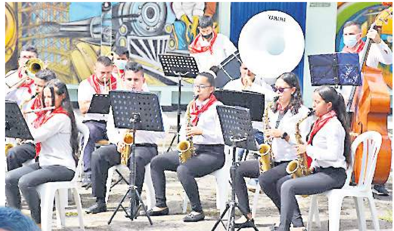
El director debe tener clara en la cabeza la música antes de sonar. Cada obra requiere de una interpretación distinta.

Actualmente dirijo la banda municipal Llano Grande de Campoalegre.