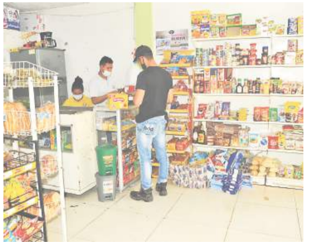
Lo atractivo de estas tiendas es debido al acercamiento que tienen los compradores con el tendero.