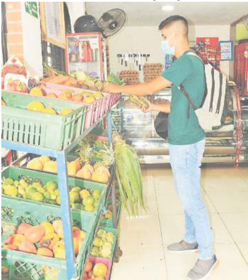
Las tiendas de barrio son un encuentro sociocultural.