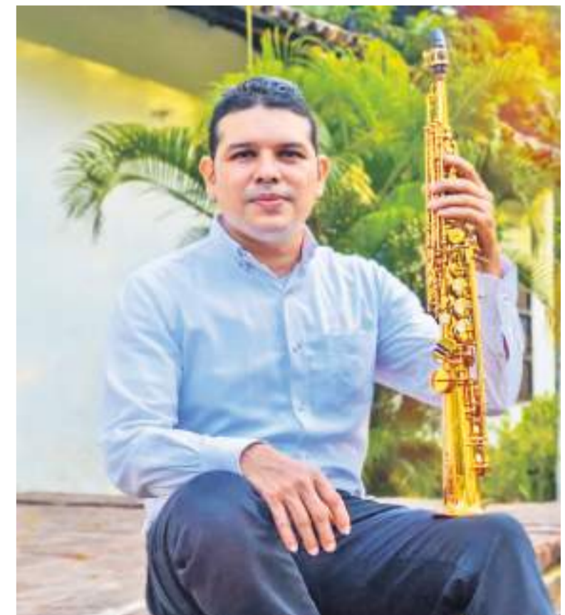
“Desde niño mostré muchas facilidades para la música. La comprendía y tocaba instrumentos con mucha facilidad”.