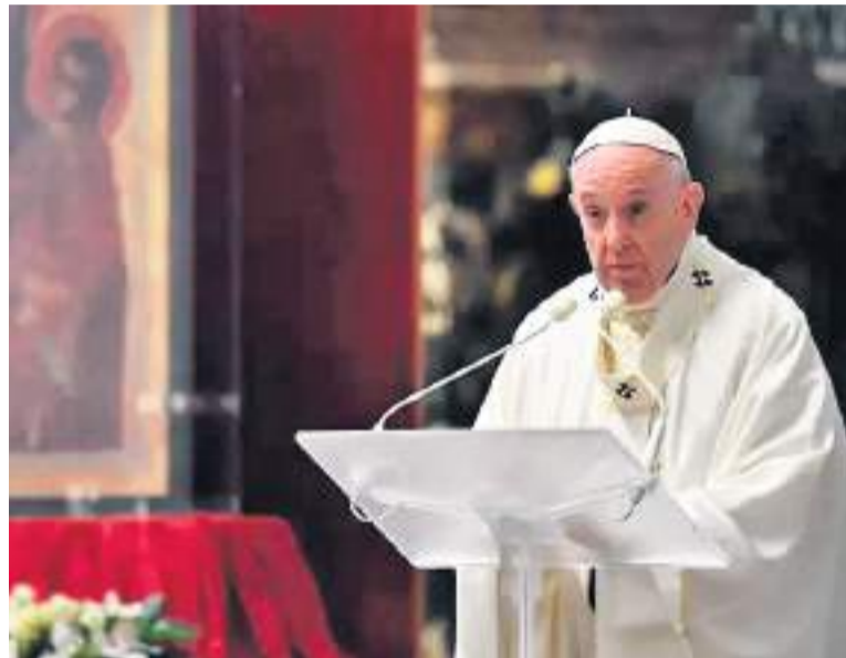
Papa Francisco en el Vaticano.

En este camino hacia la esperanza, el Papa aconsejó seguir tres “señales”. Entre ellas, el de “pro-