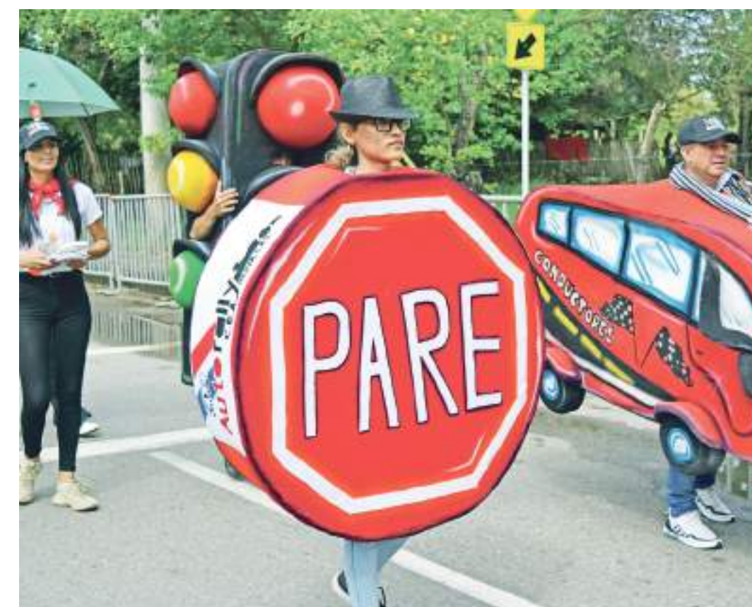
En diferentes puntos de la ciudad, en las intersecciones viales se hace labor pedagógica.