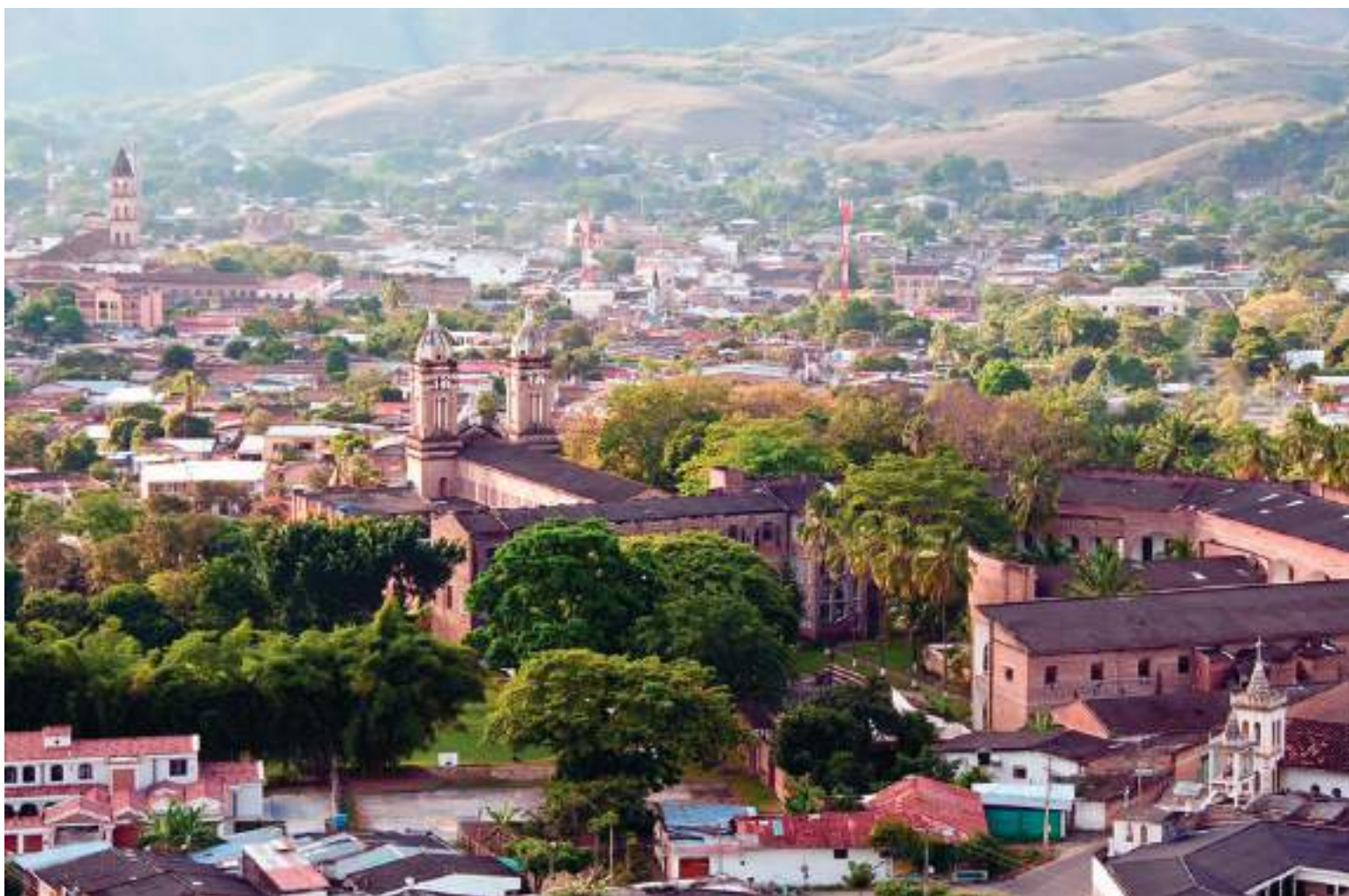
En Garzón el tema de inseguridad se presenta, un 60% en zona rural y un 40% en la zona urbana.

A su vez, a esto se le suma la temporada de cosecha cafetera que se tiene, lo que trae aún más gente nueva, lo que genera más dificultad. Pese a no ser un trabajo fácil, la articulación institucional viene desempeñando un rol fundamental para brindar tranquilidad y bienestar al pueblo plateño. No obstante, de acuerdo con el alcalde “Si nosotros miramos la población que tiene el municipio de La Plata y la comparamos con otras épocas podemos decir que se ha disminuido el tema de violencia, hurtos y homicidios. Se viene estableciendo trabajos importantes con resultados significativos. Este año hemos tenido inconvenientes por intolerancia ciudadana y otros problemas de seguridad. Algu-