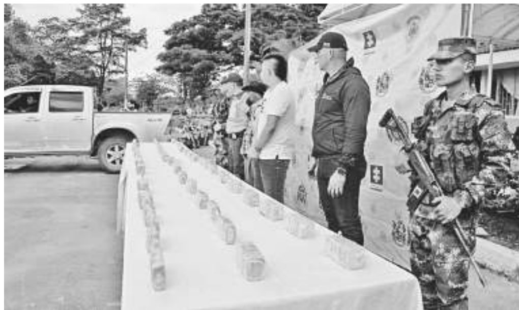
La captura se produjo en la vereda El Cedro del municipio de Pitalito, el dinero incautado al parecer sería empleado para la adquisición de estupefacientes.

Según los análisis de inteligencia, este dinero al parecer sería empleado para la adquisición de estupefacientes, de ahí que el resultado se traduce en un contundente golpe a las redes dedicadas a la criminalidad como el narcotráfico y a otras actividades ilícitas que realizan los Grupos de Delincuencia Organizada y los Grupos Armados Organizados, indicó la fuente del Ejército.