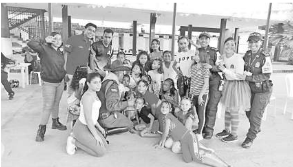
Realizadores y beneficiadas con Interactuar Usco en Hogar la Sagrada Familia.

Las niñas del Hogar la Sagrada Familia en Neiva recibieron la iniciativa de la Facultad de Educación de la Universidad Surcolombiana coordinada por el programa de Educación Física, Recreación y Deportes, que cuenta con aliados estratégicos como Diario del Huila para llevar recreación y atención social a sectores vulnerables de Neiva y otros municipios como Garzón, Pitalito y La Plata.