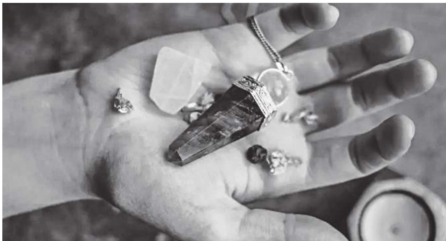
A los que se ven tentados a recurrir a la brujería, el sacerdote les advirtió que se detengan, porque “crees que puedes controlarlo, pero no puedes”.

Explicó que la idea de lanzar hechizos es una seducción del diablo que usa para atraer a las personas a él, y que “invocar un poder que no es de Dios y establecer una relación con ese poder” es inútil y solo trae conse-