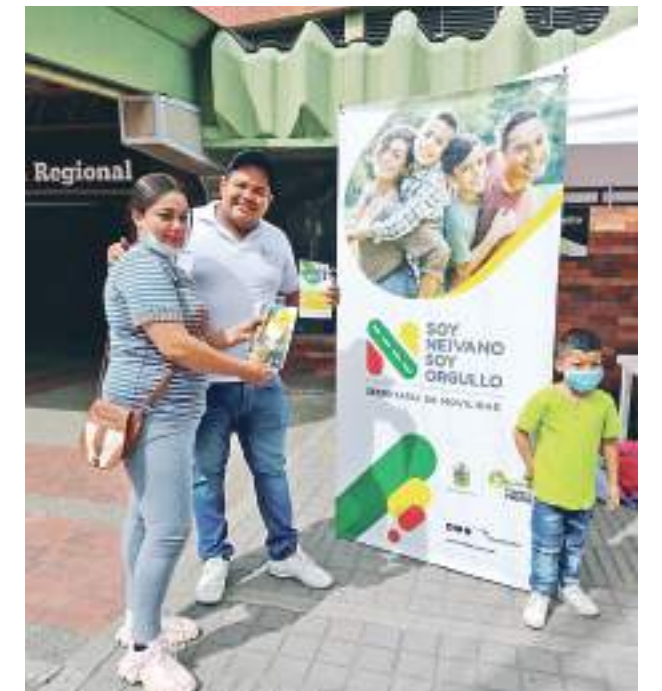
Los ciudadanos reciben una cartilla informativa.

Recordemos que esta campaña es mas de sensibilización, no todo puede ser garrote, no todo puede ser comparendo o sanciones, se le está apostando a