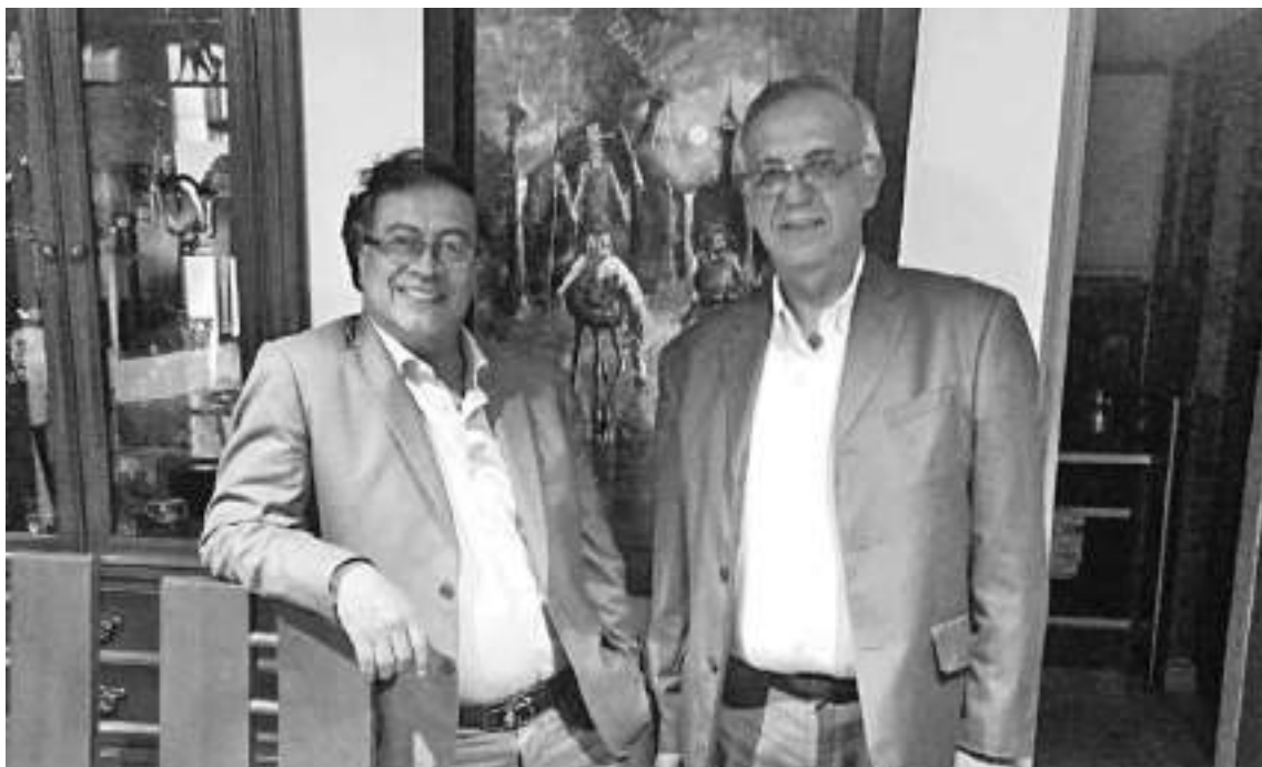
El presidente electo Gustavo Petro en compañía del designado ministro de Defensa, Iván Velásquez.

Al final, el abogado antioqueño aterrizó en la cartera a cargo de la seguridad nacional: el Ministerio de Defensa.