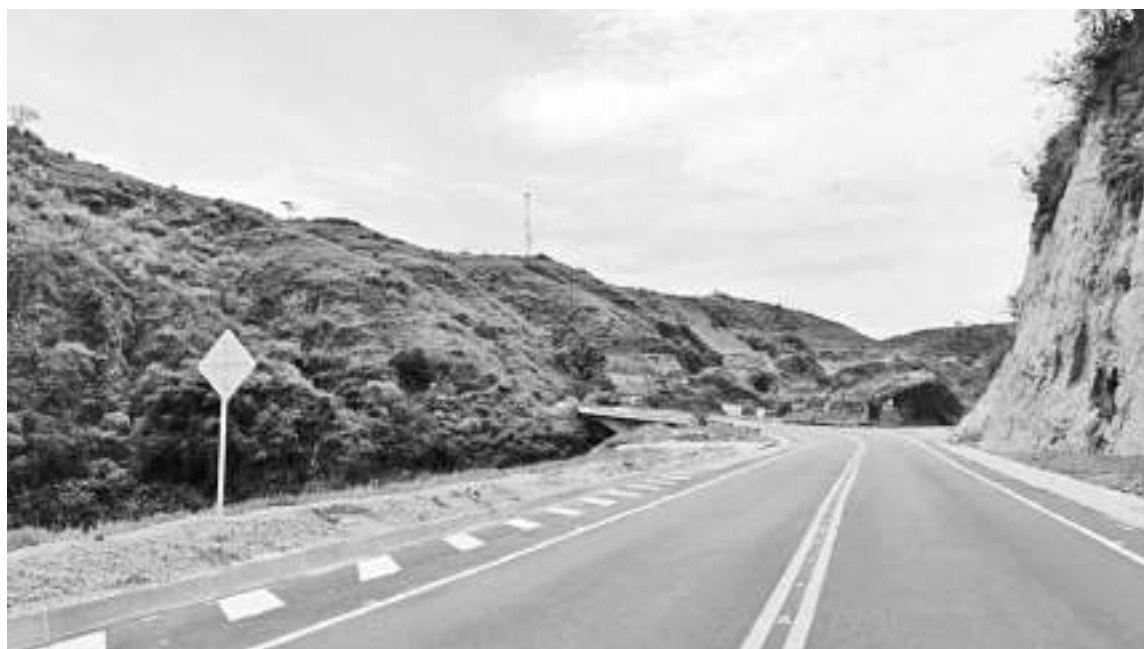
La vía Neiva- Santana- Mocoa hace parte de uno de los proyectos más importantes para el sur del país.

El departamento del Huila tiene vías que piden a gritos la intervención por parte de los gobiernos al tener afectaciones en el 50% y 60% de la malla vías, y otras como la que del municipio de Neiva conduce a Palermo que presenta una afectación del 90%. En vista de lo anterior se conoció que el gobierno departamental viene ajustando presupuestos para poder cumplirle al Huila en materia vial. En el orden Nacional también hay grandes proyectos en los cuales se debe avanzar.