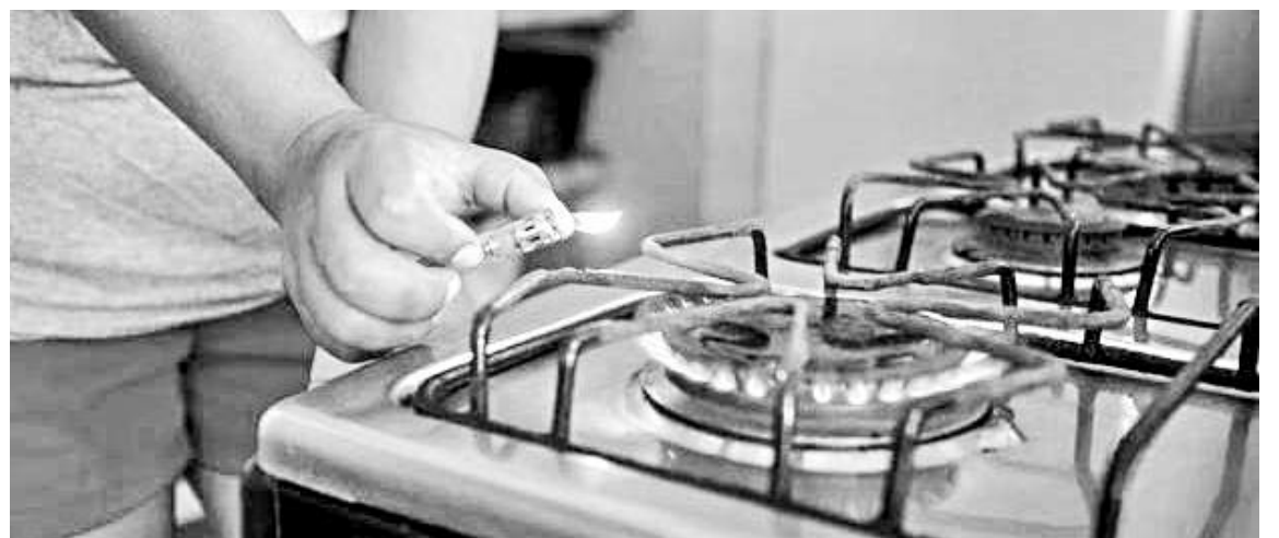
1.555 familias fueron beneficiadas en el Huila con gas natural.

“La responsabilidad del país circula en que todos los días en Colombia tengamos una calidad de vida mejor y que se pueda llevar a todas las comunidades. El país en su línea de transformación energética necesita la infraestructura adecuada para que podemos garantizar la continuidad de los proyectos y del impacto que tendrán”, indicó William Oviedo, presidente de Alcanos de Colombia.