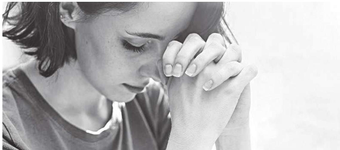
En lugar de lanzar hechizos, el exorcista animó a tener una vida sacramental, y rezar a Dios para que cuide y proteja nuestra alma.

“El diablo ya anda huyendo si vas a la iglesia y sobre todo si vas a comulgar”, concluyó.