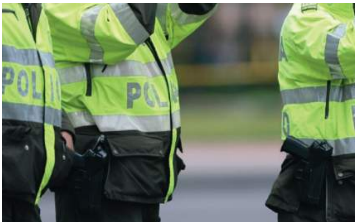
Actualmente, la fuerza pública del departamento viene anudando esfuerzos para lograr cualquier tipo de inseguridad en la región y garantizar la tranquilidad de los huilenses.

norama. En este sentido, se viene accionando para que la situación no se salga de control.