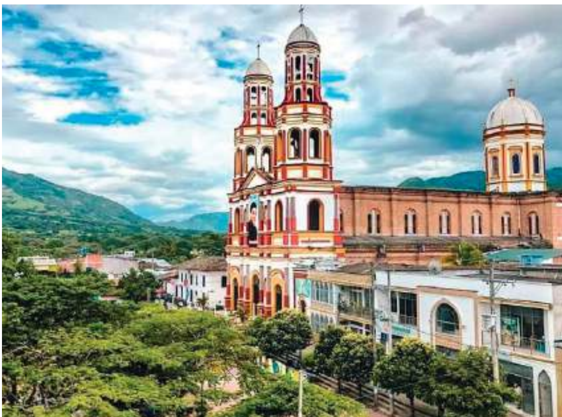
Al parecer la presencia de foráneos que arriban al territorio plateño y la falta de controles en el municipio, aumentan los casos de inseguridad.

Finalmente, es propicio decir que lo que más se genera en Garzón y La Plata son hechos de intolerancia ciudadana, lo que significa que, aunque existen flagelos y otros hechos de mayor gravedad, en estos municipios particularmente, se han logrado controlar.