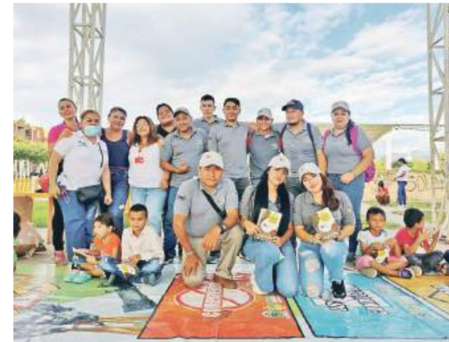
Equipo humano que adelanta la campaña con compromiso total.