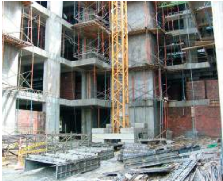
La obra empezó a construirse desde hace más de 12 años y aún no está completamente terminada ni en funcionamiento.

Así las cosas, lo que se tiene previsto es que una vez se entreguen los estudios de patología y sismo resistencia se de inicio