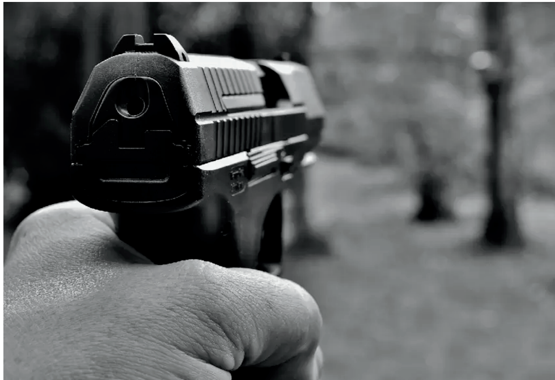
Hechos de violencia se dan en estas poblaciones también por la intolerancia e ingesta descontrolada de licor.