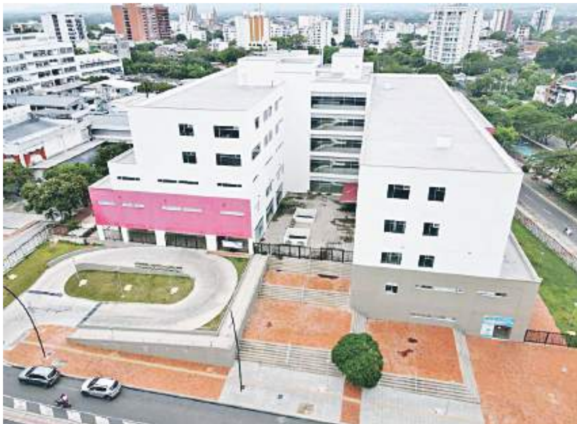
Han sido cerca de $55.000 millones de pesos los que se han invertido en el proyecto que beneficiará al sur colombiano.

Igualmente sostuvo, “yo quedé aterrado el día que vino el Contralor General de la Nación he hi-