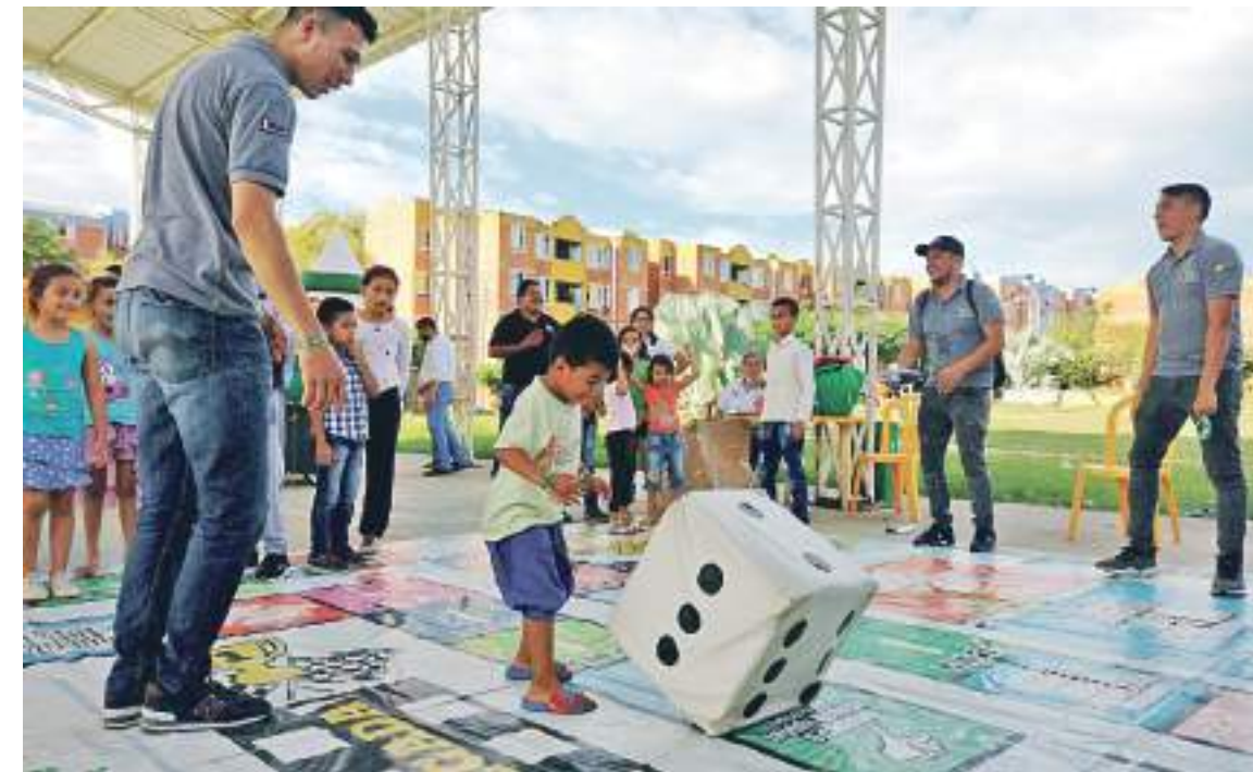
Desde los primeros años los niños aprenden el comportamiento en la vía y a respetar las normas de tránsito.