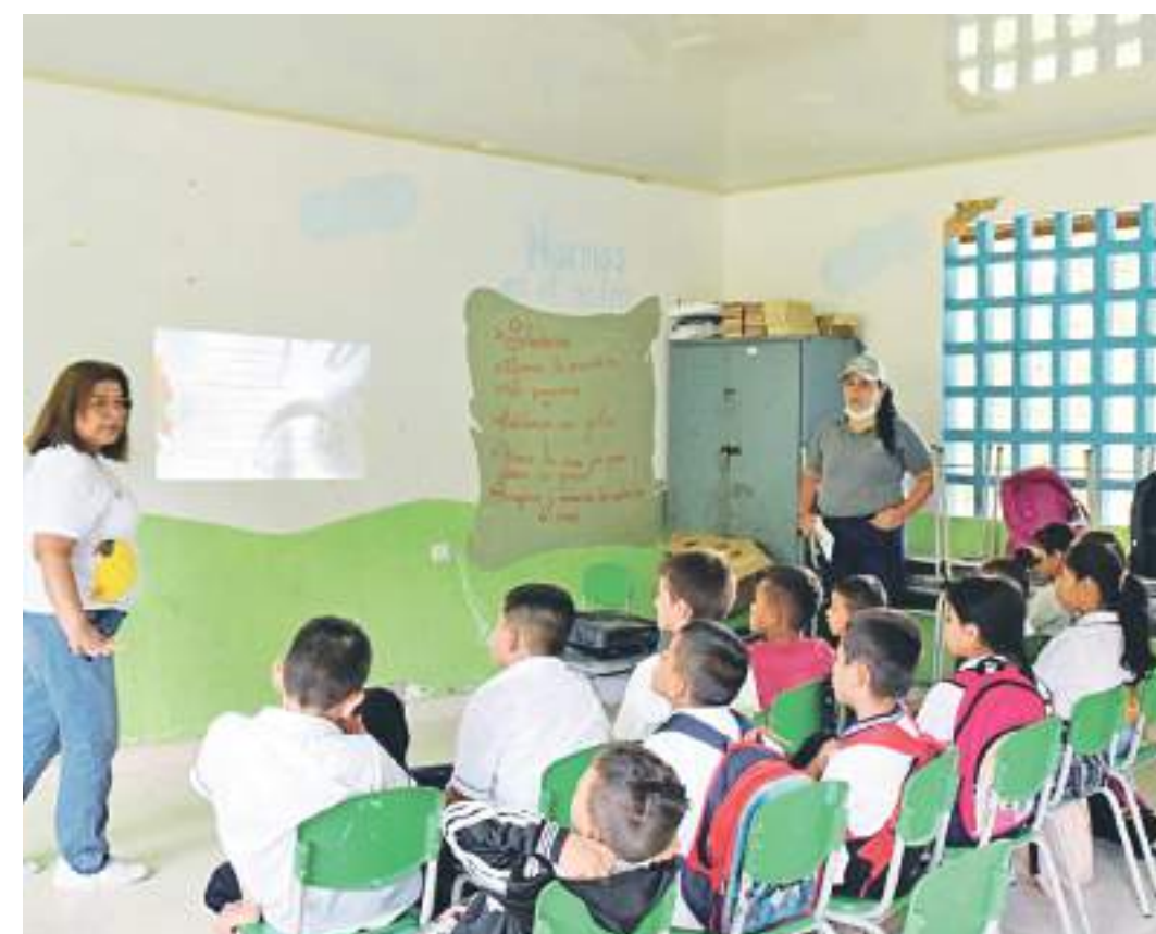
Capacitación en las Instituciones educativas con la cátedra de seguridad vial.