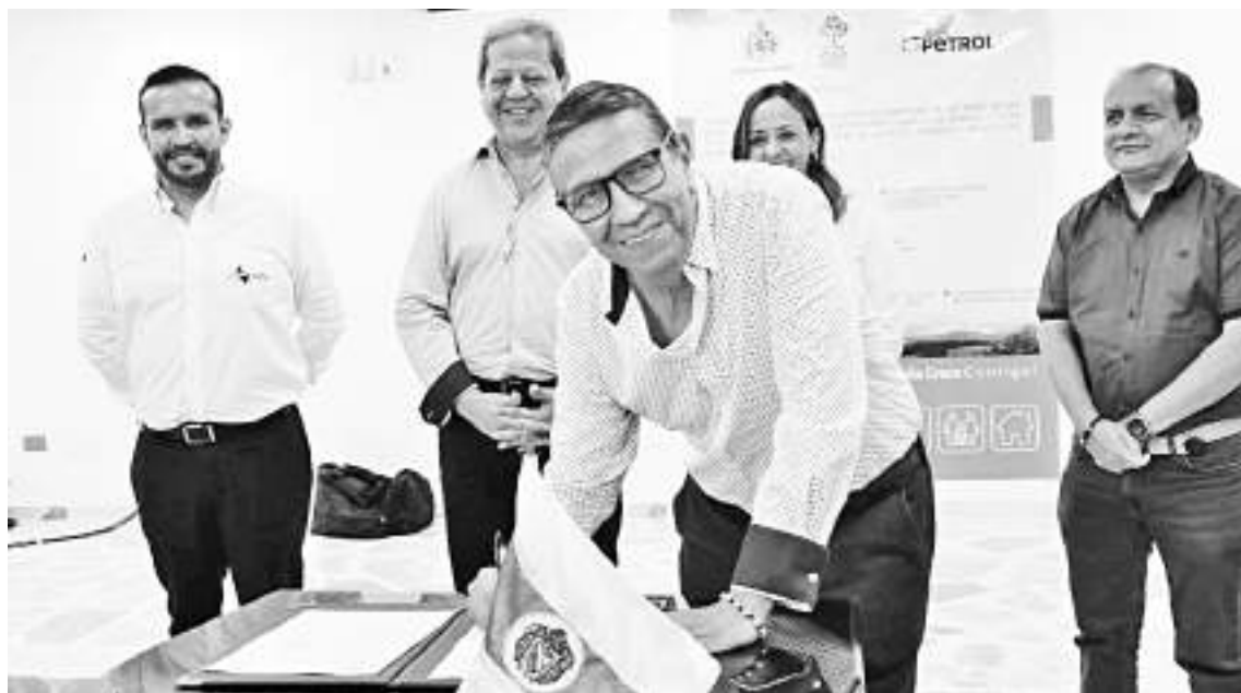
Con presencia de los alcaldes de los municipios beneficiados se dio oficializó el proyecto de gasificación.

“Aquí hay un esfuerzo de todos y así es que se logran los proyec-