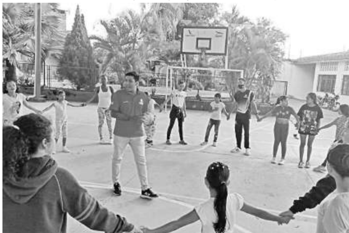
Actividades recreativas recibieron las niñas de la Sagrada Familia.

La próxima visita de la caravana de la alegría de integración social, “Interactuar Usco”, será el 28 de julio al Hogar de paso del habitante de calle en la ciudad de Neiva. Diario del Huila seguirá acompañando esta como otras campañas de tipo social que llegan a las diferentes comunidades en la capital y en todo el Huila.