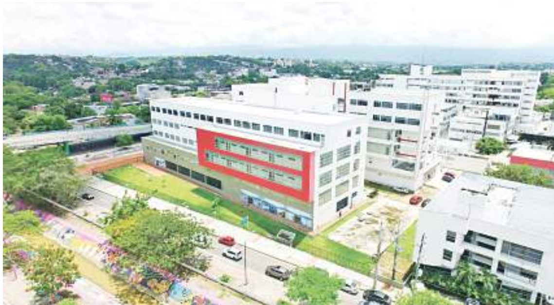
Las autoridades de Salud del Huila han indicado que para la finalización de la obra “los recursos están garantizados”.