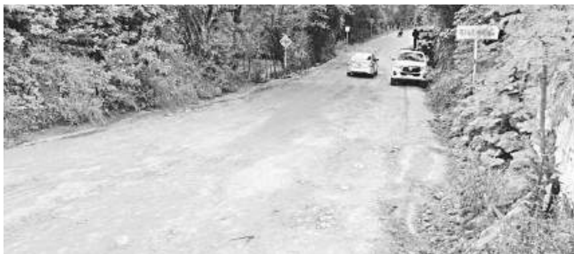
Las vías terciarias del departamento piden a gritos una intervención que mejore el tránsito de las personas de la zona rural a la urbana.

Son 32 de los 37 municipios que tienen afectaciones por las olas invernales que han sido atípica durante este año y que no cesan sobre todo en los municipios del sur de manera especial.