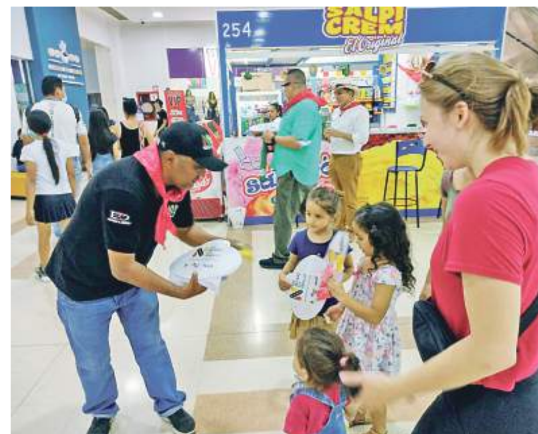
Soy Neivano, Soy Orgullo, realiza trabajo de sensibilización en los centros comerciales.