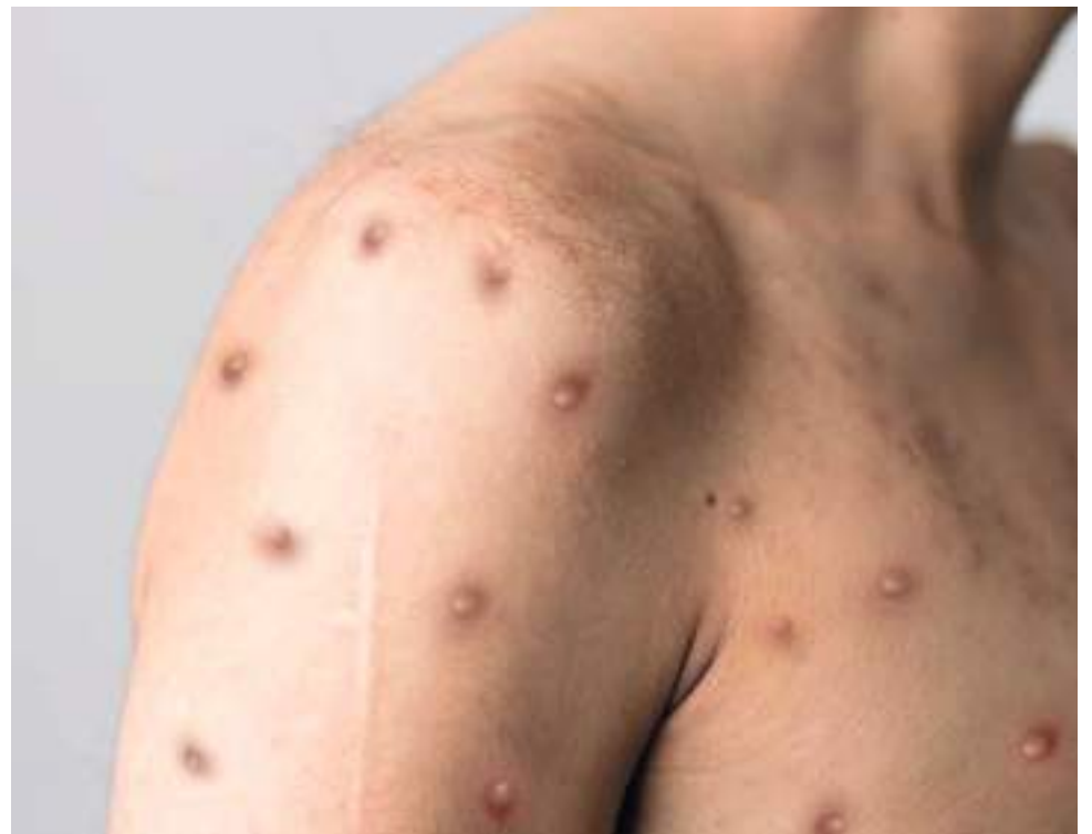
La OMS ha detectado más de 2.100 casos y un deceso en 42 países.

El tratamiento requiere de dos dosis e inicialmente estaba prescrito para tratar la viruela en adultos, una enfermedad que se considera erradicada desde hace 40 años.