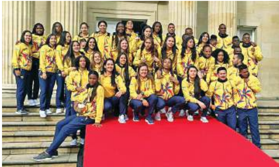
Los Juegos Bolivarianos se realizarán en Valledupar.

En diálogo exclusivo con Diario del Huila, Horta se siente orgulloso de representar a Colombia y al