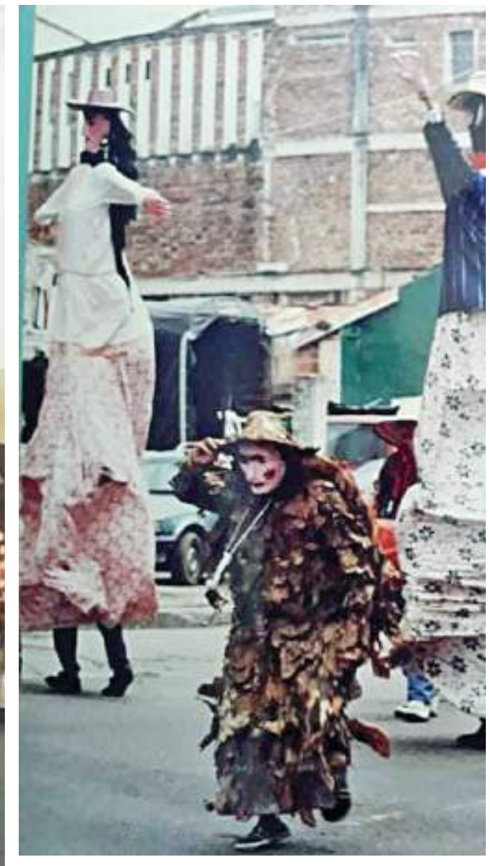
La mula del diablo, el Mohán, la Madre monte, el Tunjo de Oro son otros de los mitos en la región.

“El Taitapuro y la Mamapura, son personajes muy nuestros porque son los que presiden las festividades, hacen el llamado a disfrutar de las fiestas en paz y sana convivencia y por supuesto hacen parte de todo el grupo de mitos y leyendas del departamento del Huila”,