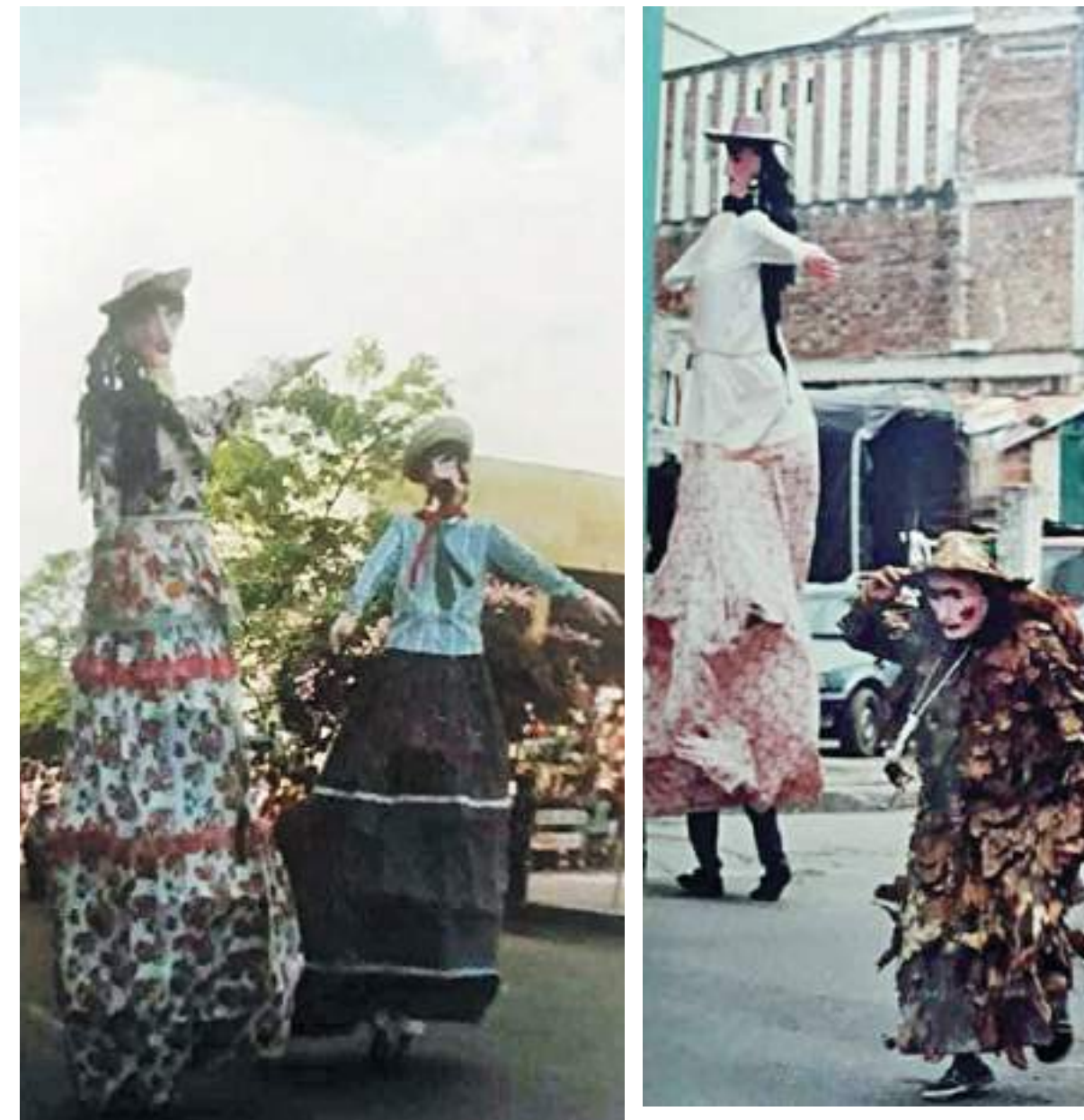
Desde lo alto disfrutaban al son del sanjuanero.