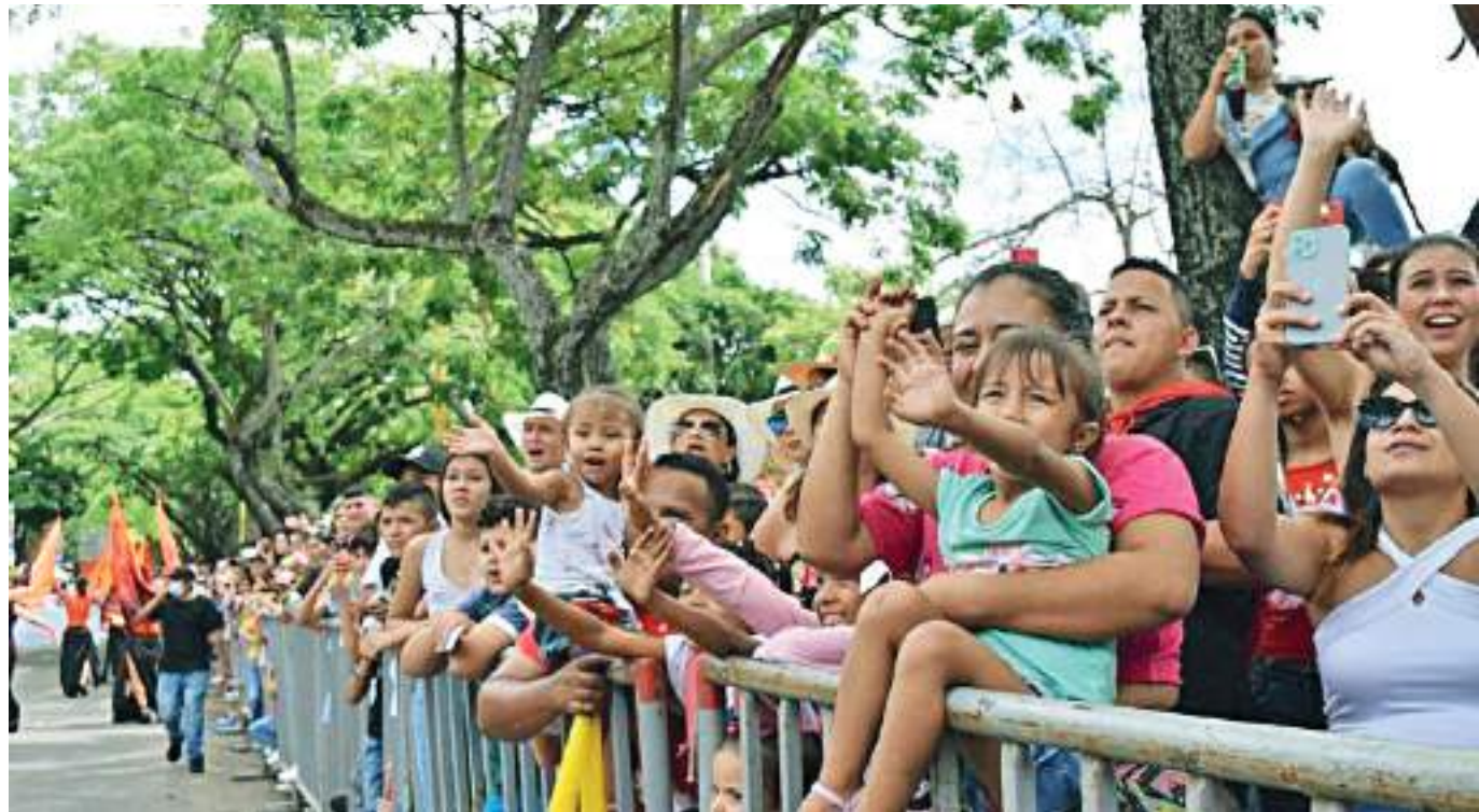
Se prevé que en el marco de las festividades sampedrinas el panorama se preste para el aumento de casos de trabajo infantil.

Claramente, la población al conocer el delito perpetrado están preparados para camuflarse al ver la autoridad y de esta