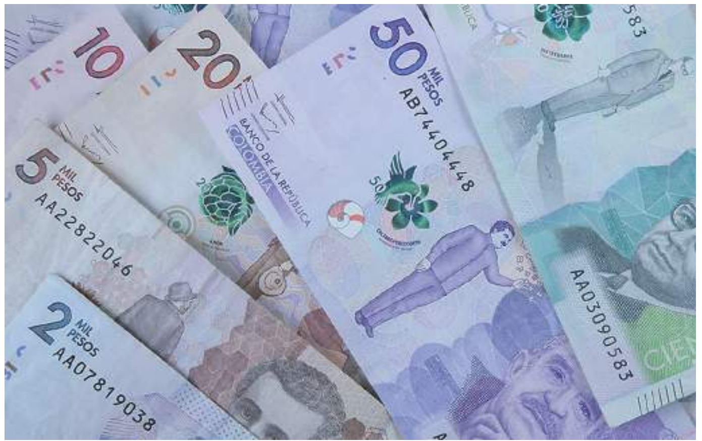
Hasta el próximo 30 de junio las personas recibirán el subsidio al desempleo por emergencia que otorgó el Gobierno Nacional.

Hasta el día de hoy ya yo hay posibilidades de aspirar al subsidio de emergencia puesto que la convocatoria se acabó y ahora a