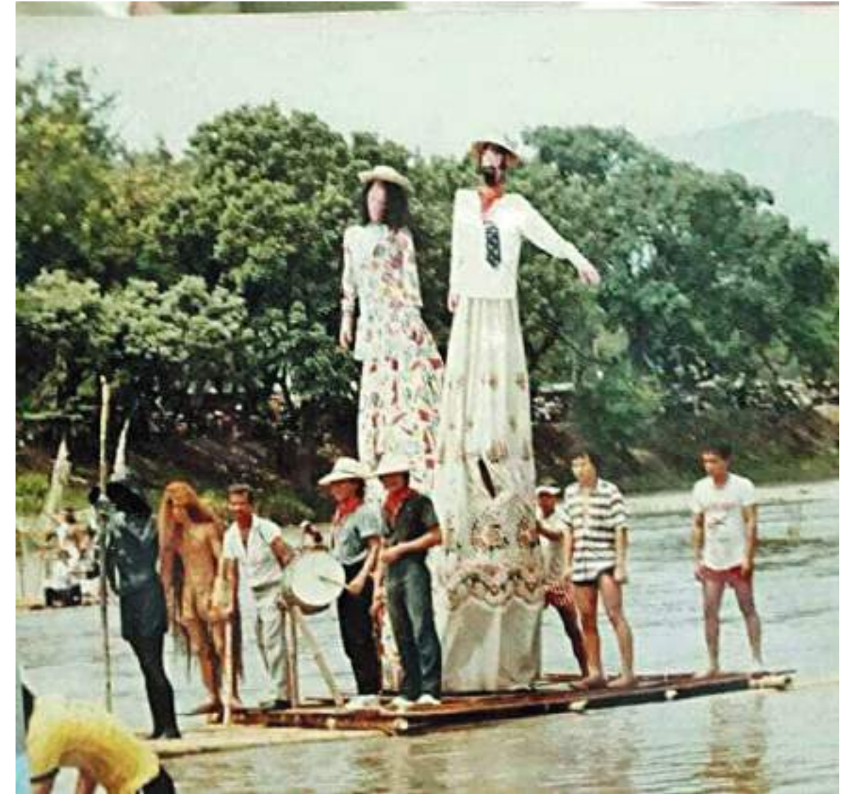
También tradicionalmente recorrían el río.

De tal manera que los mitos y leyendas siempre estarán asociadas a nuestras festividades, ya que forman parte de la propia historia regional y por ende de las fiestas que siguen conservando las tradiciones, no solo en el baile del sanjuanero, hay que tener en cuenta, la gastronomía, el vestuario y cada uno de los mitos y leyendas que ayudan a mantener vivas esas tradiciones.