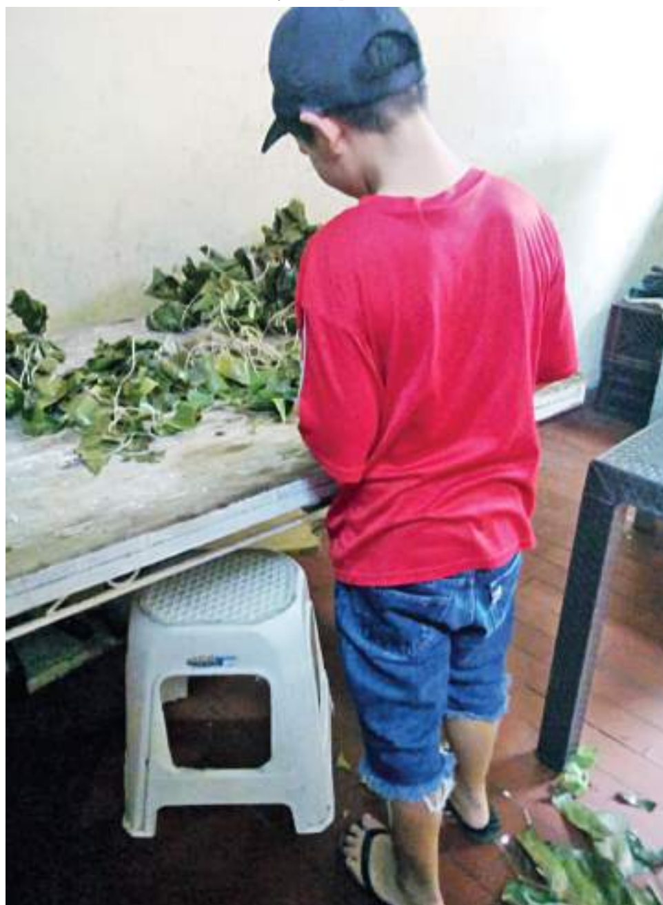
Durante esta época del año los menores han sido sorprendidos en estado de alicoramiento, bajo el efecto de sustancia psicoactivas y portando armas.

Finalmente, invita a la ciudadanía a tener corresponsabilidad y estar comprometidos con los menores de la ciudad en condición de trabajo infantil. Actualmente, adelantan la estrategia “Tu moneda los condena”, con la que buscan erradicar esta problemática.