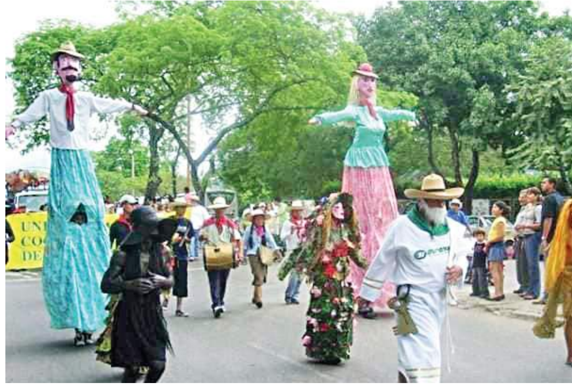
El Taitapuro y la Mamapura abren los desfiles en cada San Pedro.