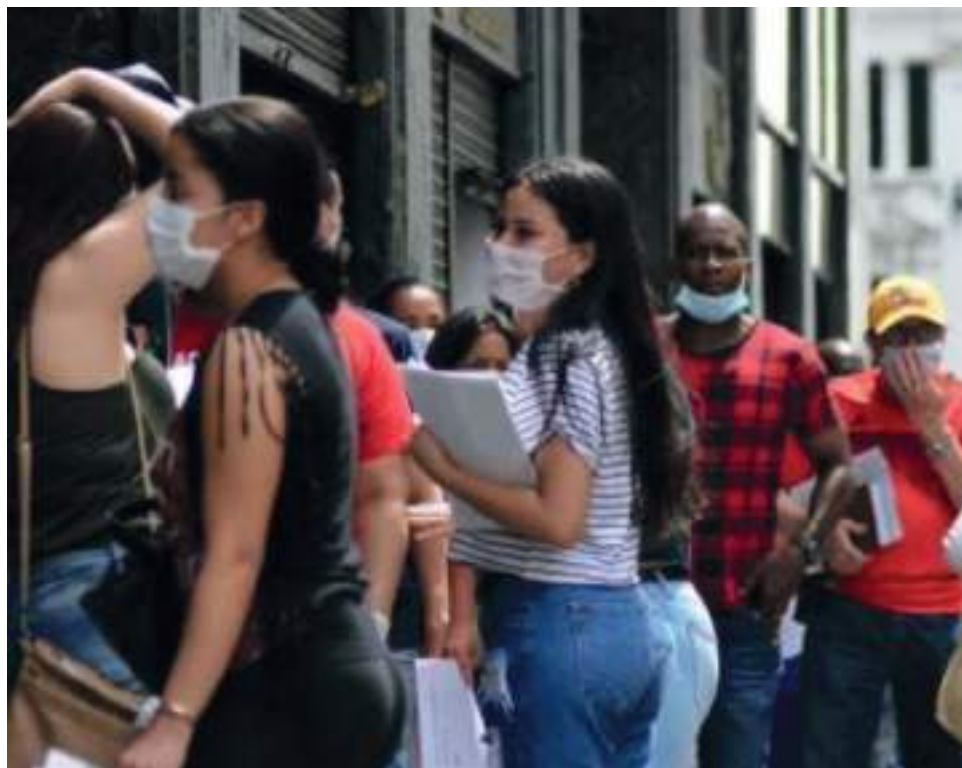
Buena parte de la población neivana tuvo la oportunidad de acceder a este tipo de subsidios que ayudaron a soportar la carga económica que tienen las personas tras la pérdida de un empleo.

Así mismo, la flexibilización de las jornadas laborales en los días hábiles de la semana se terminará una vez finalice junio. Esto correspondía a que desde que inició la emergencia a causa de la pandemia de covid-19, la jornada de 48 laborales a la semana, se podía repartir en solamente cuatro días. Es decir, en jornadas de 12 horas por día. Para así, dar un día más de descanso a los empleados que se sumará a los del fin de semana.