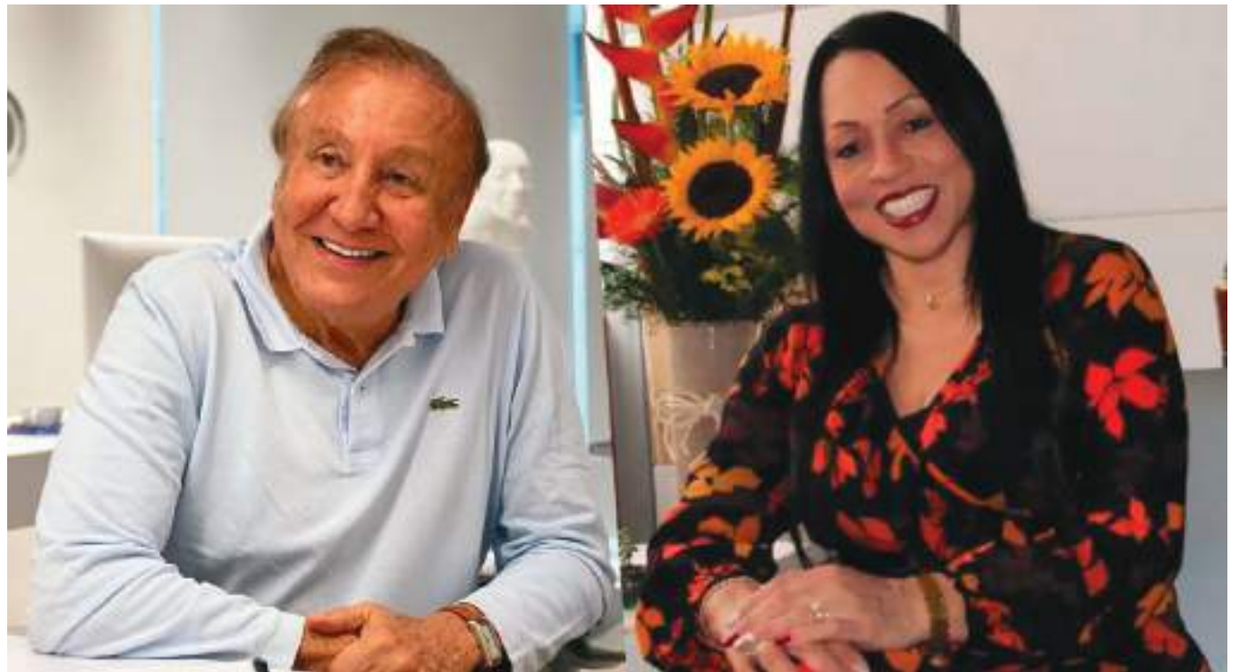
El excandidato presidencial llegará a ocupar su lugar en el Parlamento tras haber quedado segundo en las elecciones presidenciales. Su fórmula vicepresidencial irá a la Cámara de Representantes.

“Asumiré la credencial de senador que se me ha expedido en virtud del artículo 24 de la Ley 1909 de 2018, ‘Por medio de la cual se adopta el Estatuto de la Oposición Política y algunos derechos a las organizacio-