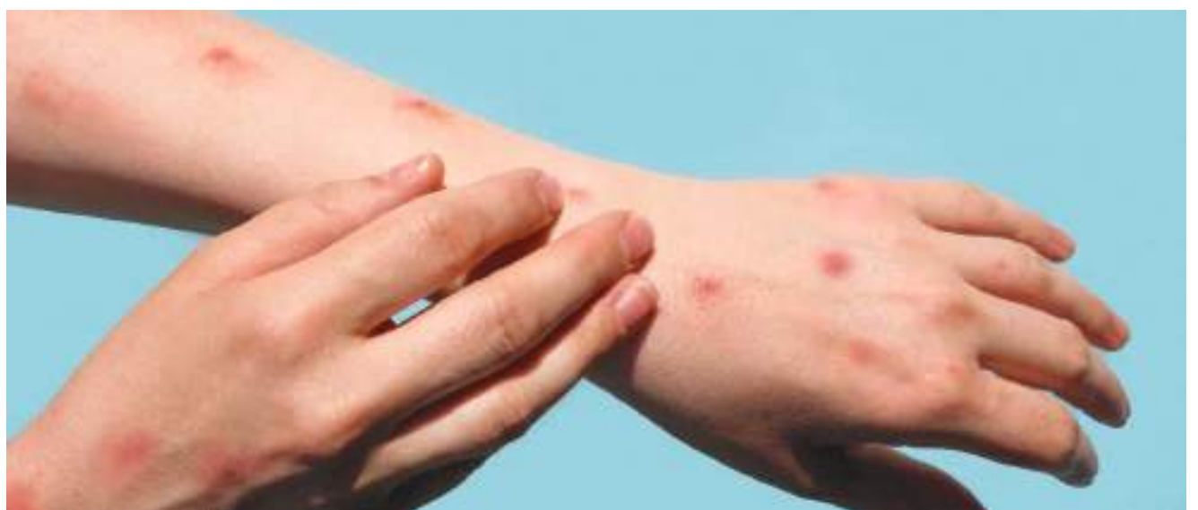
El Instituto Nacional de Salud señaló que se identificaron tres casos en territorio nacional, 2 en Bogotá y uno en Medellín.

Cuéllar pidió calma a la población colombiana y advirtió que hay que estar