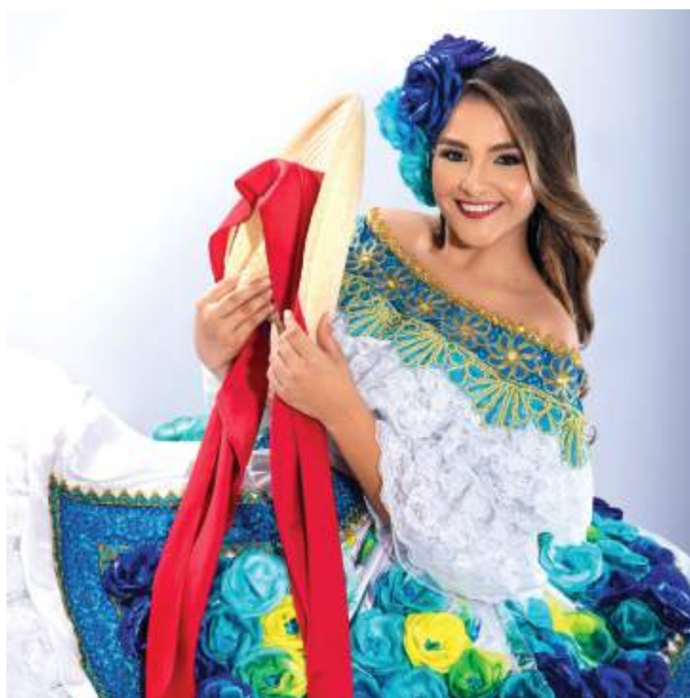
Una velada cultural, será la mejor excusa para recordar el legado opita y enaltecer el talento de los artistas locales.

"También las diversas entidades y colegios no dejan pasar la temporada y han realizado actividades que hace que se dinamice los diversos sectores. La verdad nuestro municipio siempre se ha caracterizado por unas fiestas muy tranquilas y se realizan de manera popular en el parque principal donde tienen acceso propios y turistas", puntualizó.