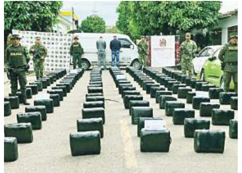
Las autoridades realizaron el decomiso de 655 kilos de marihuana Cripuy avaluados en 716 millones de pesos.

El trabajo interinstitucional es una constante en carreteras del Huila, neutralizando las pretensiones de las bandas criminales de pasar por los corredores Opitas grandes cargamentos para soportar sus economías ilícitas.