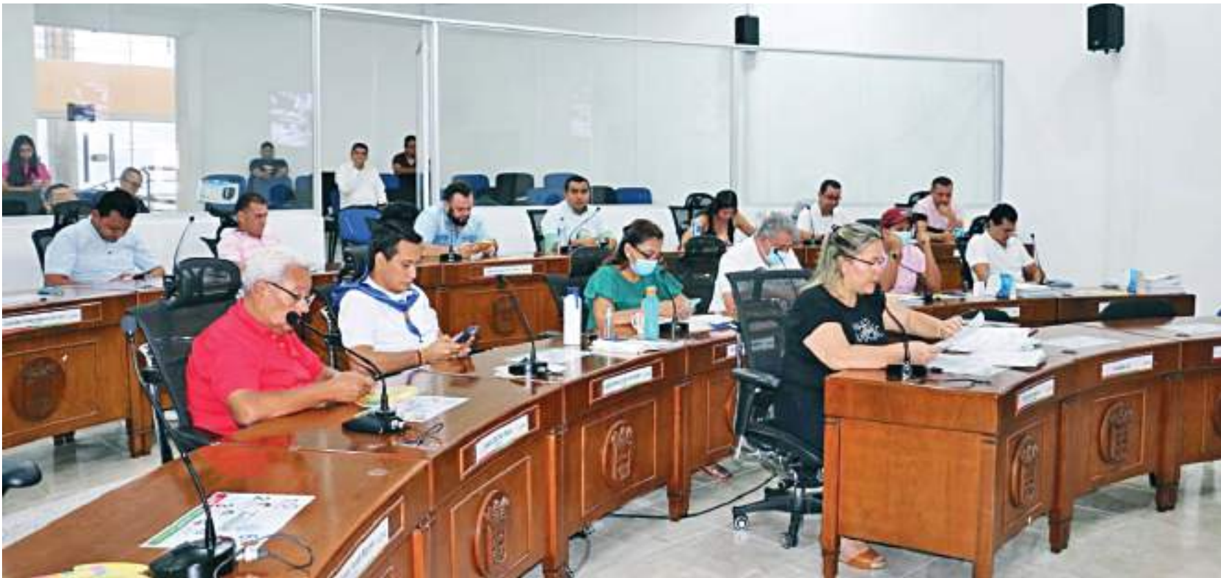
Siguen los "enredos" en el Concejo de Neiva tras la elección del nuevo Contralor Municipal.

■ Luego de tantos tropiezos que ha dado el proceso de elección de Contralor Municipal, al parecer este nuevo intento de que la Corporación Concejo de Neiva haga la elección definitiva de quien controlará el fisco municipal, dará luces. Sigue estando la zozobra de no saber quién quedará en el cargo una vez se venza el contrato del Contralor por encargo que tiene Neiva.