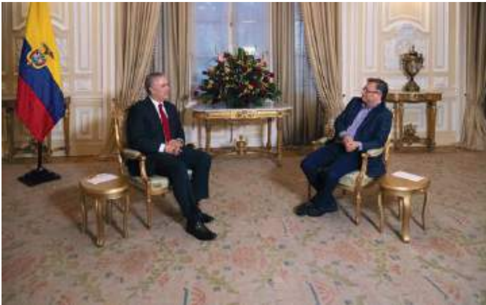
Gustavo Petro e Iván Duque se reunieron para iniciar empalme.

■ La reunión entre el presidente electo y el actual mandatario dio inicio al proceso de empalme para el cambio de administración. Dentro de los temas tratados estuvieron la seguridad nacional y las finanzas del Estado.