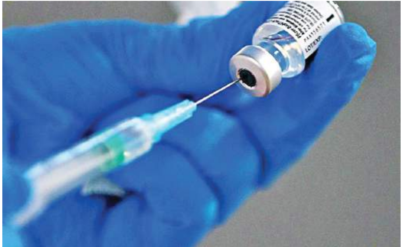
Un simple caso de viruela del mono en un país no endémico es considerado como un brote. Bavarian Nordic dispone de una capacidad de producción anual de 30 millones de dosis en su fábrica

En el seno de la Unión Europea, la autoridad sanitaria Hera, creada a raíz de la pandemia de