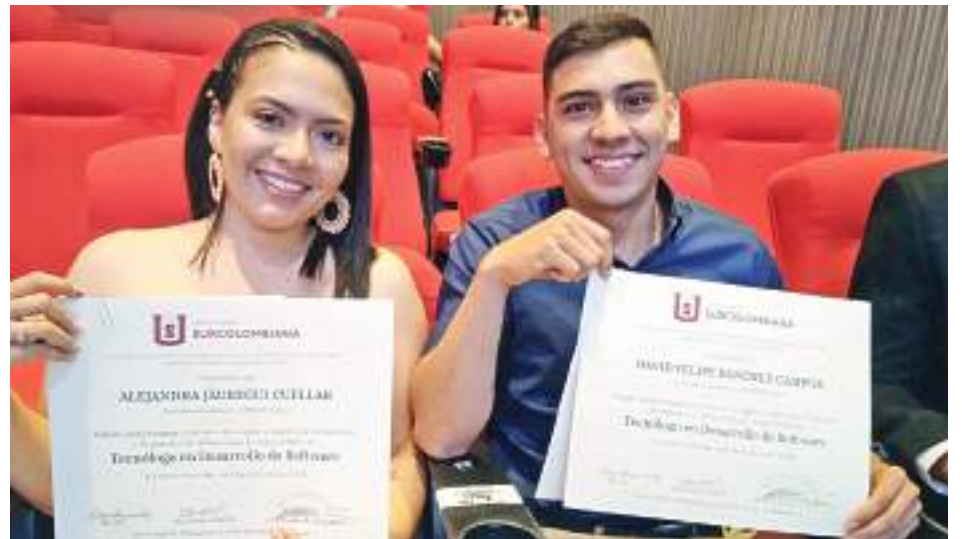
Éxitos en su vida profesional.