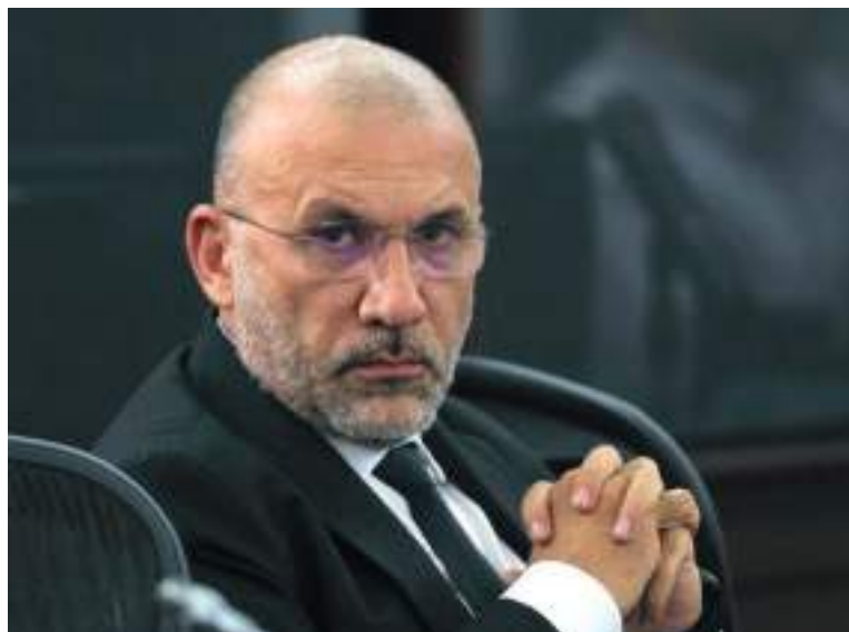
El senador Roy Barreras llegaría a la Presidencia del Senado durante el primer año de mandato del presidente electo Gustavo Petro.

La candidatura que sigue enredada es la de la Cámara de Representantes, pues aunque Katherine Miranda, de la Alianza Verde, postuló su nombre, en esa puja también está David Racero, quien ha sido más de la entraña del Presidente electo.