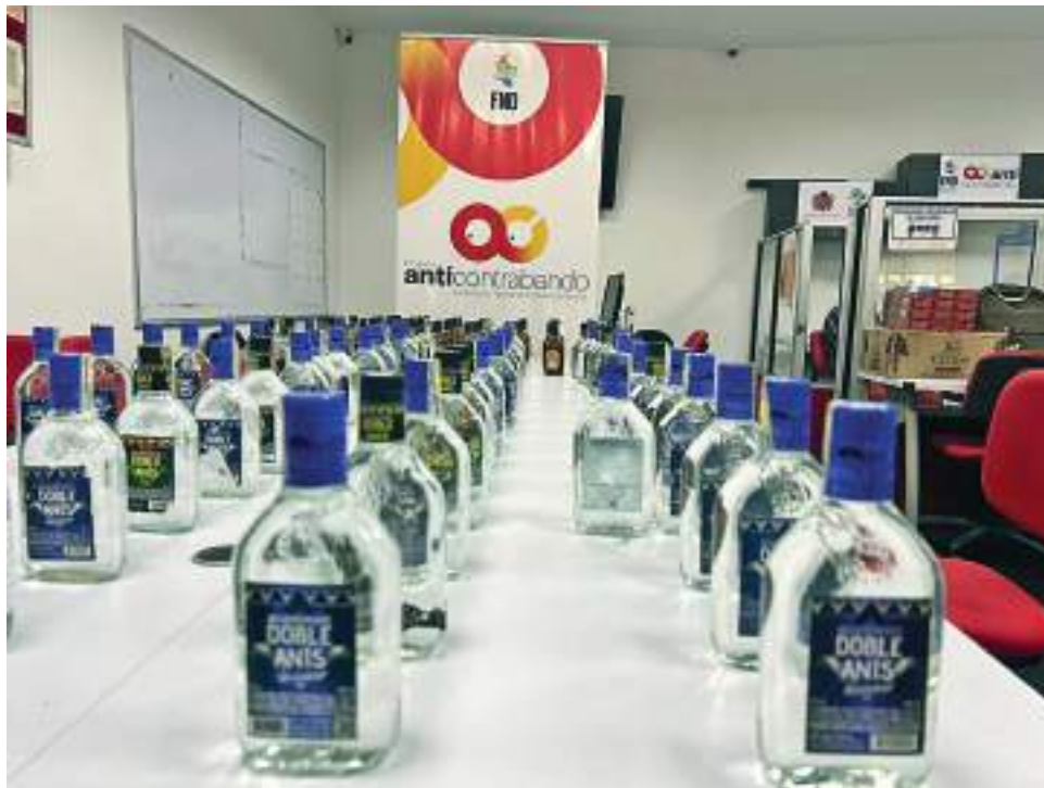
El aguardiente Doble Anís es uno de los licores más contrabandeados en esta época.

Frente a este inconveniente que afecta año tras año no sólo al de-