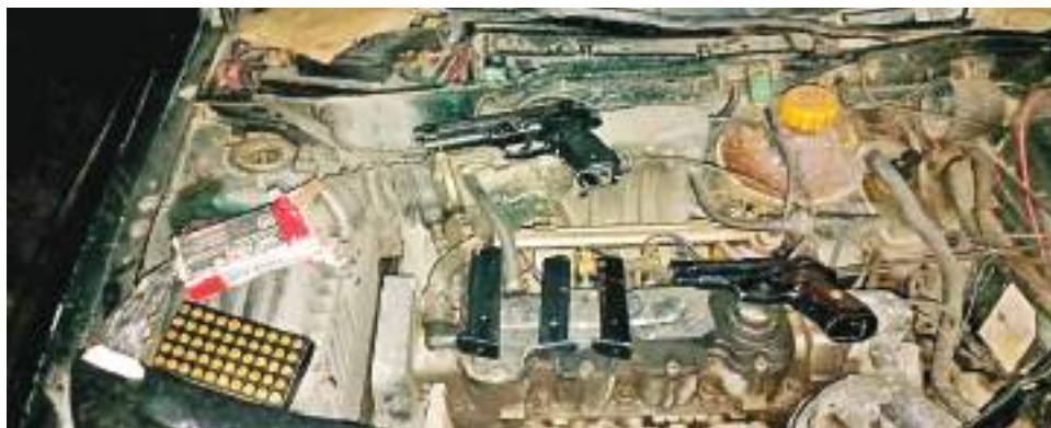
Bajo la modalidad de caleta, dos hombres transportaban armas de fuego y munición en un vehículo en el sur del Huila.