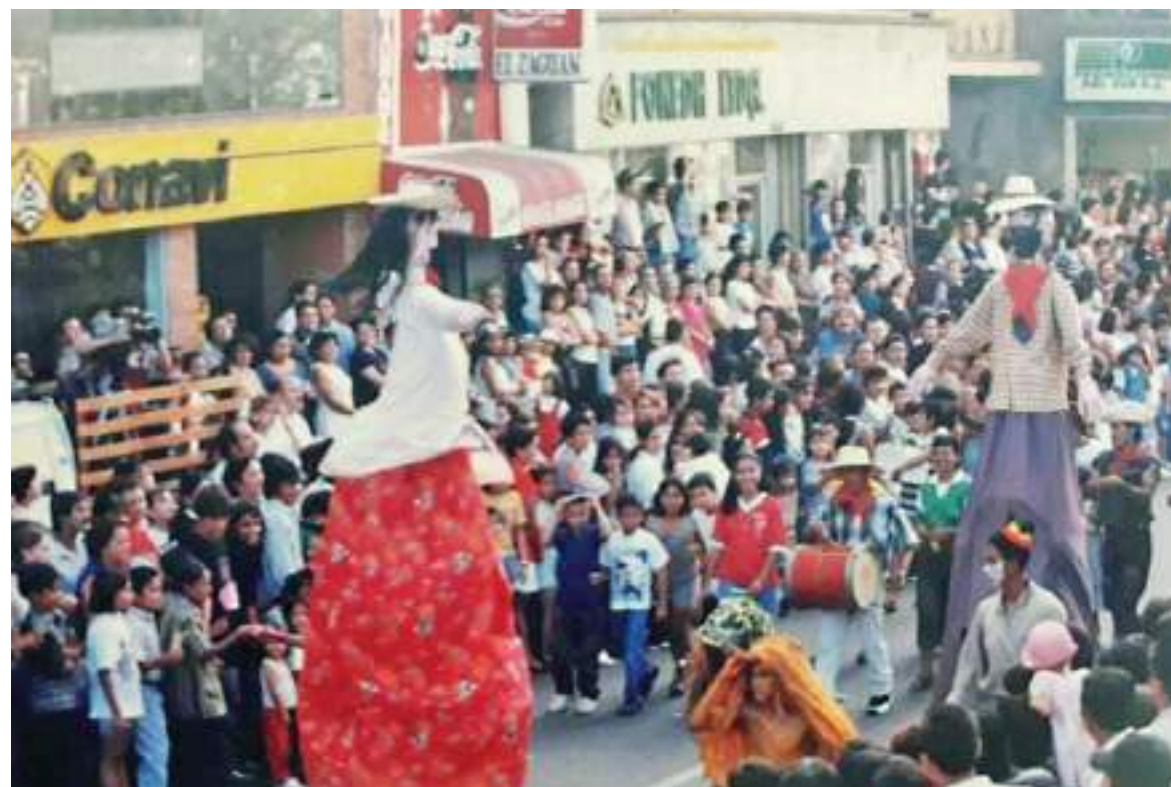
Estos dos personajes animan al pueblo a disfrutar las fiestas en paz y armonía.