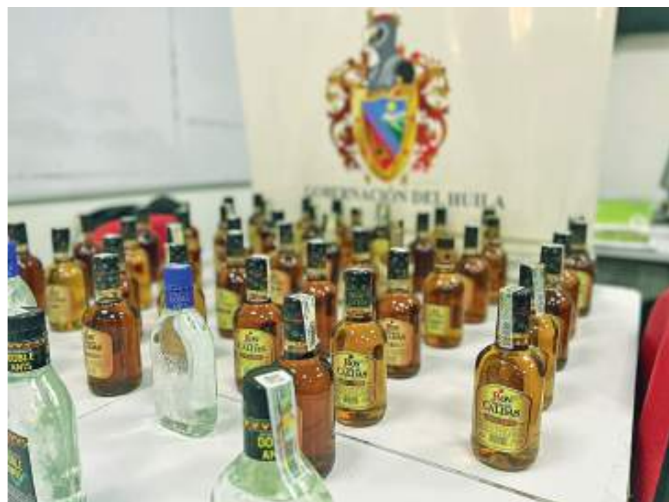
En el Ron Viejo de Caldas, los logos de la licorera deben coincidir perfectamente entre el cuello de la botella, el aro de seguridad y la tapa.

Es así como el Equipo Operativo Anticontrabando ha aprehendido más de 5.000 botellas, entre licor de contrabando y adulterado, lo que pone en una alerta al departamento frente a este tipo de acciones delictivas que atentan principalmente la salud de las personas que puedan llegar a consumir este tipo de licores.