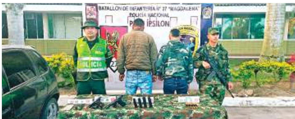
Al parecer se dirigían al vecino país de Ecuador.

La Policía señaló que los capturados junto con los elementos incautados y el automotor fueron dejados a disposición de la Fiscalía 32 local Pitalito, por el delito de fabricación, tráfico, porte o tenencia de armas de fuego, accesorios, partes o municiones. Resaltó además que las armas de fuego serán enviadas a laboratorio balístico para determinar si fueron empleadas en algún caso de homicidio.