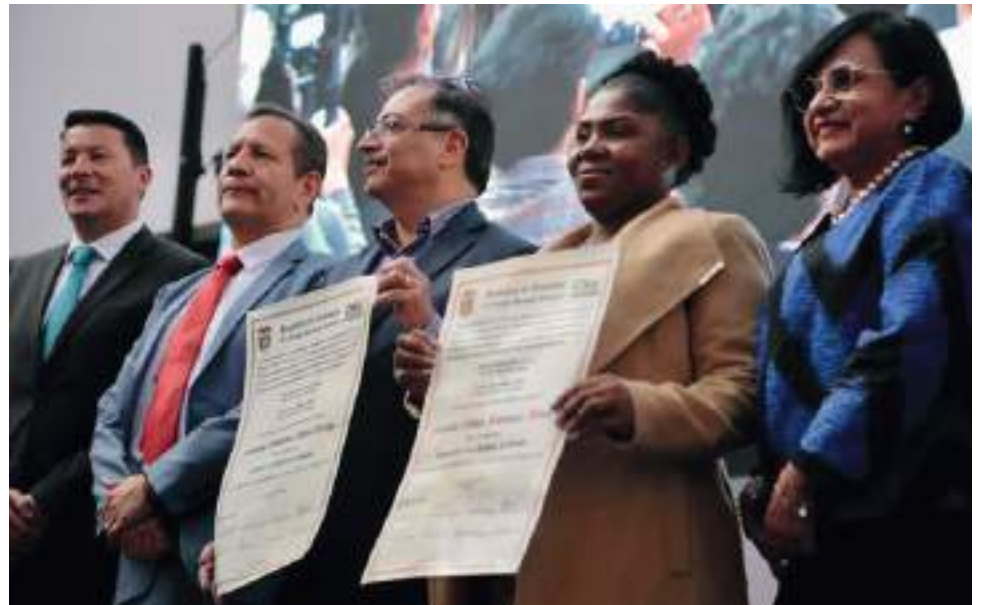
Petro se alza como el primer presidente de izquierdas de Colombia. Por su parte, Márquez se convirtió en la primera vicepresidenta afro del país y la segunda mujer en ocupar el alto cargo.