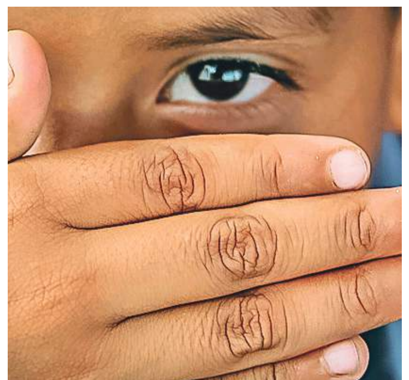
El trabajo infantil en la ciudad de Neiva es una problemática que se viene presentando de manera regular.