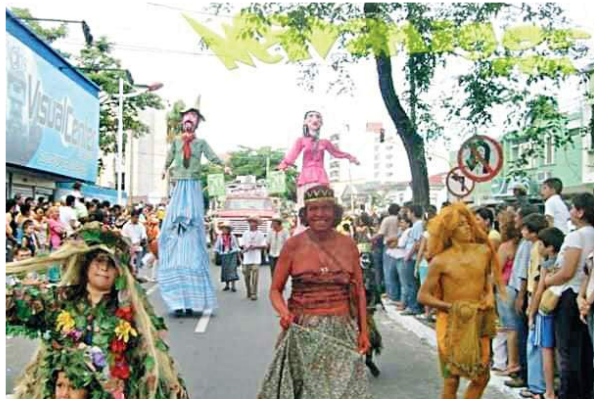
Los mitos no pueden faltar en cada desfile.