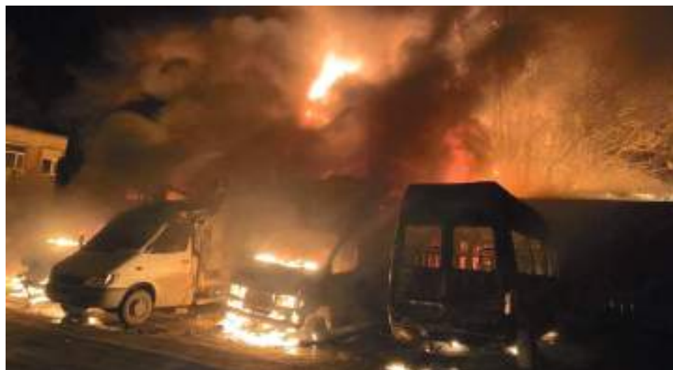
Ataques de Rusia en Mykolaiv, al sur de Ucrania.

“En un bloqueo completo. Sin comida, sin agua, sin medicinas. Bajo constante bombardeo”, ha dicho Zelenski. Además, ha acusado a Rusia de capturar