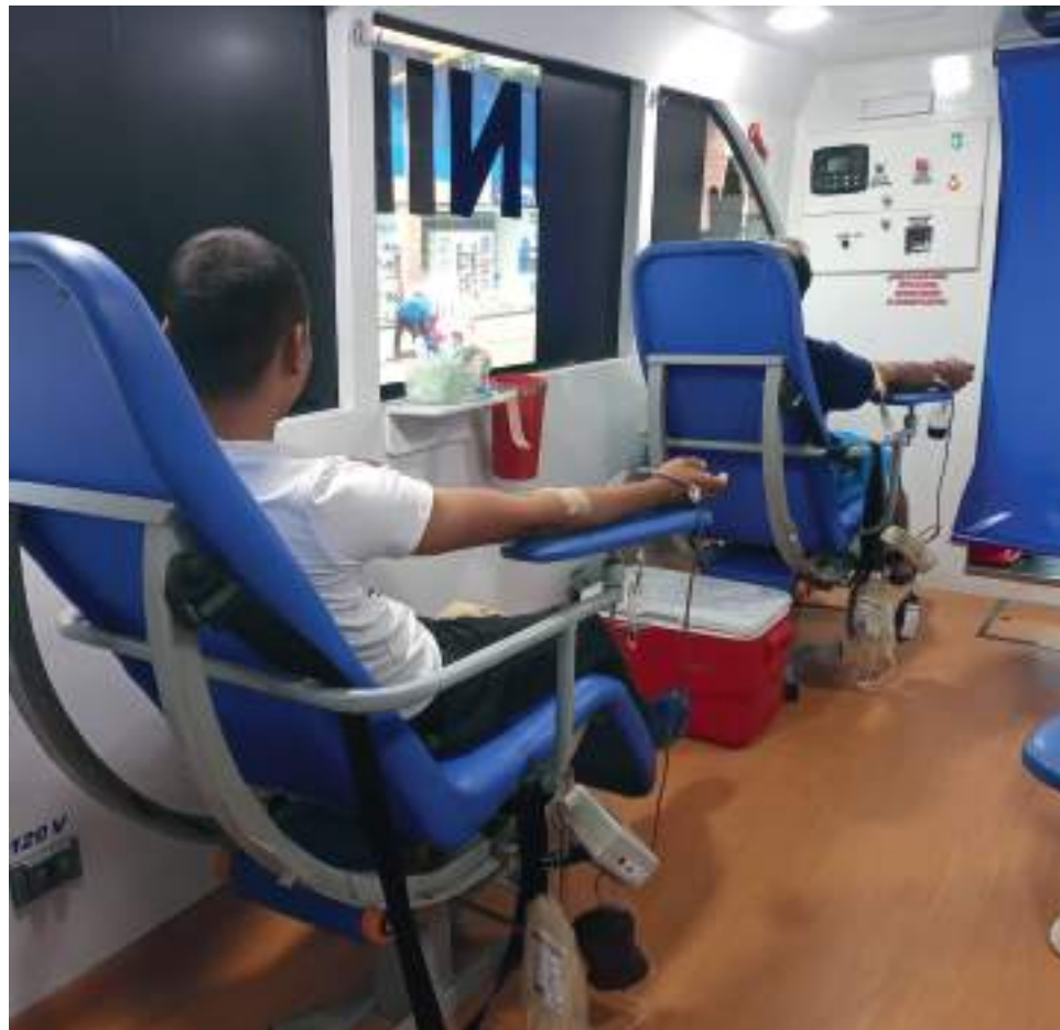
Poco a poco se ha ido reactivando la donación de sangre por parte de las personas que desean salvar vidas con este acto.

“En preciso aclarar que se ha aumentado en un 20% la necesidad de sangre para diferentes causas, transfusiones, cirugías, enfermos de cáncer, procedimientos que se realizan y para el dengue cuando es grave; que dado el aumento en los casos ha hecho que también se requiera