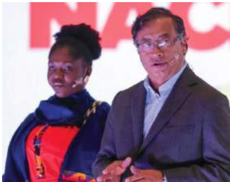
Francia Márquez, candidata vicepresidencial del Pacto Histórico, con el candidato, Gustavo Petro.

Francia Márquez es una abogada de 39 años nacida en Suárez, Cauca, quien comenzó a ser reconocida por sus luchas contra los impactos ambientales de la minería en su municipio. El que Petro la eligiera como su fórmula, significa que cambia de rumbo la