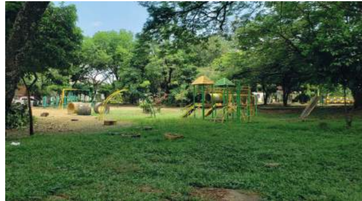
Zonas verdes y parque biosaludable del lugar.