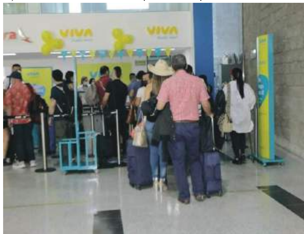
Los aviones que maneja la aerolínea Viva son los A320, totalmente nuevos y cuentan con 188 sillas.

"Me parece interesante y bueno, porque esto no solamente ahorra dinero, sino también tiempo y permite acceso fácil a la ciudad".