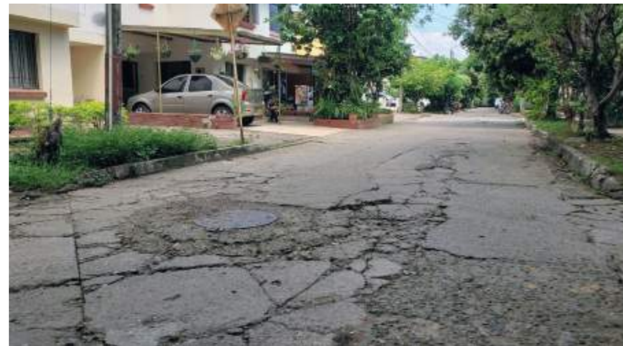
Mejoramiento de vías, uno de los propósitos de la nueva JAC.