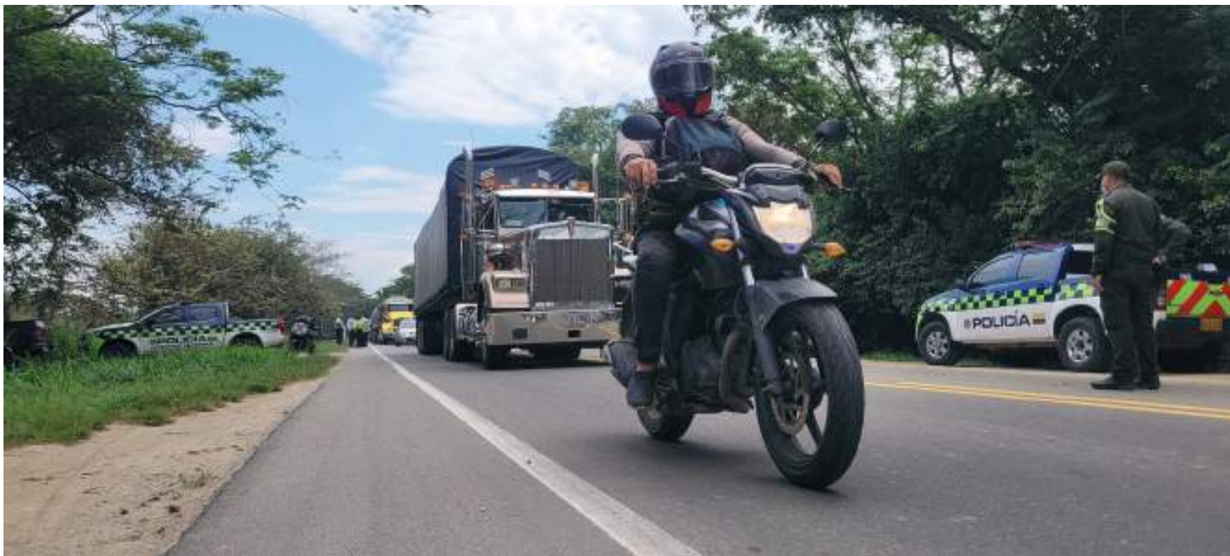
Comité del paro levantó la protesta pacífica en la vía que de Neiva conduce al municipio de Palermo.

■ Luego de día y medio de protesta pacífica en la vía que de Neiva conduce al municipio de Palermo en el sector conocido como la Báscula, se normaliza el paso por este tramo vial. Las conciliaciones a las que llegaron los manifestantes y los diferentes órganos del gobierno municipal y departamental permitieron que se desbloqueara esta importante arteria vial. De ser incumplidos los términos de las negociaciones, volverá a levantarse el paro, advirtieron los autores de la protesta.