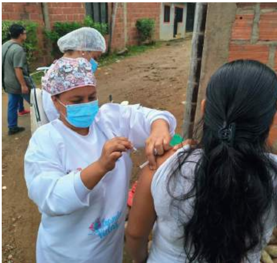
La concentración de la vacunación Covid-19 en el Parque de la Música, venía funcionando desde el mes de junio de 2021. Las jornadas de vacunación seguirán en los distintos barrios de Neiva, así como la campaña de Vacunación Casa a Casa.

Finalmente, la subgerente Técnica Científica de la ESE 'Carmen Emilia Ospina' también informó que la comunidad puede estar tranquila porque se van a garantizar las jornadas de vacunación en los distintos barrios de Neiva, así como la campaña de Vacunación 'Casa a Casa' y con esto se continuará efectuando el buen comportamiento de la población con las dosis de vacunación.