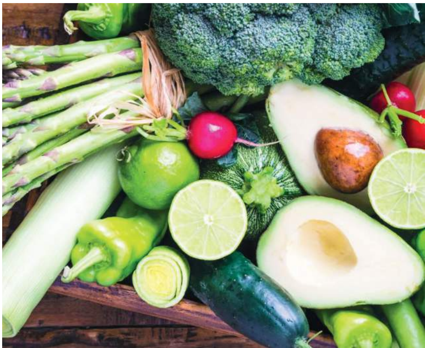
La vitamina A, C y D son importantes al momento de prevenir, mientras que el omega-3, la vitamina B12 y los fitoesteroles ayudan a combatir una gripa.

Por ejemplo, la vitamina A es esencial no solo para los ojos, también tiene la importante función de regular la producción y la actividad de las células del sistema inmune, conocidos como linfocitos T, que evitan que los virus causen demasiados estragos una vez que entren en nuestro cuerpo. Además, tiene un importante papel en mantener en buen estado las mucosas de las vías respiratorias para impedir la entrada de