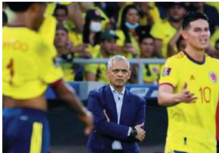
Reynaldo Rueda y su reto de salvar la clasificación.

Álvaro Montero como arquero; lateral izquierdo Johan Mojica, centrales; Davison Sanchez y William Tesillo; lateral por derecha Stefan Medina. Gustavo Cuellar como volante central, otro volante central Mateus Uribe; extremo derecho Juan Guillermo Cuadrado, extremo izquierdo Luis Díaz y delanteros Luis Fernando Muriel y Alfredo Morelos.