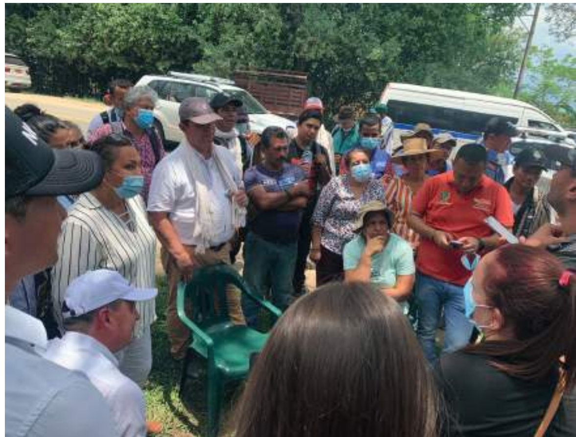
Los manifestantes advirtieron que el incumplimiento de los compromisos adquiridos hará que nuevamente se hagan bloqueos de la vía.

Habrà paso parcialmente de motocicletas si las condiciones de maniobrabilidad de la grúa lo permiten. Se recomienda tomar la vía alterna Riverita-Rivera.