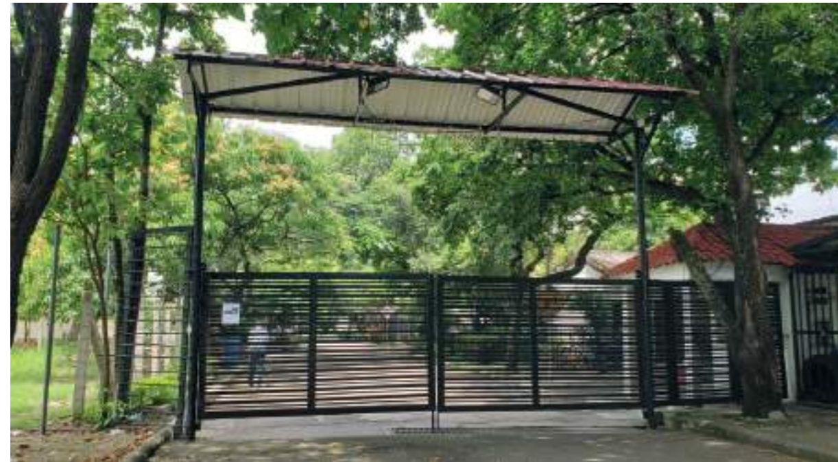
Portón de ingreso y salida a Andalucía IV Etapa Caobos.