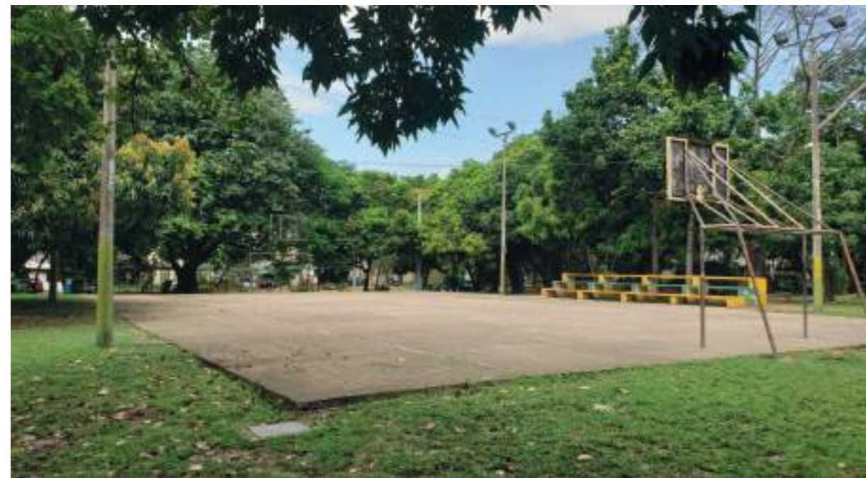
Polideportivo que esperan techar para mejor uso del mismo.