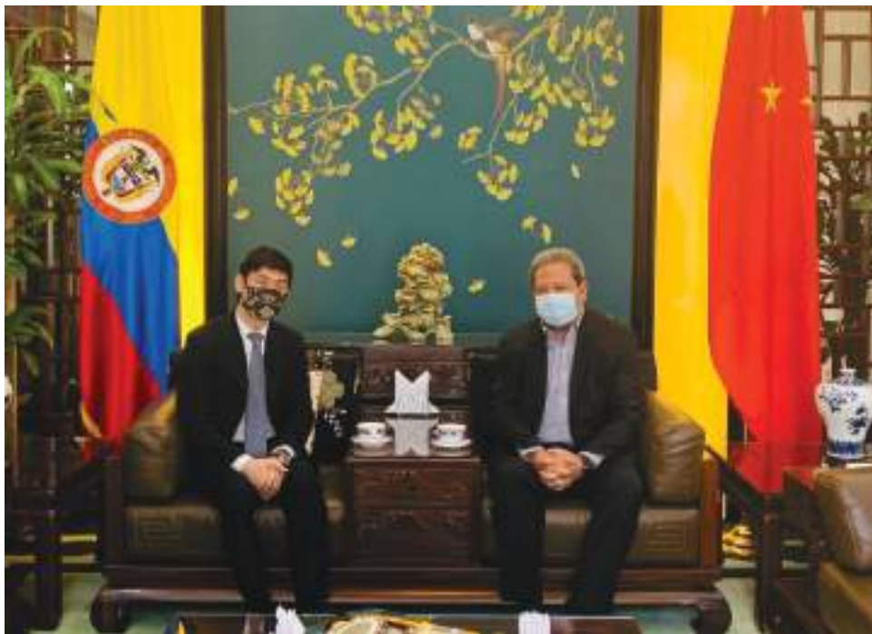
En la reunión del embajador de China y la Gobernación del Huila, se trataron temas de cooperación y acercamientos comerciales de doble vía para el sector agropecuario, turismo de naturaleza, emprendimiento, tecnologías e innovación.

Entre tanto, ya China anticipó que asistirá a este evento y están completamente interesados en conocer el departamento. “Va a traer unos compradores internacionales, una comisión comercial importante para esta feria y también con temas de cooperación el fortalecimiento del sector productivo. Asimismo, mos-