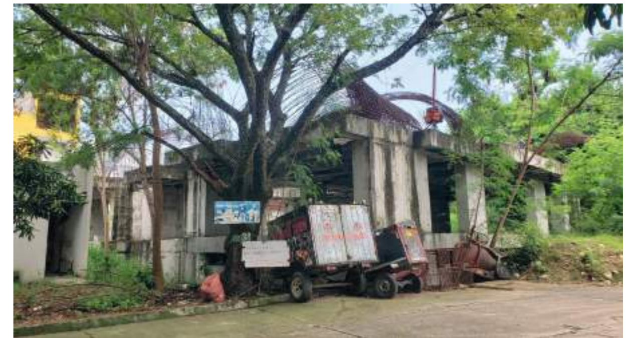
Bloque de apartamentos que se quedó en construcción.

Andalucía IV Etapa Caobos es considerado un verdadero paraíso por sus habitantes, por la flora, la fauna y el jardín botánico que tienen a su alrededor.