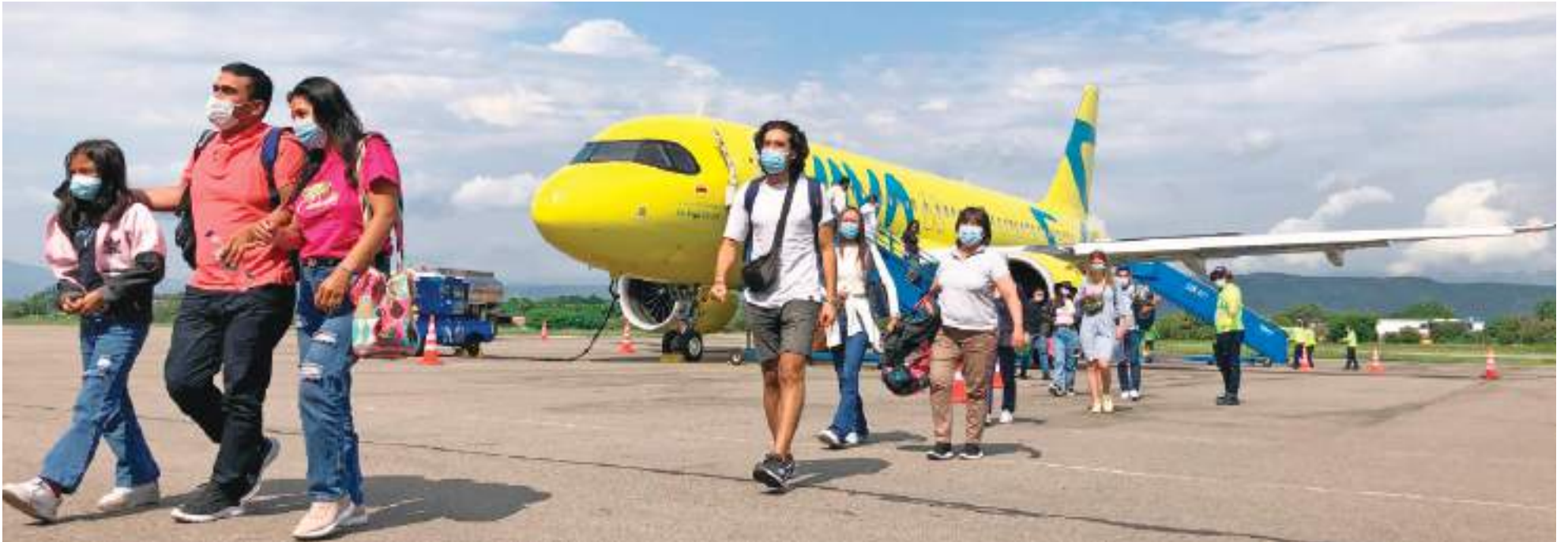
El primer vuelo que se dio, ayer 23 de marzo, salió con el cupo completo hacia Cartagena. La conectividad aérea se convierte en una estrategia fundamental para el desarrollo económico del municipio de Neiva.