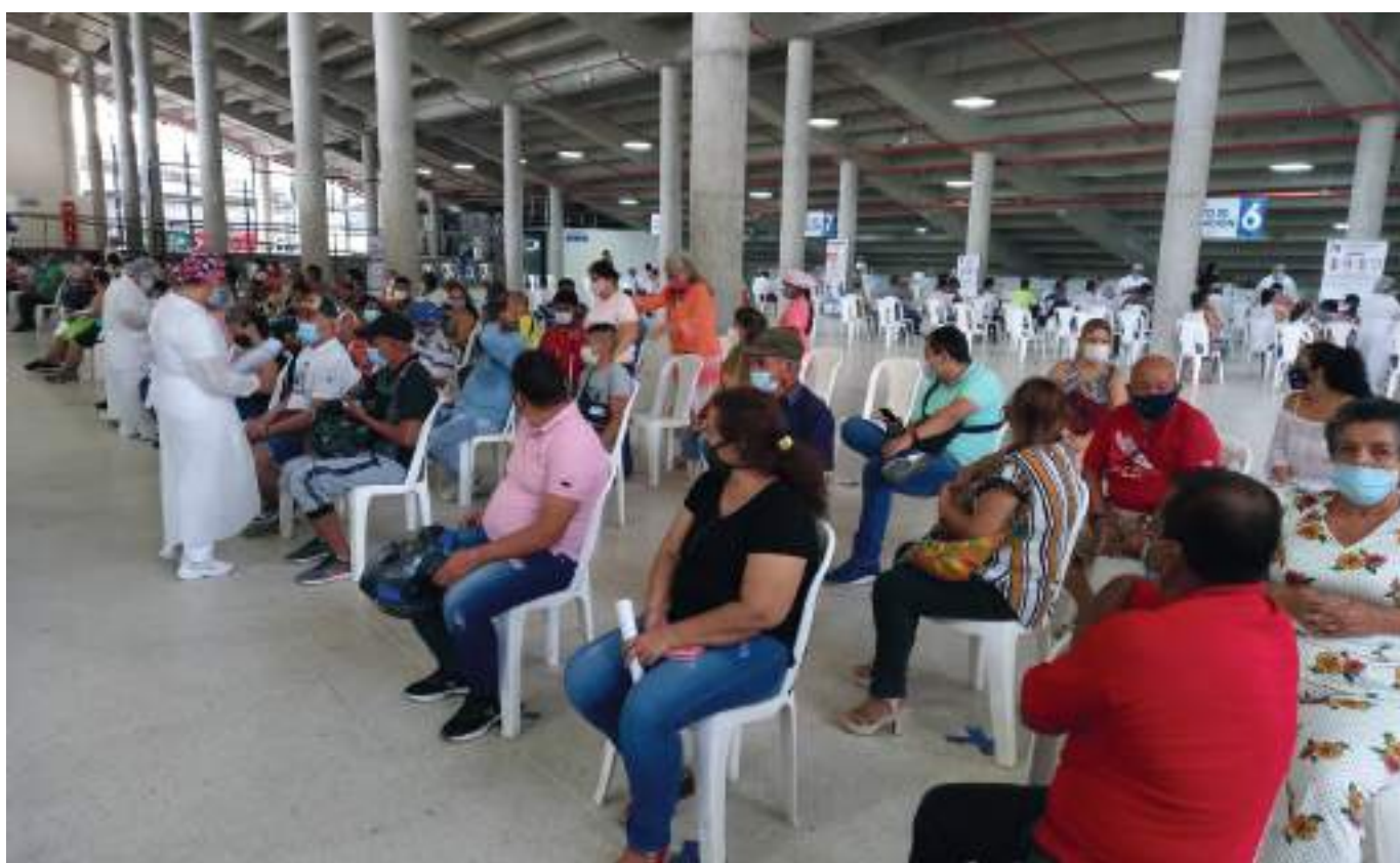
Los puntos de vacunación instalados en el Parque de la Música funcionarán solo hasta hoy jueves, 24 de marzo. A partir del 28 del mismo mes la ESE 'Carmen Emilia Ospina' los trasladará a la sede Canaima.

La concentración de la vacunación Covid-19 en el Parque de la Música, desde el mes de junio de 2021, fue un acierto de