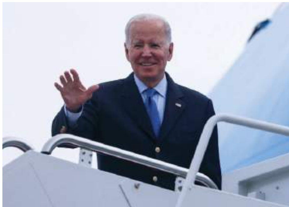
Joe Biden aborda el Air Force One

uso de armas químicas o biológicas”, dijo Stoltenberg, añadiendo que la OTAN había observado el “ruido de sables nuclear” del presidente ruso Vladimir Putin. “Cualquier uso de armas químicas cambiaría totalmente la naturaleza del conflicto... y tendría consecuencias de gran alcance”, añadió Stoltenberg.