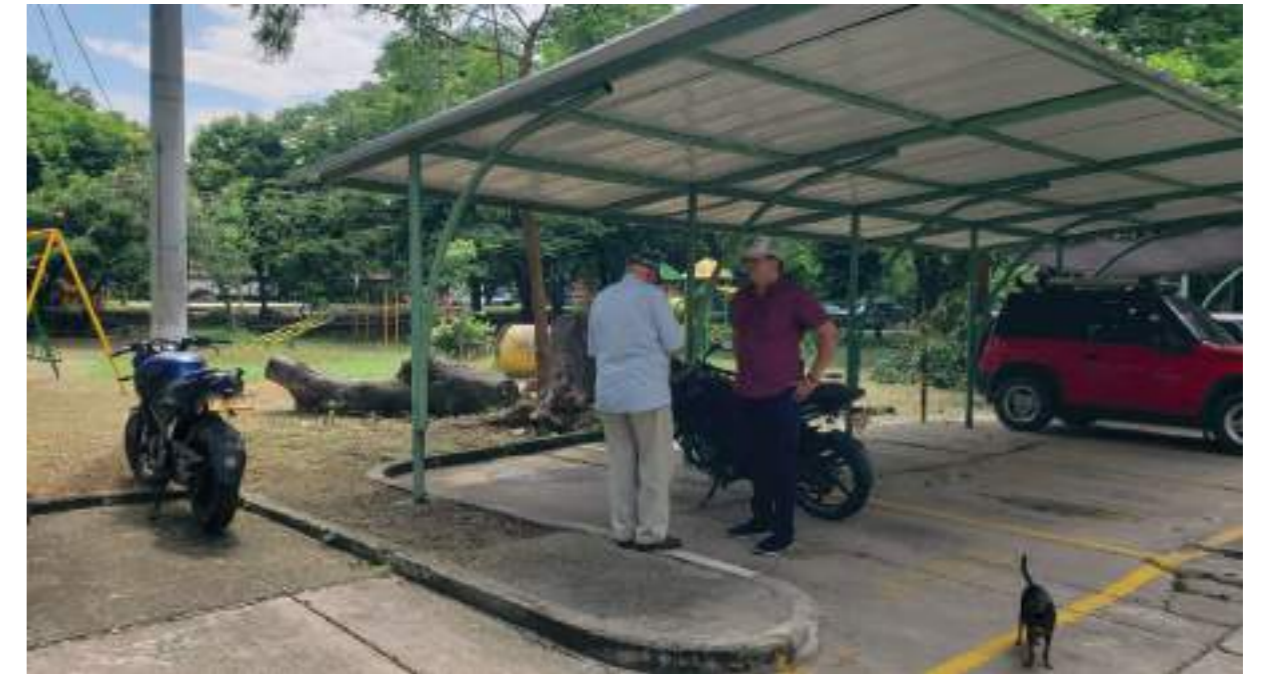
El presidente de la JAC de Andalucía IV Etapa.