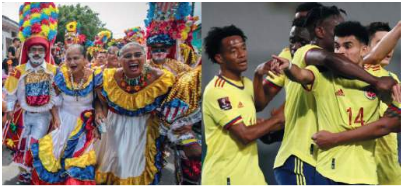
En Barranquilla viven el regreso del Carnaval, la Selección está en segundo plano.

A la Selección Colombia le restan dos oportunidades para poder cumplir el sueño llamado Qatar, donde deberá conseguir los seis puntos disputados con buena diferencia de gol, en caso de empatar en puntos con