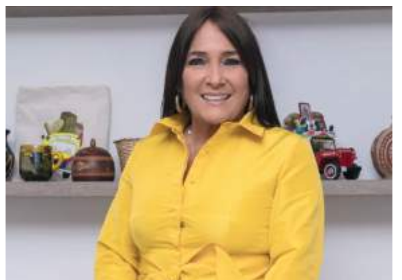
Iván Duque decidió nombrar a Correa como ministra de Vivienda luego de que Jonathan Malagón renunciara al cargo por asuntos personales.

Posteriormente, el 7 de agosto de 2018 fue designada como directora de Departamento para la Prosperidad Social, cargo que ocupa actualmente. Finalmente, cabe mencionar que en 2001 fue secuestrada por el Ejército de Liberación Nacional (ELN) y pudo quedar en libertad hasta que un grupo de la Policía Nacional la rescató en medio de un operativo. Estuvo en poder de esa guerrilla durante 13 meses y 2 días.