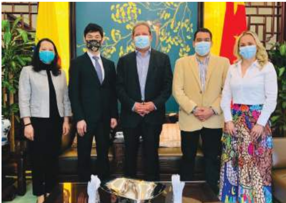
El país oriental afirmó su asistencia a la próxima ‘Feria internacional de Café, Cacao y Agroturismo’.

Esto es una oportunidad o convenio entre cul-