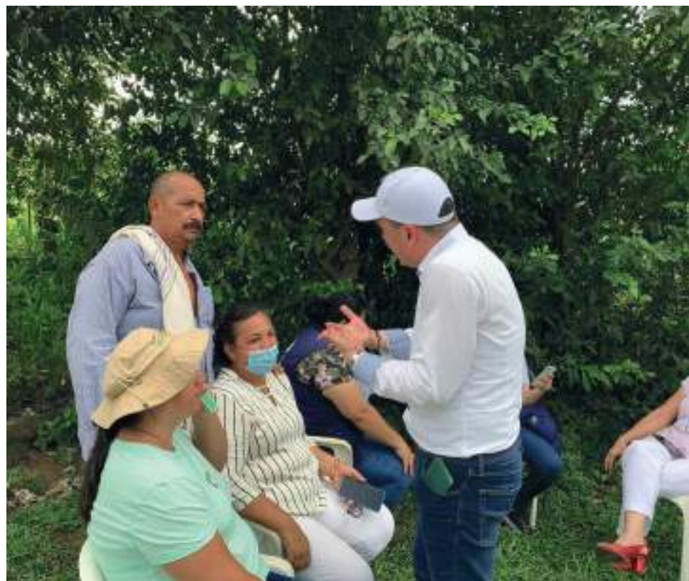
En medio de una mesa de diálogo los entes gubernamentales y la población llegaron a acuerdos puntuales.

La anterior publicación se realiza para los fines establecidos en el artículo 225 de la ley 599 del 2000.