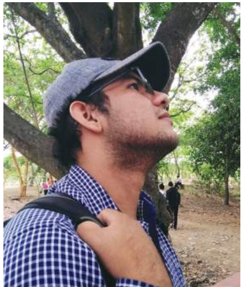
Su diseño 'Resurgir huilense', alcanzó la más alta votación del concurso de Coporsanpedro.

Asimismo, en la publicación se apreciaba el argumento del autor, "Las tradiciones se mantienen y reviven cada año a través de hermosas melodías que resuenan en nuestro territorio; el espíritu huilense se transporta desde épocas de antaño, donde la majestuosidad de sus coloridos trajes nos contagia de alegría, mientras los rajaleñas y comparsas hacen vibrar a un pueblo multitudinario?"