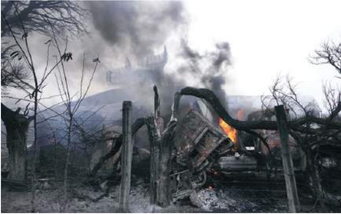
Radares dañados y otros equipos se ven en una instalación militar ucraniana en las afueras de Mariupol, Ucrania, el jueves 24 de febrero de 2022.

En una rueda de prensa este jueves, Zelensky vinculó las acciones de Putin con la Alemania nazi.