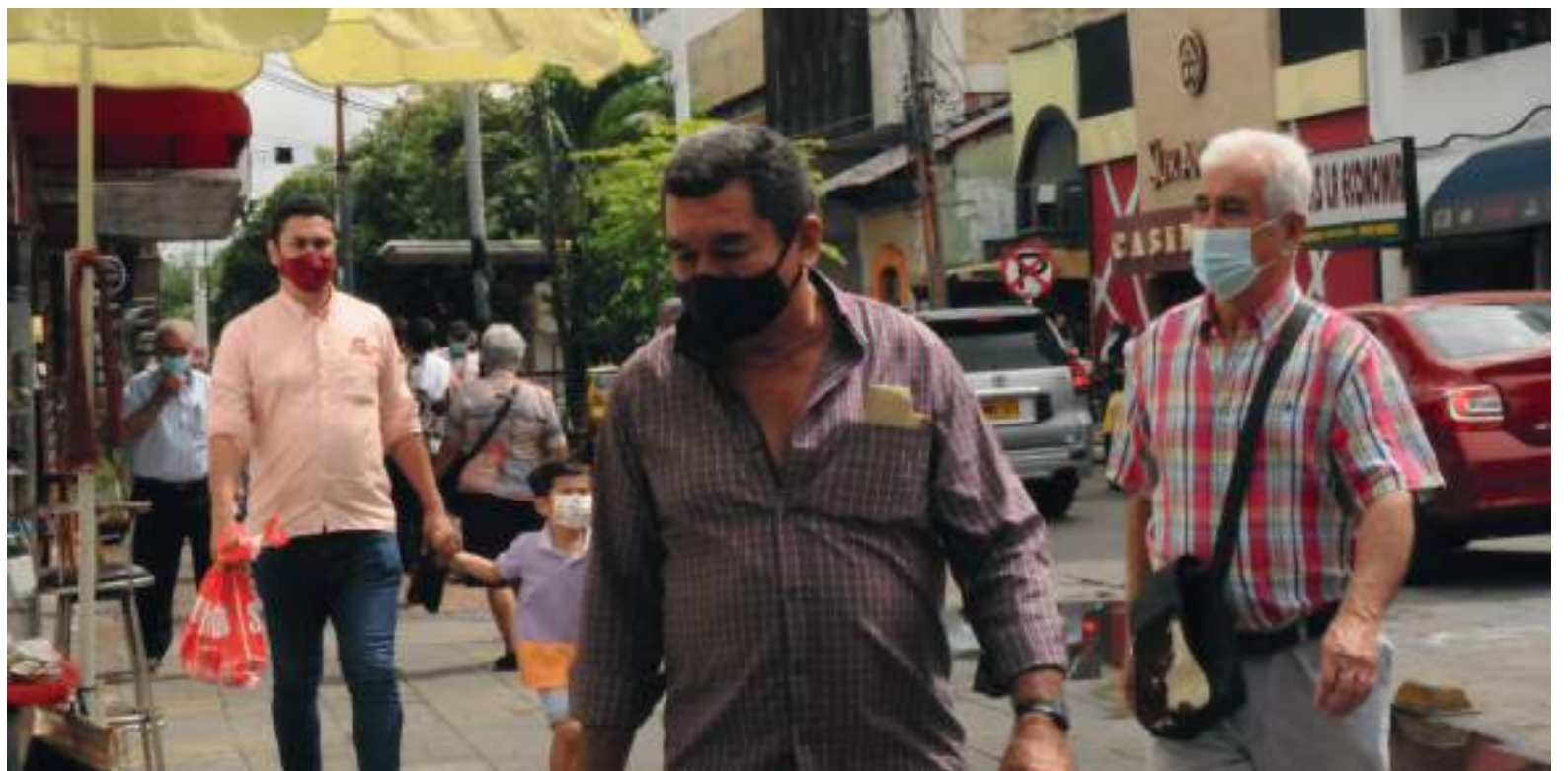
La Sala de Análisis del Riesgo para la vigilancia epidemiológica del evento Covid-19 reportó 22 casos nuevos en 5 municipios.

El informe también señala que 59 colombianos fallecieron a causa de la enfermedad en el último día. De esta manera, el país llega a un total de 138.421 muertes a causa del virus desde el inicio de la pandemia.