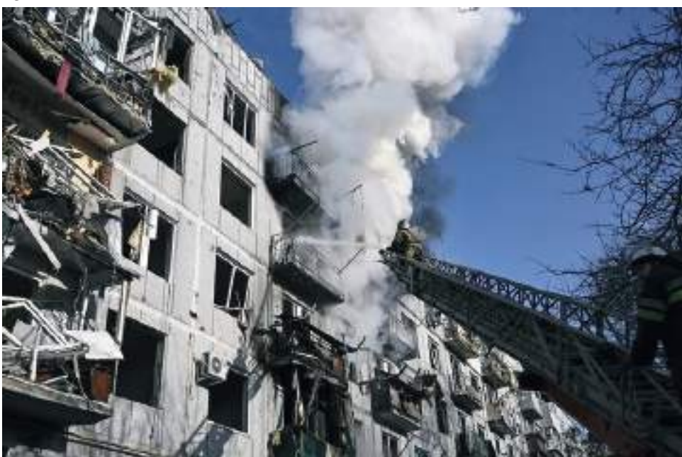
Los bomberos trabajan en un incendio en un edificio después de los bombardeos en la ciudad de Chuguyiv, en el este de Ucrania

Rusia lanzó una andanada de ataques aéreos y con misiles en Ucrania el jueves temprano y funcionarios ucranianos dijeron que las tropas rusas entraron en el país del norte, este y sur.