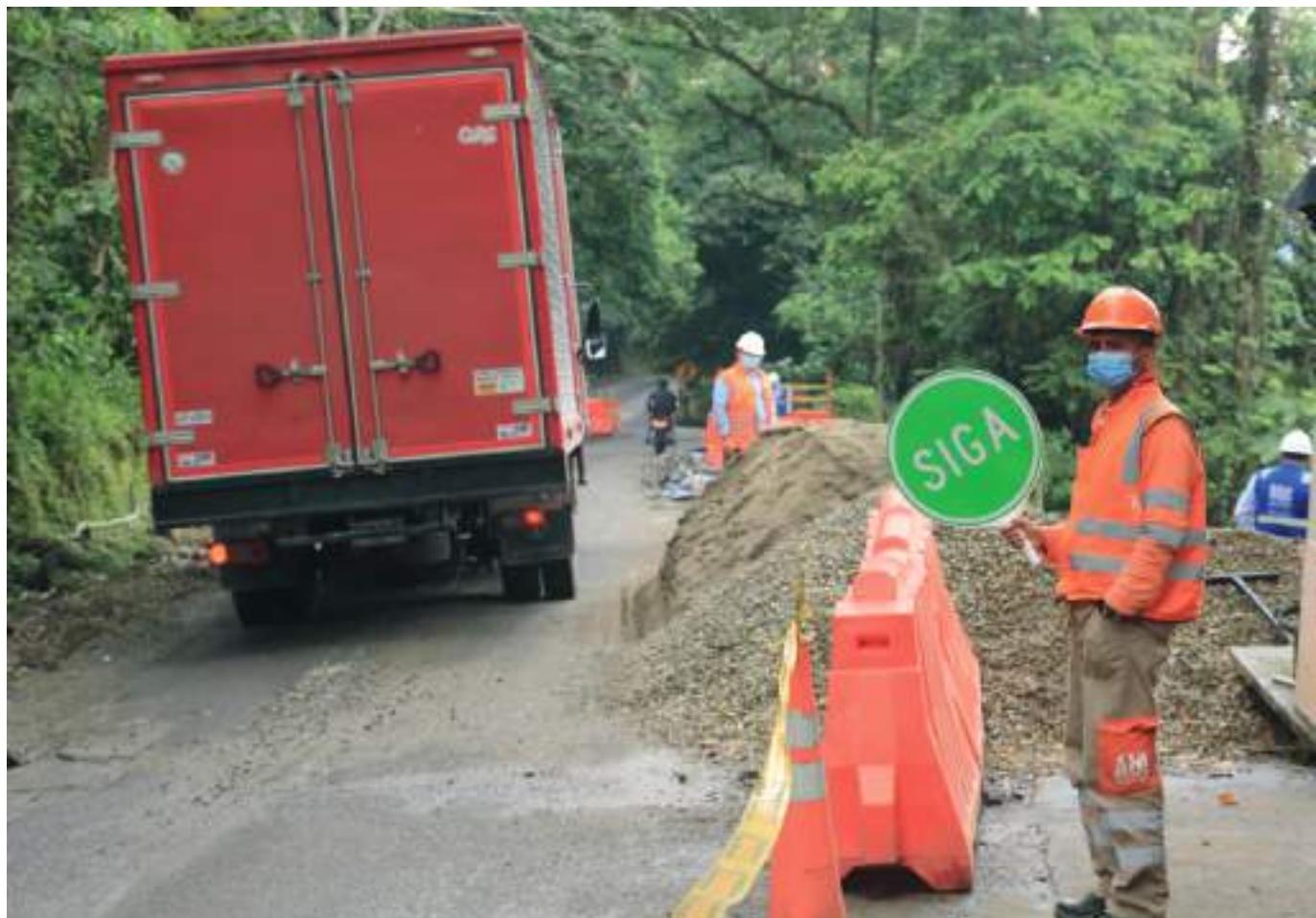
Una vez finalizada la etapa de normalización en junio próximo, la ANI iniciará la etapa de construcción del proyecto, que incluye la doble calzada de Neiva hasta Campoalegre. Se invertirá más de 1.7 billones de pesos.

Es de recordar que la ANI actualmente tiene 3 peajes en el departamento del Huila, en los cuales se incrementó el IPC en la tarifa desde inicios de este año.