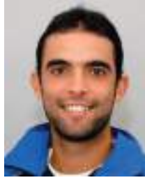
Juan Sebastián Cabal

Durante esta semana se juegan en México el WTA 250 de Zapopan y el ATP 500 de Acapulco, ambos con presencia de deportistas colombianos. En el primero estará en la segunda ronda Maria Camila Osorio, mientras que en las playas mexicanas harán presencia los doblistas, Juan Sebastián Cabal y Robert Farah.