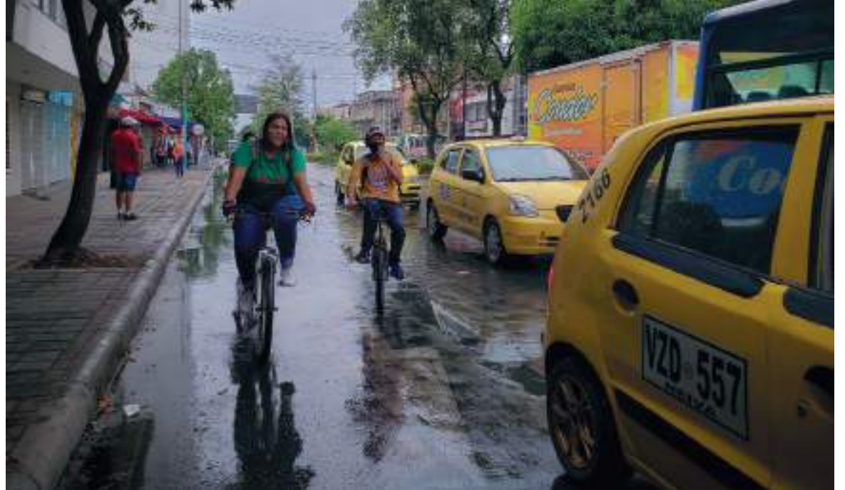
Ayer en Neiva se cumplió la primera jornada del día sin carro y moto. Según el Decreto 086 de 2022, esta primera jornada de uso de la bicicleta y no circulación de vehículos fue sancionatoria, pues quien no cumpliera la orden tendría sanciones económicas.

debido a qué amaneció lloviendo en la ciudad de Neiva y eso generó conmoción e incomodidad para muchas personas. Se realizaron 133 comparendos, 40 motos y 21 carros inmovilizados.