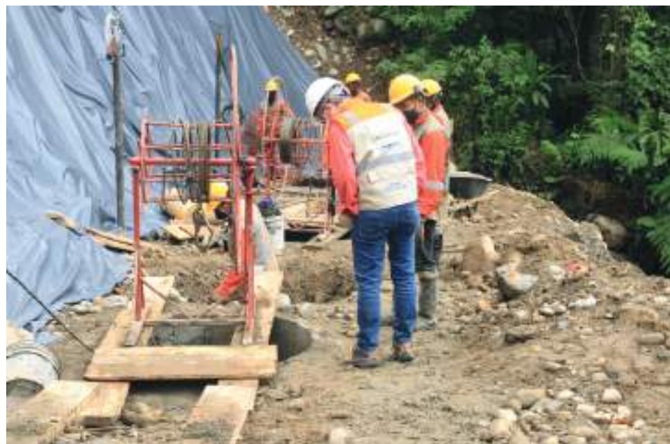
El presidente de la ANI visitó las obras de normalización que se desarrollan del megaproyecto vial Neiva-Santana-Mocoa.

Los otros proyectos viales tienen que ver la concesión Santana-Mocoa- Neiva, que comprende una parte de la ruta 45, que es la vía que bordea todo el río