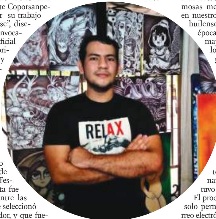
Este artista empezó su admiración y pasión desde muy niño dibujando a mano en cuadernos y poco a poco se dio cuenta del talento que tenía en esa área.

puesta, "la preservación de las tradiciones populares a pesar de las dificultades que dejó la pandemia."