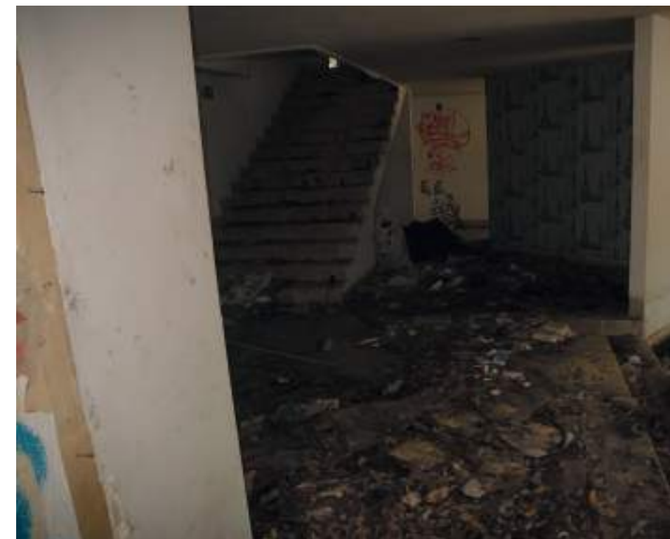
Zona de ingreso a la escalera que da acceso al segundo piso