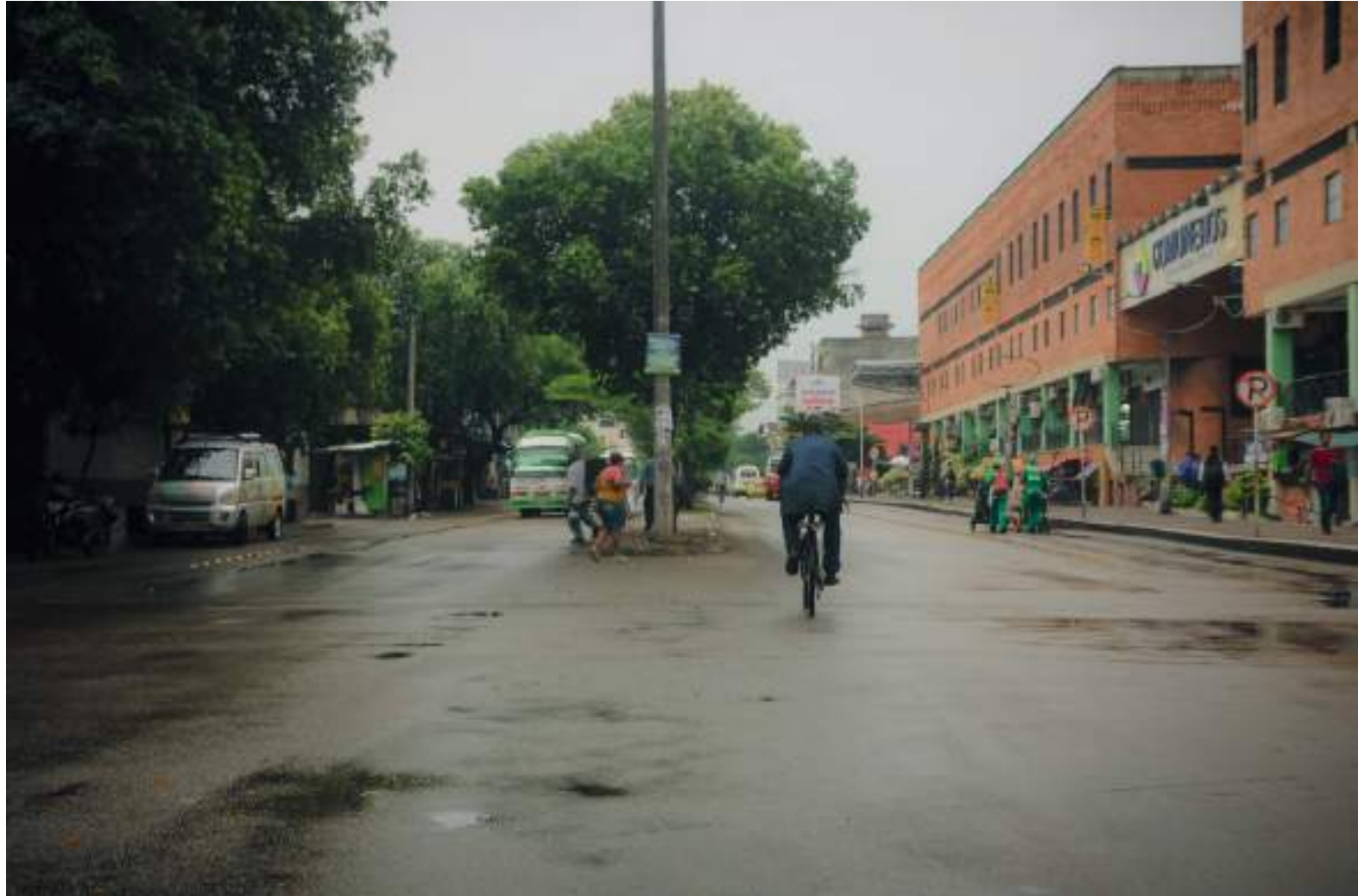
Así era el panorama durante la primera jornada del día sin carro y moto en la ciudad de Neiva

Esta primera jornada fue sancionatoria, por lo que quien incumplió la restricción, recibió una multa de hasta 15 salarios míni-