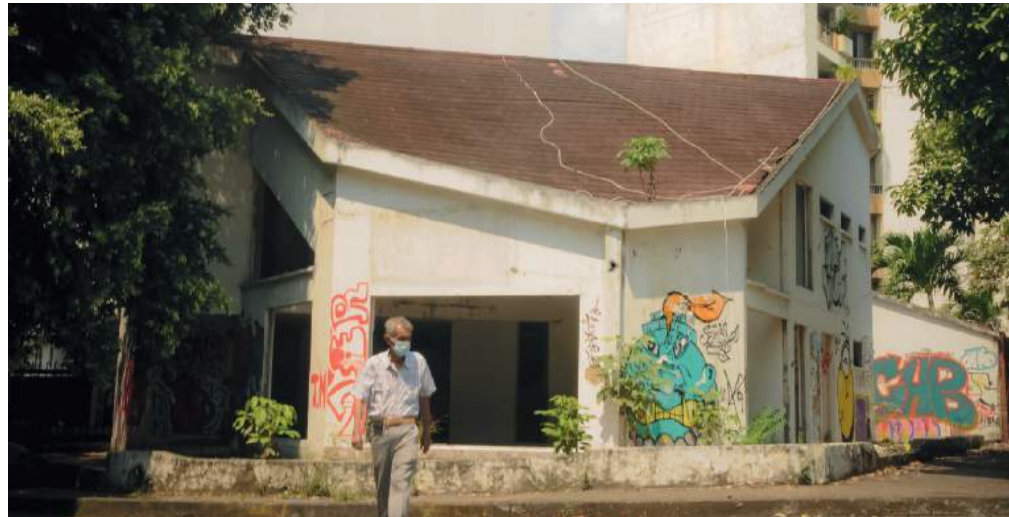
Vestigios de como se ha ido dismantelando la vivienda.