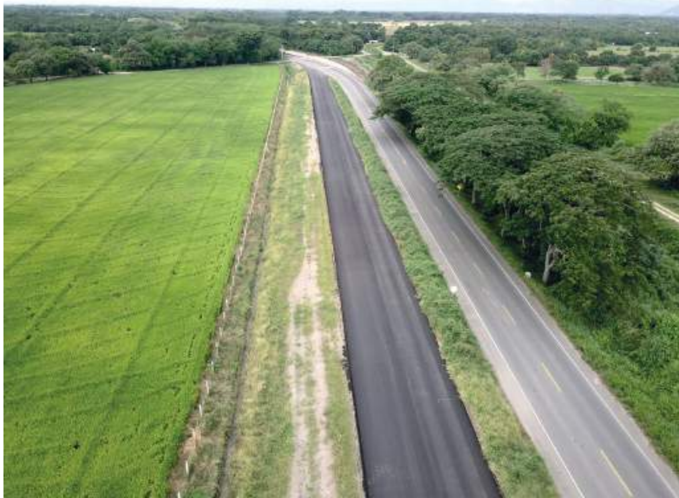
La vía Neiva-Espinal-Girardot, un proyecto de más de 1 billón de pesos, se finalizaría en marzo próximo.

El beneficio de este proyecto radica en que mejora y ahorra tiempo de desplazamiento, reduce la accidentalidad, y se mejoran las