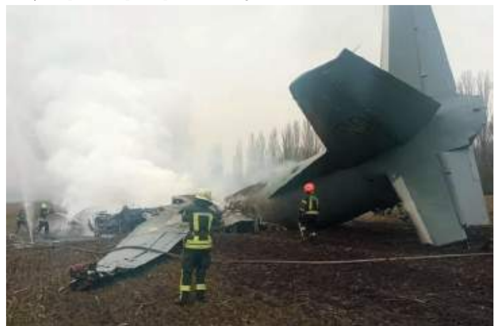
Equipos de rescate trabajan en el lugar donde se estrelló el avión Antonov de las Fuerzas Armadas ucranianas que, según el Servicio Estatal de Emergencias, fue derribado en la región de Kiev, Ucrania.