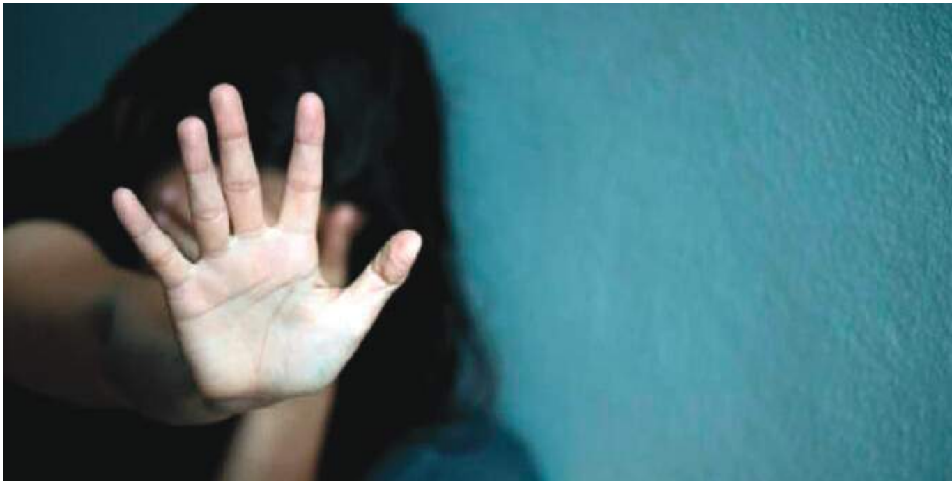
Los abusadores suelen ser mayormente familiares y personas cercanas al entorno del menor de edad.

El delito de acceso carnal abusivo con menor de 14 años, registró 129 casos en la vigencia 2021, teniendo una reducción del -17% en comparación al año 2020 en el cual se presentaron 155 casos en esta conducta delictiva. Y el acceso carnal violento con 35 casos en la vigencia 2021, teniendo una reducción del -8% en comparación al año inmediatamente 2020 donde se presentaron 43 casos.