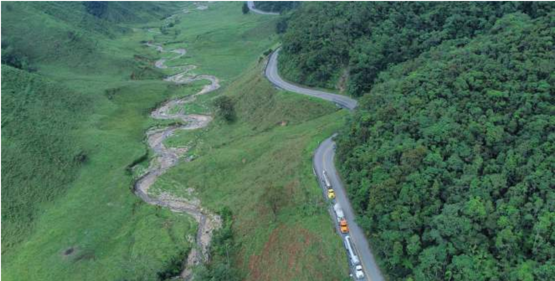
Esta será la nueva vía que comunique el centro del país con el Ecuador. El proyecto avanza en su etapa de normalización

Magdalena hasta Santa Marta. Son 456 kilómetros los que tiene este corredor, el cual estuvo muy deteriorado en los tramos entre Neiva y Pitalito, así como Pitalito-San Agustín, Pitalito-Mocoa, a causa del abandono por parte del concesionario anterior.