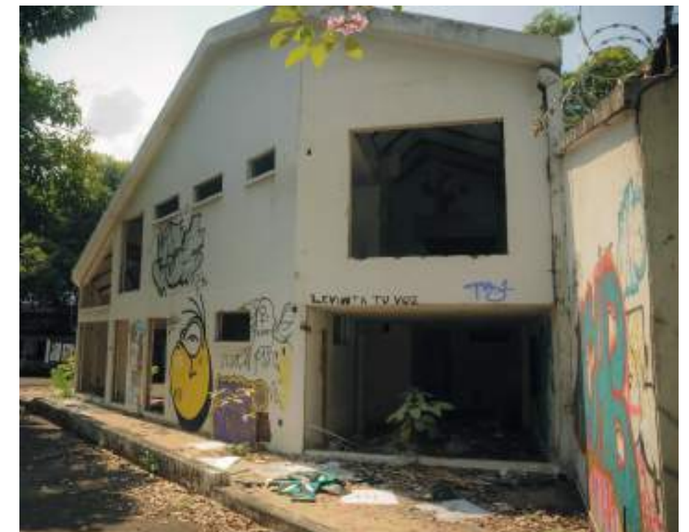
Fachada de la casa abandonada en la calle 11 con carrera 6 de Neiva.

que estuvo como el último inquilino, la casa estuvo sin arrendar cerca de dos años y fue cuando comenzaron a desvalijarla y nos tocó vivir este calvario”.