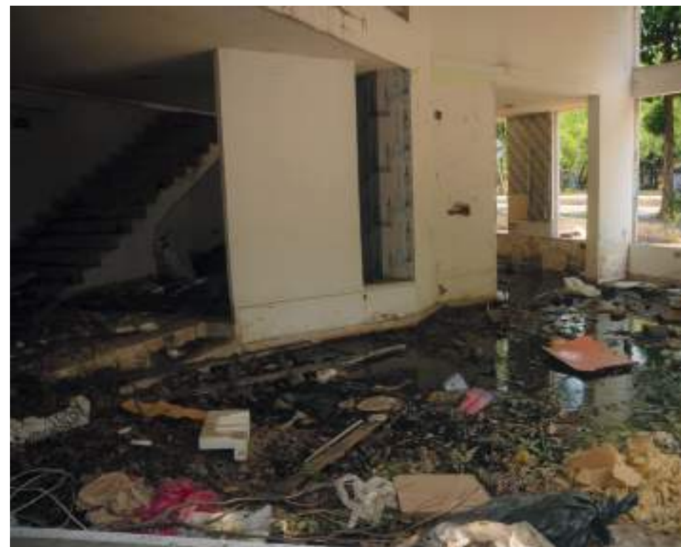
Los pisos lucen en mal estado con desechos y materiales de construcción.