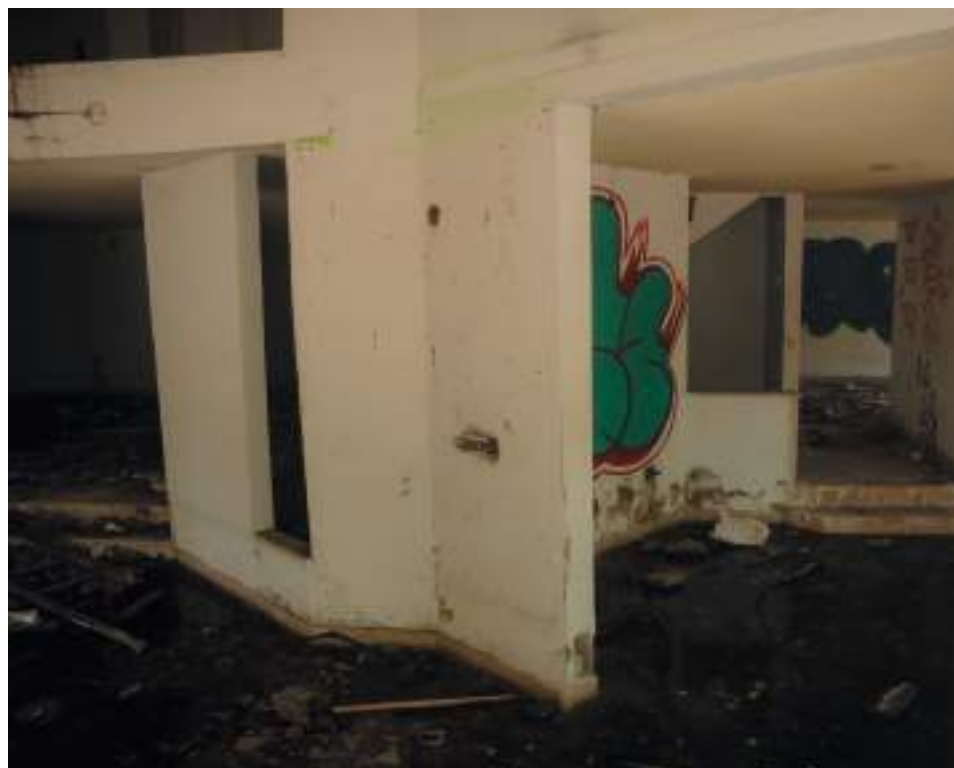
El mal aspecto del lugar es evidente a simple vista.