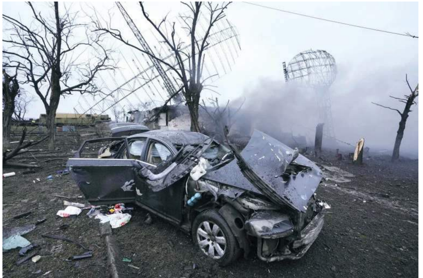
Un radar, un vehículo y equipo dañados se ven en una instalación militar ucraniana en las afueras de Mariupol, Ucrania.

El presidente de Estados Unidos, Joe Biden, anunció una nueva ronda de sanciones económicas que incluirán el congelamiento de activos de bancos y capitales de inversionistas: "La agresión de