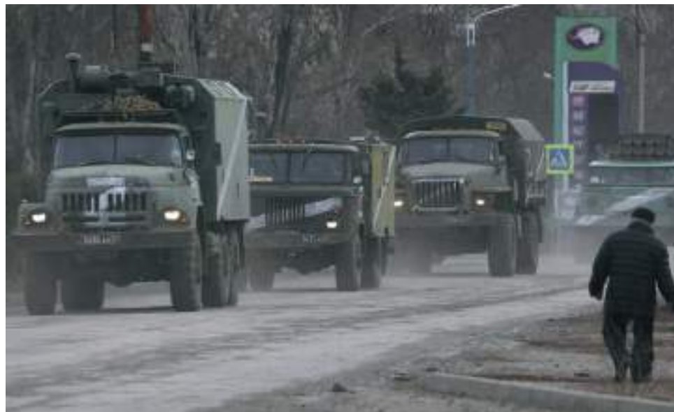
Vehículos militares rusos pasan por una calle después de que el presidente Vladimir Putin autorizó una operación militar en el este de Ucrania, en la localidad de Armyansk, Crimea.

Putin justificó su decisión por una supuesta petición de los líderes separatistas de las regiones rebeldes de Donetsk y Luhansk el miércoles al Kremlin para que enviara tropas rusas a sus territorios.