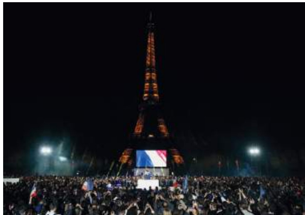
Macron festejó frente a la Torre Eiffel.

“A partir de ahora, ya no soy el candidato de un grupo, sino el presidente de todos”, agregó durante el discurso de su victoria a los pies de la torre Eiffel en París, donde prometió además un “método renovado” para dirigir el país tras un primer mandato marcado por las protestas.