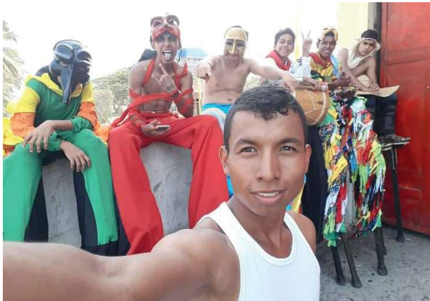
No se conocen hasta el momento los móviles del crimen. La víctima nunca fue atendida por una ambulancia.

Así pues, también resaltó que esta fue una noticia muy inesperada para todo el mundo, puesto que se trataba de un muchacho muy humilde, responsable, talentoso, respetuoso.