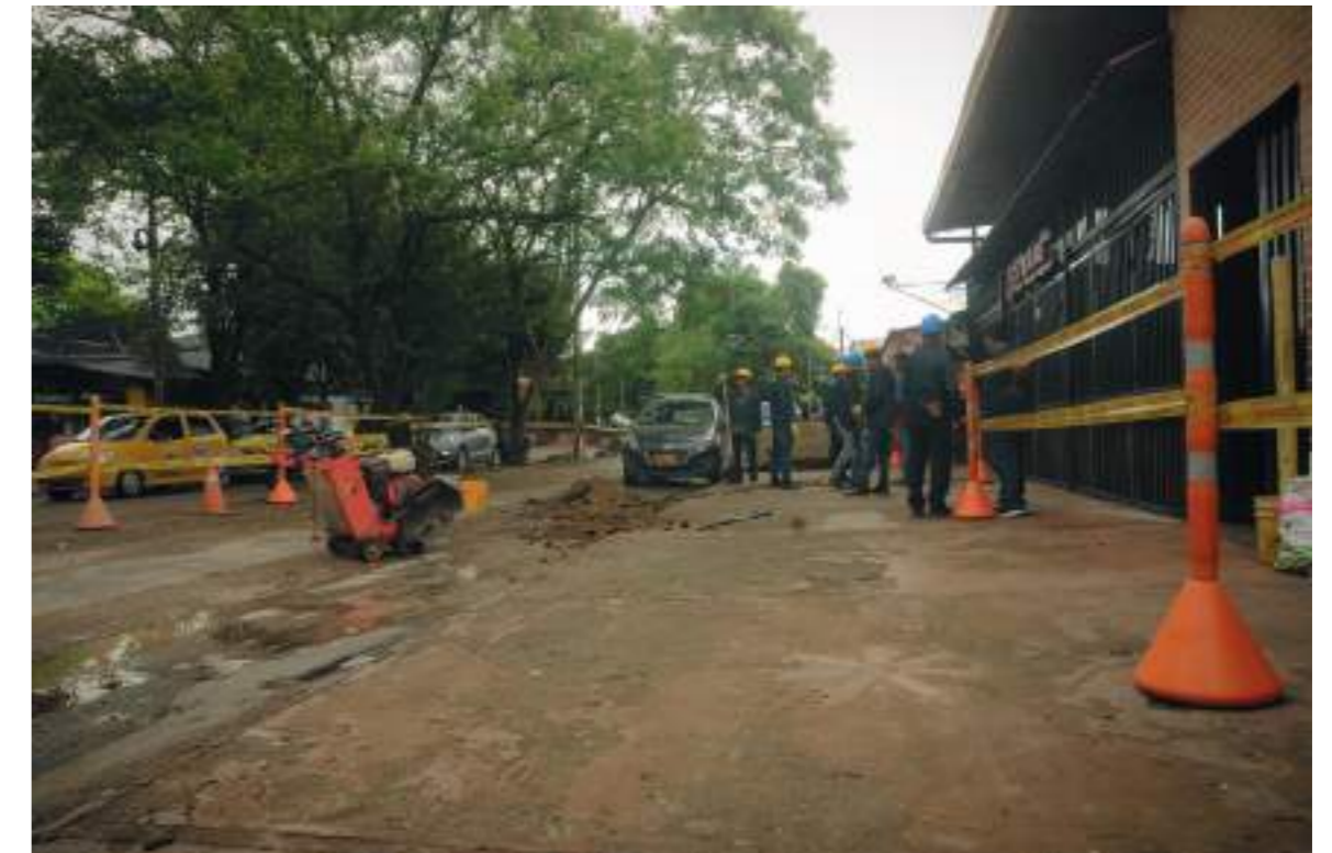
Las cuadrillas de trabajadores se centran en sus labores.