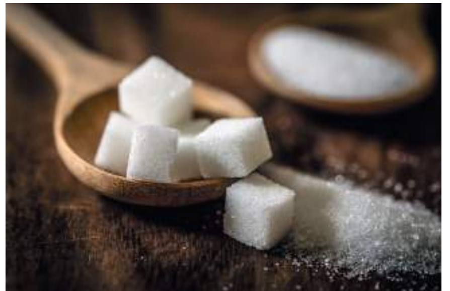
El 31.5% de los colombianos que consumen bebidas azucaradas las toman dos o tres veces a la semana y el 26.7% por lo menos una vez a la semana.

En mayo de 2021 la Organización Panamericana de la Salud publicó un informe en el que señala que el uso eficaz de impuestos podría reducir en gran medida el consumo de bebidas azucaradas. “Un aumento