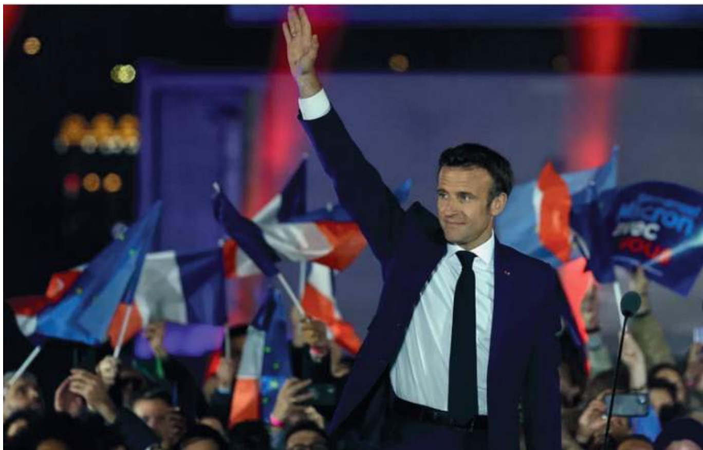
El presidente francés Emmanuel Macron saluda en el escenario tras ser reelegido como presidente.

El líder de la izquierda radical en Francia, Jean-Luc Mélenchon, tachó al ganador hoy de ser