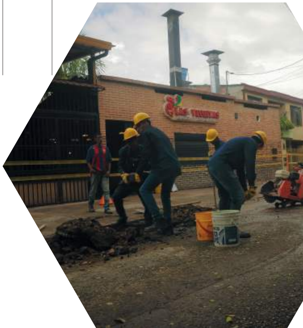
Aspectos de los trabajos en la calle 7 entre carreras 11 y 13 en la Comuna cuatro.

El frente que está activo es el de la calle 7 entre carreras 11 y 13 en un corto tramo de apenas una cuadra, en la que funcionan establecimientos comerciales, un instituto de capacitación y la sede de una IPS.