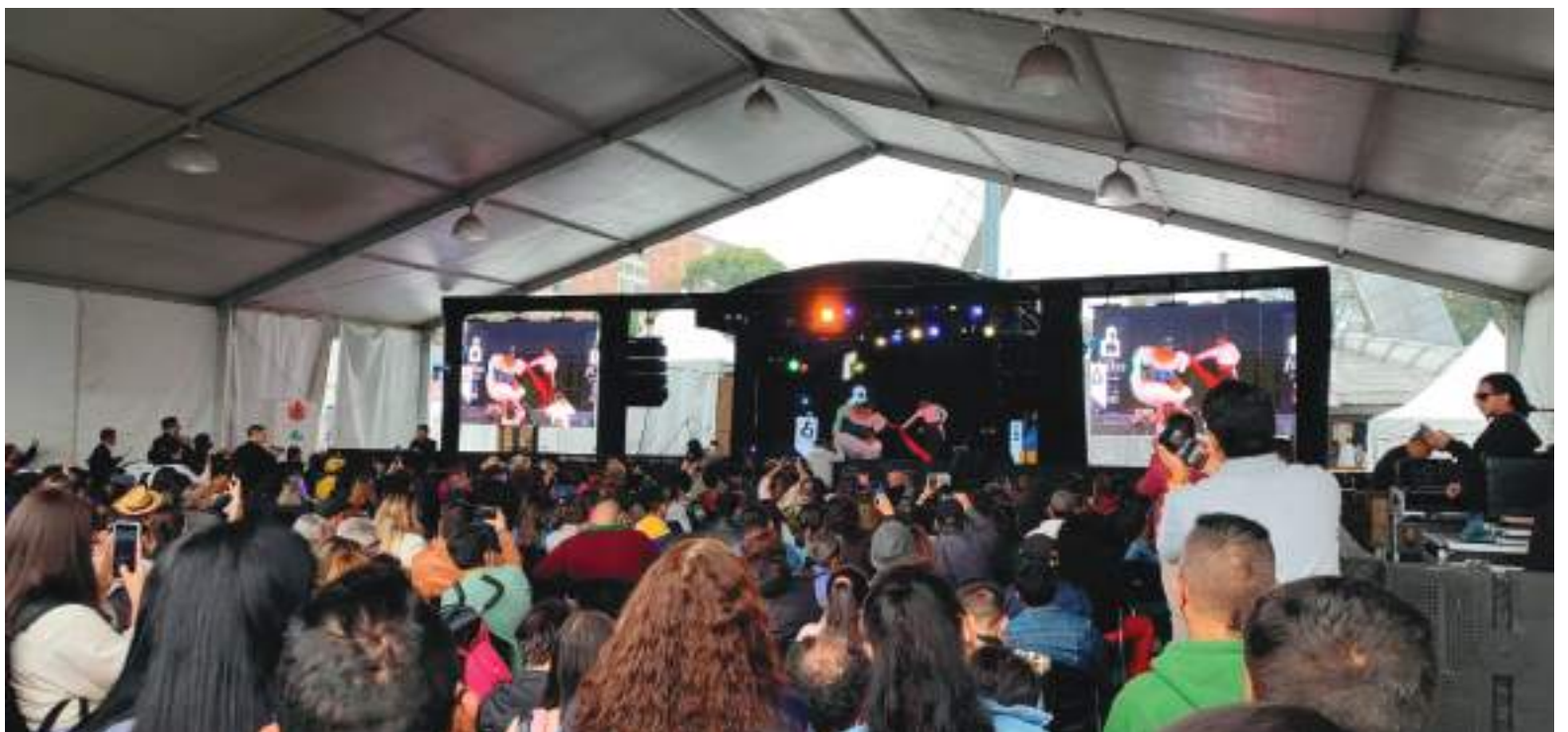
También toda una delegación de artistas promocionaron el Festival del bambuco en San Juan y San Pedro, en la carpa cultural de Corferias.

“tenemos más de 70 títulos propios en vitrina, esperando ser leídos por los visitantes, hace 32 años que el Huila inició su participación con 14, hoy de manera significativa hemos crecido bibliográficamente entre poesía, investigación y demás géneros”