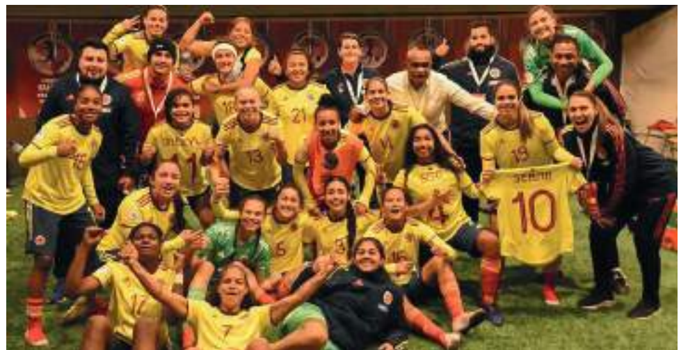
Las colombianas con todo el grupo de trabajo de cara al Mundial.

El sorteo de los grupos de la Copa Mundo de Costa Rica será en el mes de mayo y el torneo irá del 10 al 28 de agosto del presente año.