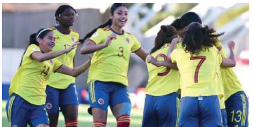
Las celebraciones no paran entre el grupo de jóvenes mujeres por lo logrado.

Colombia sub 20 clasificó al mundial femenino de Costa Rica con una contundente goleada 3 a 0 ante Uruguay que llegaba con las mismas pretensiones de las colombianas.