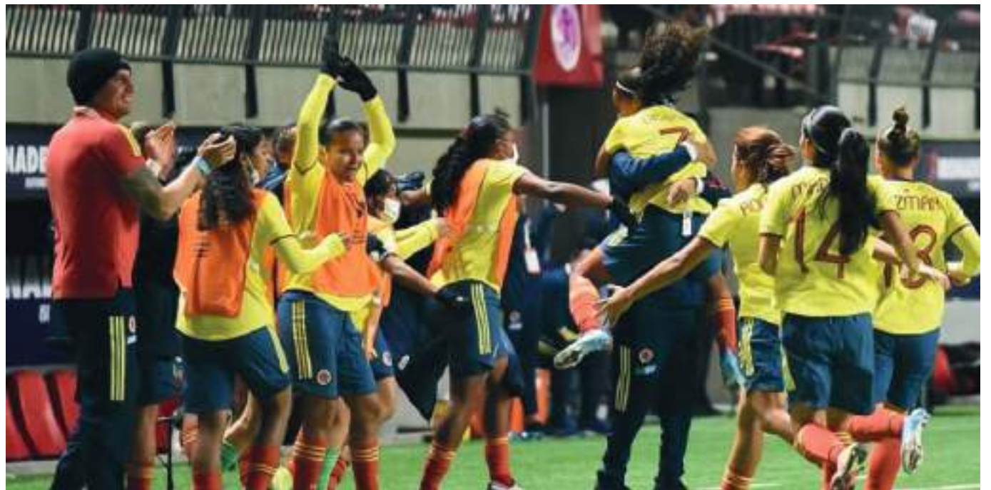
Las jugadoras colombianas celebran su clasificación al Mundial sub 20 de Costa Rica.

El segundo tiempo fue de control, con un par de aproximaciones de Uruguay, pero en términos generales sin asustar a la defensa