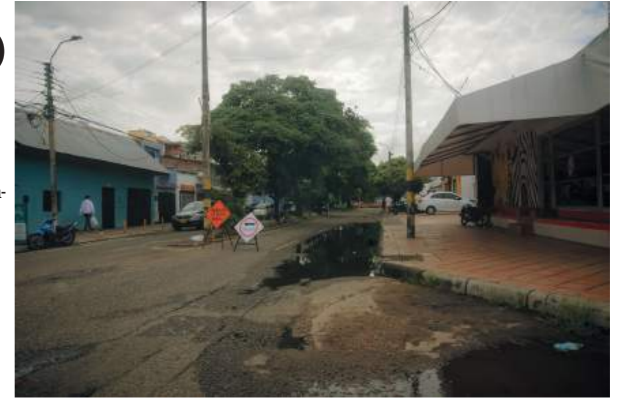
Señalización en la carrera 11 previo a las obras.