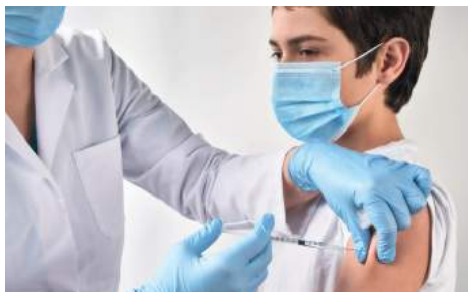
Estas jornadas se adelantarán en el marco de la Semana de la Vacunación de las Américas.

Aunque el propósito principal se mantiene en completar algunos esquemas, la inmunización también incluye contrarrestar enfermedades específicas como: la poliomielitis, tuberculosis, hepatitis A y B, difteria, tétanos, tos ferina, varicela, fiebre amarilla y por supuesto COVID.