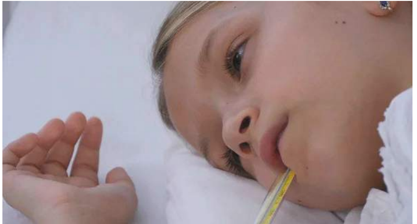
Las autoridades sanitarias de la Unión Europea y de Estados Unidos están investigando el origen de estos casos, desconocido hasta ahora.

Se ha reportado casos en Estados Unidos, Dinamarca, Irlanda, Francia, Noruega, Rumanía, Bélgica, Italia, entre otros. Según dijo Pebody a Stat, los niños afectados tienen edades comprendidas entre 1 mes y 16 años, pero la mayoría son menores de 10 años. El funcionario confirmó al menos