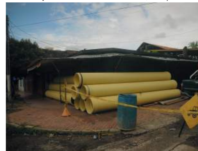
Los trabajos se espera sean entregados dentro de lo concertado.

"Es muy complicado lograr que la gente participe de esas veedurías, no se sabe si por negligencia o por temor a verse inmersos en investigaciones, que creen ellos los van a involucrar, cuando no es así. De tal manera que la administración otorga los contratos y hace su propia veeduría, pero los directamente responsables de recibir a satisfacción es la comunidad", concluye.