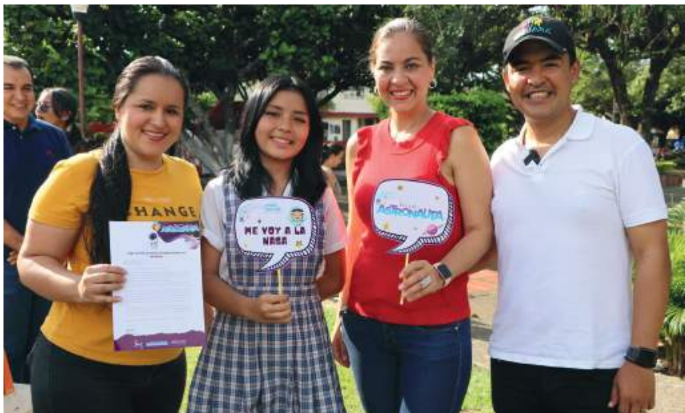
Sus familiares se encuentran muy orgullosos de ella y le dieron a conocer la noticia de su elección mediante una muy especial reunión que realizaron en Yaguará.