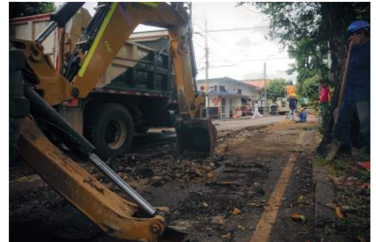
Maquinaria pesada es utilizada para agilizar los trabajos.

Insistió como ASOJUNTAS a que la comunidad se preste a hacer las veedurías, porque después vienen los reclamos y las insatisfacciones, pero resulta que la comunidad no toma parte de las veedurías.