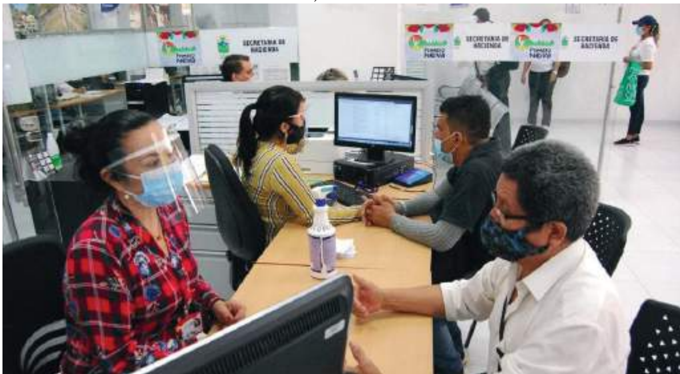
El secretario de Hacienda de Neiva en la “cuerda floja” por no cumplir, según 10 de los concejales, con las funciones de su cargo.

Así mismo, incoherencia en las preguntas relacionadas con el proceso de la Secretaría (presupuesto, contabilidad, rentas y tesorería), la poca concordancia en la información que tiene la página web de la Secretaría frente a lo evidenciado en la página de CHIP (Consolidador de Hacienda e Información Pública) de la Contaduría General de la Nación y la plataforma del CIA OBSERVA y el desconocimiento e inaplicabilidad del artículo 73 y 74 del Decreto Nacional 111 del 15/01/1996 del programa anual mensualizado del caja, PAC.