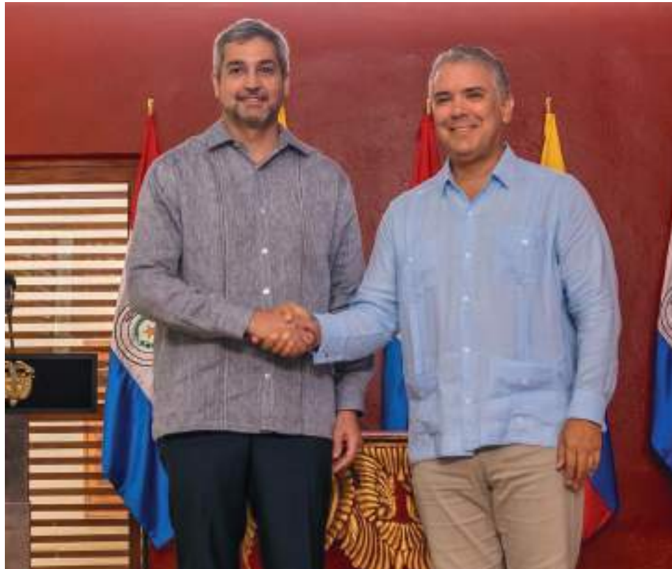
En la Casa del Marqués de Valdehoyos en Cartagena, Iván Duque y su esposa María Juliana recibieron al Presidente de Paraguay, Marito Abdo. Estrecharon vínculos de cooperación y comercio, y suscribieron acuerdos para beneficio de ambos pueblos.

"Se estará constituyendo la figura del gabinete binacional para hacer una coordinación de políticas públicas en muchísimos frentes. Quiero reiterar el apoyo de Colombia a Paraguay en la lucha contra el crimen organizado y contra el terrorismo, estaremos apoyando con todos nuestros equipos de inteligencia, contrainteligencia y nuestras escuelas de formación para que el Paraguay logre extinguir el mal llamado Ejército Paraguayo del Pueblo, que ha sido un grupo terrorista, que ha sembrado muchísimo daño", expresó el presidente Duque.