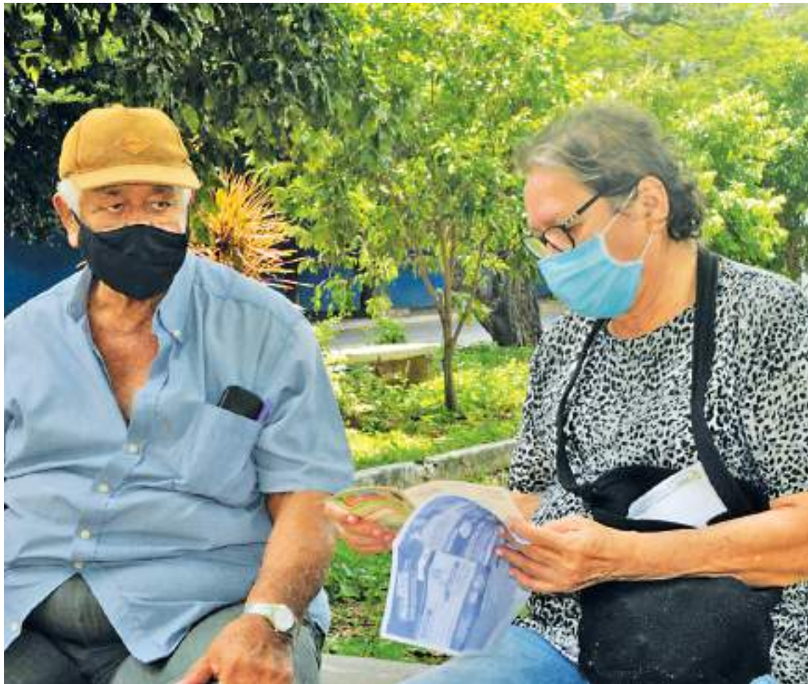
Zonas verdes y espacios abiertos están libres del uso de tapabocas.

El ministro de Salud y Protección Social, Fernando Ruiz Gó-