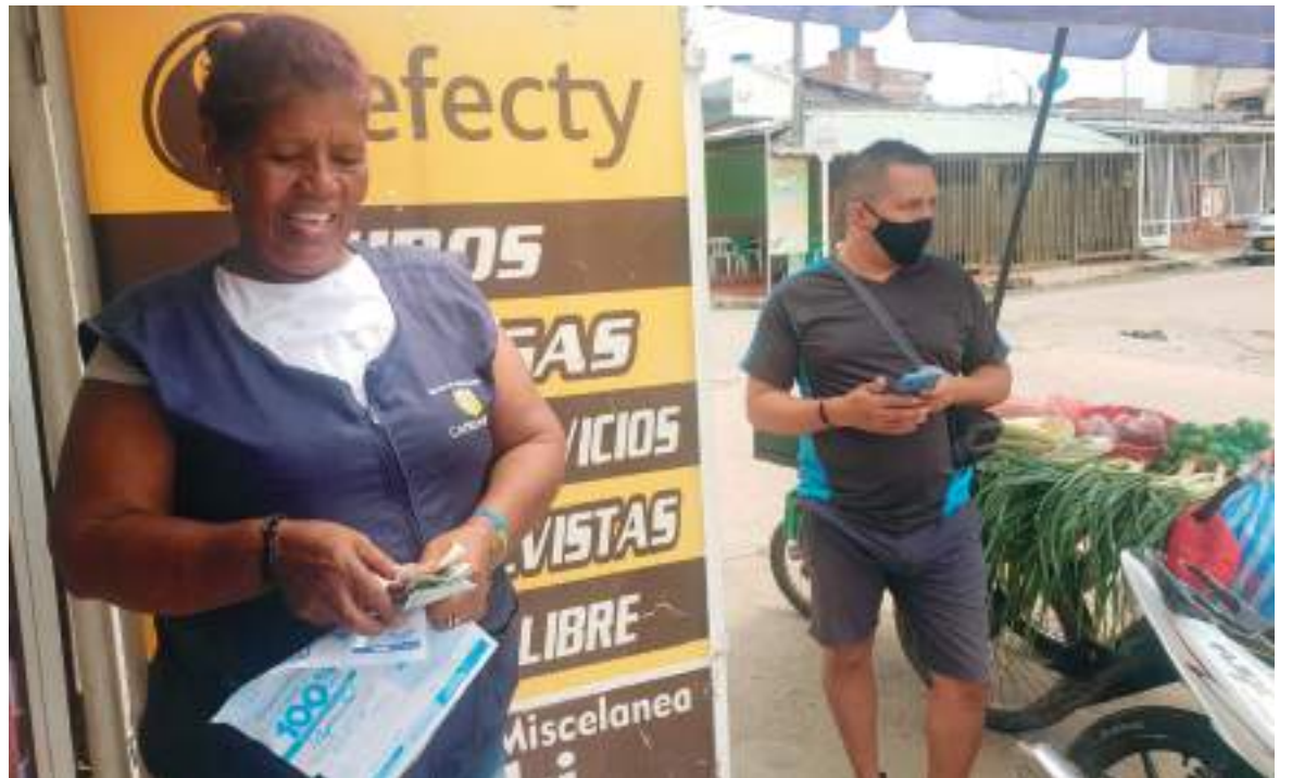
Poco a poco los neivanos se acostumbran y adaptan a la medida.

“La persona debe ir con su tapabocas en el bolsillo, si está en un espacio abierto y ve una aglomeración de personas, colocarse de nuevo el tapabocas porque sigue habiendo transmisión del virus”, agregó Hernández.