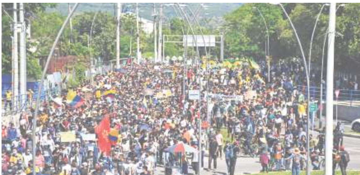
Tras convocarse esta semana una nueva movilización en contra de la carestía de alimentos, servicios públicos, Soat y gasolina en el país, ahora se suspende y se aplaza la jornada porque no hay garantías.