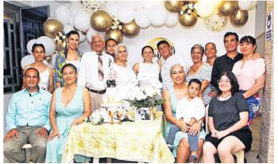
Los esposos con su familia.