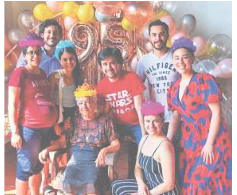
Los nietos y bisnietos son parte fundamental en su vida.