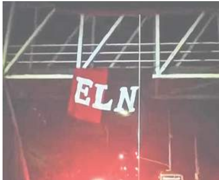
La bandera fue ubicada en la parte alta del puente peatonal y, por ello, de inmediato aislaron el lugar y procedieron a inspeccionar completamente.