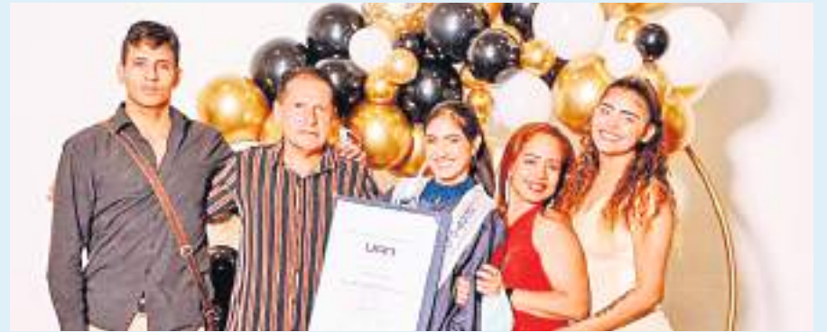
Su familia la felicita por este gran logro y le desean éxitos en su vida profesional.