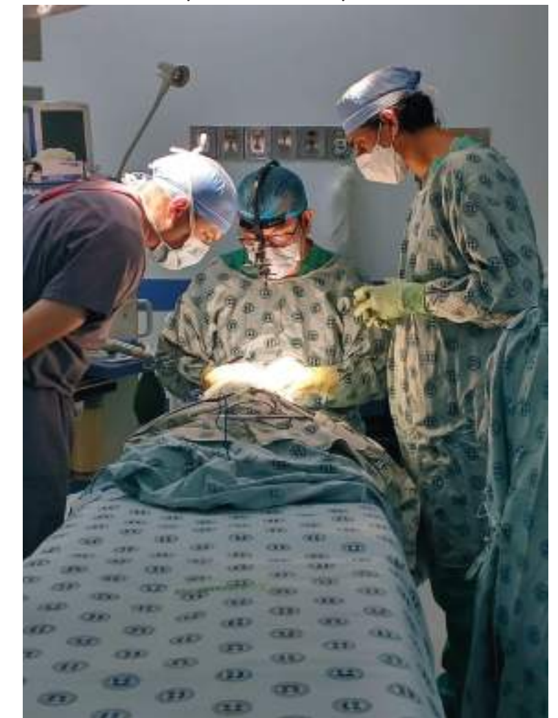
La falta de donantes, impide la realización de trasplantes. En el Huila, 150 personas esperan por la donación de un riñón que les permita tener una oportunidad de vida.

Recordó que estos procesos se asocian con enfermedades crónicas como la hipertensión y la diabetes y que terminan en falla renal. Lo más preocupante, indica, es que esta cifra puede estar aumentando ostensiblemente porque las enfermedades cardiovasculares cada día se incrementan en casos. Esto, indica, sumado a la debilidad de los programas de promoción y prevención en el país, conlleva a que día tras día se tengan más pacientes con falla renal y en hemodiálisis.