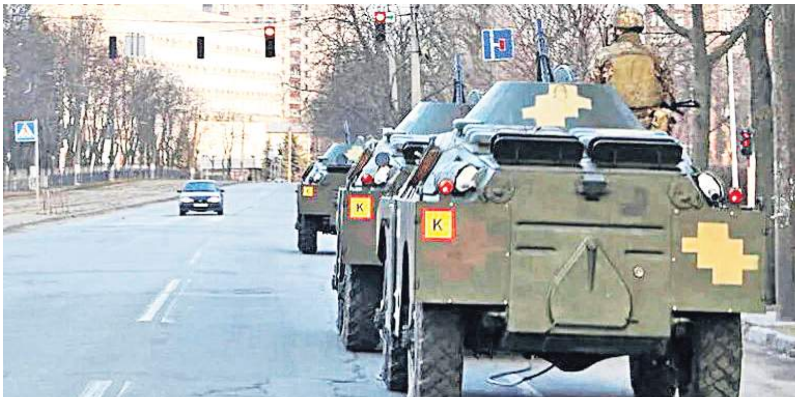
Un miembro del servicio ucraniano es visto encima de un transporte personal blindado en Kiev, Ucrania.

Wang Yi expuso la posición básica de China sobre el tema de Ucrania: "China aboga firmemente por respetar y salvaguardar la soberanía y la integridad