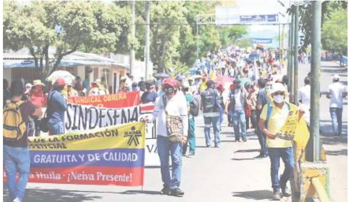
Debido a faltas de garantías para las movilizaciones en las calles, decidieron suspenderla y aplazarla.

La Central Unitaria de Trabajadores – CUT - y el Comando Nacional Del Paro, anunciaron la convocatoria de una nueva jornada nacional de movilización y protesta, para el 3 de marzo de 2022, en el país. Dentro de este panorama, otro motivo de estas movilizaciones es la carestía de precios después que la inflación interanual llegará al 6,94 %, según el Departamento Administrativo Nacional de Es-