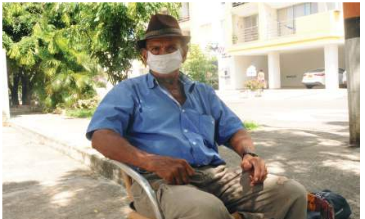
Lo de cuidarnos es cuestión de cada quien.