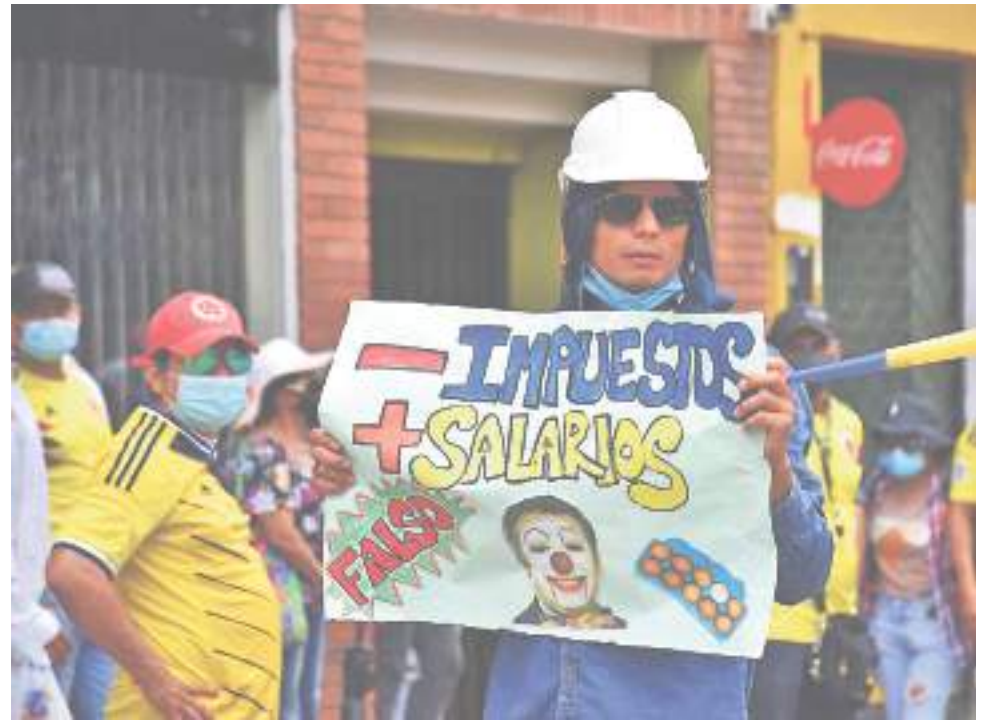
El Comité seguirá expresando su inconformismo con estos asuntos, enfatizando en el alto costo de vida e imposibilidad de muchos colombianos de acceder a los productos de la canasta básica familiar.