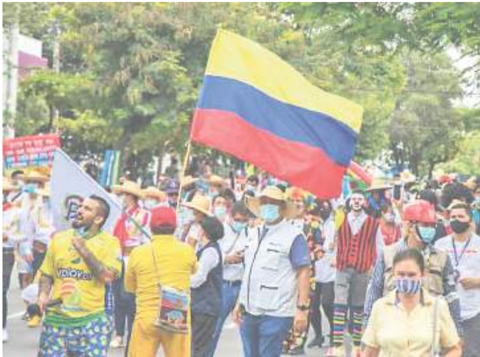
El Comité invitó a los ciudadanos a votar en las elecciones del próximo 13 de marzo como alternativa de participación.