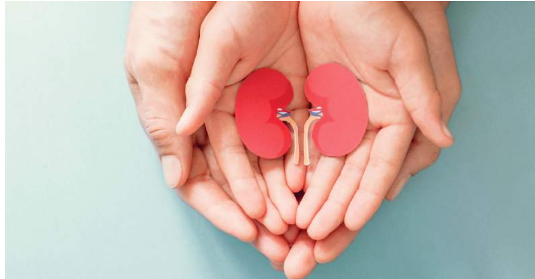
En el Día Mundial del Trasplante de Órganos, es la fecha propicia para tomar conciencia de la importancia de esta práctica por el bien común.

Por eso, el trabajo de las regionales en el país, ahora se enfoca en retomar esa confianza y motivar e incentivar a la población para que permita la oportunidad de la donación y trasplante de órganos. Esta tarea ya se inició en este 2022, a través de campañas educativas y de promoción de la donación. Este domingo, 27 de febrero se celebra el Día Mundial del Trasplante de Órganos, fecha propicia en la que la Unidad llevará a cabo en las instalaciones del Hospital Universitario una actividad de información y carnetización de la comunidad que quiera conocer,