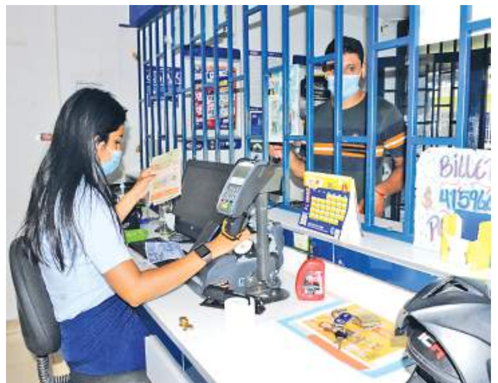
Lugares de atención al público mantienen la medida de uso de tapabocas.