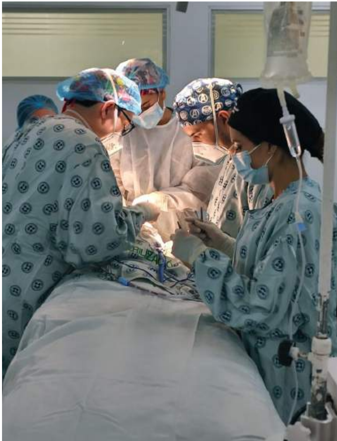
La Ley 1805 que entró en vigencia en el 2016, es una alternativa que puede aumentar el número de donantes para trasplantar en la Unidad Renal. Pero la donación voluntaria es un verdadero gesto consciente de humanidad.

» El trabajo de las regionales en el país, ahora se enfoca en retomar esa confianza y motivar e incentivar a la población para que permita la oportunidad de la donación y trasplante de órganos. «