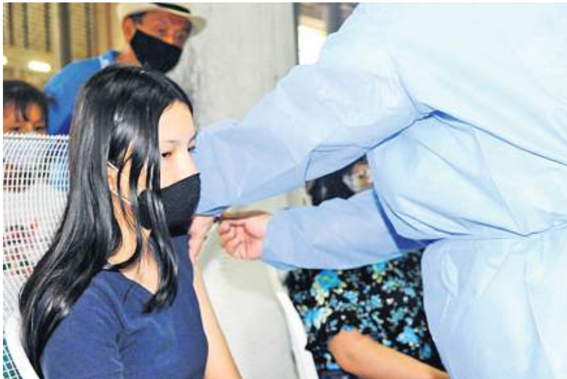
La llegada de ómicron a Colombia presentó un nuevo reto para las autoridades que debieron implementar nuevas medidas de prevención para evitar la propagación del virus.

pabocas en la calle, estadios y en general todos los espacios abiertos donde haya ventilación directa de aire. Sí hay necesidad en los espacios cerrados, lo que quiere decir que debemos andar con el tapabocas en el bolso o bolsillo para que cuando entremos