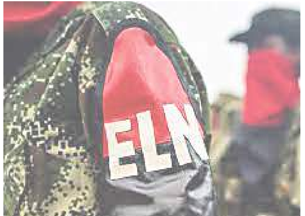
Los hombres colgaron el elemento con las letras alusivas al grupo subversivo, generando pánico y zozobra entre los habitantes.