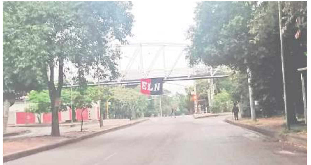
Esta situación que generó caos vehicular en la capital del Huila ha generado todo tipo de comentarios.

control de antiguos corredores de las Farc en el norte del departamento. Se trata de una comisión, que inteligencia militar ha identificado como "Estructura Centro Sur", bajo la dirección del Frente de Guerra Oriental del grupo que delinque en Arauca.