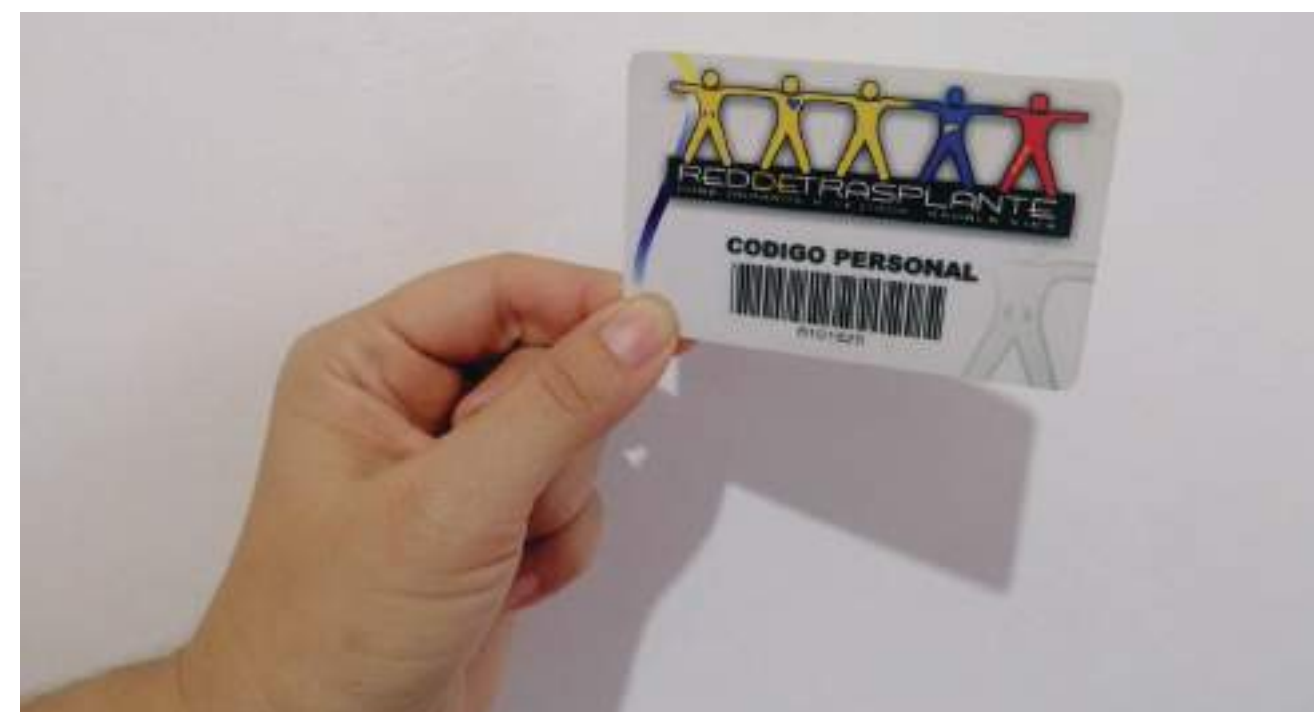
Donar un órgano es un acto de grandeza y de comprensión humana.

El trasplante es lo mejor que le puede pasar a un paciente renal, es posibilidad de recuperar su vida en muchos aspectos. En el Huila, actualmente más de 3 mil personas reciben tratamiento de hemodiálisis por falla renal, y otras 150 están en lista de espera de recibir un riñón. La pandemia disminuyó el número de trasplantes y de donantes, por lo que en el Día Mundial del Trasplante de Órganos, se busca tomar conciencia de la importancia de esta práctica por el bien común.