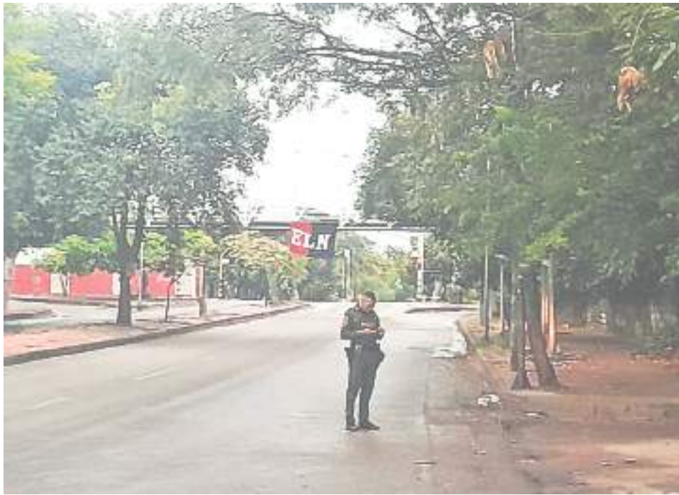
En la mañana del viernes 25 de febrero del presente año, los transeúntes de Neiva se percataron que en la zona de la Calle 21 con Carrera 2 de la ciudad de Neiva se encontraba una presenta bandera del “El Ejército de Liberación Nacional - ELN”.