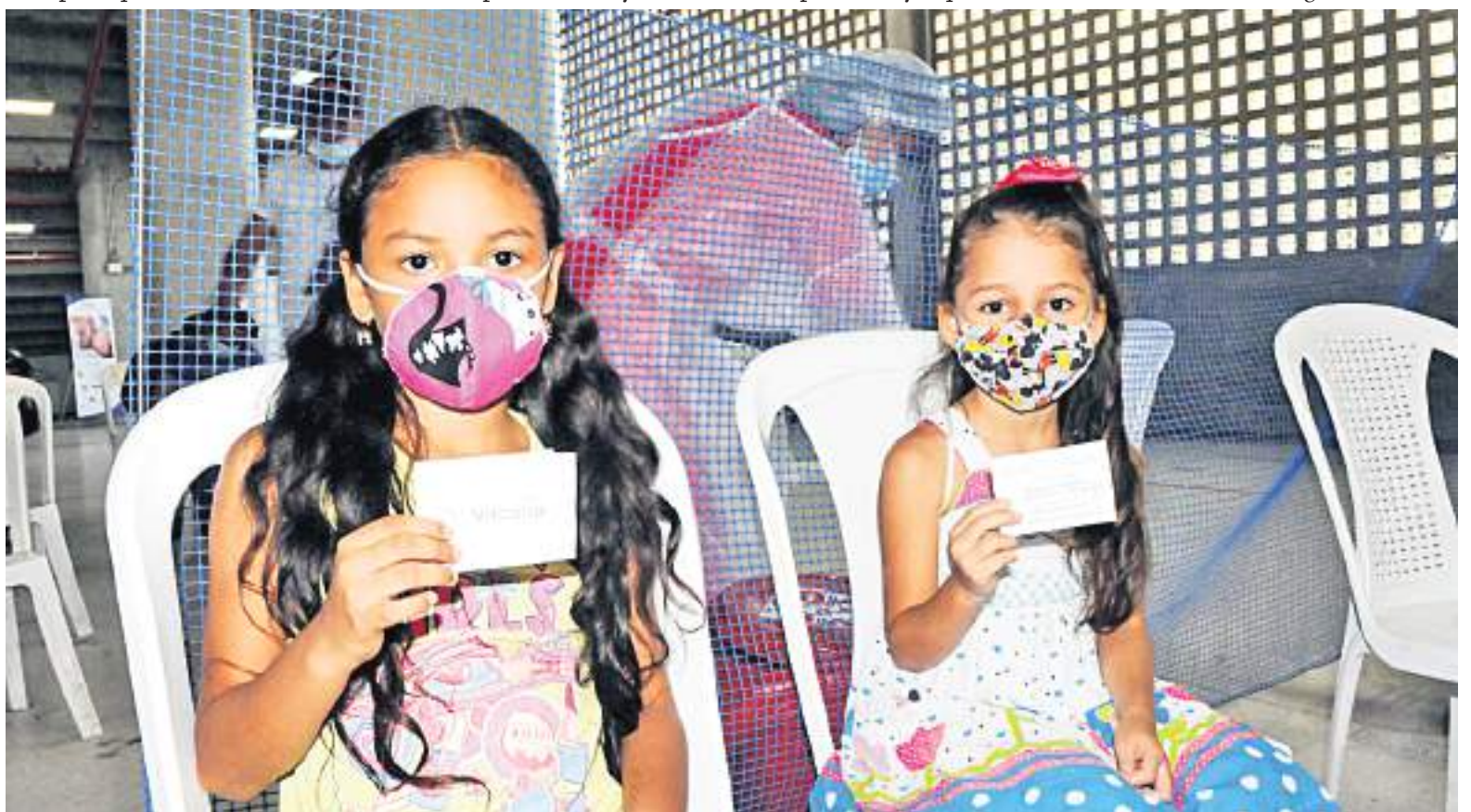
El ministro Fernando Ruiz aseguró que para garantizar el control y cumplimiento de la medida, confiará en la disciplina ciudadana.

Sobre la posibilidad de eliminar de manera definitiva el uso del tapabocas, el ministro Fernando Ruiz afirmó que, “tendríamos que tener un escenario epidemiológico donde tengamos claramente una consolidación hacia lo que llamamos una endemia, es decir, que haya una situación en la covid-19 continúe y tengamos picos, pero que probablemente esos picos sean de menor intensidad y que de alguna manera el efecto severo no sea tan grande”.