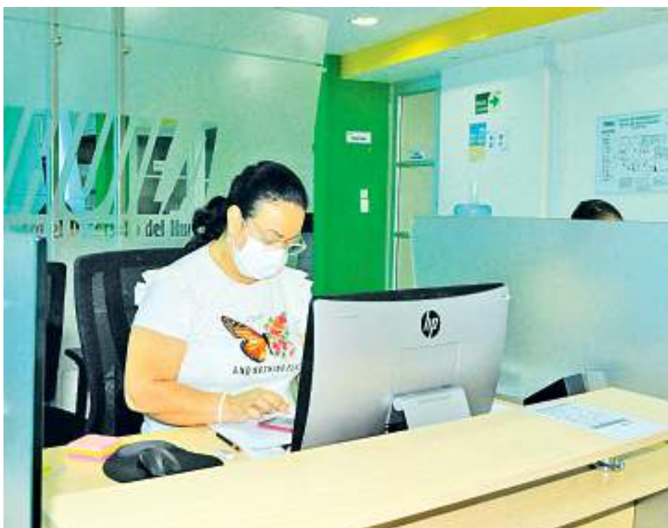
Lugares como las oficinas se mantienen con uso de tapabocas.

“No debemos bajar la guardia contra el COVID, ojalá esta medida de no uso de tapabocas en espacios abiertos no se convierta en dejar de utilizarlo en todos los lugares, muchos por ejemplo con-