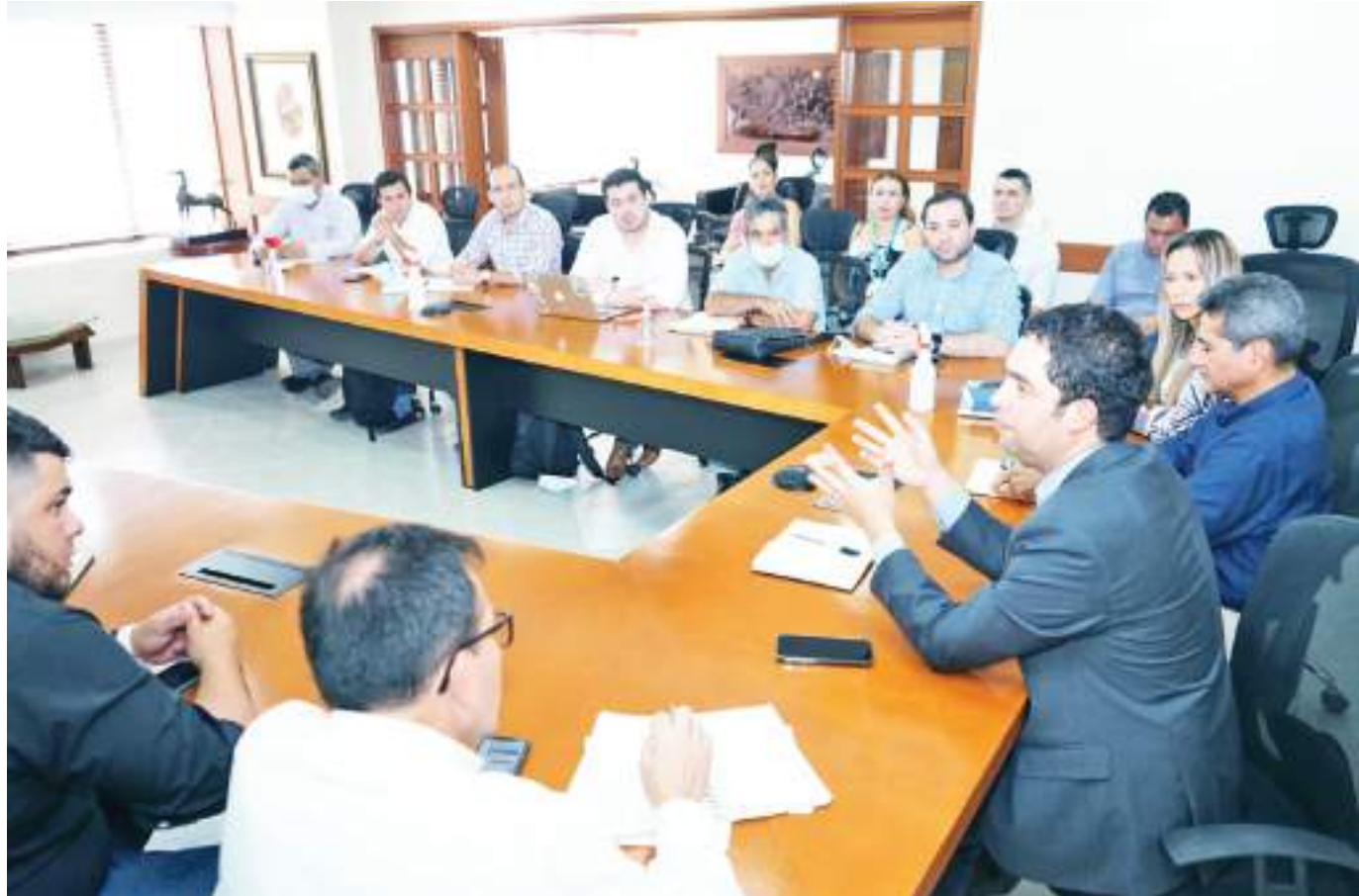
En medio de una reunión con distintos actores del sector productivo del Huila, el viceministro de Comercio Exterior habló sobre las proyecciones del departamento.

El café representa en el Departamento del Huila el 95% de las exportaciones, según datos del