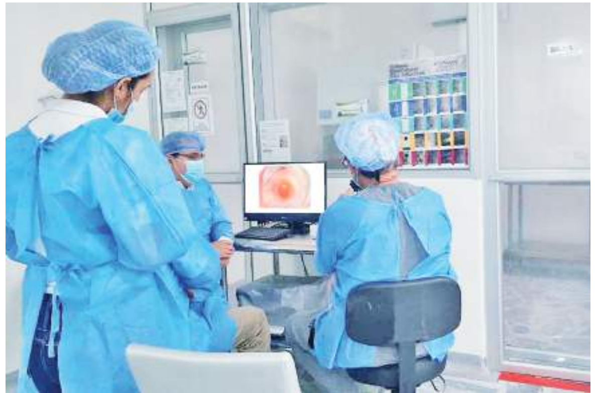
Bantejido es una corporación 100% huilense sin ánimo que busca básicamente satisfacer la demanda de los tejidos con fines ópticos en el sur del país.

Además, este que es el primer banco de tejidos del sur de Colombia en la Regional 6, apoya a los