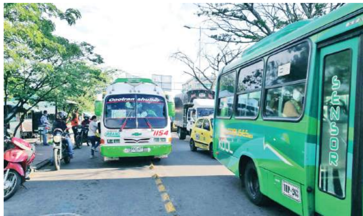
Ahora los colectivos dejan los pasajeros en la avenida principal, no entran al barrio.

Los barrios afectados por la falta de servicio frecuente y cercano de transporte colectivo como Calamarí, Campos de Venecia y la Vorágine, pertenecen a la Comuna Noroccidental o Uno de la ciudad de Neiva.