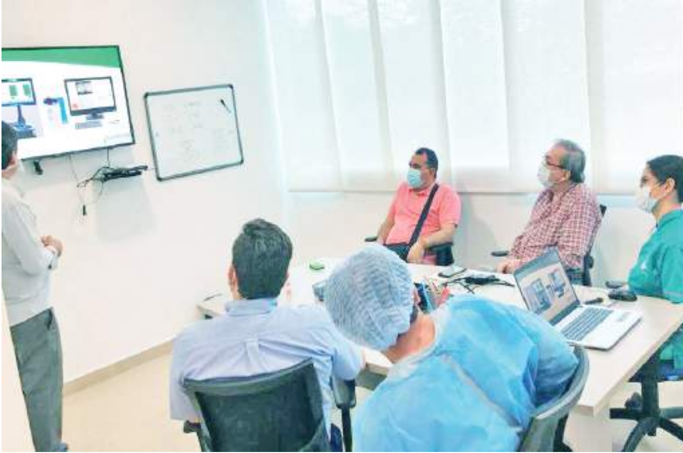
Hay que recordar que 1 donante puede salvar 8 personas y mejorar la calidad de vida de 75 personas, según la OMS.