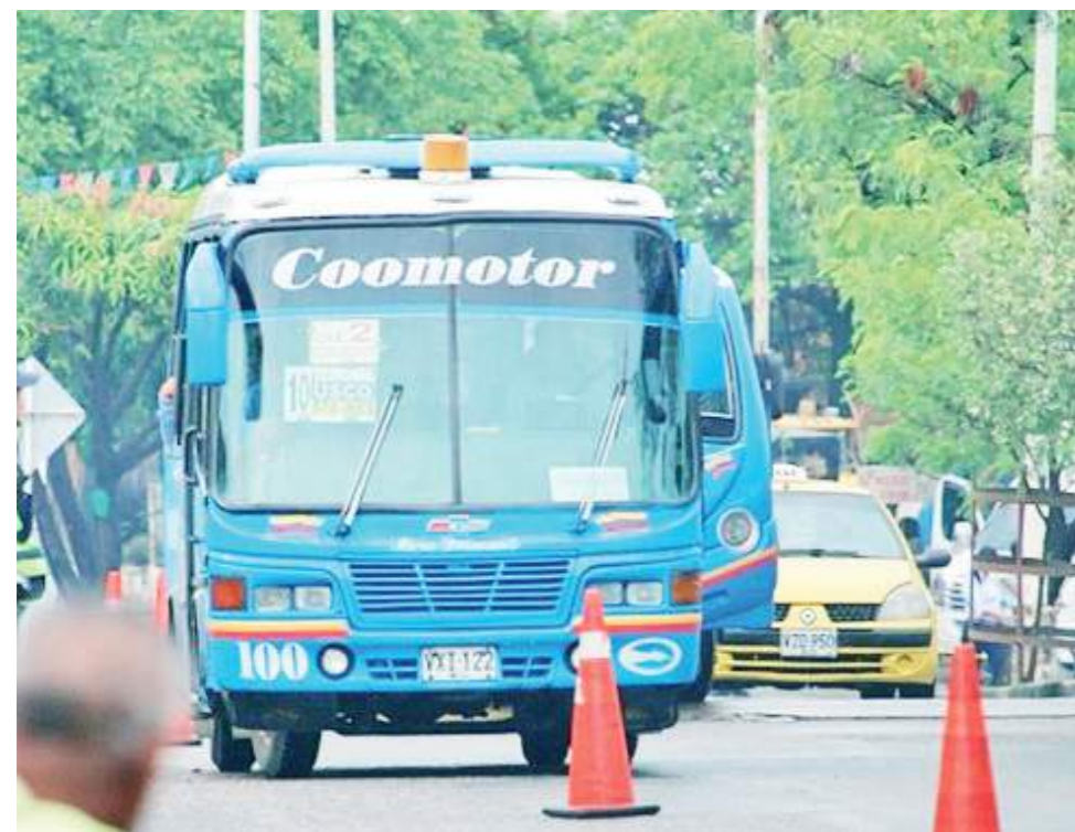
Poco a poco se han ido disminuyendo las frecuencias y rutas en la comuna