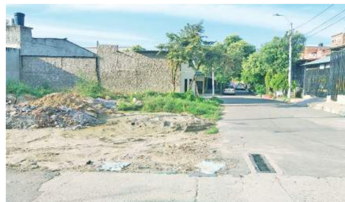
Al ingreso del barrio Calamarí se encuentran lotes baldíos que se prestan para la inseguridad.