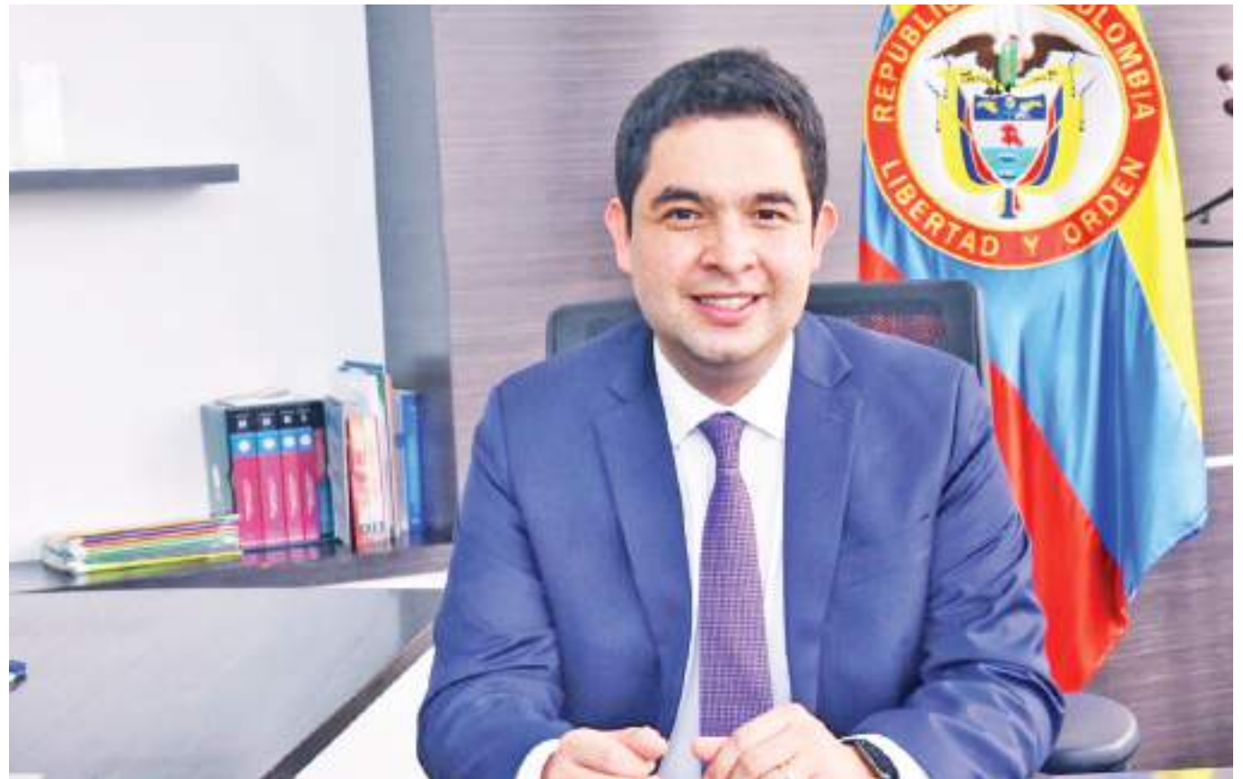
El viceministro de Comercio Exterior Andrés Cárdenas, se comprometió a dejar adelantadas acciones del documento CONPES con el fin de garantizar la continuidad del mismo.

“A nivel de departamento el año pasado se exportaron 750 millones de dólares de los cuales cerca de 700 millones de dólares son exportaciones no minero energéticas y en este primer trimestre del año se rompió un récord de mayores exportaciones de los últimos 30 años por parte del Departamento del Huila”