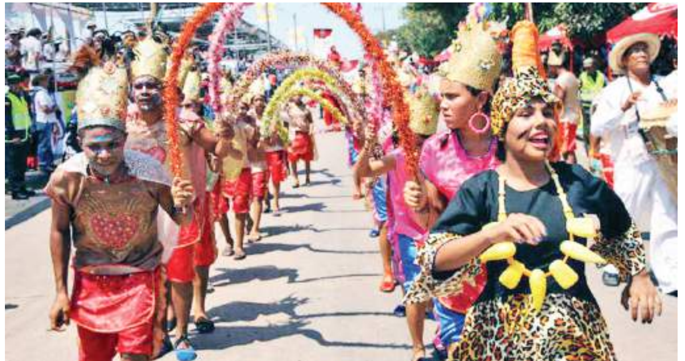
¿Los candidatos son conscientes de la importancia de la transformación social y el aporte de la cultura?

convocatorias pueden brindar un Ministerio de Cultura y el Gobierno mismo al ecosistema cultural?