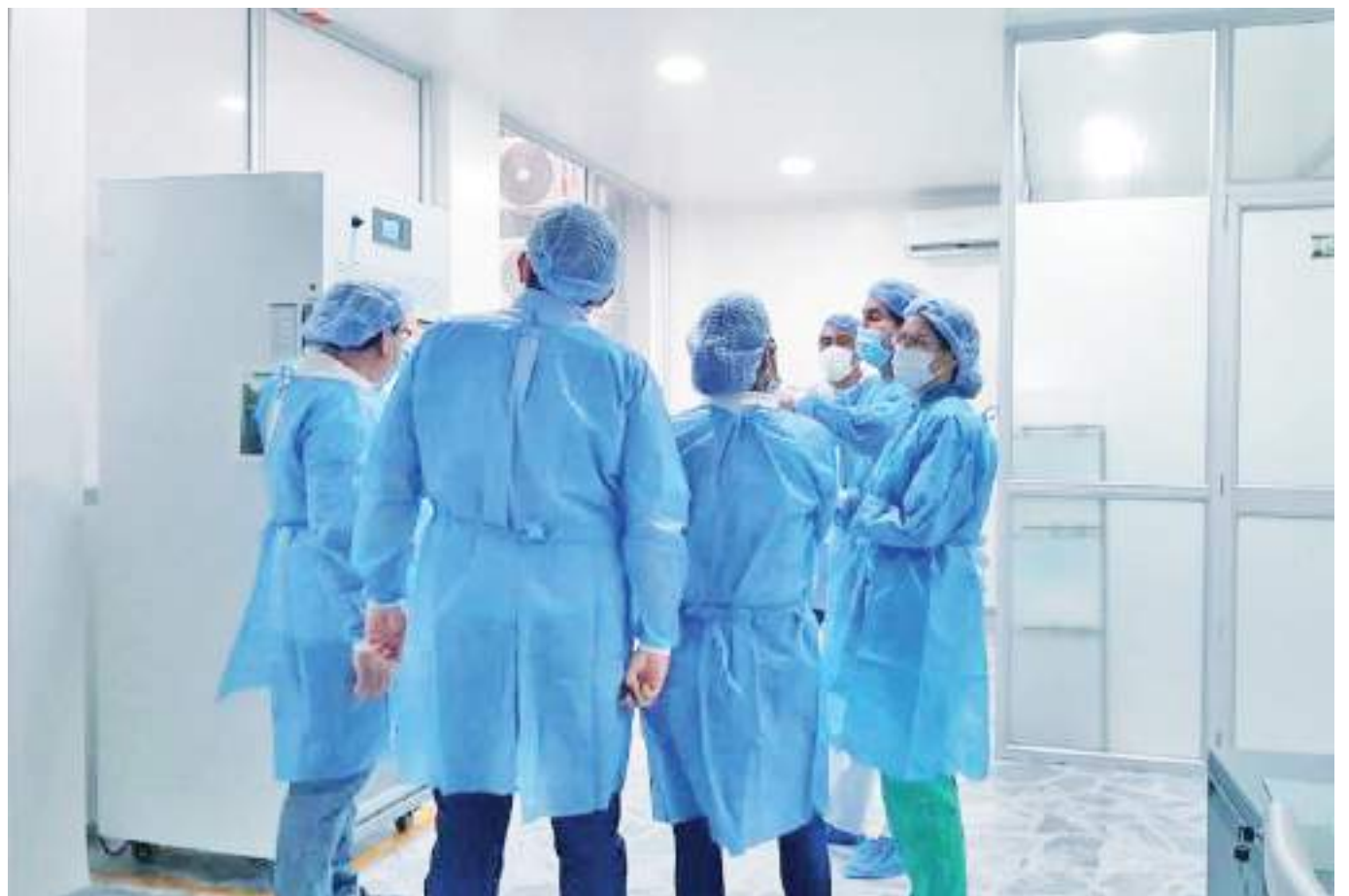
Gracias a la labor del banco de tejidos del sur de Colombia, hay una disminución notable en la lista de pacientes en espera en la región.

2015 - 31 Córneas 2016 - 5 Córneas 2017 - 26 Córneas 2018 - 11 Córneas 2019 - 31 Córneas 2020 - 60 Córneas 2021 - 62 Córneas