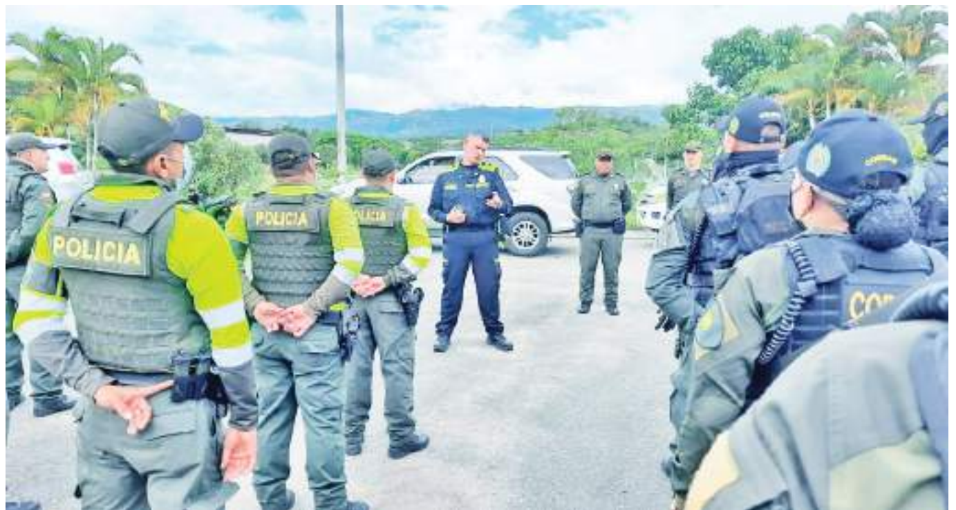
Desde el Departamento de Policía Huila se garantiza la seguridad en todo el Huila.

La Policía Nacional decomisará toda la propaganda proselitista que esté siendo distribuida o que sea reportada por cualquier medio