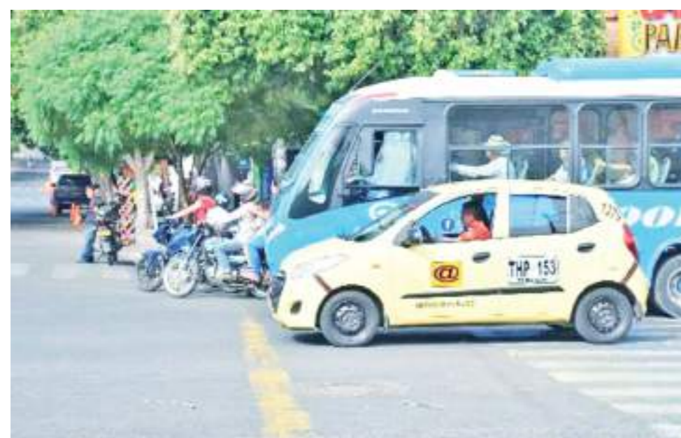
Los transportadores argumentan que trabajan a pérdida.