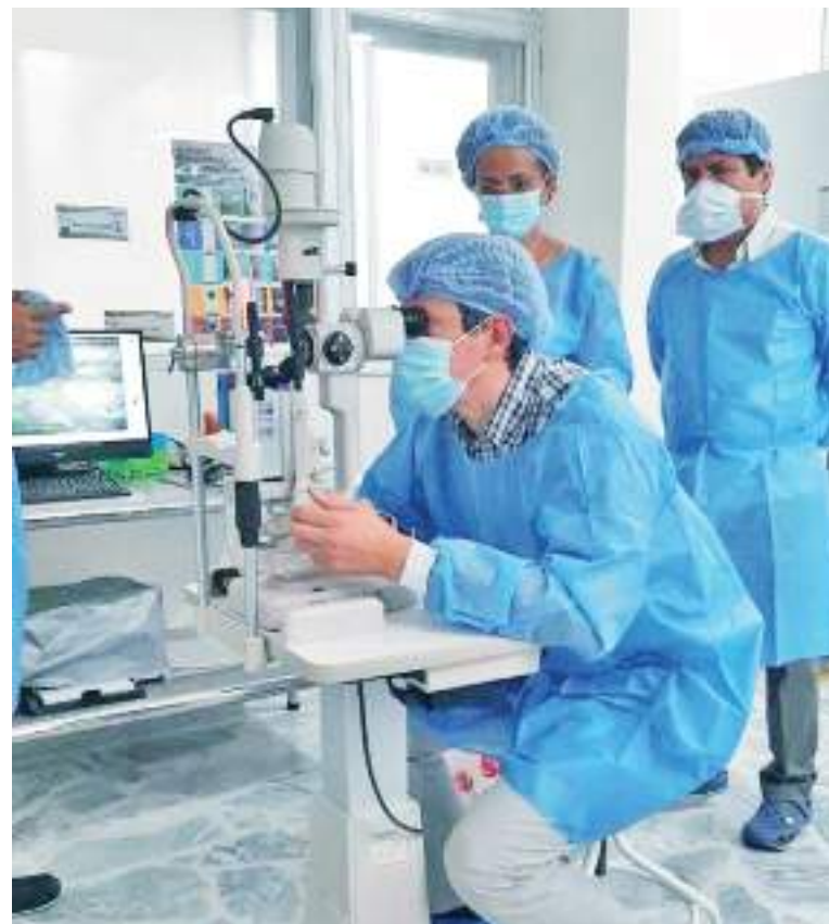
A nivel nacional son muchas las personas que sufren de algún problema óptico y son pocos los bancos para cubrir toda la necesidad del país.

Pese a que hasta el momento han venido trabajando con esfuerzos individuales, actualmente, se encuentran buscando el apoyo de entidades de la región porque su idea es arrancar con esta proyección este mismo año y así adelantar este proyecto que beneficia al departamento en general. En concordancia, buscan crecer y darles nuevas oportunidades a