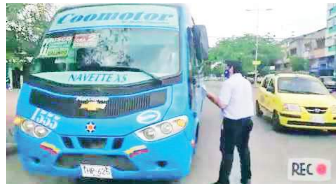
Pasaron de cuatro rutas a una y luego a cero.

La disminución y cancelación de rutas de transporte público colectivo en Neiva, obedece a múltiples factores, como el mototaxismo, el argumento de los transportadores legales que dicen trabajar a pérdida, y mientras tanto los usuarios a la espera de que haya un mejor servicio.