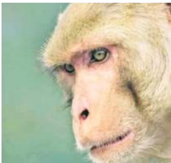
La viruela del simio puede infectar una variedad taxonómicamente amplia de especies de mamíferos.

No obstante, un diagnóstico definitivo de la viruela del mono solo puede establecerse mediante pruebas de laboratorio. Por lo tanto, la Organización Mundial de la Salud (OMS) recomienda que las muestras óptimas para el diagnóstico incluyan el muestreo directo de las lesiones: frotis de exudado de lesiones vesiculares o costras almacenados en un medio de transporte seco, estéril, no viral y tubo de ensayo frío.