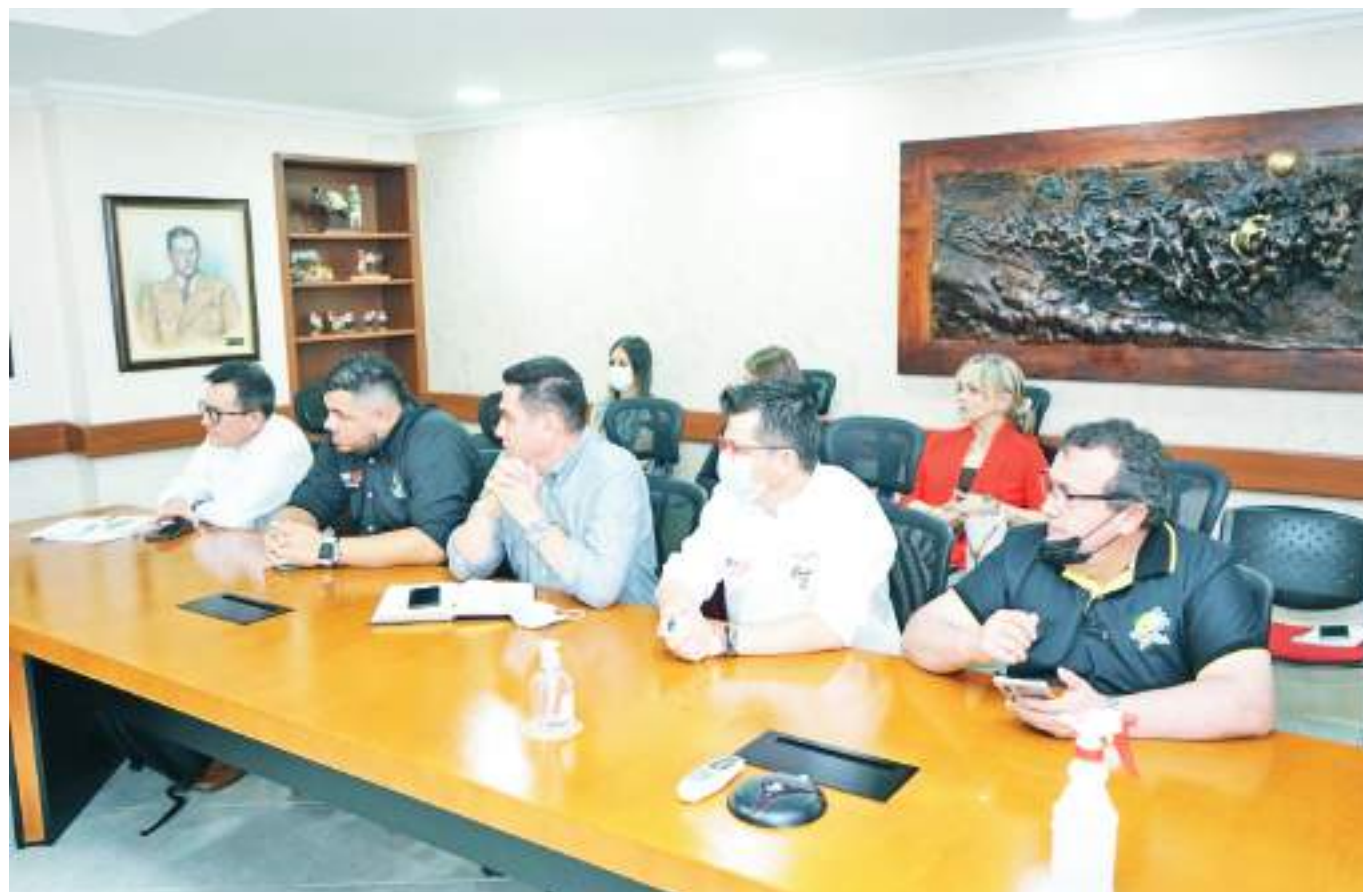
Será responsabilidad de los diferentes actores económicos impulsar la economía del departamento a través de distintas apuestas productivas.

Ahora, el compromiso, tal como lo expuso el viceministro, sería de los departamentos para que a través del sistema Nacional de Competitividad e Innovación “sean quienes les digan al nuevo gobierno; esta es la hoja de ruta que queremos seguir y es nuestro compromiso hasta el 7 de agosto, adelantar toda, la mayor implementación que se pueda de las acciones para que sean los departamentos por voluntad propia los garantes de que la política se siga cumpliendo”, concluyó el viceministro Cárdenas.