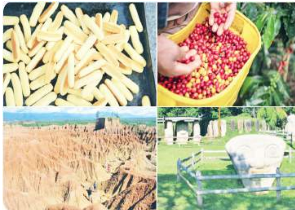
El Departamento del Huila representa el 3.9% de canasta exportadora no minera. A marzo se exportó en esta clase de bienes US$230 millones. 15,5% más que el año anterior.