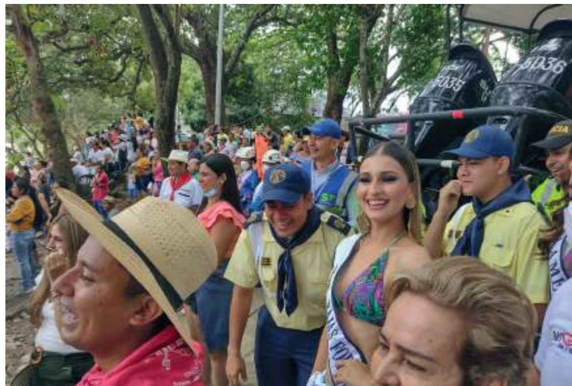
Integración, belleza, alegría mostraron las candidatas a los asistentes.

Con un retraso de cerca de dos horas se realizó el esperado desfile acuático por las aguas del río Magdalena, que este año se incluyó dentro del evento local.