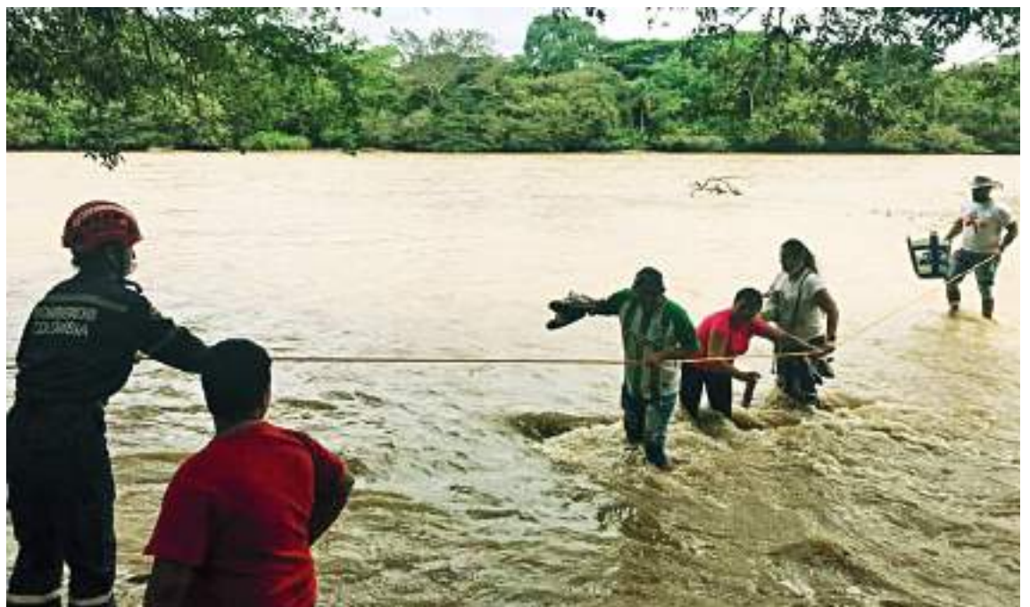
Bomberos voluntarios de Neiva rescataron más de 50 personas que quedaron atrapadas en un islote del río Magdalena, mientras veían el desfile acuático. El nivel del río subió dejándolos en inminente peligro.