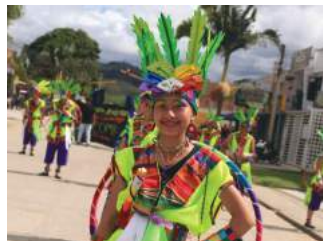
Toda una fiesta cultural se vive en Pitalito.

En el marco de la celebración del 59° Festival Folclórico Laboyano y 1er Encuentro Surcolombiano de Integración Cultural, la Alcaldía de Pitalito expidió el Decreto Municipal Nro. 174 del 24 de junio de 2022, mediante el cual se dictan medidas especiales y transitorias para la reactivación económica que atraviesa el municipio por estas festividades sampedrinas.