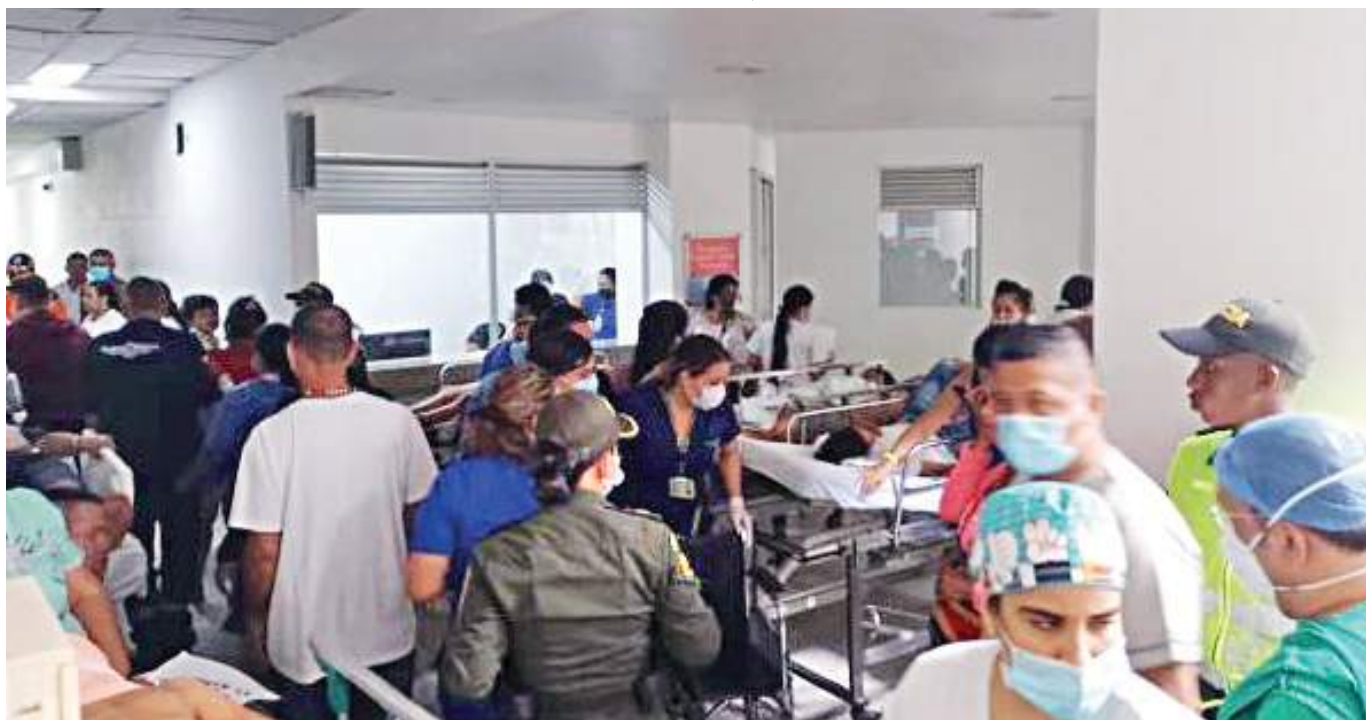
El desplome de las gradas improvisadas en la plaza de toros y la cantidad de heridos provocó que se declarara alerta roja hospitalaria en el municipio de El Espinal, Tolima.

“Sentimos la terrible tragedia registrada en El Espinal, duran-