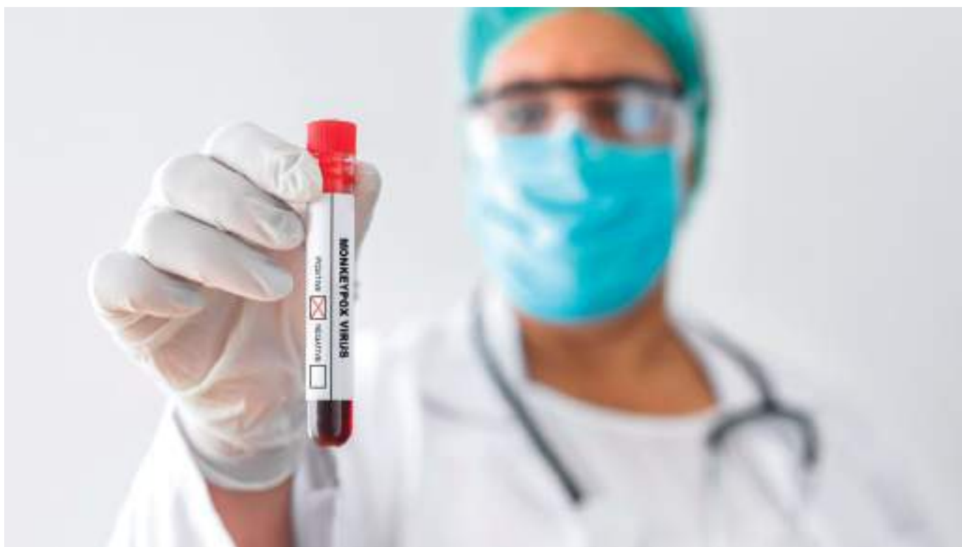
Acudir a los servicios de urgencias si se llega a presentar algún tipo de síntoma que pueda estar relacionado con esta patología, es la recomendación desde la Secretaría de Salud Departamental.

“Toda la red de salud ya conoce los síntomas y está en alerta