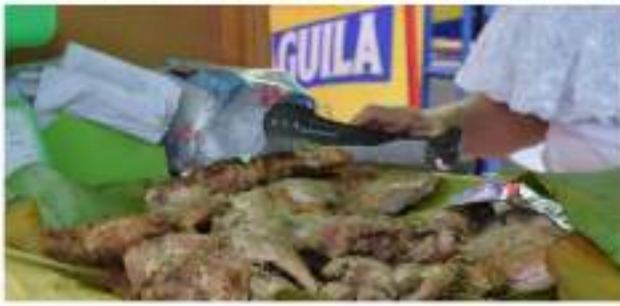
Asado huilense; una costosa tradición