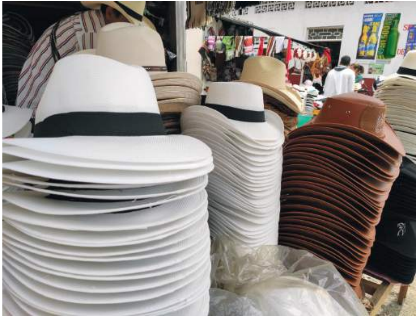
Pese a su reconocimiento por la temporada, los artesanos conocedores del tema cada vez son menos.

“Yo no he dejado de tejer, ni en pandemia, yo seguía tejiendo así no se compraran. Igual trabajaba a puerta cerrada. Ahorita gracias a Dios lo que habíamos tejido en la pandemia, nos sirvió para esta