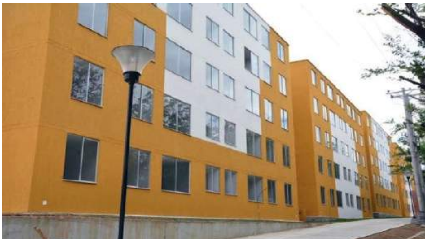
La recomendación ha sido no dejar solos a los menores por ninguna circunstancia.

Finalmente, lo fundamental de esta historia es que la menor se encuentra avanzando en su estado de salud. Adicional a esto, se estaría investigando el hecho de que las ambulancias a las que se le dieron aviso no acudieron al lugar para atender la emergencia, por lo que la niña tuvo que ser trasladada desde el lugar de los hechos hasta la clínica por un vehículo particular.