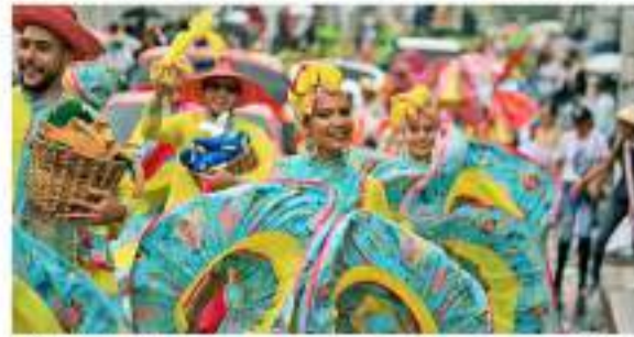
Pitalito vive la verdadera integración cultural