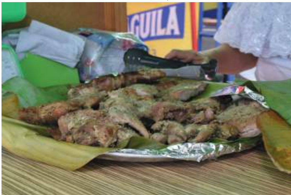
En el marco del “Festival de San Pedro y San Juan” se lleva a cabo la Feria del Asado Huilense y Platos Típicos en la ciudad de Neiva.

de manera notoria y en ocasiones desmesurada. “Durante todo el año uno sufre los distintos cambios del mercado, a veces está costosa la carne, a veces lo de plaza, los insumos para el adobo o lo que se necesita para preparar los otros productos, pero justo en esta época los precios suben