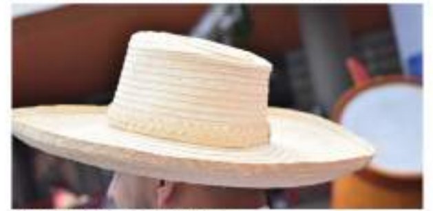
Una vida entre la Iraca