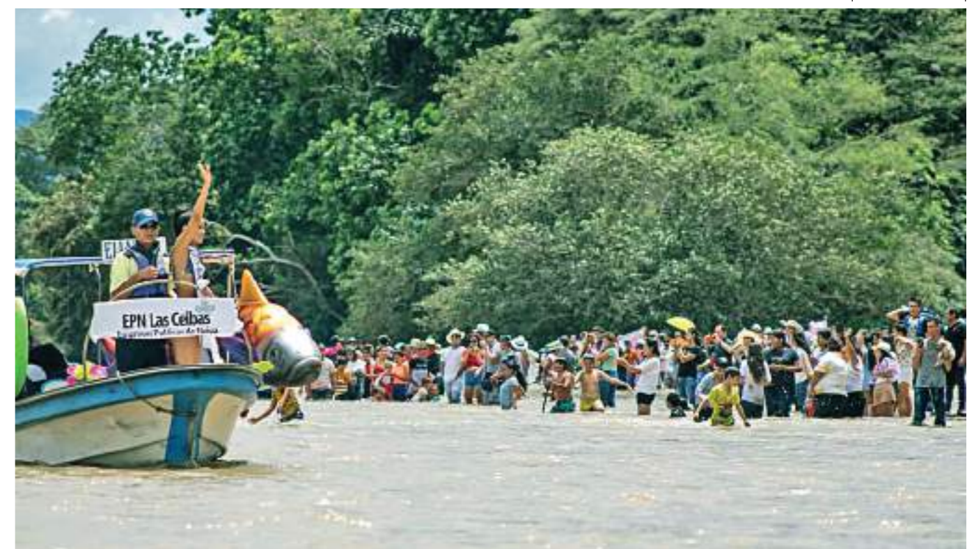
Las candidatas navegaron sobre las aguas del río. Mientras muchas personas ingresaron también al río.

“Creo que esto es algo para disfrutar, me encantó, es positivo que me hayan invitado para ser testigo de este gran evento, esto es algo espectacular que para conocerlo hay que vivirlo”