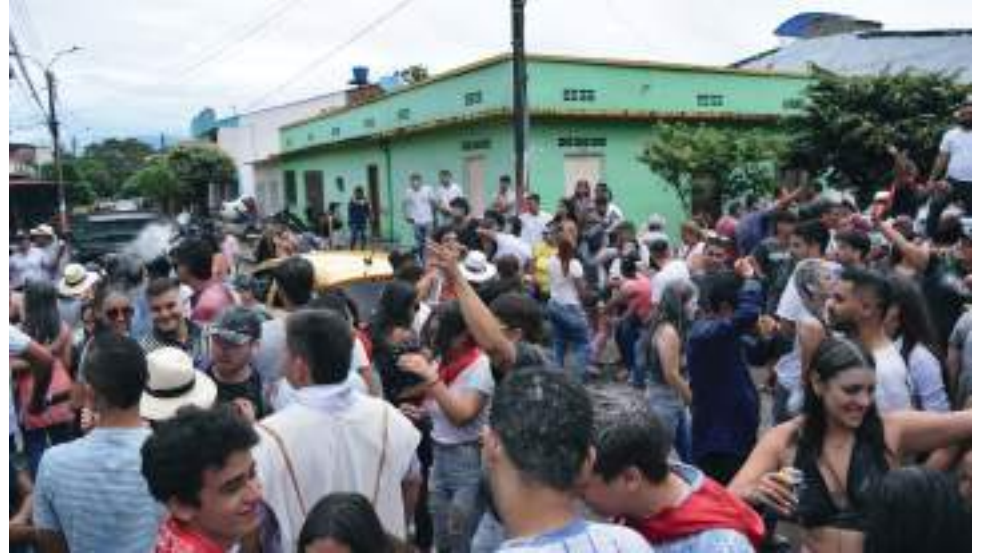
Esta actividad que congrega a miles de personas anualmente, este año rompió límites tras su reactivación.