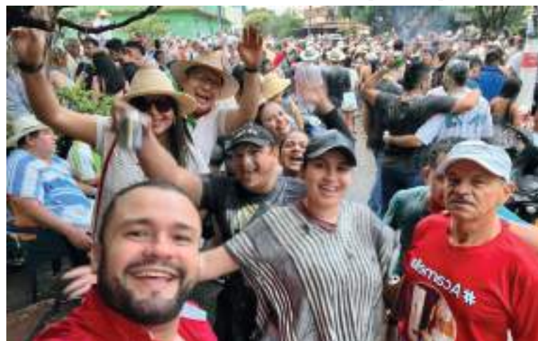
Varios líderes comunitarios disfrutaron de esta alborada

“Tuvimos dos grupos folclóricos de danzas, la compañía de la Reina Nacional Infantil, el apoyo de la Policía y decidimos poner una tarima con sonidos, para darle un cambio a la alborada que siempre era el recorrido y finalizaba. Estamos reactivando la economía en el día de hoy”, explicó el líder comunitario.