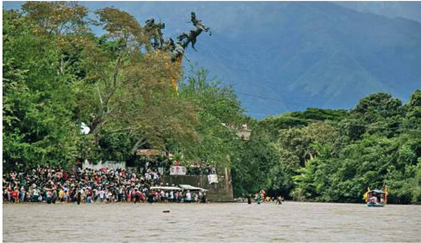
El monumento a la Gaitana, marco espectacular del desfile acuático.