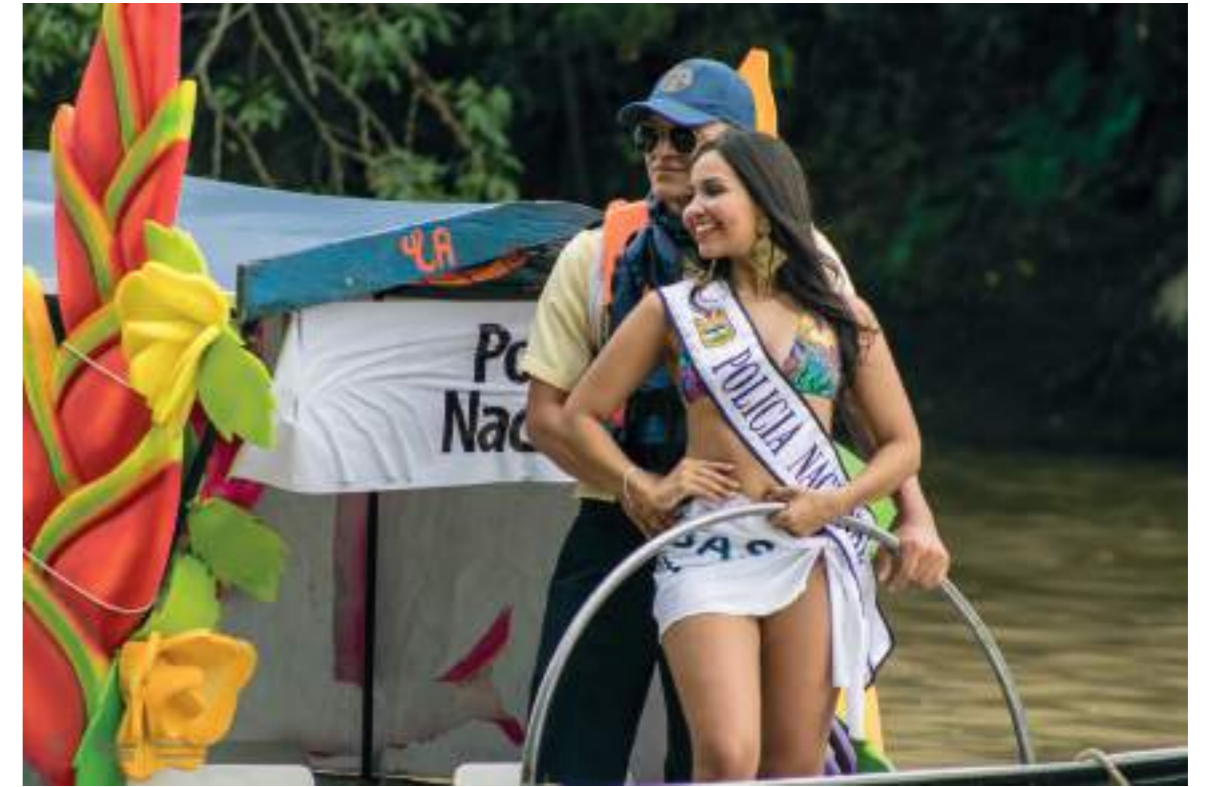
Los neivanos y visitantes volvieron la cara hacia el río Magdalena.

La presencia de la espuma y la harina si son normales en los carnavales de Pasto en Nariño y en las festividades del departamento del Cauca, al igual que en los carnavales de otras ciudades en Colombia.