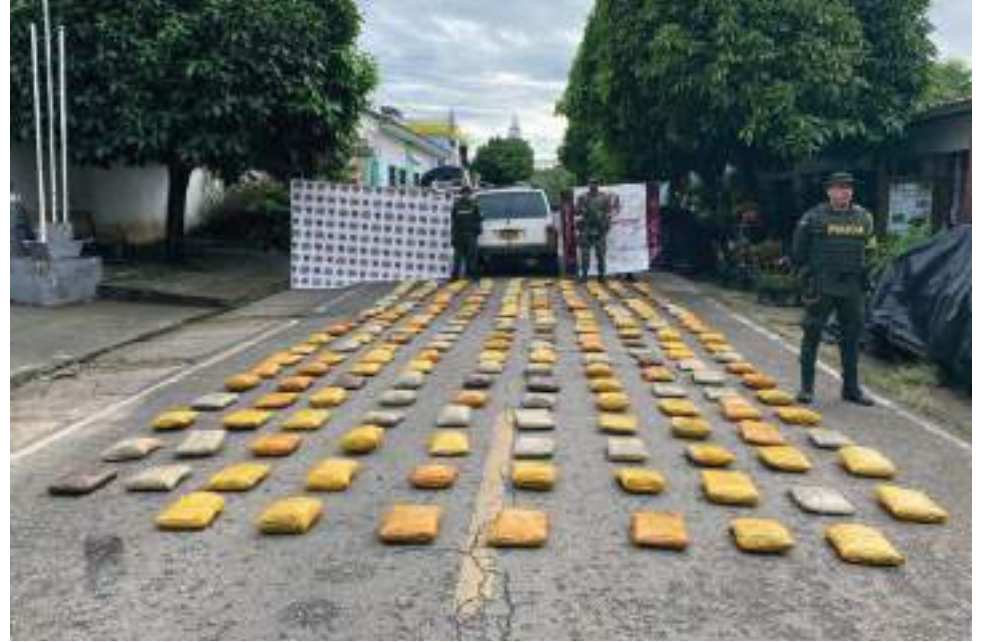
230 kilos de marihuana se logró también incautar.