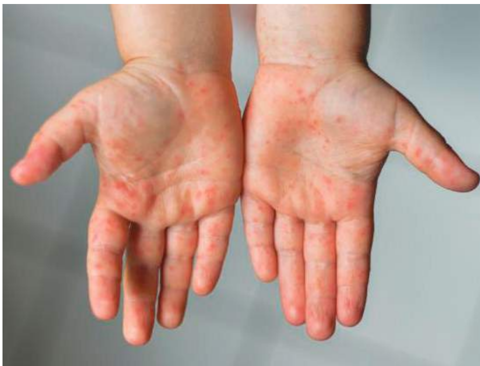
La viruela del mono se ha venido presentando en el mundo como una patología altamente contagiosa, pero no tan letal.

Es importante tener en cuenta que la viruela símica no suele considerarse muy contagiosa porque requiere un contacto físico estrecho con alguien infeccioso para propagarse entre las personas.