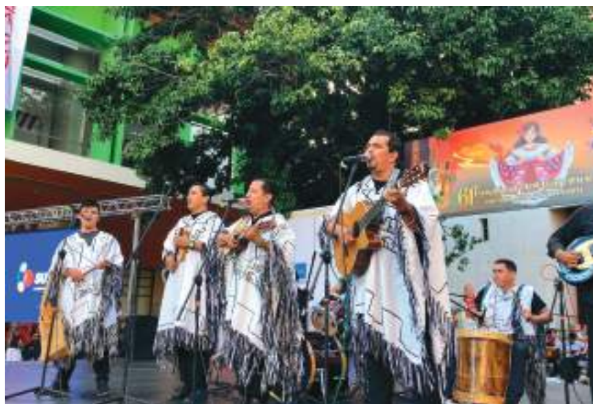
Las agrupaciones de música andina deleitaron a propios y visitantes.

■ La música que por estos días también alegra el espíritu sampedrino en el Huila es la Andina con sus chirimías. Esta música ancestral tuvo su espacio en el encuentro departamental que se desarrolló en la plazoleta del centro de convenciones 'José Eustasio Rivera' de Neiva, con la presentación de agrupaciones de diferentes municipios.