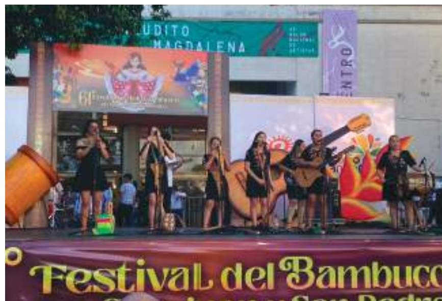
Agrupaciones del sur del Huila hicieron su participación en tarima.