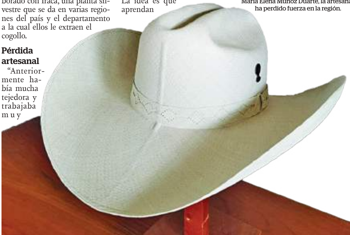
El sombrero de Suaza es un elemento apetecido por propios y turistas.