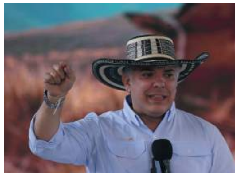
El presidente Duque y la vicepresidenta Marta Lucía Ramírez lamentaron el accidente en El Espinal, y anunció que se dará inicio a las investigaciones pertinentes sobre este hecho.

te las fiestas de San Pedro y San Juan, por desplome de palcos en una corraleja. Pediremos una investigación de los hechos; pronta recuperación a los heridos y solidaridad con las familias de las víctimas", indicó el presidente a través de redes sociales.