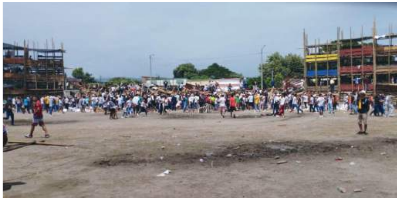
Un menor de 14 meses de nacido figura en la lista de fallecidos tras el desplome de la plaza de toros del municipio de El Espinal, Tolima, donde sus habitantes celebran por estos días las tradicionales fiestas de San Pedro.

Además, la gerente del hospital San Rafael aclaró que de los 257 heridos, hay algunos que presentan lesiones menores y otras más delicadas, pero que los están esta-