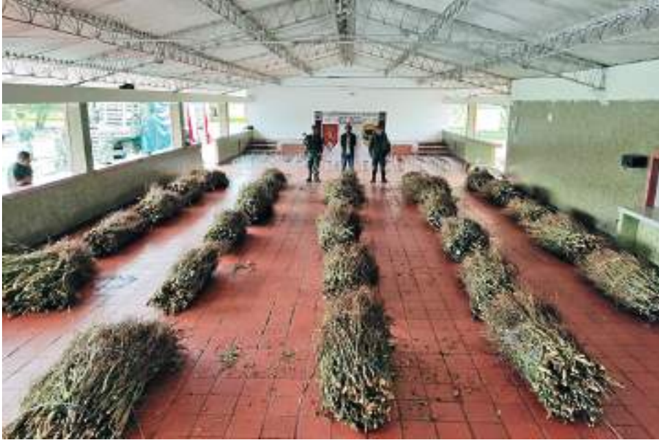
Unas 6 mil ramas de mata de coca fueron incautadas en la vereda El Cedro de Pitalito.

■ Al menos 6 mil ramas de mata de coca fueron incautadas en un vehículo que transportaba chatarra. Al parecer iban a ser utilizadas para la extracción de semilla. Así mismo en zona rural de Timaná 230 kilos de marihuana fueron abandonados en un vehículo.