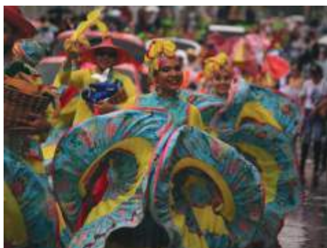
Las muestras folclóricas engrandecen la identidad del pueblo laboyano.

Se admiró la participación de las delegaciones de niños, jóvenes y adultos mayores. Pitalito se vistió de color con