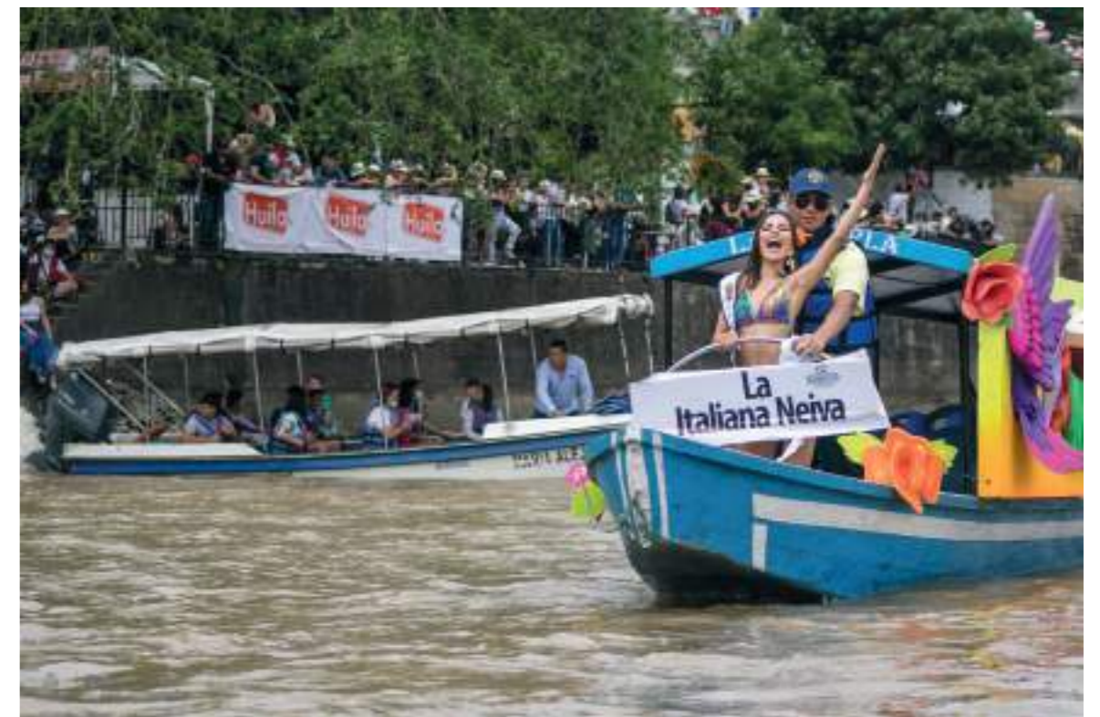
El desfile acuático se realizó por primera vez a nivel Neiva.