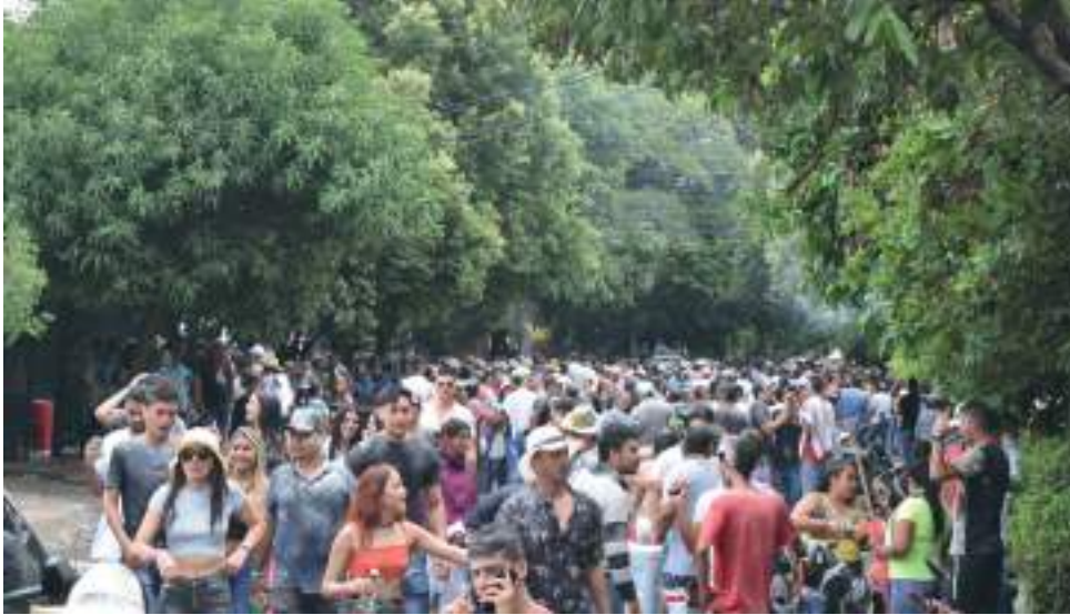
La música, el folclor y el disfrute fueron algunos elementos que se priorizaron durante la alborada organizada por el barrio Las Granjas de Neiva.

Una de las actividades más cotidianas en los diversos rincones del Huila por esta época, son las tradicionales alboradas que congregan gran flujo de personas. En Neiva una de las más antiguas la realiza el barrio Las Granjas. Ayer se llevó a cabo esta actividad que reunió a cientos de personas de diversos sectores y que se festejó al ritmo del folclor huilense.