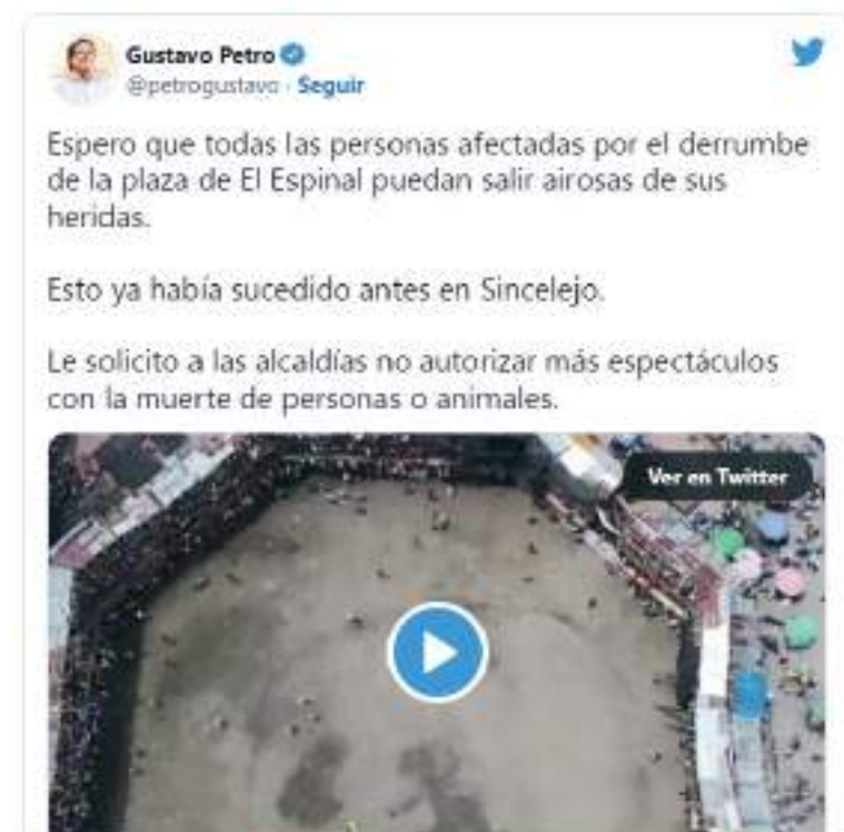
Gustavo Petro le solicitó a las alcaldías "no autorizar más espectáculos con la muerte de personas o animales".