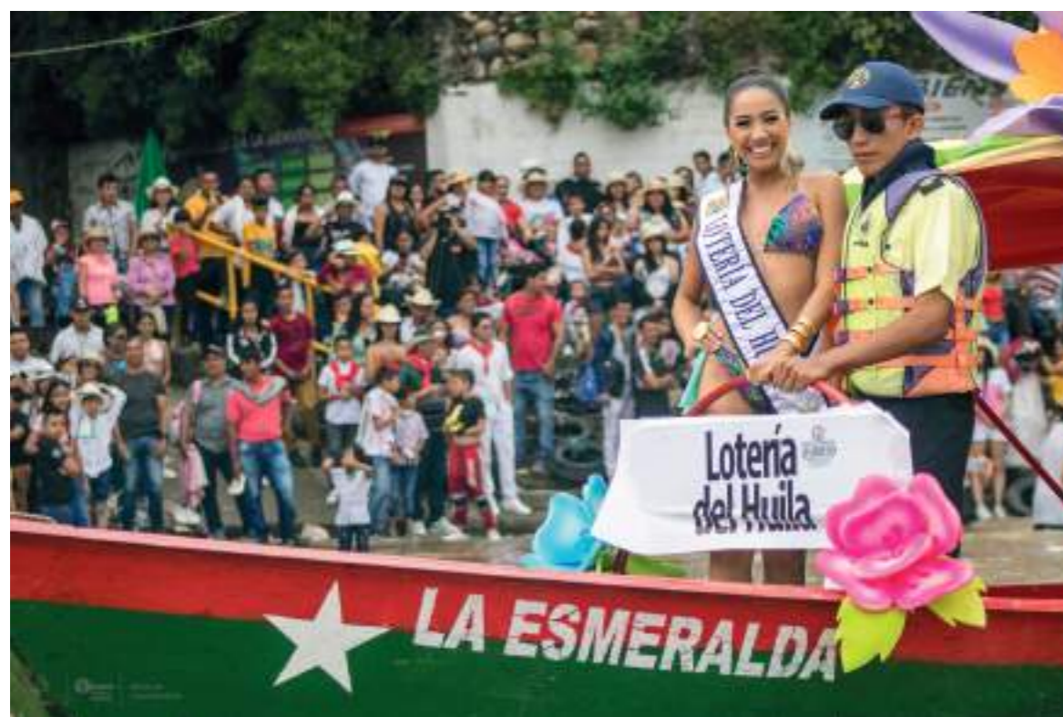
Los espectadores disfrutaron del evento.