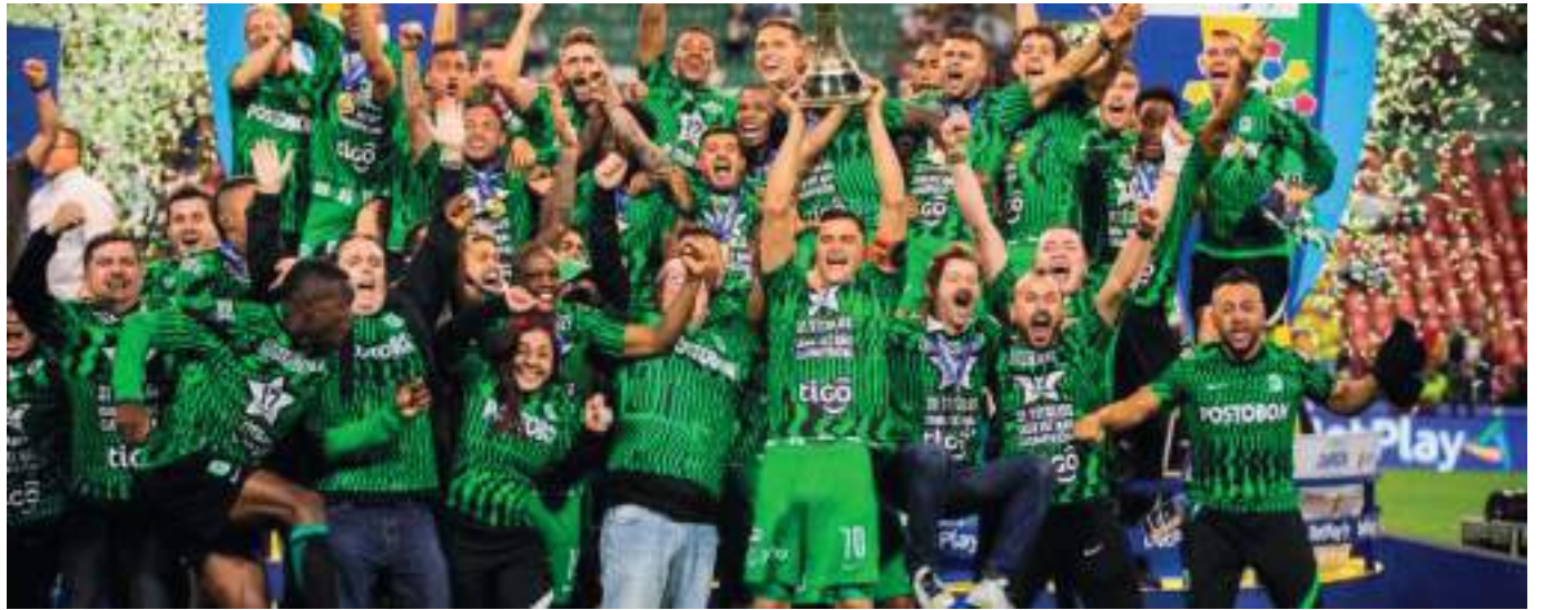
Nacional celebra la estrella 17 en el 'Murillo Toro' de Ibagué.

Más adelante, la visita logró emparejar un poco el duelo y no sufrirlo tanto. En dicho aspecto fue importante la labor de Jhon