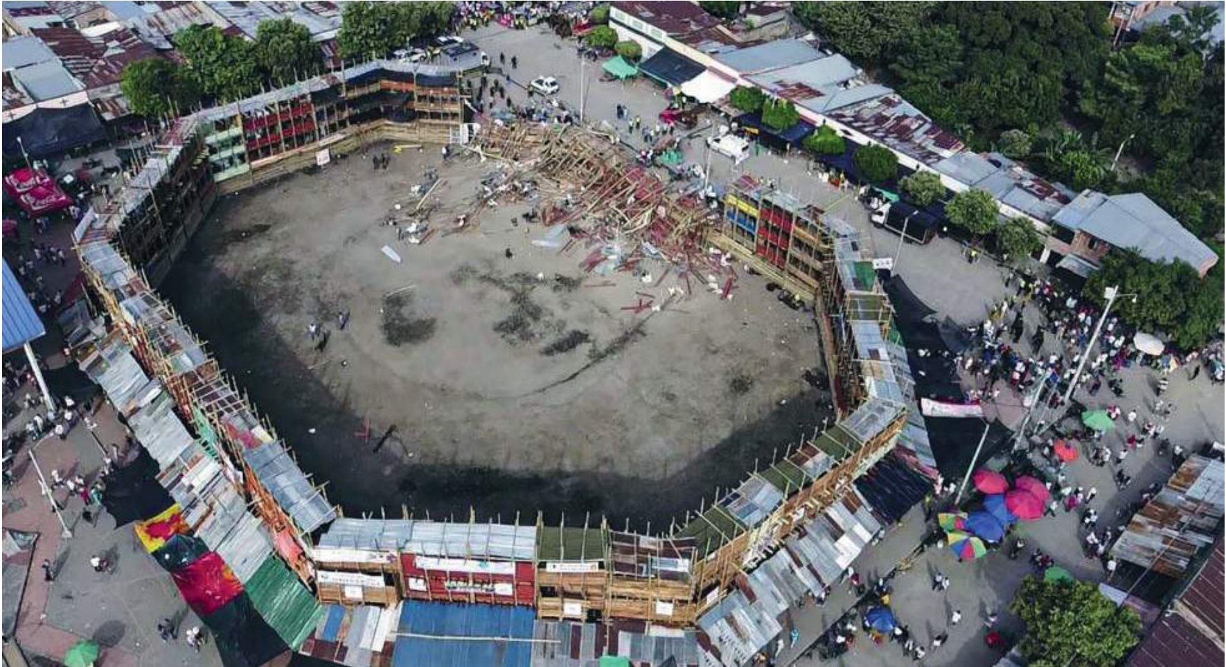
La emergencia ocurrió a las 12:45 minutos de la tarde de este domingo 26 de junio.