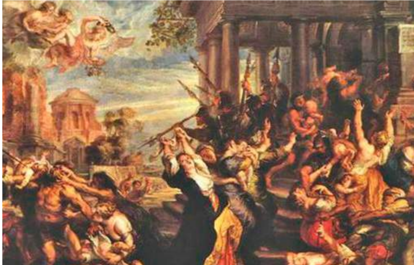
El 28 de diciembre se celebra la fiesta de los Santos Inocentes.