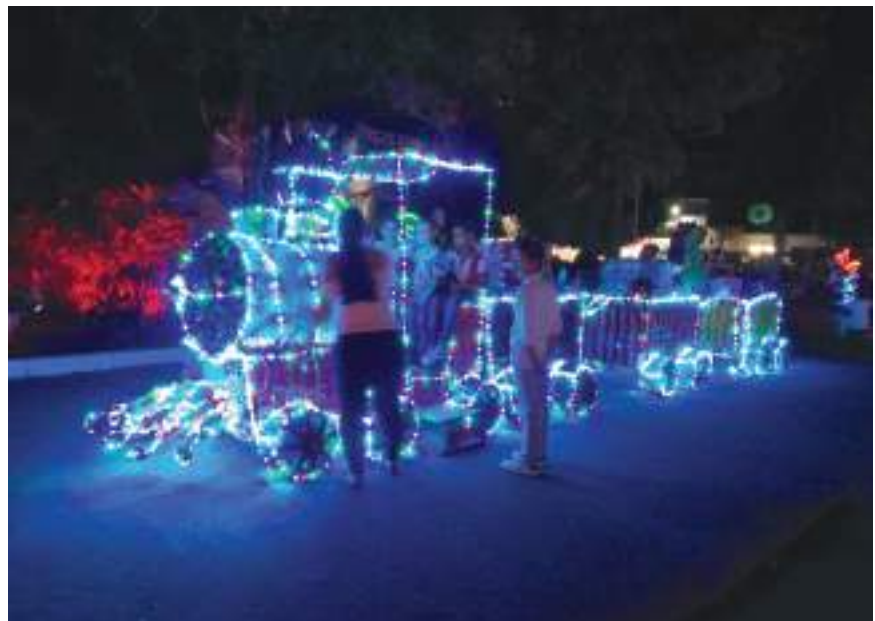
Las figuras representan la tradición e identidad del pueblo suaceño.

El proyecto ha impactado de manera positiva el medio ambiente porque cualquier cantidad de envases plásticos que eran arrojados a la basura y a las calles, han sido recuperados y transformados en llamativas figuras navideñas.