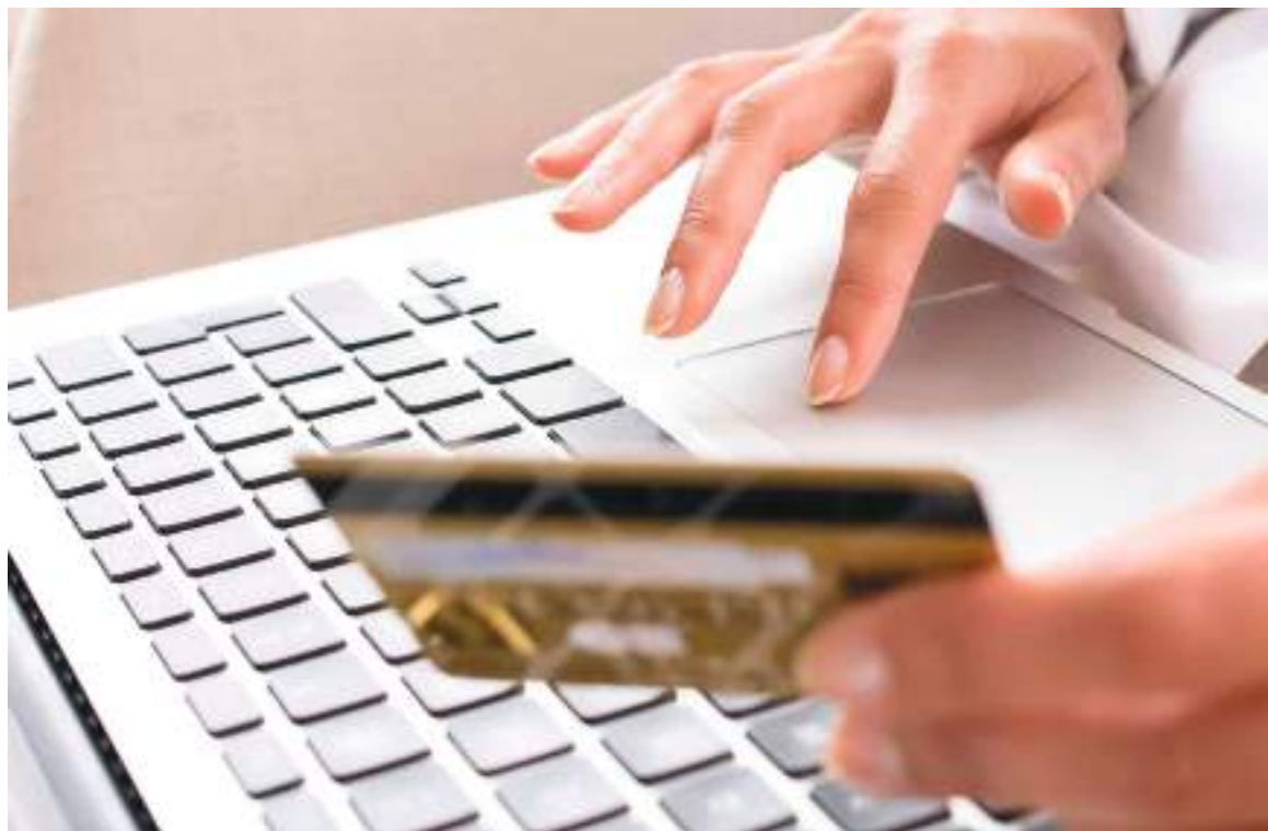
Las autoridades colombianas revelaron cifras preocupantes relacionadas a los delitos cometidos en línea durante este 2021.

Se detalló que entre los principales delitos informáticos está el grooming, nombre que recibe la acción deliberada de un adulto, varón o mujer, de acosar sexualmente a una niña, niño o adolescente a través de un medio digital. Se registraron 516 incidentes de este crimen. En segundo y tercer