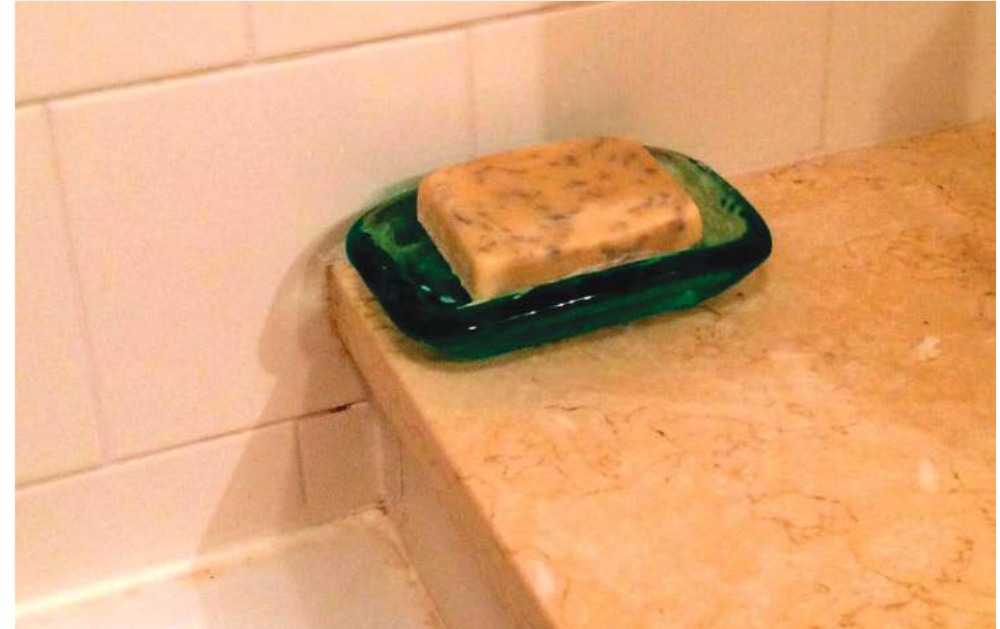
Cambiar el jabón por queso es una broma que se estila.