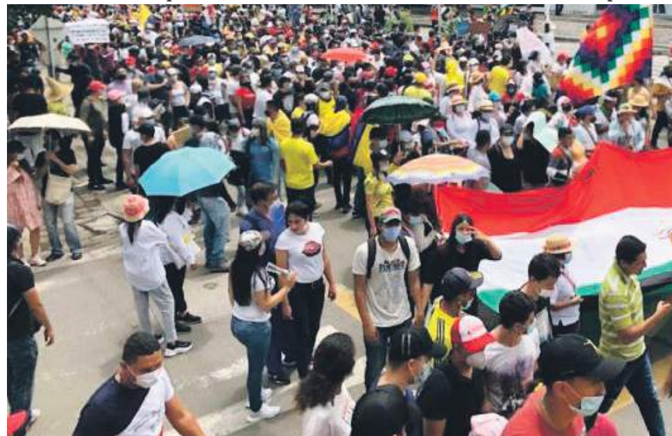
Muchos opositores consideran que con la ley se criminaliza la protesta social.

Para varios sectores, el incremento de penas no