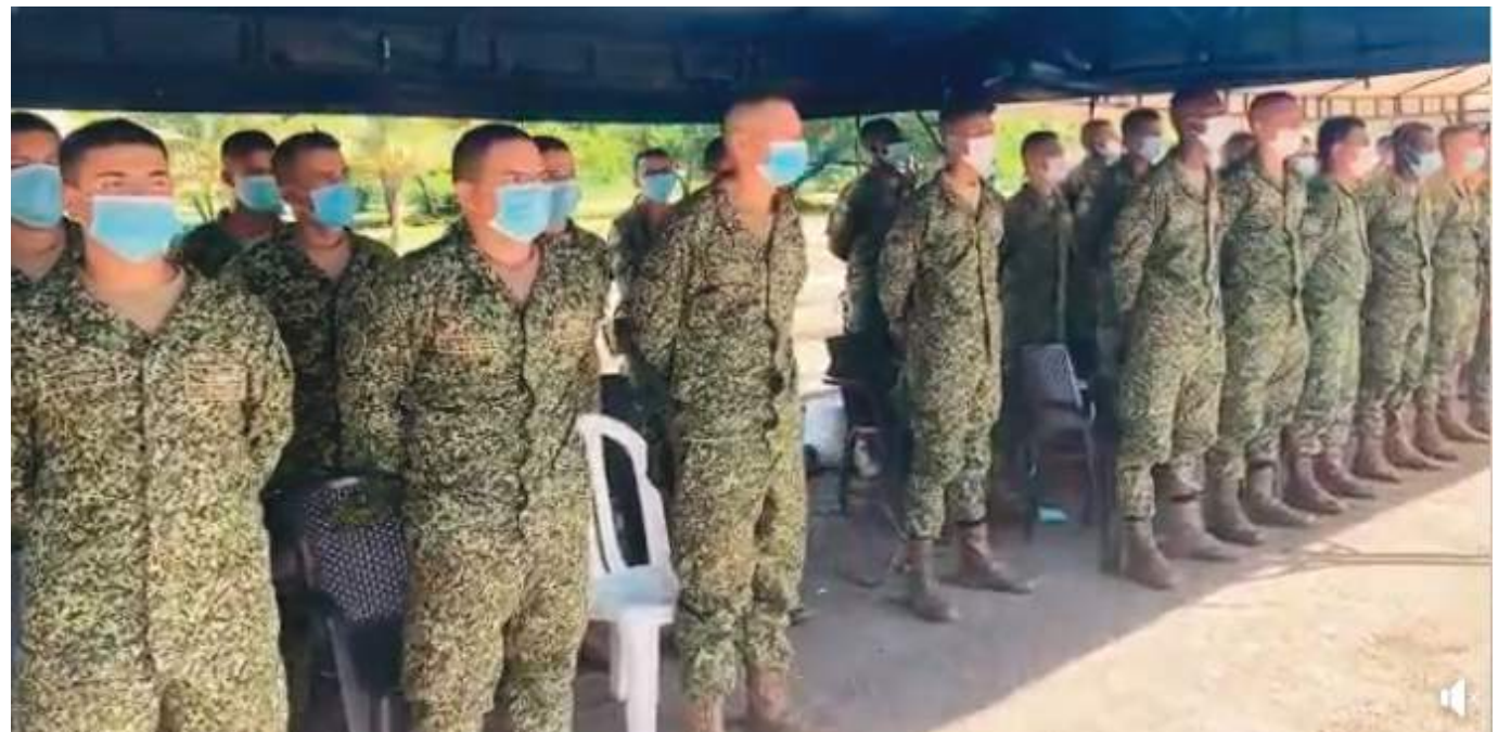
El tiroteo ocurrió en la mañana del 25 de diciembre.