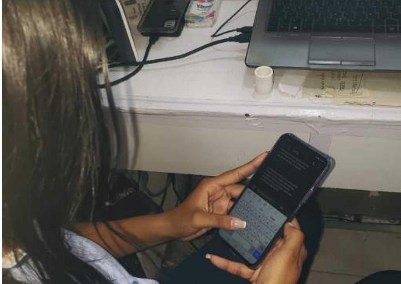
Las personas tienen mecanismos que les facilitan eliminar o restringir este tipo de mensajes.

Como se dijo, antes de presentar una queja a la SIC, es necesario surtir el trámite con la empresa. En cuanto no hay un mecanismo para revocar todas las autorizaciones en bloque, este proceso debe hacerse de manera manual,