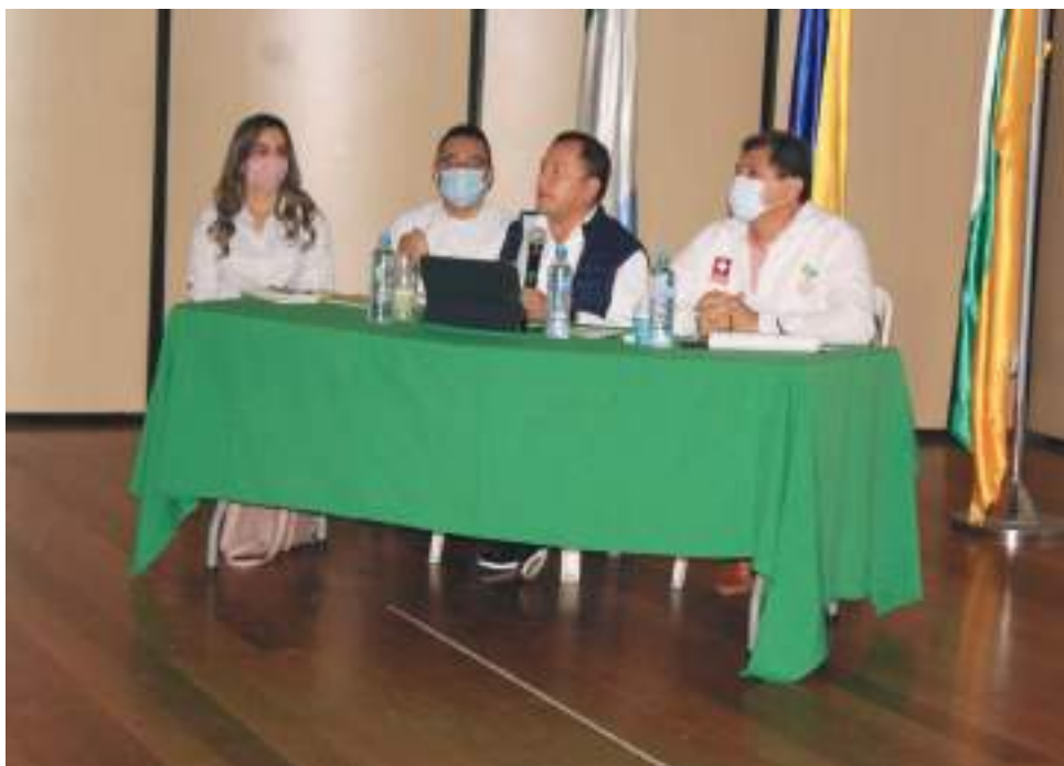
En Pitalito se analizó y estructuró un Plan de Trabajo unificado que permita lograr la inmunidad en los municipios del sur y centro del Huila de manera urgente en torno al Plan de Vacunación contra Covid-19.

La estadística de personas fallecidas por causa del Covid19 en el departamento del Huila es de 3.193.