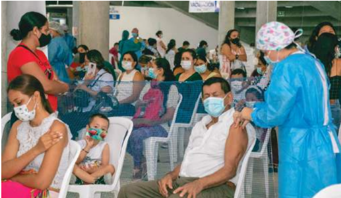
El encuentro de 'Control Social' arrojó que en el Huila se ha logrado el 48,30% del total de dosis necesarias para lograr la "cobertura de rebaño".

Por ello desde el Gobierno Departamental se empezaron a adelantar toda una serie de estrategias y acciones en búsqueda de