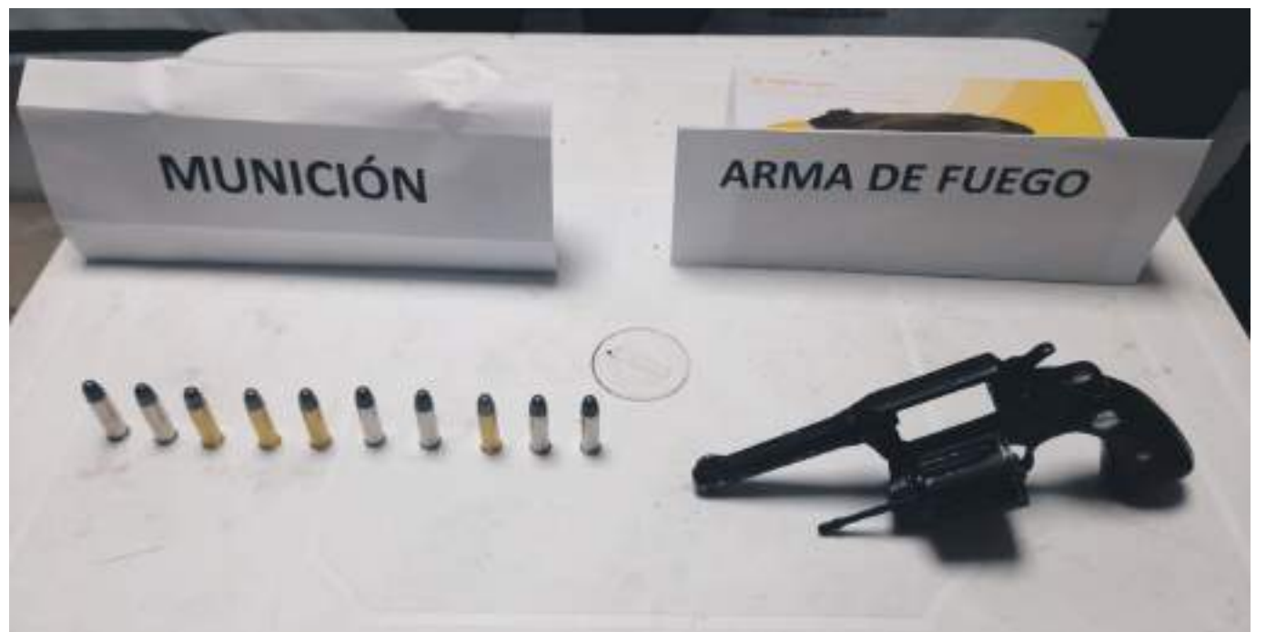
Los hechos se habrían presentado a las 2:40 de la madrugada del 24 de diciembre en el parque San Martín.

Hacemos un llamado a la tolerancia y al respeto por la vida, igualmente a no tomarse la justicia por mano propia, e informar oportunamente hechos de violencia.