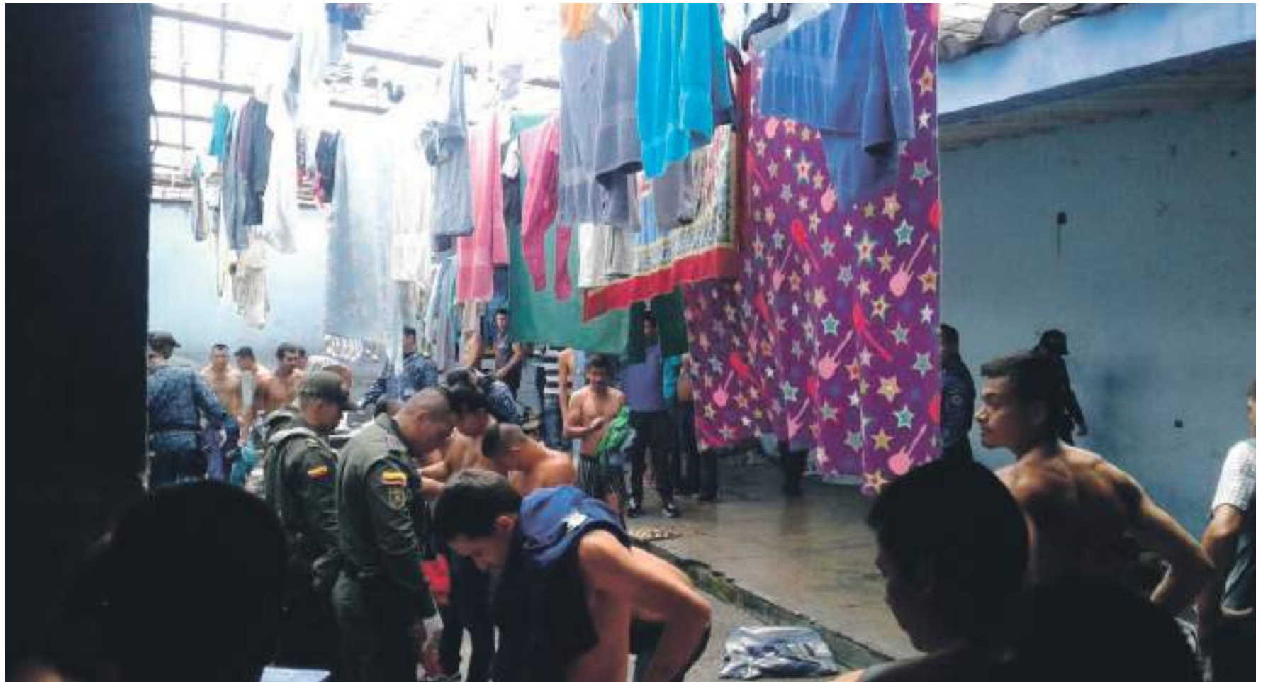
La nueva ley deja abierta la posibilidad de la privatización de las cárceles en Colombia.

■ La aprobación de esta ley no ha estado exenta de polémicas, según la bancada de oposición del gobierno, el proyecto va en contra de los derechos humanos al criminalizar la protesta social. La ley crea “delitos y agravantes sin análisis de implicaciones para el sistema penal o de su verdadero objetivo, efecto, frente a la criminalidad”. Para varios sectores, el incremento de penas no es más que una política criminal “populista”.