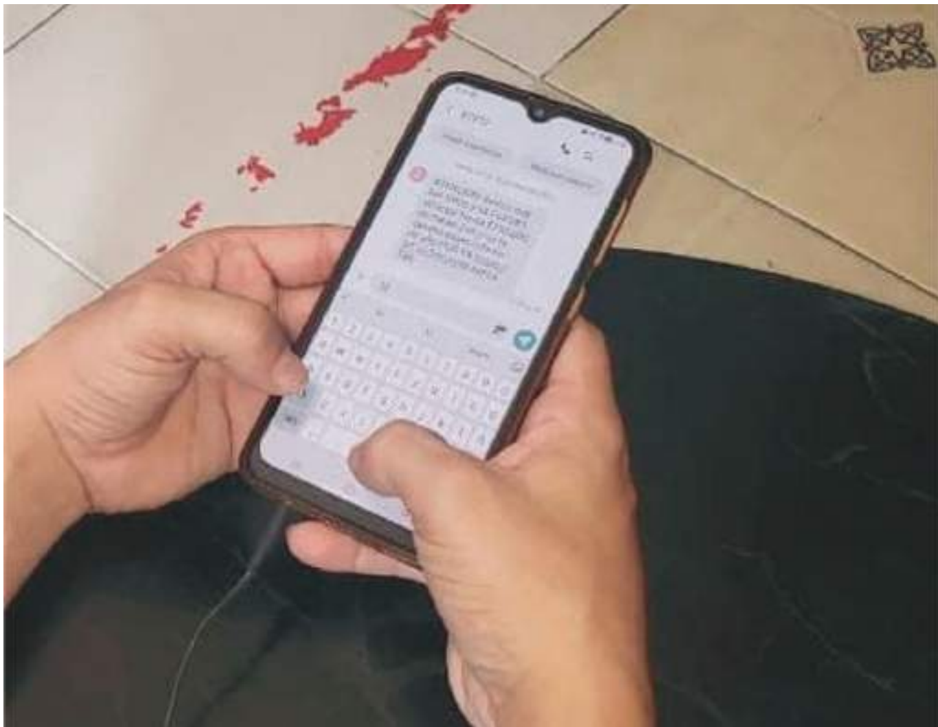
El número de mensajes indeseados que llegan a los teléfonos celulares personales son incontables.

Primero, debe tener en cuenta que este tipo de mensajes solo pueden ser recibidos en una franja horaria de 8:00 a.m. a 9:00 p.m., y solo podrán ser enviados si el consumidor dio su consentimiento informado para ello. Para que utilicen sus datos personales para transmitir información los destinatarios deben contar con su