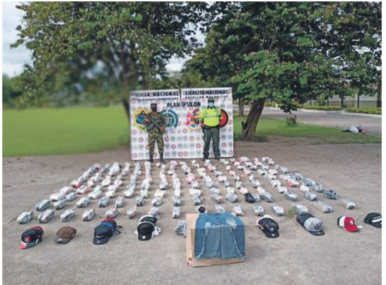
La primera operación del “Plan Ípsilon” permitió la incautación de 10.000 kilos de azúcar marca San Carlos, distribuidos en 200 bultos de 50 kilos cada uno.

Finalmente, se logró la incautación de 0.177 metros cúbicos de madera de la especie Laurel, material forestal que no contaba con los permisos por parte de la autoridad ambiental competente. Todo un trabajo coordinado e interinstitucional que permite combatir los diferentes fenómenos de ilegalidad por territorio huilense.