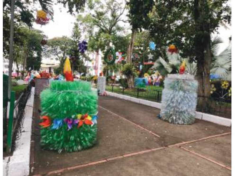
El alumbrado navideño con material reciclado fue elaborado con la participación de la misma comunidad de Suaza.