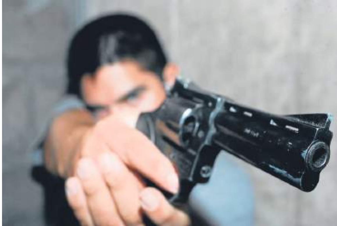
También se habla del uso de armas por parte de particulares.

“se presume como legítima la defensa que se ejerza para rechazar al extraño que usando maniobras o mediante violencia penetre o permanezca arbitrariamente en habitación o dependencias inmediatas, o vehículo ocupado. La fuerza letal se podrá ejercer de forma excepcional para repeler la agresión al derecho propio o ajeno. En los casos del ejercicio de la legítima defensa privilegiada, la valoración de la defensa se deberá aplicar un estándar de proporcionalidad en el elemento de racionalidad de la conducta”.