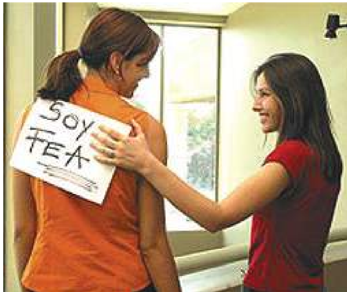
Pegar letreros en la espalda es otro de los juegos para este día

En todo el mundo una celebración denominada 'Día de los inocentes', la cual tiene dos significados totalmente distintos y a la vez relacionados por un episodio ocurrido hace más de 2.000 años.