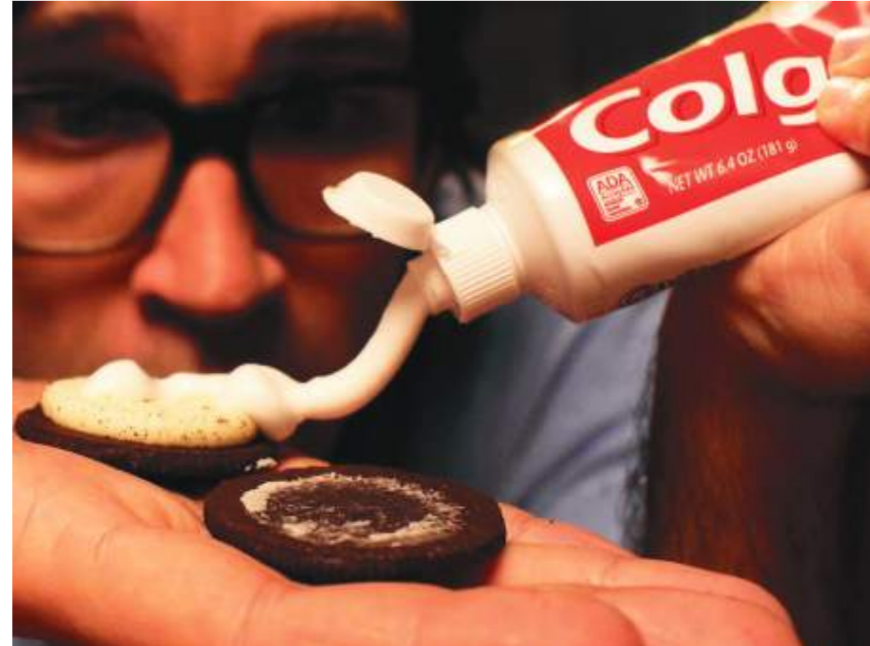
Las bromas se ponen a la orden este día.