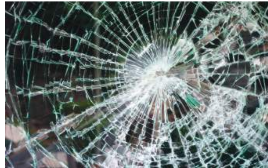
Fingir un cristal roto. Se hace con tiza y jabón

La realidad actual es que se ha ido perdiendo