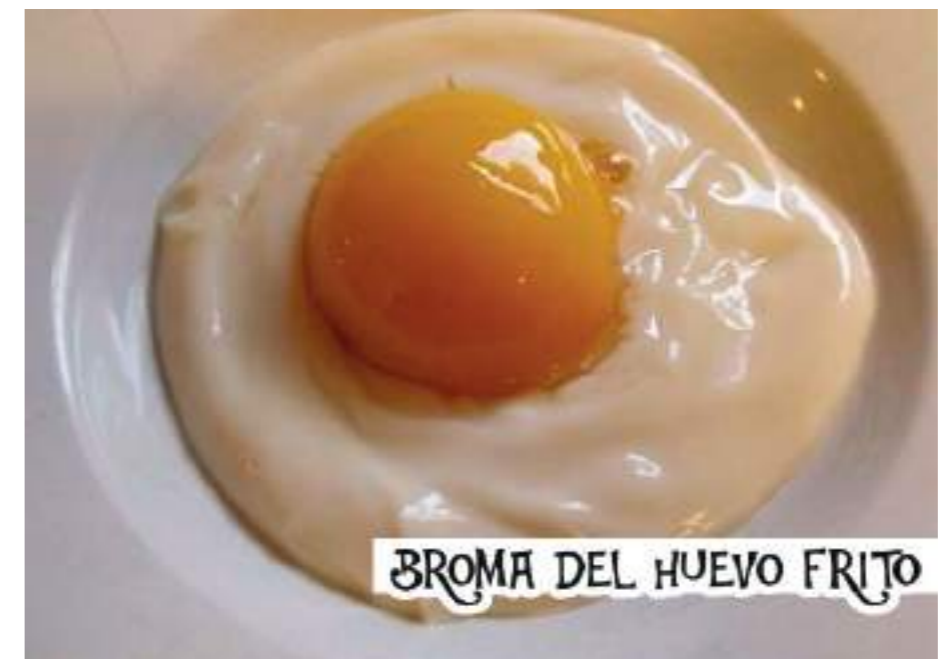
Broma del huevo frito. Se hace con yogurt y melocotón

"Tal vez porque ahora la gente vive más informada, más enterada de las cosas. No es fácil de sorprender ni cogerla fuera de base. Las redes sociales cuentan, anticipan y adviertes las cosas. Antes no