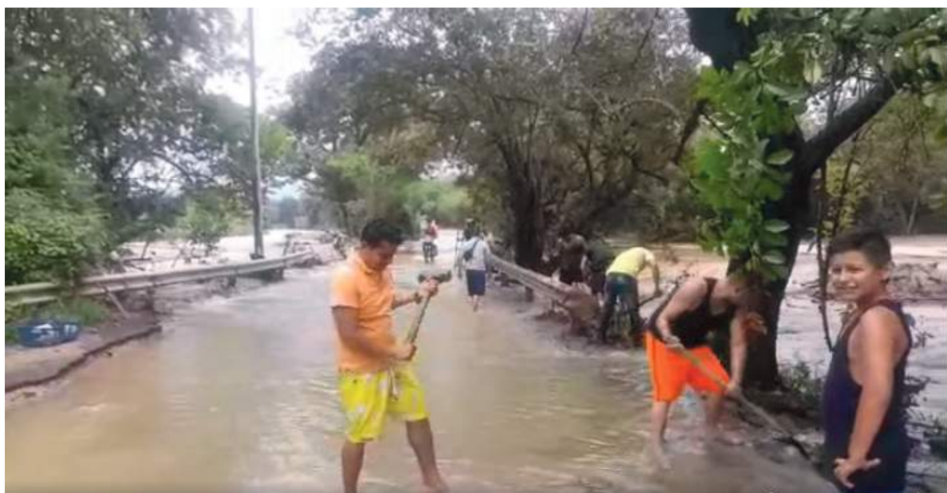
La comunidad aledaña de Puente Amarillo trata de abrir paso a la vía.

“En este momento se está haciendo un dragado a la quebrada con una máquina del municipio de Hobo y una máquina de una empresa privada que muy amablemente nos ha colaborado. Ya llevan tres días acá trabajando en este dragado, estamos también con volquetas, con personal que nos