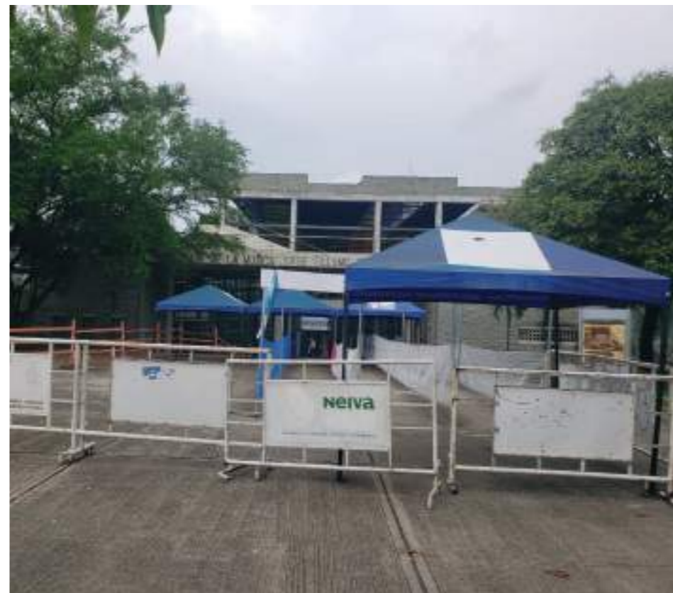
Alrededores del parque la Música de la capital del Huila.