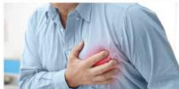
Amiloidosis Cardíaca, viaje al corazón de las enfermedades raras