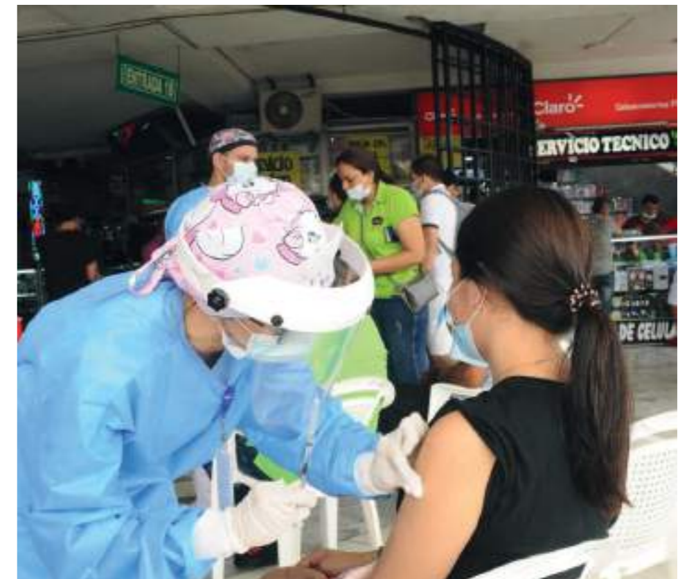
La invitación es a no bajar la guardia.