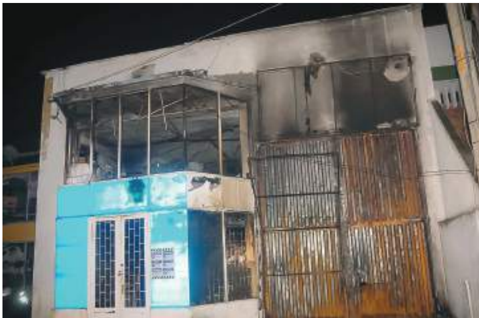
La comunidad que transitaba a esa hora por el sitio se percató de la situación y dio aviso a las autoridades competentes, quienes posteriormente llegaron al lugar la infraestructura consumida por las llamas.

■ Un lamentable incendio se presentó durante la noche del sábado 26 de febrero de 2022, al sur de la ciudad de Neiva, exactamente en el almacén “Los Colchones Más Baratos”, el cual dejó grandes daños materiales, las autoridades competentes tratan de establecer cuáles fueron las causas que provocaron el incendio y las pérdidas cuantificadas.