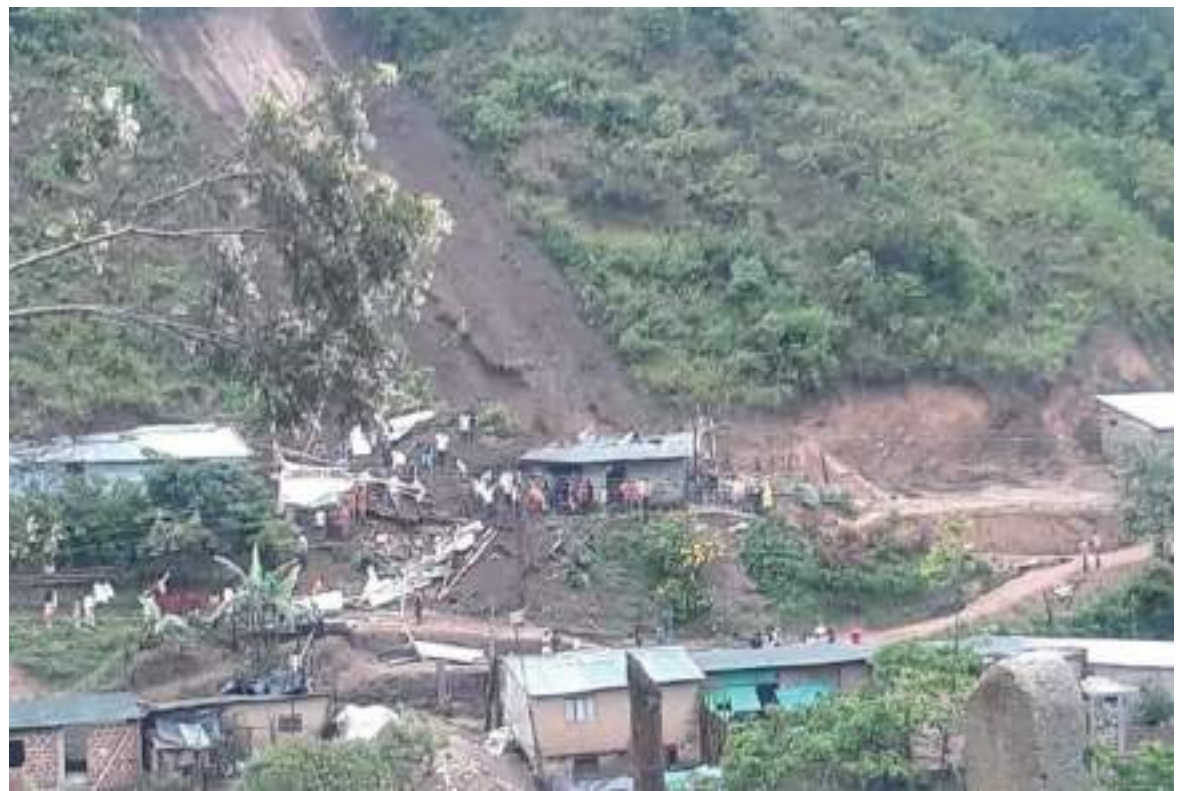
A raíz de las fuertes lluvias registradas en los últimos días en el departamento del Huila, el día de ayer ocurrió una tragedia en el Centro Poblado, Valencia de la Paz.