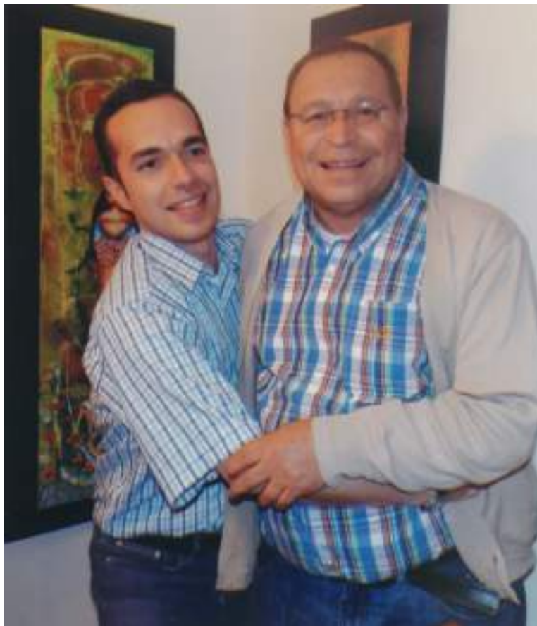
Su vínculo con el Huila lo inspiran en especial los paisajes, la narrativa de José Eustasio Rivera y las canciones de Villamil.