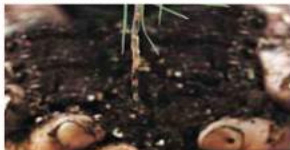
Ecuador promueve la reforestación en reserva de la biosfera