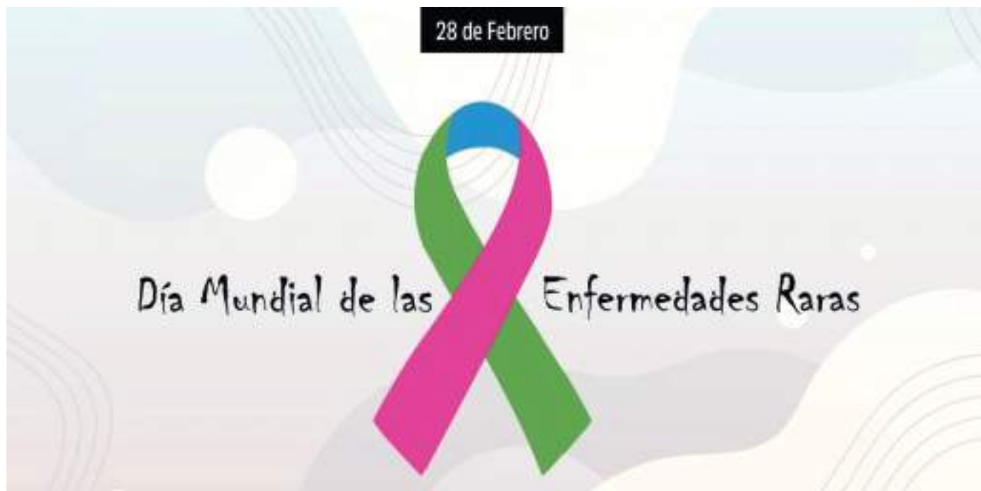
La amiloidosis es una enfermedad poco común. Es un trastorno provocado por depósitos de una proteína anormal (amiloide) en el tejido cardíaco. Estos depósitos dificultan el trabajo apropiado del corazón.

La especialista afirma que, “la incidencia de la enfermedad es variable, dada la gran diversidad