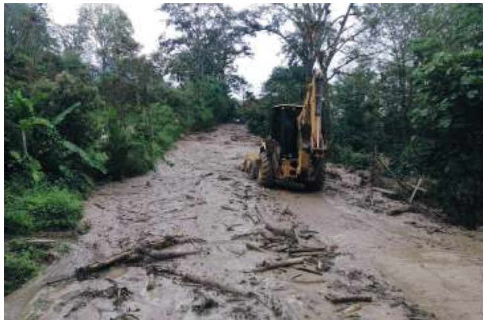
Por ahora, según las autoridades las precipitaciones se prolongarán hasta inicios del mes de marzo y hacen un llamado a la ciudadanía para mantener la calma, tener precaución en cada territorio y estar atentos a la información que lo que sucede en sus contextos.