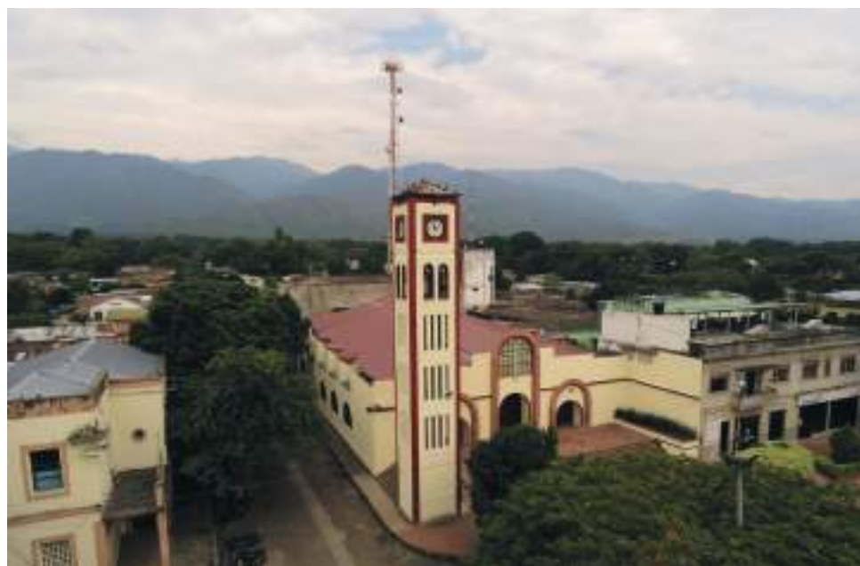
Las autoridades investigan para dar con la captura de los responsables de este nuevo crimen que enluta a la población de Campoalegre.

El Personero hizo la invitación al ente ejecutivo, a las autoridades de Policía y demás organismos es a “redoblar esfuerzos en la lucha contra estos flagelos que tanto hacen daño a nuestros conciudadanos y al buen nombre de un municipio como Campoalegre que en otrora sobresalía por sus aportes positivos y de crecimiento para la región pero que hoy la nota triste son los titulares negativos que de manera frecuente circulan en los medios de información”.