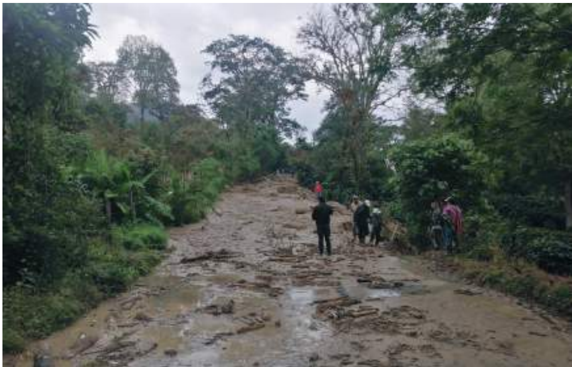
La ciudadanía ha compartido por redes sociales videos en los que se ve cómo el agua afectó automóviles, hogares, motociclistas y como esto impide la movilidad dentro de sus lugares de residencia.

Gestión De Riesgos Y Desastres (CMGRD) reportó adicionalmente 3 viviendas afectadas por deslizamiento con daños parciales en estructuras en el mismo centro Poblado Valencia de La Paz; como también deslizamientos en vías rurales que comunican a la vereda El Chaparro. Situaciones atendidas por el municipio con los Bomberos Voluntarios de Íquira y maquinaria local.