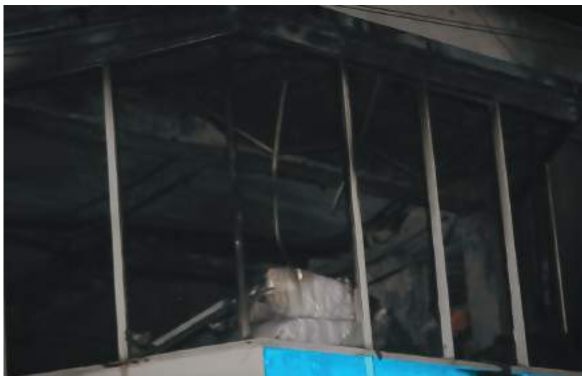
Autoridades competentes tratan de establecer cuáles fueron las causas que provocaron el incendio y las pérdidas cuantificadas.

Por el momento no se ha revisado el inventario y aunque se sabe que las pérdidas son considerables, no se tiene una cifra específica. Asimismo, durante los próximos días se estará develando nueva información de lo sucedido y se establecerá el monto de las pérdidas.