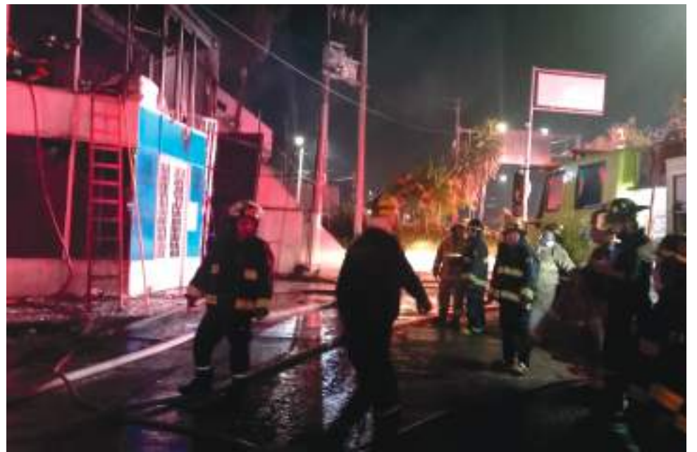
Los organismos de socorro atendieron el hecho que se presentó sobre la carrera quinta y que dejó grandes daños materiales.