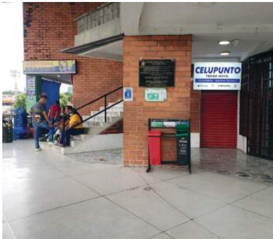
Zona donde funciona puesto de vacunación en los Comuneros.

Debemos entender que el proceso de vacunación tendrá que darse en un periodo que establecerá el Ministerio de Salud, que puede ser de entre seis meses y un año para continuar con la periodicidad.