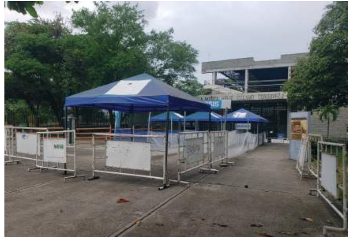
Puesto de vacunación del parque de la Música en Neiva

¿Qué tanto seguimos con los programas de vacunación, será que nos estamos relajando? Las autoridades a nivel nacional, enviaron un mensaje claro en el sentido que debemos seguir cuidándonos y ante todo continuar con los esquemas de vacunación.