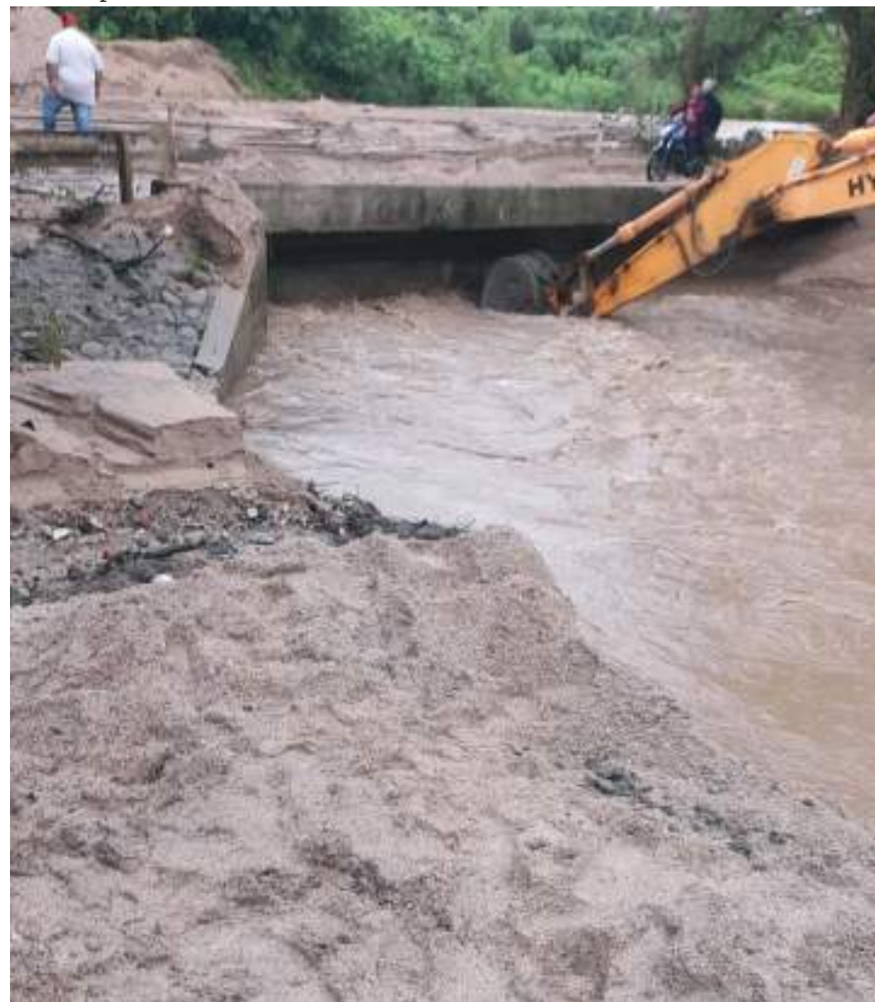
Con maquinaria privada y del municipio de Hobo, se realiza actividad de dragado en este sector, para solucionar de manera provisional la situación.

no Departamental que por favor nos colabore a terminar este dragado, y a comenzar el proyecto de la construcción de un levantamiento”, añadió la ciudadana.