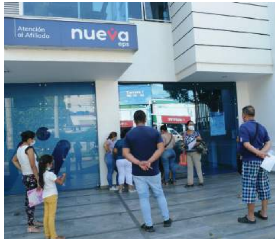
Nueva IPS sede Neiva.