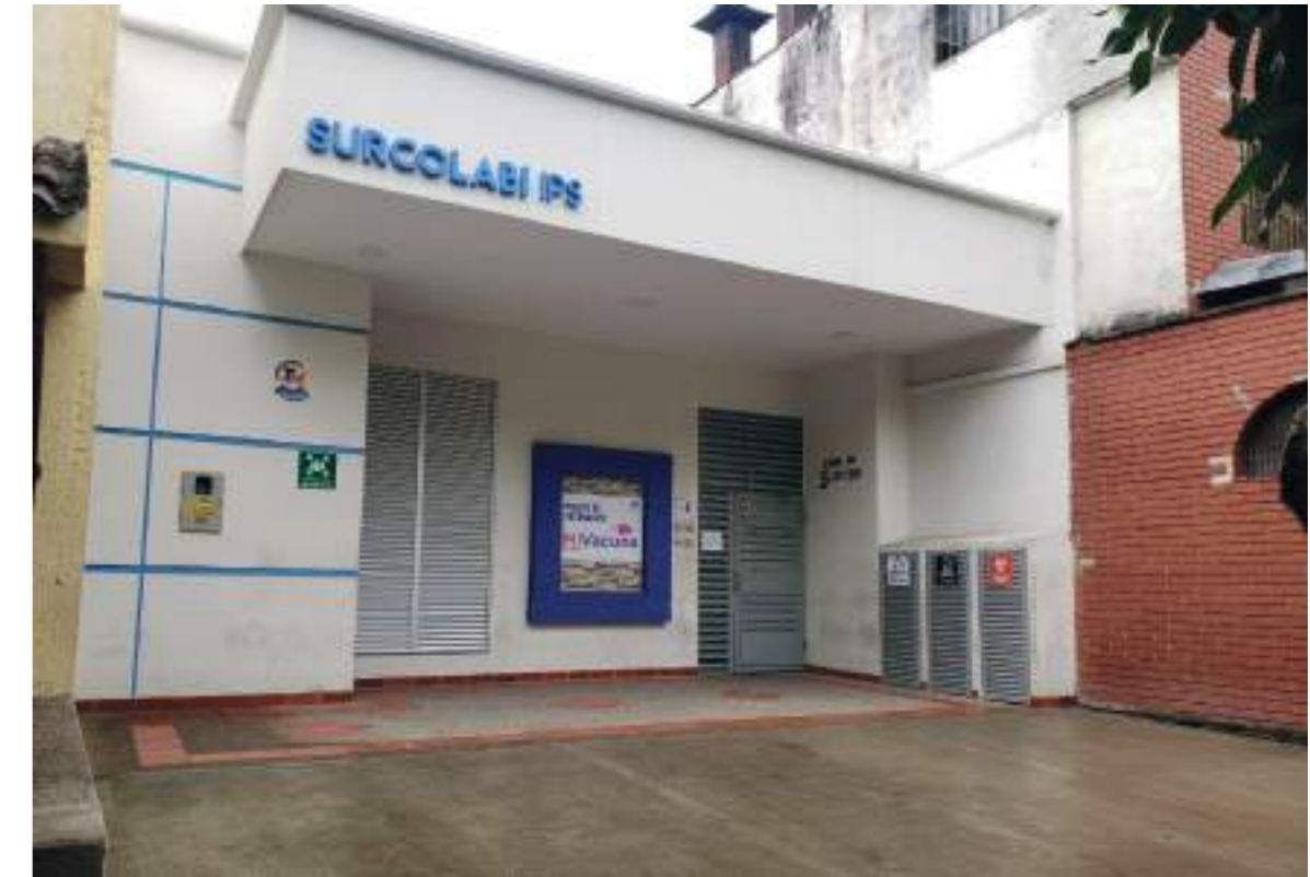
Punto de vacunación COVID en el barrio el Altico.

■ Ese es el balance que encontramos en Neiva al hacer un recorrido por los puntos de vacunación establecidos por las autoridades de salud en la capital del Huila. Nos estamos relajando más de la cuenta, Diario del Huila con la comunidad ante el panorama frente al covid-19