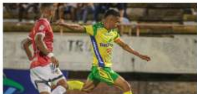
Atlético Huila visita hoy a Atlético de Cali en el torneo Betplay