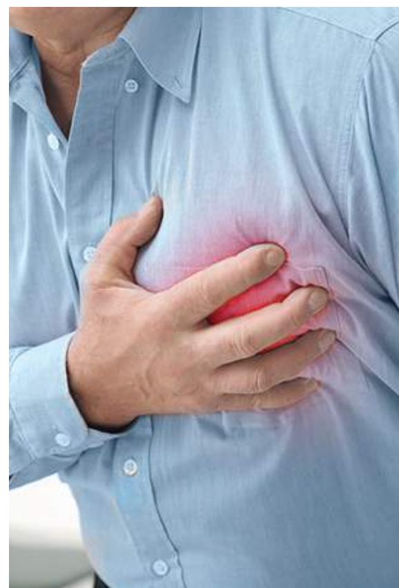
En Colombia se desconoce cuántos pacientes tienen la enfermedad.