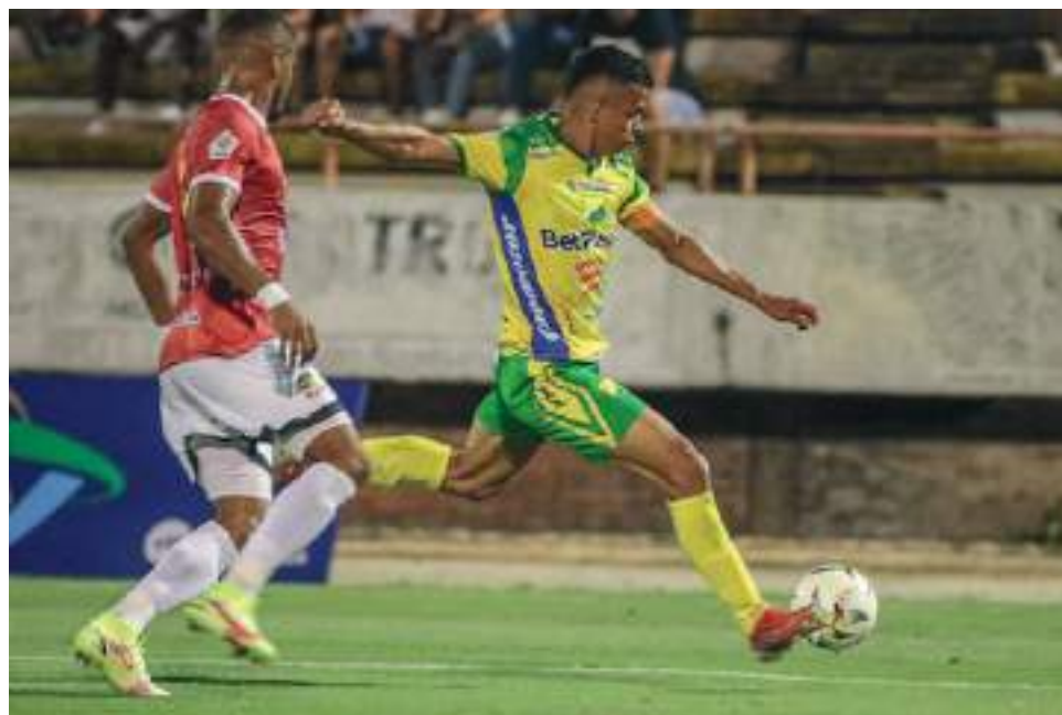
Atlético Huila busca ganar como visitante.

Huila llega motivado tras su clasificación a la siguiente fase de la Copa en la que dejó en el camino a Real Cartagena tras igualar en el juego de vuelta en la ciudad de Neiva y el triunfo uno a cero como visitante en Cartagena.