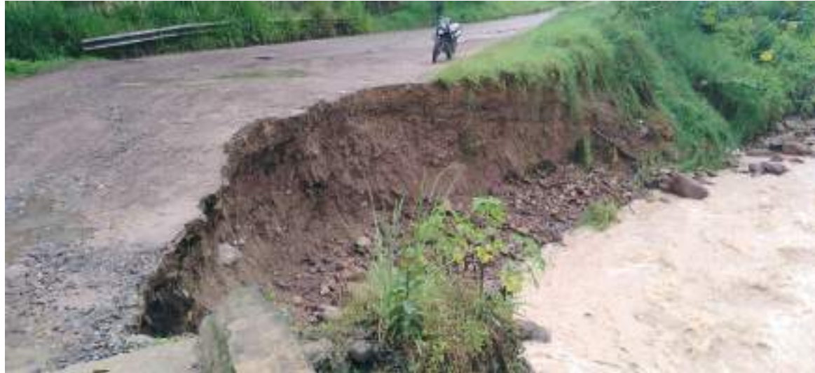
En varias vías de la ciudad los accidentes fueron protagonistas, por cuenta de los árboles caídos.

Por otro lado, la Secretaría de Gestión de Riesgo, informó que “Las lluvias afectaron varias viviendas, incluso la iglesia del barrio Alberto Galindo, en varios asentamientos del norte de Neiva, las viviendas se vieron notablemente afectadas, más de 36 árboles caídos en Neiva, en el sector del barrio Las Granjas un vehículo chocó con una vivienda al perder el control por el represamiento del agua. En sectores como Carbonell y Galindo, dónde se han reportado el mayor número de afectaciones.” Ese es hasta el momento el reporte preliminar del panorama evidenciado hasta