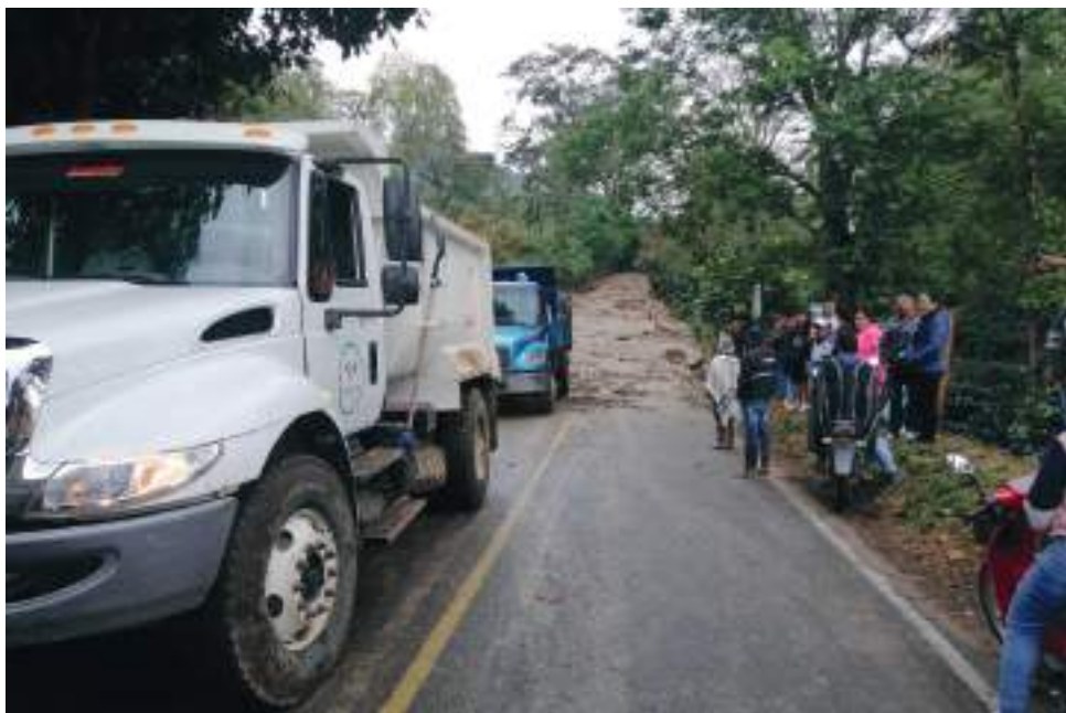
Estragos han causado las fuertes lluvias evidenciadas estos últimos días. Iquira, La Argentina, El Pital, Pitalito, Garzón y Nátaga, son algunos de los municipios que se han visto más afectados por situaciones de emergencias con eventos adversos.

Nátaga: Deslizamientos con posible afectación, aún sin confirmar de dos viviendas afectadas, igualmente comunican reporte de deslizamientos en varias vías. Situaciones pendientes de verifica-