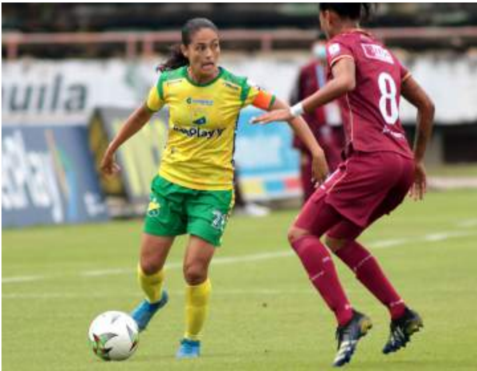
El sexto clásico del Tolima en la Liga femenina se fue con empate.