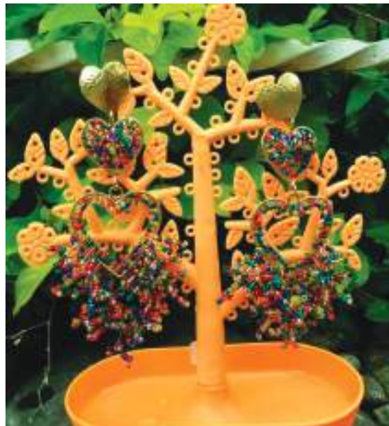
Participa en varias ferias donde ha tenido la oportunidad de conocer otras mujeres emprendedoras.

"Posteriormente, decidí guiarme por la parte de bisutería porque me gustaba más. Y allí fue donde hace tres años me decidí a montar el almacén aquí en el municipio de Campoalegre y empecé de lleno a dedicarme 100% a la elaboración de bisutería tejida hecha a mano.", sostuvo.