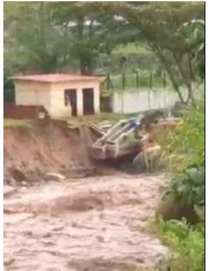
Afectaciones por buena parte del departamento dejan las lluvias del fin de semana.