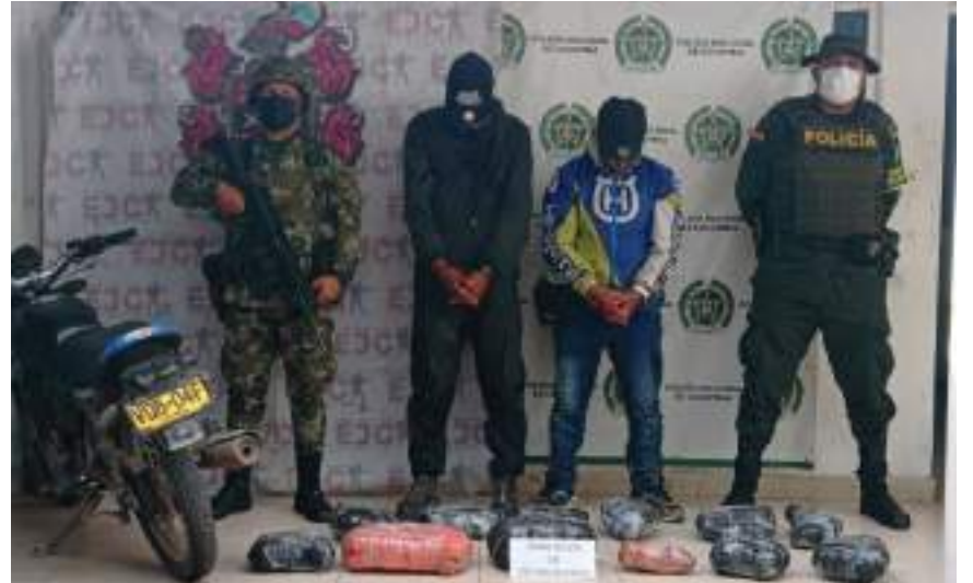
Más de 123 mil dosis entre marihuana, bazuco y clorhidrato de cocaína fueron incautadas.

Así mismo, indicó que durante los planes de registro, control y verificación de antecedentes, incautaron 2 armas de fuego, 3 armas traumáticas, 46 armas blancas, recuperaron 2 motocicletas e incautaron mercancía por un valor superior a los 180 millones de pesos. De igual manera, en la lucha frontal contra el tráfico local de estupefacientes, lograron sacar de circulación de las calles más de 123 mil dosis entre marihuana, bazuco y clorhidrato de cocaína.