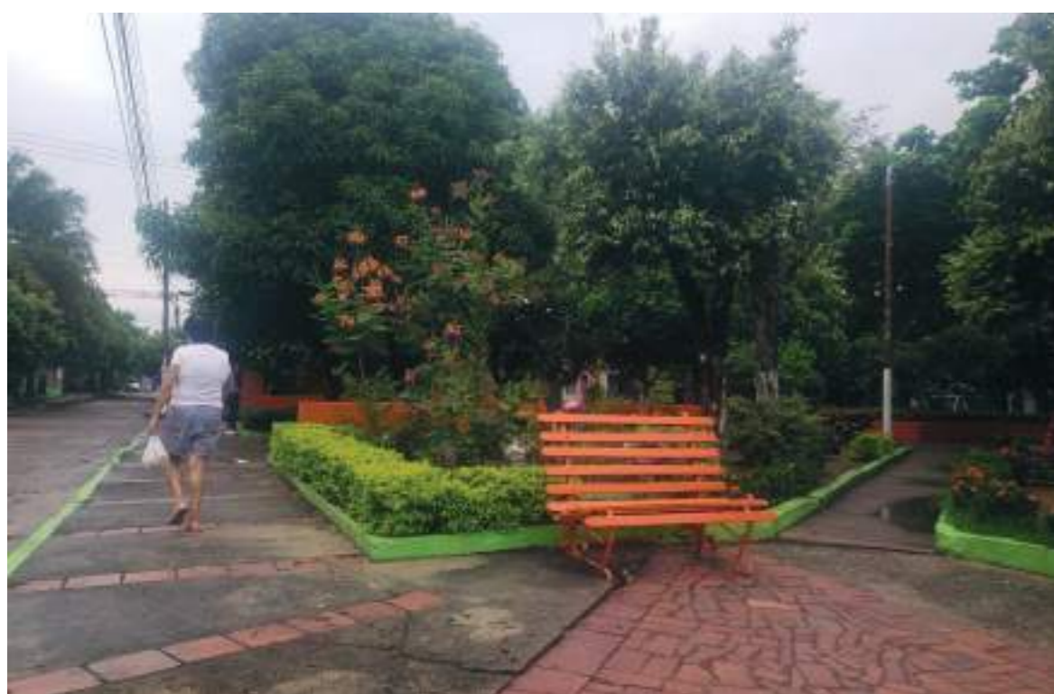
Bien podría llamarse el barrio de los parques.