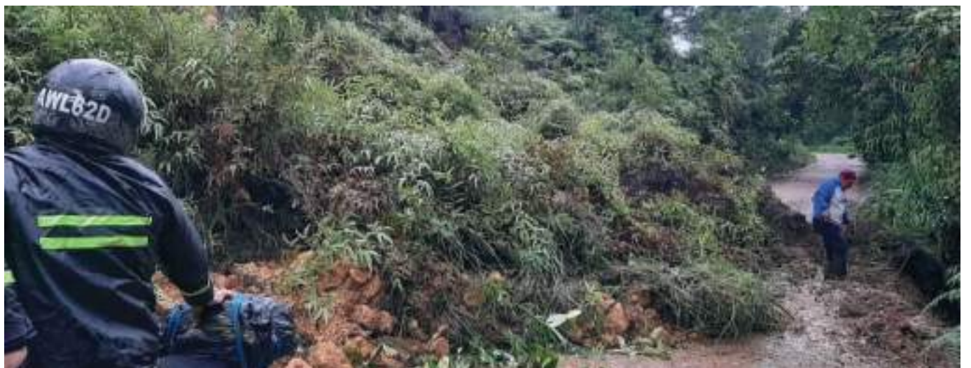
Vías en mal estado en Aipe, impiden el desplazamiento de docentes a las instituciones educativas.

A la fecha, según los docentes, la carretera presenta 4 derrumbes, que no han permitido el paso de ningún vehículo, y están a la espera de que abran la vía para continuar con sus actividades.