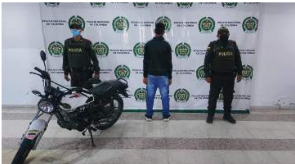
Por los delitos de hurto y tráfico de estupefacientes fueron dejados a disposición de autoridad competente.