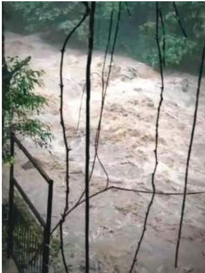
Aumento en el caudal de fuentes hídricas, con el invierno de ayer domingo.