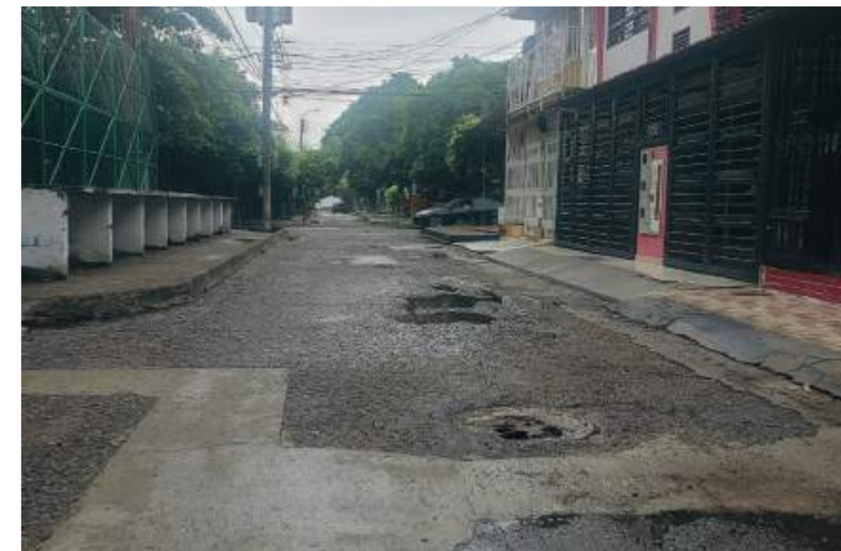
Especial atención requieren las vías en mal estado.

En materia vial, “hay un trabajo de parcheo, de tapar huecos, por qué esos arreglos no duran, son dos o tres meses y vuelven a estar los huecos como al principio, ¿será falta de buenos materiales?; es la pregunta que uno se hace, a que lo que tienen es como un negocio redondo. Sobre esto hay que fortalecer las veedurías e interventorías, no las hay y eso nos deja a la deriva sobre la calidad de las obras que se hacen en la ciudad”, sostiene otros de los vecinos del sector.