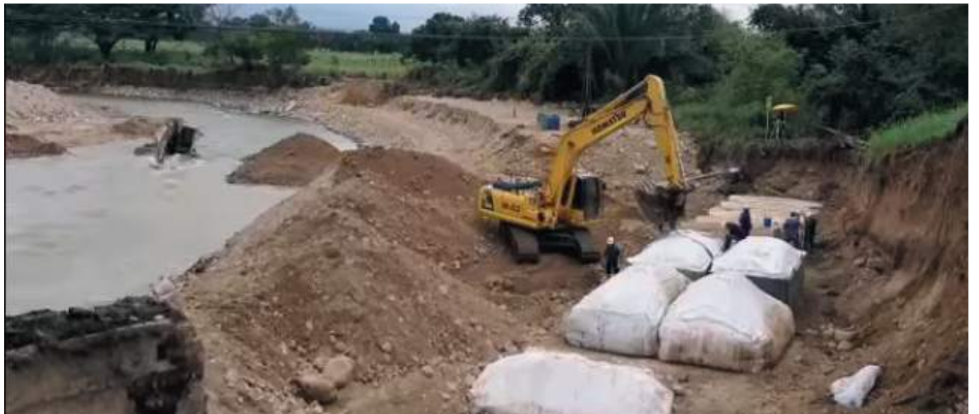
Por ahora, no se conoce una fecha exacta del arreglo completo del puente. Personal de la Concesionaria Ruta al Sur S.A.S., trabaja incansablemente en avanzar con los trabajos de recuperación de la calzada en el PR107+800 del Ruta Nacional 45.

Asimismo, mientras se construye este puente provisional, paralelamente, la concesionaria 'Ruta del Sur' está definiendo nuevas opciones y continúan estudiando posibles soluciones. Igualmente, hace unos días, el secretario de Vías e Infraestructura del Huila, Julio Fierro Garzón, expresó que la concesionaria Ruta al Sur continúa en la evaluación de las afectaciones que habrían presentado no solo el viaducto sino la vía que colapsó, añadiendo además que,