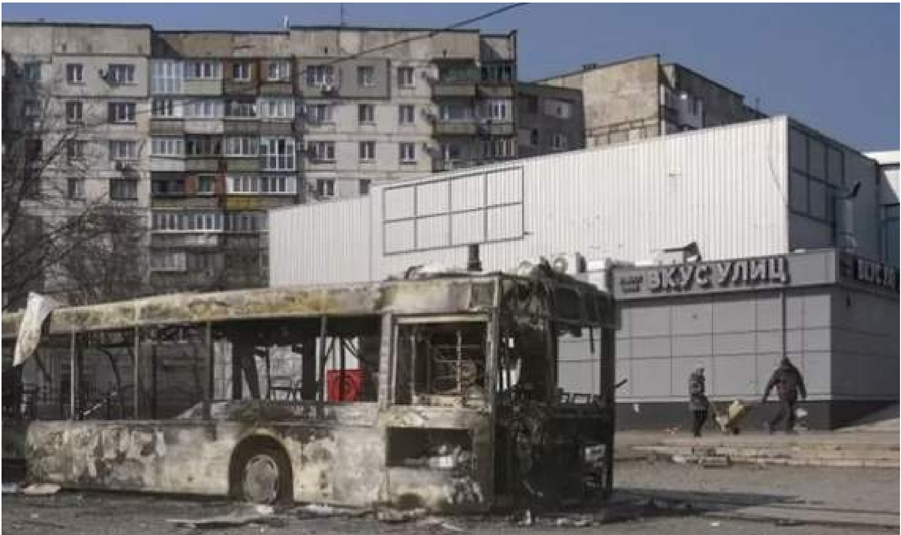
Los bombardeos rusos han devastado a Mariúpol.

■ Ucrania acusó a Rusia de reubicar por la fuerza a miles de civiles de Mariúpol, la ciudad portuaria devastada por los bombardeos rusos.