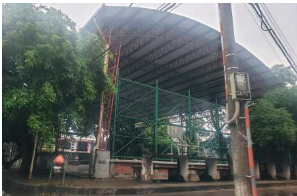
Polideportivo en la entrada del barrio Las Granjas.