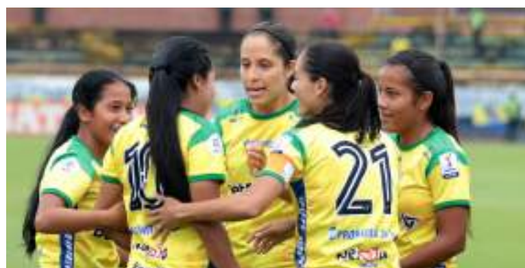
Al final con nueve jugadoras se logró un empate.

Fortaleza y Llaneros, se citaron en el estadio Municipal de Chía, con triunfo por la mínima diferencia para las llaneras, mientras que Atlético Huila y Deportes Tolima, protagonizaron el quinto clásico del Tolima grande la historia, en esta oportunidad, en el estadio Guillermo Plazas Alcíd que se fue con marcador 1 a 1.