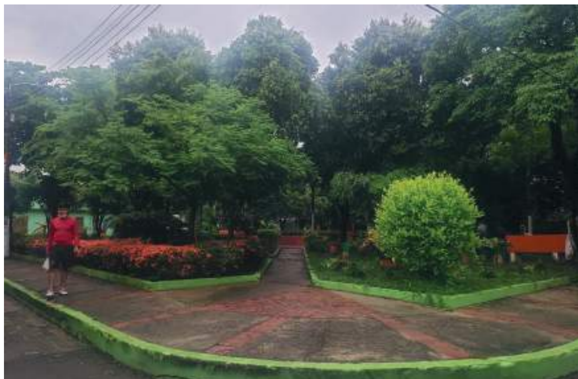
Diez parques, tiene el barrio Las Granjas en la Comuna dos de Neiva.