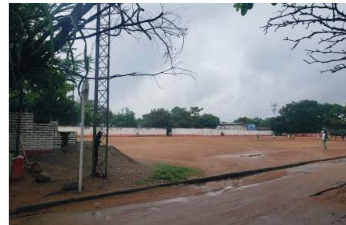
Cancha de fútbol del tradicional torneo que lleva 32 años de vigencia.