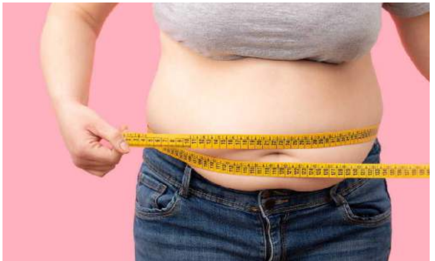
Tomar la decisión y comprometerse con el propósito, es el primer paso.

pósito y el compromiso suficiente para llevarlo a cabo, el CDC recomienda consultar con su médico para que entre a evaluar la condición física del paciente y los factores de riesgo relacionados con el peso. Este será el punto de partida para determinar el estado actual del paciente y lo que se busca allí es evaluar su estado general de salud, en busca de indicadores de riesgo derivados de la obesidad.