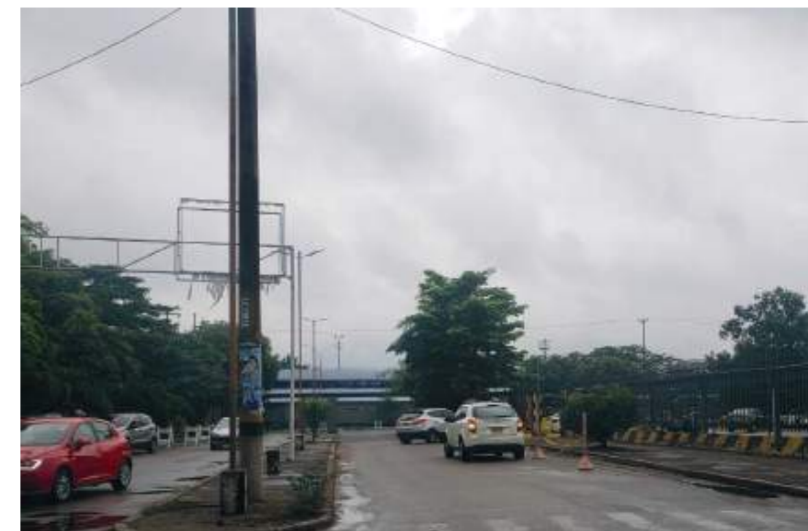
Ingreso al Aeropuerto Benito Salas.