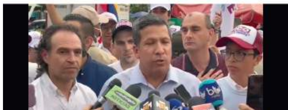
"Es un equipo que respeta mis principios, que apoya mis propuestas y que tiene como propósito unir al país", publicó el exalcalde de Neiva.