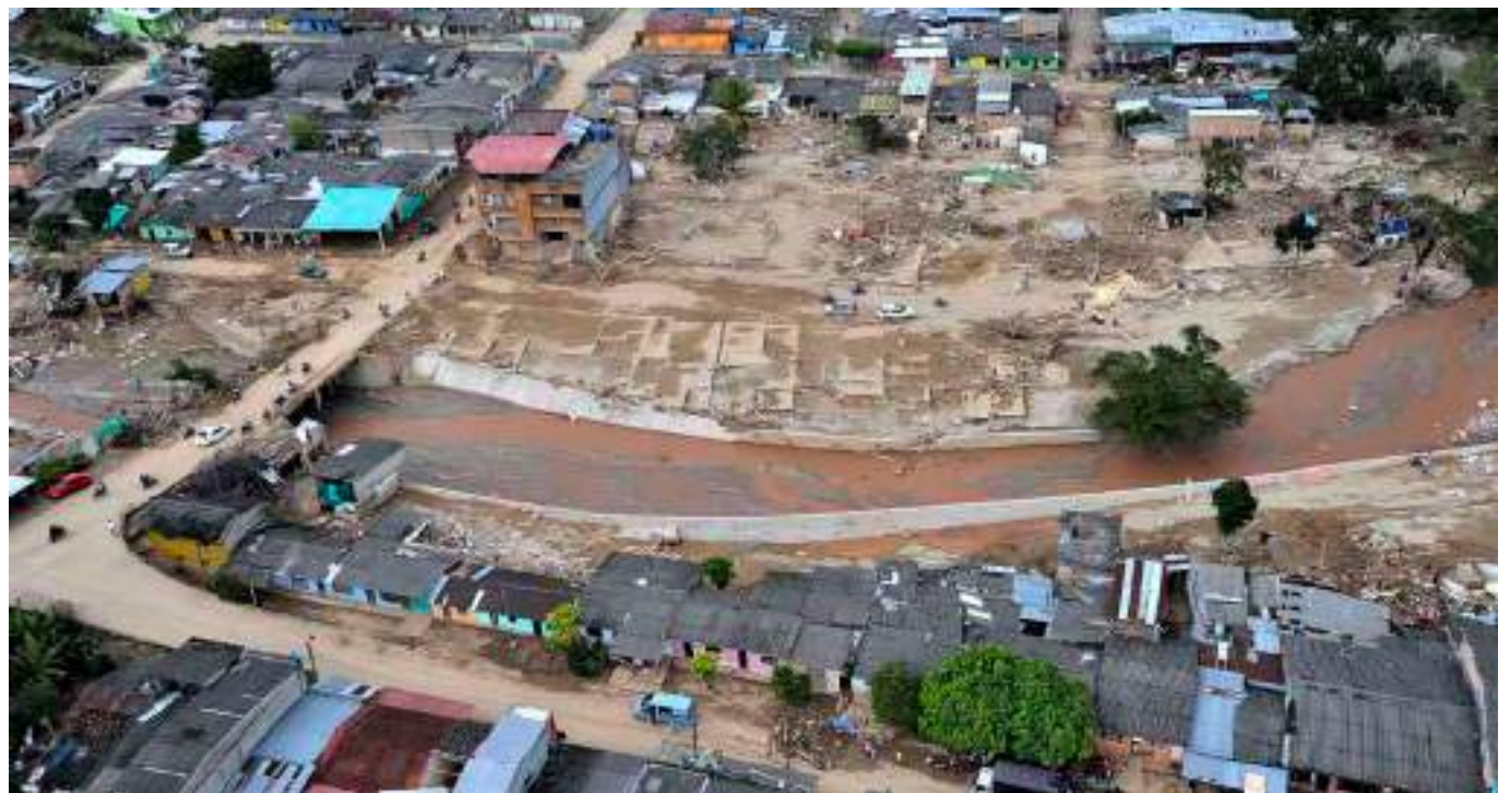
El ente de control indicó que si no se toman acciones que remedien esta situación, es altamente probable que este Programa no pueda ser terminado antes de febrero de 2024.

El control de advertencia de la CGR señaló 7 hechos o situaciones sobre los cuales debe producirse alguna intervención, para que se logre efectivamente mitigar y concluir los proyectos de infraestructura pendientes. Entre estos señala las obras de mitigación en los cauces de ríos y quebradas. En el más reciente Informe del seguimiento permanente, la CGR estableció que las obras correspondientes a la zona alta de los ríos Mulato y Sangoyaco y de la quebrada Taruca, denominadas como obras robustas e indispensables para minimizar el riesgo de crecientes súbitas y de desbordamientos masivos que