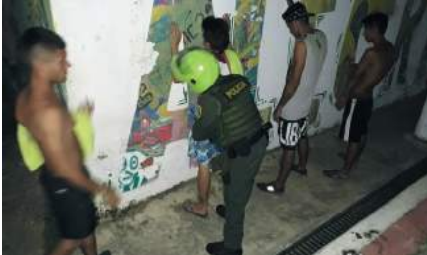
Operativos policiales durante el fin de semana dejaron como resultado la captura de 23 personas en situación de flagrancia y 9 por orden judicial.

Entre las capturas más relevantes, indicó la fuente oficial, se tienen la de 5 hombres por el delito de homicidio y porte ilegal de armas de fuego.