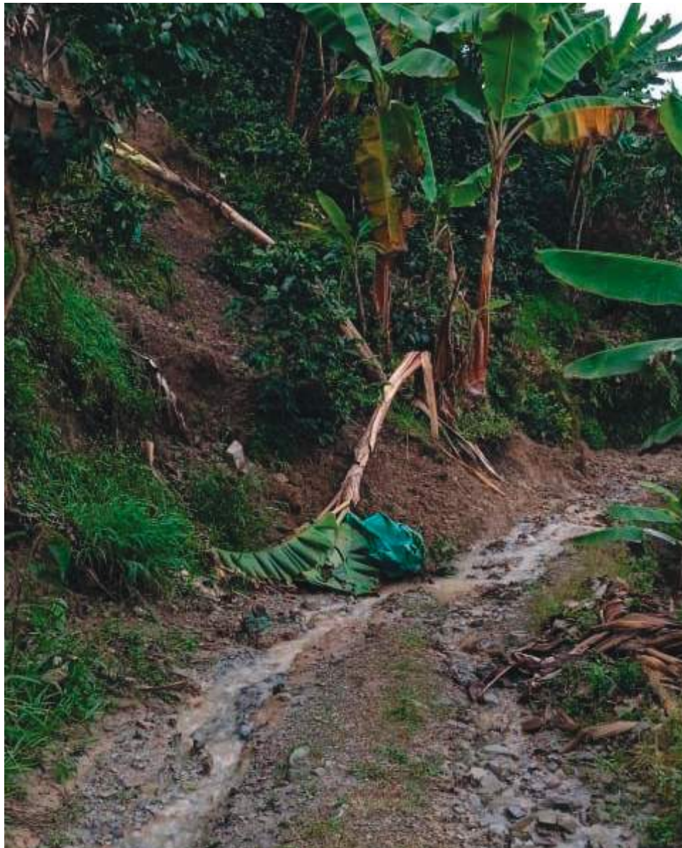
Cultivos arrasados y deslizamientos.

“Lluvias fuertes cayeron pasado el mediodía de este domingo en la zona alta de las veredas de Nilo, dejando afectaciones en el acueducto y cultivos”, indicó.