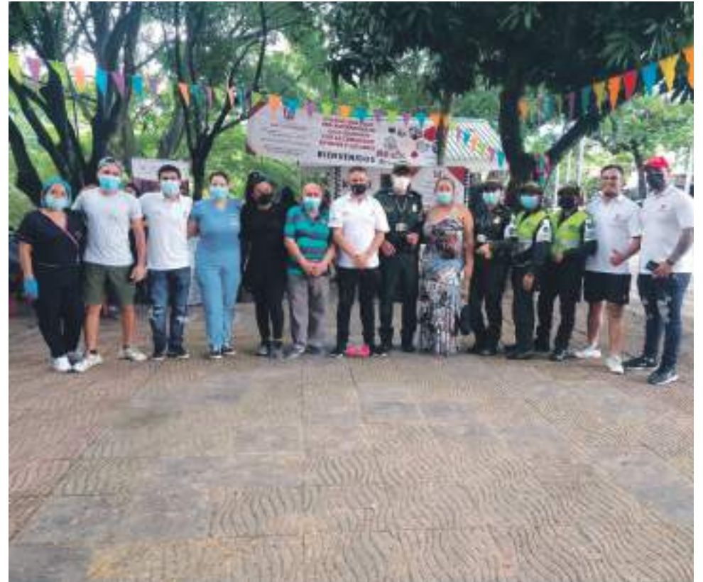
Parte de la organización del proyecto social con Diario del Huila como socio estratégico.

recogió impresiones de quienes vivieron la integración, social, lúdica y deportiva.