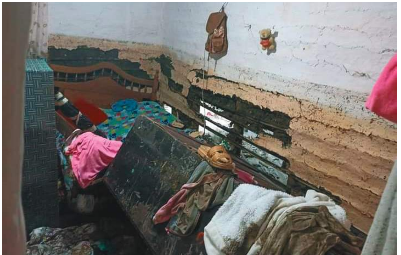
Casi 3 mil personas damnificadas por efectos de las torrenciales lluvias en el Huila.

En varios de éstos municipios como el de Tello, las emergencias se han presentado en un mayor grado de intensidad, al dejar un número considerable de daños y personas damnificadas. En el presente mes de noviembre, las precipitaciones originaron deslizamientos de material vegetal que afectaron la malla vial, incomunicado al centro poblado de San Andrés. Se registraron igualmente derrumbes en varios predios rurales, con daños a cultivos de 240 personas y 19 viviendas afectadas. También en Tello una creciente súbita del Río Villavieja causó daños en la estructura del acueducto municipal y afectaciones en 7 acueductos rurales, 20 vías, 4 puentes vehiculares y 2 puentes peatonales. El balance oficial da cuenta de 1295 personas afectadas y 240 hectáreas de cultivos, principalmente de café y