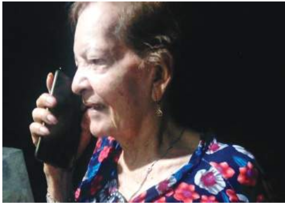
El propósito con el cambio es adaptar la marcación en Colombia a los estándares internacionales, sin embargo, muchas personas aún lo desconocen.

Este cambio se realizó debido a que, hasta hace recientemente, la marcación telefónica era de diferente longitud, dependiendo del tipo de llamada: siete dígitos para llamadas fijas locales, de diez a doce dígitos para llamadas de larga distancia nacional, de doce dígitos de fijo a móvil y de diez dígitos de móvil a fijo y entre móviles. En adelante, todas las llamadas se realizarán con una extensión de diez números.