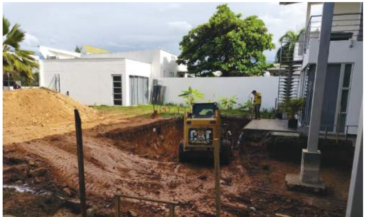
Según cifras del Dane, en septiembre de 2021 el sector edificador superó el millón de personas ocupadas.

En cuanto al segmento No VIS, que son las casas y apartamentos cuyo precio es superior a los $136,2 millones, las ventas en lo corrido del año superan las 54 mil unidades y, además, los