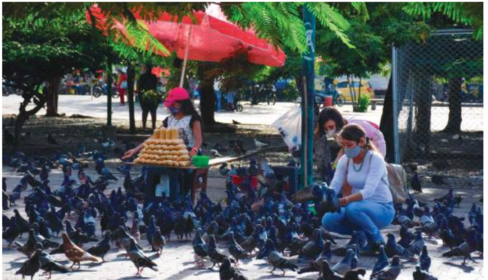
La Sala de Análisis del Riesgo para la vigilancia epidemiológica del evento Covid-19 reportó 17 contagios nuevos en 9 municipios.

Hay 434 conglomerados en el país. Los territorios son: Amazonas, Antioquia, Arauca, Atlántico, Barranquilla, Bogotá, Bolívar,