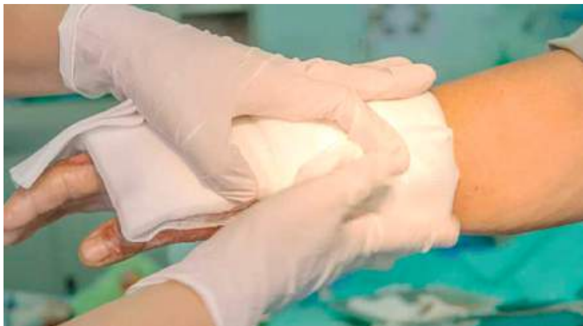
Según la investigación realizada por la Universidad del Bosque, es importante dar un acompañamiento integral a las víctimas de ataques con ácido.

pasado por el Congreso después de varios tropiezos. Esta norma contempla el endurecimiento de las condenas a los agresores; y además, busca sanciones para quienes comercialicen ilegalmente estas sustancias.