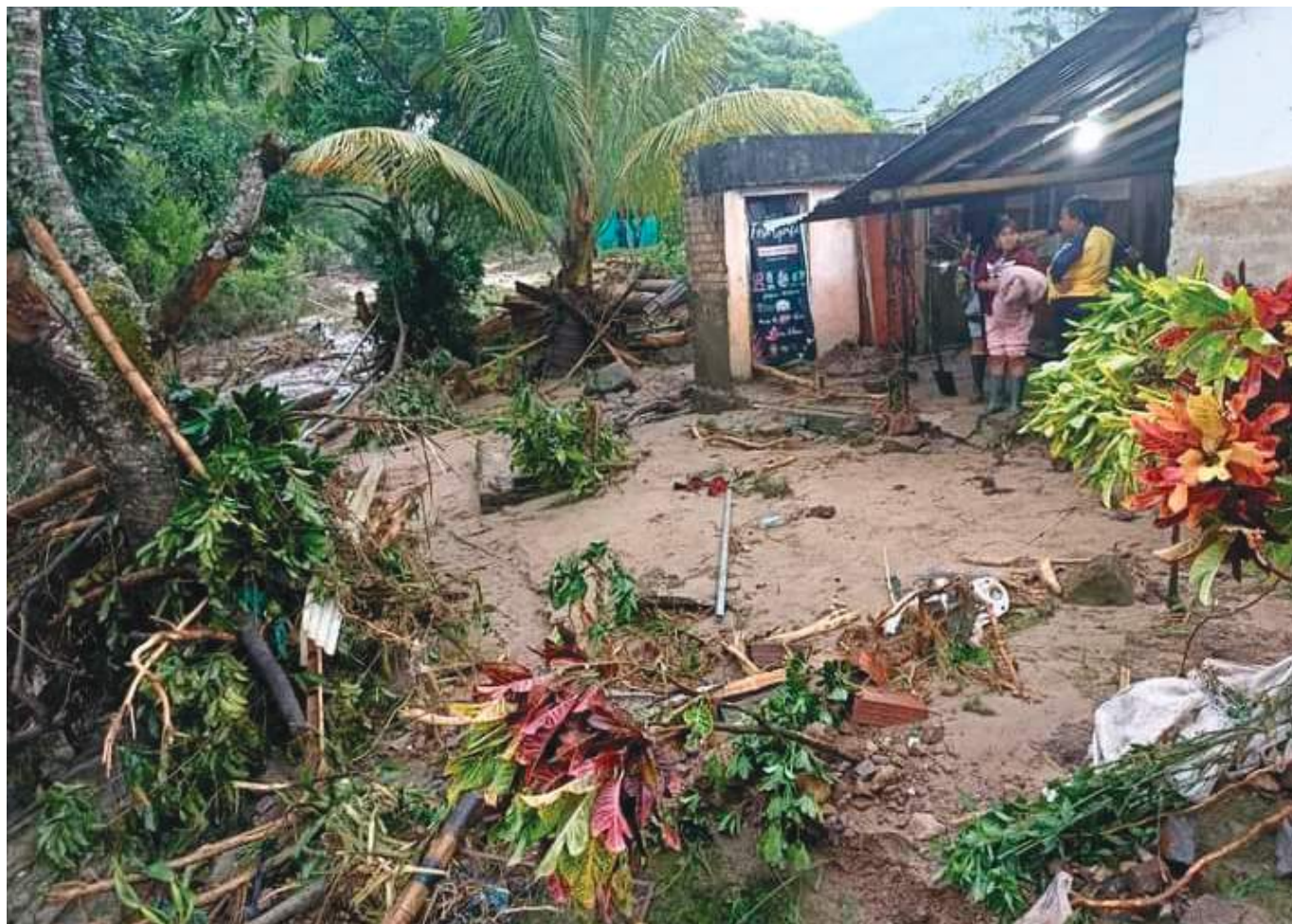
Cuantiosos daños en infraestructura vial dejan las lluvias

“Se dará inicio a la socialización del proyecto de rehabilitación de las viviendas afectadas por la ola invernal, dando respuesta oportuna a todos los municipios que resultaron afectados. Es importante destacar que se irá a beneficiar a 275 familias que fueron reportadas a través de las actas de riesgos municipales reportadas