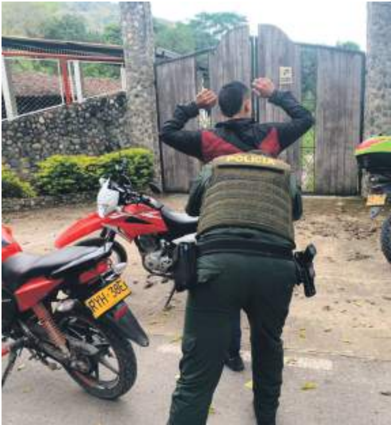
En los planes de control fueron capturadas 14 personas, 3 motos recuperadas y se incautaron 6 armas traumáticas y 1 de fuego.