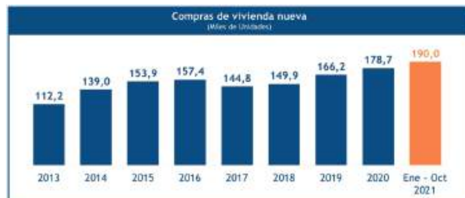
Con 190 mil viviendas comercializadas 2021 ya es el mejor año en ventas de la historia.

Los datos positivos también se han traducido en generación de empleo, según cifras reveladas por el Dane, en septiembre de 2021 el sector edificador superó el mi-