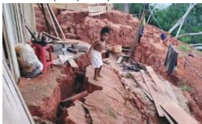
El epicentro se situó a 98 kilómetros al este de la localidad de Santa María de Nieva, distrito de Nieva, provincia de Condorcanqui, cerca de la frontera con Ecuador.

El gobernador regional de Amazonas, Óscar Altamirano, en conversación con TV Perú señaló que hasta el momento no se registran víctimas mortales, ni heridos. Asimismo, agregó que sí se han reportado daños materiales en distintas zonas de la región, donde decenas de viviendas han colapsado y cientos quedaron inhabitables debido a que muchas se encuentran construidas de ladrillos de barro, por lo que es-