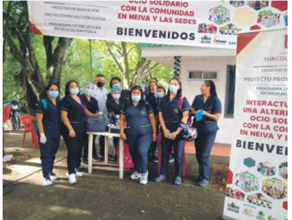
La atención al mejoramiento personal a cargo de la Academia de belleza Paola.