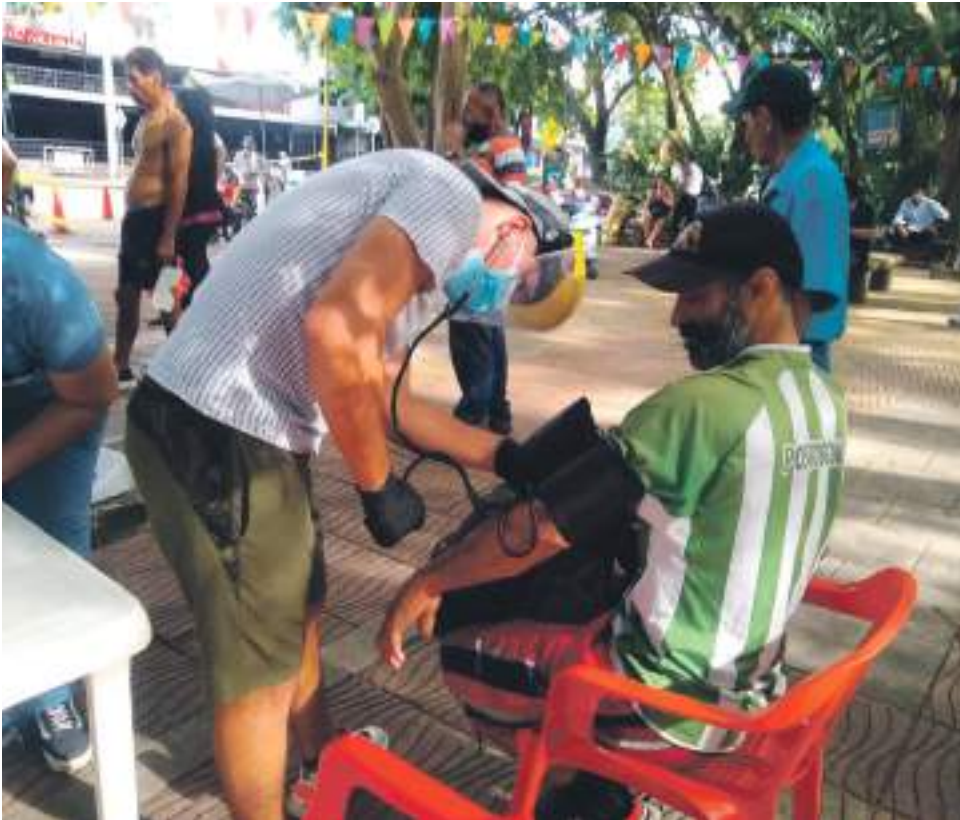
La facultad de la salud prestó atención en toma de signos vitales.