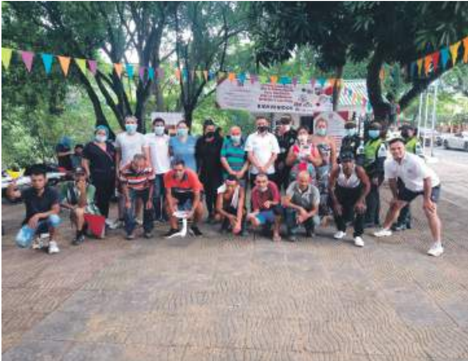
Jornada de clausura de Interactuar Usco en el malecón del río Magdalena en Neiva.

■ Con un evento en el CAI de la avenida circunvalar clausuró actividades en 2021, “Interactuar Usco”. En esta oportunidad la comunidad vulnerable que recibió alternativas de ocio solidario fueron los habitantes de calle en Neiva. Diario del Huila como socio estratégico de este proyecto acompañó el programa de clausura.