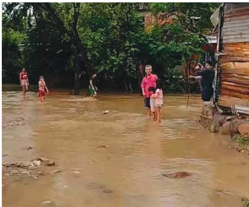
La Plata y Tello, entre los 19 municipios más afectados en el departamento por la ola invernal.

Reportó la UNGRD que, en la línea de viviendas, ya son 8.291 las casas que se han visto afectadas al igual que 306 que han quedado destruidas. En infraestructura, se reporta impacto en 254 vías en todo el país, así como en 44 puentes vehiculares y en otros 23 de paso peatonal. Así mismo, 43 acueductos han sufrido daños, 18 centros de salud y 71 centros educativos.