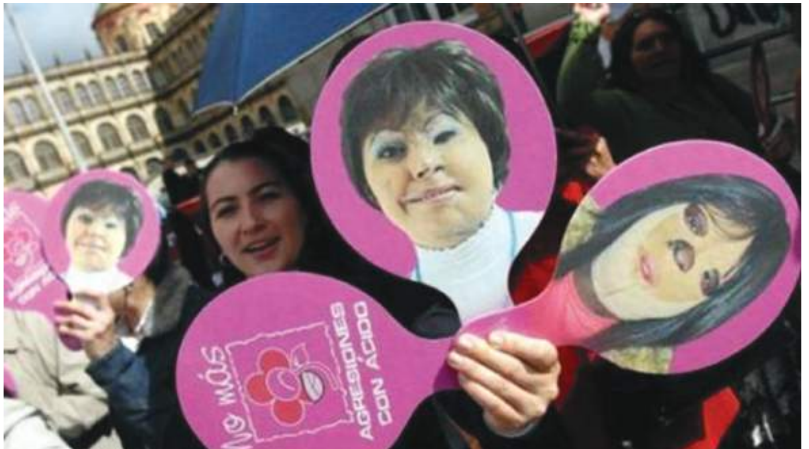
Al menos una persona a la semana fue víctima de un ataque con ácido, así lo reveló el último estudio de Medicina Legal.

Estos delitos tienen pena de hasta 50 años de acuerdo con la ley Natalia Ponce, sancionada el año