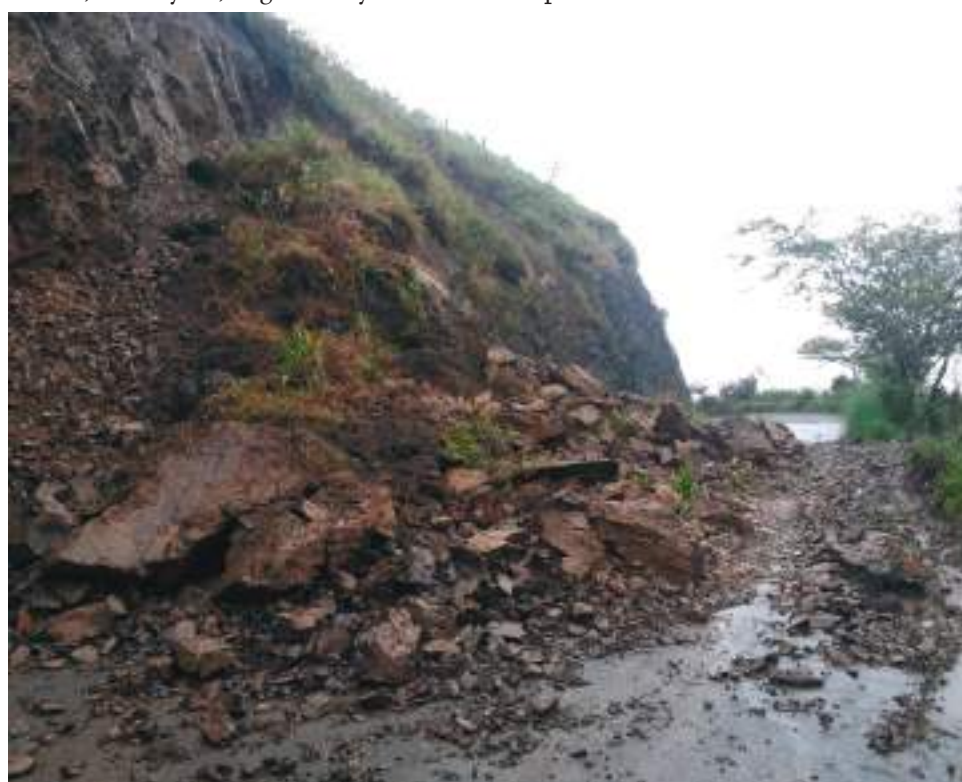
Preliminarmente, unas 320 hectáreas de cultivos de cacao, café y plátano han sido arrasadas.

En unos 19 los municipios huilenses se han registrado eventos de emergencia como inundaciones por desbordamiento de ríos y quebradas y derrumbes. Ellos son Algeciras, Baraya, Garzón, Íquira, La Argentina, La Plata, Neiva, Palermo, Pitalito, San Agustín, Santa María, Tello, Villavieja, Elías, El Pital, Yaguará, Teruel, Timaná y Colombia.