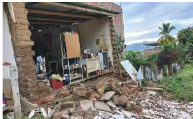
Informan de la destrucción de viviendas en diversos centros poblados y comunidades, como el centro poblado de Tayuntza, ubicado en el distrito de Nieva, provincia de Condorcanqui.

“Toda mi solidaridad con el pueblo de Amazonas ante el fuerte sismo ocurrido. He dispuesto que los ministerios y diferentes instancias del Ejecutivo desplieguen acciones inmediatas. No están solos, hermanos. Apoyaremos a los afectados y actuaremos frente a los daños materiales”, escribió el jefe de Estado.