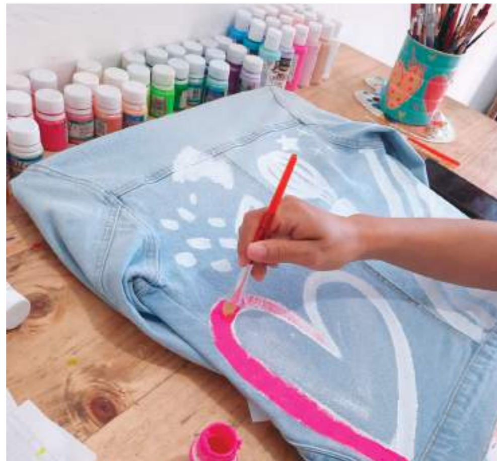
Cada detalle de las prendas de Matiz Color's es hecho con mucha dedicación.

pintado a mano por nosotras, con nuestros diseños, ofrecemos prendas únicas y personalizadas y por supuesto seguimos diseñando y haciendo accesorios.