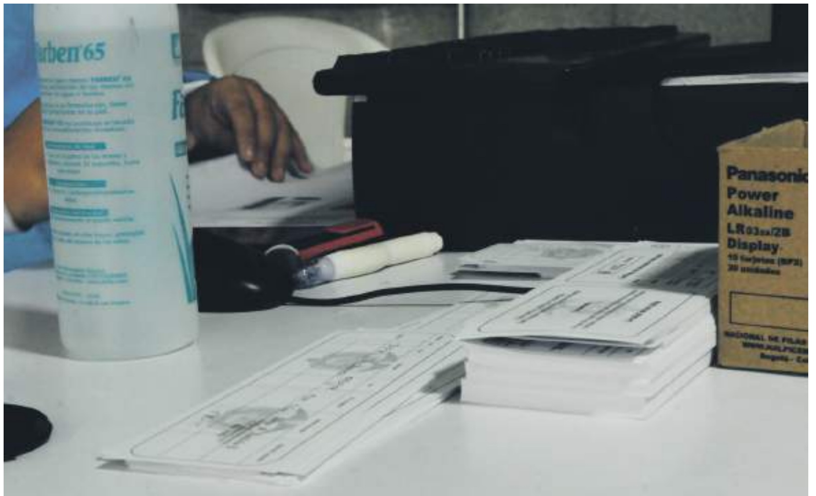
El 16 de noviembre se comenzó a aplicar en todo el país el decreto 442 de 2021, que reglamenta y especifica en qué casos se exigirá el carné de vacunación.

Recordemos que la norma señala que el carné es exigido para asistir a bares, gastrobares, restaurantes, cines, discotecas,