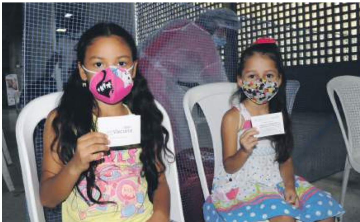
El gobierno nacional ha recibido 1.106 tutelas contra el requerimiento carné de vacunación contra la covid-19.

Los lugares que no cumplan con las medidas de verificación estarán sometidos a sanciones por parte de las autoridades, “a las medidas correctivas establecidas en Código Nacional de Policía y Convivencia, que establece la suspensión inmediata de la actividad”. Así mismo, tenga en cuenta que podría haber una amonestación, multa e incluso el cierre del establecimiento.