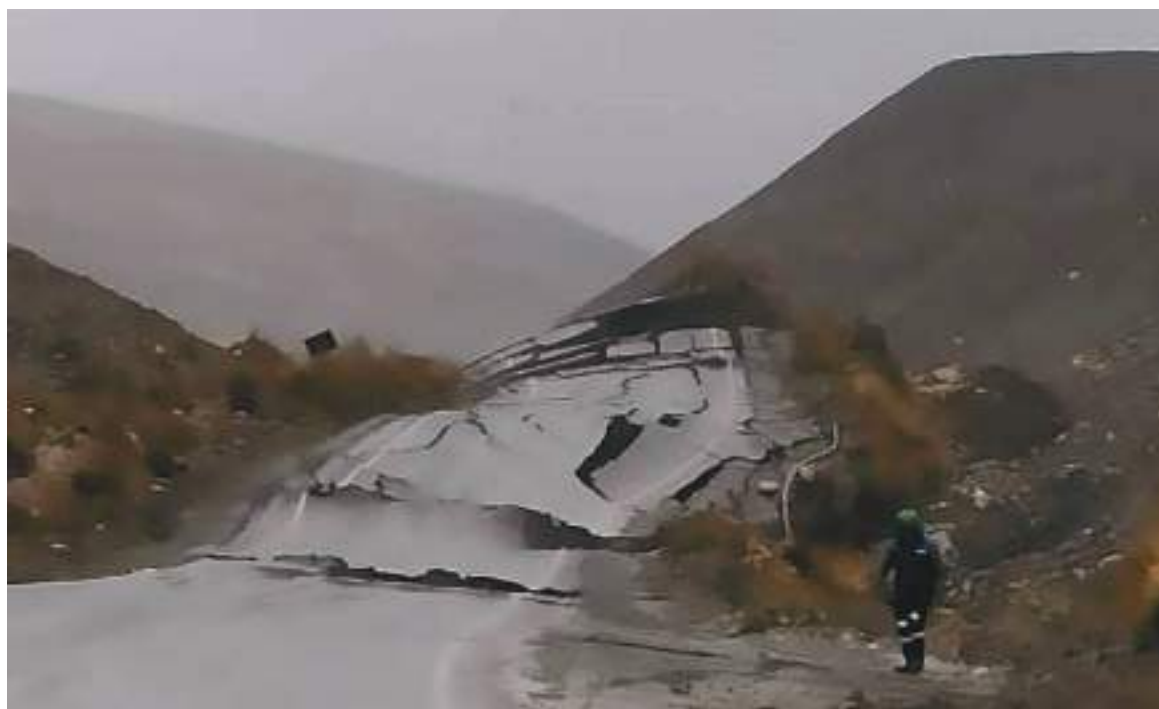
A las 5:52 a.m. (hora Perú) se registró en la región de Amazonas un terremoto de 7.5 grados, según datos proporcionados por el Instituto Geofísico del Perú.

■ Iglesia con 182 años de construcción colapsó, viviendas destruidas y otras quedaron inhabitables. Otras regiones también sufrieron daños.