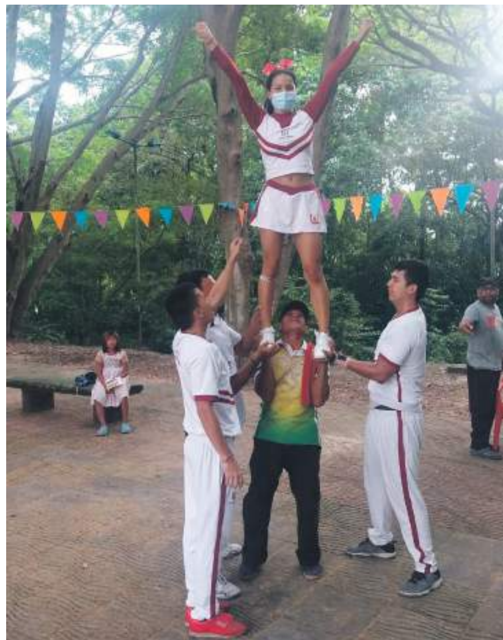
Las porras de la facultad de educación física también hicieron su presentación.

De esta manera Diario del Huila sigue pendiente de todos los programas que involucren a la comunidad en especial a quienes viven en condición de vulnerabilidad dentro de la actividad de tipo social que nos corresponde.