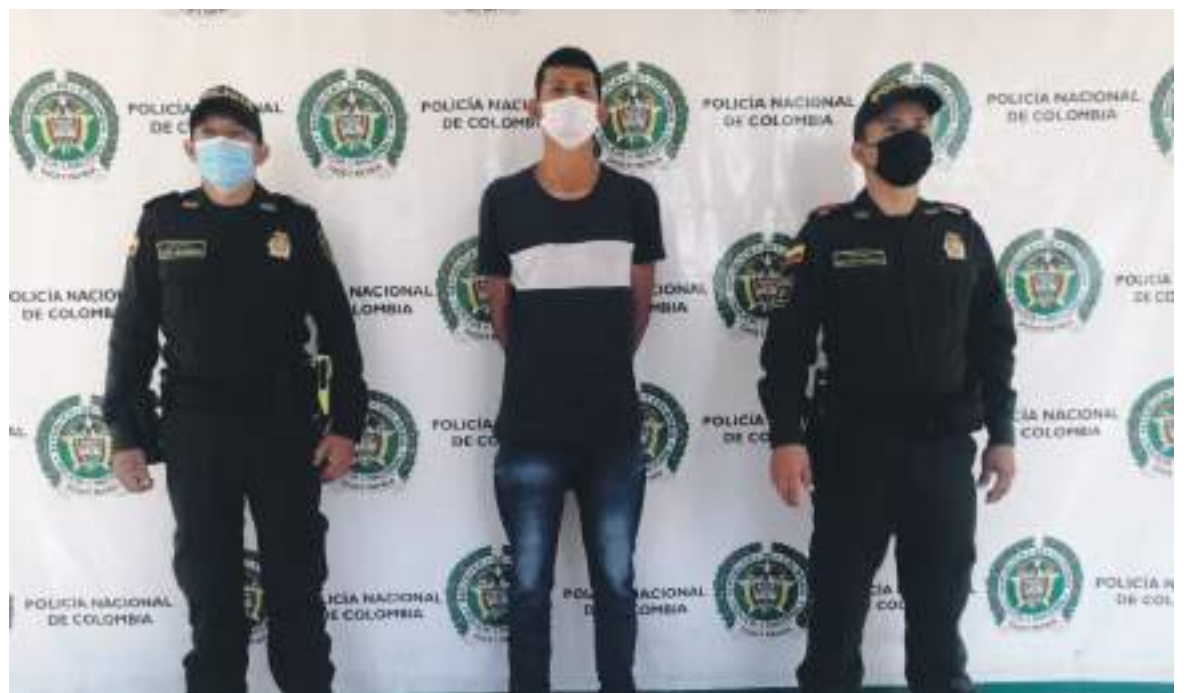
El capturado es dejado a disposición de autoridad competente por el delito de Lesiones Personales, donde un juez de control de garantías le definirá la situación judicial.

La Policía Nacional hace el llamado a la ciudadanía para empleen el diálogo como método para la solución de conflictos e invita a que denuncien cualquier situación que atente contra la integridad de las personas, informando a través de la línea de emergencia 123 o con la patrulla del cuadrante más cercano.