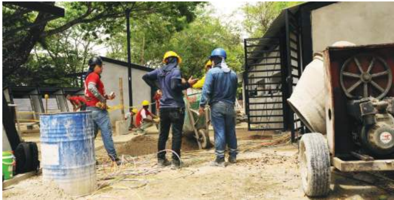
En el área urbana de Neiva, según cifras de Camacol, el número de unidades culminadas fue de 171.

Desde el gremio de la construcción se están preparando para los retos que se vienen para Colombia en los próximos años. Entre estos, lograr que todo el canal de proveeduría e insumos tenga la capacidad y se pueda abastecer, de cara a las proyecciones de nuevas viviendas para los próximos dos años, que asciende a 365.000 unidades. Con esta meta y los 9,4 millones de metros cuadrados