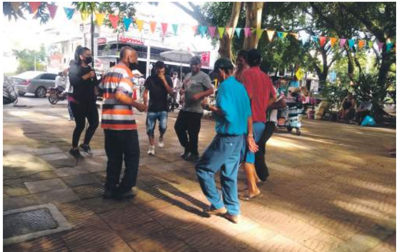
Hubo tiempo para bailar salsa orientada por la representante de la secretaria de deportes de Neiva.

Los protagonistas como ha sido la constante se lucieron con sus participaciones. Diario del Huila que hizo parte del proyecto como aliado acompañó esta jornada y