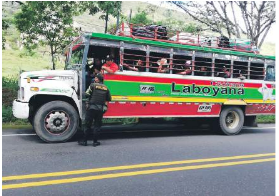
Fue necesario la imposición de 91 órdenes de comparendos, de los cuales, 56 son por comportamientos que ponen en riesgo la vida e integridad de las personas.

Los diferentes planes de registro y de control en establecimientos públicos y la atención de casos