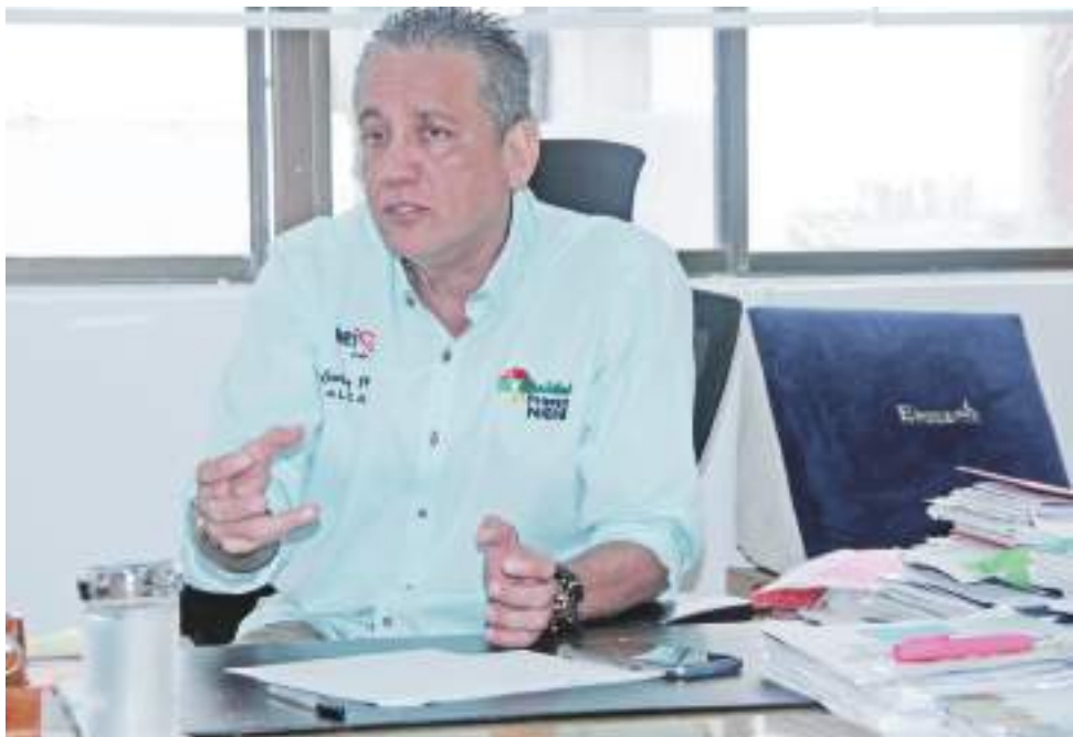
Alcalde de Neiva fue relacionado por el periodista y dueño de Alfa Stereo que lo involucraban con tener nexos con las FARC.

Frente a lo que tiene que ver directamente con el periodista de Alfa Stereo, la tutela sigue dando un fallo improcedente que acobija al medio radial que representa el demandado, sin embargo, “en razón al trámite constitucional de la acción de tutela, se dispondrá exhortar al citado para que en ejercicio de la responsabilidad social del periodismo y como deber ético frente a lo que implica en el conglomerado social como se ha venido analizando y sin pretender calificaciones de censura, se disponga de una labor auto crítica e imparcial y evitar situaciones de polarización en la comunidad sobre información que podría estar afectada de imparcialidad y falta de veracidad” concluyó.