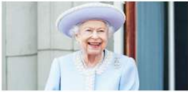
Isabel II celebra 70 años como reina de Inglaterra