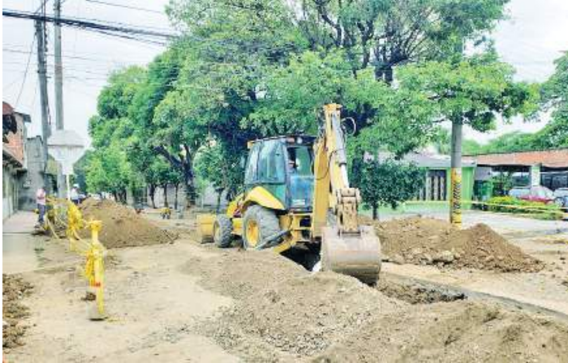
Uno de los frentes de mayor actividad es el de la carrera 13 que lo ejecuta el consorcio K14.