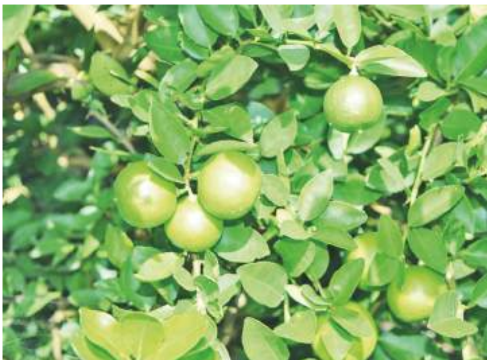
Utilizan paneles solares para mover una motobomba que impulsa el agua al sistema de riego por goteo y fabrican de manera orgánica los abonos, herbicidas y plaguicidas para el cultivo.

“Este cultivo tiene dos años de edad, somos productores orgánicos de Villavieja con insumos que nosotros mismo preparamos en la finca, hacemos fertilizantes, plaguicidas, hacemos herbicidas y diferentes insumos que podemos sacar de acá mismo con los vecinos”