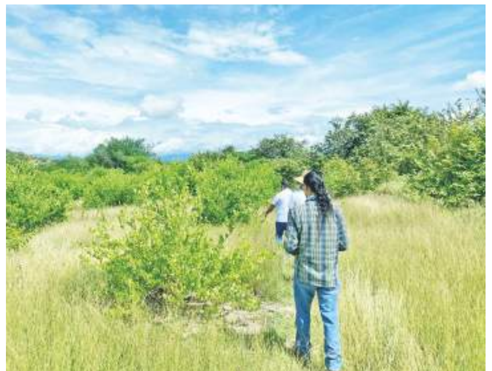
Una apuesta a la ecoagricultura en el departamento del Huila.