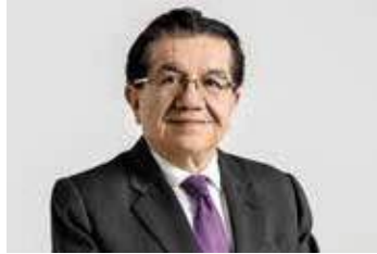
Fernando Ruiz Gómez