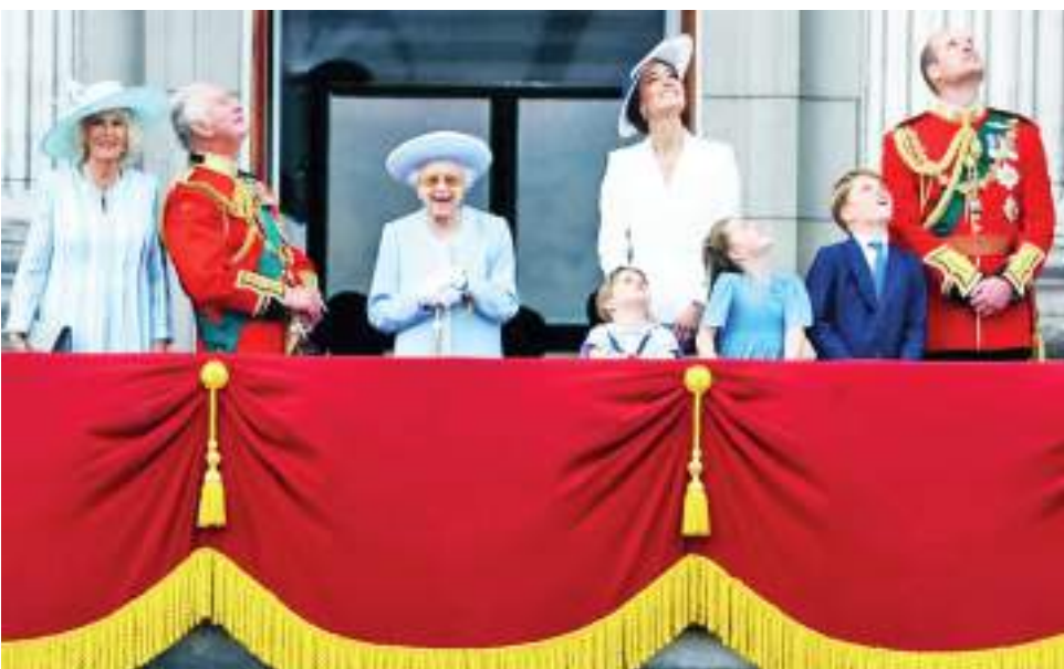
La reina Isabel de Gran Bretaña junto a su familia.

4 de junio: será la Fiesta de platino de la BBC en Palacio. Se trata de tres escenarios en los que estarán Queen (con Adam Lambert), Alicia Keys, Hans Zimmer, Duran Duran, Andrea Bocelli y más artistas que interpretarán sus mejores éxitos en este tributo a Su Majestad. También aparecerán estrellas del deporte y una actuación especialmente grabada de Sir Elton John. Será un espectáculo de dos horas y media cuyo cierre estará a cargo de Diana Ross.