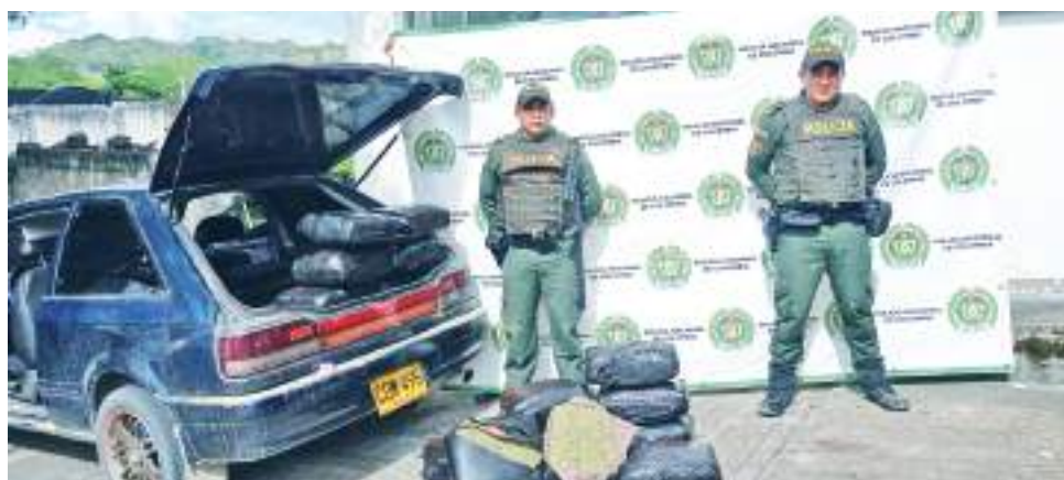
La estrategia de pasar numerosos paquetes en pequeñas cantidades es constantemente contrarrestada por la Fuerza Pública.

Con esta misma modalidad, dos hombres abandonaron en la vía un bolso verde con cuatro kilos de estupefacientes. Así mismo en la vía entre Agrado y el Pital, un hombre abandonó un carro con 160 kilos de marihuana.