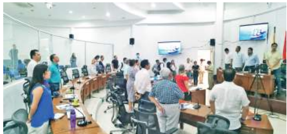
Los concejales deberán tomar serias decisiones frente a varios proyectos que se presentarán por medio de la Alcaldía Municipal.

Ahora bien, “así estará de grave la corporación que a estas alturas del año no han podido ni siquiera elegir al menos su secretario. Esto enmarca la ausencia de madurez política y administrativa que ha caracterizado al concejo de Neiva. Un proceso limpio, con una universidad decente, hubiera bastado para evitar todos los enredos en los que se han metido”, concluyó.