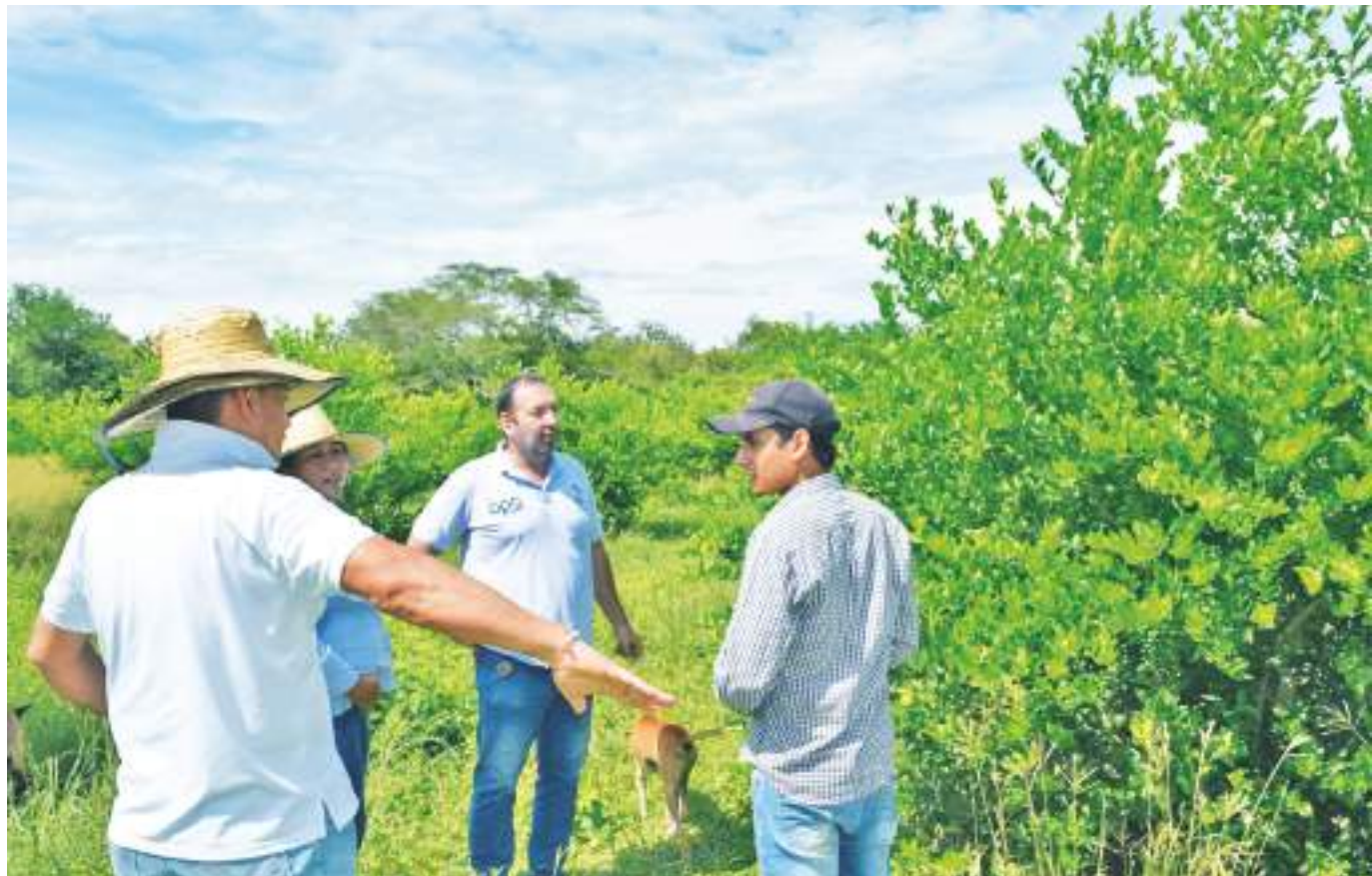
El cultivo del limón está ubicado en la vereda Cerco de Piedra en Villavieja.

Actualmente estos jóvenes agricultores están analizando la posibilidad de implementar un sistema inteligente con una empresa huilense que les permita analizar en tiempo real las zonas que están siendo regadas, durante cuánto tiempo y operar todo desde el celular.