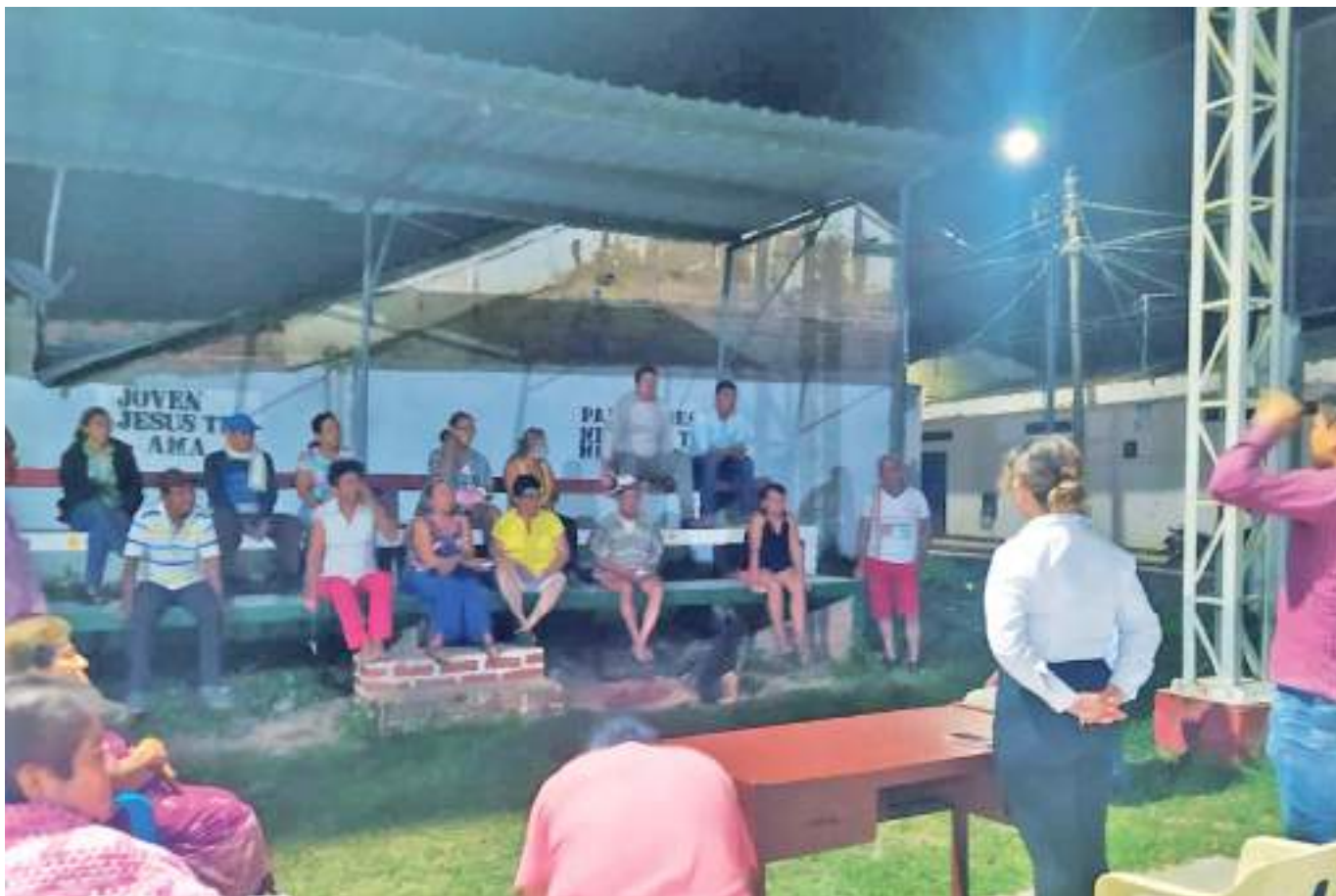
Al buzón de sugerencia no llega ninguna queja o inconformidad, y la mayoría de personas evidencian su descontento a través de diversas redes sociales.

Aunque este ha sido un problema latente en el municipio, actualmente se adelantan acciones para garantizar un servicio idóneo para toda la comunidad.