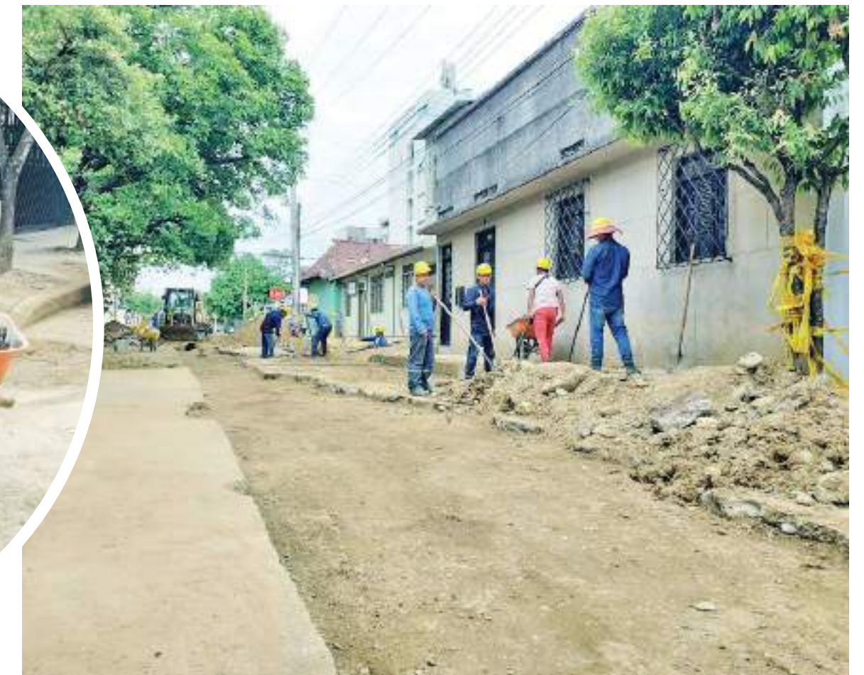
Son varios los trabajadores entre ingenieros, maestros y ayudantes los que laboran en la obra.

Uno de los frentes de mayor actividad por la magnitud de las obras es el que atiende la reposición de alcantarillado entre la Avenida La Toma y el barrio el Altico por la carrera 13.