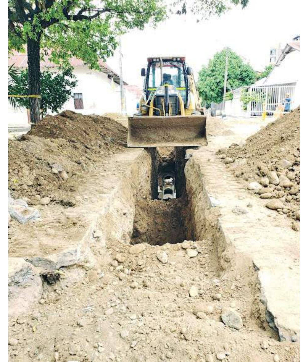
En las intervenciones se utiliza maquinaria pesada.