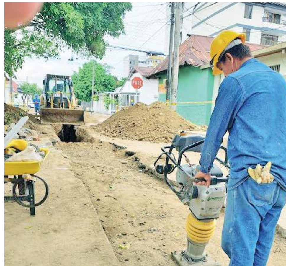
Dejar la vía en buen estado es parte del compromiso del contratista.

El anuncio lo hizo Las Ceibas dejando en claro que la suspensión de las obras se hará, pero con la salvedad de dejarlas funcionales; esto quiere decir "sin problemas de movilidad".