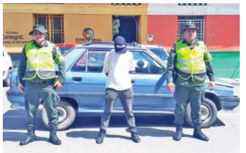
Por el delito de receptación será judicializada esta persona.

La Policía anotó que este vehículo fue hurtado el pasado mes de mayo del año 2019 en el municipio el Espinal, Tolima. Así las cosas, los uniformados procedieron a su captura, siendo dejado a disposición de un juez de garantías, para que defina su situación jurídica.