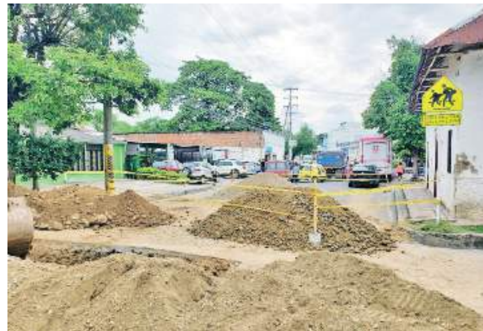
La zona es de mucha actividad comercial y de movilidad en la ciudad.