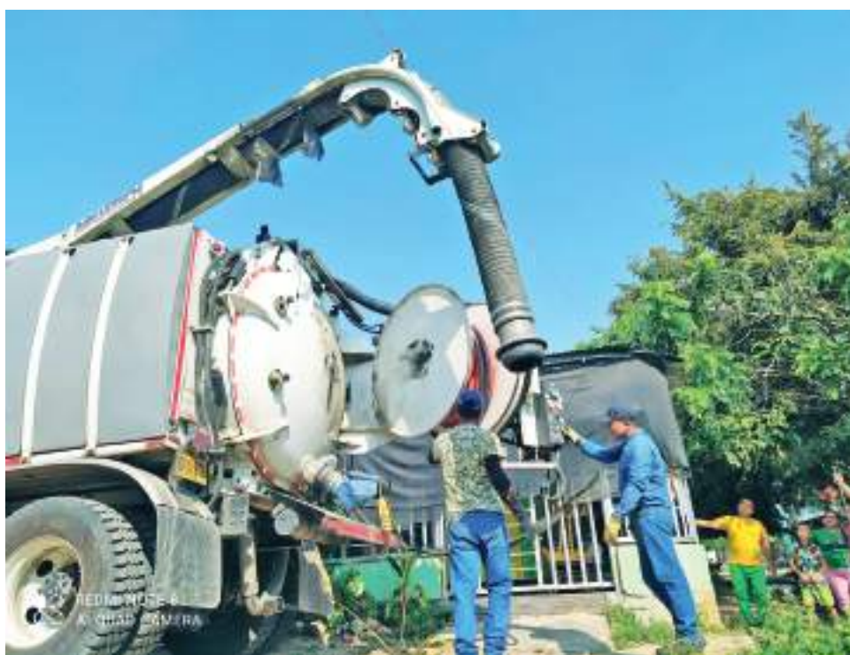
La empresa de servicios públicos indicó que vienen trabajando de manera ardua para ampliar la planta y así poder pensar en unos meses cumplir con el servicio completo y constante.

Explicó también que el municipio de El Hobo ha crecido exponencialmente en muy corto tiempo y, por esa razón, la planta que existe no da abasto para