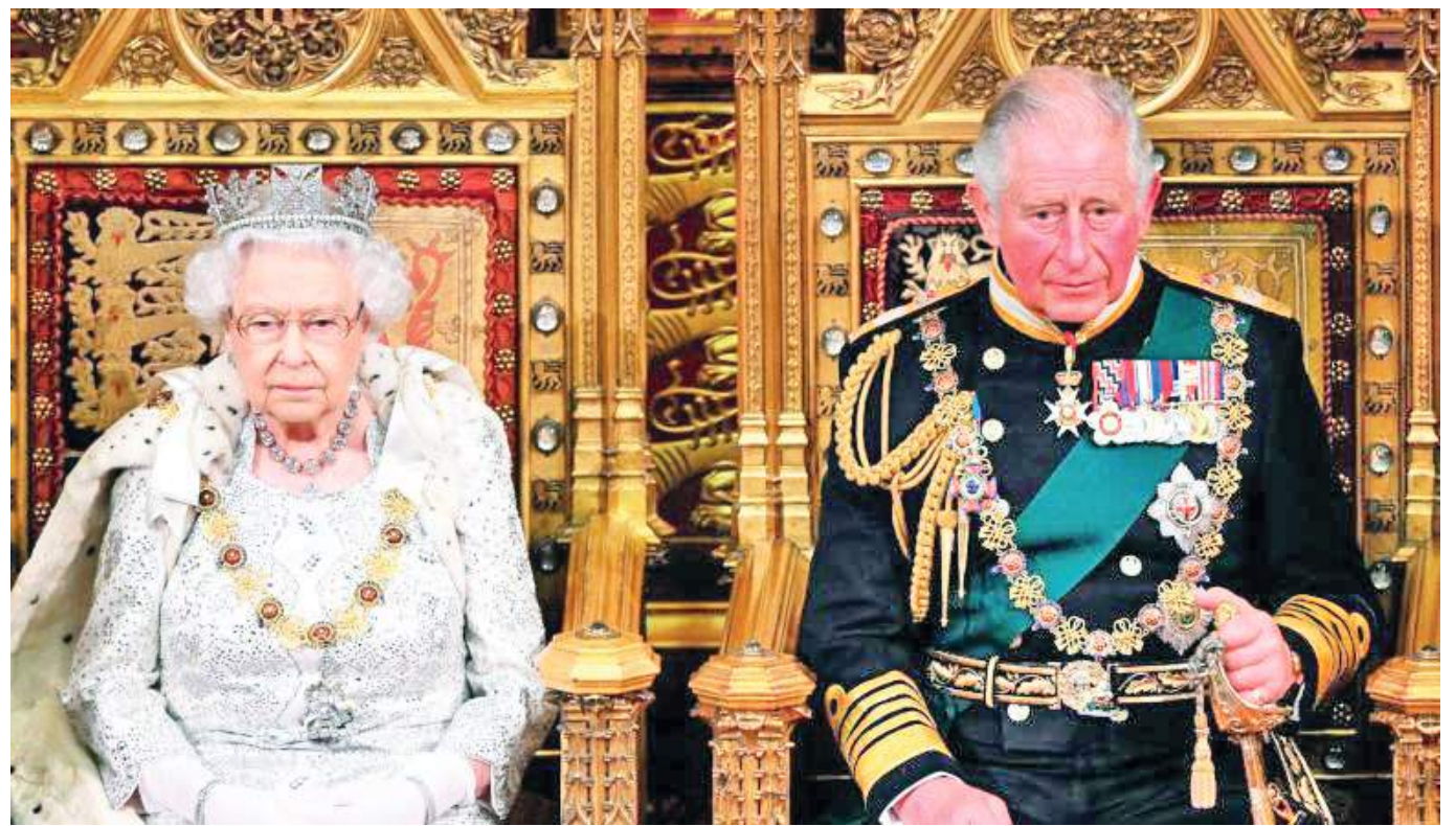
La monarca inglesa comenzó la celebración de su jubileo de platino, siete décadas como reina de Inglaterra. En la imagen con su hijo Carlos, sucesor al trono.

Esa imagen recia y saturada de frialdad la ha acompañado en momentos claves, pero a la vez en los más difíciles de su reinado, uno de ellos cuando falleció la princesa Diana, por el que fue