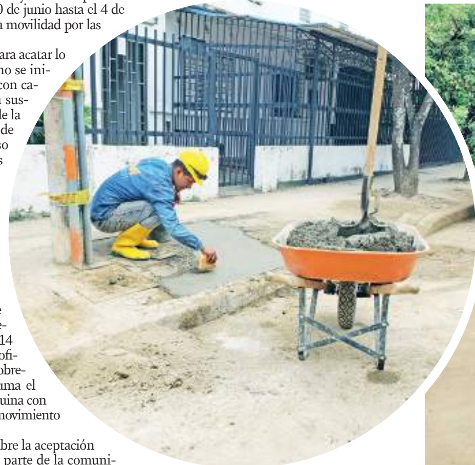
Algunas domiciliarias deben ser intervenidas.