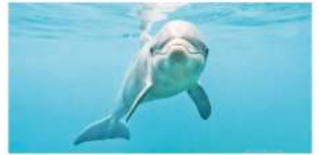
Los delfines pueden identificar a sus amigos por el gusto