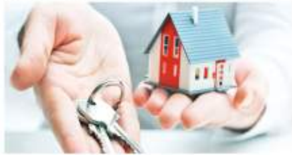
Incrementa en un 50% los créditos de vivienda