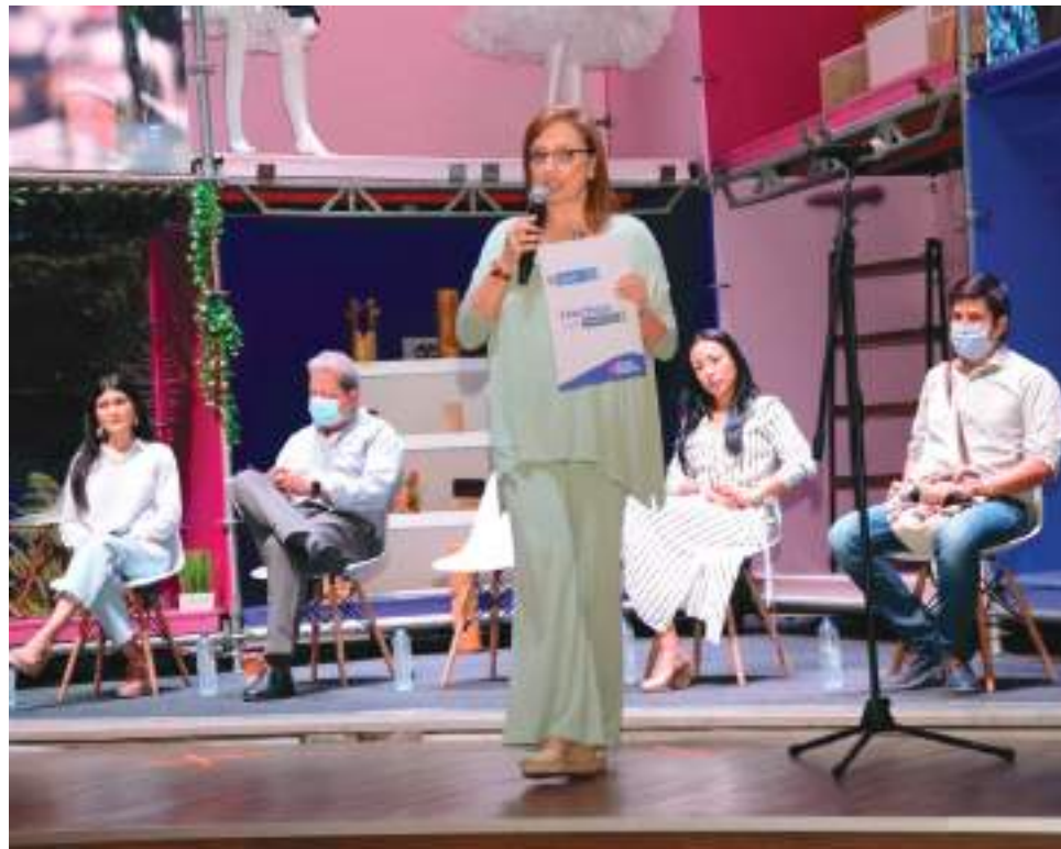
La Ministra TIC, Carmen Ligia Valderrama presentó la versión 2022 del programa 'Vende Digital', a través del cual se apoya a los emprendedores para que asienten sus negocios en el mundo digital.

“Desde el gobierno Nacional tenemos como objetivo transformar digitalmente a los colombianos y uno de los frentes ha sido los empresarios. Aquí les estamos ofreciendo otra alternativa para quienes ya tienen su negocio o inclusive sin ellos. También estamos capacitando para que quie-