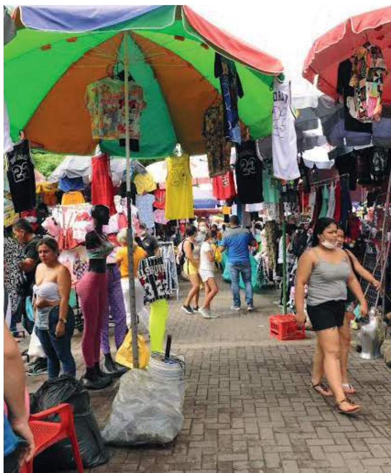
La pandemia, habría aumentado el número de vendedores informales en la ciudad de Neiva.

Hasta el momento, 1321 vendedores informales han sido caracterizados en ciudad de Neiva por parte de la Dirección de Espacio Público, y según la entidad, se avanza con las jornadas pedagógicas de sensibilización sobre el uso del espacio público en la ciudad.