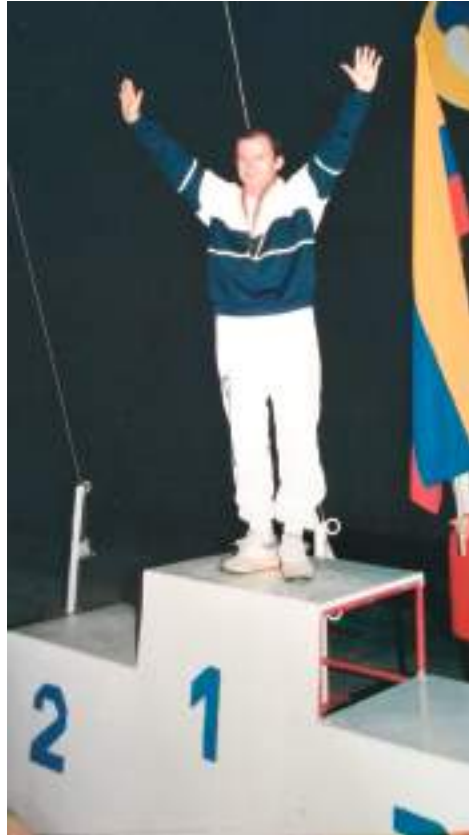
Jorge Barón Lamus brilló como deportista y como entrenador de lucha Olímpica.