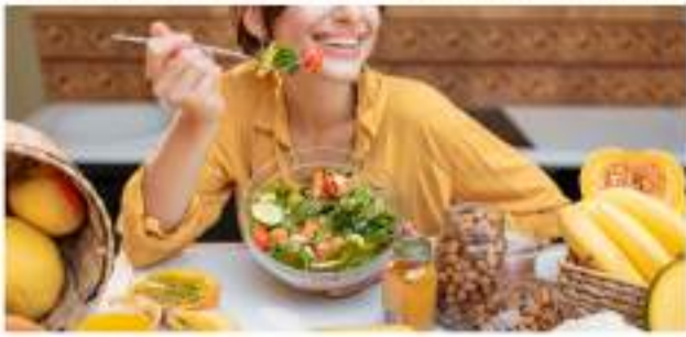
Buenos hábitos alimenticios, la clave para prevenir el cáncer de colon