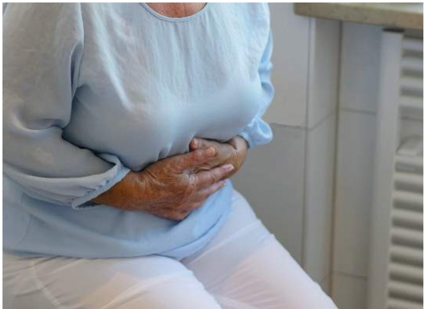
Según el Instituto Nacional de Cancerología de Colombia - ESE, entre el 80 y el 90 por ciento de los casos de este tipo de cáncer lo padecen personas mayores de 50 años.

“La base del tratamiento es la cirugía oncológica. Si es cáncer de colon se realiza cirugía y quimioterapia, pero si es a nivel del recto lo más frecuente es combinar la quimioterapia con radioterapia y posteriormente proceder a la cirugía. Sin embargo, esto depende del estado del tumor, pues en una detección temprana podría ser suficiente con la cirugía”, indica el doctor