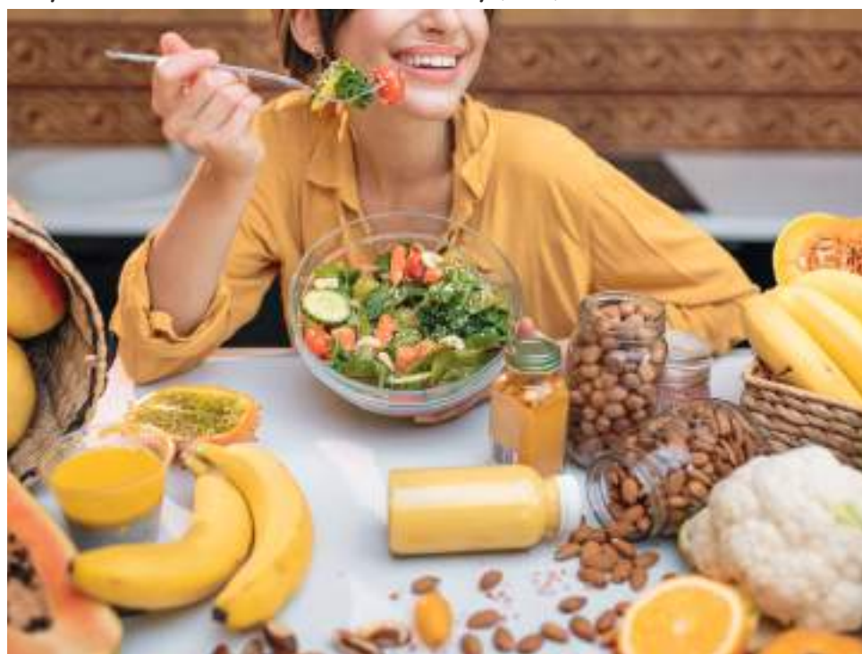
Los buenos hábitos alimenticios, son la clave para prevenir el cáncer de colon.

Los especialistas, hacen un llamado a la población hoy 31 de marzo en el Día Internacional Contra el Cáncer de colon, con el fin de prevenir y detectar a tiempo esta enfermedad.