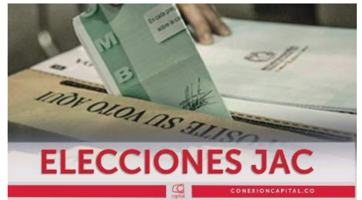
El próximo 24 de abril elecciones en donde no se pudieron conformar Juntas de acción Comunal en el país.