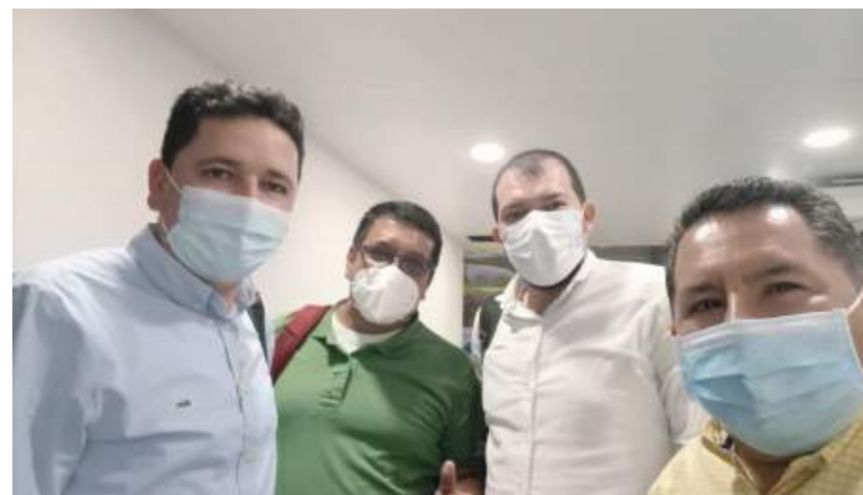
Son varios los temas que se lideran desde Neiva y el Huila.