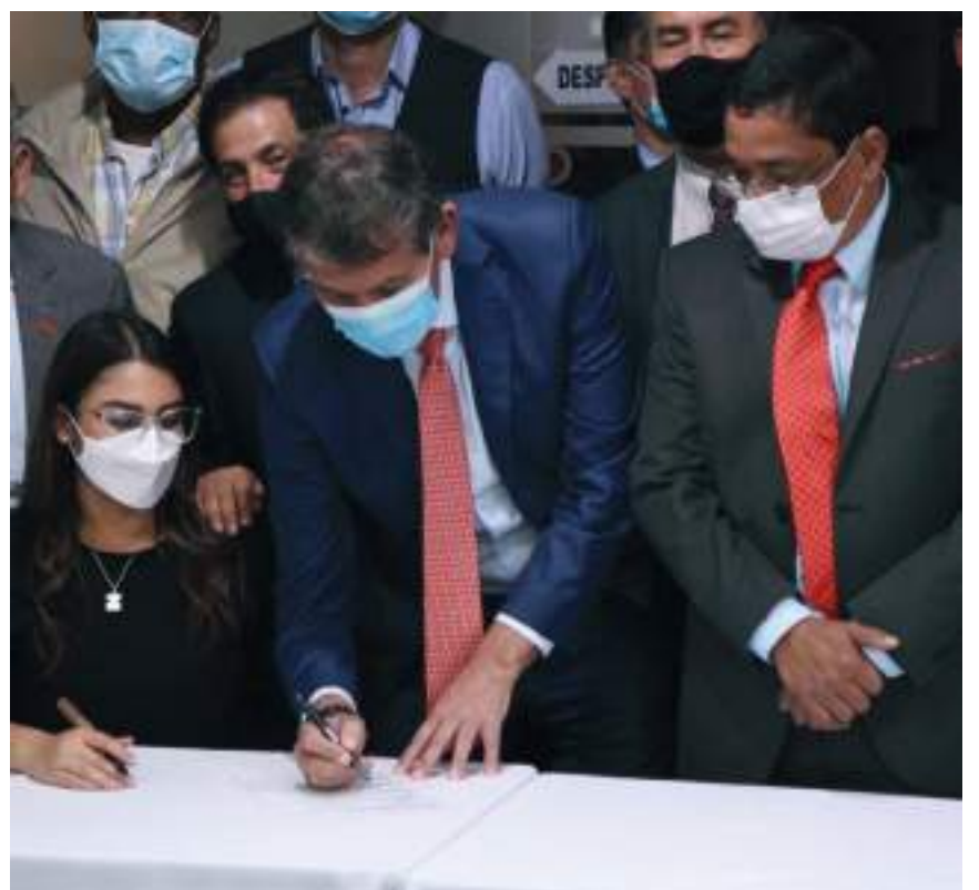
El aumento que beneficia a más de 1,2 millones de trabajadores públicos se reflejará a partir de abril, con retroactivo desde el primero de enero de 2022.

El acuerdo alcanzado con las organizaciones sindicales efectuado en 2021 contempló un ajuste salarial para los servidores públicos del 2.61% el año pasado. Se presentaron alrededor de 1.200 solicitudes y se alcanzaron más de 200 acuerdos.