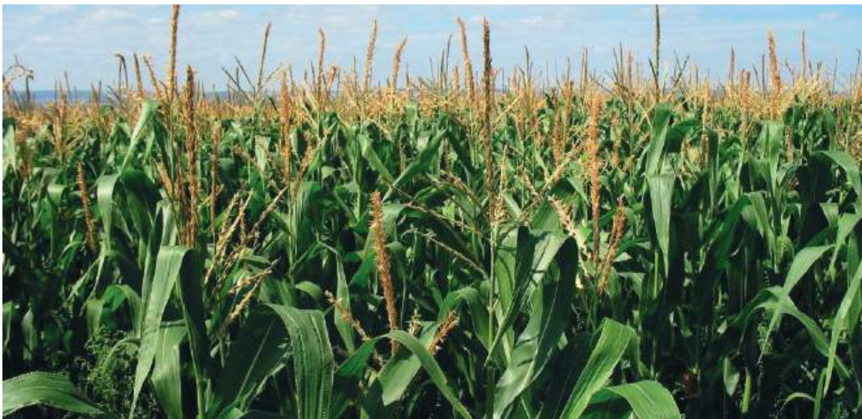
El proyecto de desarrollo de conocimiento para la innovación, está orientado al manejo del achaparramiento arbustivo en maíz.

■ Tras una agresiva plaga que azota los cultivos de maíz, se adelanta una investigación en tres municipios del departamento que ha avanzado en un 40%. Con esto se busca conocer, analizar y buscar soluciones para mitigar esta situación y así tener cultivos sanos.