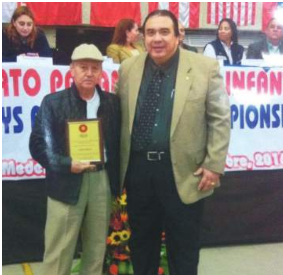
Momento en el que recibe el reconocimiento Internacional de las Américas.