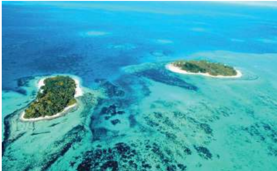
El territorio del Archipiélago de San Andrés y Providencia, otrora tierra americana de piratas británicos y esclavos africanos, es motivo de disputa entre Colombia y Nicaragua.

La Corte Internacional de Justicia examinará las reclamaciones nicaragüenses según las cuales Colombia supuestamente habría violado el derecho internacional por no haber dado aplicación al fallo del 19 de noviembre de 2012 de la Corte Internacional de Justicia, con las operaciones de la Armada Nacional en el mar Caribe; así como con la expedición del decreto que estableció la Zona Continua Integral