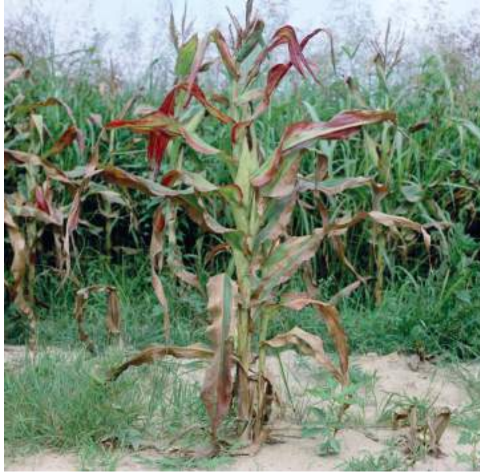
Así luce el achaparramiento del maíz con la plaga de la que se intenta conocer más.