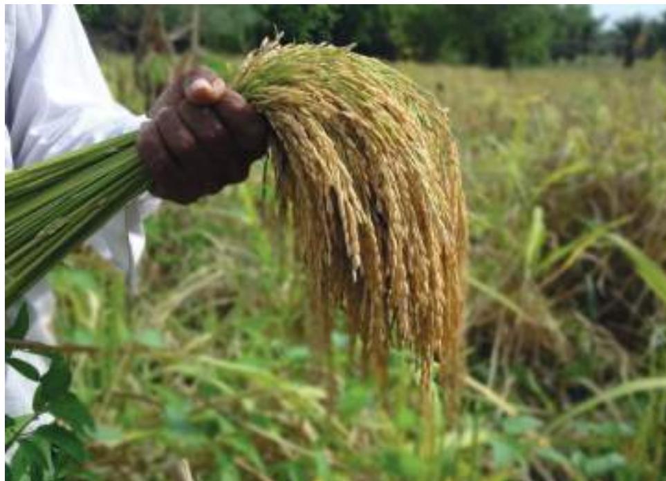
Este convenio tiene como objetivos, mejorar los índices de producción en el sistema productivo del maíz y garantizar las condiciones sociales de reactivación económica del sector.

El profesional, se refirió a la enfermedad que está causando serias afectaciones a la producción del maíz en el Huila. “En el año 2014 se detectó una enfermedad, achaparramiento del maíz, transmitida por un vector que trasmite un patógeno. Ese año en Campoalegre casi el 100% del maíz se perdió, era una plaga desconocida y a partir de allí la gente tuvo temor de sem-