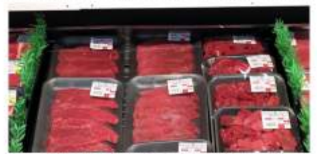
Exportaciones de carne totalizaron USD 50,5 millones en enero de 2022