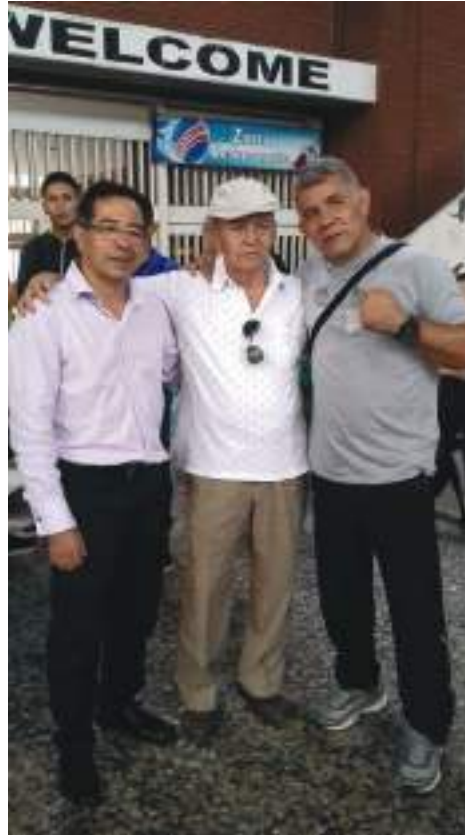
Siempre se rodeó de los entrenadores y la dirigencia deportivos.