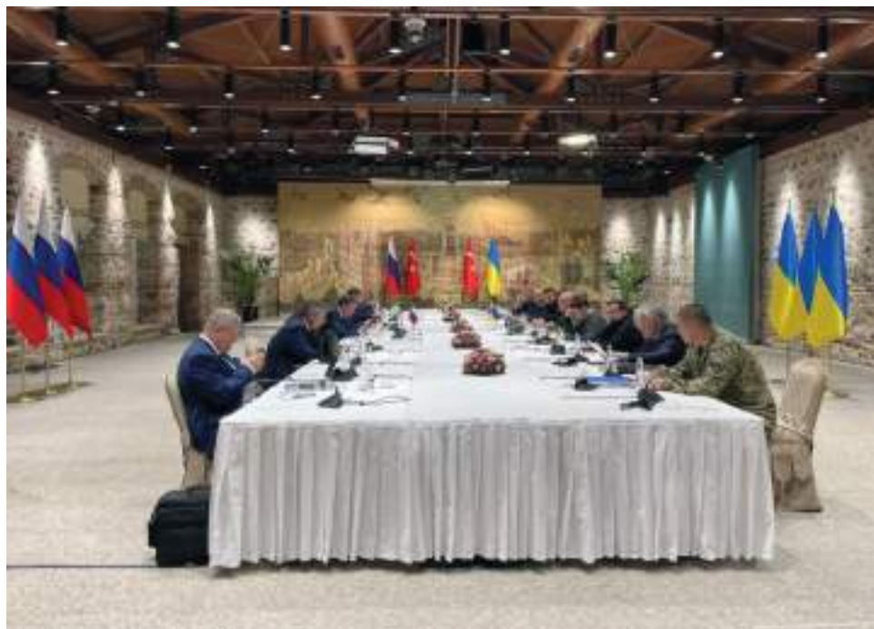
Una de las jornadas de negociación en Turquía.

Además, han precisado que las tropas rusas no han tenido “acciones activas” en dirección norte.