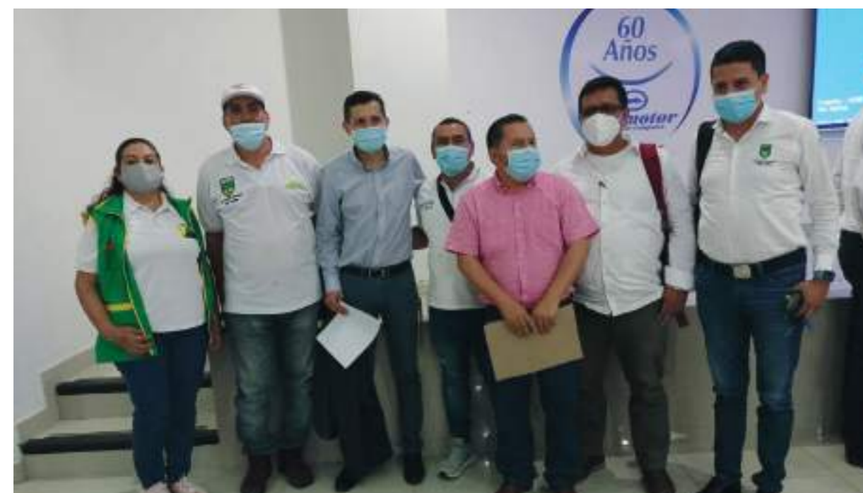
En Neiva y el Huila se ha avanzado en la construcción de una política pública para el sector.

La Organización Comunal es la instancia a través de la cual las comunidades deciden organizarse para liderar e impulsar procesos comunitarios en barrios y veredas, materializándose a través de la participación, el quehacer en la vida de las comunidades.