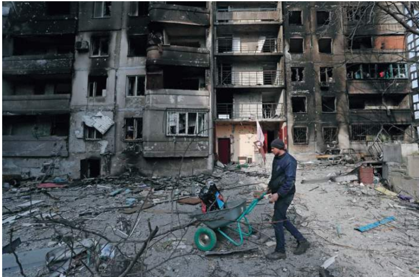
La desolación en la ciudad atestigua los horrores de los combates y bombardeos.

En el terreno la “situación no cambia”, según autoridades ucranianas. En Irpin, que los ucranianos anunciaron el lunes que habían “liberado”, los ataques si-