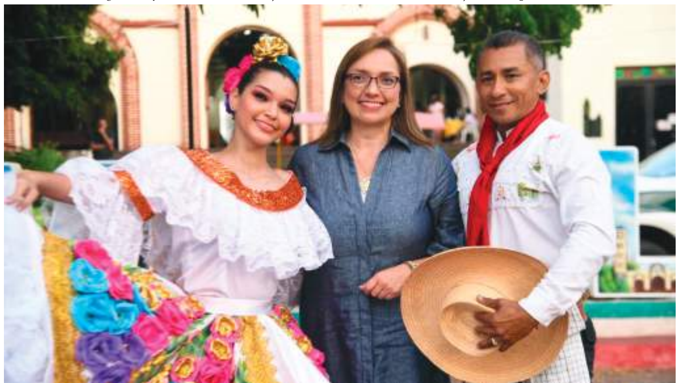
Carmen Ligia Valderrama, ministra TIC, recorrió Huila para realizó en el Huila nuncios en materia de conectividad y emprendimiento.

Posteriormente, en la Institución Educativa Juan XXIII de Algeciras, la Ministra lideró un taller sobre los riesgos en internet y activismo digital, del programa ‘En TIC Confío +’. Dicha estrategia comenzó en el año 2011 y ha beneficiado a más de 13 millones de colombianos, brindándoles herramientas para reconocer, prevenir y denunciar delitos y riesgos digitales como el cibercoso, sexting, ciberdependencia, entre otros. En el departamento del Huila, a través de ‘En TIC Confío +’, en los últimos tres años, se ha llegado a 165.283 personas, quienes a través de cursos especializados se han formado en la prevención de riesgos y en el uso positivo de Internet.