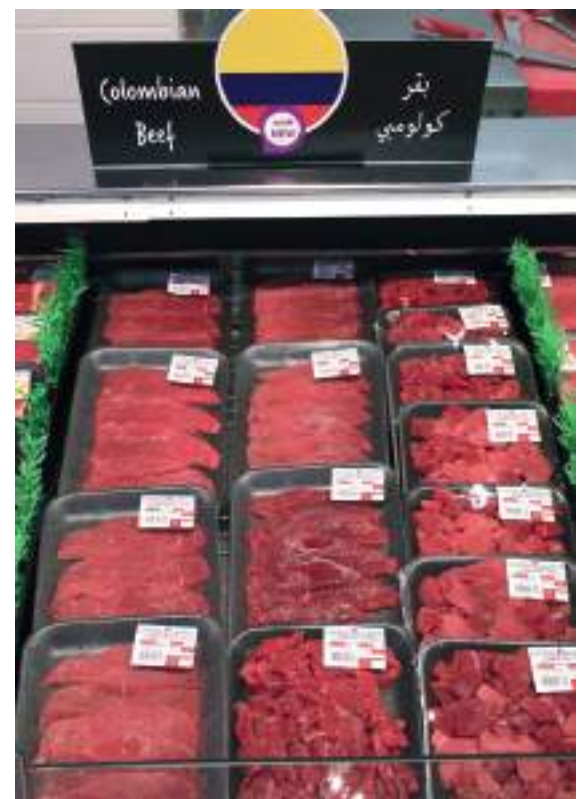
Rusia, es uno de los países a donde llega la carne 100 % colombiana.

“Son importantes avances. Continuamos dialogando con empresarios, gobiernos y apoyando la apertura de mercados en todo el mundo para que más personas compren carne, animales vivos y productos lácteos 100 % colombianos”, añadió el