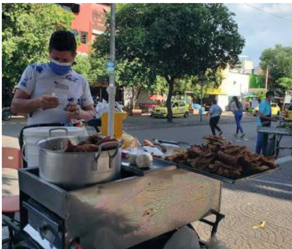
Aunque se continúa en el proceso de mejoramiento del espacio público de la ciudad, los vendedores informales esperan soluciones concretas y avances significativos.

“Esa caracterización se hizo con los vendedores antiguos,