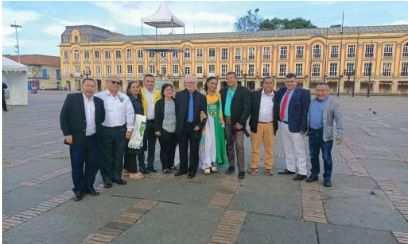
En la capital del país se reúnen los representantes de las JAC.