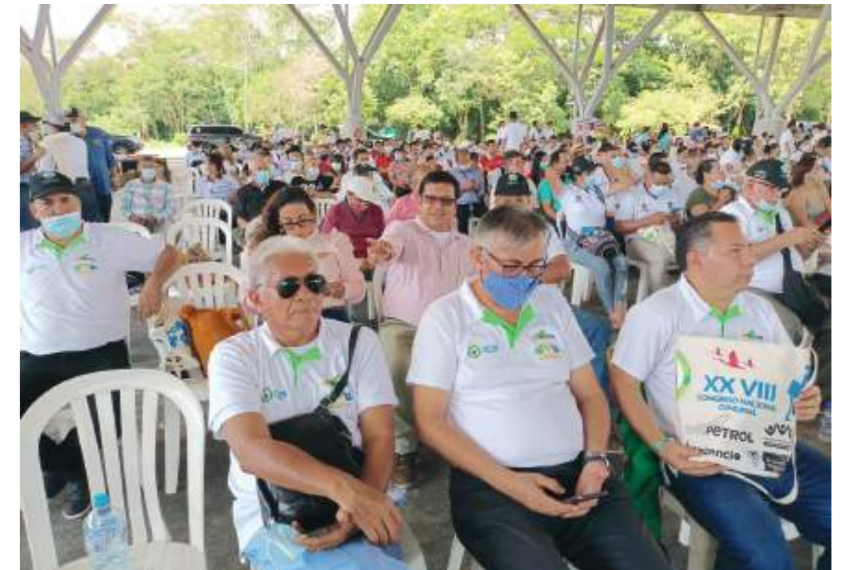
El Huila se hará presente con cinco delegados.

■ Por petición de la Confederación Comunal Nacional, durante dos días, desde este 1 de abril, se reúnen en Bogotá delegaciones de todas las regiones del país para participar en una mesa técnica sobre la implementación de la ley que construye la política pública de la acción Comunal en Colombia. Neiva y el Huila estarán representados por cinco delegados.