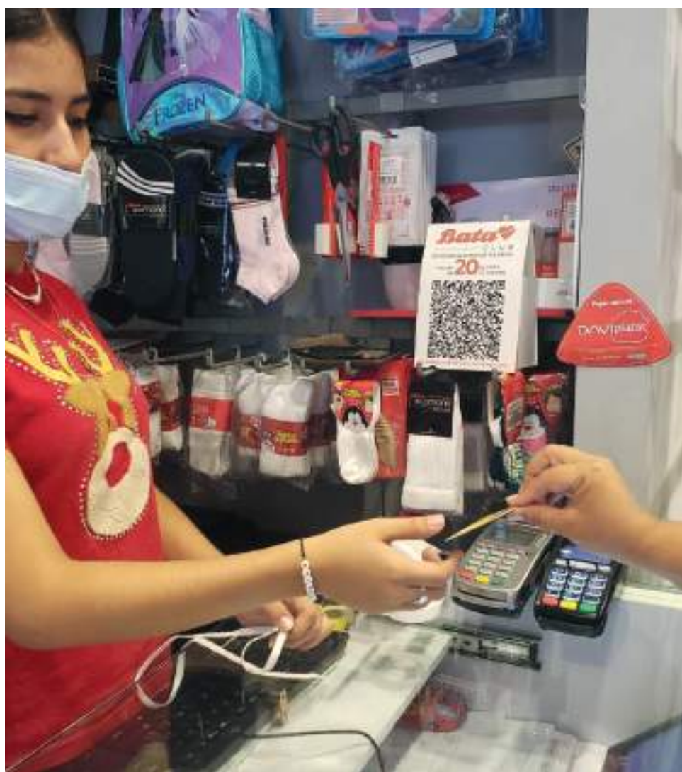
La mayor cantidad de deudores estuvo concentrada en las tarjetas de crédito.

Mediante la Circular Externa 022 del 30 de junio de 2020 la Superintendencia impartió un grupo de medidas complemen-