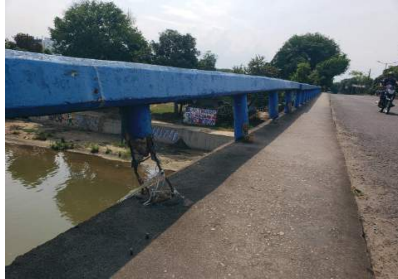
La pata de una de las barandas a punto de colapsar.