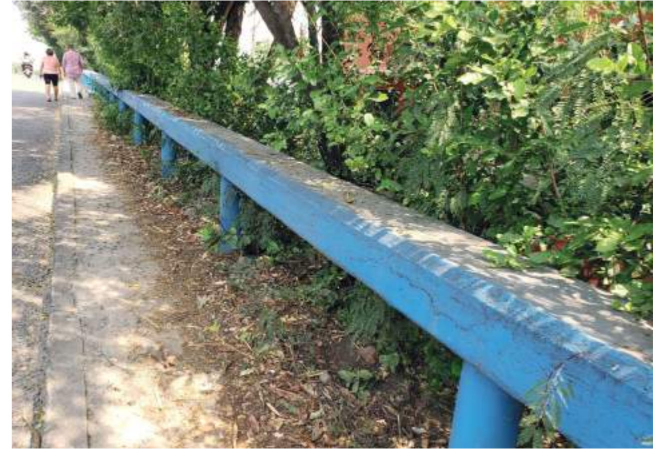
Los peatones también transitan con inminente riesgo para su integridad.