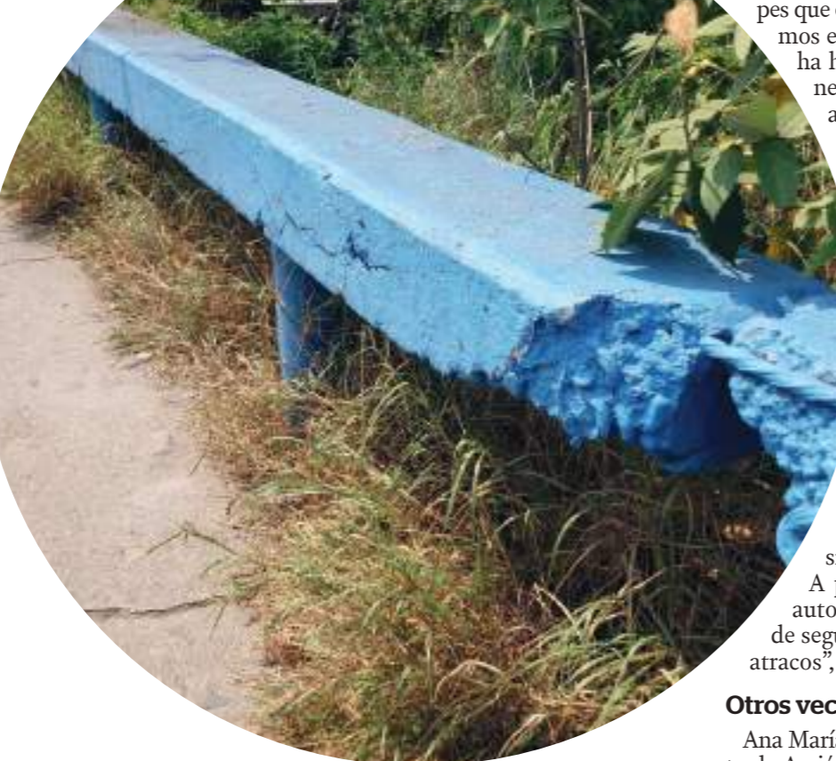
Las barandas también lucen en mal estado.

El flujo vehicular sobre todo en las horas pico es bastante, por lo que son