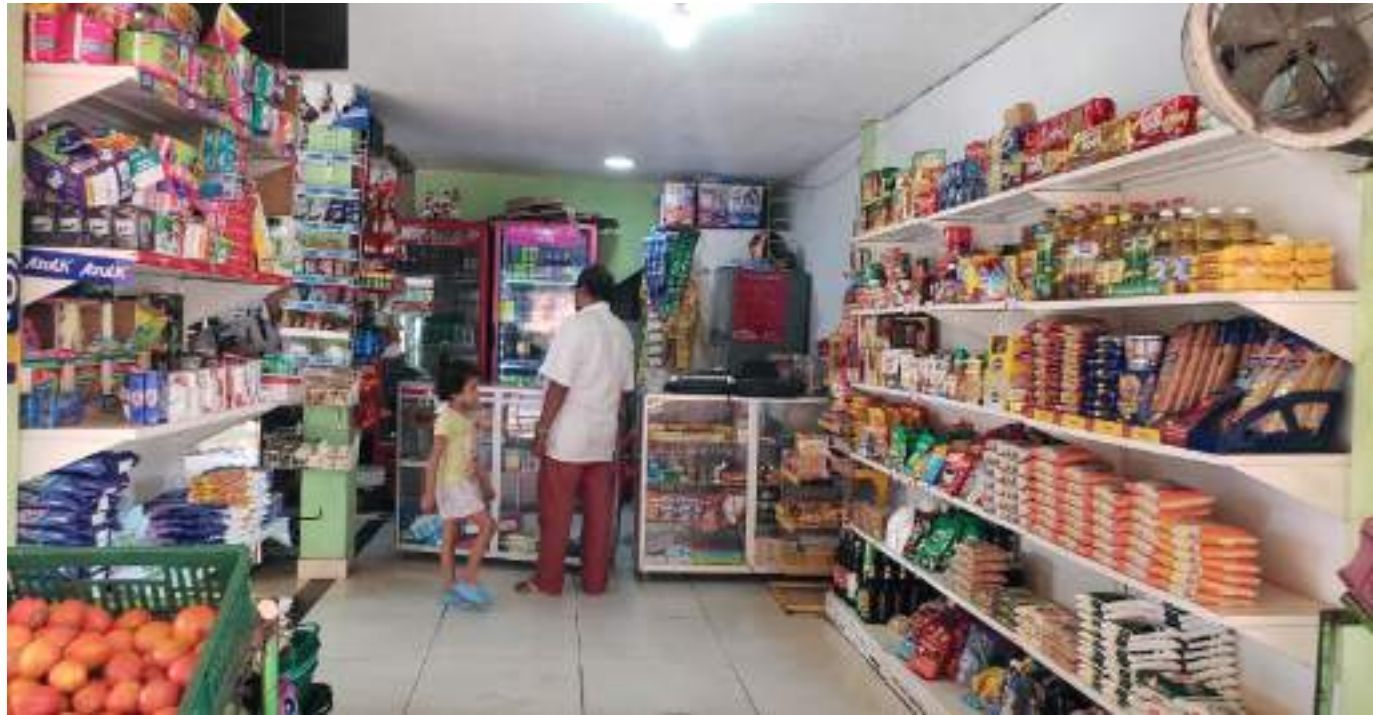
Aunque el número de pasadas por la tienda son menores, las compras se han incrementado.

El más reciente estudio realizado por Fenalco el año anterior, que los tenderos, además de de-