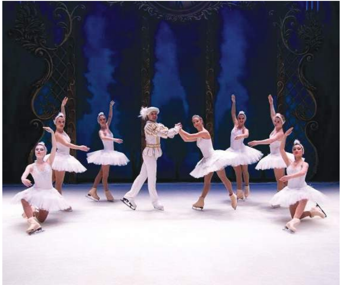
Pensando en la reactivación económica y cultural de Colombia, este hermoso espectáculo estará visitando todo el país en el mes de febrero.