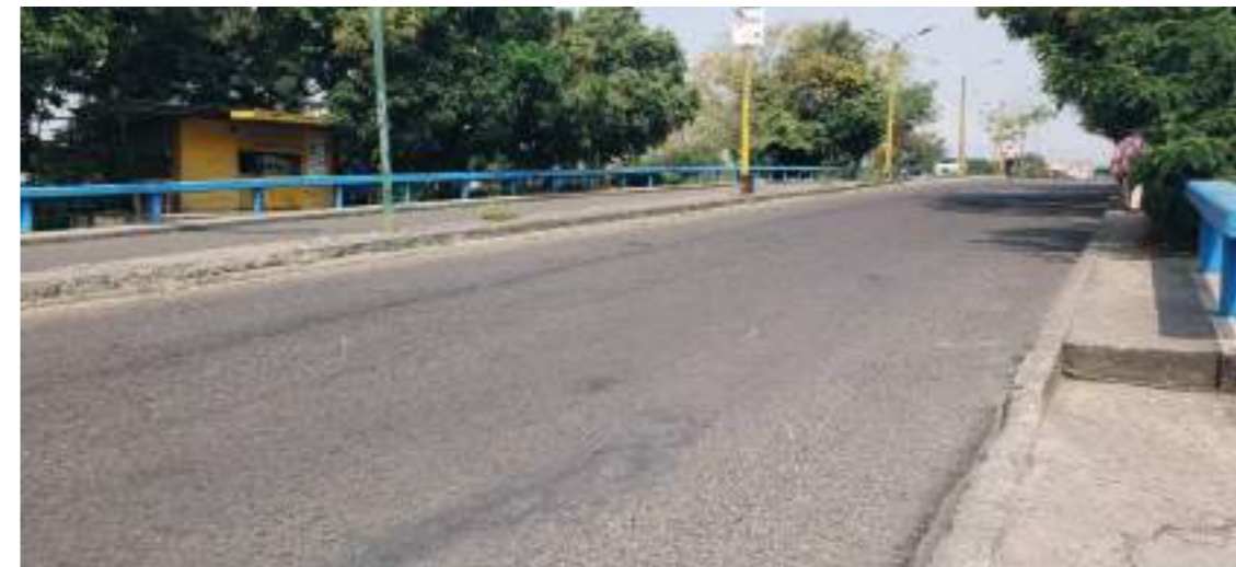
La vía es amplia y de mucho tráfico vehicular.