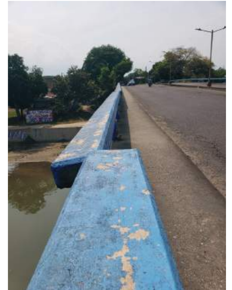
En el sentido norte sur una de las barandas amenaza caer a río.

Consultar sobre a quién corresponde dar solución al problema que afrontan los habitantes de las Delicias, el Reinaldo Matiz y Rojas Trujillo por el deterioro de puente Misael Pastrana Borrero en la carrera segunda sobre el río Las Ceibas, no es tarea fácil. El puente fue construido sobre la que se considera una vía nacional, la antigua entrada a Neiva, los trabajos los ejecutó en su momento el gobierno municipal a través de convenio con el estado con participación del departamento. Así que lo primero que toca aclarar es a cargo de quien está el puente y a quien le compete hacer interven-