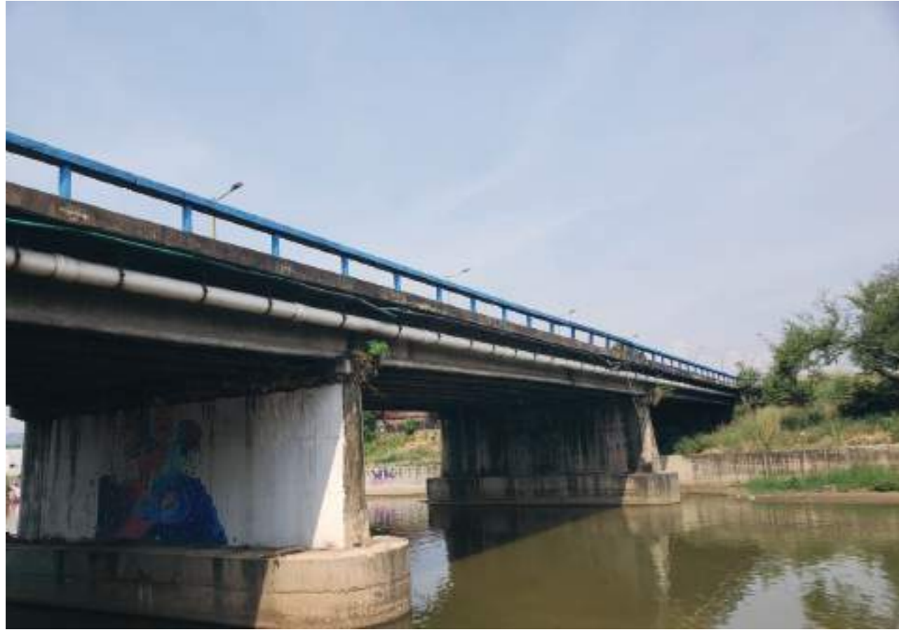
Puente Misael Pastrana Borrero de Neiva en evidente deterioro