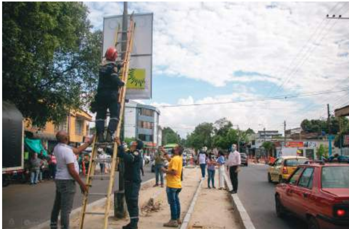
Las elecciones a Congreso serán el domingo 13 de marzo de 2022 y, previo a ello, se viene dando cumplimiento al decreto que deben acatar los partidos políticos.

“Hemos continuado con la tarea de desmonte de publicidad política en sitios prohibidos, en el microcentro de Neiva no puede haber publicidad y sobre ello hemos venido coordinando y trabajando; alrededor de los puestos de votación que la mayoría son colegios no puede haber publicidad a cien metros a la redonda. Cerca de 40 carteles, pasacalles y vallas, han sido desmontados y vamos a continuar diariamente trabajando en esta tarea. Esperamos que los candidatos, gerentes de campaña, los equipos políticos, nos apoyen para que no se pre-