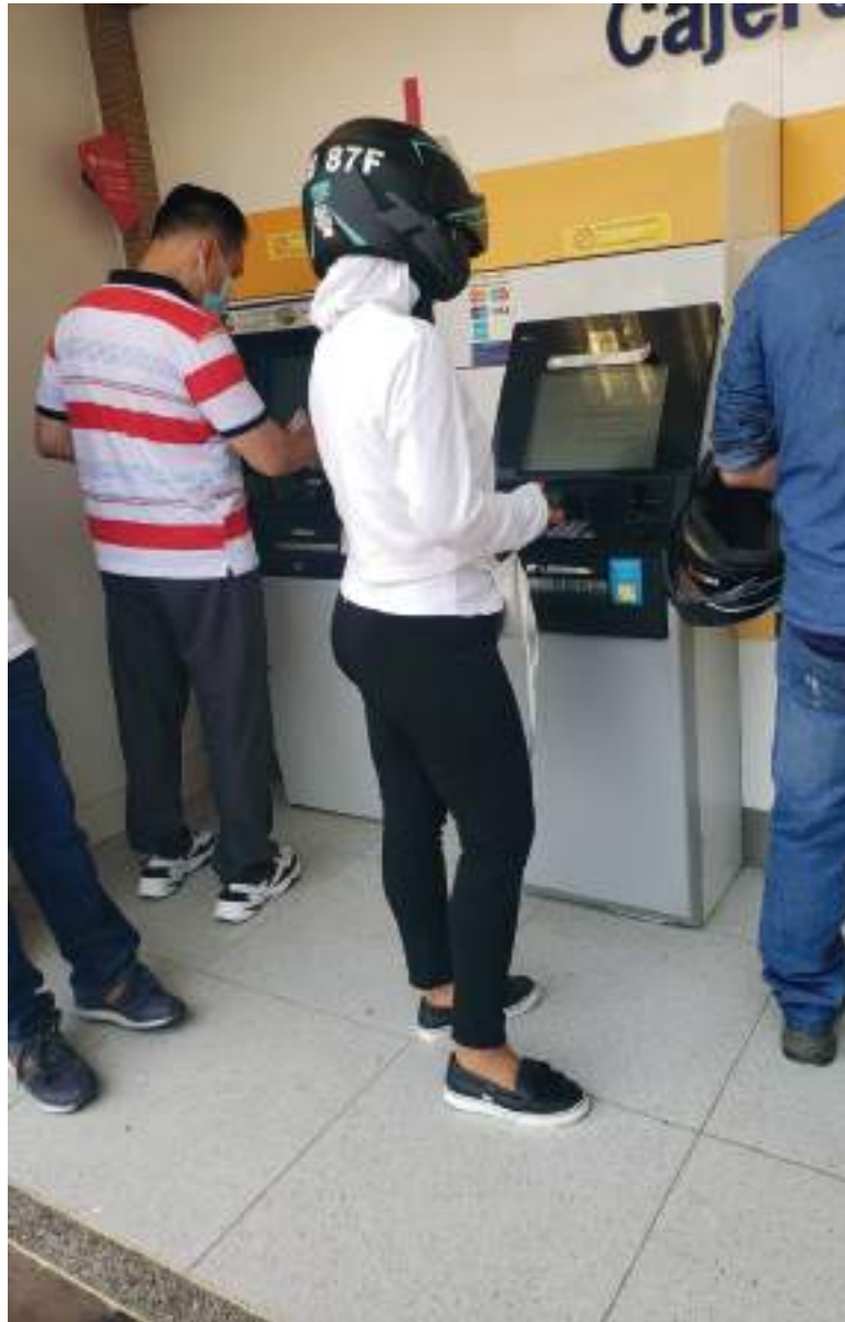
Entre el 25 de diciembre de 2021 y el 21 de enero de 2022 se desembolsaron 28.472.781 créditos por un valor total de $32.20 billones.

Las tasas de interés de las operaciones de crédito responden al comportamiento de diversos factores como: el riesgo de crédito