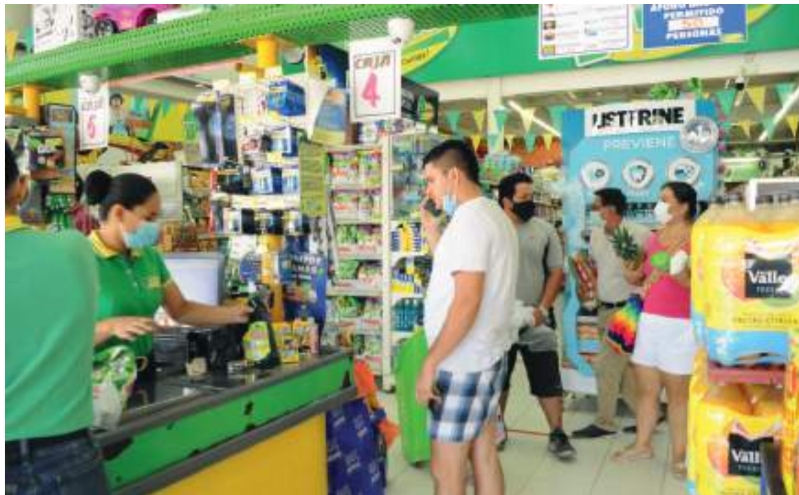
El año 2022 trajo consigo alzas elevadas en los precios de algunos productos de la canasta familiar para los hogares colombianos.

Al día de hoy, las tiendas de barrio y comercios locales muestran una gran preocupación, pues, la adquisición de sus productos se torna más difícil y la venta es aún más compleja; leche, carne, huevos, abarrotes y varias verduras han sufrido un cambio desproporcionado en sus costos y por el momento, no habría a corto plazo una disminución en estos precios. Según este informe, los precios incluso seguirían aumentando y el valor del peso colombiano por la misma devaluación podría seguir en caída provocando un aumento importante en el índice per cápita en el inicio del 2022.