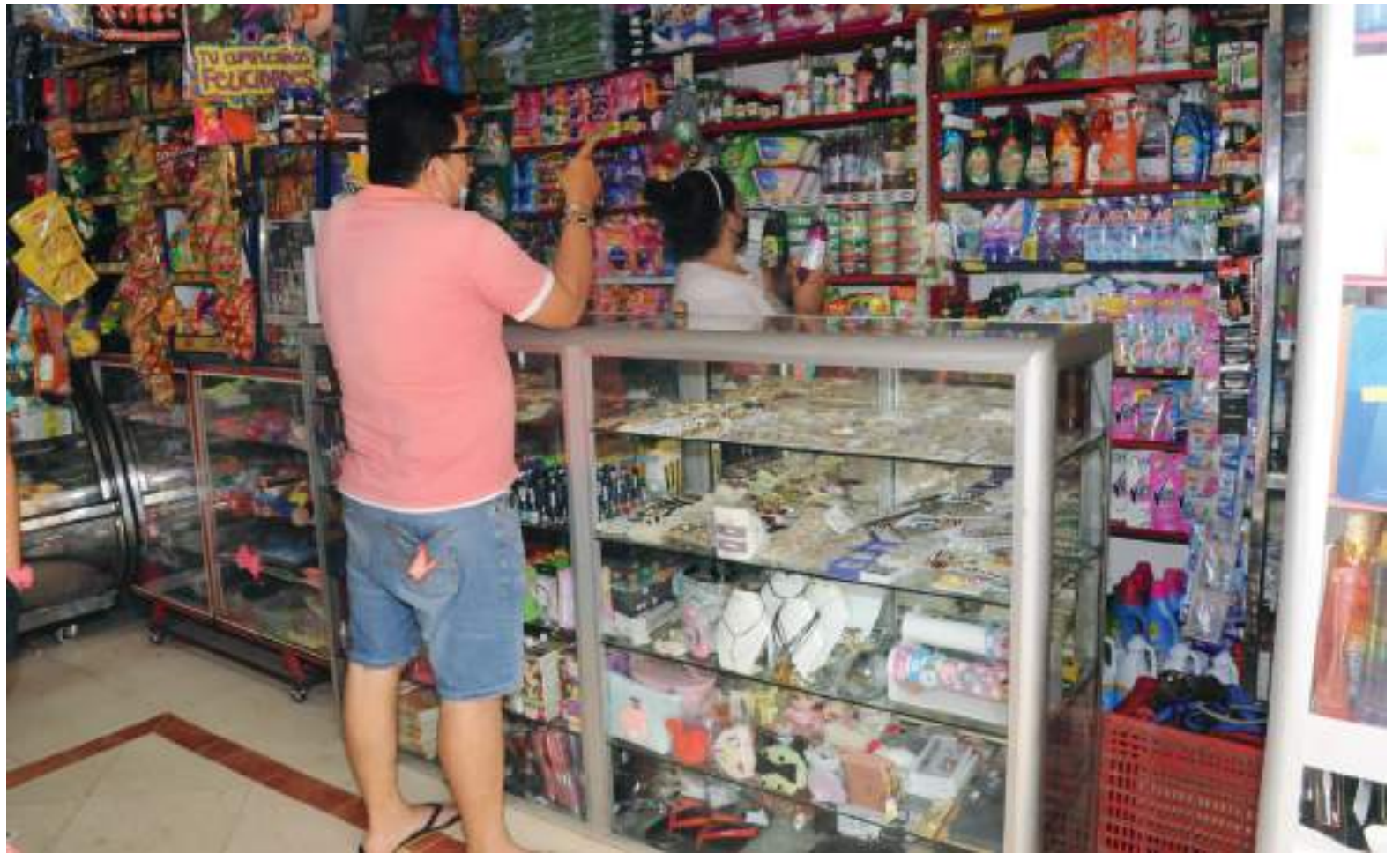
Desde el Banco de la República han informado y predispuesto a la población colombiana, señalando que en este año podría haber alzas en varios productos durante este primer semestre.

El presidente Iván Duque, resaltó el nuevo salario mínimo