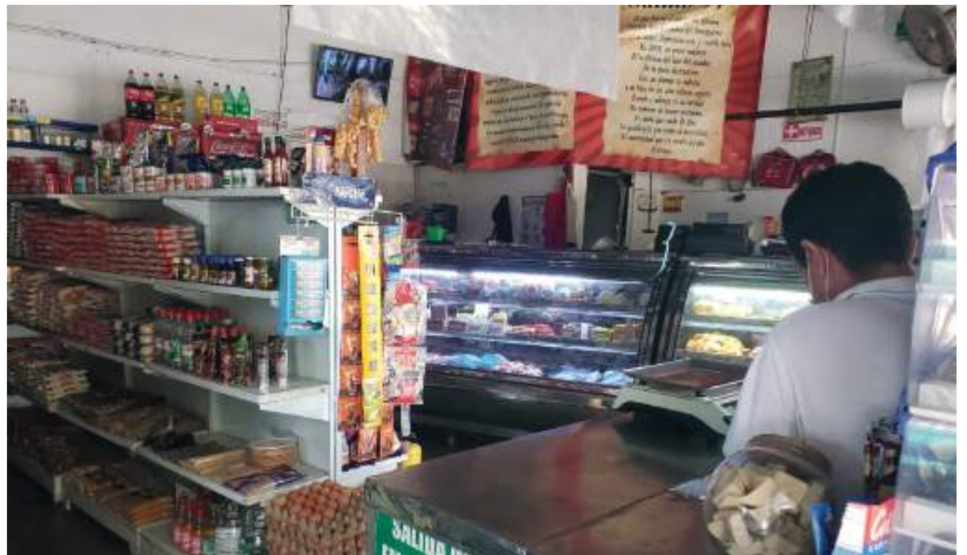
Aún las crisis que han tenido que afrontar en el último año, las tiendas de barrio siguen más vivas que nunca.

Para el cierre de 2021 se registró en las tiendas de barrio, un crecimiento transaccional respecto al 2020 del +5,5%, por consiguiente, se entiende que este desempeño sobre el canal tradicional, se debe pri-