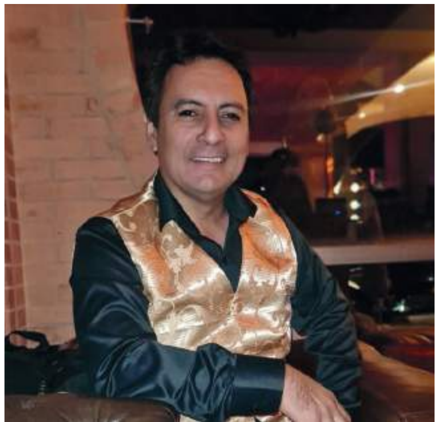
La música siempre ha estado ligada a su vida

Los primeros recuerdos de su Algeciras natal son siempre vinculados a la música, es el menor de cinco hermanos de la camada, dice. Me crié al lado de mi papá en la finca.