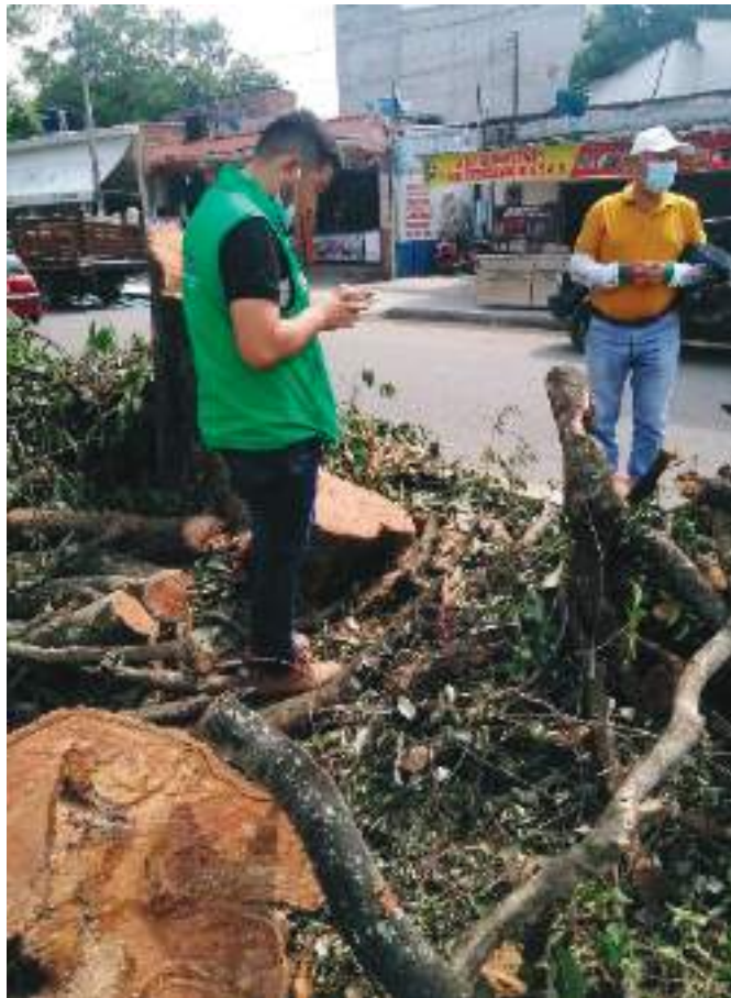
La CAM impuso medida preventiva que establece la suspensión inmediata del aprovechamiento forestal, hasta tanto se cumpla con las condiciones de manejo ambiental establecidas en la autorización y que garantizan la minimización de los impactos ambientales.

De igual manera la CAM, explicó que, “El Permiso de Aprovechamiento Forestal establece como medida de compensación para dicha intervención, la relación 1:20, es decir, por cada árbol aprovechado