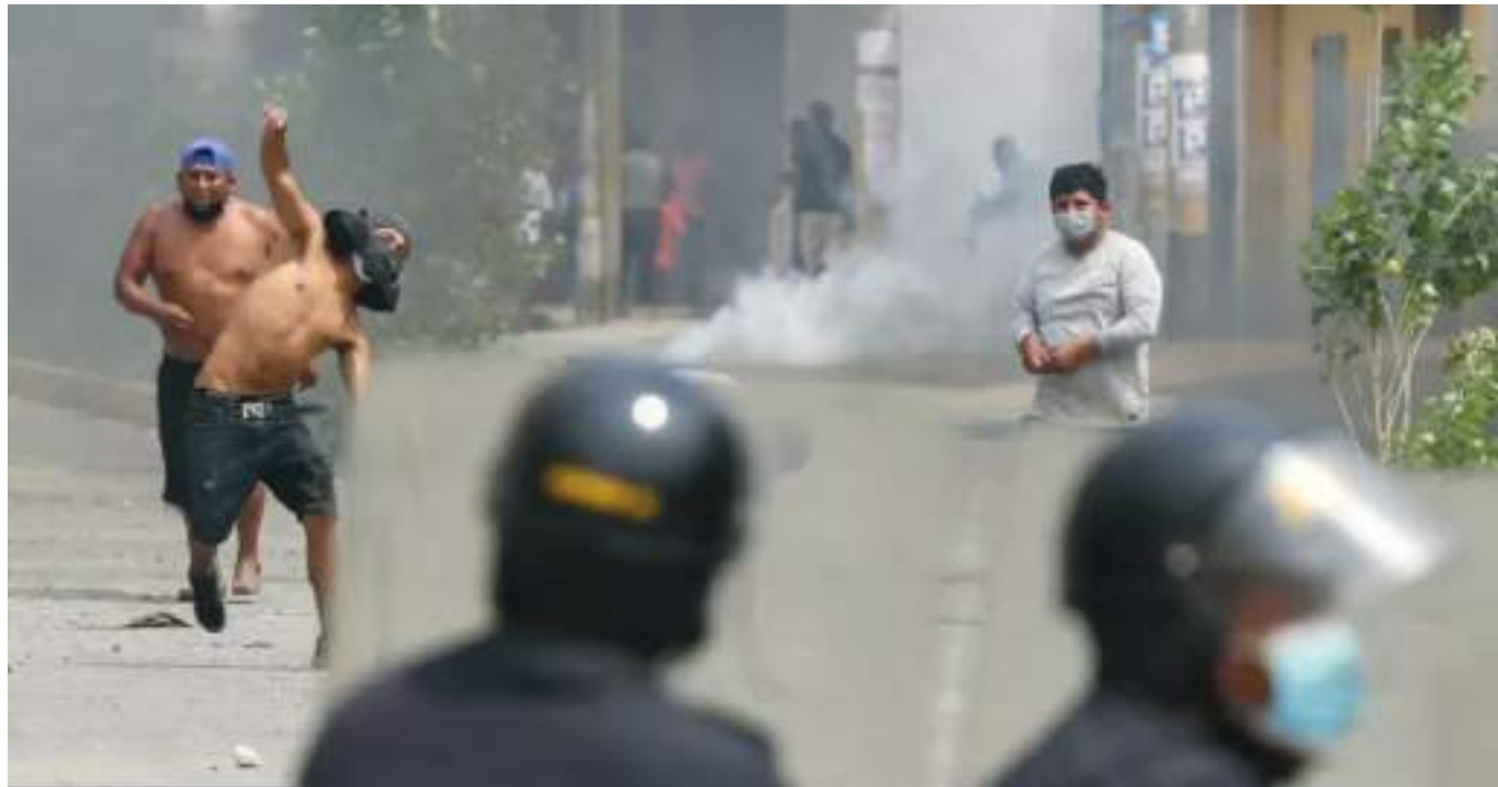
El gobierno asegura que las muertes no se han producido en enfrentamientos con la policía, sino en circunstancias derivadas del bloqueo de carreteras y protestas.

Los altos precios del combustible fueron el detonante para que