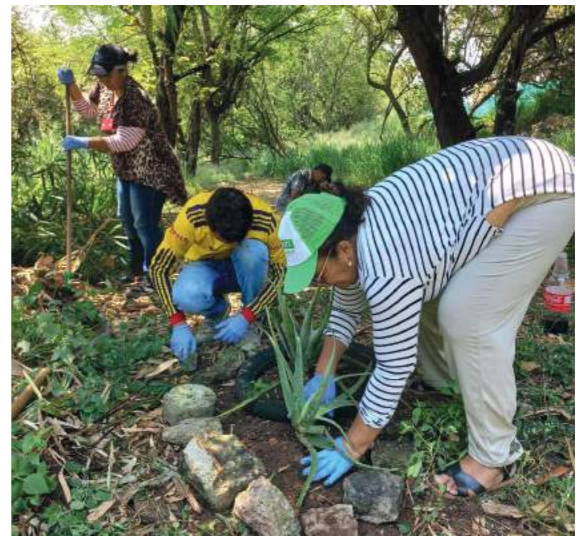
Vecinos aprovecharon para sembrar plantas.