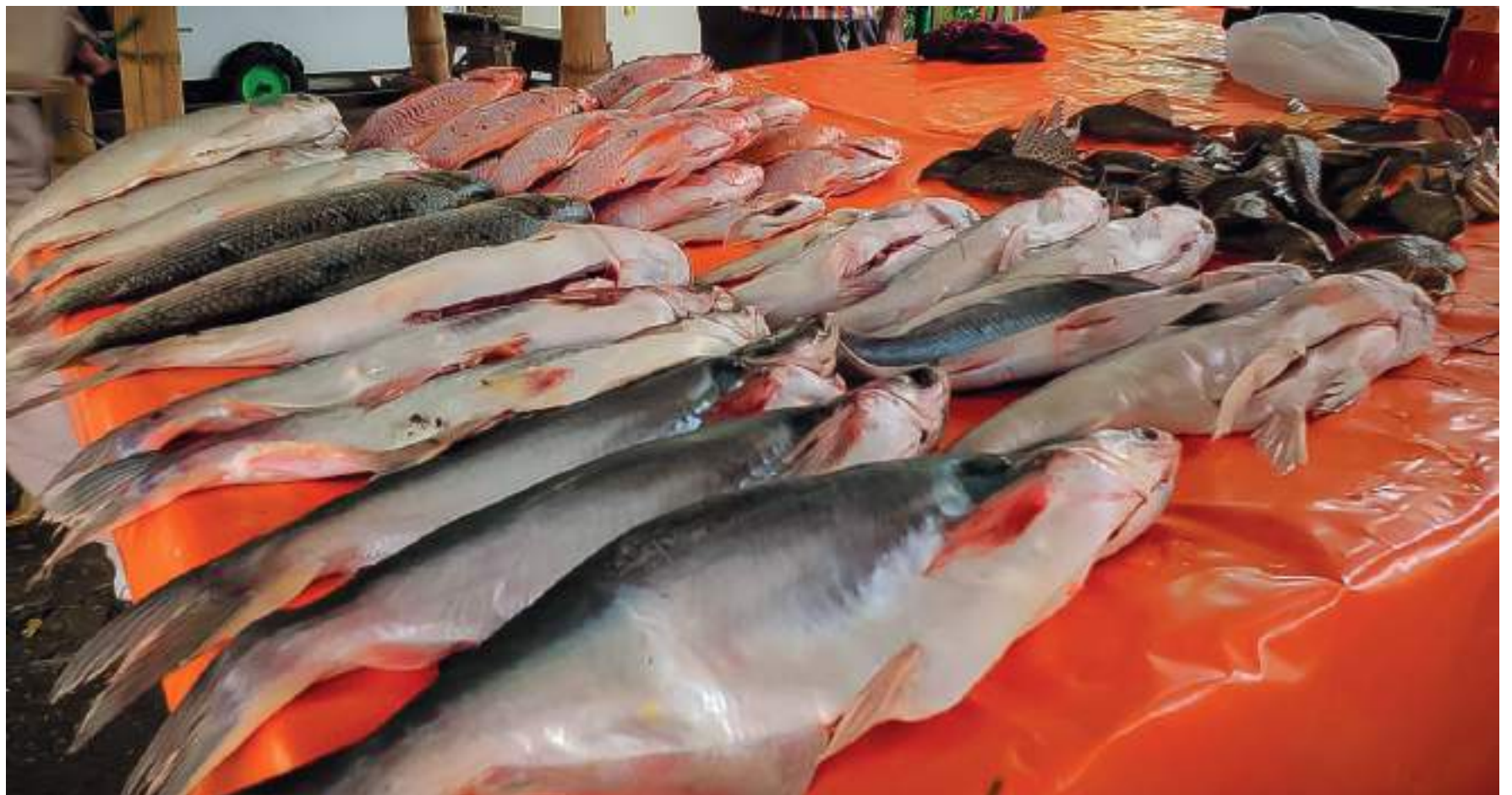
El 35% y 40% de la producción piscícola es comercializada en esta época.

"Creo que en este momento la Semana Santa va a ayudar un poco al incremento del consumo del pescado en el país, teniendo en cuenta los altos costos del pollo y la carne"