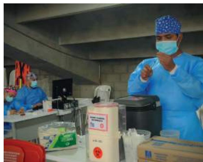
1.674.517 dosis de vacunas acumula el Departamento del Huila y 653.410 han sido administradas en el Municipio de Neiva.

Es decir, El Pital, Oporapa, Rivera, Algeciras, Gigante, Guadalupe, Palermo, La Plata, Timaná, Isnos, Tarqui, Pitalito, San Agustín, Acevedo y Suaza por sus coberturas en vacunación inferiores al 60% están llamados a exigir permanentemente el uso de tapabocas y respeto de aforo en las celebraciones litúrgicas que impliquen riesgo para la población.