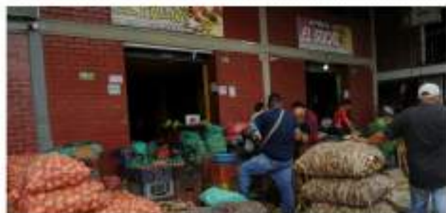
Neiva se ubicó de cuarta en variación del IPC de 1,25% en marzo