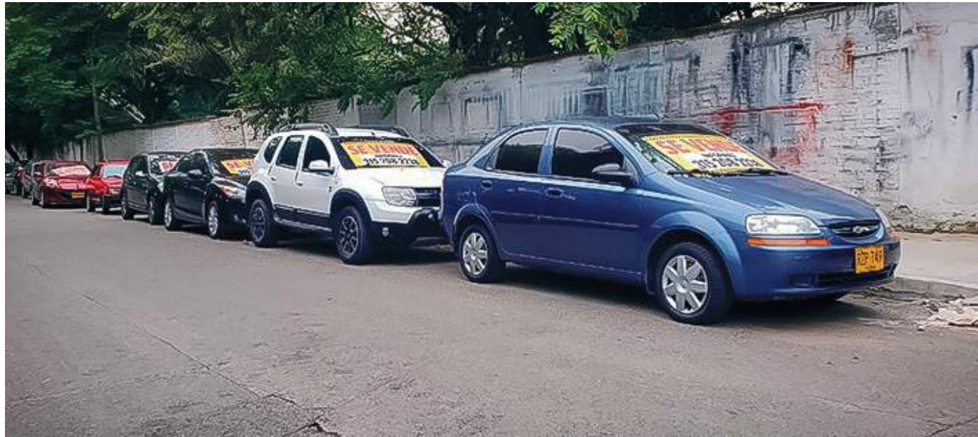
Esta situación directamente también afecta la venta de vehículos de segunda.

Según cálculos de Andemos, con base en cifras del informe RUNT, en lo corrido de este año la venta de vehículos nuevos en el departamento del Huila arrojó una disminución del -20% frente al mismo periodo del 2021, al bajar de 957 unidades comercializadas a 770. Este panorama se viene presentando desde enero, en donde se vendieron 203 vehículos, -14% menos frente al año anterior; en febrero se comercializaron 267 que se tradujo en una disminución del -17%; y en marzo, aunque se ascendió a 300 unidades, representó una contracción del -24%.