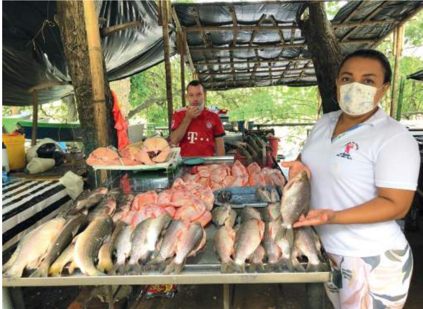
Es recomendable comprar en sitios seguros y que estén siendo vigilados por la Secretaría de Salud Departamental