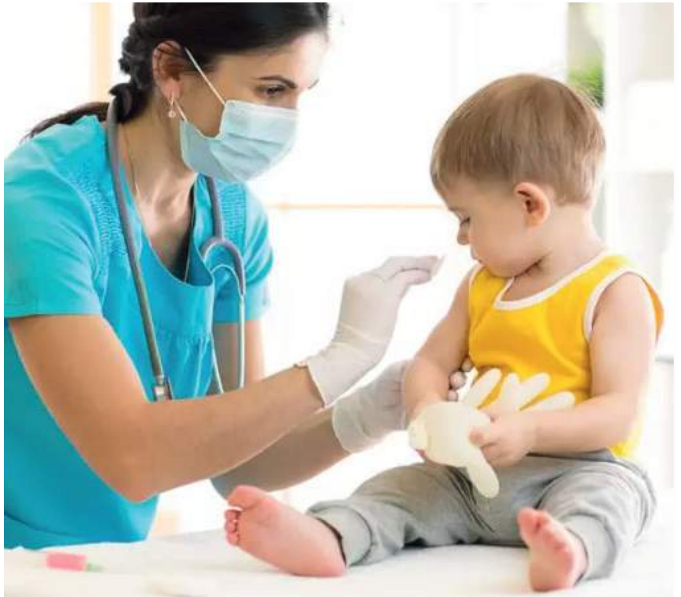
La vacunación reduce el riesgo de enfermarse hasta en un 60% en la población general.

Los profesionales de la salud son conscientes de la importancia de extender el impacto positivo de la vacunación contra la Influenza y de mantener las coberturas de inmunización altas para prevenir impactos en la salud, así como de la concientización de su valor para la calidad de vida. Por ello, comparten al-