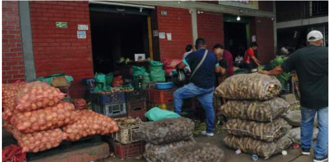
La inflación anual en Colombia se ubicó en 8,53 %. Así lo reveló el Dane, que también afirmó que la variación mensual fue de 1,0 %.

Así mismo, otros mayores aportantes a la variación en lo corrido del año (enero - marzo), se ubicaron en las divisiones de alimentos y bebidas no alcohólicas, hoteles, alojamiento, agua, electricidad, gas y otros combustibles, transporte y muebles, artículos para el hogar y para la conservación ordinaria del hogar, las cuales en