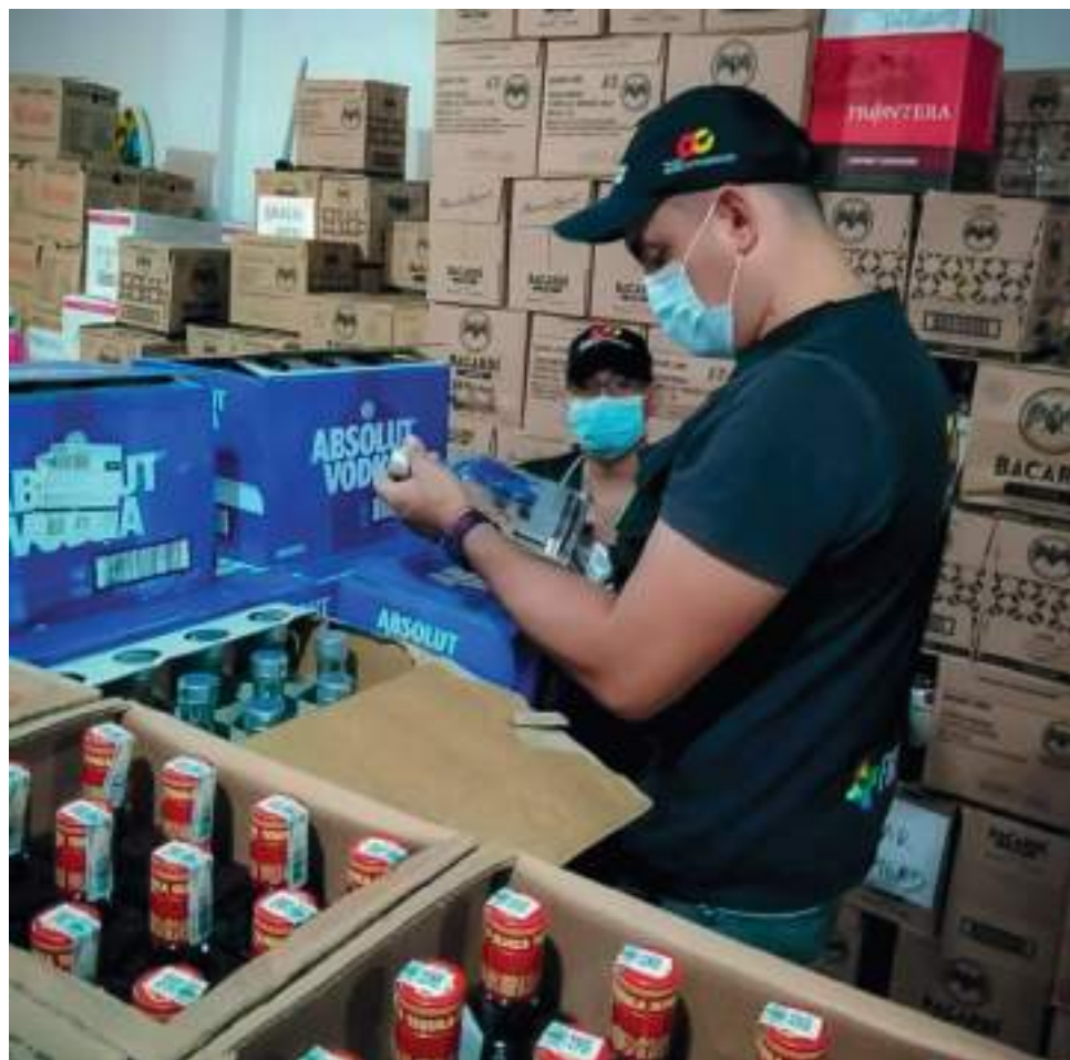
Es esencial que en las estampillas se especifique que el licor es para distribución y comercialización en el Departamento del Huila.

Este tipo de procedimientos se hacen de manera constante en el Departamento, sin embargo, aumentan los controles teniendo en cuenta que se está a puertas de la Semana Mayor y de las festi-