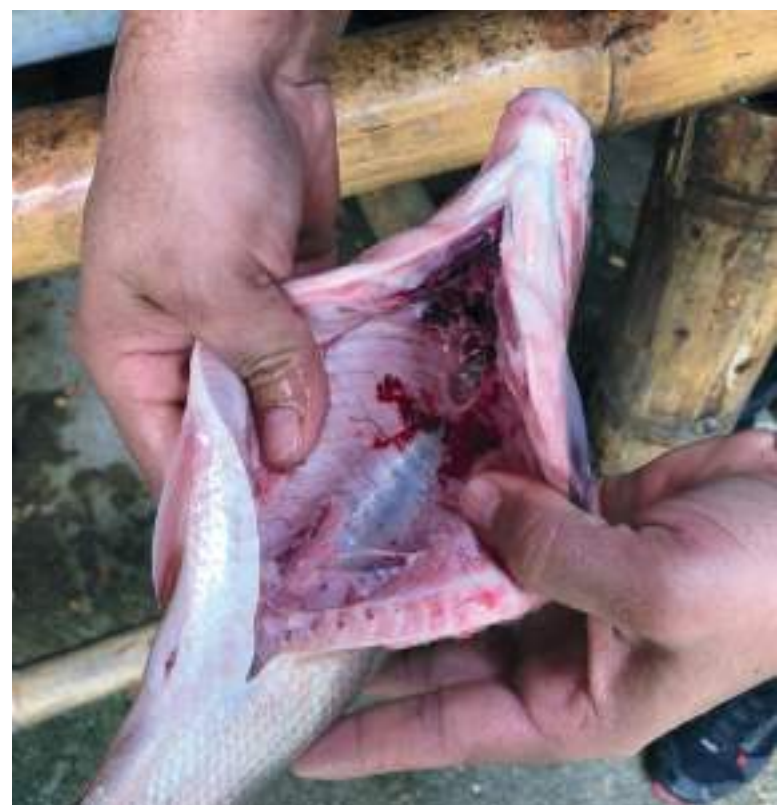
El pescado fresco se diferencia por la textura de la carne, el olor, los ojos y las agallas.

Agallas: Deben ser de color rojo vivo en la mayor parte de las especies y rosa en otras. Suaves y resbaladiza al tacto. Cuando está en mal estado sus agallas toman un color amarillento. Cuando el pescado está fresco sus agallas no presentan mucus, y a medida que se va descomponiendo esta aparece hasta tener un aspecto lechoso.