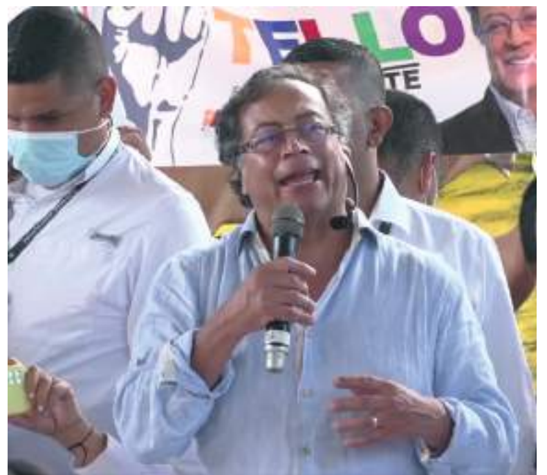
Este martes estuvo en Neiva el candidato presidencial Gustavo Petro. Su agenda la desarrolló en el polideportivo del barrio Campo Núñez, donde asistieron comunidades campesinas, resguardos indígenas, gremios, empresarios y gestores culturales del Huila.

Al término del evento, el candidato salió de la ciudad, cancelando la agenda con medios de comunicación que tenía prevista para el día de hoy.