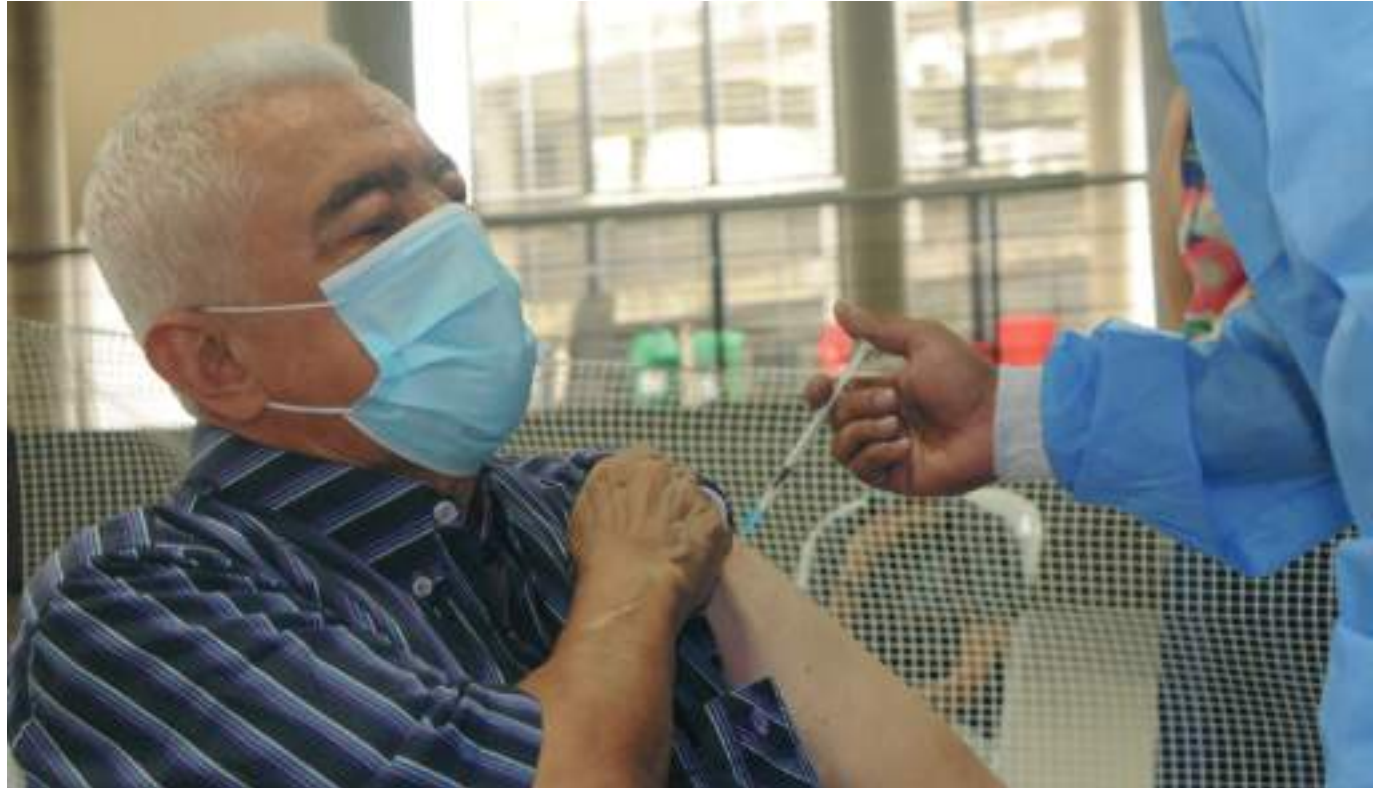
Los adultos mayores han sido a nivel del Departamento lo que más han acudido a cumplir con su esquema de vacunación.

Así mismo la funcionaria les pidió a los adultos jóvenes “que son las personas que tienen tal vez más posibilidades de salir, ver el desfile y estar acompañando di-