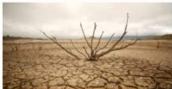
Al ritmo actual el planeta se calentará 3,2 grados este siglo: ONU