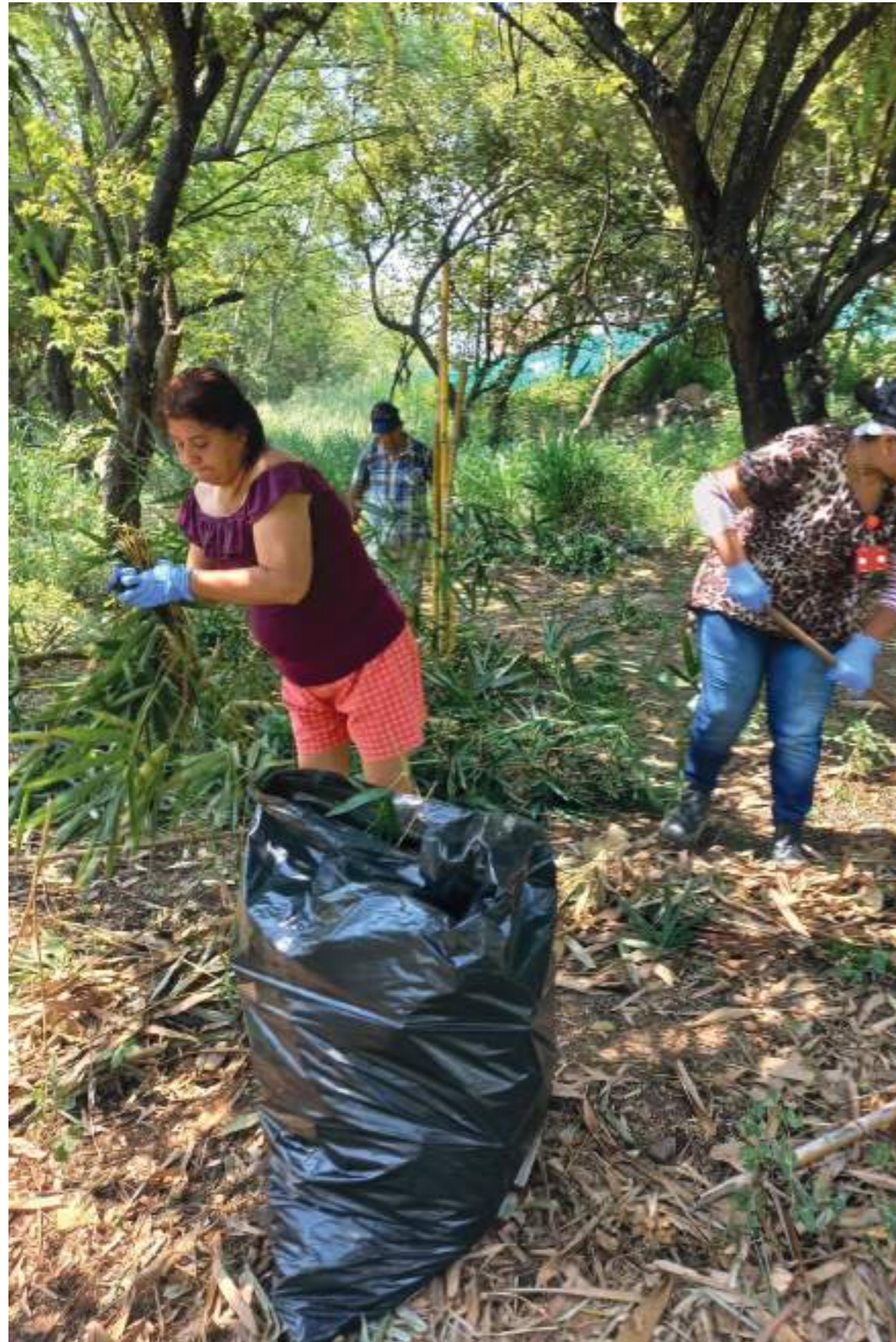
Recolección de materiales y basuras en inmediaciones del Virgilio Barco.

El pasado fin de semana varios de los moradores de este importante barrio de la Comuna nueve se dieron cita en la zona verde para adelantar la jornada que permitió recuperar parte de la misma.