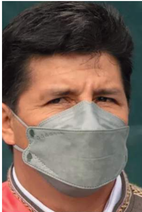
La popularidad de Pedro Castillo se sitúa en el máximo en sus ocho meses de gobierno y muchos prevén que no será capaz de culminar su mandato.

El paso inesperado del toque de queda y estado de emergencia del presidente, es el último giro de un mandatario cuestionado y acostumbrado a cambiar de opi-