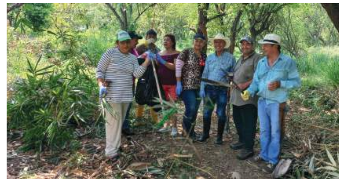
Vecinos del Virgilio Barco y miembros de la JAC trabajan de manera conjunta.

Buscan adelantar un trabajo conjunto con Medio ambiente, Policía ambiental, Ciudad Limpia y la comunidad para recuperar del todo el lote cercano al coliseo de voleibol en construcción.