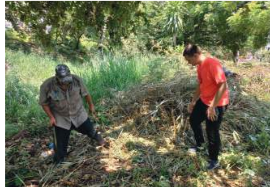
Cada uno de los sectores fue recorrido con el propósito de limpiar.