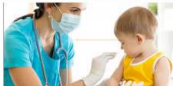
La Influenza, el virus que provocó cuatro epidemias en el último siglo