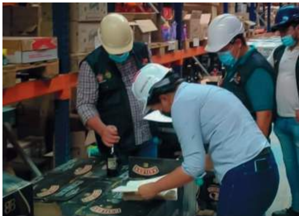
158 botellas de distintos licores fueron incautadas en el 2021 como producto de los operativos anticontrabando.

mente y la que rige en este momento es de color azul, y el material es térmico. “Lo que indica que si aplicamos calor va a cambiar a color blanco. Adicional a esto tiene un código único que debe tener sólo letras, sólo números o combinaciones, debe contener un código QR mediante el cual se pueda hacer la verificación por medio de un ce-