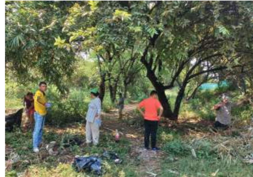
El trabajo fue arduo y lo triste dicen es que no alcanzaron a terminar.