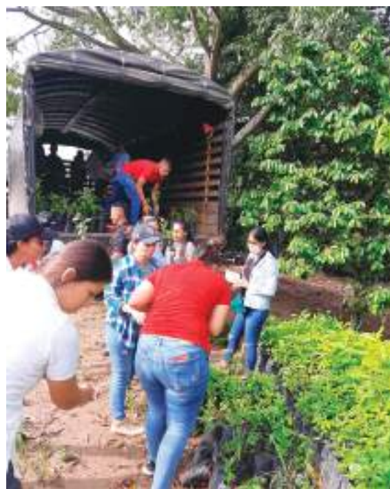
Por su parte, la Administración Municipal destacó que durante su mandato se han sembrado 27 mil árboles en todo el territorio neivano.

Y mientras esta situación se da en el centro de la ciudad, la Administración Municipal destacó que