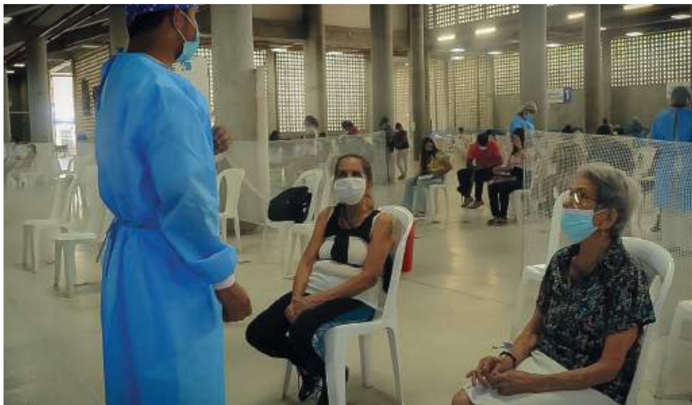
Los puntos de vacunación en la ciudad de Neiva se trasladaron a la ESE Carmen Emilia Ospina.

De acuerdo con los porcentajes, en primeras dosis se tiene un acumulado en el departamento de 79.1%, en la segunda dosis 63.0% y en la tercera 23.9% lo que de-