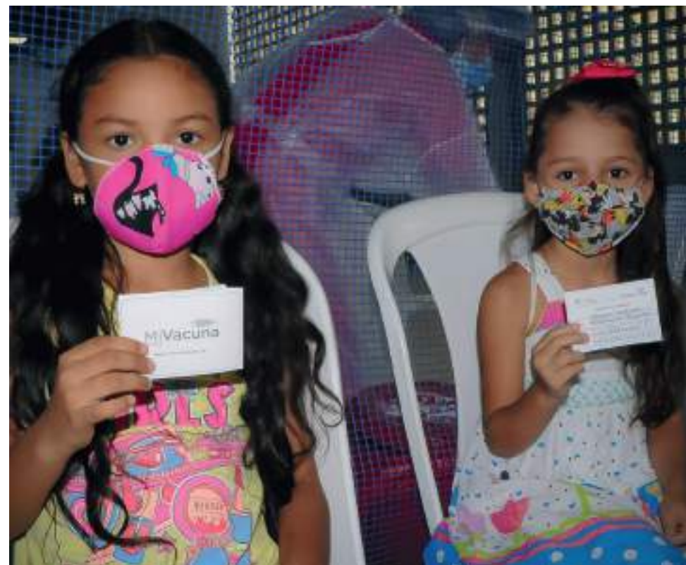
Desde la Secretaría Municipal se invita a los padres de familia a continuar con el esquema de vacunación en niños, niñas y adolescentes.

Sólo en los primeros dos meses del 2022 se han aplicado, en enero 33.908 dosis y en el mes de febrero 18.239. En los diferentes grupos poblacionales se tiene que del grupo de menores de 80 años el 100,16% tiene el esquema completo, de 60 a 79 años el