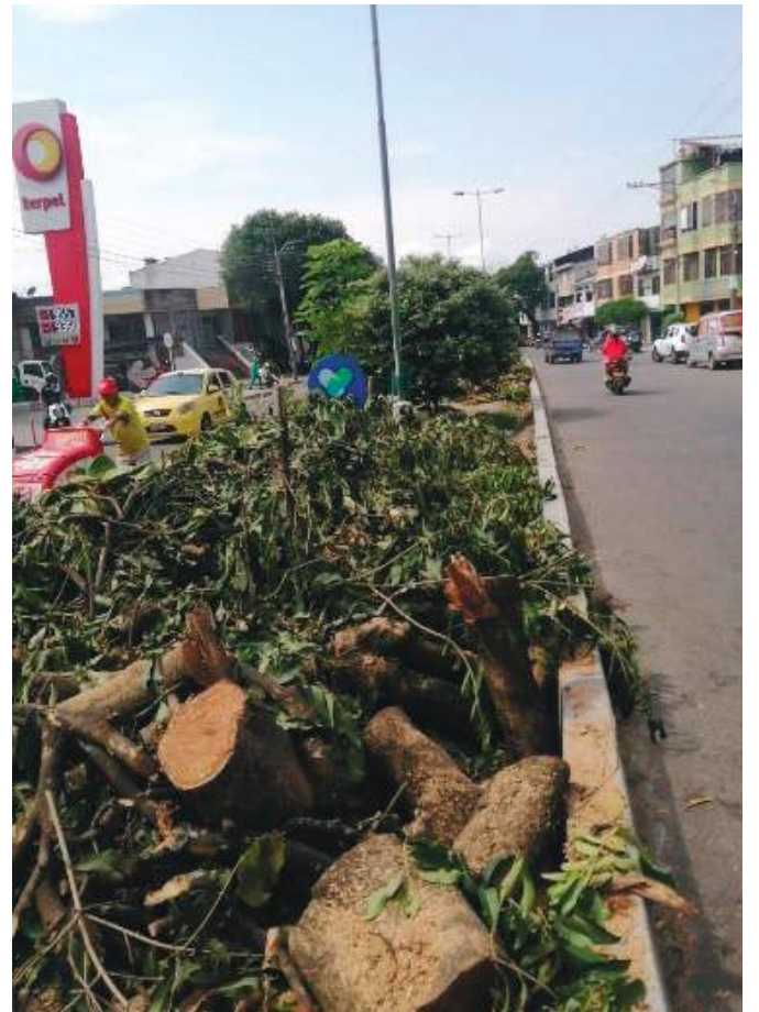
De un total de 166 individuos forestales que conformaron el inventario, la Corporación autorizó el aprovechamiento de 46.

se deben compensar 20 árboles, para un total 920 árboles a reponer; de los cuales 460 individuos forestales nativos del Ecosistema Bosque Seco Tropical deben, concertadamente con la CAM, plantarse y realizar el respectivo mantenimiento por un año, hasta alcanzar los 1,5 metros de altura mínima. Los otros 460 árboles adicionales, serán entregados a la Corporación para su siembra en áreas ambientalmente estratégicas de la ciudad de Neiva enfocadas hacia la protección de la ronda de las fuentes hídricas urbanas”.