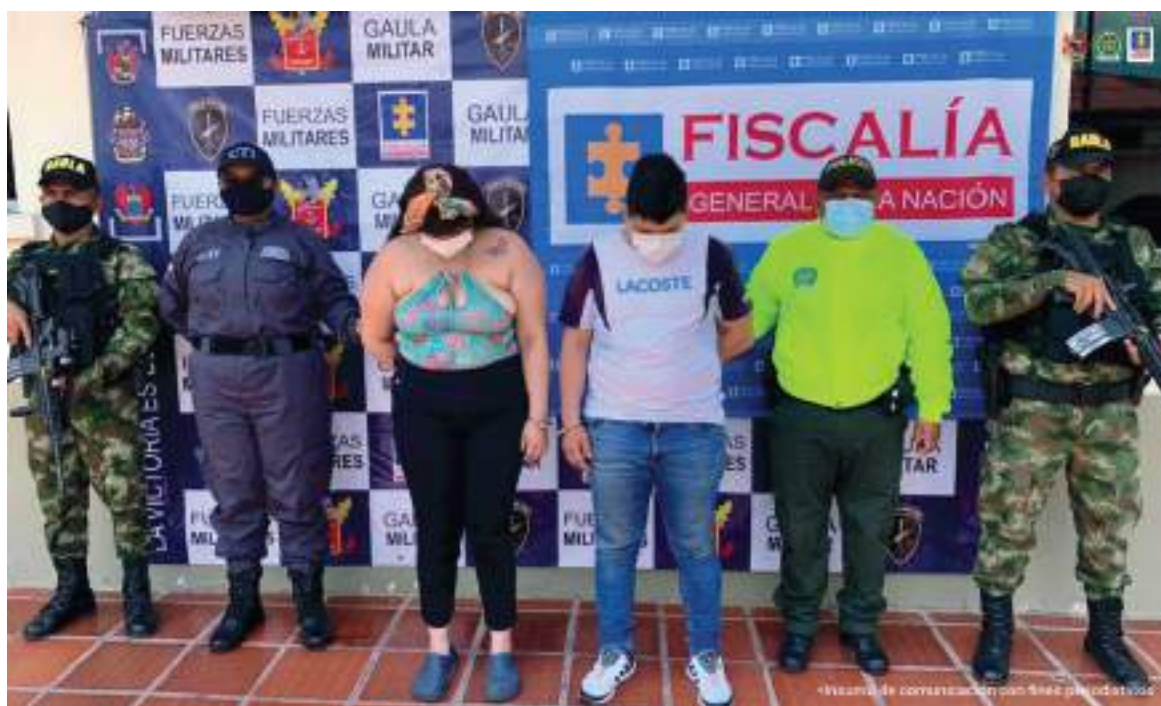
Las capturas se hicieron efectivas en las ciudades de Ibagué y Neiva.

Estas personas, de acuerdo al material probatorio recolectado, presuntamente participaron en