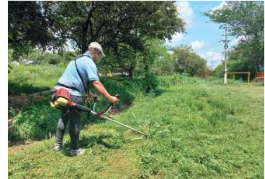
Guadaña en mano, uno de los vecinos recuperando la zona verde.