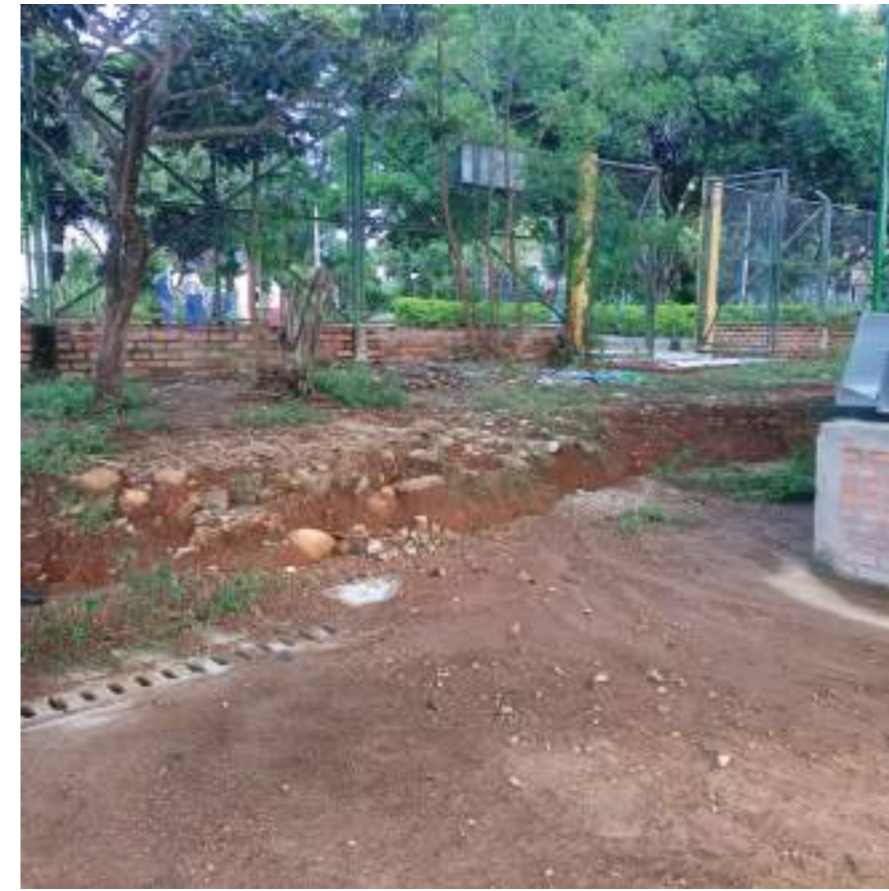
Totalmente tapadas por la arena permanecen las rejillas de desagüe.

Desde el 30 de noviembre del año 2019 la comunidad del barrio La Orquídea sueña con ver su polideportivo convertido en uno de los más nuevos y modernos de la ciudad de Neiva, tal como se concibió en el proyecto de remodelación que inició la Alcaldía de Neiva hace más de dos años. Sin embargo, hoy permanece cerrado sin poder utilizarse y en deterioro. $350 millones de pesos fueron destinados para esta obra.