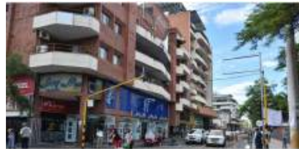
Recomendaciones para la convivencia con tapabocas en espacios abiertos ■ 16 SALUD