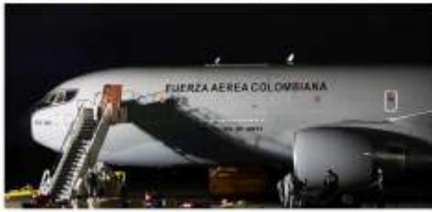
Avión de Fuerza Aérea irá a Ucrania para repatriar colombianos