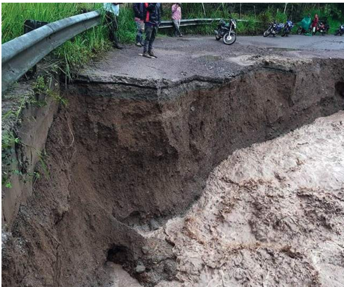
Algunos de los municipios más afectados son: La Plata, Tello, El Agrado, El Pital, Pitalito, Teruel, Palermo, San Agustín, Paicol, Algeciras, Tarqui y Gigante.

prios más afectados son: La Plata, Tello, El Agrado, El Pital, Pitalito, Teruel, Palermo, San Agustín, Paicol, Algeciras, Tarqui y Gigante.