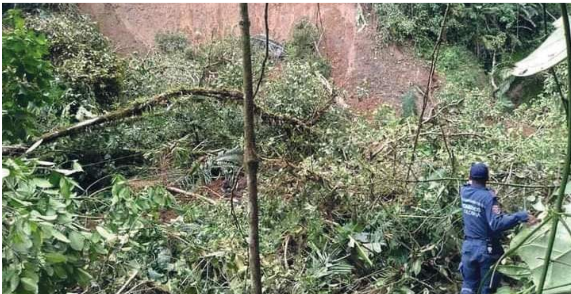
Los seis kits de maquinaria dispuestos por la Gobernación del Huila se encuentran atendiendo las emergencias viales, que tienen aislados diferentes municipios en el departamento.

A la fecha los eventos presentados por lluvias permanentes han sido vendavales, avenidas torrenciales, crecientes súbitas, inundaciones, deslizamientos, inundaciones por insuficiencia de alcantarillado y caída de árboles. Asimismo, hasta el 4 de marzo se reportaron 321 familias damnificadas, 3 viviendas destruidas, 3 heridos, 1 muerto, 282 viviendas averiadas, 127 vías afectadas, 11 puentes vehiculares, 8 puentes peatonales, 14 acueductos, 7 alcantarillados, 14 cultivos y otros daños 146.