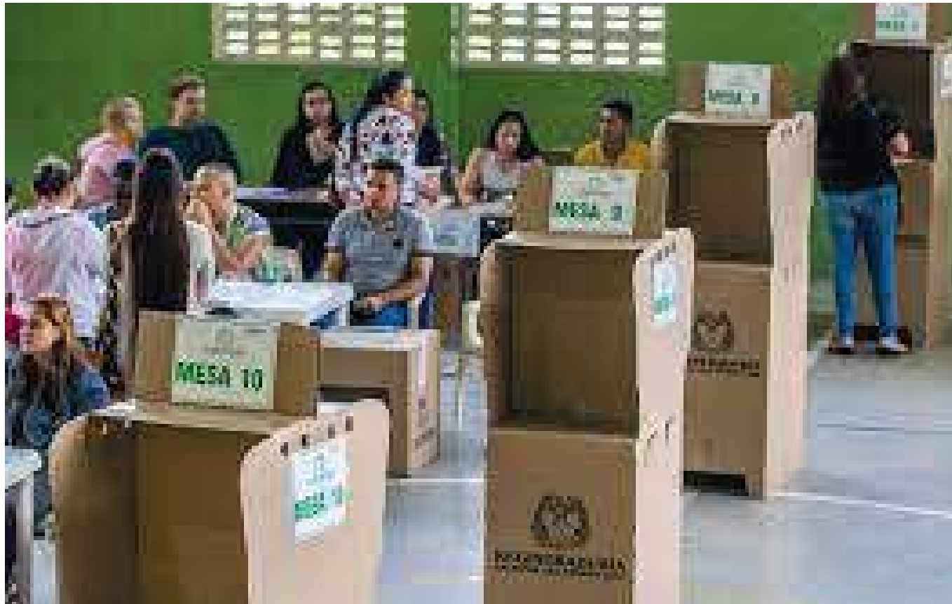
En el Huila habrá 2.538 mesas de votaciones, 233 puestos de votación, de esos 125 son rurales y 108 urbanos.

De esta forma confirmó que, para estas elecciones, habrá 2.538 mesas de votaciones, 233 puestos de votación, de esos 125 son rurales y 108 urbanos. 880.047 sufragantes y seis puestos nuevos en corregimientos. “En Rivera tenemos Río Frío y El Guadual, en Acevedo en el corregimiento El Carmen, Pueblo Viejo y Marticas, y en Timaná en Pantanos”, informó la Delegada.