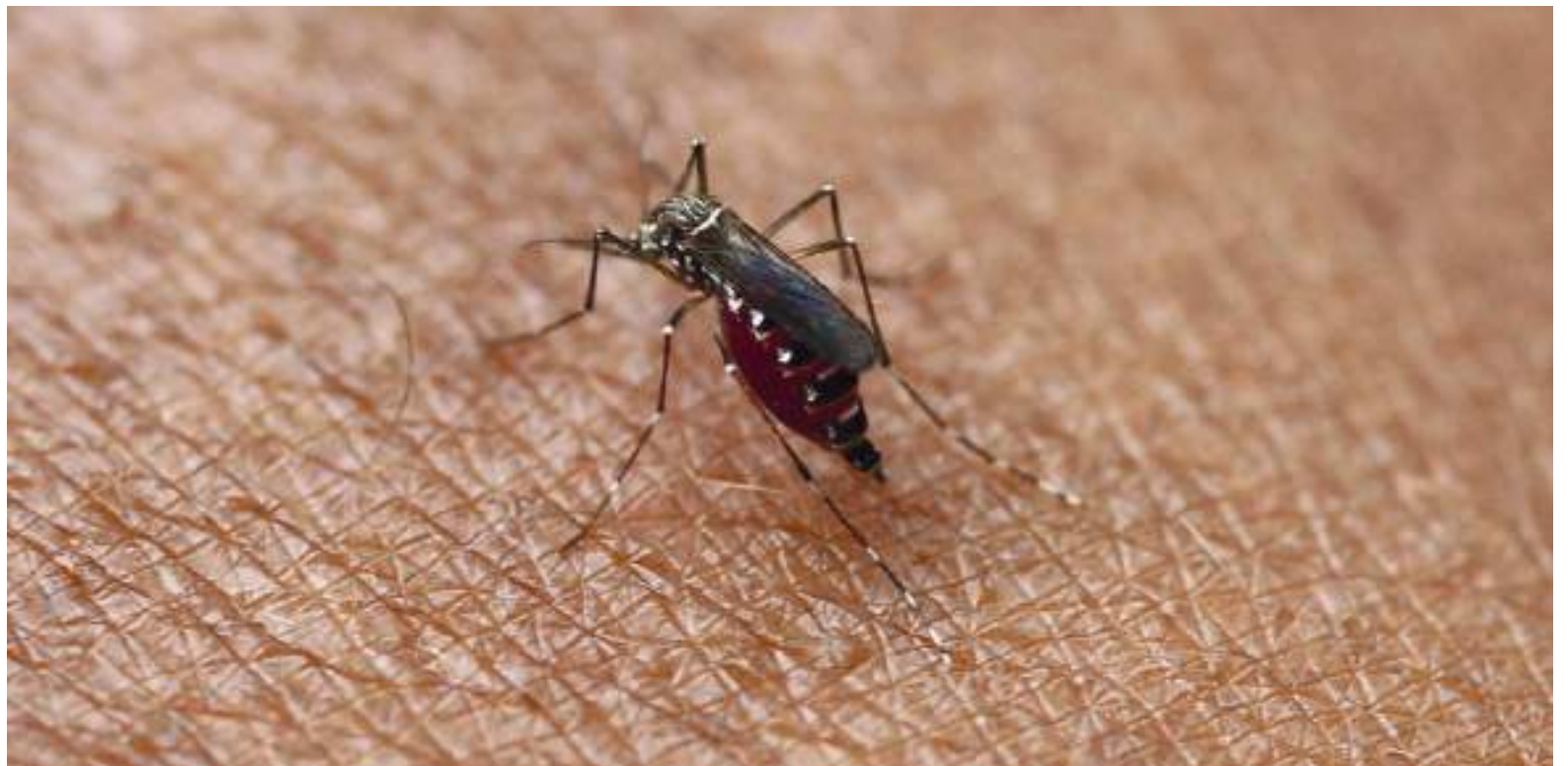
Se implementará una vigilancia epidemiológica mayor en los departamentos de Atlántico, Bolívar, Córdoba, La Guajira, San Andrés y Sucre.

Así las cosas, las autoridades hacen un llamado a la comunidad para atender recomendacio-