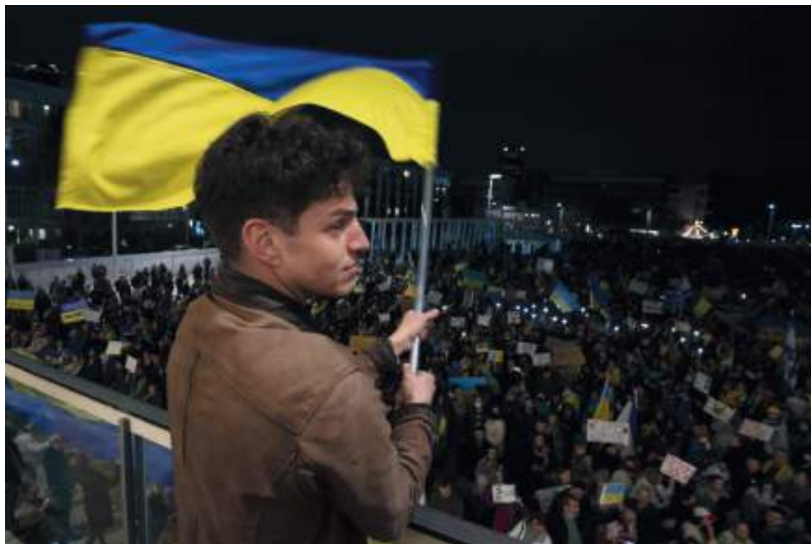
El gobierno colombiano anunció que para el 11 de marzo la Fuerza Aérea y la Cancillería enviarán un avión a Ucrania para repatriar a los colombianos.

Por ahora se sabe que los colombianos evacuados ya se encuentran en Polonia y otros países cercanos, algunos han tomado distintos caminos, aunque, algunos aún se encuentran a la espera de poder definir su situación, puesto que tenían planes establecidos en ucrania: “Hay 26 colombianos hospedados en Varsovia, uno en Lublin, 5 en el puesto de asistencia de frontera y 9 en Hungría, hasta hoy la Cancillería tiene un registro de 293 colombianos con registro en Ucrania”.