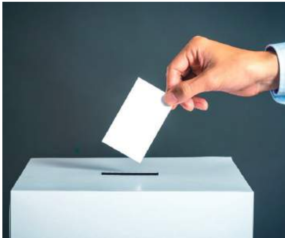
Colombia está siete días de las elecciones legislativas.

propuestas, era como estar metido en la caseta de un San pedro con música y trago. Eso no me gusta”.