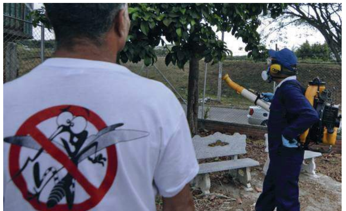
La autoridad en salud nacional hizo un llamado de alerta para continuar y reforzar las acciones de vigilancia y autocuidado requeridos para disminuir la infección por covid-19.

cionadas con el frecuente lavado de manos, conservar la distancia con las personas que no viven en el hogar, evitar el contacto con personas enfermas, las aglomeraciones y espacios mal ventilados. Así mismo, se llamó la atención para fortalecer la cobertura de vacunación en la población.