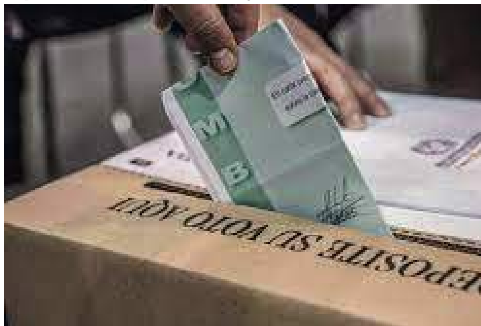
Está garantizado el orden público durante las elecciones.

“Me siento contento porque el departamento del Huila no cuenta con riesgo electoral para estas elecciones, ya que sabemos que esta región era golpeada por la violencia, y hoy podemos decir que las mesas de votación están garantizadas, la participación política nos informa que el Tribunal de Garantías está en total normalidad y la Fuerza Pública comprometida con las elecciones”, indicó