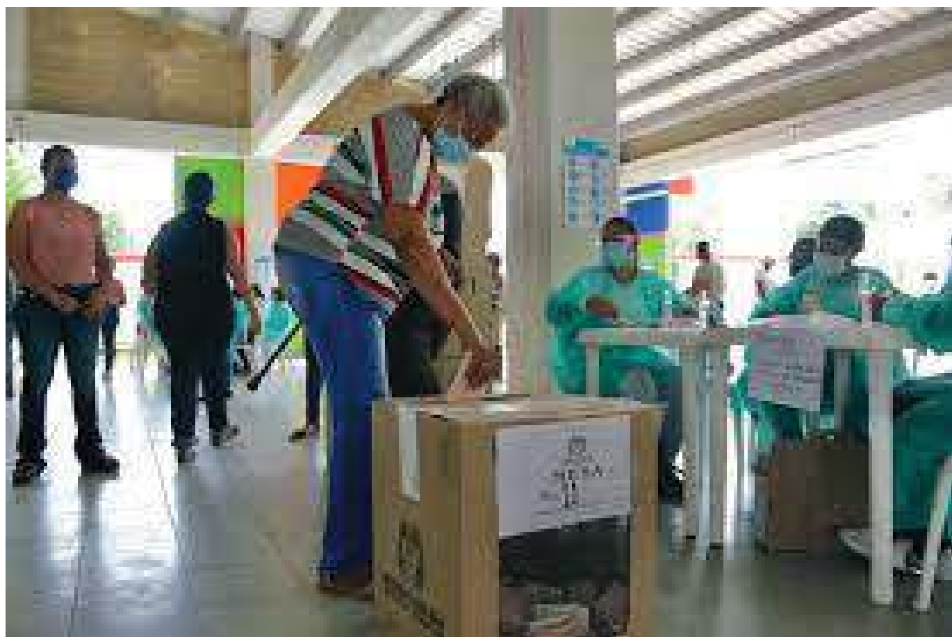
Este domingo 13 de marzo están llamados a votar casi 39 millones de electores en todo el país, que podrán ejercer su derecho en más de 12.500 puestos de votación en todo el país.

Según datos de la Registraduría, para estas elecciones hay 1.562 candidatos en 268 listas a la Cámara en todo el país. Entre ellas: 974 candidatos en todo el país, 23 candidatos para las listas indígenas, 974 candidatos afrodescendientes y 23 de circunscrip-