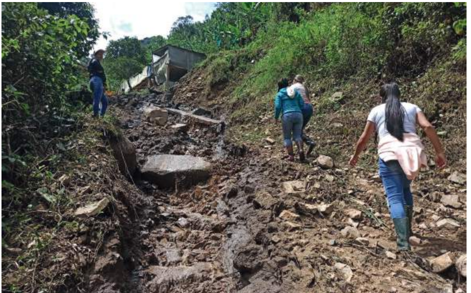
Los alcaldes de varios municipios del Huila afectados durante la primera temporada de lluvias del año, han elevado un angustioso llamado al Gobierno Departamental y Nacional pidiendo ayudas.