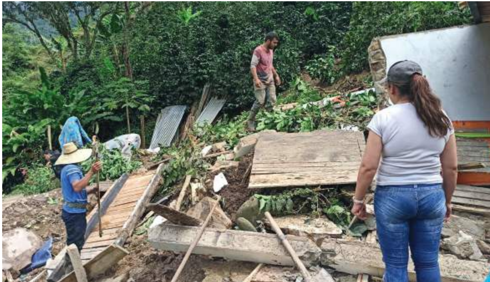
Las fuertes lluvias en el departamento del Huila, no dan tregua y continúan causando estragos lamentables en la región.

San Agustín: Reportó que debido a las fuertes lluvias que se han presentado en días anteriores dos importantes vías terciarias del municipio presentan afectaciones por pérdida de la banca, en la vereda San Lorenzo y en la vereda Alto Frutal. No se presenta afectación a personas, ni viviendas de los dos hechos reportados en las vías.