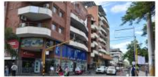
Recomendaciones para la convivencia con tapabocas en espacios abiertos