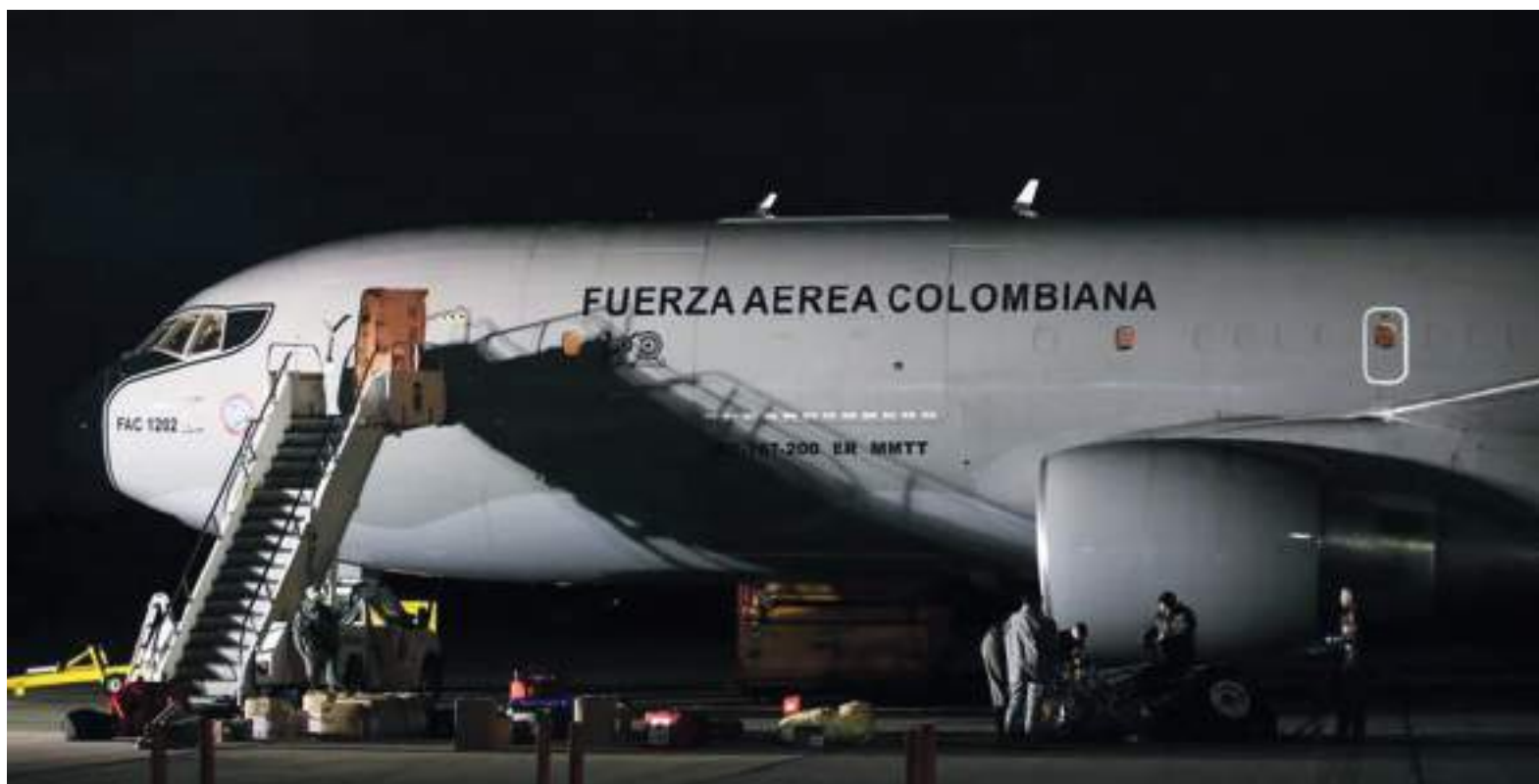
La tensión entre Ucrania y Rusia continúa, pues los gobiernos no han podido llegar a un acuerdo que complazca a las partes.

Las alianzas entre países han buscado facilitar procesos en el