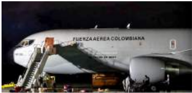
Avión de Fuerza Aérea irá a Ucrania para repatriar colombianos ■ 117 INTERNACIONAL