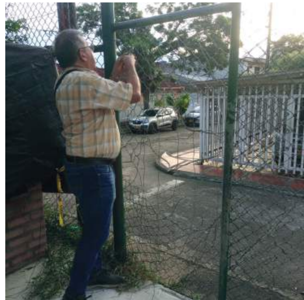
La comunidad se ha encargado de arreglar la malla que otras personas dañan para ingresar al polideportivo que aún no está en funcionamiento. Estas canales permanecen abandonadas en la gradería del polideportivo.