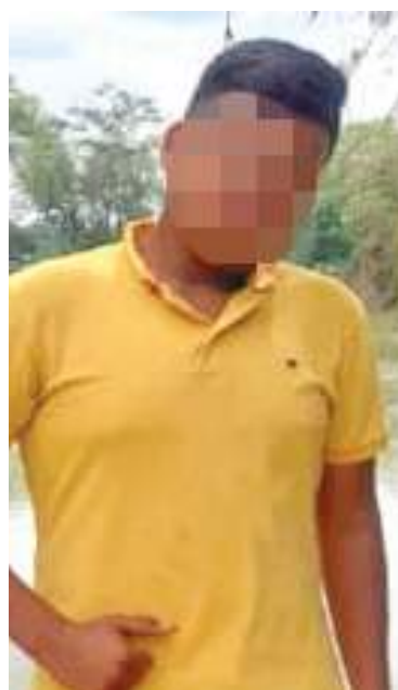
Las víctimas reciben atención médica. Las autoridades investigan los móviles del hecho.

“Estamos haciendo patrullajes en todas las zonas, pero yo llamo a los padres a ayudarnos a verificar dónde están sus hijos, nosotros podemos tener muchas cámaras, patrullas y personal, pero si no tenemos ayuda desde la casa, todo se hace más difícil”, manifestó el Coronel.