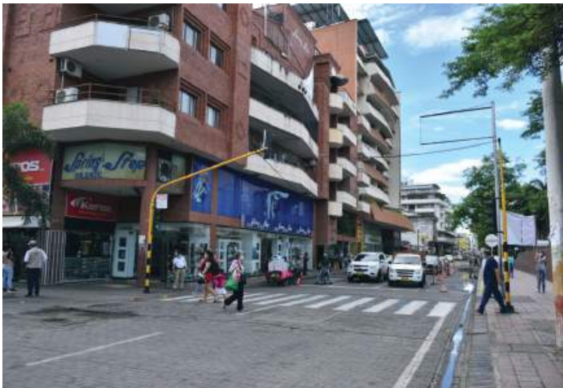
El Ministerio de Salud anunció el pasado 23 de febrero que los municipios en el país que contaban con el 70% de su población inmunizada contra el covid-19, quedaban exentos de la medida que establecía la obligatoriedad del uso del tapabocas en espacios abiertos.

Según el último reporte de la cartera de Salud en el país actualmente 35.263.024 ciudadanos cuenta con la primera dosis del biológico, 27.625.225 ya han completado su esquema de vacunación y 8.899.380 ya se han aplicado su dosis de refuerzo a través del Plan Na-