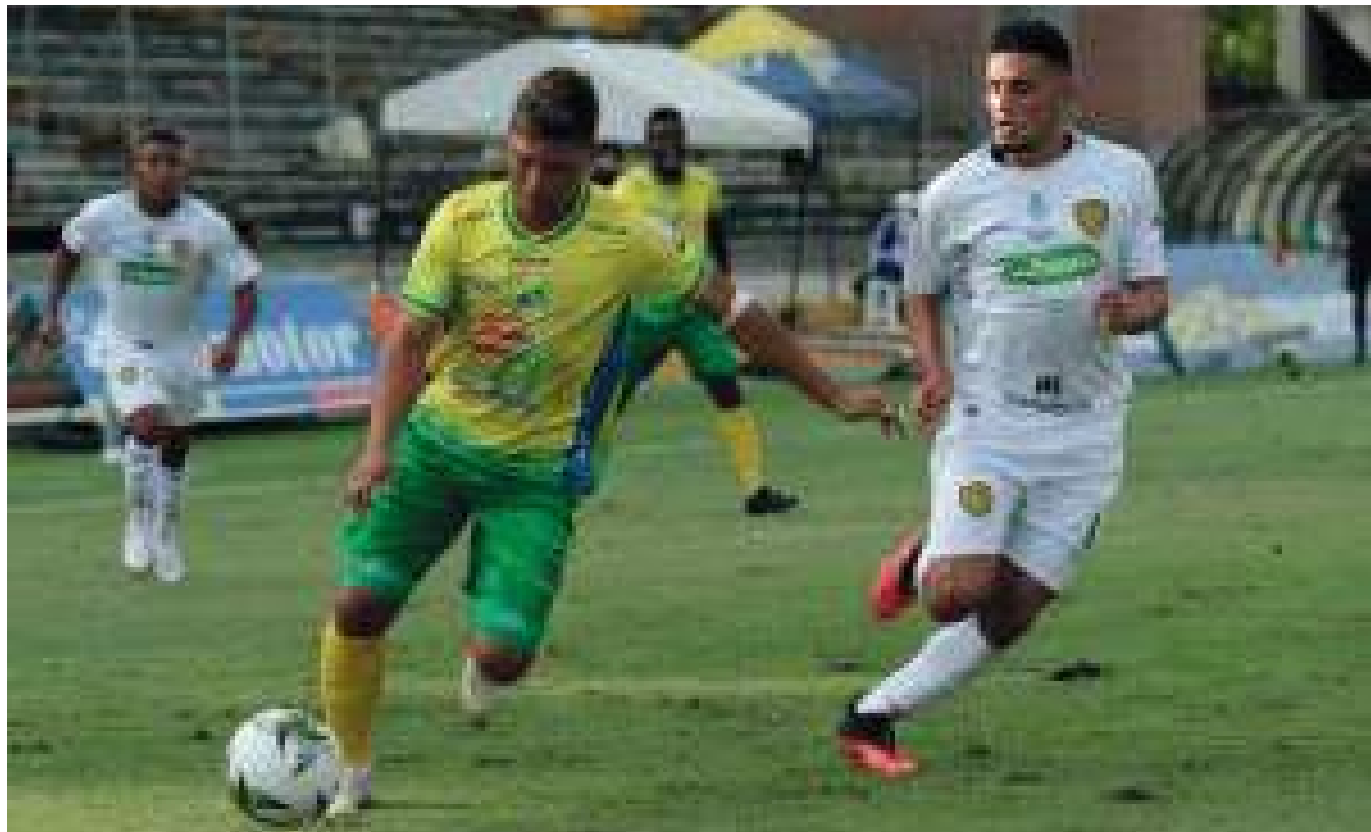
Atlético Huila enfrenta hoy al líder Leones.