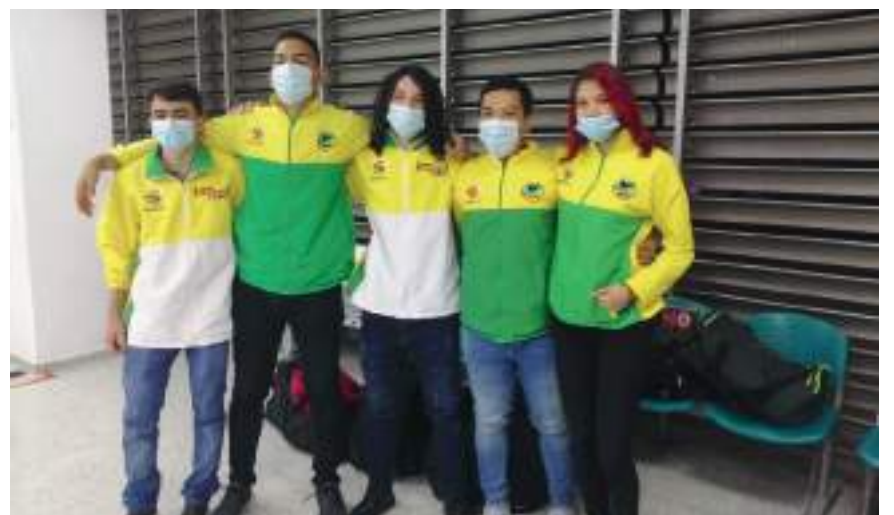
Parte de la delegación huilense que viajó a Zipaquirá.