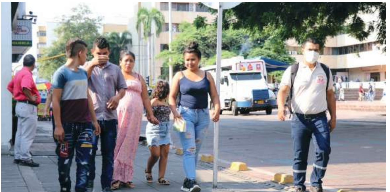
Según el último reporte de la cartera de Salud en el país actualmente 35.263.024 ciudadanos cuenta con la primera dosis del biológico, 27.625.225 ya han completado su esquema de vacunación.

El jefe de cartera de Salud aclaró a su vez que el sistema de transporte público no opera como espacio público por lo que se tendrá que seguir usando el tapabocas. “Ahí hay una cercanía y aglomeración y, en general, no hay las condiciones de ventilación”, argumentó Ruiz.