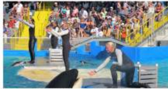
La orca Lolita abandona «el mundo del espectáculo»