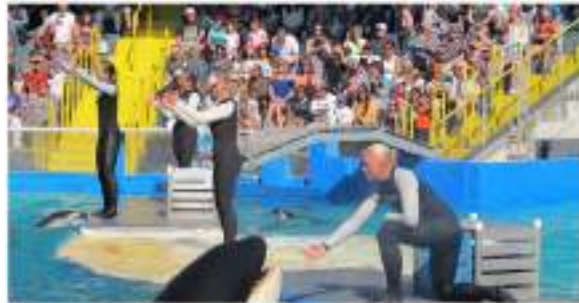
La orca Lolita abandona «el mundo del espectáculo» ■ 20 CONTRAPORTADA