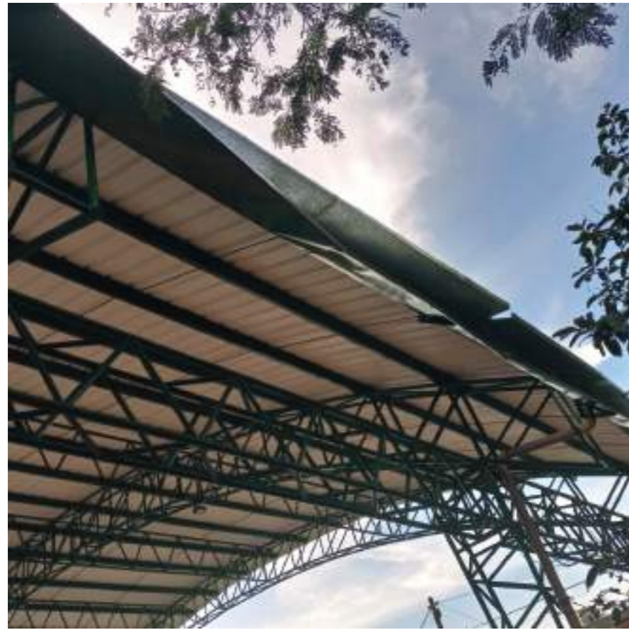
Canal que se deterioró con las fuertes lluvias presentadas en los últimos días. Charcos se forman en la cancha debido a que no cuenta con un desagüe de aguas lluvia debidamente instalado.

“Me da lástima la situación de nuestro parque porque esto lo hemos recuperado poco a poco, aquí se luchó por un encerramiento ya que venían personas de otros lados a consumir sustancias alucinógenas, había riñas entre muchachos, cada ocho días la gente se quejaba de escándalos y ruidos, y todo eso se ha ido mejorando”