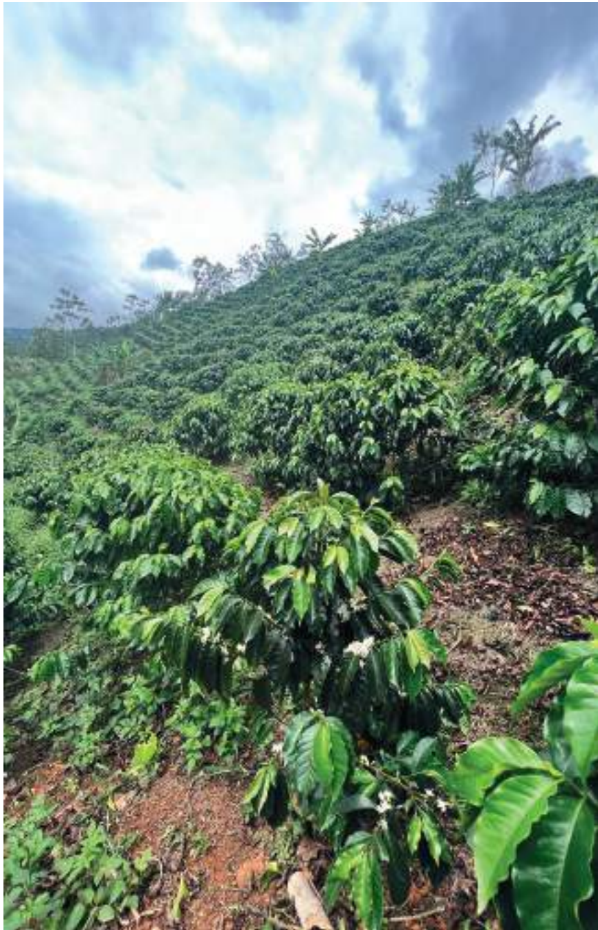
Cultivos de las fincas donde se recoge el café de la marca Sweet Coffee en el municipio de Pitalito, al sur del departamento del Huila.

Para el mes de marzo del 2022 se registró una caída en la producción del 13% donde se vendieron 914.000 sacos de café verde frente a 1,1 millones de sacos producidos el año inmediatamente anterior para el mismo mes, producto aparentemente por las fuertes condiciones de lluvias que presentó el departamento en los primeros meses del año.