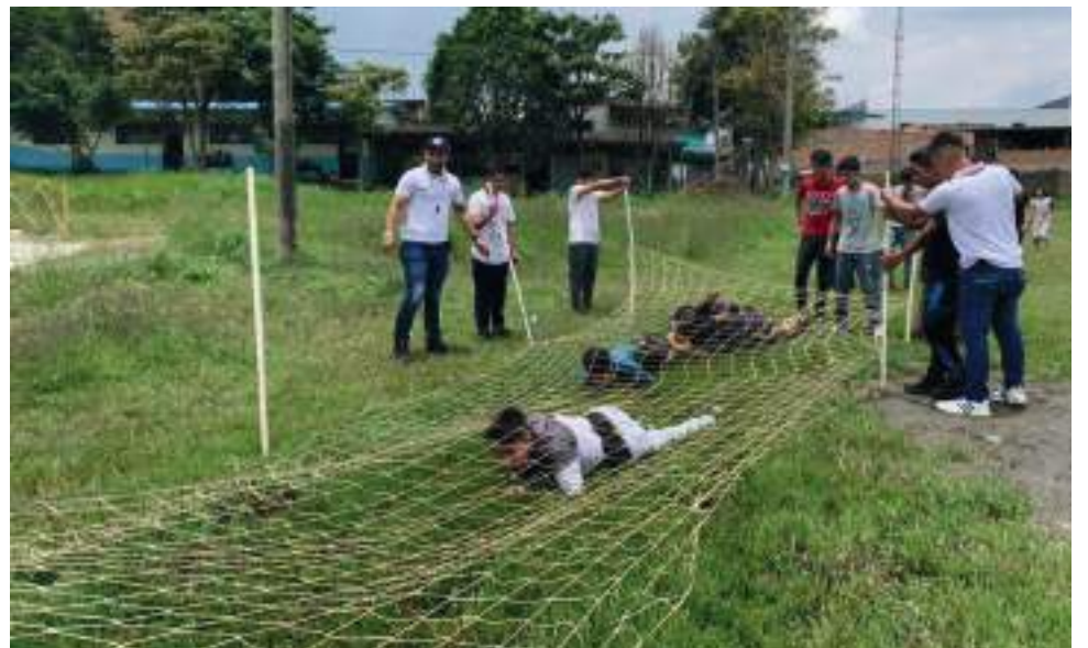
El deporte y la recreación son derechos de los jóvenes establecidos por la ley del deporte.

“Estas etapas de crecimiento se alcanzan de acuerdo a cómo van clasificando sus espacios de formación y van aumentando, subiendo en su nivel o rango. Se empieza con la semilla, del proyecto que se parece a un árbol de café, la primera es esa semilla en la que se ubica el aspirante que ingresa se capacita, después de una prueba sube, pasa a tallo, luego sigue a fruto, flor, hoja raíz y termina en árbol mayor que es el grado más alto de los campamentos juveniles. Eso es básicamente lo que representa el programa en el que hay una buena acogida en todo el Huila”, concluye.