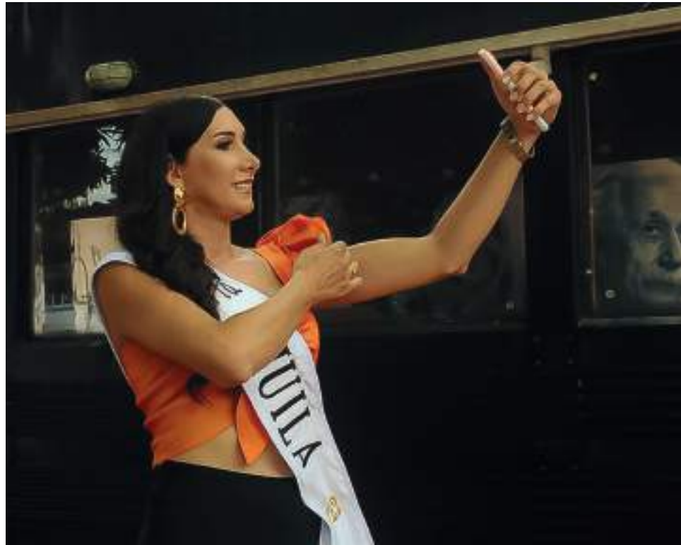
Esta joven neivana de 24 años, es docente y actualmente funcionaria pública quien hace parte del equipo del programa de diversidad sexual.

Según contó la candidata al certamen “Nuestra Belleza Trans Colombia”, ella se viene preparando desde finales del año pasado, tanto psicológica, intelectual y física-