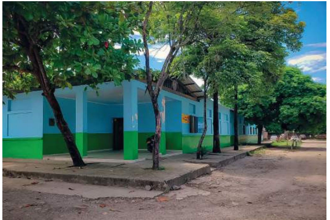
Las vías de acceso a la Institución Educativa Renacer están en mal estado según lo que denuncian los padres de familia y esto hace difícil el acceso al colegio.

dora del plantel, pero ésta les ha manifestado que “debemos esperar a que la Alcaldía solucione los problemas pues son competencia de ellos suministrar estos servicios”, agregó.