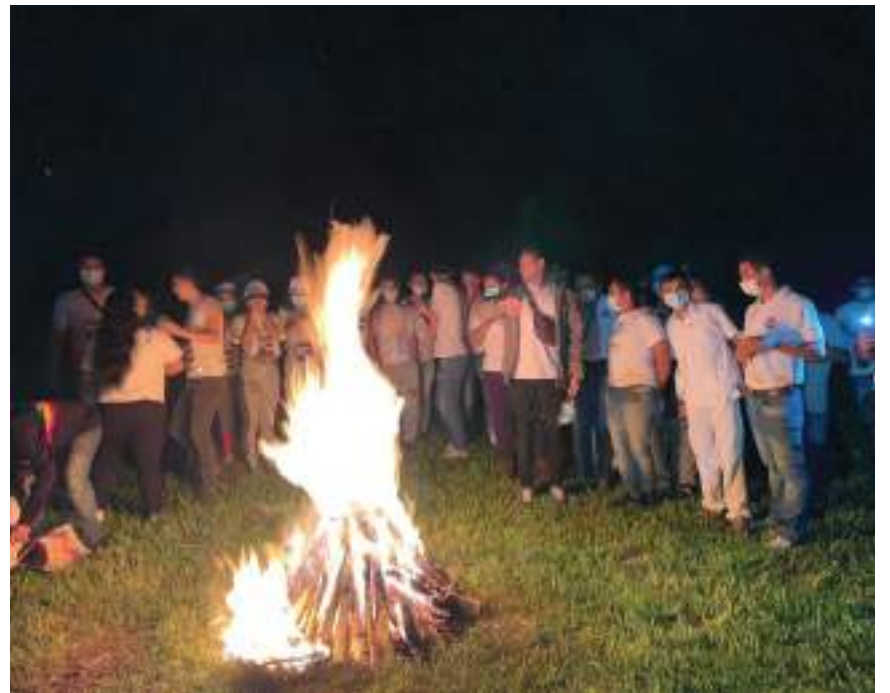
Alrededor de una fogata se realizan actividades culturales.