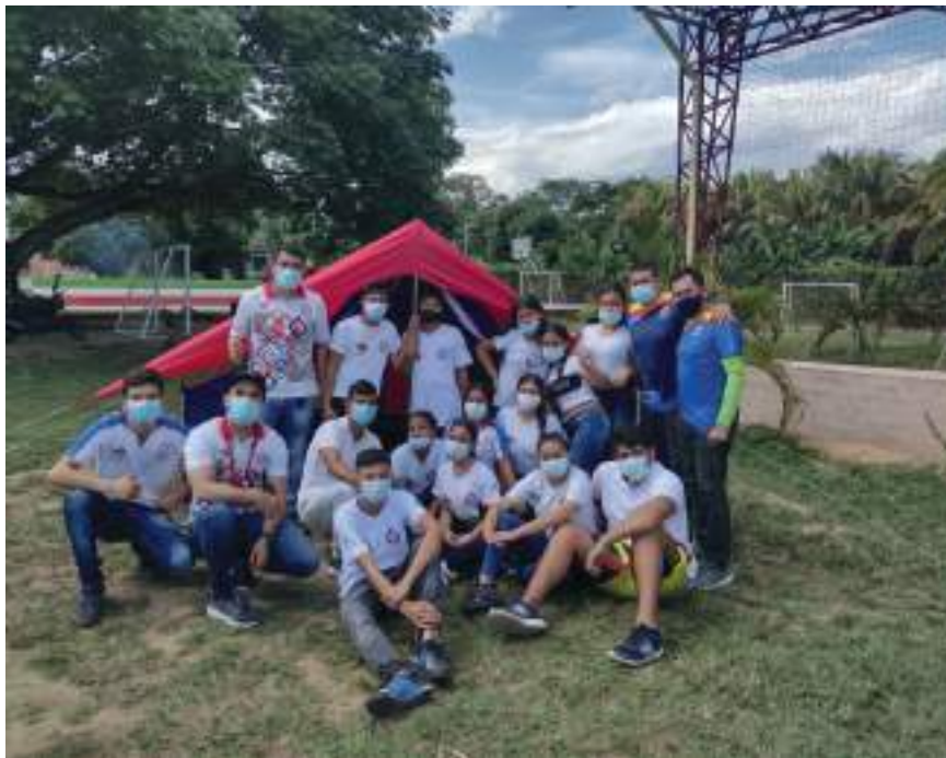
Los campamentos juveniles son encuentros de formación para la vida.

Esta es una estrategia liderada por el Ministerio del Deporte y articulada con cada uno de los entes territoriales para brindar espacios a los jóvenes en su formación y crecimiento de cara a su proyecto de vida.