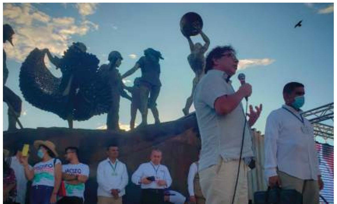
En Neiva, el candidato del Pacto Histórico Gustavo Petro se dirigió a los surcolombianos en la Plaza Cívica Los Libertadores de la capital opita.