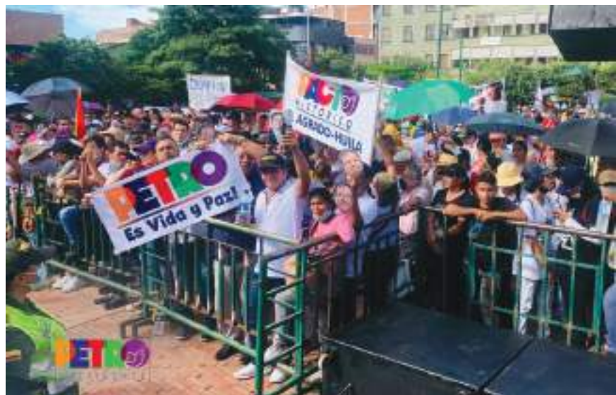
Varios huilenses le hicieron una entusiasta bienvenida.