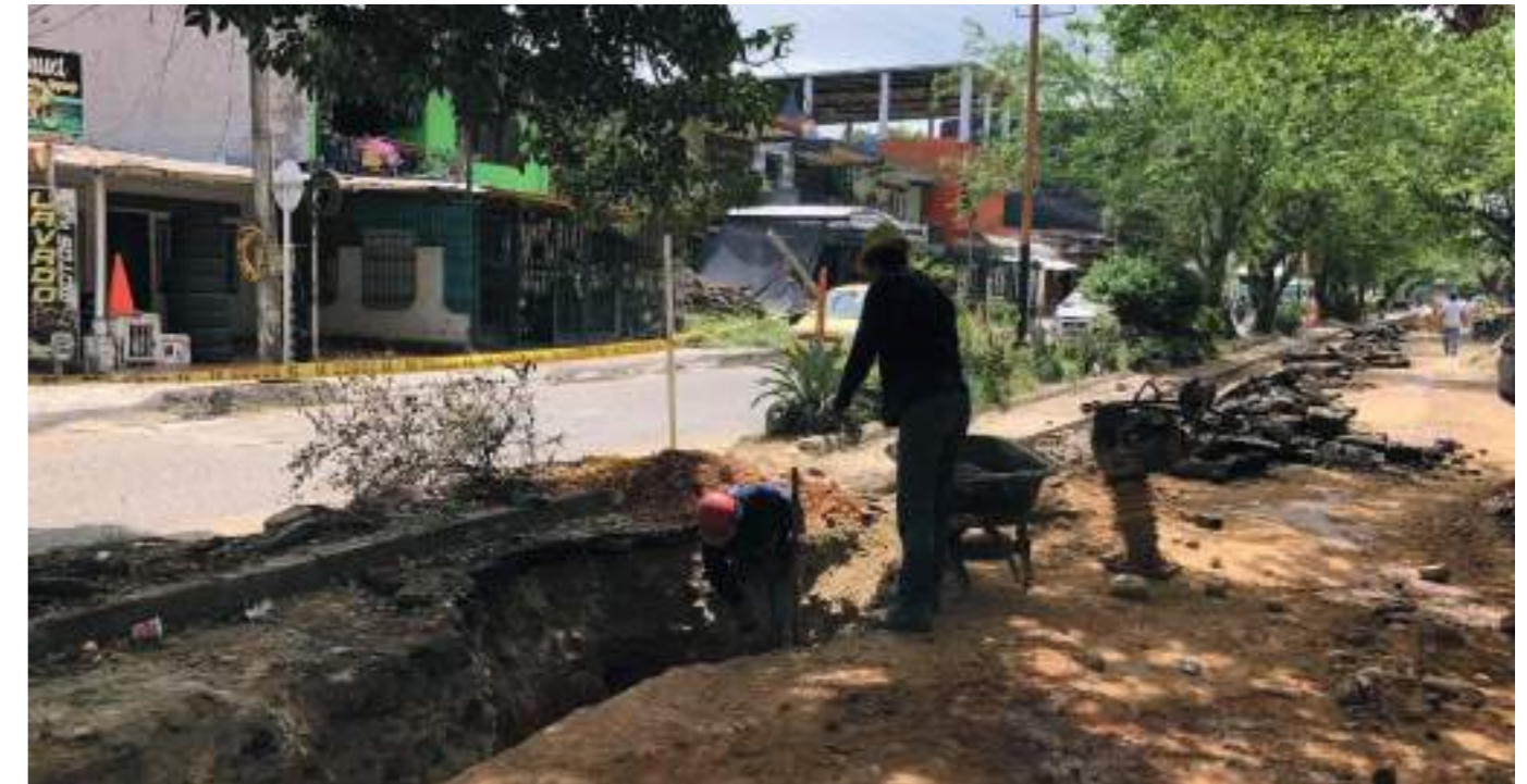
Cuadrillas de obreros trabajan en la restitución de redes.

Finalmente, dijo que le pide a la comunidad que tengan un poco de paciencia, ya que son obras de beneficio, no solo para la comuna cinco sino para toda la ciudad.