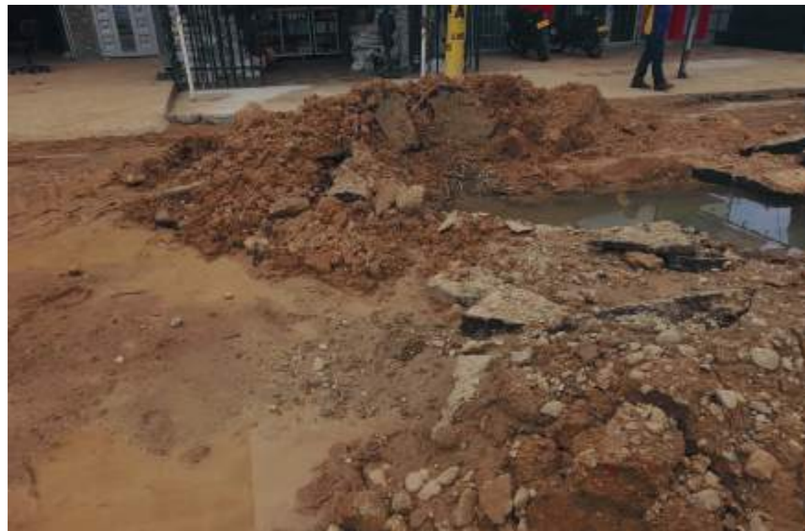
Los trabajos se deben realizar bajo tierra.