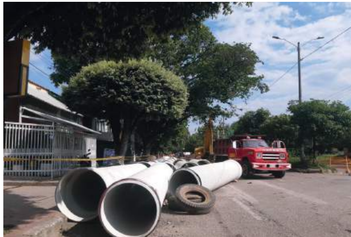
Tubos en PVC que se están instalando en la red de alcantarillado y que reemplazarán por los antiguos.