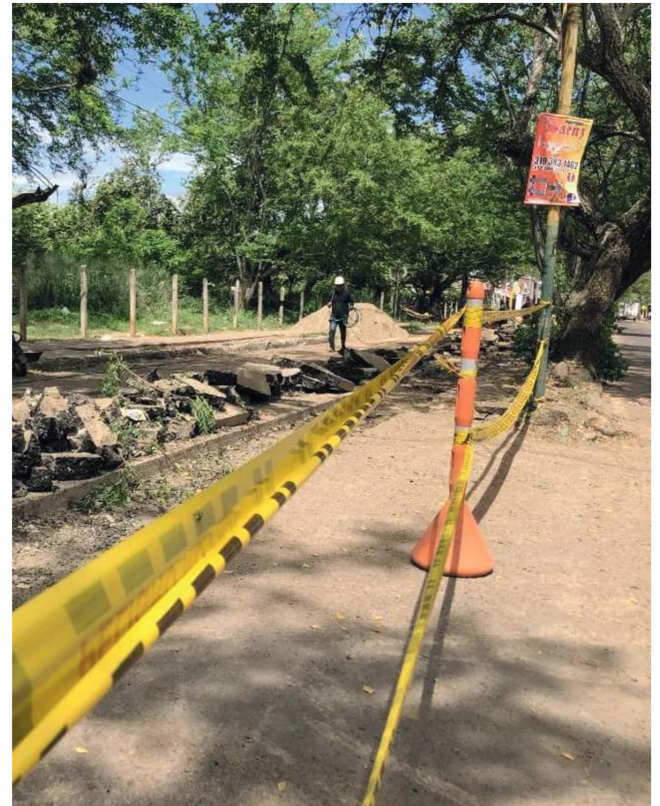
Intervenciones en el sector de Buganviles hasta la 45.

Gloria Vanegas explicó cómo se viene trabajando en dos frentes que se desarrollan de forma simultánea, de un lado para la restitución de la red de alcantarillado y por el otro la red de acueducto.