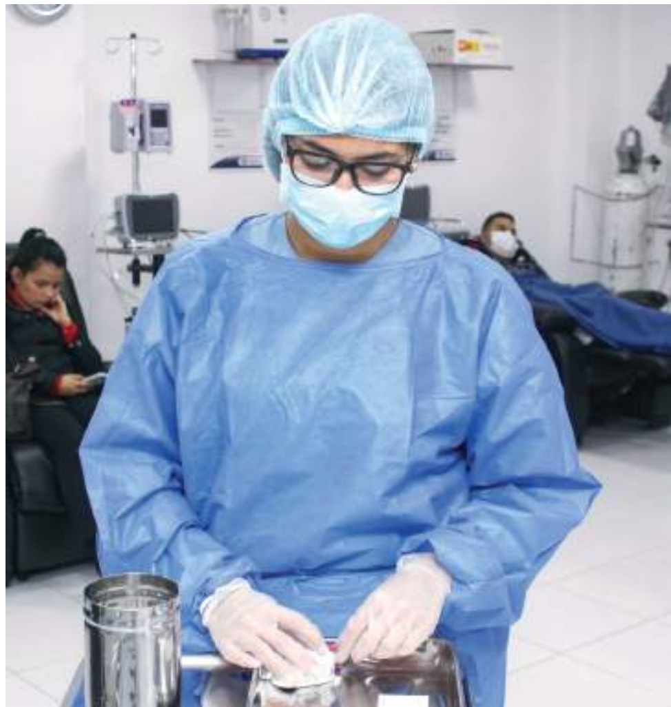
Los empleadores deben asumir la obligación de cubrir el costo de las evaluaciones médicas ocupacionales, pruebas o valoraciones complementarias de sus trabajadores dependientes.

También podrán dirigirse de manera presencial a cualquiera de las Direcciones Territoriales y Oficinas Especiales de la cartera laboral en las distintas regiones del país.