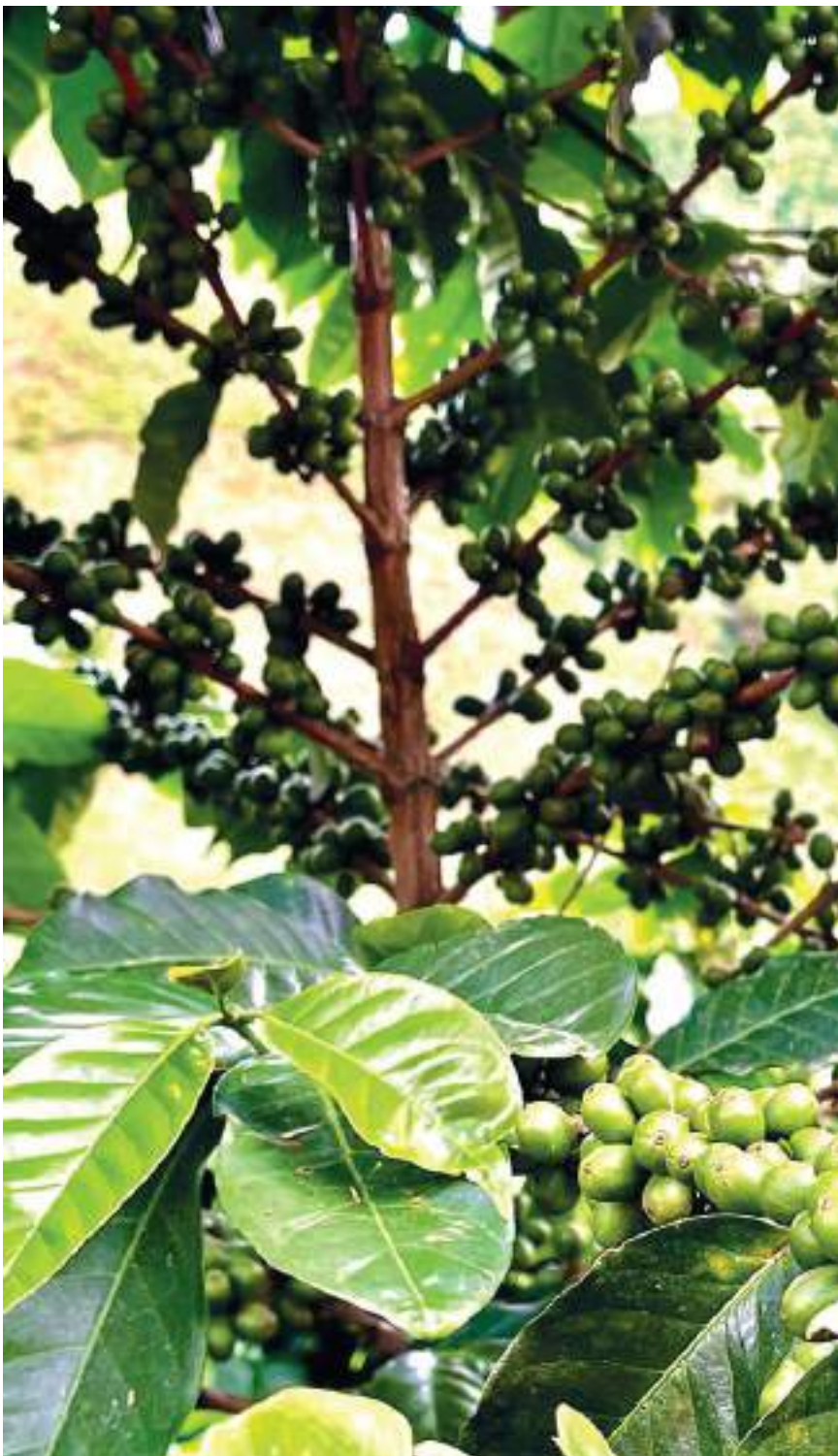
Los cultivos de café han sido los más afectados con el invierno que ha vivido el Huila en lo corrido del año 2022.

En este momento cultivar una hectárea de café está alrededor de 1 millón 600 mil pesos lo cual deja un margen de ganancia muy bajo teniendo en cuenta que el precio interno de referencia está a $2.010.000 tal como lo estipula la FNC.