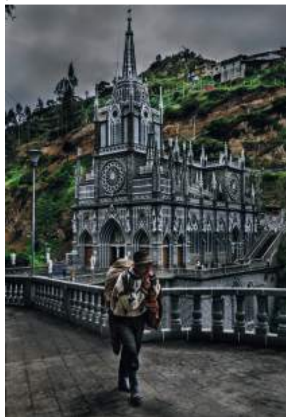
IpiALES, Nariño, uno de los destinos nacionales por excelencia en Semana Santa.

Buga (Valle del Cauca). Donde se encuentra la Basílica del Señor de los Milagros, es un lugar de peregrinaje de feligreses para llevar sus peticiones y hacer oración.