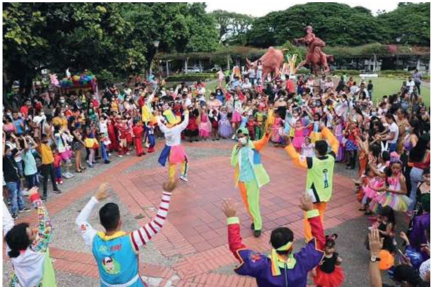
'Doctores Juguetes' nació hace seis años en la ciudad de Neiva, precisamente con el fin de ayudar a niños con diferentes patologías y vulnerados de la región.

En efecto, quienes integran esta fundación, se enfocan en apoyar, acompañar y realizar dinámicas en épocas importantes para los niños. "Buscamos lugares más vulnerables como asentamientos, en donde la vulnerabilidad de los niños es notoria y amplia.