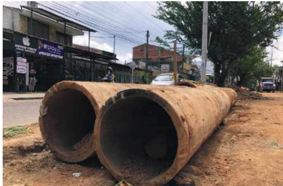
Los viejos tubos en asbesto que son reemplazados.