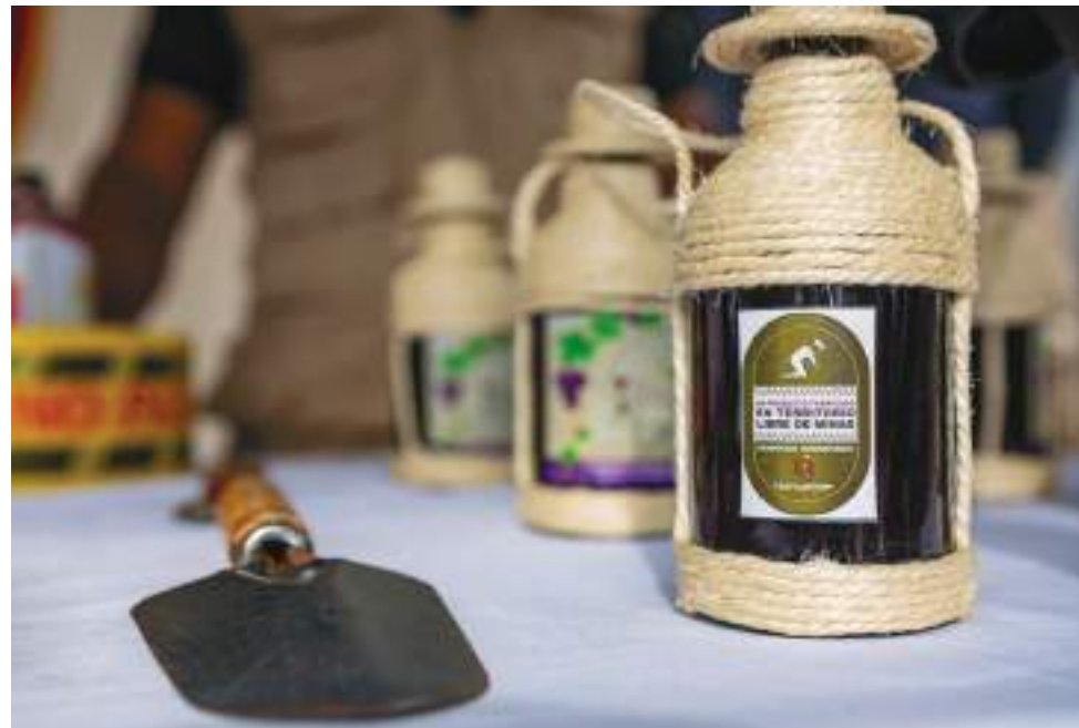
Este agricultor puede transitar seguro durante la búsqueda del fruto silvestre para la elaboración del único vino de agraz que a nivel Colombia es completamente orgánico.

“El año pasado en octubre, Santa María fue declarado como municipio libre de minas. Por mi labor en el campo, el Batallón de Desminado me seleccionó para brindarme su apoyo y mediante la etiqueta de territorio seguro, dar a conocer mis productos al mundo”