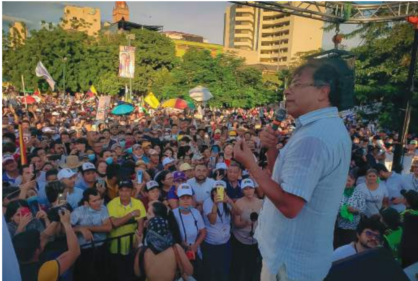
Desde la plaza cívica Los Libertadores de Neiva, Gustavo Petro se dirigió a los surcolombianos

Durante casi una hora que tuvo en sus manos el micrófono, fue poco lo que Petro dejó conocer de manera clara sus propuestas, ensimismado en su discurso. Faltan