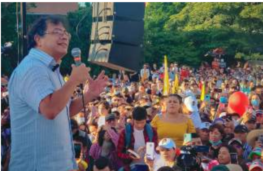
Los simpatizantes se expresaron su pleno respaldo al candidato del Pacto Histórico.

“Si queremos una Colombia potencia de la vida tenemos que cambiar la política de seguridad, por ejemplo. La seguridad no se debe medir en muertos, la seguridad se debe medir en vida”.