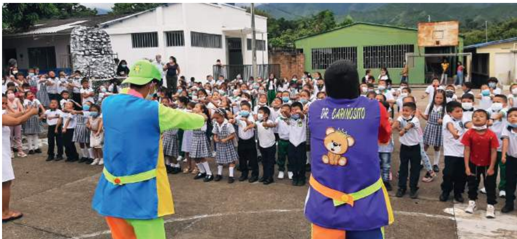
Aparte de luchar por la primera infancia, también apoyan a adultos mayores y habitantes de calle.

El Día del Niño es una fecha que resalta el papel de la primera infancia en la sociedad, la promoción de sus derechos y desarrollar actividades para su bienestar, sin embargo, aunque es una celebración no hay que olvidar la realidad que viven a diario muchos de ellos.