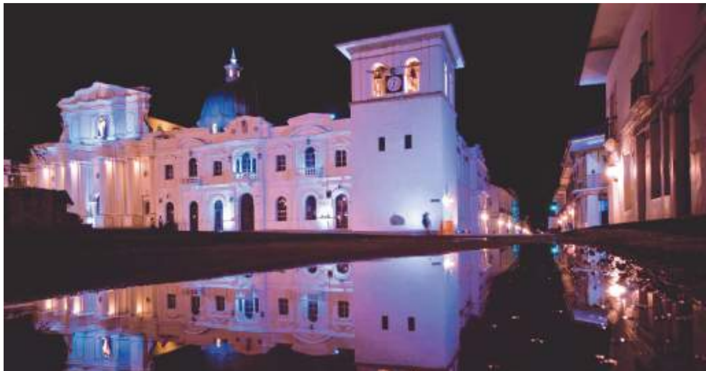
En el territorio nacional se prevé la circulación de 1,3 millones de personas, entre nacionales y extranjeros, durante Semana Santa.

Al comparar la cifra del PIB 2022 del segundo trimestre en 2019, que alcanzó los 8 billones de pesos, se confirmaría que este año superará las cifras que se tenían antes de pandemia en cerca del 50%. Por el lado de la tasa de ocupación hotelera, para marzo de este año se calcula que estará