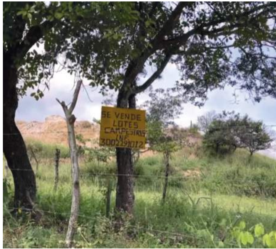
Imagen que evidencia la venta de lotes en el sector de la Vega del Oriente, en Campoalegre.