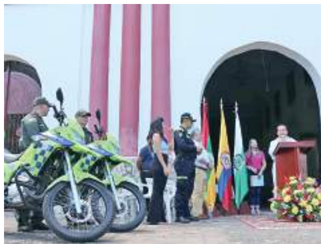
La Alcaldía de Neiva realizó en El Caguán la entrega de dos motocicletas destinadas para el servicio del Modelo Nacional de Vigilancia Comunitaria por Cuadrantes.

La Policía Nacional afirmó que continuará con apoyo de las autoridades político administrativas, aunando es-