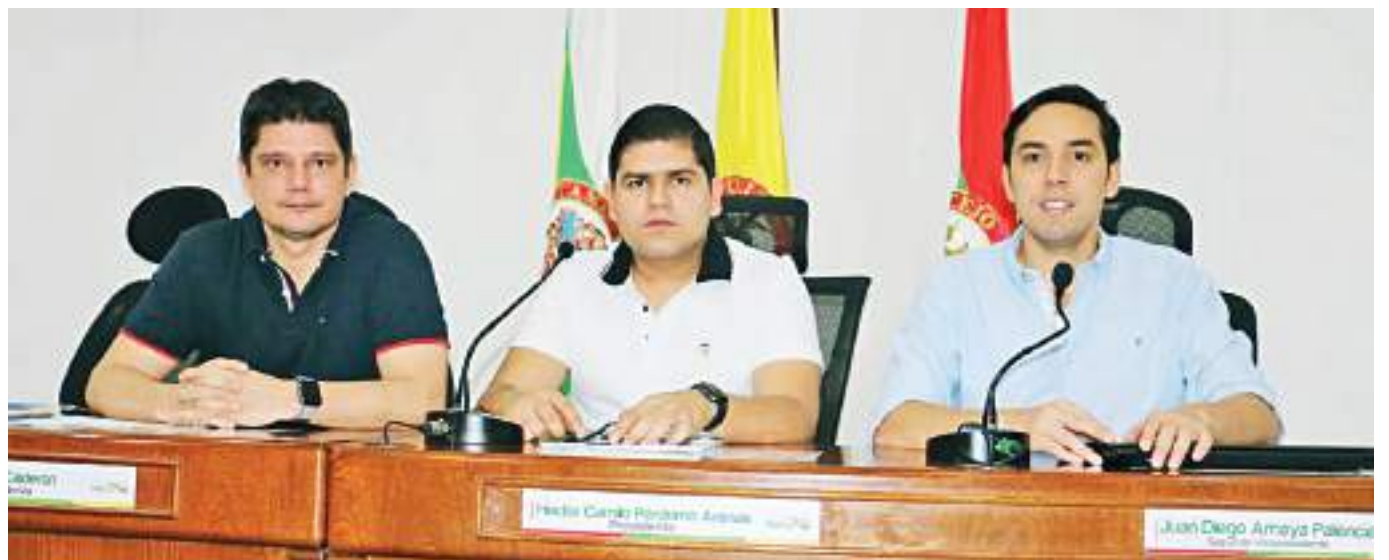
La mesa directiva del Concejo de Neiva deberá responder por el proceso de elección de Secretario General y buscar alternativas de solución.

Aunque en plenaria se consideró bajar los 70 puntos y darle la posibilidad a los 4 que pasaron la prueba de conocimiento de que continuaran en el mismo eliminando de este modo el artículo 35 de la Resolución donde hace alusión a que el aspirante