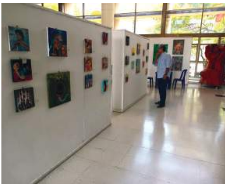
Son 70 piezas de artistas de diferentes países de América Latina, con temas sobre violencia, medio ambiente e identidad cultural.

Son cerca de 70 piezas en micro formato, las que van a encontrar los asistentes, entre fotografías, pinturas, lienzografías y otras expresiones artísticas que hacen parte de la exposición “Identidad Cultural”.