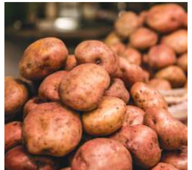
El clima favoreció la oferta de algunos productos del grupo de las frutas como el limón, las mandarinas, el maracuyá y el mango.

tos que más subió. La mayoría de sus cortes fueron mayores en mayo con relación a los reportados en abril. Según la entidad, “se encarecieron cortes como el morrillo, la cadera, el lomo fino, el pecho, entre otros”.