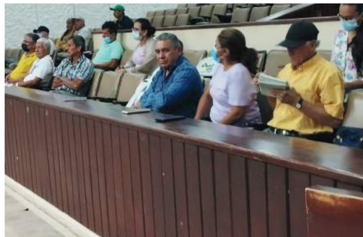
Delegados de todo el Huila se dieron cita en la Asamblea.

Los delegados abordaron temas como el reconocimiento e instrumentación de la política pública común, la constitución del banco de acciones comunales, vías, capacitación comunal, juegos y nuevas elecciones comunales.