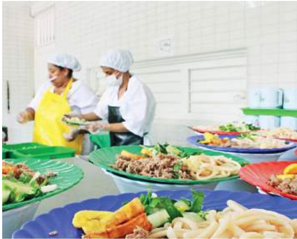
Apartado del comunicado emitido por la Bolsa Mercantil donde se evidencia la cancelación del contrato por incumplimiento total del mismo.

En lo corrido del año sólo 104 sedes en Pitalito han recibido de manera parcial el PAE.