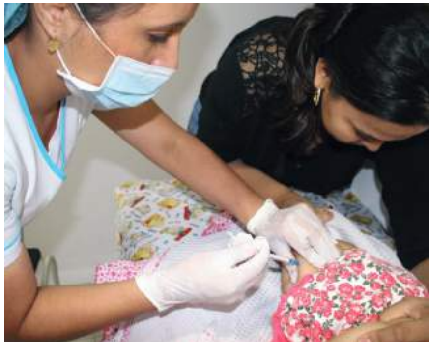
La Secretaria de Salud enfatizó que es primordial seguir utilizando todas las medidas de bioseguridad permanente durante el ‘Festival del Bambuco en San Juan y San Pedro 2022’.

Luego de conocerse que Bogotá está al borde del colapso en camas de hospitalización y UCI pediátricas, por infecciones respiratorias agudas, las autoridades de salud de Neiva, advirtieron que, en el momento, en el municipio no existen alarmas frente a esta situación, sin embargo, de no implementarse el esquema de vacunación completo para la primera infancia, en unos meses, la situación podría ser otra.