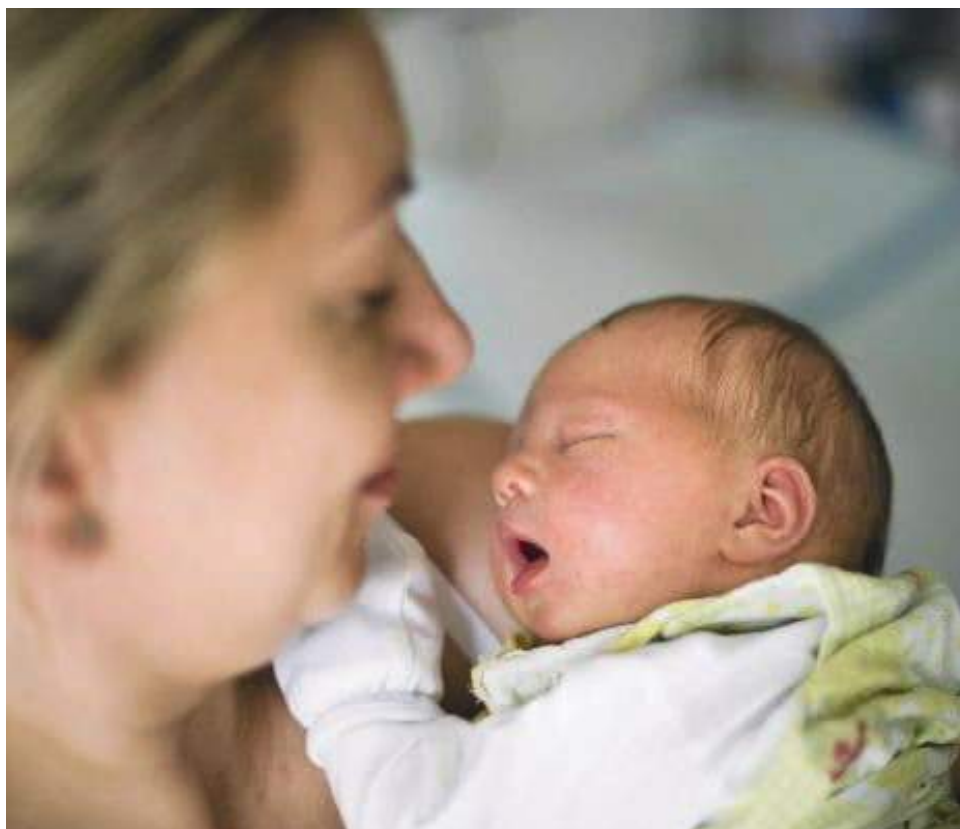
Las madres tienen que dedicar todo su tiempo a cuidar al bebé y muchas veces descuidan sus propios cuidados y bienestar como dormir bien o comer saludablemente.

Ver más allá de una madre: muchas mujeres se olvidan de que aunque hayan tenido un hijo siguen siendo mujeres. No monopolizar las conversaciones en torno al nacimiento del hijo y tratar con normalidad otros aspectos como la relación de pareja es importante.