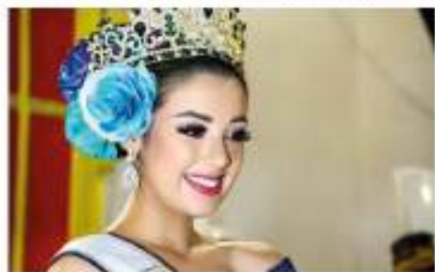
¡Ya hay nueva reina estudiantil 2022!