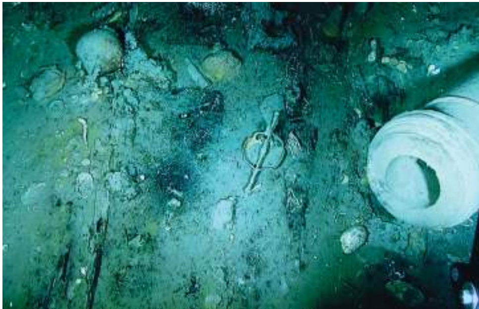
La Armada de Colombia comprueba que el Galeón San José no ha sufrido intervenciones por acción del hombre.

■ El jefe de Estado, Iván Duque también dio a conocer que se realizó un hallazgo de otras embarcaciones similares. La nueva exploración logró imágenes exclusivas que fueron tomadas a profundidades de más de 950 metros, del oro y las piezas de la época que llevaba el Galeón en su interior. Esta embarcación de la península ibérica se hundió en aguas colombianas en junio de 1708, por el ataque de piratas ingleses.