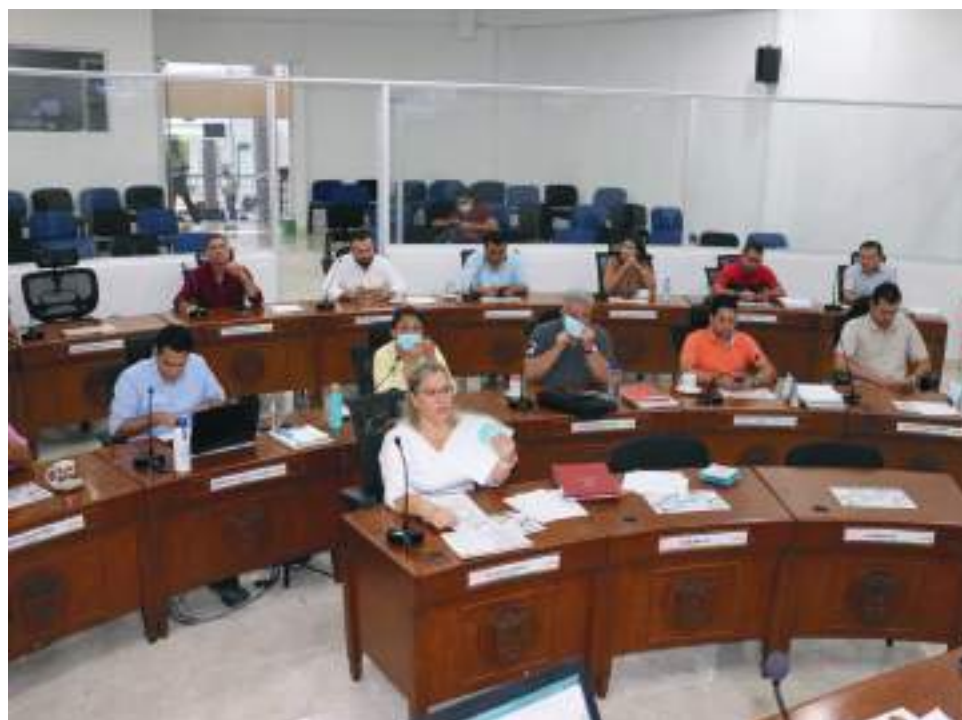
La Universidad de Cartagena será quien de una terna para que en plenaria se escoja a la persona indicada para ejercer el cargo.

Ahora bien, “nos llama la atención que la mesa directiva sea la que construya resoluciones, haga ruedas de prensa, emita conceptos y actos administrativos. Pero cuando de errores se habla se le adjudican a la universidad exclusivamente. Aquí tanto la directiva como la inoperante Universidad de Cartagena deberán responder por esta situación que no tiene precedentes”, finalizó.