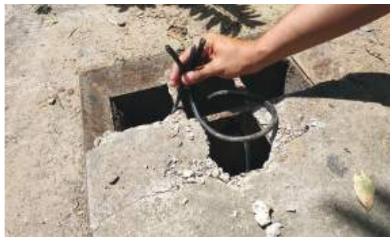
Secretaría de Movilidad ha hecho un llamado a la comunidad a denunciar estos hechos delincuenciales.

“Invitamos a todos los actores viales que cuando observemos que están dañando los semáforos, que cuando observemos que están robando los cables, que denuncien al 123 y así nosotros poder contrarrestar estos hurtos de cables que se están presentando en la ciudad de Neiva”.