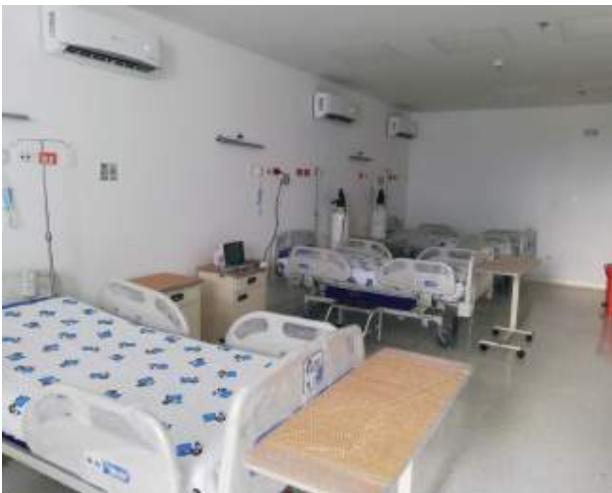
La tuberculosis, Covid-19, infecciones respiratorias agudas e influenza, son las enfermedades con mayor riesgo para la población infantil particularmente.

Finalmente, enfatizó en que los niños tienen que seguir utilizando el tapabocas y es primordial seguir con todas las medidas de bioseguridad permanente durante el ‘Festival del Bambuco en San Juan y San Pedro 2022’, pues se trata de un tema de cultura ciudadana.