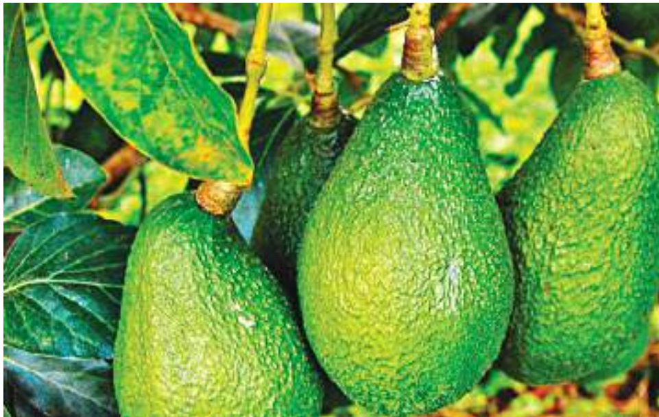
En áreas sembradas, el país tiene 79.832 hectáreas de aguacate de diferentes variedades, de las cuales 40.000 pertenecen a la variedad Hass.

“Manifiestar al Gobierno chileno nuestra gratitud por su disposición, compromiso, esfuerzo y contribución para que se pueda lograr la admisibilidad fitosanitaria de aguacate Hass colombiano al mercado chileno. Esto es de gran relevancia para el sector, debido a que las áreas de producción del aguacate en Colombia y las exportaciones vienen en un continuo crecimiento”, resaltó la gerente general del ICA, Deyanira