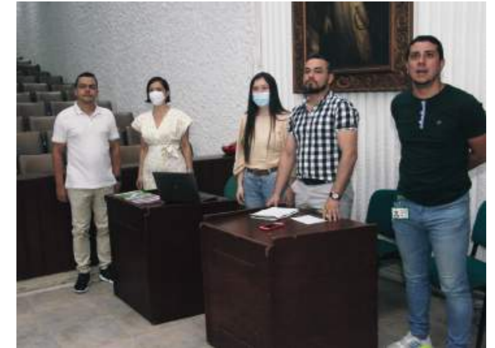
El trabajo se articula desde la acción comunal y la administración.