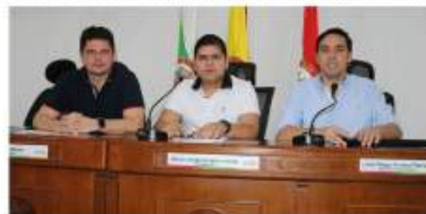
Se hundió el proceso