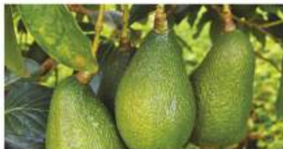
Aguacate Hass colombiano a un paso de conquistar el mercado chileno