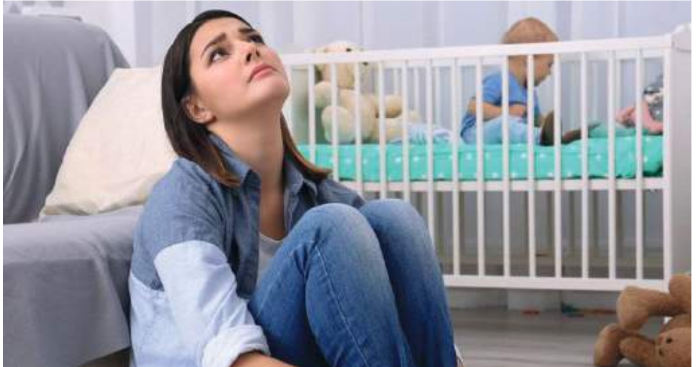
La depresión postparto es algo muy habitual durante los primeros meses después de dar a luz.

aumenta progresivamente puede convertirse en ansiedad. En ocasiones, esta puede estar derivada por la impotencia de muchas madres por no encontrarse a pleno rendimiento o felices por esta etapa.