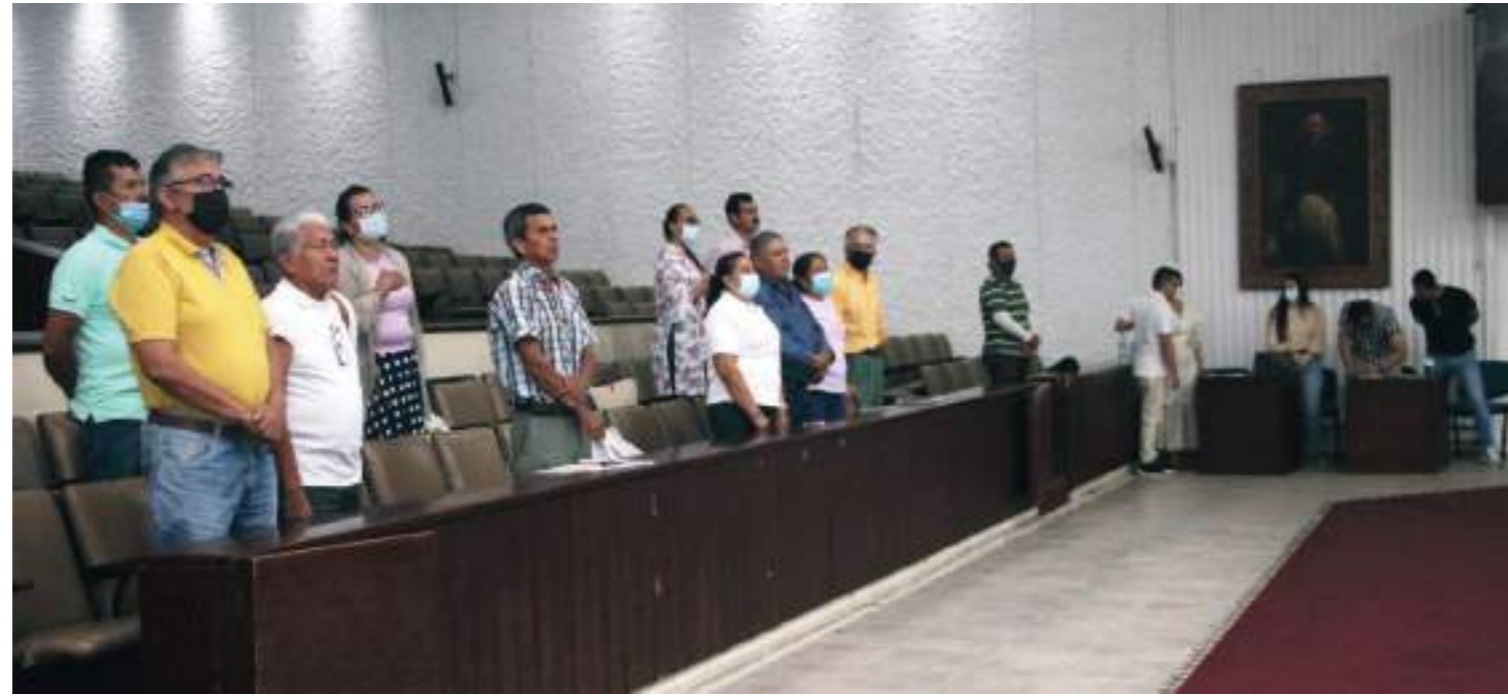
Son varias las comisiones que se integraron.