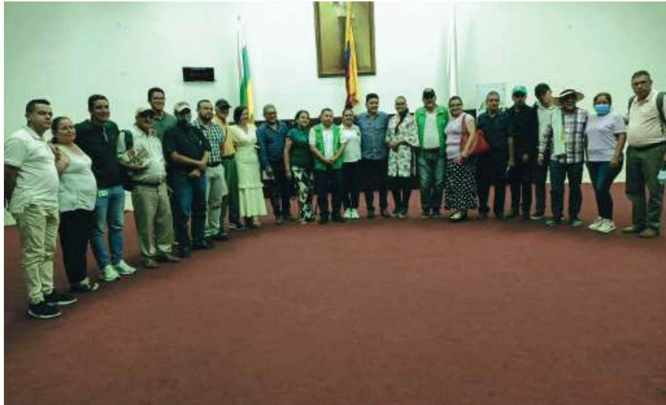
La Asamblea de la Federación Departamental de las JAC se realizó en Neiva.