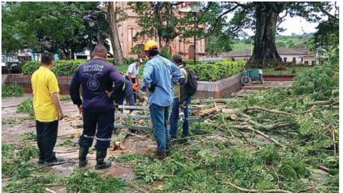
Unidades de Bomberos y funcionarios de Electrohuila realizaron el corte y levantamiento de un gran árbol que colapsó en el parque principal de Timaná, tras las fuertes lluvias con granizo registradas ayer en ese municipio del sur del Huila. La caída del árbol generó que varios sectores se quedarán sin energía y varias viviendas resultaran destechadas en medio de la ola invernal.