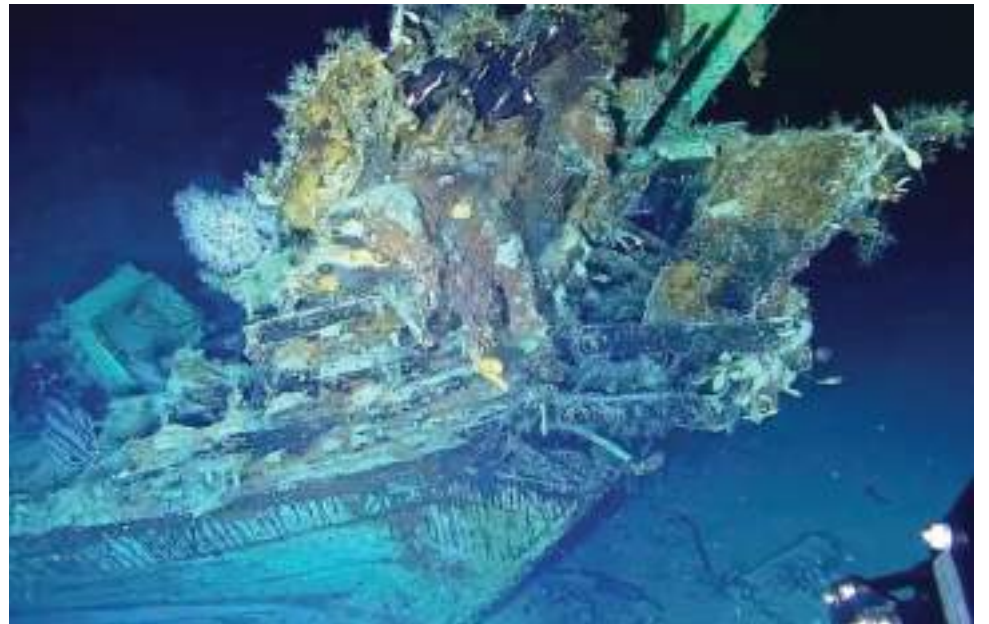
Nuevas imágenes tesoro galeón San José.