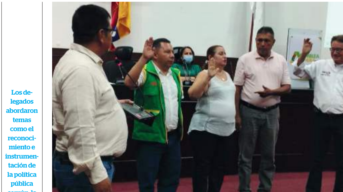
Las comisiones se juramentaron ese mismo día.

Los delegados abordaron temas como el reconocimiento e instrumentación de la política pública común, la constitución del banco de acciones comunales, vías, capacitación comunal, juegos y nuevas elecciones comunales.