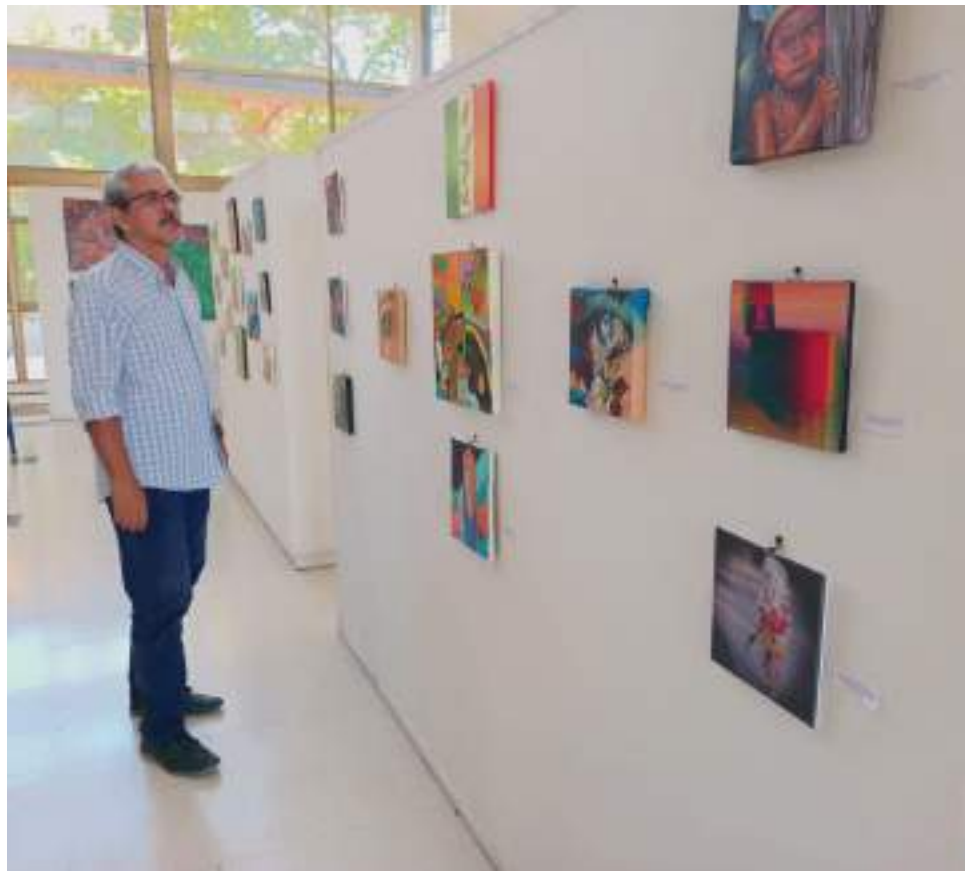
En el Hall de la Biblioteca departamental Olegario Rivera se realiza la exposición de pinturas y fotografías.

Entre fotografías, cuadros pintados al óleo y la participación