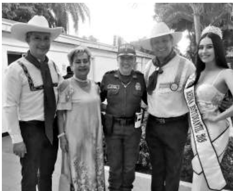
Momento de la entrega de "Mando" para la organización del evento.

La Fundación Taitas que es sin ánimo de lucro, está integrada por ex parejas y parejas del baile del Sanjuanero Huilense e integrantes de todas las