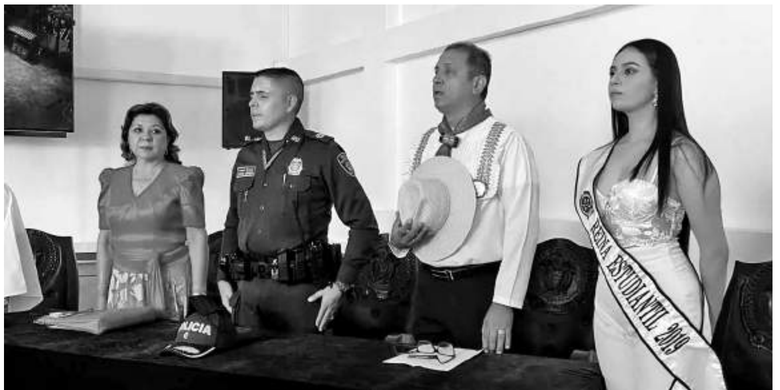
Durante 27 años fue la Institución San Miguel Arcángel de la Policía Nacional la encargada de la realización del certamen.

El Festival Intercolegiado se realizará los días 2 y 3 de junio. Y hasta el jueves anterior