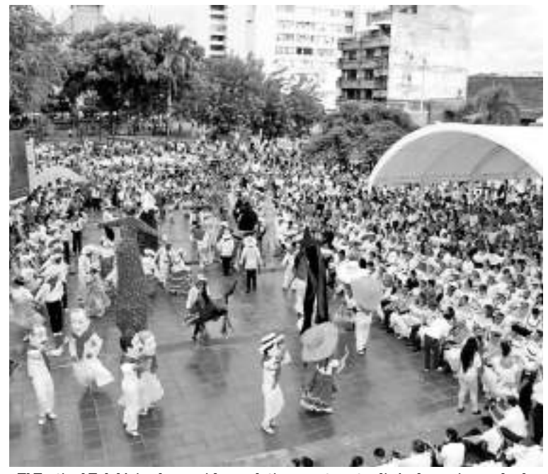
El Festival Folclórico ha venido paulatinamente actualizándose, sin perder la tradición.