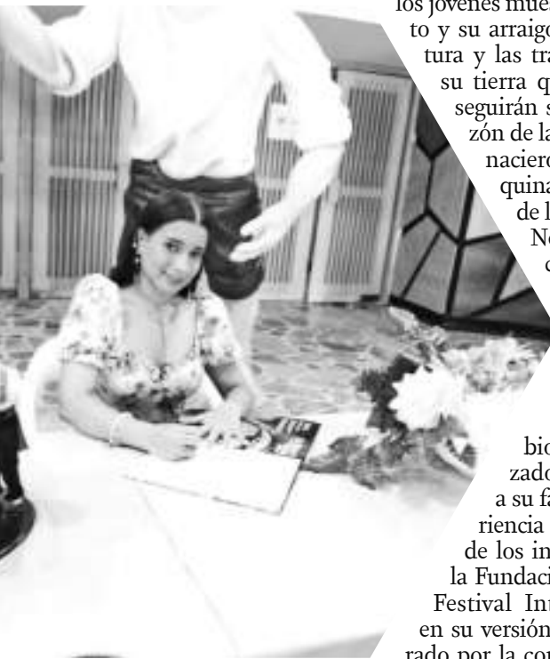
Representante del Instituto Técnico de Neiva.

Con cambio de organizador que tiene a su favor la experiencia de cada uno de los integrantes de la Fundación Taitas, el Festival Intercolegiado en su versión 28 es esperado por la comunidad estudiantil y en general todos los huilenses como anuncio de que llegaron la fiestas.