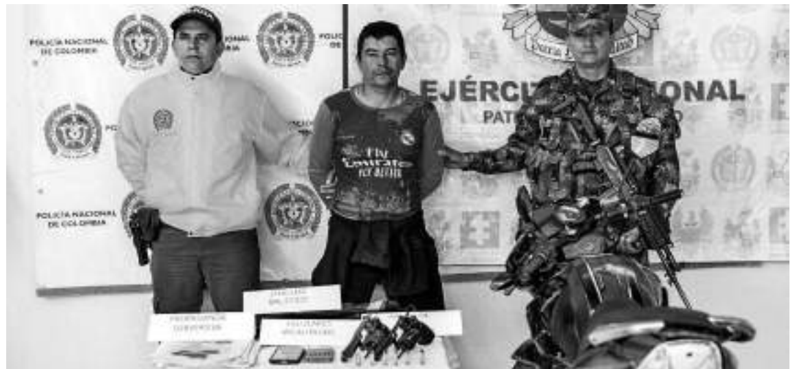
La operación se dio en la vía que del municipio de Yaguará conecta con Neiva.

La solidaridad de la Red de Participación Ciudadana permitió neutralizar presuntos hechos delictivos en el Huila. Esta captura se llevó a cabo en el municipio de Yaguará.