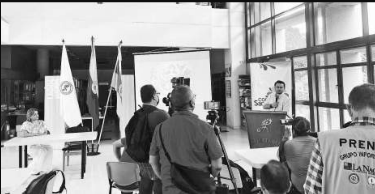
Foto de la presentación de San Pedro

Con una terrible improvisación y desorganización se presentó la programación del Festival del Bambuco en San Juan y San Pedro.