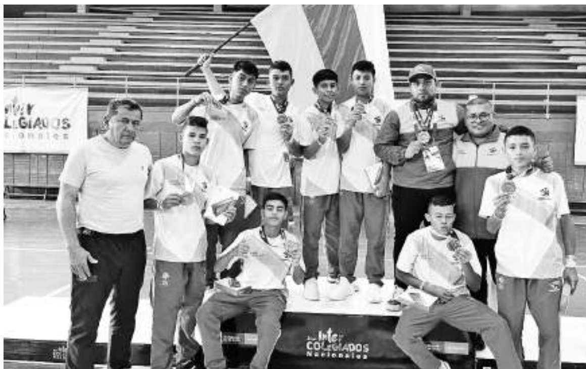
Los integrantes del representativo del Liceo Andaki de Pitalito subieron al podio por la medalla de oro.