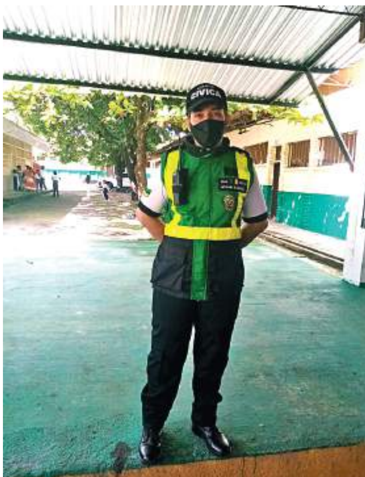
Ser policía cívica significa para ella poder aportar a la comunidad enseñanzas que ella ha vivido.

sos de lencería, de belleza, de croché e hizo seminarios de primeros auxilios, nunca logró cumplir su sueño que era ser enfermera de profesión, al principio su poder adquisitivo no era mucho para lograr entrar a esta carrera y luego el afán de darle todo a sus hijos no la dejó convertirse en profesional.