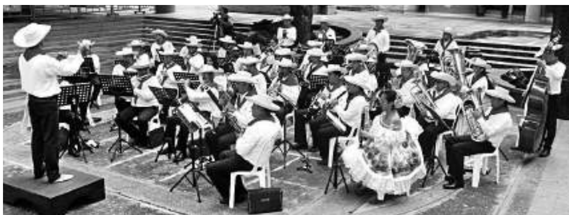
El Sanjuanero ha sido interpretado por generaciones.