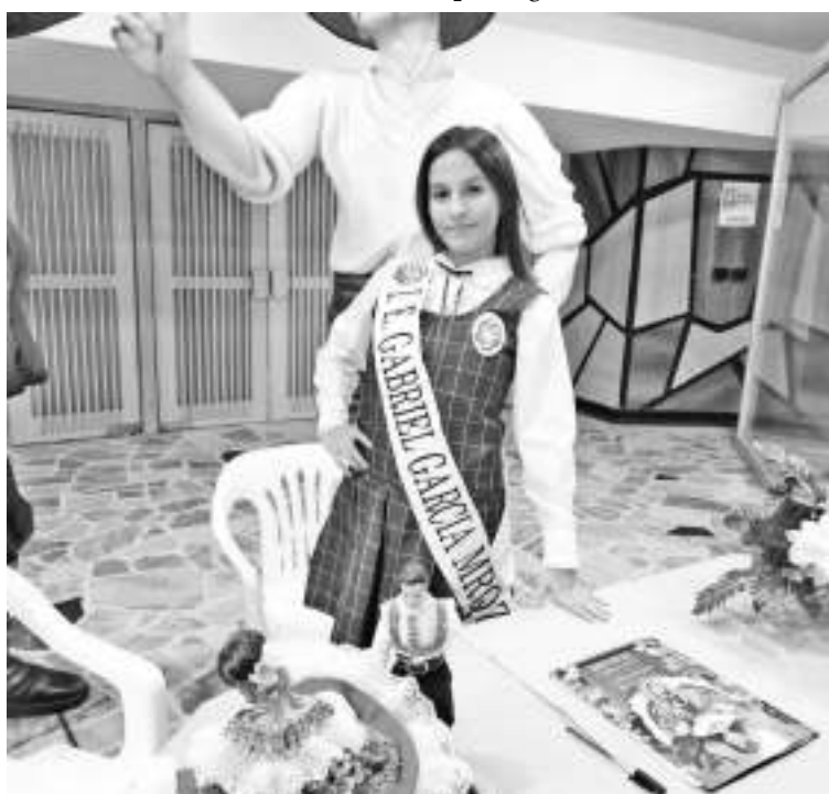
La representante de la I. E. Gabriel Garcia Márquez al reinado Intercolegiado.