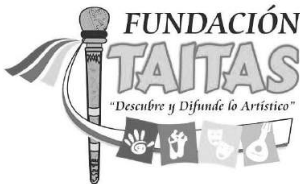
La Fundación Taitas asume el reto de la organización.

en las horas de la tarde habían confirmado 16 candidatas, entre otras; de La Plata, Yaguará, Palermo, Rivera, Pitalito, Garzón y varias instituciones educativas de Neiva. Aun hay tiempo para que las aspirantes se inscriban ante el comité organizador a cargo en esta oportunidad de la Fundación Taitas.