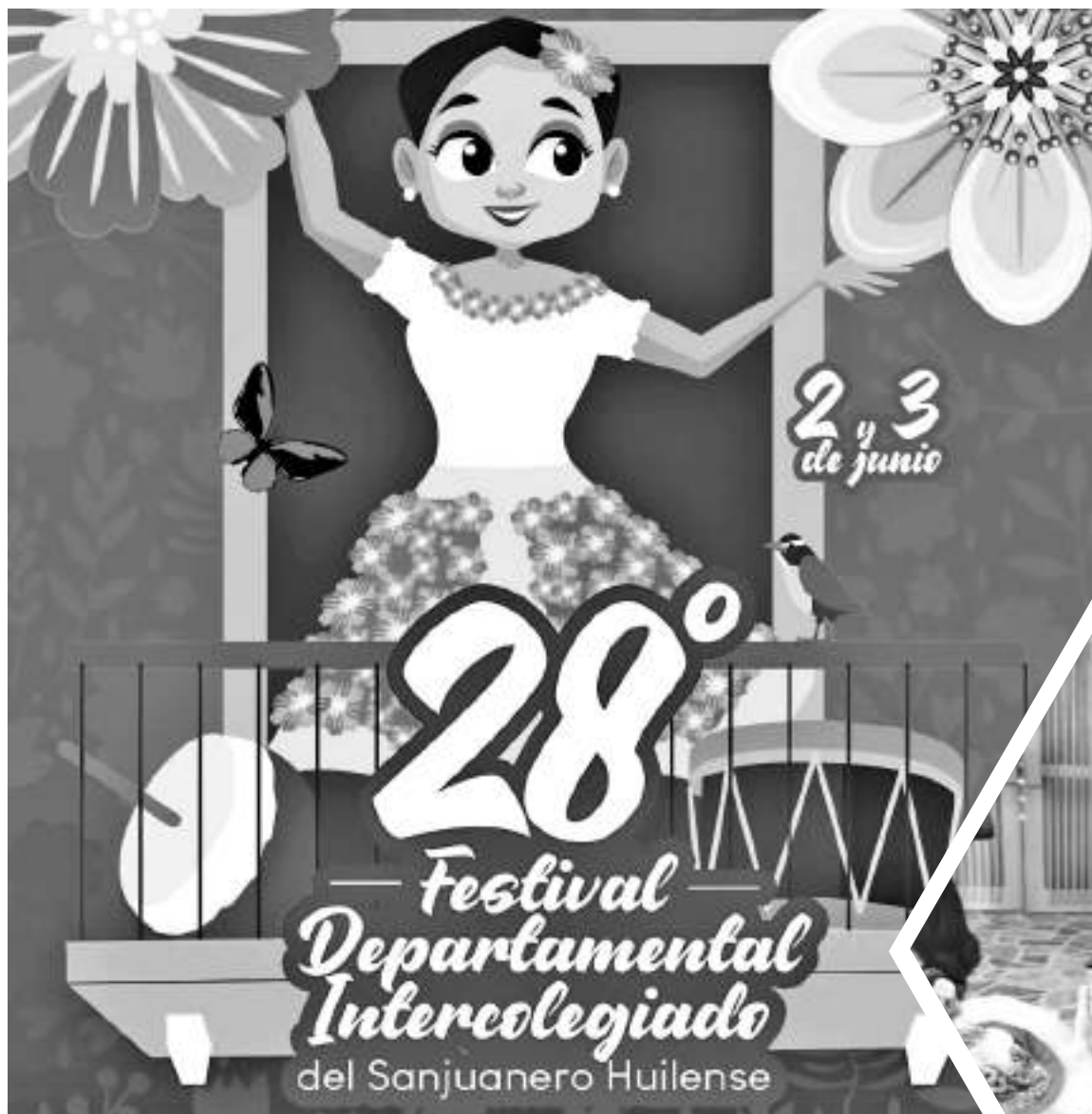
Afiche oficial de la versión 28 del festival.

la gran parada de las candidatas en un recorrido de unos 400 metros dentro de las instalaciones del parque de la Música Jorge Villamil Cordobés, estarán acompañadas de sus comparsas, sus grupos musicales, con temática libre para que puedan desarrollar toda a creatividad en su comparsa.