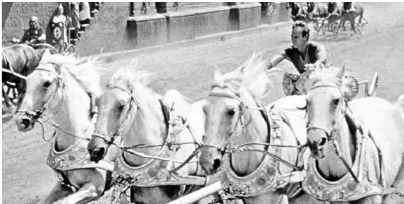
Al igual que la arena romana, el espacio en que se desarrolla el espectáculo, es una mezcla de reality show en directo y combates de gladiadores.

Como castigo por una rebelión en contra de este último, en la que Capitolio derrotó a los doce primeros distritos y destruyó el decimotercero, cada año un chico y una chica de cada uno de los doce distritos restantes, entre doce y dieciocho años, son seleccionados por sorteo y obligados a participar en los "Juegos del Hambre". Estos fueron creados por el Capitolio con el objetivo de recordar a los pobladores Los Días Oscuros, evento televisado, donde los participantes deben luchar a muerte en un estadio al aire libre, "La arena";