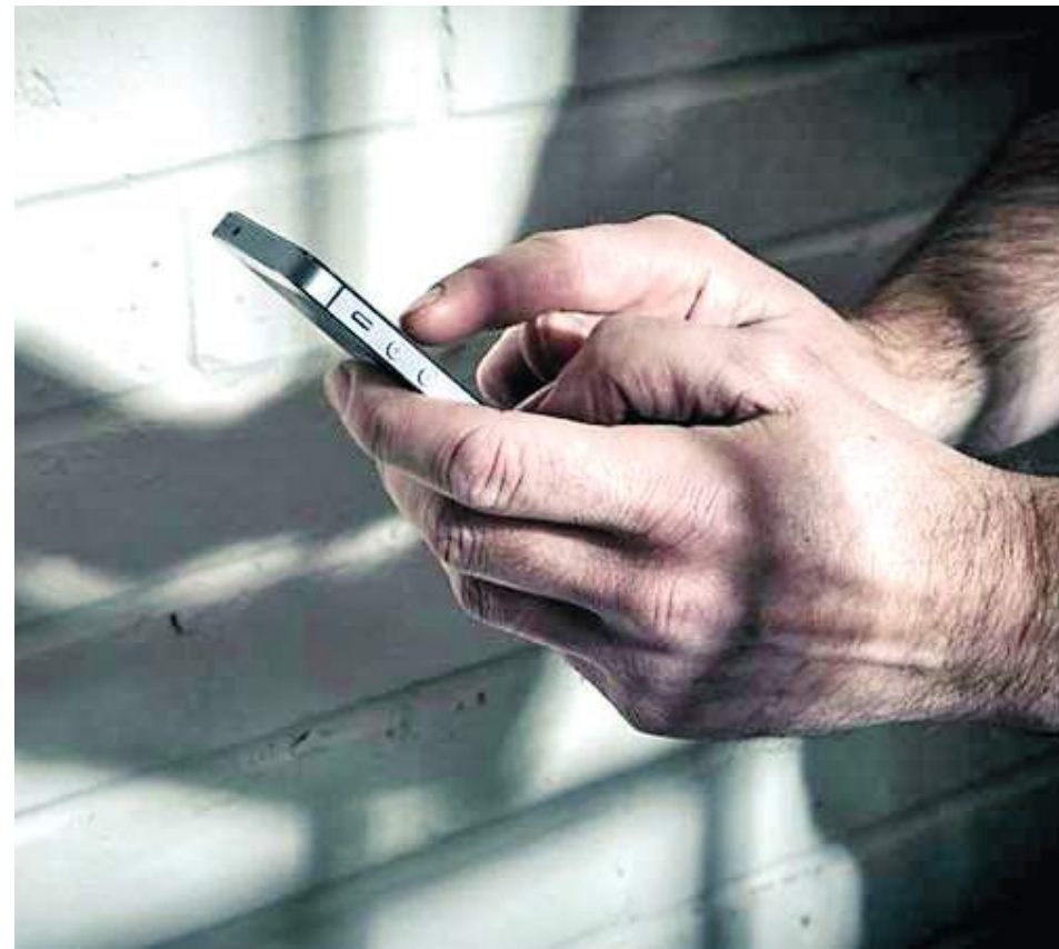
Los principales victimarios siguen siendo personas privadas de la libertad en cárceles.

» Una vez han intimidado a su víctima lo que proceden hacer es solicitarle los números de los familiares para llamar a extorsionar aludiendo un supuesto secuestro. «