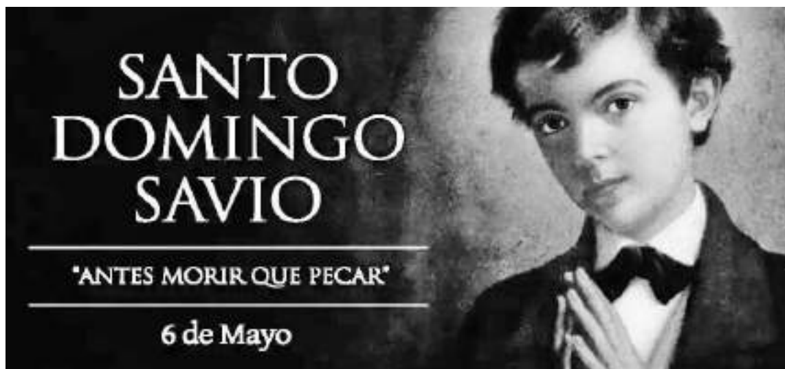
Domingo Savio, desde muy pequeño se sintió llamado al sacerdocio.

Cuando Don Bosco le preguntó qué hacía en esos momentos, Domingo le contestó: “Es que a veces me asaltan tales distracciones