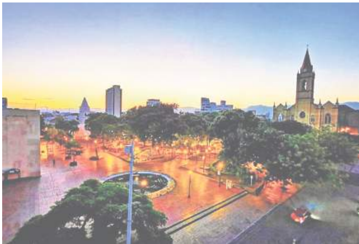
Definitivamente, las ciudades y los países están afrontando retos muy importantes en su desarrollo social, económico y ambiental.

Hace 21 años, cuando se lanzó la visión de futuro del Huila 2020, se identificaron cinco marcos mentales en el pensamiento de los huilenses: Paternalismo,