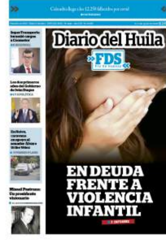
Para la edición del año 2020 cuando el país estaba atravesando por la pandemia del covid-19, Diario del Huila continuó sin parar informando a todos los huilenses.