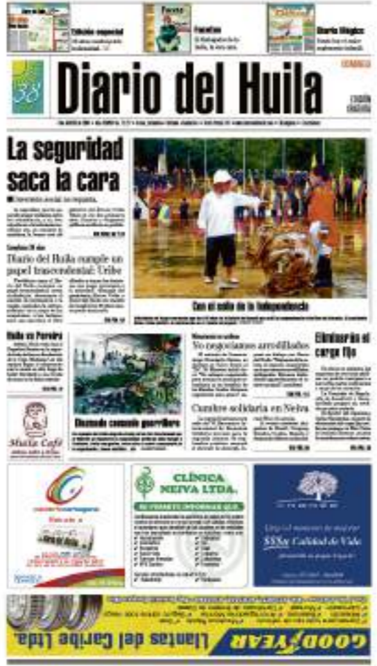
Portada de la edición 14.040 en el año 2005.