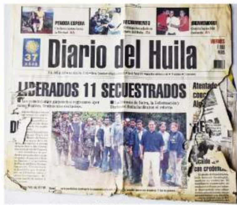
La primera página de Diario del Huila donde se registró la liberación de un grupo de secuestrados. Don Hernando fue el fotógrafo.