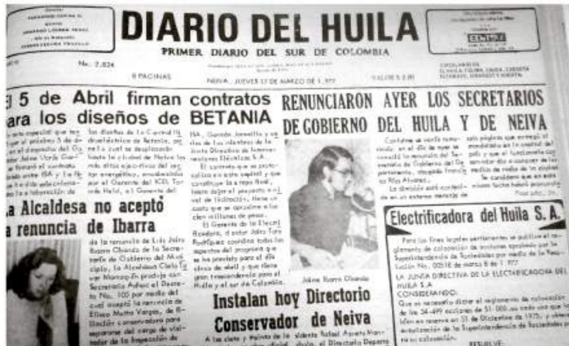
Desde el 8 de agosto de 1966 el Diario del Huila ha marcado la pauta en materia informativa.

El Diario del Huila registra en sus páginas el acontecer de los hechos más importantes del sur colombiano, y a lo largo de la historia como el primer periódico de la región, el objetivo siempre ha sido el de ser cada vez mejores. Han pasado cinco décadas desde que el señor Max Du-