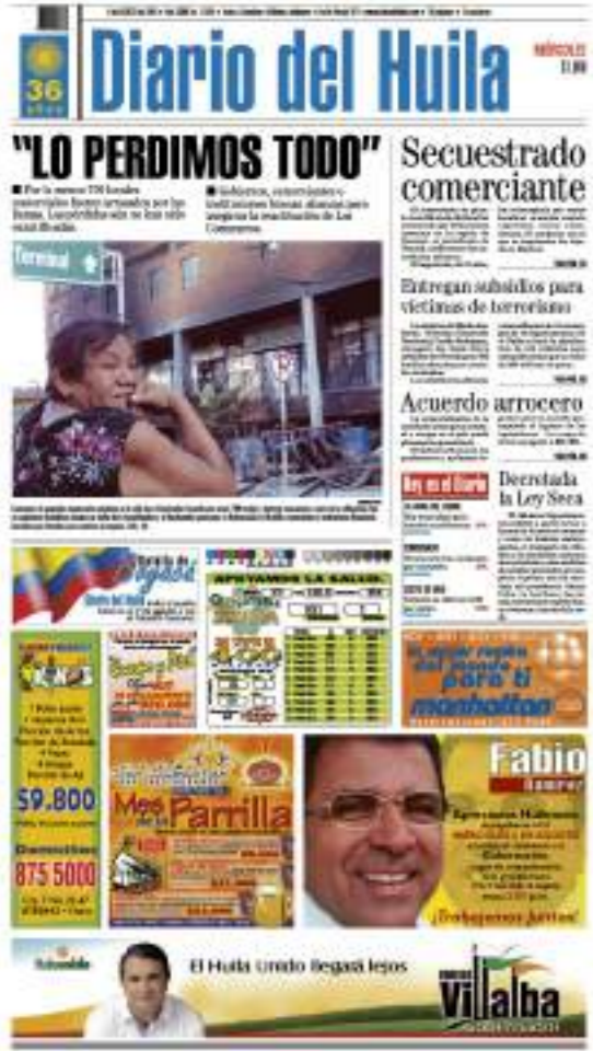
Para el mes de agosto del año 2003 ocurrió un incendio que acabo con 700 locales en Los Comuneros, las pérdidas fueron incalculables.