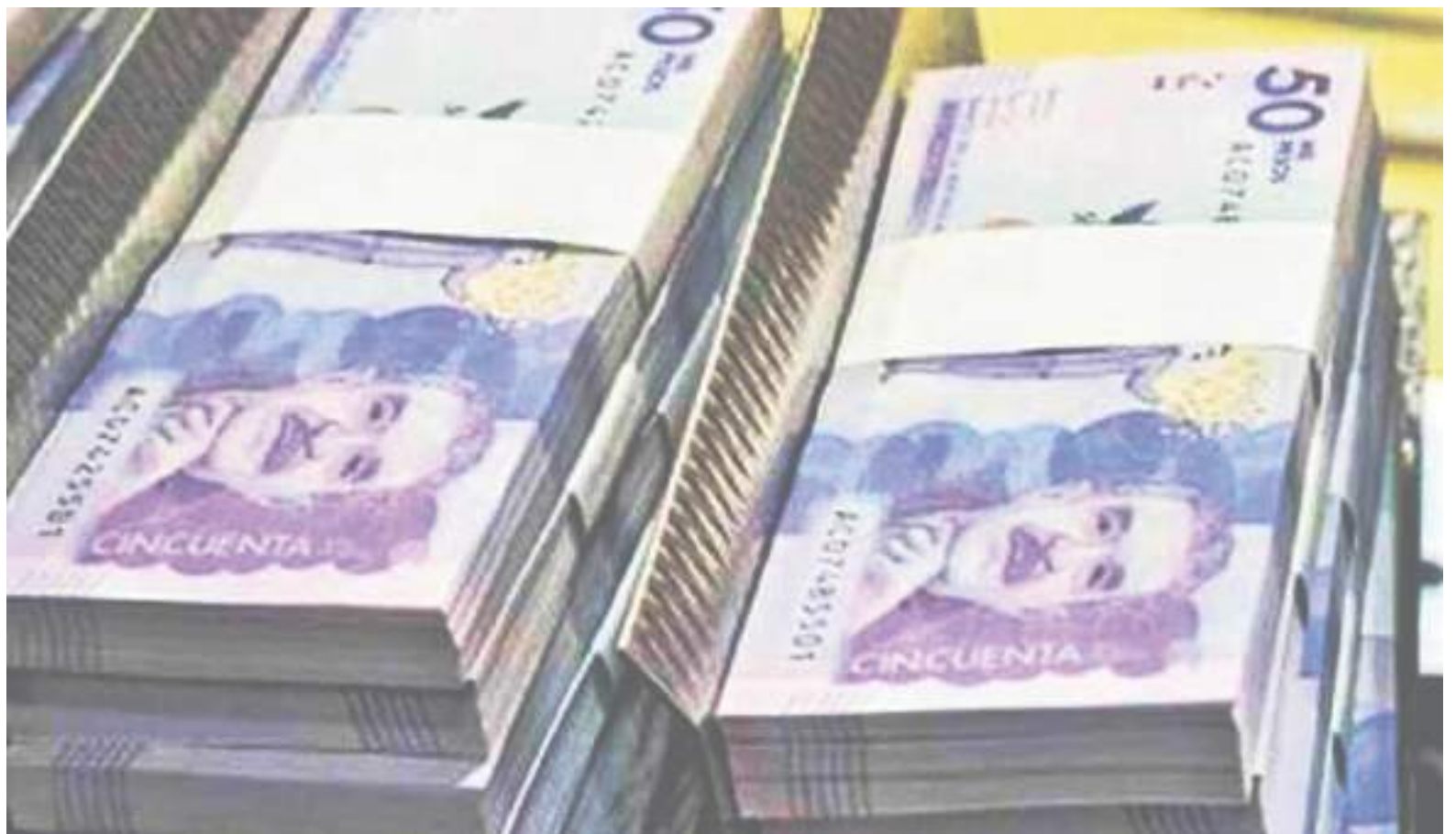
Las diferentes líneas definidas por el FNG canalizaron 782,051 créditos por un valor de $19.4 billones atendiendo los segmentos de: grande, mediana, pequeña y microempresa.