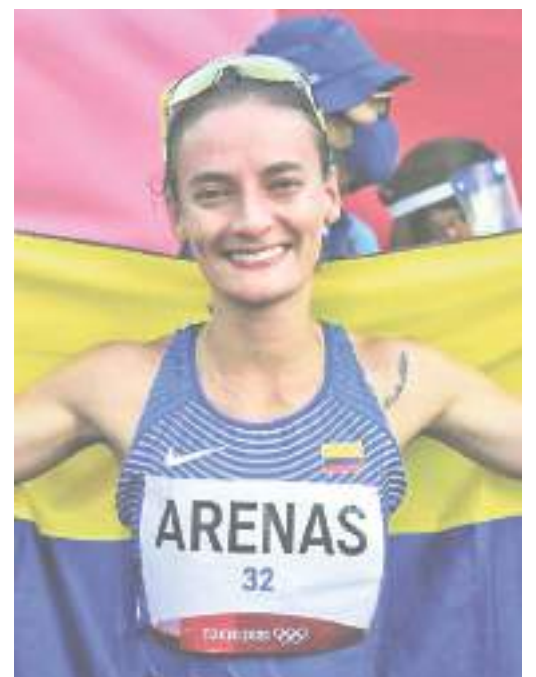
Sandra Lorena Arenas

La colombiana fue la mejor en la marcha 20 km de los Juegos Olímpicos Tokio 2020, tras llegar en la segunda posición a 0:25 de la ganadora y campeona Antonella Palmisano.