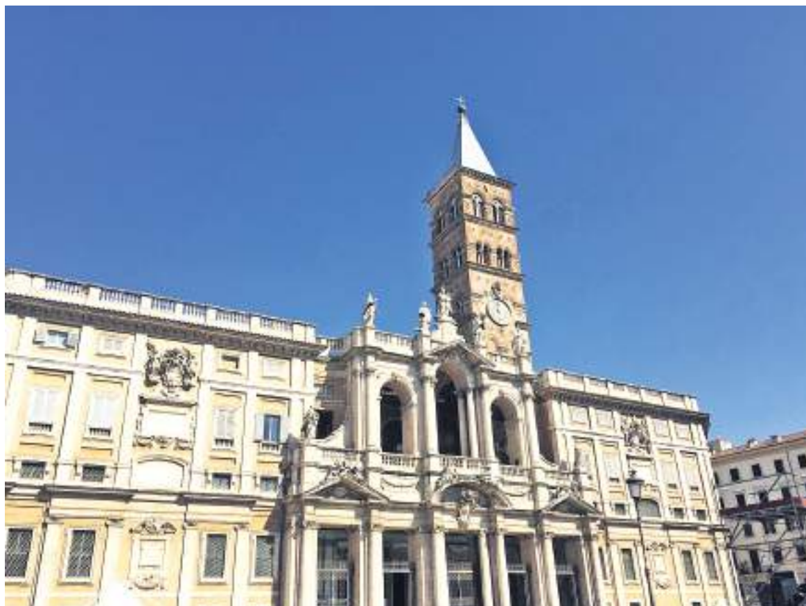
Recientemente, el Papa acudió a rezar inmediatamente después de haber sido dado de alta del Hospital A. Gemelli luego de haber sido sometido a una cirugía el pasado 4 de julio.

para las celebraciones litúrgicas durante el Pontificado de San Juan Pablo II.