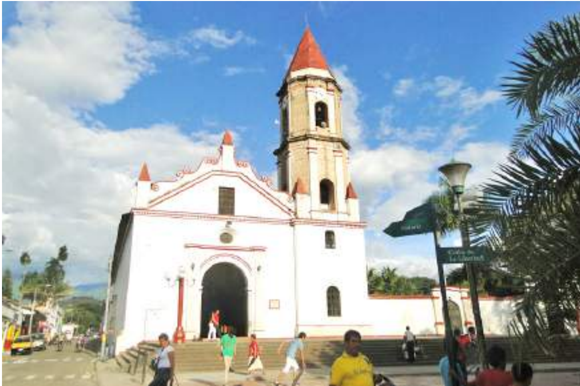
La parroquia San Antonio de Padua se ha visto forzada a cerrar las puertas a sus feligreses ante el peligro que representa esta estructura para ellos.