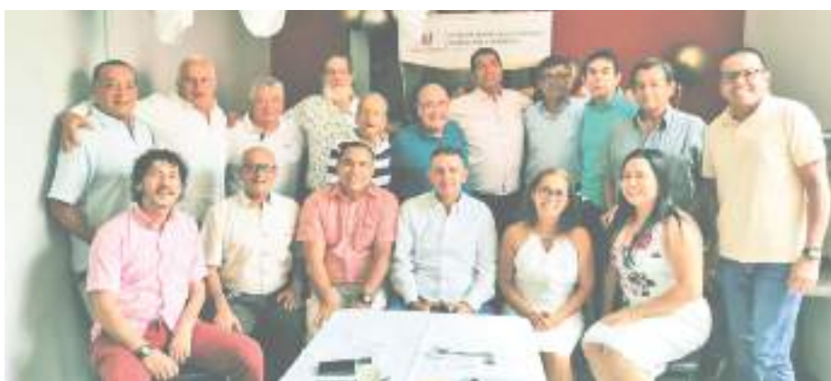
La Decana de la Facultad de Educación y Docentes de programa Licenciatura en Educación Física, Recreación y Deportes.

El programa de Licenciatura en Educación Física, Recreación y Deportes está celebrando los 45 años de funcionamiento, la Decana de la Facultad de Educación y Docentes de programa Licenciatura en Educación Física, Recreación y Deportes celebraron en un reconocido restaurante de la ciudad.