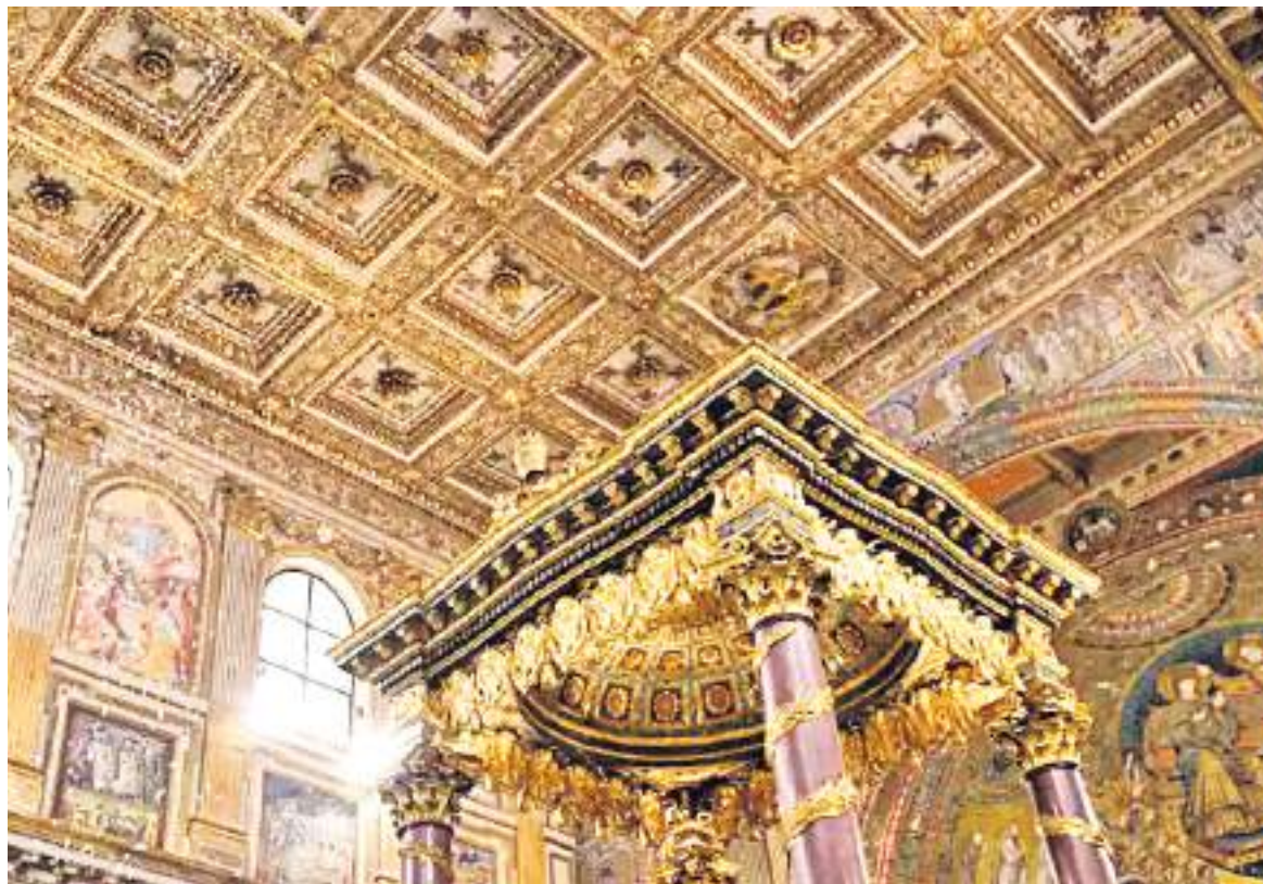
Commemoración del “milagro de la nieve”.

Como ya es tradición, la ciudad de Roma conmemora cada año el “milagro de la nieve” con una Misa solemne por la mañana para recordar el hecho que originó la construcción de la actual Basílica de Santa María la