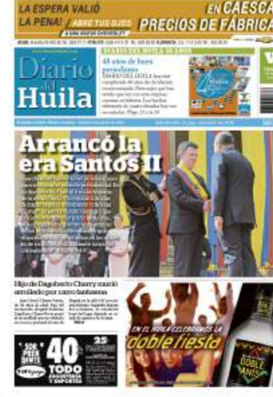
En el año 2014 Diario del Huila registró cuando iniciaba la segunda era de Juan Manuel Santos.