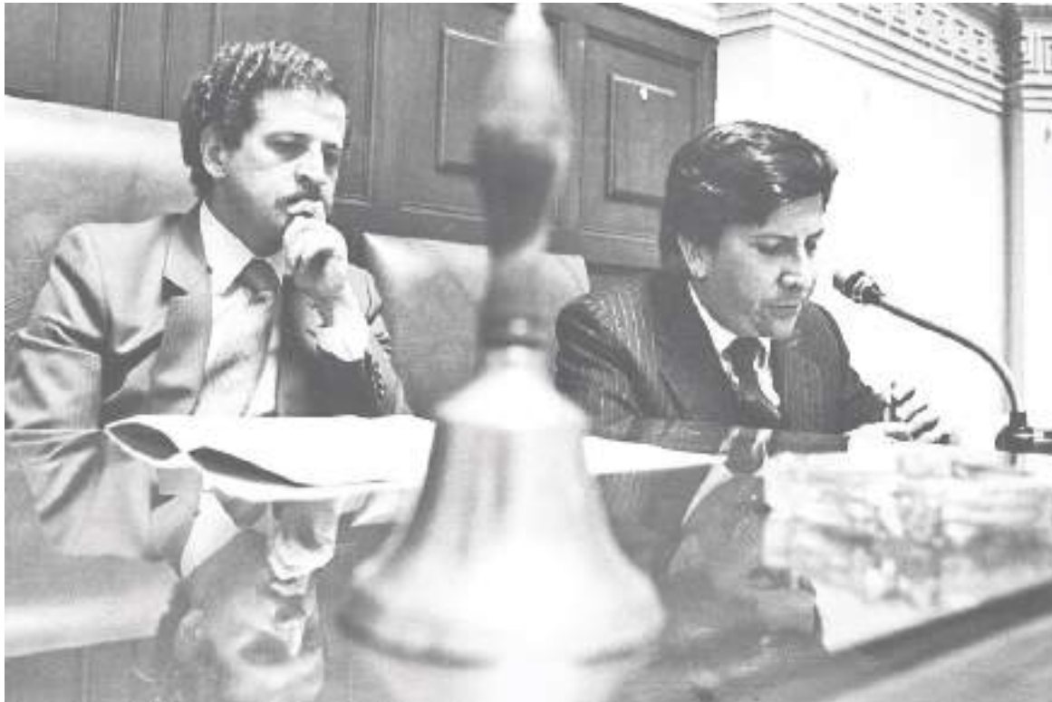
Luis Carlos Galán Sarmiento y Rodrigo Lara Bonilla.

Los hijos de los inmolados Luis Carlos Galán y Rodrigo Lara Bonilla, tienen la responsabilidad de organizar el Nuevo Liberalismo, sin ser inferior a un partido moderno que concite el interés nacional y encare la difícil problemática económica, social y política colombiana para rescatar la credibilidad en la dirigencia política.