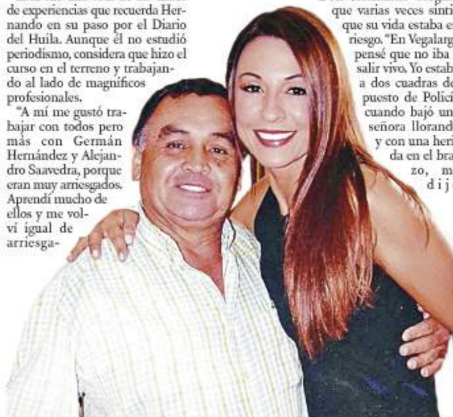
Acompañado de la actriz Amparo Grisales.