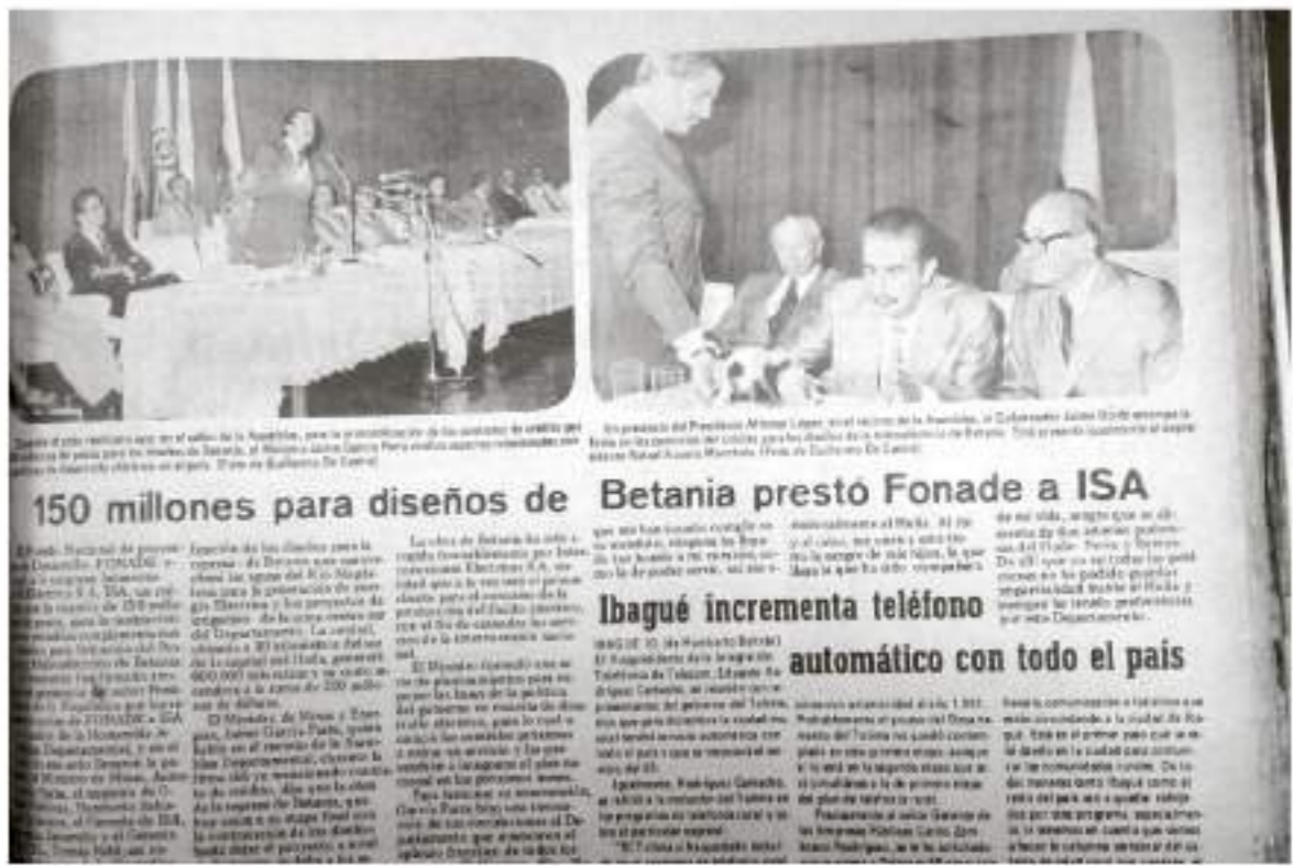
El periódico emerge en la casa de la Hacienda Matamundo en un ambiente de unidad, conciliación y proceso de construcción democrática y participativa.