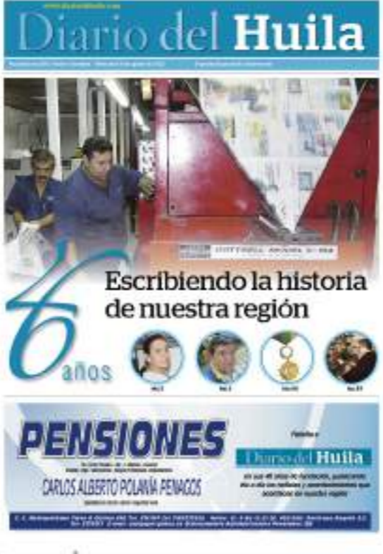
Para el cumpleaños del año 2012 los periodistas de esta Casa Editorial realizaron una edición especial.