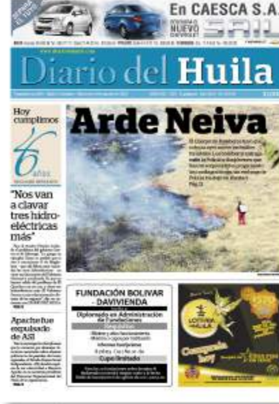
En la edición 16.603 el Diario del Huila cumplió 46 años.