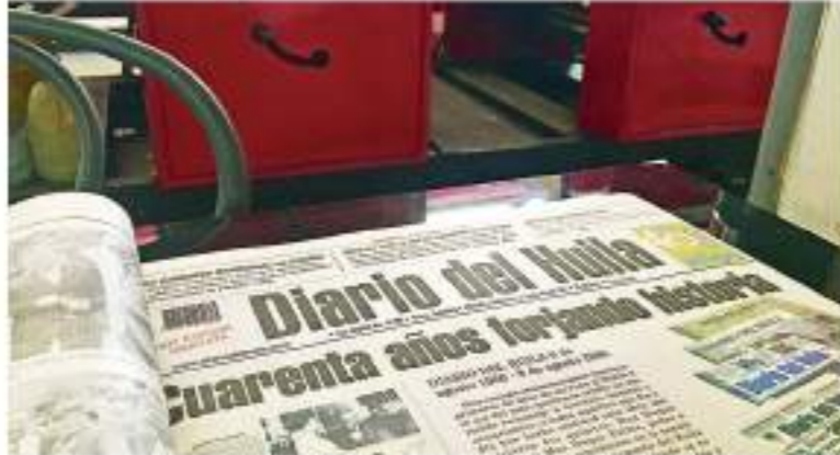
El Diario ha logrado mantenerse de pie, y marchando al ritmo de los agitadores pasos de la globalización.