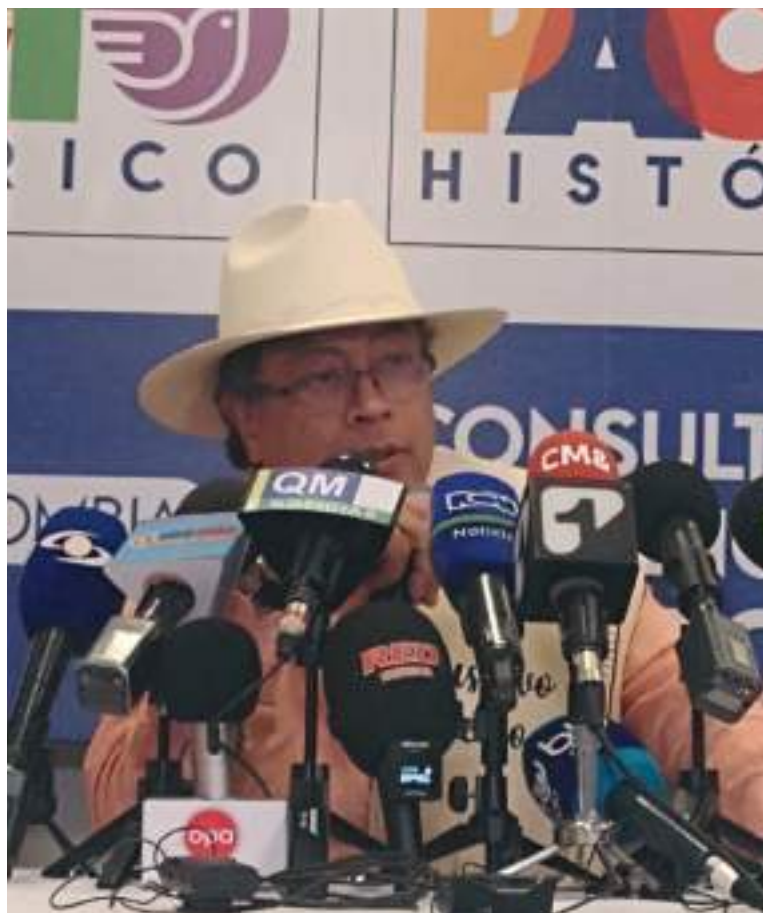
El precandidato por el Pacto Histórico Gustavo Petro.

El subsidio beneficiaría a 5.800.000 personas de la población conformada por madres cabeza de familia y personas de la tercera edad que no han podido tener acceso a una pensión. Esta es una de las propuestas más ambiciosas que tiene el precandidato y lo cual ha causado mucho revuelo entre sus contrincantes.