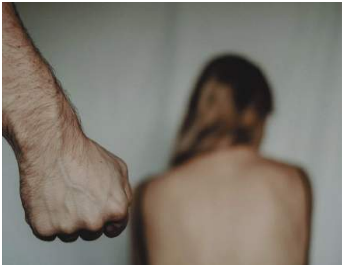
La pobreza y las inequidades en estudio y empleo generan una mayor vulnerabilidad a las mujeres, niñas y adolescentes que padecen de violencia basada en género.

“Es una ocasión para reflexionar acerca de los avances logrados a través de la historia en materia de reconocimiento de sus derechos y los retos que implica evitar retrocesos frente a esos logros alcanzados”, concluyó el defensor Camargo.