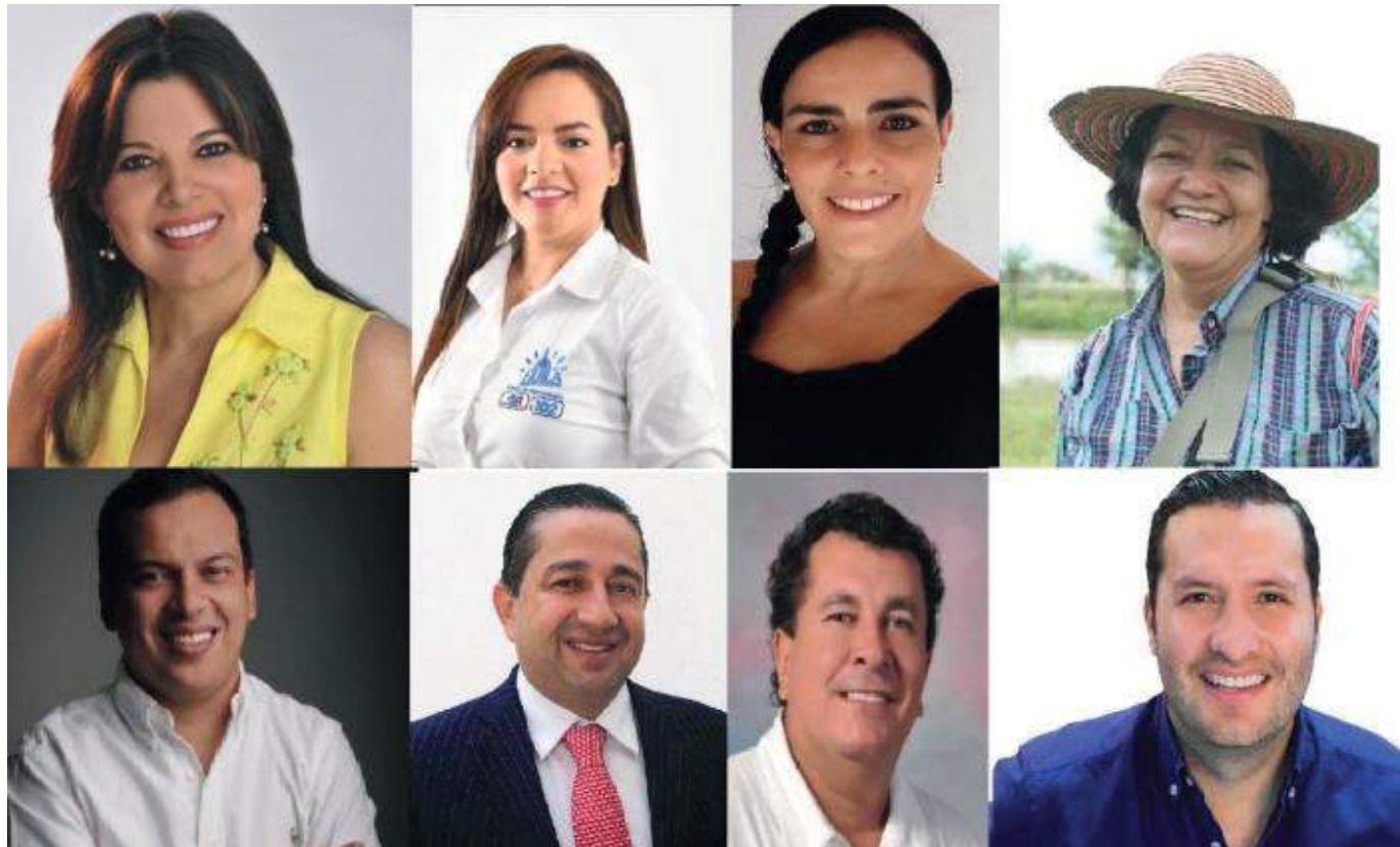
Los 2.832 candidatos al Senado y a la Cámara de Representantes tenían plazo de reportar tanto sus ingresos como sus gastos de campaña una semana antes del día de las votaciones, como lo establece el Consejo Nacional Electoral.