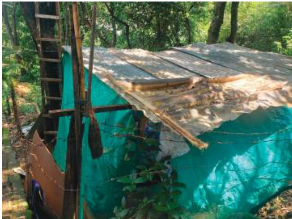
Vivienda que pretende mantener Francia en el sector de las Brisas.

el incremento de las lluvias, el cimiento de la casa cedió y todo se fue al cielo, dando gracias al cielo y a Dios que no estábamos en el momento mi niño y yo o hubiera ocurrido una tragedia, esto sucedió el lunes en la mañana, se salvaron porque no tenía como cocinar el desayuno, a las cinco de la mañana nos fuimos para donde mi mamá a preparar los alimentos, eso nos salvó”, agrega.