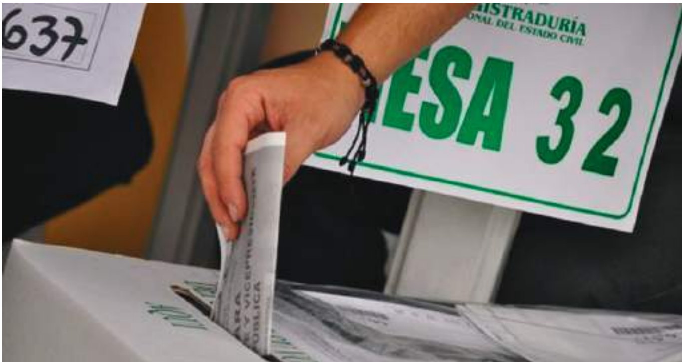
Tenga en cuenta las normas y prohibiciones que el Ministerio del Interior decretó para garantizar los comicios legislativos del próximo 13 de marzo.

El ministerio estableció que desde las 6:00 p. m. del sábado 12 de marzo hasta las 6:00 a. m. del lunes 14 de marzo habrá ley seca en el territorio colombiano. Según el documento, la restricción se hace con base al artículo 206 del Código Electoral y cada uno de los alcaldes deberá emitir los correspondientes decretos para adoptar la prohibición.