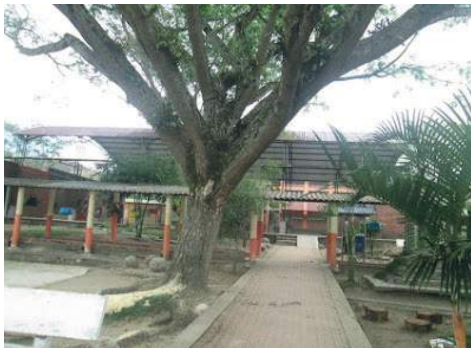
Hoy en horas de la mañana se reunirán para buscar soluciones y volver a las aulas.

Por ahora, hoy la comunidad educativa tendrá una reunión a las 8:00 A. M, a la que asistirán todas las partes y hasta ese momento se determinará el proceder. Asimismo, estudiantes y maestros esperan hoy volver a clase y encontrar soluciones, porque este tema los afecta a todos.