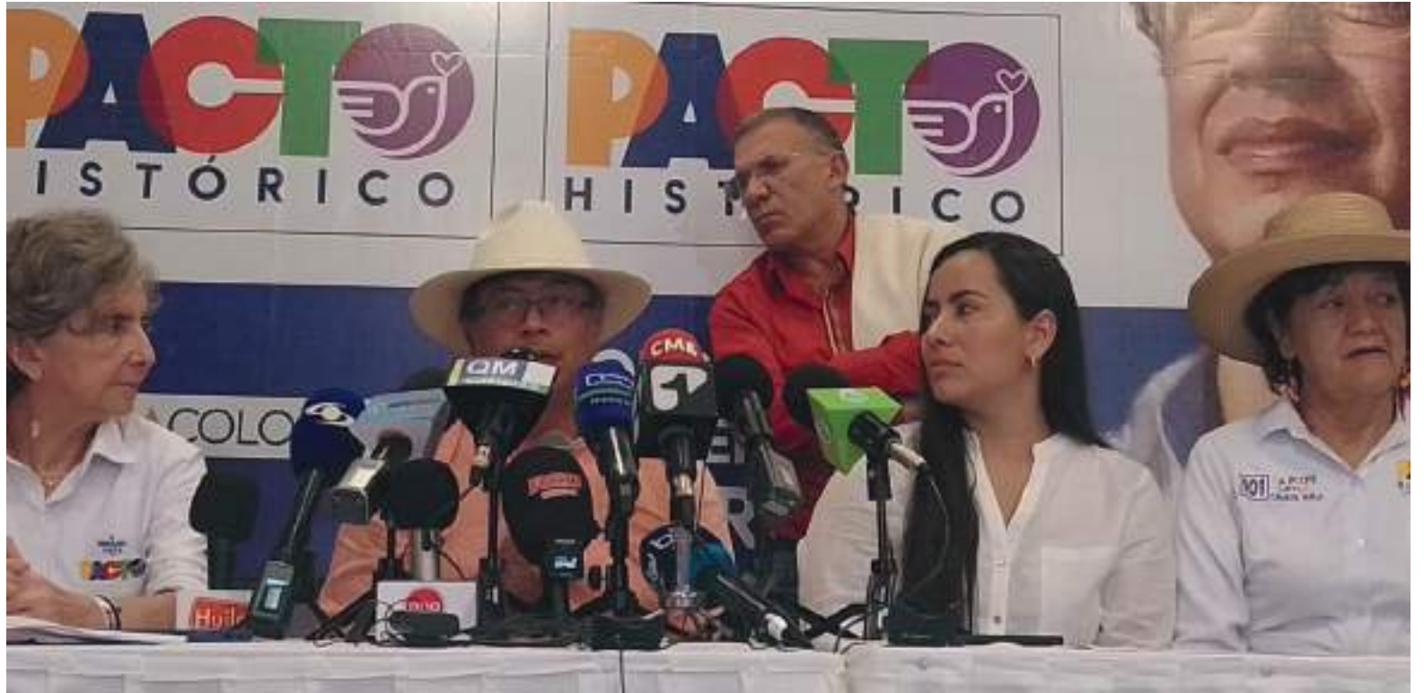
“Colombia no resiste el modelo económico que está llevando que es muy similar al de Venezuela; depender económicamente de las regalías del petróleo. Ahí se corren demasiados riesgos” Gustavo Petro.

Adicionalmente aseveró que hoy nos encontramos sumidos en una situación de miseria y lo dicen las estadísticas y la “salvación es fortalecer sectores económicos como los textiles, las energías no reno-