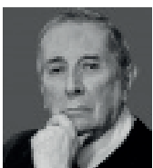
Rafael Nieto Navia

La Corte Constitucional es lo que los juristas denominan un órgano límite, es decir, un órgano que carece de control superior (o éste es puramente nominal) y por consiguiente su deber ser es no sancionado y sus decisiones deben ceñirse al derecho por puro respeto a la norma.