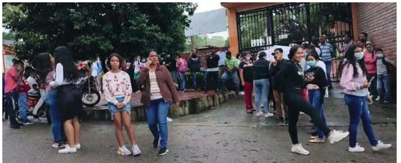
Los estudiantes de la Institución Educativa Jorge Eliecer Gaitán del corregimiento de Potrerillos, en Gigante decidieron entrar en manifestaciones desde el viernes por algunas inconformidades.