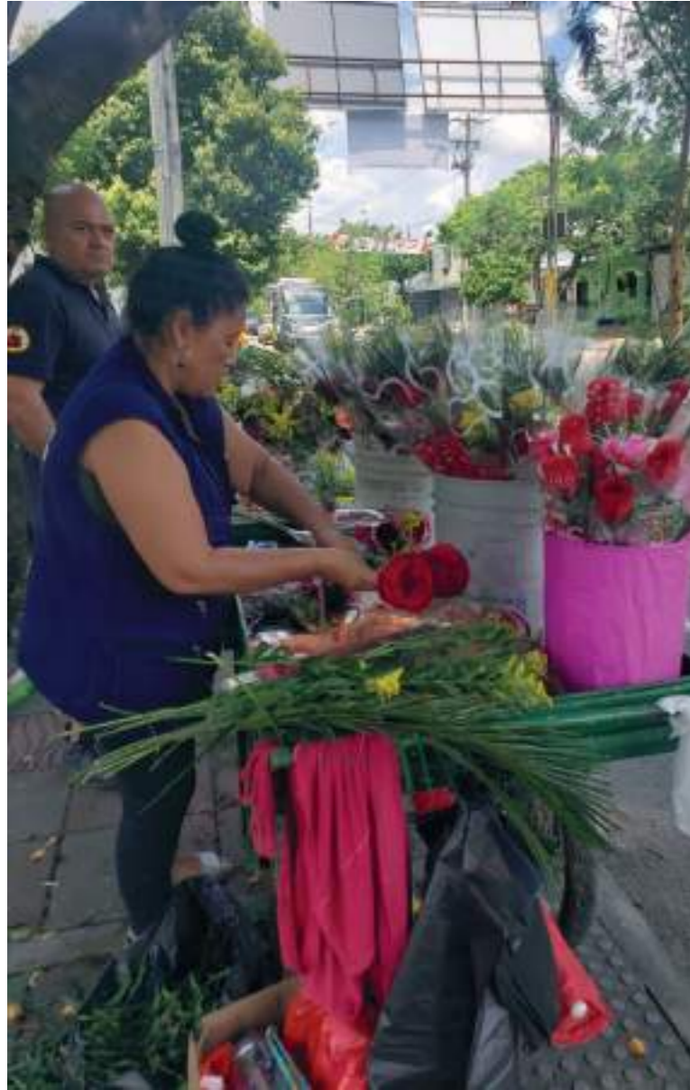
Toda clase de detalles ofrecieron las mujeres para las mujeres.