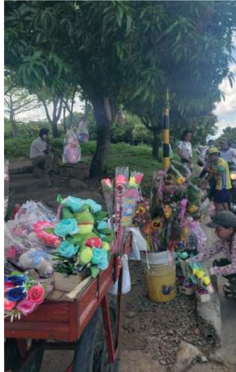
Los arreglos florales fueron los más apetecidos.