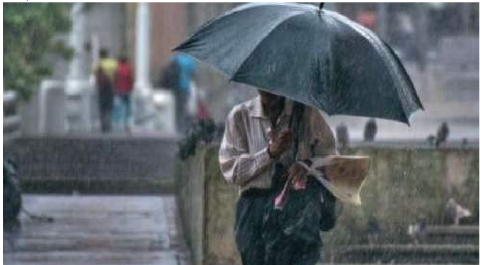
Por último, señaló que el 40 % de las mujeres atendidas por VBG se dedican a actividades informales, el 20 % al cuidado del hogar y un 10 % son mujeres desempleadas, evidenciado que la pobreza, y las inequidades en educación y empleo generar una mayor vulnerabilidad.