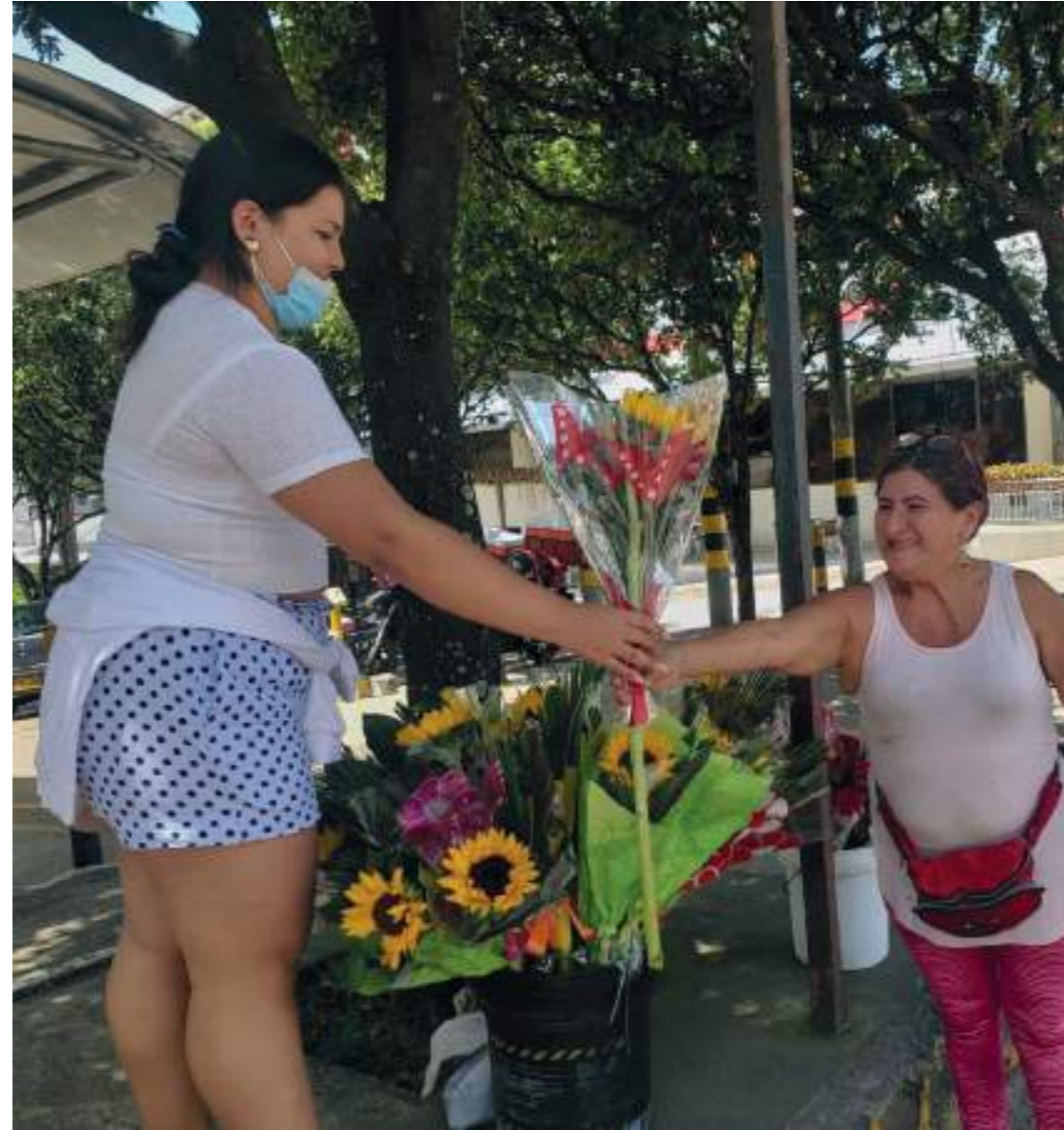
Los hombres buscaban el detalle para las mujeres.