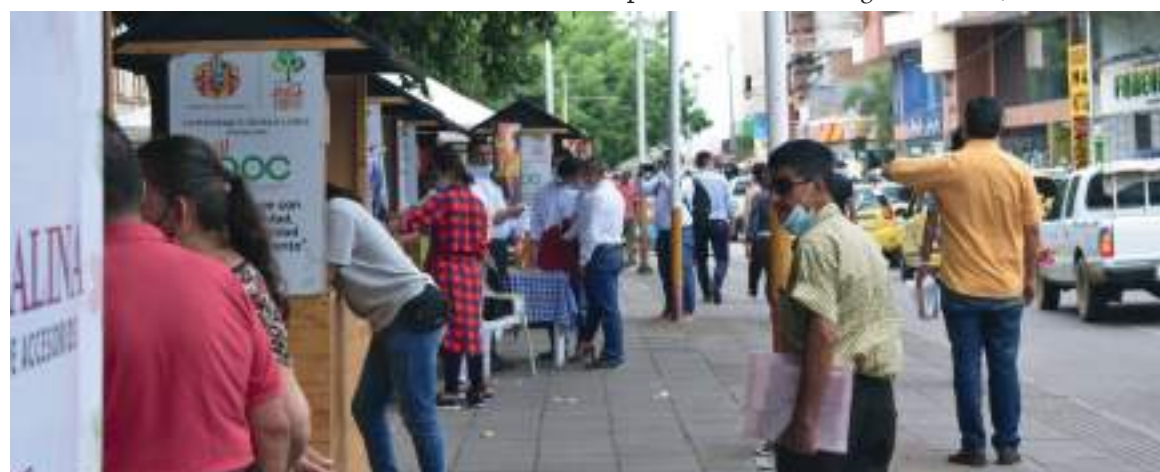
El comportamiento de ocupación hospitalaria en Unidad de Cuidados Intensivos al cierre de la jornada fue del 50 % a nivel departamental, en la ciudad de Neiva en 69 %.

A la fecha se han diagnosticado 100.142 casos positivos de Covid-19 en el Huila.