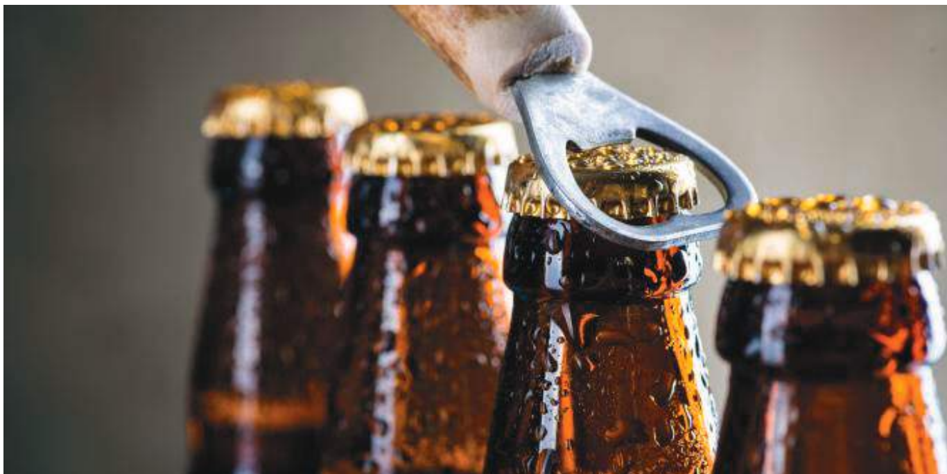
El Ministerio estableció que desde las 6:00 p. m. del sábado 12 de marzo hasta las 6:00 a. m. del lunes 14 de marzo habrá ley seca en el territorio colombiano.

Cuando se cierren las urnas, los medios de comunicación están obligados a solamente “suministrar información sobre resultados electorales provenientes de las autoridades electorales”, indicó el ministerio. En tal caso de difundir datos parciales se debe especificar “la fuente oficial, el número de mesas del cual proviene el resultado, el total de mesas de la circunscripción electoral y los porcentajes correspondientes al resultado que se ha suministrado”, agregó.