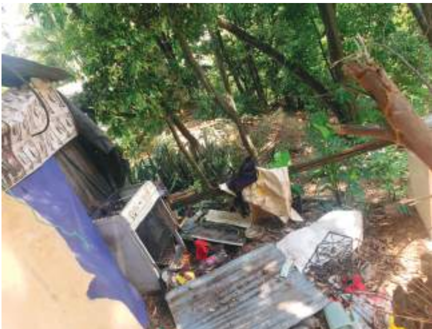
Los enseres de cocina todos se perdieron.

Mientras espera que haya una solución definitiva por parte de las autoridades, hace un llamado a quienes le quieran colaborar con materiales o con recursos para acabar de levantar lo que quedó de su vivienda, para que la contacten al celular 3107511824, o si le quieren consignar directamente a su cuenta Daviplata, o en la calle 8 # 25-105 barrio Las Brisas, les agradecería de corazón, concluye.