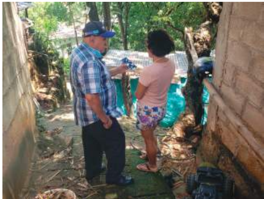
Zaguán de ingreso a la zona en donde está ubicada la vivienda colapsada