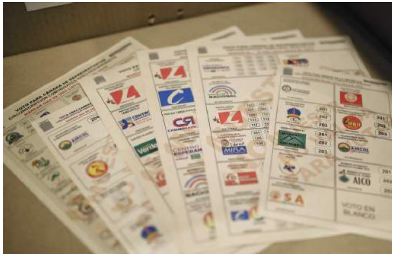
El Consejo Nacional Electoral dio a conocer el listado de ingresos y gastos de cada candidato a la Cámara de Representantes.

Igualmente, la Constitución Política de Colombia en su artículo 109 hace obligatoria para los candidatos y las organizaciones políticas la rendición de cuentas sobre el volumen, origen y destino de sus ingresos. La ley 130 de 1994 obliga a los partidos, movimientos políticos y grupos significativos de ciudadanos a rendir cuentas entre otros sobre la información de la financiación de las campañas electorales. En desarrollo, es la Ley 1475 de 2011 la que especifica los lineamientos de la presentación de los informes por medio de los cuales se rinde cuentas de la financiación de campaña. No obstante, cada proceso electoral cuenta con unas normas particulares, ya que por mandato constitucional le corresponde al Consejo Nacional Electoral, reglamentar cada caso por medio de Reso-