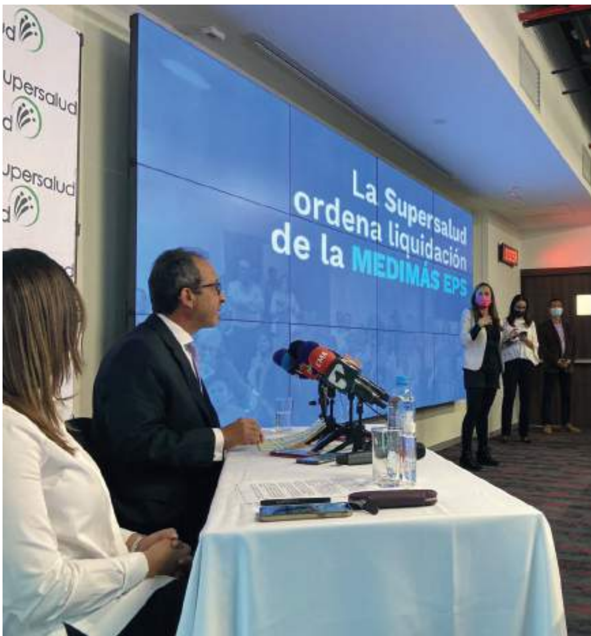
Medimás habría reunido siete condiciones para liquidar a una EPS por fallas en sus estándares en la prestación del servicio de salud.

las cuales el factor tiempo es crucial, la EPS se tomó hasta 27 días en el 35% de los casos para responder a las PQRS por las demoras en la entrega.