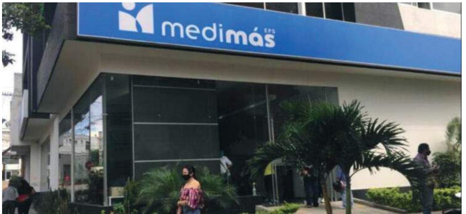
La respuesta de la Supersalud a Medimás se dio una hora después, pero no fue la que ellos querían.

En otros casos de enfermedades crónicas y catastróficas, como condiciones cardiovasculares, diabetes y cáncer, contra