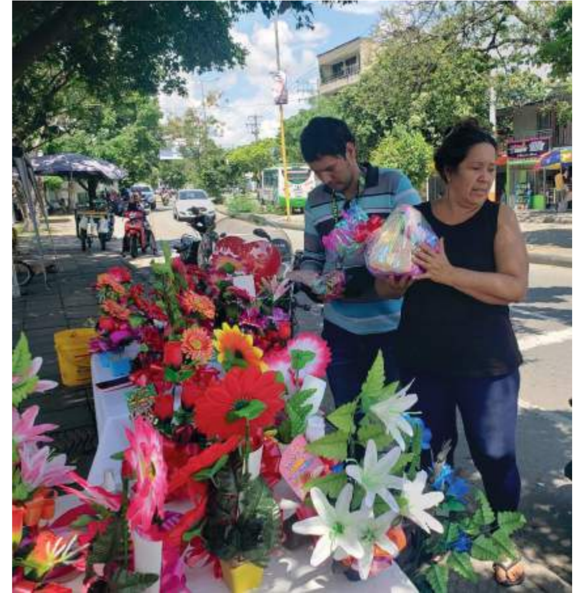
Las ventas son muy buenas en los días especiales como el Día Internacional de la Mujer.

Muchas fueron las mujeres que celebraron su Día Internacional trabajando en las calles para conseguir su sustento diario.