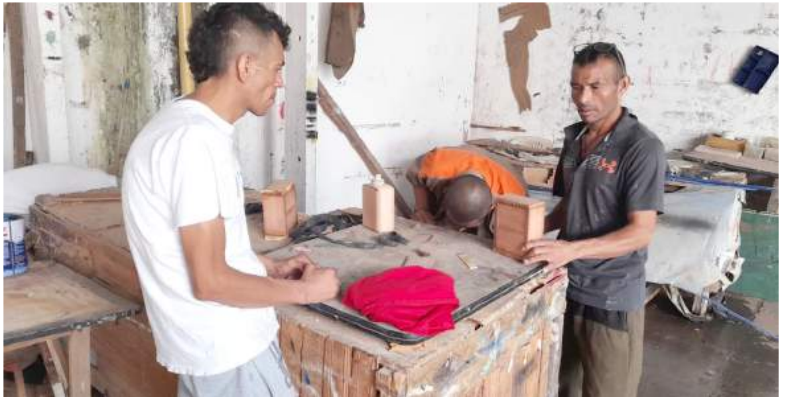
Se espera que desde el Gobierno Nacional se ponga la lupa a esta problemática ya generalizada en el país.

El Establecimiento Penitenciario de Mediana Seguridad y Carcelario de La Plata Huila, atiende a los municipios de Tesalia, Nátaga, Paicol y La Argentina y La Plata. En este último territorio, sólo tenían 6 condenados en la estación de Policía, quienes la semana pasada fueron trasladados dando cumplimiento de unos de