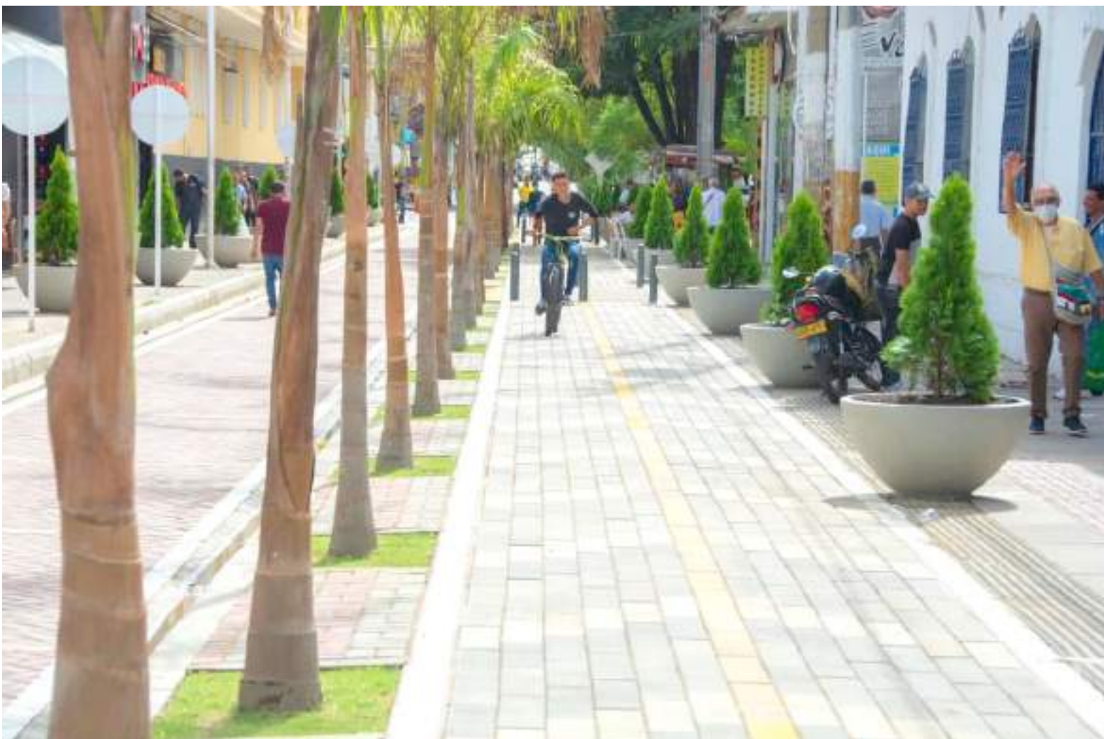
La vista general es agradable por todo el entorno.

Ahora ya con la obra en servicio, corresponde a los neivanos en general, tener sentido de pertenencia por la ciudad y entre todos cuidar lo que convierte en atractivo comercial y turístico a Neiva, y que de paso esto no sea solo en las festividades de San Pedro.