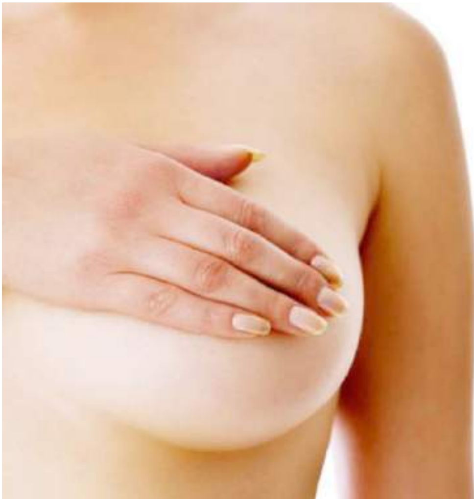
El cáncer de mama es el tipo de cáncer más común.