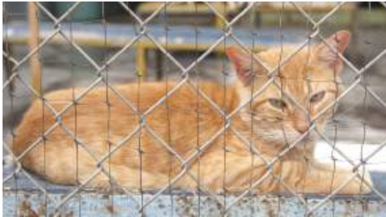
“Es muy importante que la gente denuncie el maltrato, porque si no denunciamos, las cosas se quedan así”.

Señaló Losada que la indiferencia no proviene solo de la comunidad sino también de los administradores públicos que no ejercen las tareas correspondientes pese a la competencia que detentan. “Hace falta responsabilidad de la Administración Pública porque la protección de los animales está contemplada en la Ley. Es una obligación de los alcaldes, de los gobernadores, y del Estado en general, desarrollar planes y programas de prevención, así como crear centros de bienestar animal”. Adujo que, por el contrario, los entes territoriales se atienen a las fundaciones y asociaciones y no aportan lo necesario para el cumplimiento de esta labor.