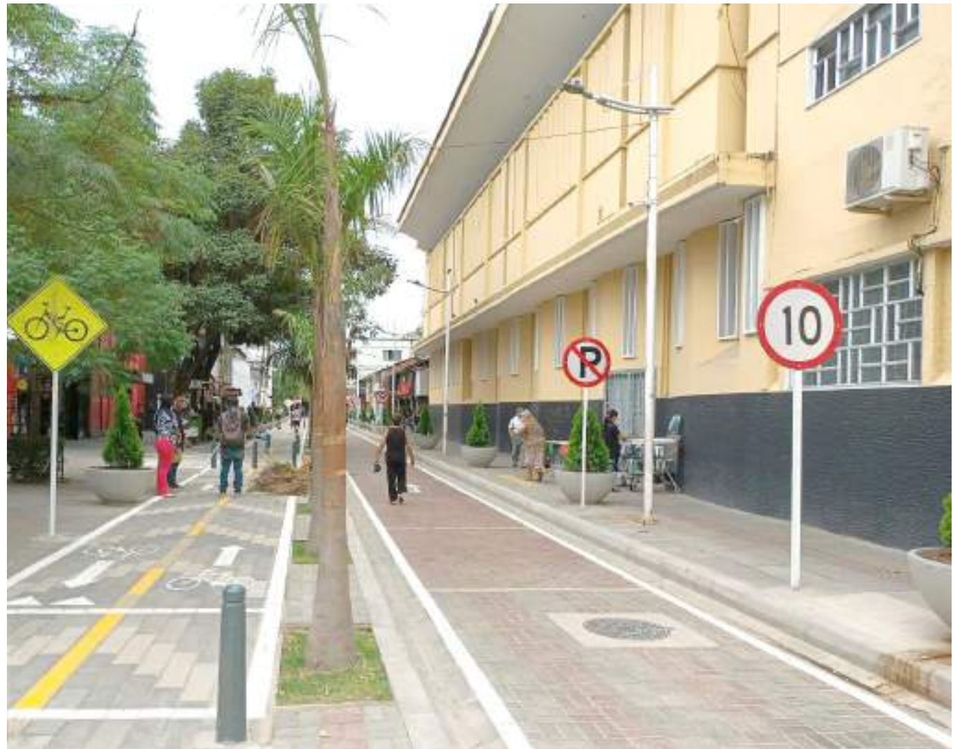
Algunos vendedores informales conservan sus espacios.

“Este es un proyecto que está dentro del componente técnico de estructuración, legal y financiera del Sistema Estratégico de Transporte Público de la ciudad de Neiva, haciendo caso a la pirámide mundial de movilidad”.