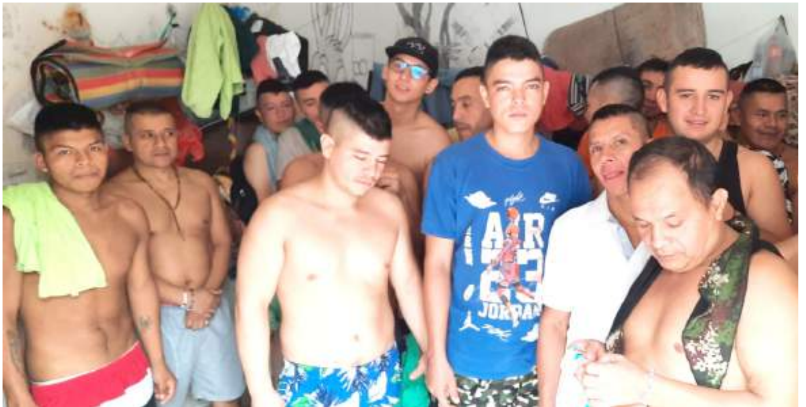
Preocupa hacinamiento de personas privadas de la libertad en la estación de Policía de La Plata.

Explicó así que, “Estas responsabilidades no quieren ser asumidas por parte del INPEC quienes tienen sus propios procedimientos que hacen mucho más engorrosos los trámites. Para efectos de que nos recibieran a todos los presos se firmó