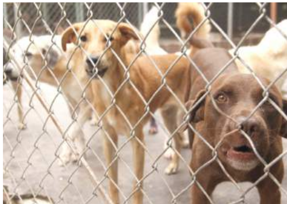
“Esterilizar es lo más importante que debe hacerse y es el mejor regalo que puede dársele a los animalitos”.

Concluyó Andrade exhortando a la ciudadanía a adoptar una conducta diligente frente a los animales pues es ésta la única forma como se puede contrarrestar el fenómeno. Solo la comunidad, con su buen comportamiento y responsabilidad, podrá cambiar la triste realidad que viven miles de perros y gatos en la ciudad de Neiva.