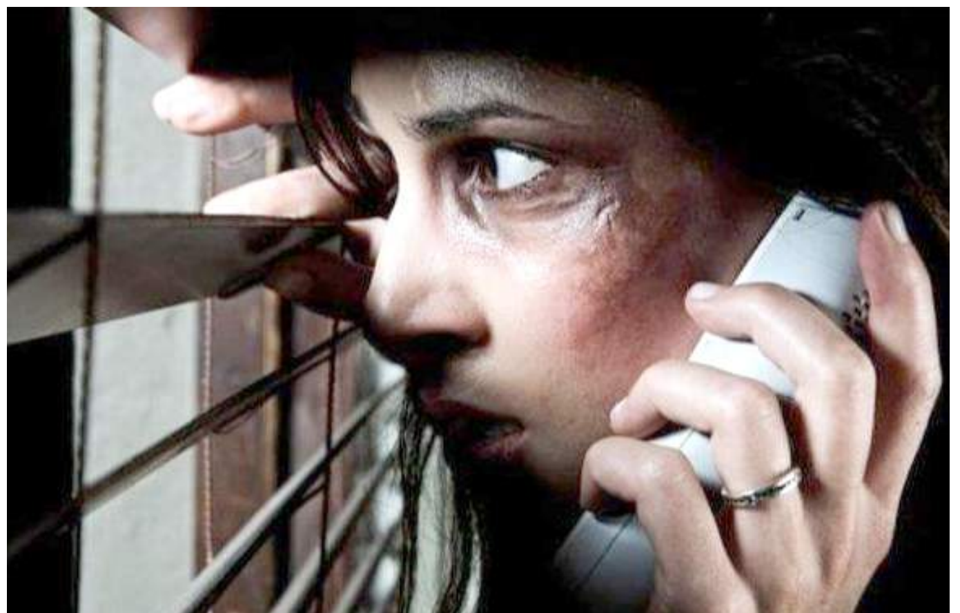
La Alcaldía Municipal cuenta con rutas de atención para la violencia de género.

Cabe resaltar que las estrategias están pensadas para atender a la diferente población de mujeres el municipio sin importar el estrato social, la creencia o la edad que tenga.