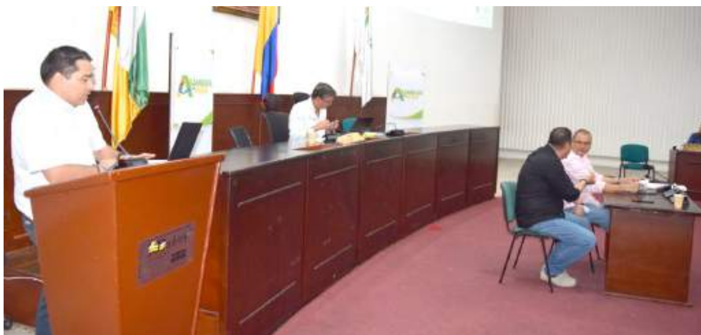
La Asamblea del Huila aprobó el proyecto de ordenanza en el que se institucionaliza el Festival Gastrofest-Opita.

Finalmente, será la administración departamental la que deberá garantizar anualmente el presupuesto para la realización del Festival y el proyecto de ordenanza N.033 de 2022, permitirá la creación de una red de apoyo entre productores y comercializadores, así como el desarrollo de programas de capacitación y formación como acompañamiento post-Festival que busque fortalecer e impulsar el crecimiento del emprendimiento en el Departamento.