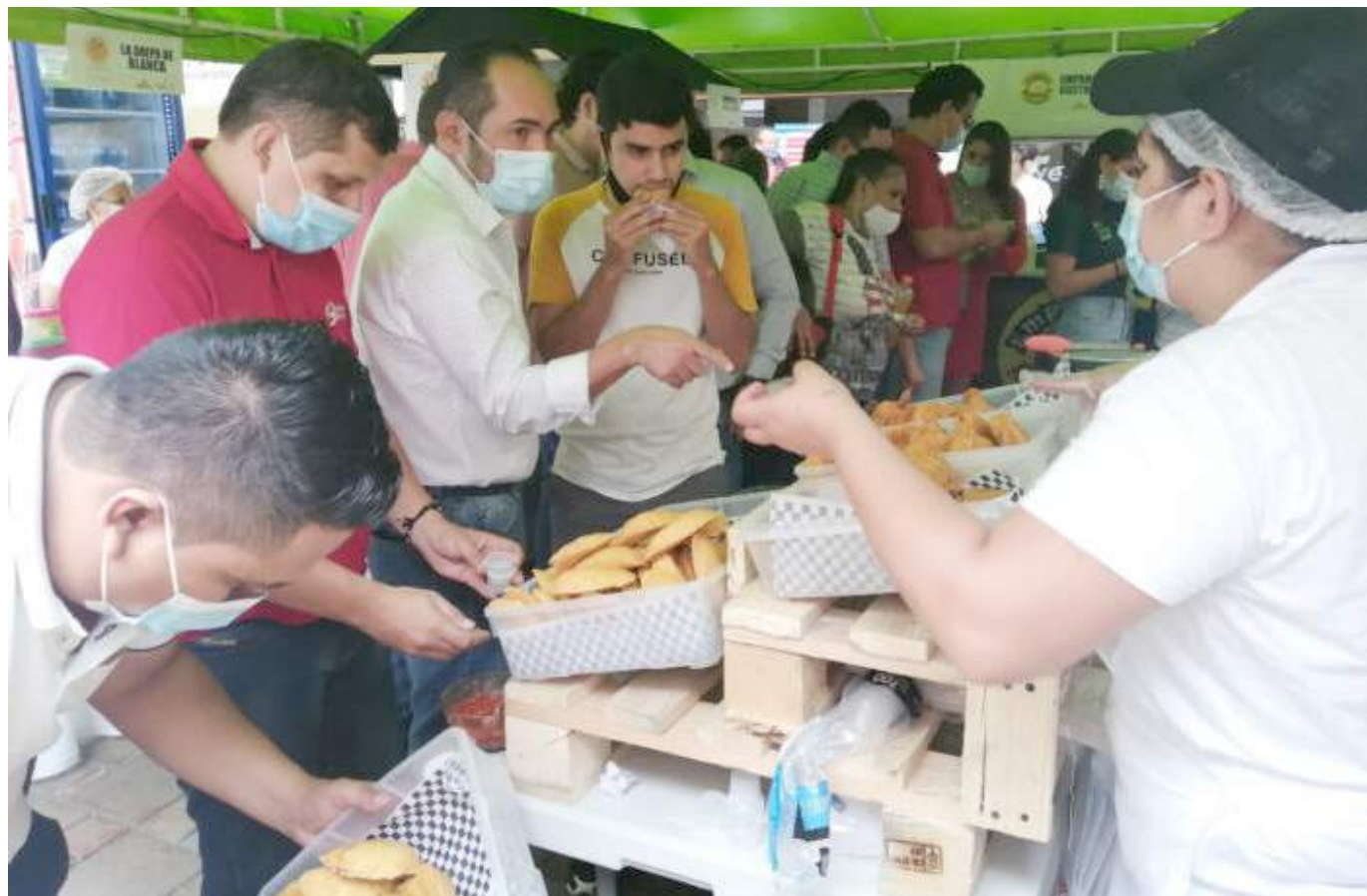
Se prevé arrancar con la primera versión del festival en noviembre del presente año.

Dentro de la misma ordenanza se definió que la administración departamental deberá presentar un informe a la Asamblea del Huila, posterior a la ejecución del GASTROFEST-OPITA. Lo anterior con el fin de hacer seguimiento y evaluación de la actividad.