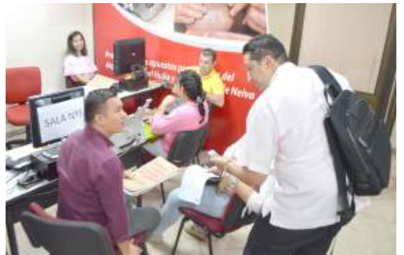
Los días 14, 15 y 16 de septiembre, se llevará a cabo una nueva jornada de Conciliación Nacional.

La conciliación es un mecanismo para la solución de conflictos en el que dos o más partes manifiestan sus intereses y necesidades a un tercero neutral y calificado denominado conciliador, con quien intercambian ideas y propuestas que permitan resolver las diferencias que éstas tienen.