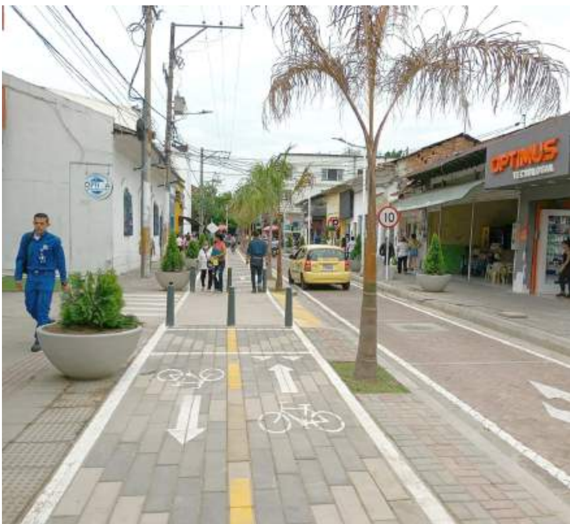
El sector es comercial por excelencia.

■ Tras una serie de retrasos por diversos motivos que se fueron superando por parte de los contratistas, fue entregada la peatonalización de otro tramo de la calle 8 en el centro de Neiva entre las carreras 6 y 7. La obra está enmarcada en la fase 8 del componente de infraestructura vial del proceso de implementación del nuevo esquema de transporte Público - SETP Neiva.