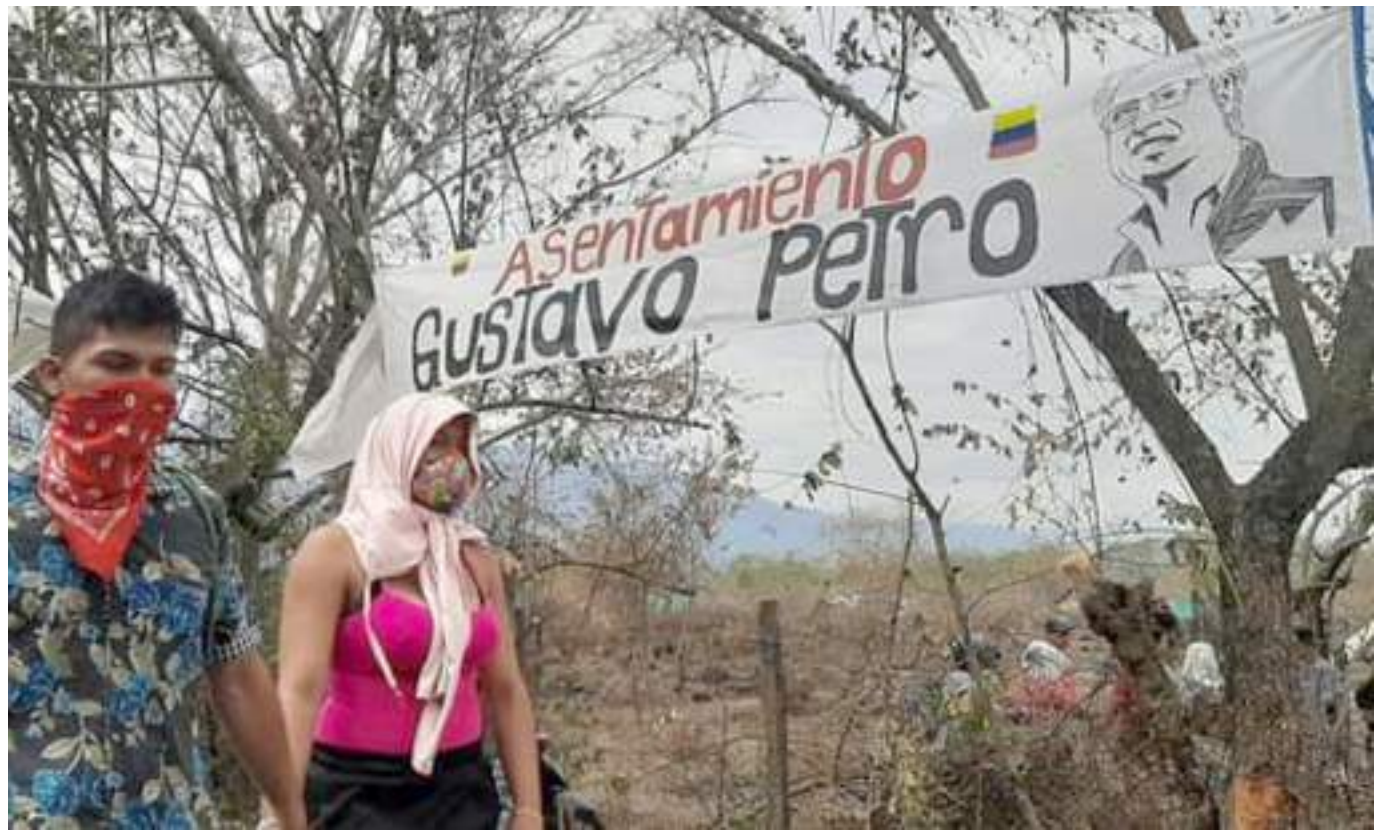
Asentamiento “Gustavo Petro”, así le llamaron al predio invadido en el corregimiento El Caguán.