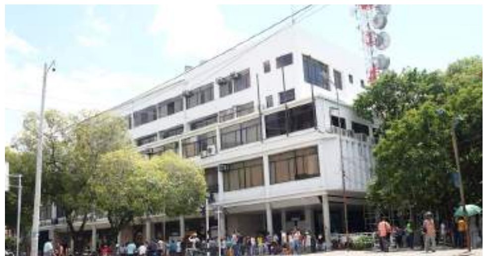
Se anunció recorte de trabajadores de la Alcaldía de Neiva.

También anunció que se reducirá “el tema de contratistas, para quienes tendremos un plan de austeridad severo porque la idea es que tengamos gente en propiedad que se apersonen de los procesos y que tengan asegurados todos los derechos en cuanto a prestaciones de ley”.