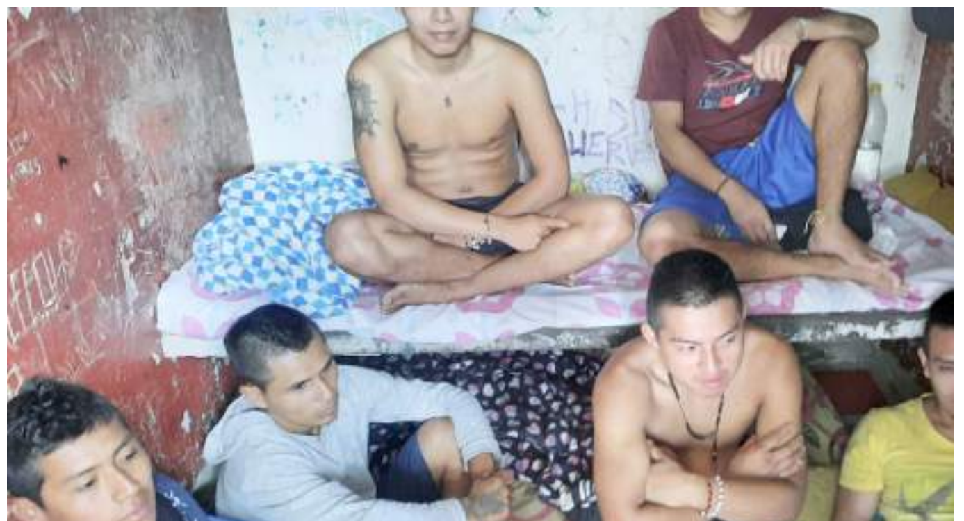
El hacinamiento carcelario en las estaciones de Policía obedece a las medidas adoptadas desde la pandemia.

De acuerdo con el encargado del INPEC de La Plata, la administración a través de su presupuesto municipal tendría que haber destinado un rubro que es para seguridad, del cual se tendría que invertir en el centro transitorio.