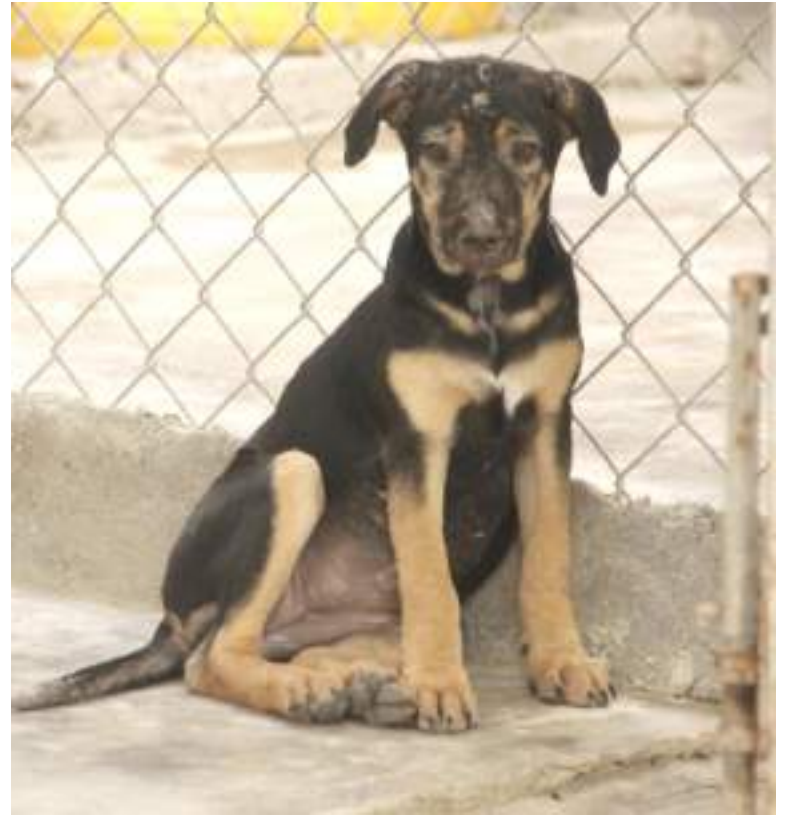
“La gente les echa agua caliente, los machetean, los golpean, los dejan tirados por no gastarles un peso”.