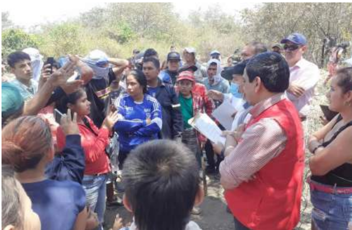
En el predio se han instalado familias de varios municipios y no se ha logrado ningún acuerdo.