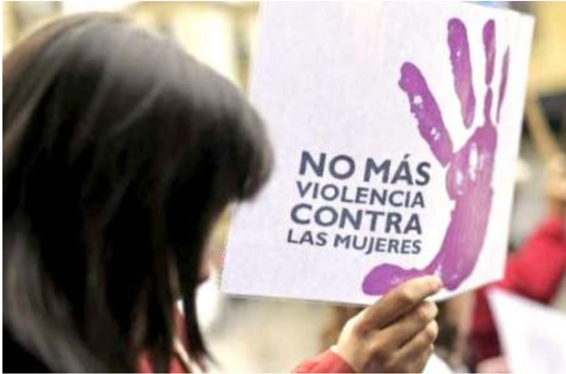
En la ciudad de Neiva se ha registrado un gran número de casos de violencia contra las mujeres.

■ En Neiva son cuatro las Instituciones que reportan casos de violencia de género ocurridas en el Municipio de Neiva. Para el caso de la Policía Metropolitana se reportan 96 casos hasta febrero del 2022. Los más alarmantes los presenta la Secretaría de Salud Municipal con 320 casos en el primer trimestre, al igual que Medicina Legal con 279 casos.