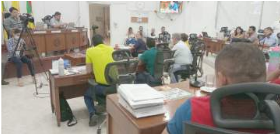
Pasó en el Concejo el proyecto de contra crédito por $5 mil millones de pesos.

Este dinero será destinado para pagar la nómina de la Alcaldía Municipal la cual se encuentra colapsada por la gran cantidad