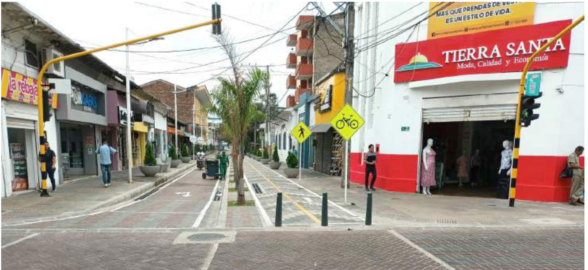
Vista de las obras de la 8 desde la carrera