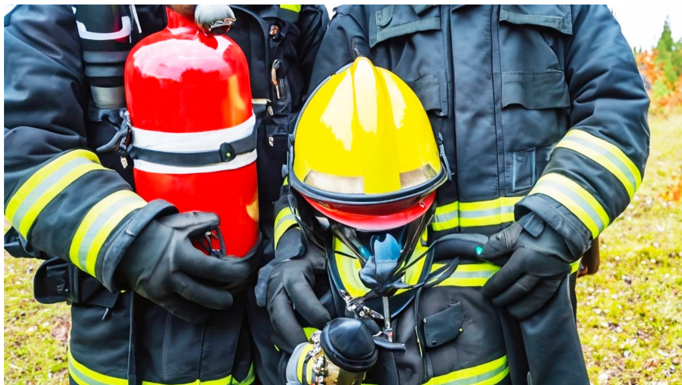
Solo un traje de bombero profesional, tiene un costo de $ $50 millones.

En este sentido, los entes territoriales deben garantizar la inclusión de políticas, estrategias, programas, proyectos y la cofinanciación para la gestión integral del riesgo contra incendios, rescates y materiales peligrosos en los instrumentos de planificación territorial e inversión pública.