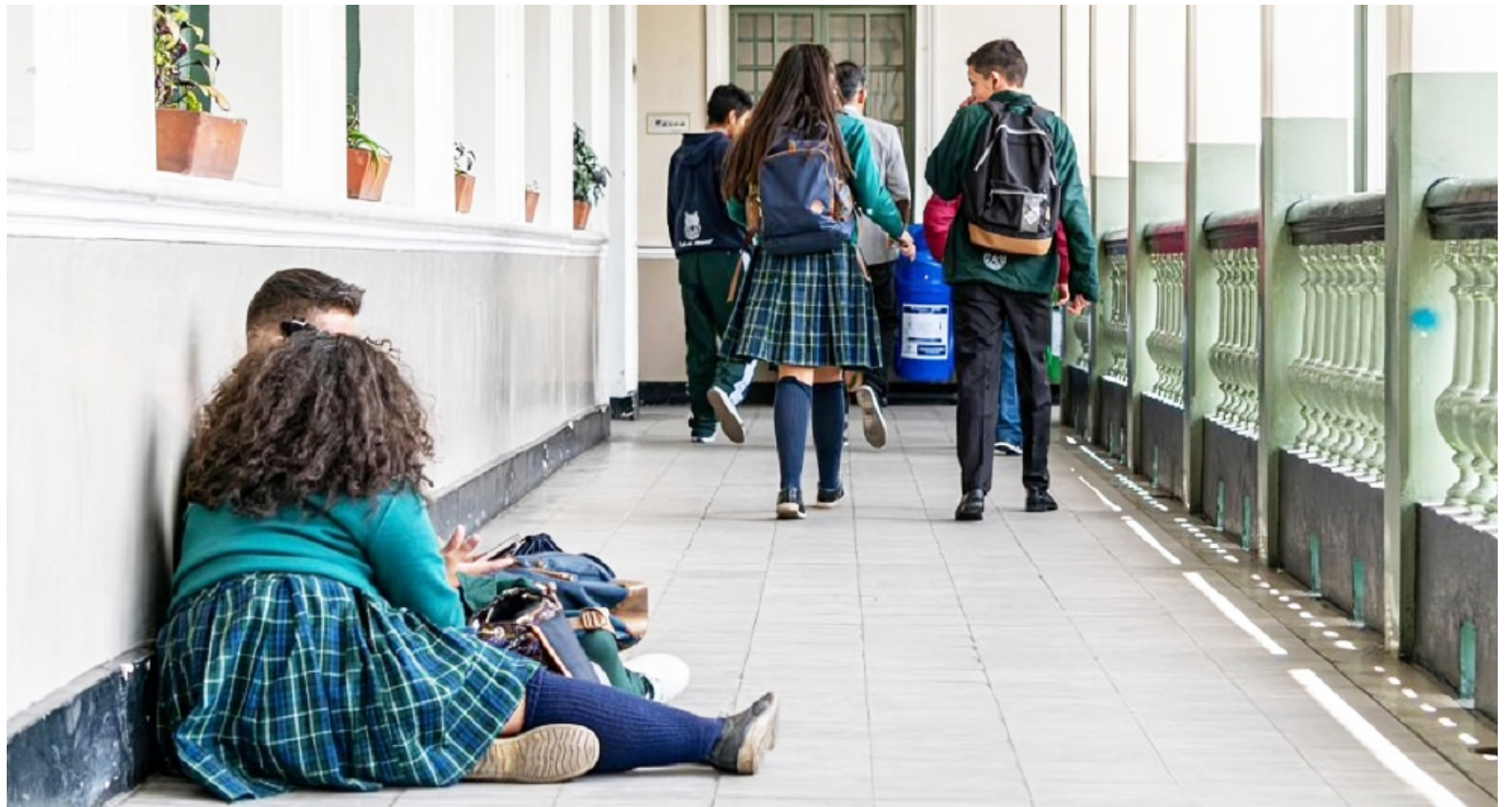
Las nuevas normativas indican cómo factores como la permanencia y el Índice de Precios al Consumidor influirán en la fijación de tarifas educativas desde 2025.

La resolución clasifica a los colegios en tres regímenes: libertad regulada, libertad vigilada y régimen controlado. Cada uno de estos regímenes se rige por una serie de criterios específicos que incluyen la autoevaluación institucional, el Índice de Precios al Consumidor (IPC), la permanencia de los estudiantes, la inclusión educativa y el reco-