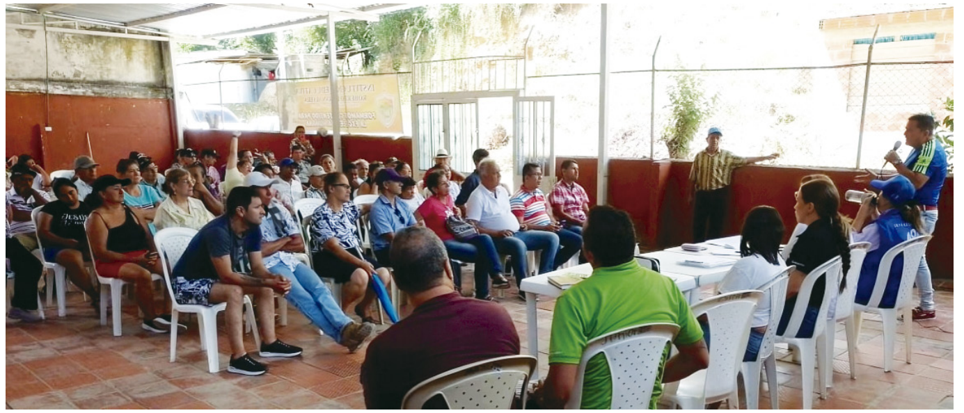
Socialización de las alertas, el pasado 24 de junio del año en curso.

Sin embargo, este medio de comunicación, recibió una denuncia de la comunidad, donde señalaron que los mencionados sistemas de alertas tempranas que fueron instalados, no funcionan, debido a que hace un año, no les hacen mantenimiento y no cuentan con servicio de internet, para enviar información actualizada.