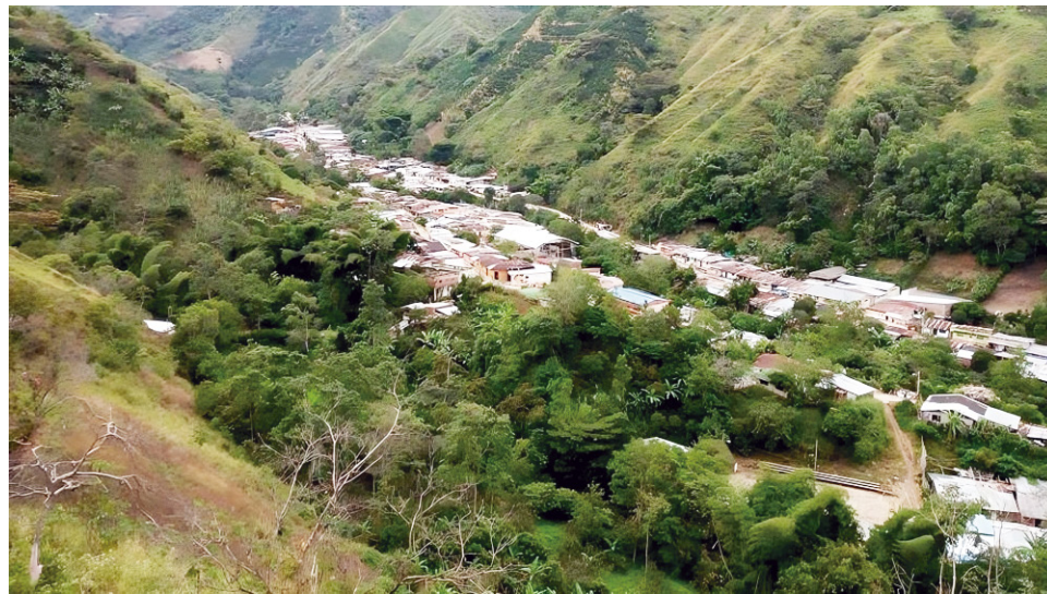
La amenaza indicada, es por la posibilidad de que el río Fortalecillas, socave las montañas y se presenten deslizamientos.