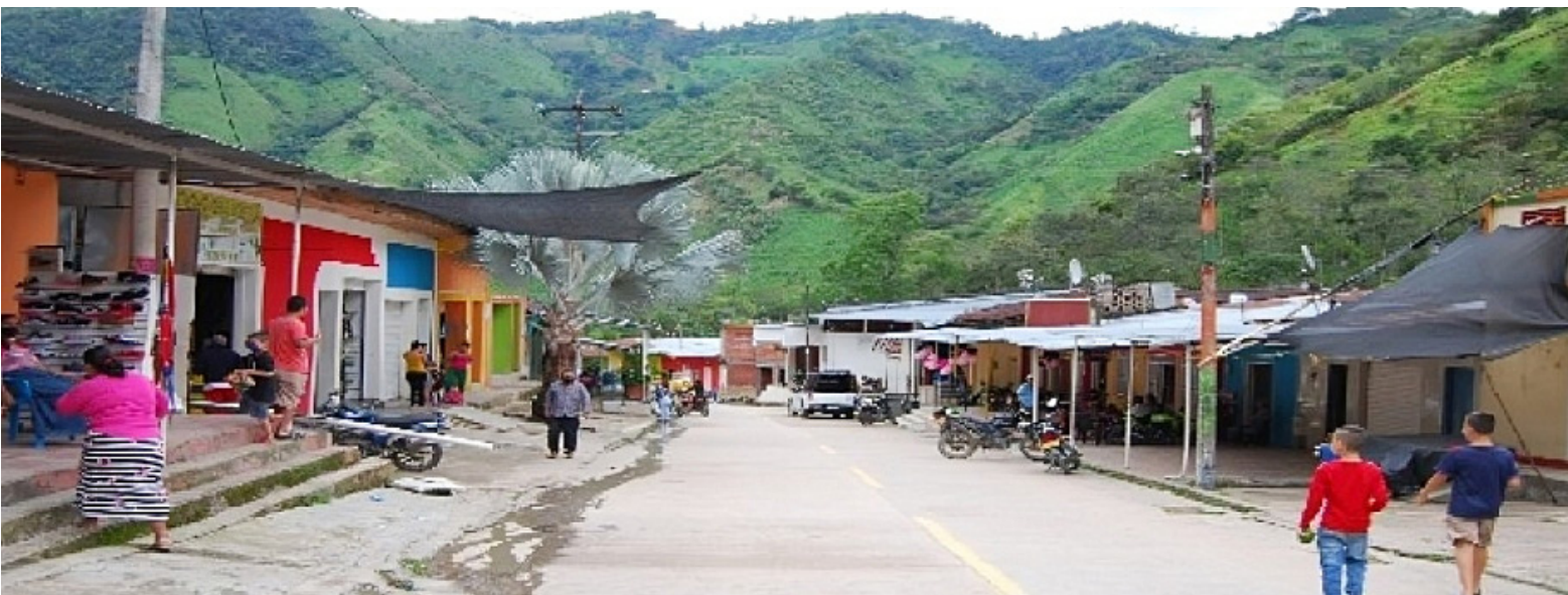
La comunidad i que no invierten en su localidad, pero si deben pagar impuestos.