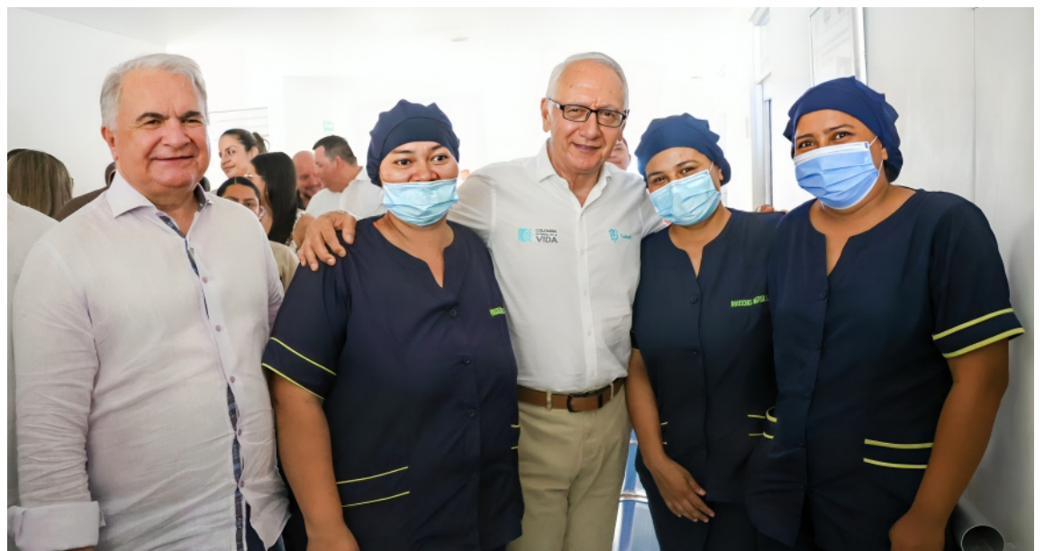
El Ministro de Salud Guillermo Alfonso Jaramillo, adelantó un recorrido de inspección a varios hospitales y centros de salud del departamento. Anunció equipos básicos en salud, recursos para el mejoramiento de la infraestructura y funcionamiento.