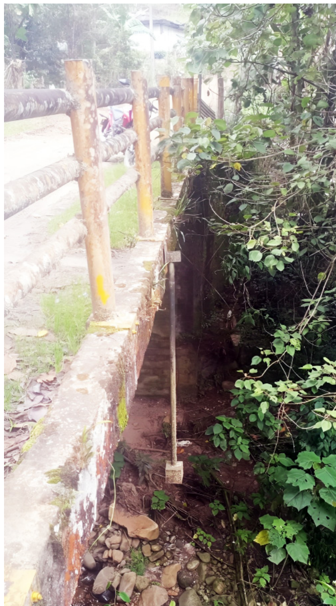
Sistema de Alerta, para monitorear el río Fortalecillas, no estarían funcionando denunció la comunidad.