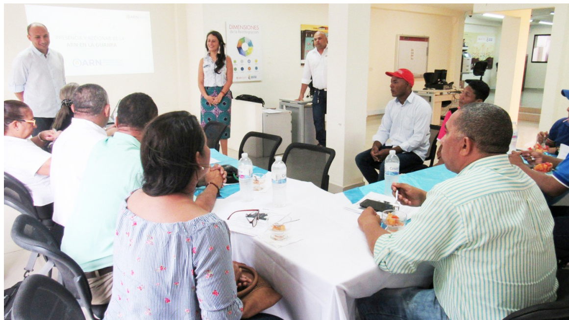
La estigmatización es uno de los mayores problemas a los que se enfrentan los firmantes de paz.