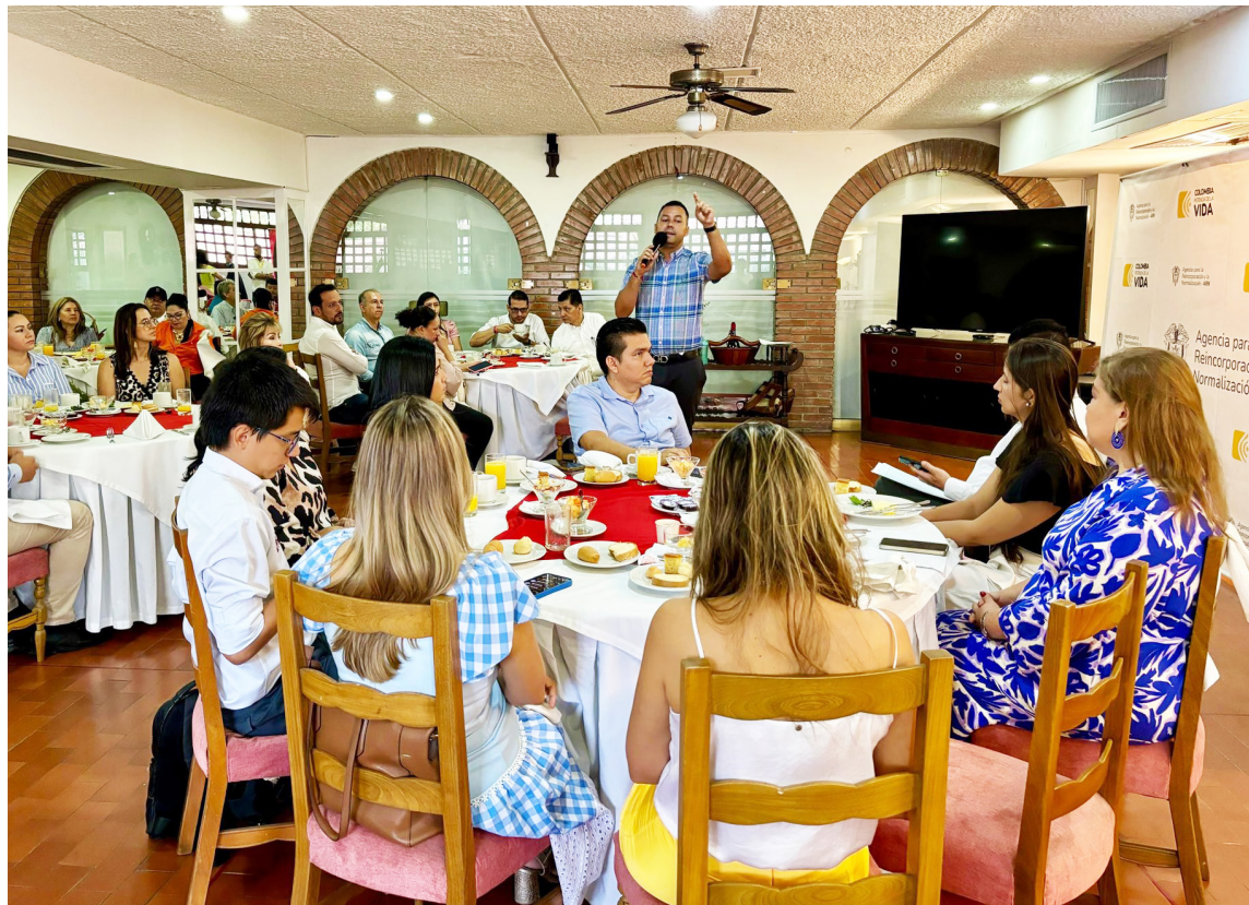
Igualmente, se vienen desarrollando acercamientos con el sector empresarial.

La estigmatización de los excombatientes es otro obstáculo que enfrenta el proceso de reincorporación en el Huila. Restre-