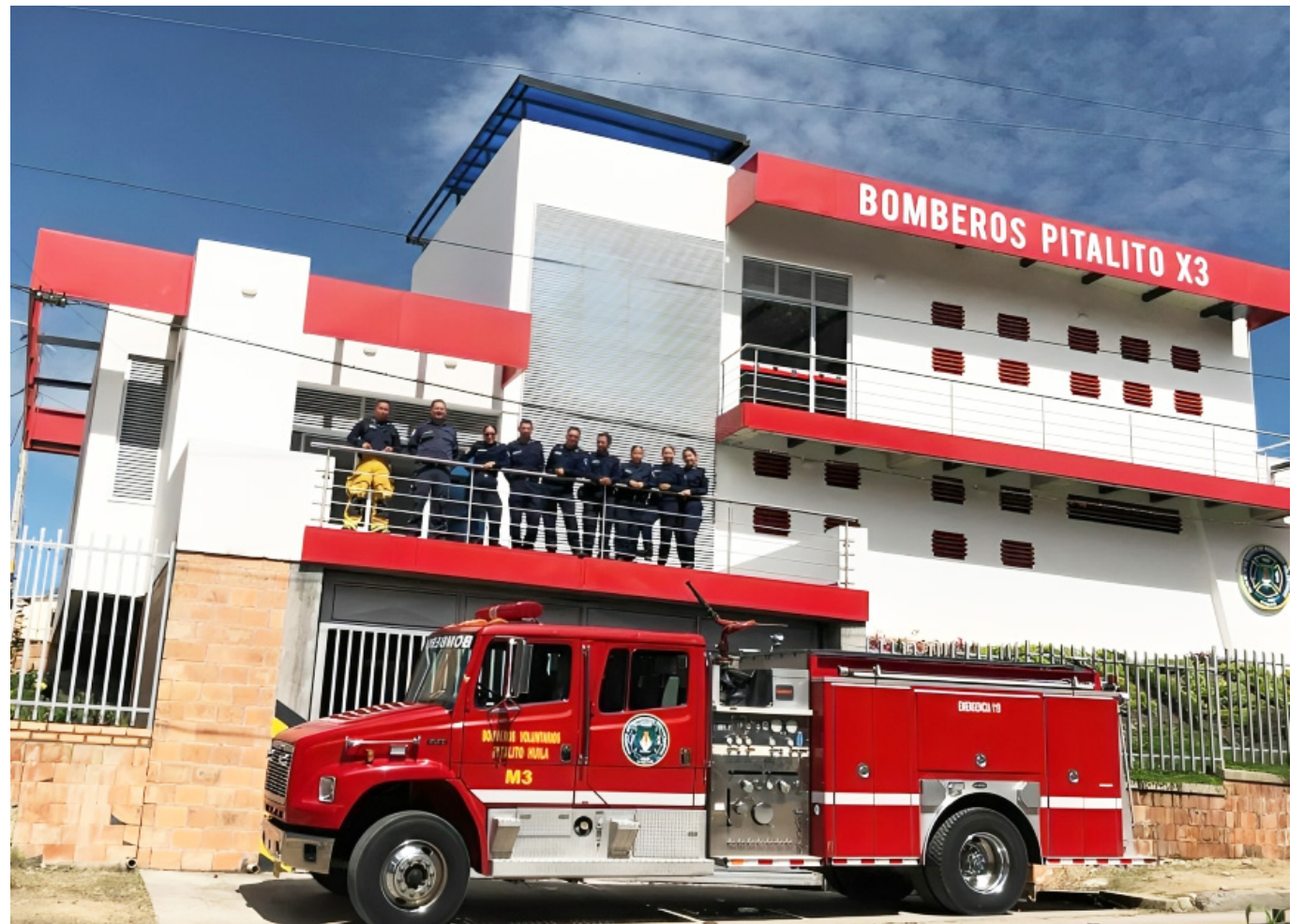
Por ejemplo Bomberos Pitalito, necesita $3.200 millones para operar.

"En esta conflagración afectó un reconocido taller de carpintería, donde todo quedó reducido a cenizas, y tenían trabajos de talla para entregar. Ahora ¿Cuánto se demora en llegar un carro de bomberos de Timaná a Elías? Cerca de 30 minutos, que por norma no debe pasar de cinco", reveló el abogado.