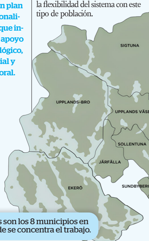
Estos son los 8 municipios en donde se concentra el trabajo.

financiado por la Universidad Surcolombiana, Vicerrectoría de Investigaciones y Proyección Social, Facultad de Ciencias Jurídicas y Políticas, ORNI y el programa de expertos internacionales del ICETEX, por ello, visité a tres ciudades de Suecia (Estocolmo, Falun y Gotemburgo) para conocer de primera mano cómo el Estado con su Ministerio de Justicia, las autoridades penitenciarias, la policía y la sociedad en su conjunto hacen frente a los problemas de seguridad que se han agravado extrañamente en este país, dada la creciente presencia de emigrantes provenientes de Asia y África que gestan conflictos producto de los carteles de drogas transnacionales, en donde se utilizan a jóvenes para traficar o incluso cometer delitos como el homicidio a sabiendas de la flexibilidad del sistema con este tipo de población.