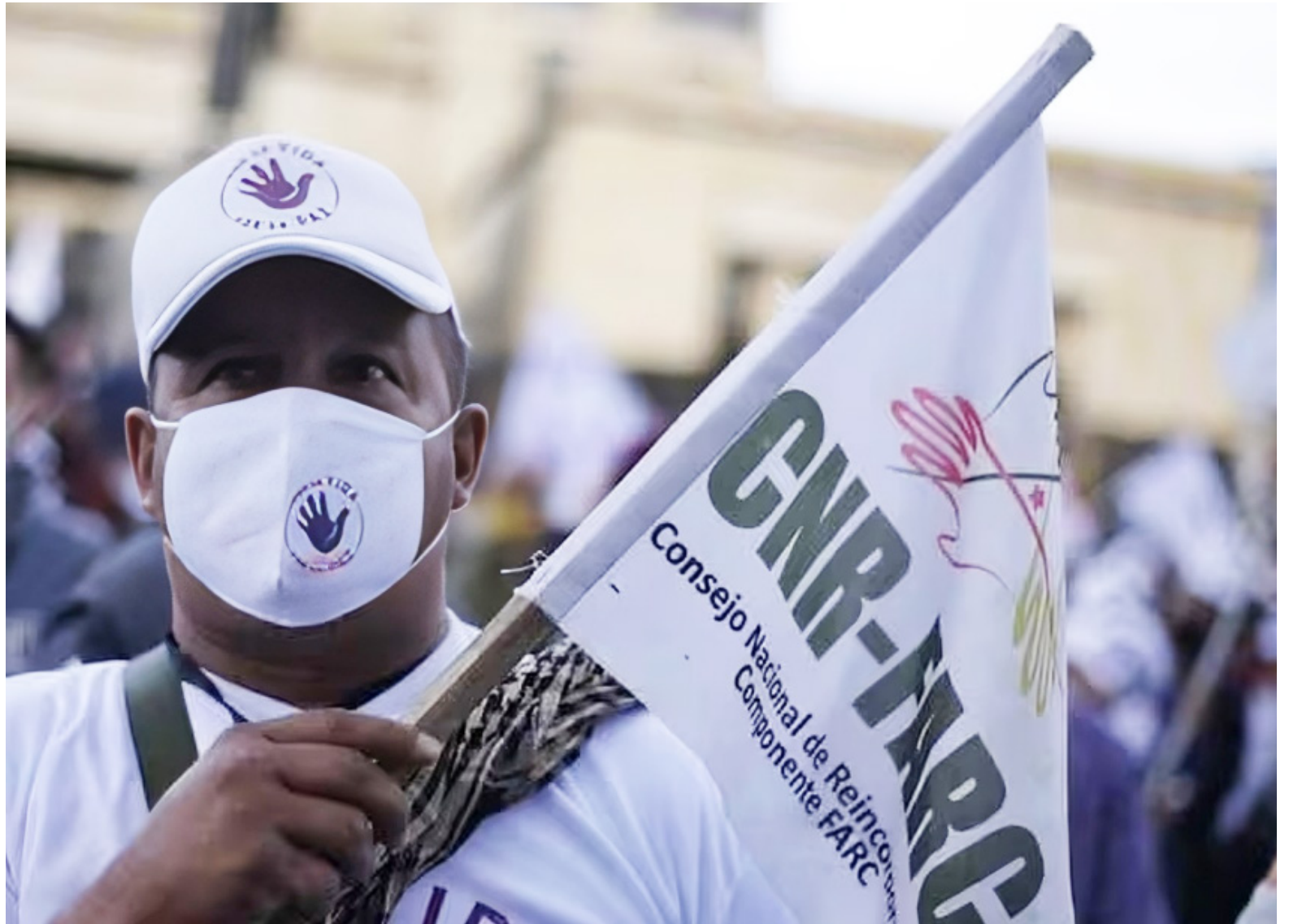
En el Huila hay, hasta agosto del 2024, 544 personas activas en el proceso de reincorporación.

“El camino hacia una paz total será largo y complicado mientras sigan existiendo grupos armados al margen de la ley. Aunque el go-