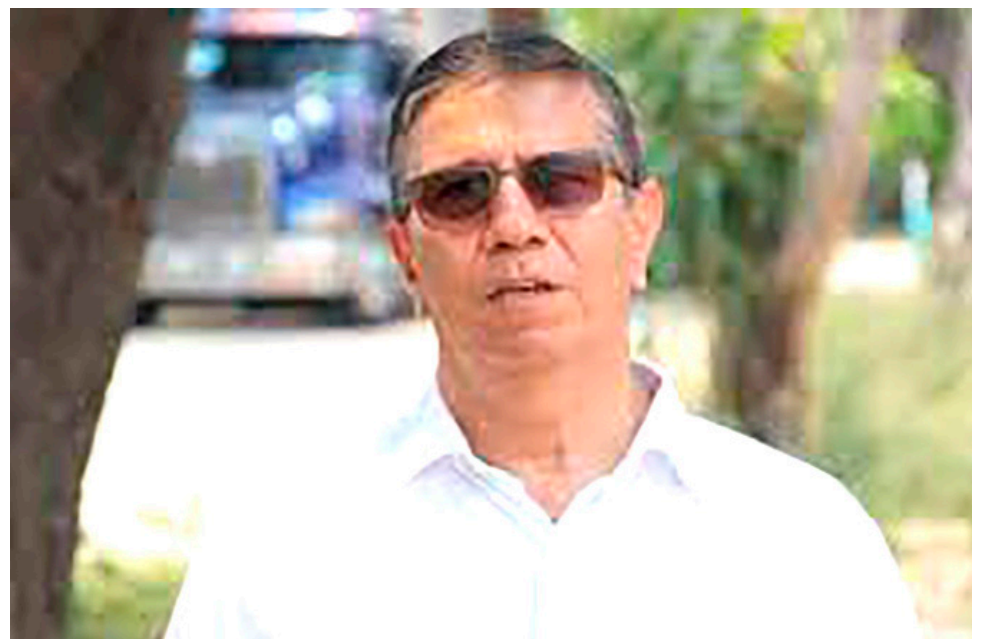
Alcalde de Garzón Cesar German Roa Trujillo

Además, advirtió claramente que, “desde la planeación presupuestal del año 2023, estas entidades, debieron darle prioridad a destinar los recursos para dar cumplimiento al fallo de tutela objeto de revisión”.