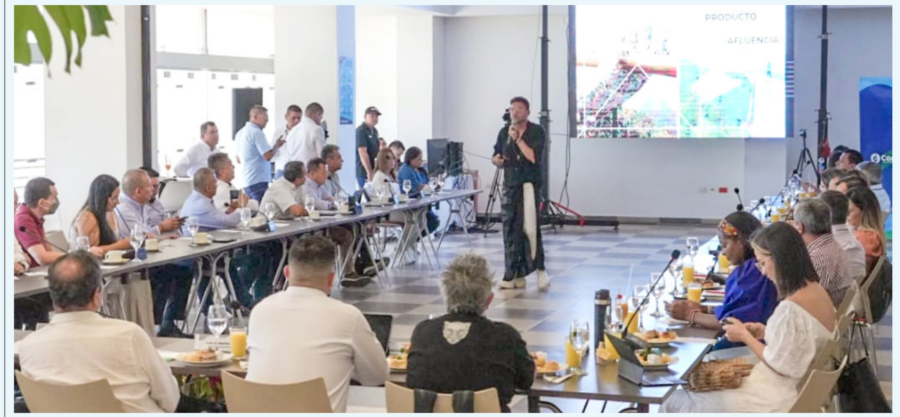
Comfamiliar indicó que "el río Magdalena nos une como región. Por ello la Supersubsidio y la Caja logran reunir el sector público y privado para fortalecer el turismo en el departamento."