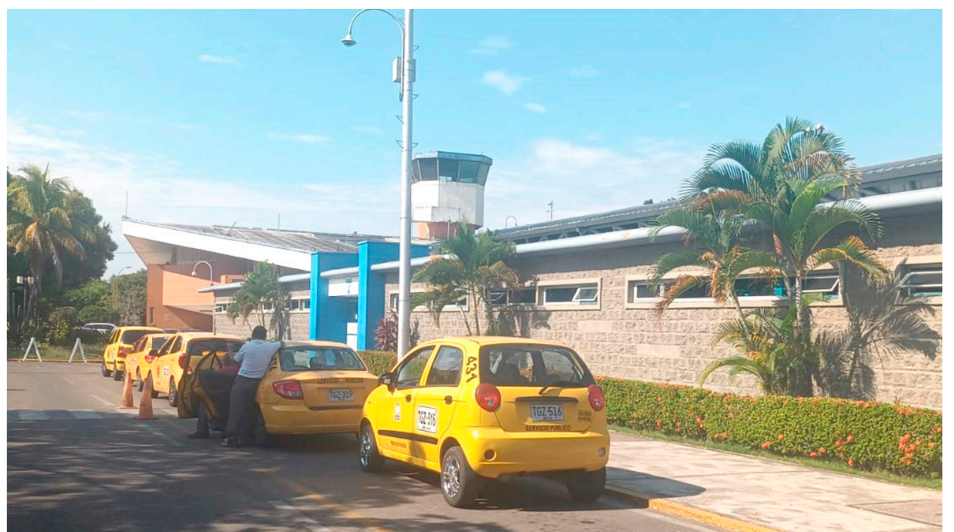
Finalmente tuvieron que abandonar la terminal sin solución.

Se esperaban unas 150 personas, de las que llegaron un poco más de 50 para intentar encontrar una respuesta o que los embarcaran en otras aerolíneas como una de las alternativas ofrecida.