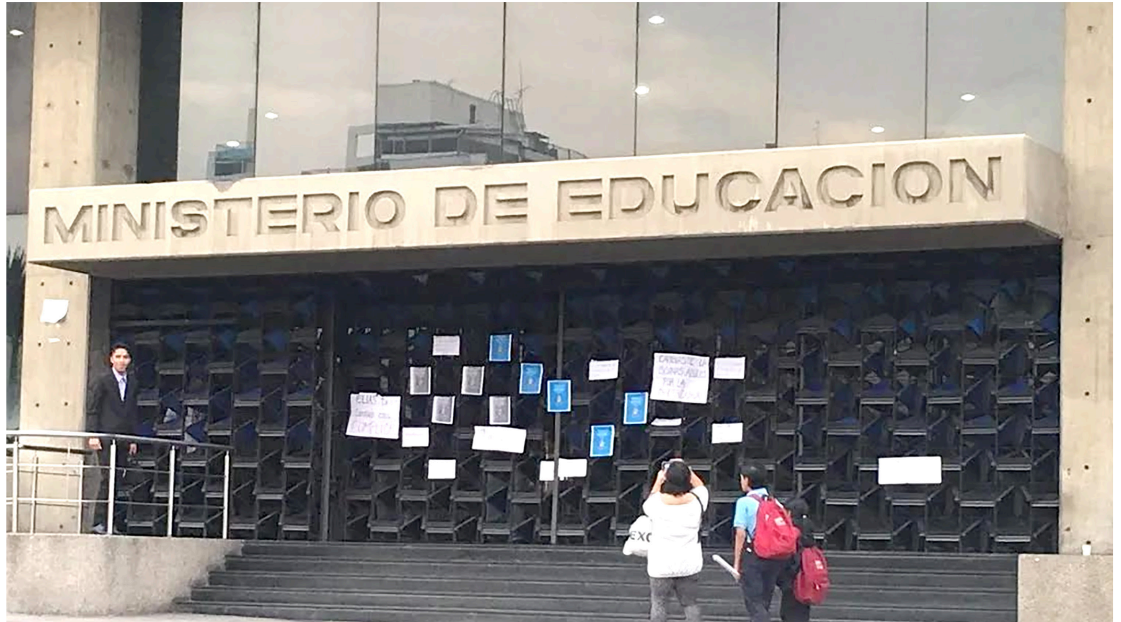
El ministerio de Educación indicó que los responsables son la Gobernación y la Alcaldía.

La manzana de la discordia está en que a los estudiantes de esta institución no se le ha garantiza-