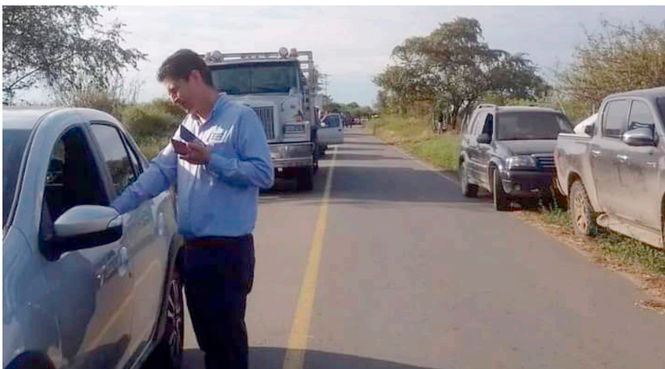
Protestan por el servicio de transporte escolar.

“La prestación del servicio de transporte por competencias es una obligación de la Nación y quienes deben adelantar los trámites y presentar los proyectos que serán subsidiados solidariamente por el departamento, son los alcaldes”.