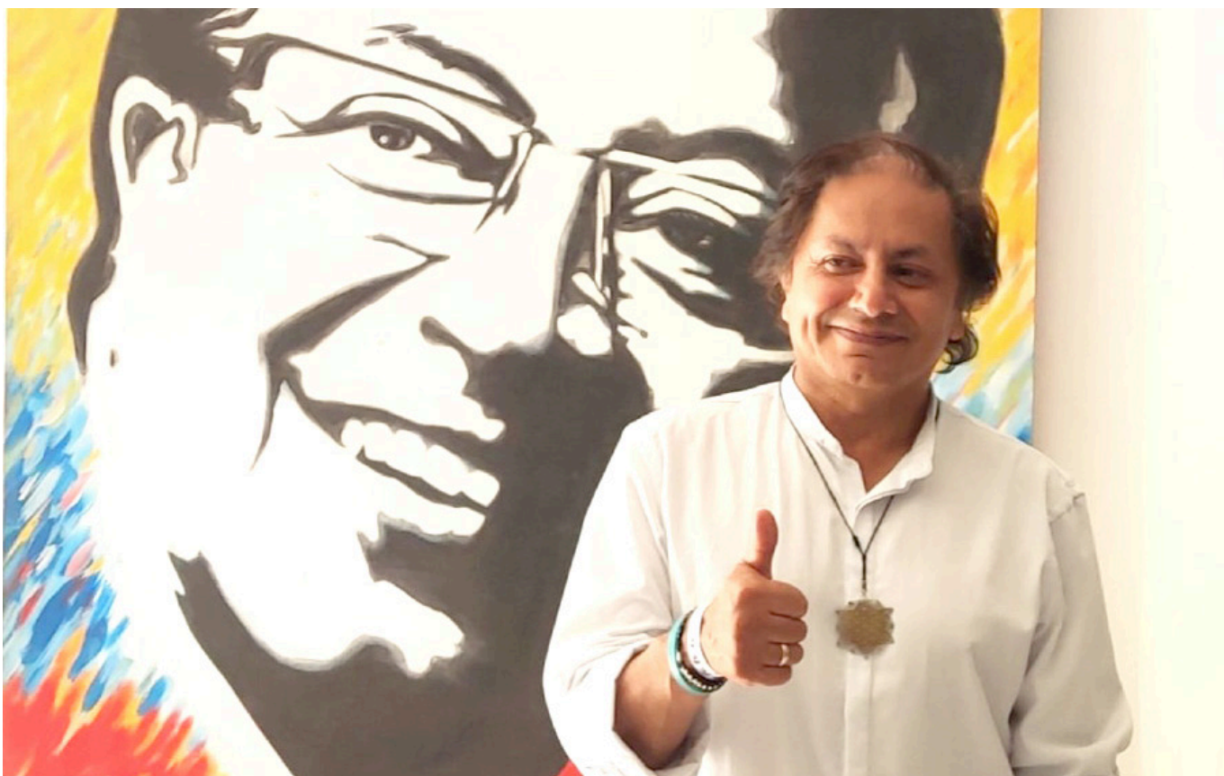
Así mismo Juan Fernando Petro, podría ser investigado por la Fiscalía.

La polémica generada por las declaraciones de Days Vásquez se suma a la tensión política que vive Colombia en estos momentos, y ha provocado un gran debate en el país sobre la corrupción en la política y sobre la necesidad de investigar a fondo las posibles relaciones entre los políticos y los grupos criminales.