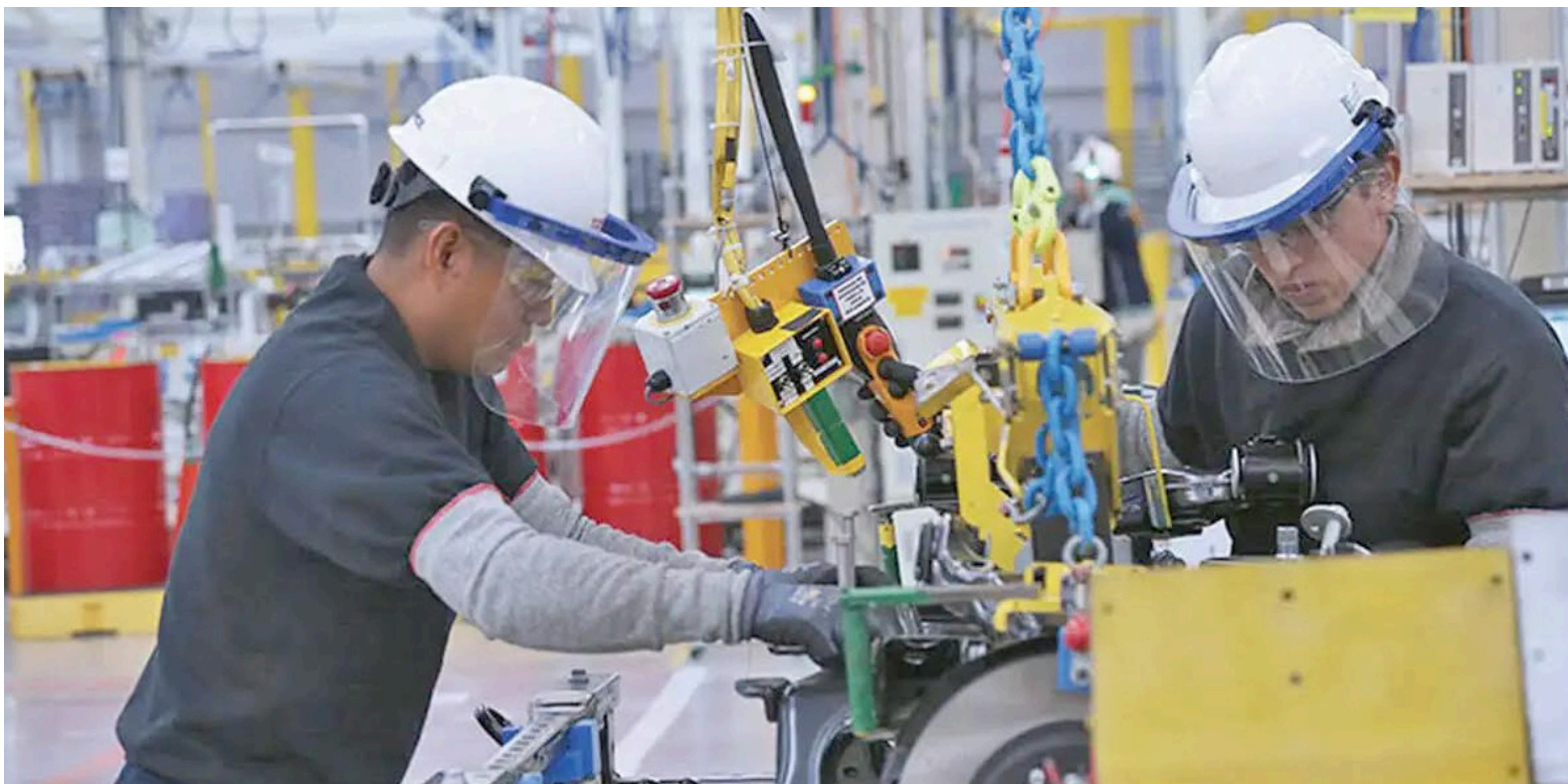
La jornada laboral en Colombia, tendrá una reducción de 1 hora.

Una medida para evitar el despido injustificado será aumentar la multa, otra de las propuestas de la reforma es la indemnización, la cual tiene un gran debate en la comisión.