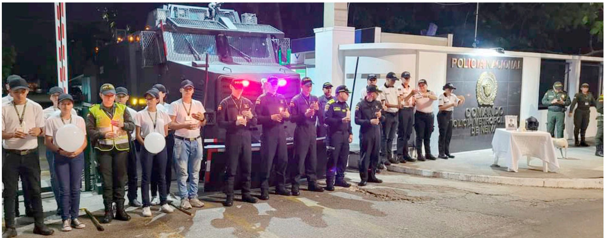
En Neiva, los uniformados de la Policía Metropolitana realizaron un velatón por la muerte del Subintendente Monroy Prieto.

Con camisetas blancas, flores y globos, lamentaron la partida del uniformado que deja una esposa y dos hijos.