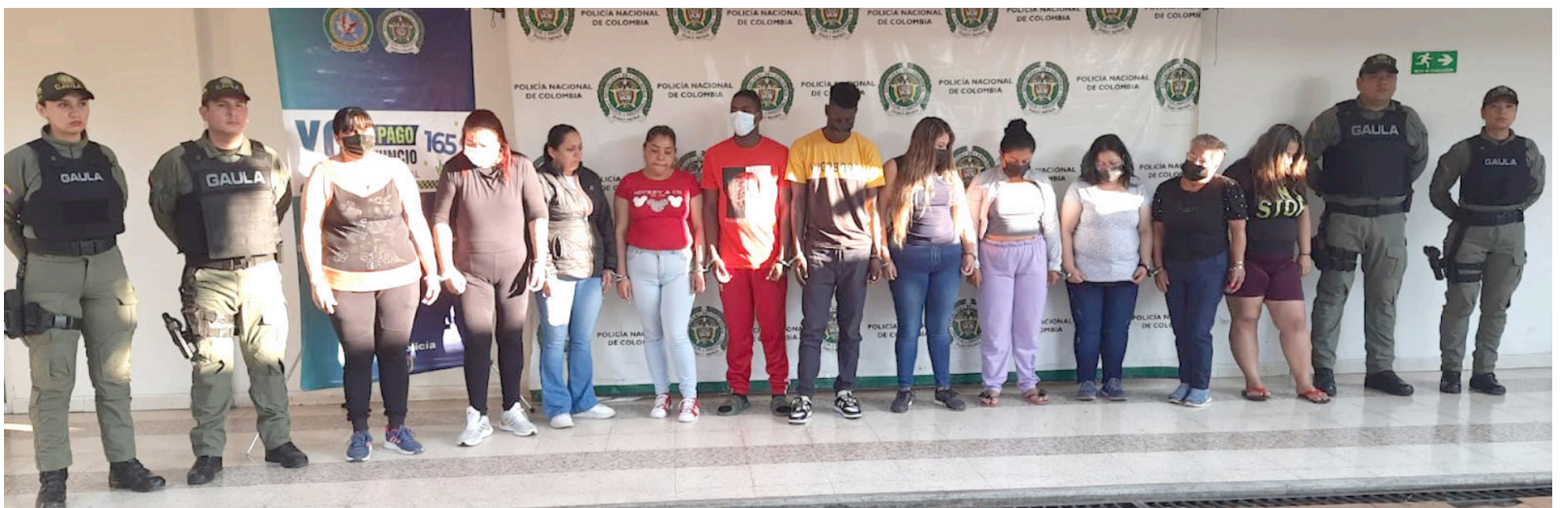
Once personas conformarían esta banda delincuencia dedicada a la extorsión.