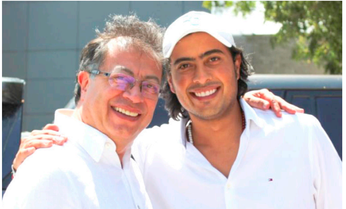
Gustavo Petro pidió investigar a su hijo mayor.

El Presidente Gustavo Petro instó la Fiscalía investigar a su hijo Nicolás Petro, tras las declaraciones que dan cuenta que habría recibido supuestos dineros del narcotráfico.