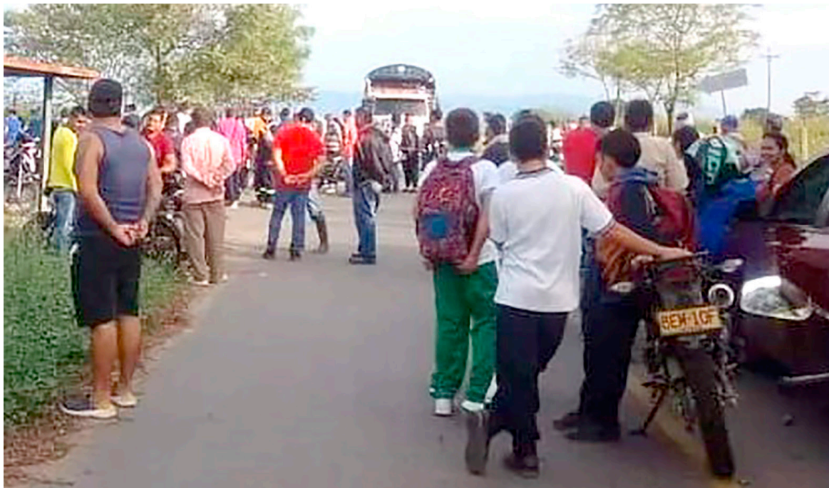
Comunidad de Polonia en Villavieja.

Los que tienen alguna posibilidad económica en sus familias, se transportan en moto, pero tam-