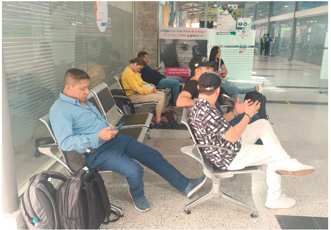
Hasta última hora esperaban poder cumplir con su propósito de viajar.

La Defensoría hizo presencia en compañía de otras instituciones como la Superintendencia de Industria y Comercio, que también hace presencia para garantizar los derechos de los viajeros.