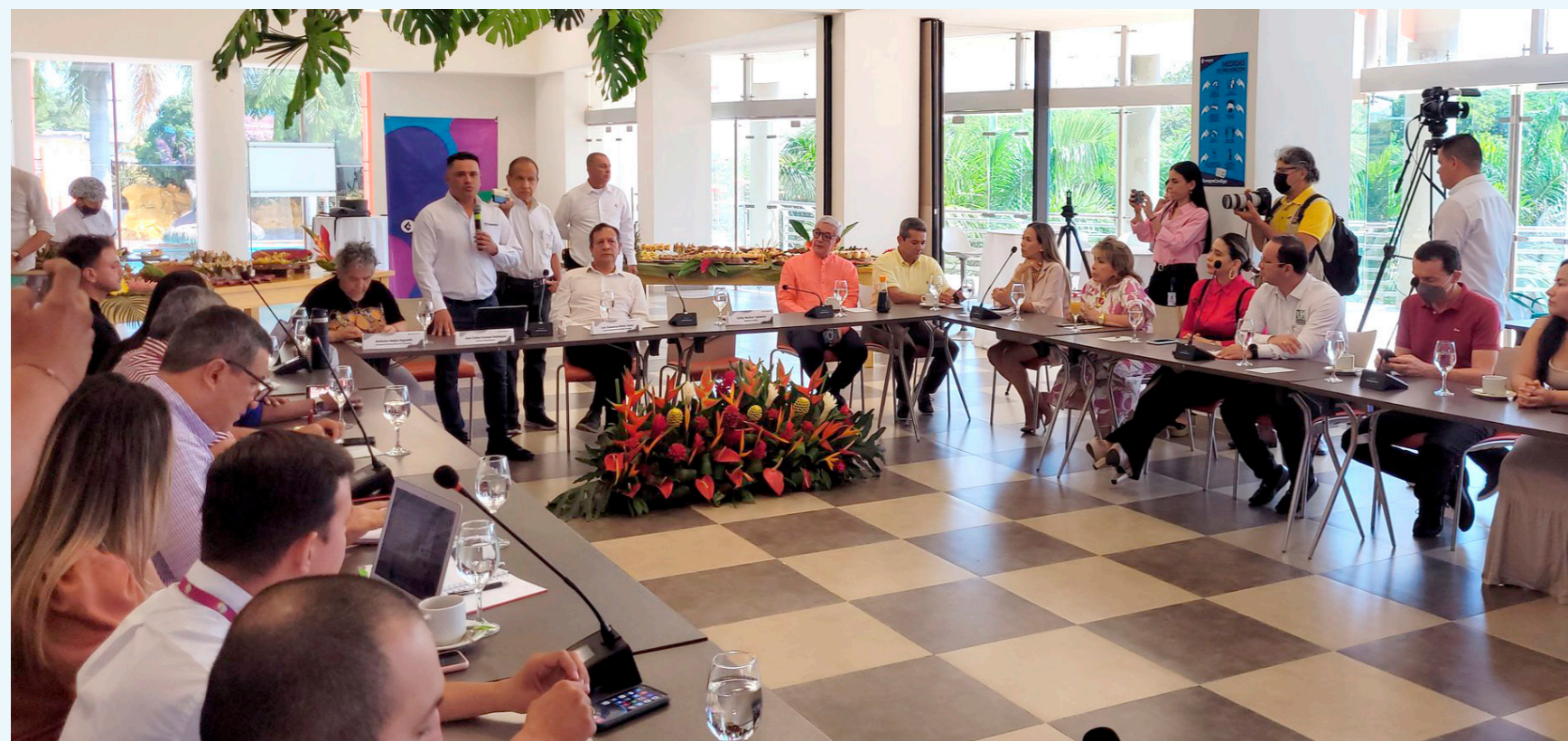
Se espera que en los próximos meses, los proyectos independientes a esta iniciativa se logren unificar.

Creo que es buen momento para volver a retomar un proyecto de esta magnitud. Se han hecho muchas iniciativas, hay muchas ideas, pero verlo en esa magnitud es interesante, más aún con la atención del Gobierno Nacional, Fontur y Comfamiliar del Huila. Yo creo que vale la pena darle trascendencia a esto y ahora que entramos en las campañas políticas, creo que vale la pena poner en contexto este proyecto para los candidatos, no solamente a la alcaldía de la ciudad capital, sino también de los candidatos a la Gobernación, se apropien de ello", Finalizó.