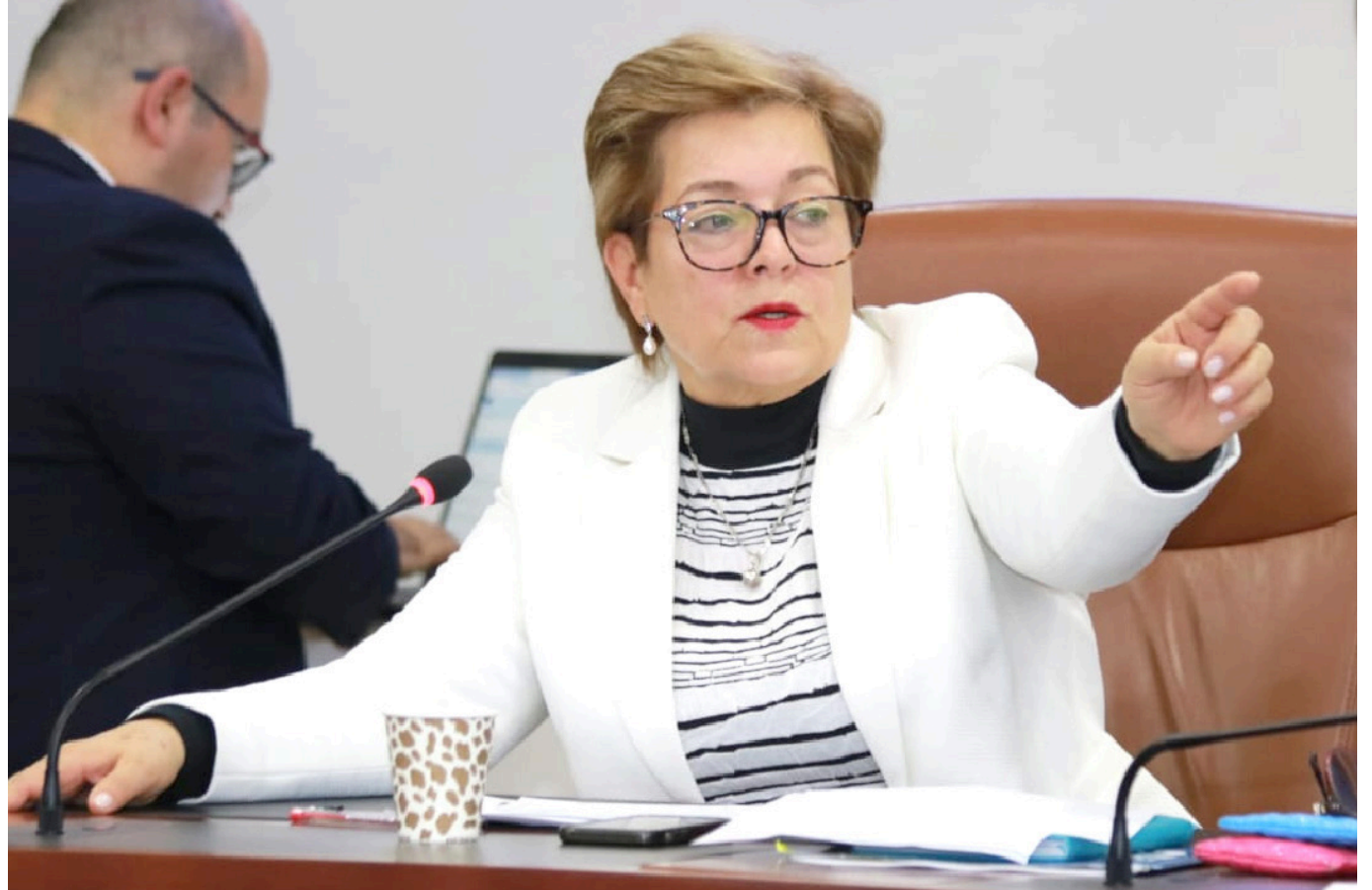
La ministra de Trabajo, Gloria Ramírez dio a conocer algunos de los cambios, que traerá la Reforma Laboral.

“Mi gobierno no otorgará beneficios a criminales a cambio de sobornos. Al contrario, nos encontramos en la construcción de los mecanismos legales para que estas agrupaciones se acojan a la justicia, reparen a las víctimas y cesen la violencia en las ciudades y demás territorios”.