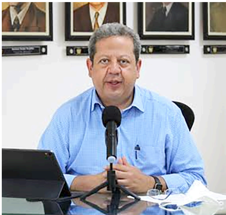
Luis Enrique Dussán, gobernador del Huila

Así las cosas, el despacho consideró que “desde la decisión de primera instancia ha transcurrido un tiempo prudencial, más de tres meses, suficiente para que se hubieran adelantado los trámites correspondientes y para que estuvieran presupuestados los recursos necesarios para dar cumplimiento. Sin embargo, en las respuestas dadas por las entidades al incidente de desacato no se avizora que se esté materializando el cumplimiento del mismo”.