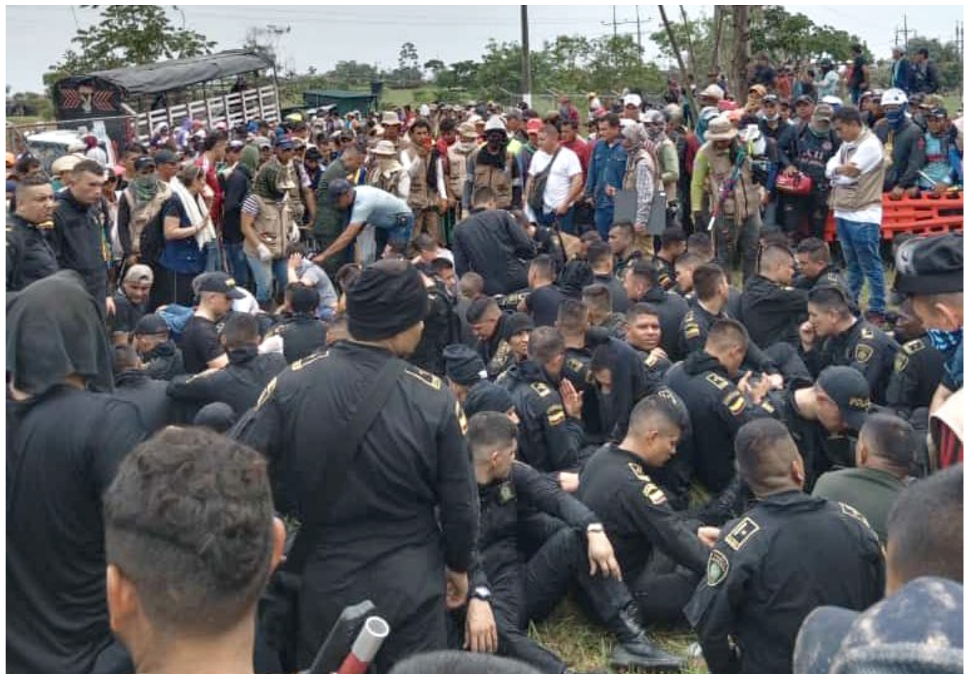
La Defensoría del Pueblo logró liberar a 78 uniformados de la Policía que habían sido retenidos por la Guardia Campesina.