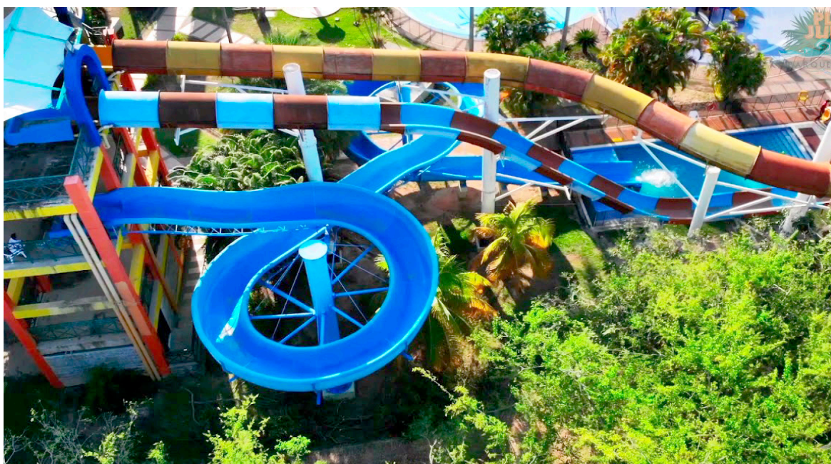
Pitalito será el municipio donde tendrá lugar el centro recreacional más grande del sur del Huila.