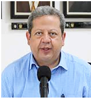
Alcalde de Gigante y gobernador a pagar arresto ■ Primer plano 2-3