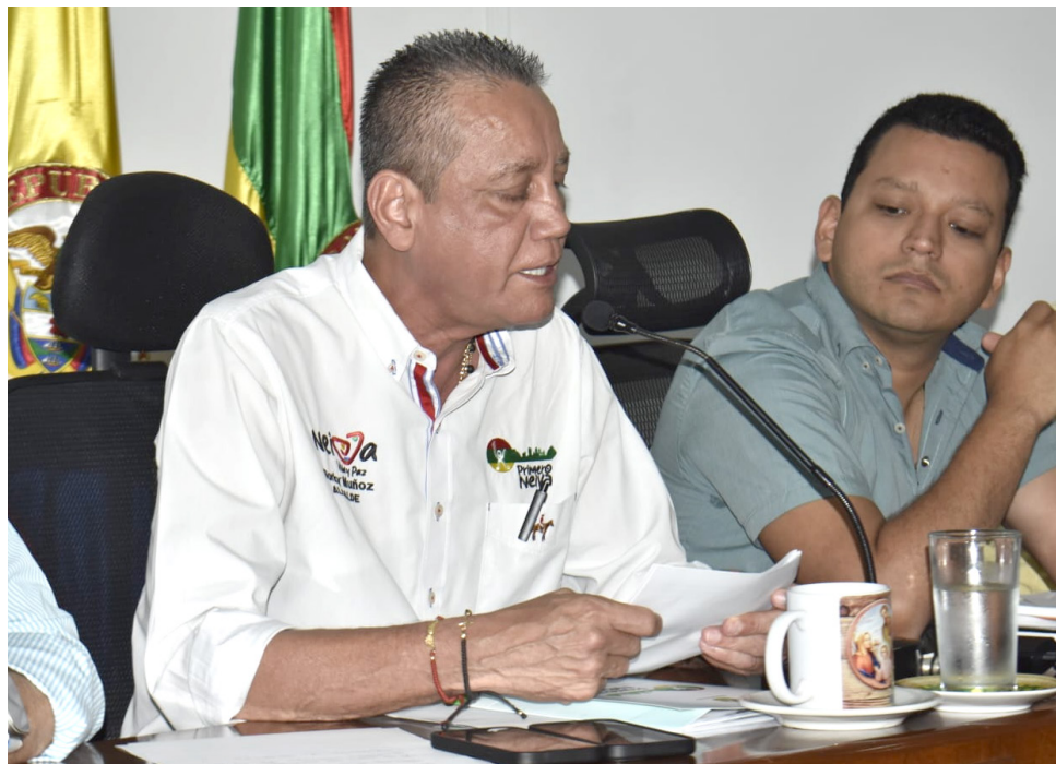
Alcalde de Neiva pidió al Concejo evaluar proyectos.