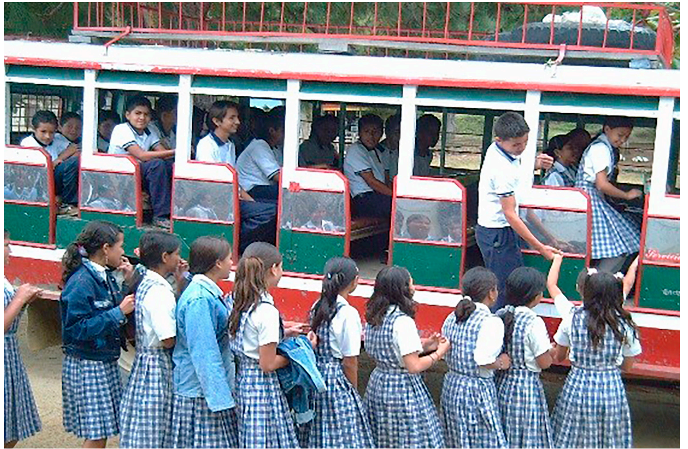
Los estudiantes de la Institución Educativa Sylvania no tienen transporte escolar.

Allí se incluye la IE Sylvania por un valor de $153.341.000 para un periodo de 23 días. Así mismo se evidencia una adición al total del contrato por un valor de $100 millones suscrito el 29 de abril del 2022.