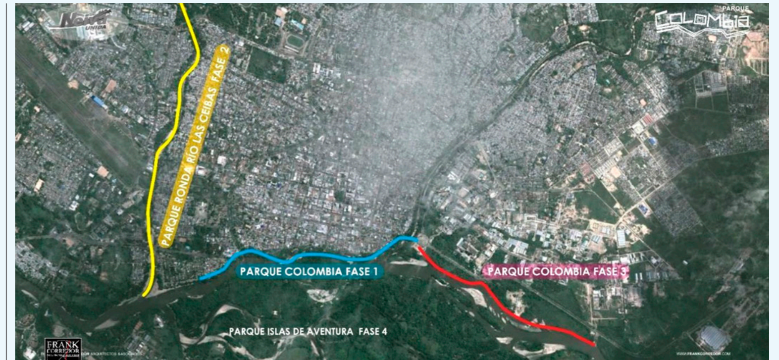
Parque Colombia, que comprendería 8.5 km, se dividiría en estas 4 fases.

"Una iniciativa que generaría empleo, impulsaría el turismo en la región y crearía unidades