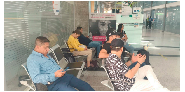
Viajeros de Viva Air se quedaron sin respuestas en el Benito Salas ■ Neiva 6