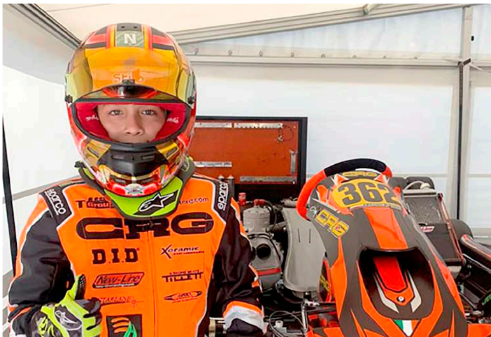
Para esta temporada la participación internacional también es una de las prioridades.

2023 será un escalón más en la carrera de esta joven promesa del deporte huilense y colombiano en el objetivo final de correr en fórmula 1.