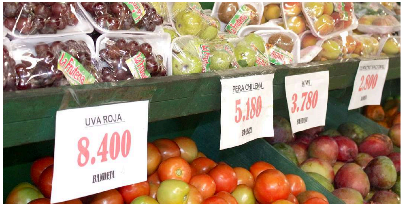
Enero tampoco ha sido un mes bueno para los comerciantes de alimentos.

Bajo esa lógica, la expectativa está sujeta al manejo que las diversas empresas le den a la situación tanto por el incremento del salario mínimo, la ubicación de la inflación y las afectaciones que esto conlleva.