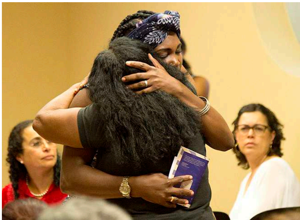
La Comisión y el Movimiento por la Paz (MPDL) se unieron para escuchar a las víctimas de violencia sexual.