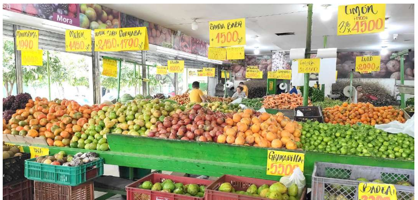
Los comerciantes de alimentos no fueron ajenos a esta situación y, ahora, luego de un diciembre complejo están expectantes del movimiento que se tendrá durante esta vigencia.

Según el DANE, en diciembre de 2022, los mayores incrementos de precio se registraron en alimentos como arracacha, ñame y otros tubérculos (109,84%), cebolla (106,81%) y yuca para consumo en el hogar (88,08%).