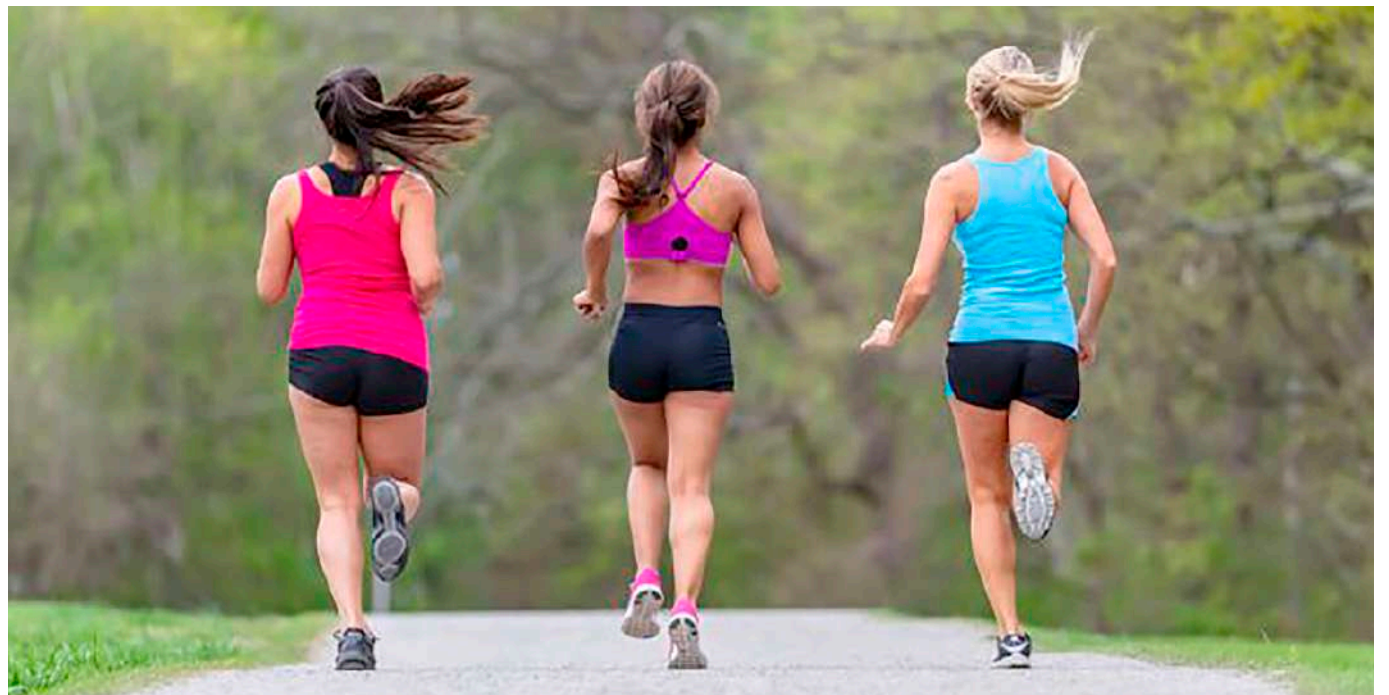
No interesa si se hace entre semana o los fines de semana, lo importante es cumplir la regla.

todo es recomendable realizarlo bajo la supervisión médica, dado que cada caso es distinto dependiendo de las condiciones particulares que tenga cada persona.