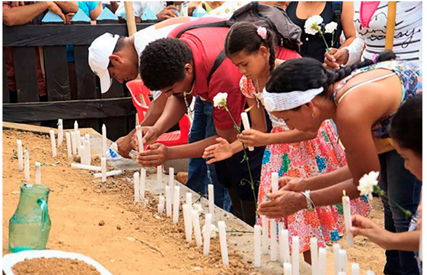
La reparación de las víctimas en Colombia ha sido una promesa parcialmente cumplida.

“El reconocimiento de estas violencias que hizo la Comisión de la Verdad fue esencial pues hablamos de derechos reproductivos que deben ser reconocidos como derechos humanos”.