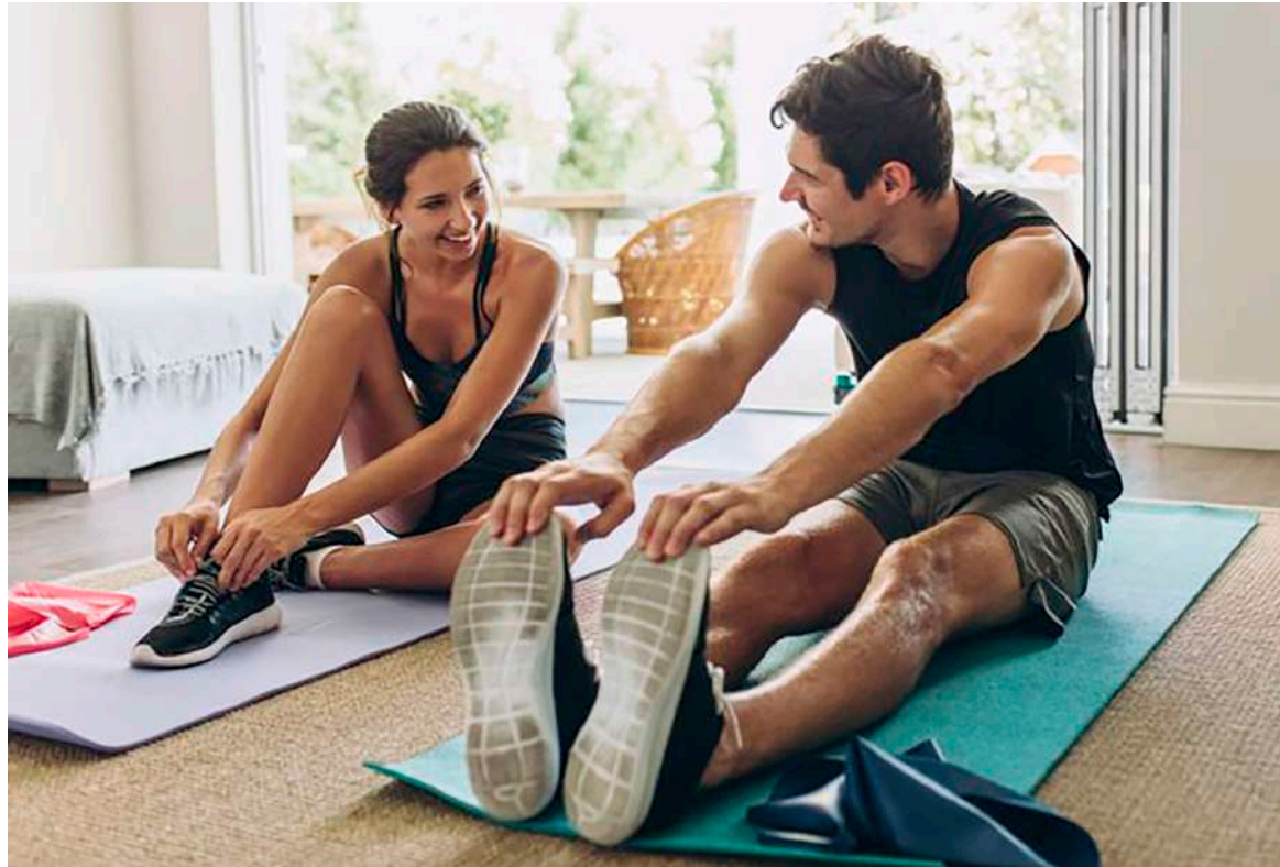
La actividad física, tal como se decida realizar, es importante para la salud humana.

En comparación con los participantes físicamente inactivos, los participantes activos (tanto gue-