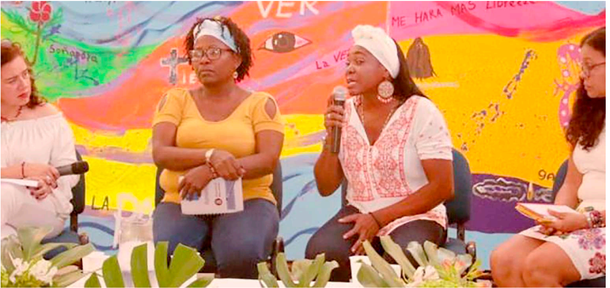
La Comisión de la Verdad a partir de su escucha activa pudo conocer los casos de violencia sexual que no habían sido denunciados.