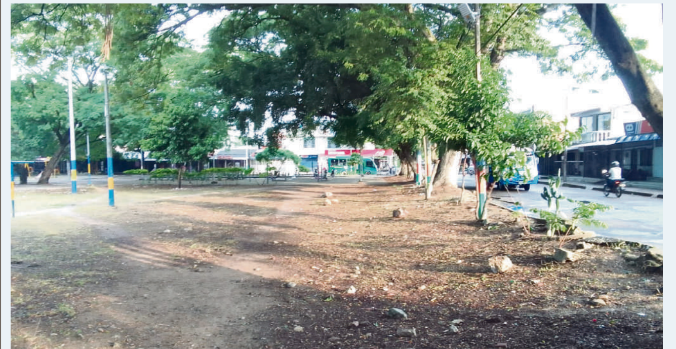
Tiene amplias zonas verdes y comercial.