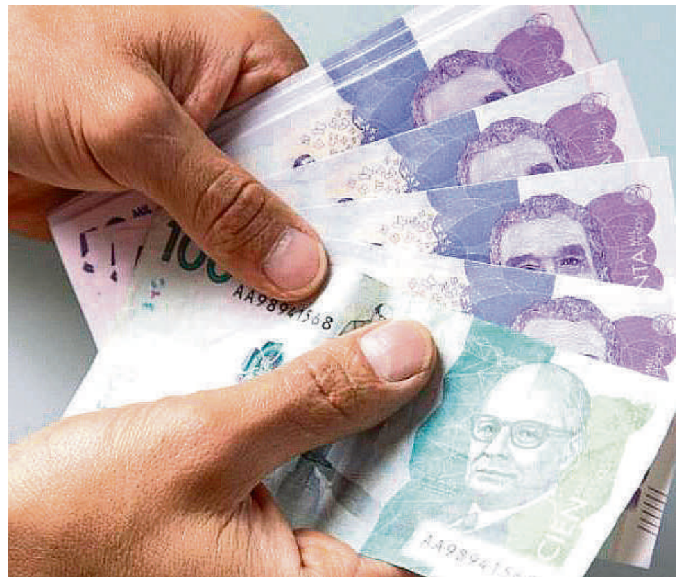
El Gobierno se puso como meta desindexar 204 rubros

Junto con estas acciones se espera que en los próximos meses se den nuevas medidas que permitan aliviar el bolsillo de los colombianos. Este será uno de los temas más importantes que se aborden en las próximas agendas legislativas del Congreso de la República, y que estarán amparadas por los intereses del Gobierno y el sector productivo nacional.