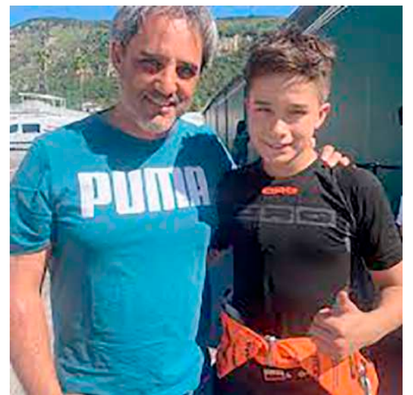
El piloto huilense brilla en cada una de sus participaciones.

En el año 2015 fue su primera carrera internacional en Italia en la categoría baby quedó campeón mundial, después subió a la ca-