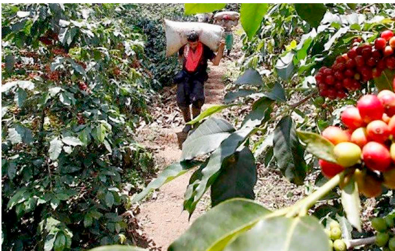
El Huila tiene que prepararse para efectos de poder convocar al país cafetero y tener la posibilidad de contar con ese gerente general.

Lo que se está viviendo es un tema mundial, no solamente de los caficultores o la región. En ese orden de ideas nosotros nos tenemos que dedicar al tema del café, no solo a la producción sino también a la comercialización