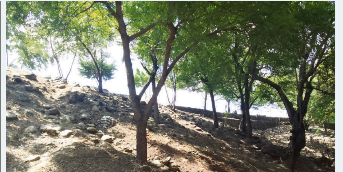
Altos del Limonar una de las partes del barrio.