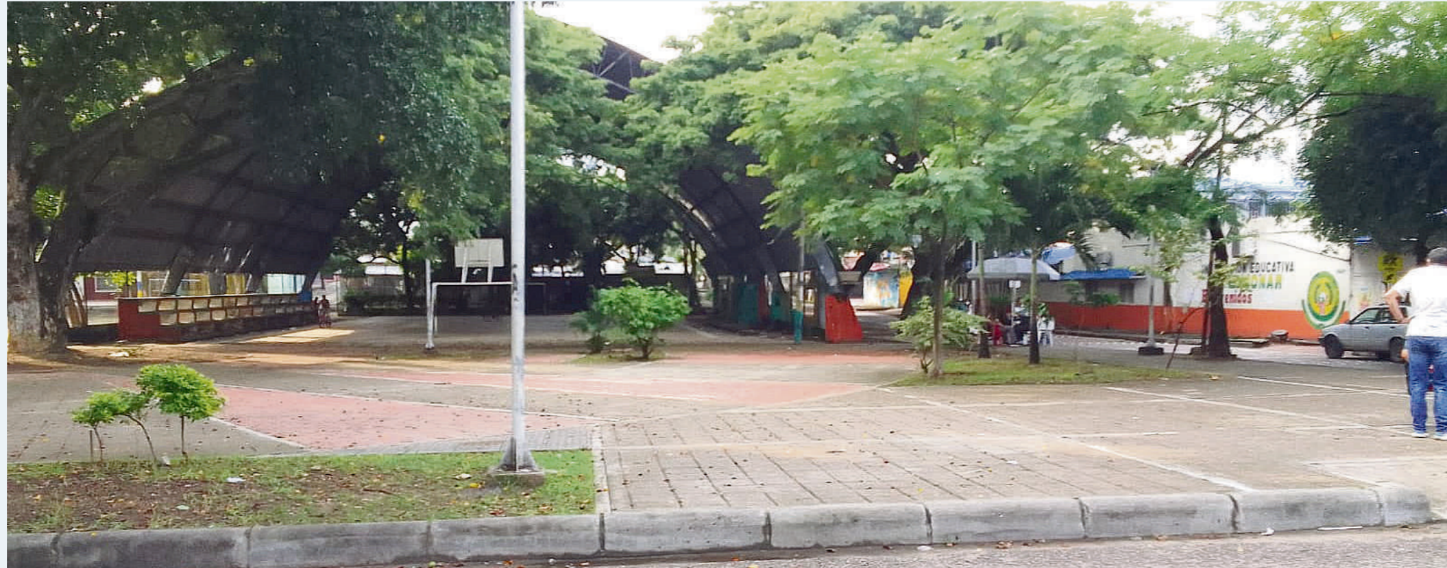
Limonar parte alta uno de los tres sectores del barrio Limonar.