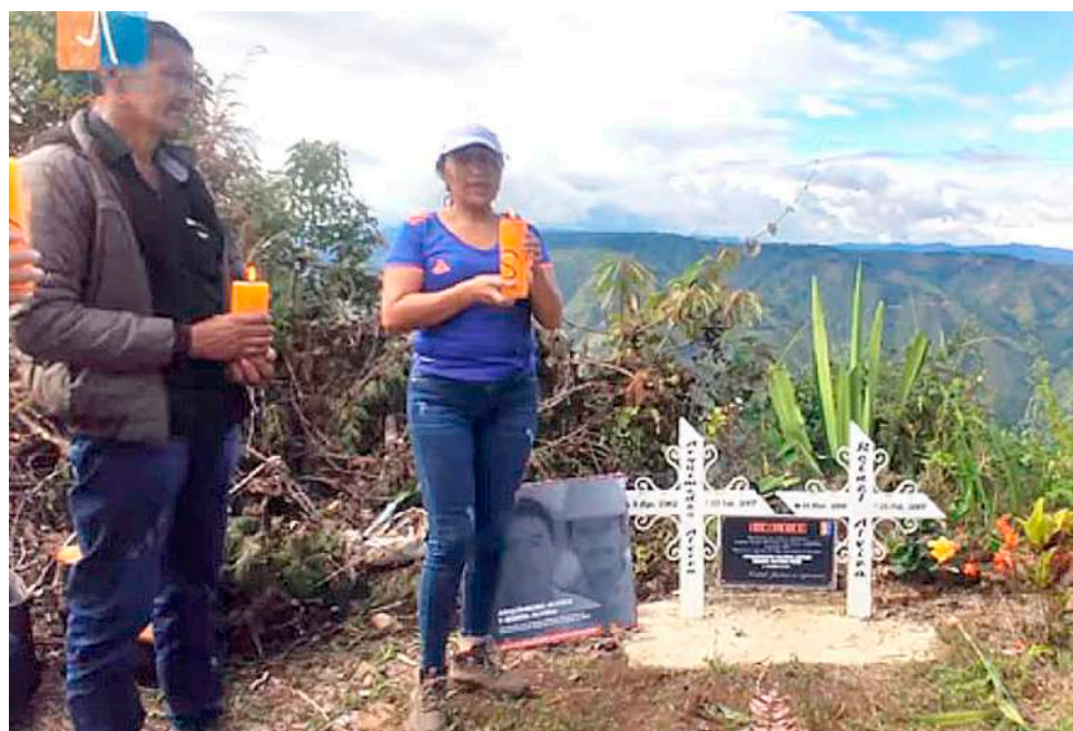
El 14 de diciembre, pese a que las excusas públicas no las presentaron en la vereda donde vivió Arquímedes y su hijo, la familia hizo un acto simbólico.

El reconocimiento simbólico se hizo el 14 de diciembre del año pasado. Incluso las excusas que presentaron en el periódico, ¿por qué ellos no lo hicieron en primera plana?