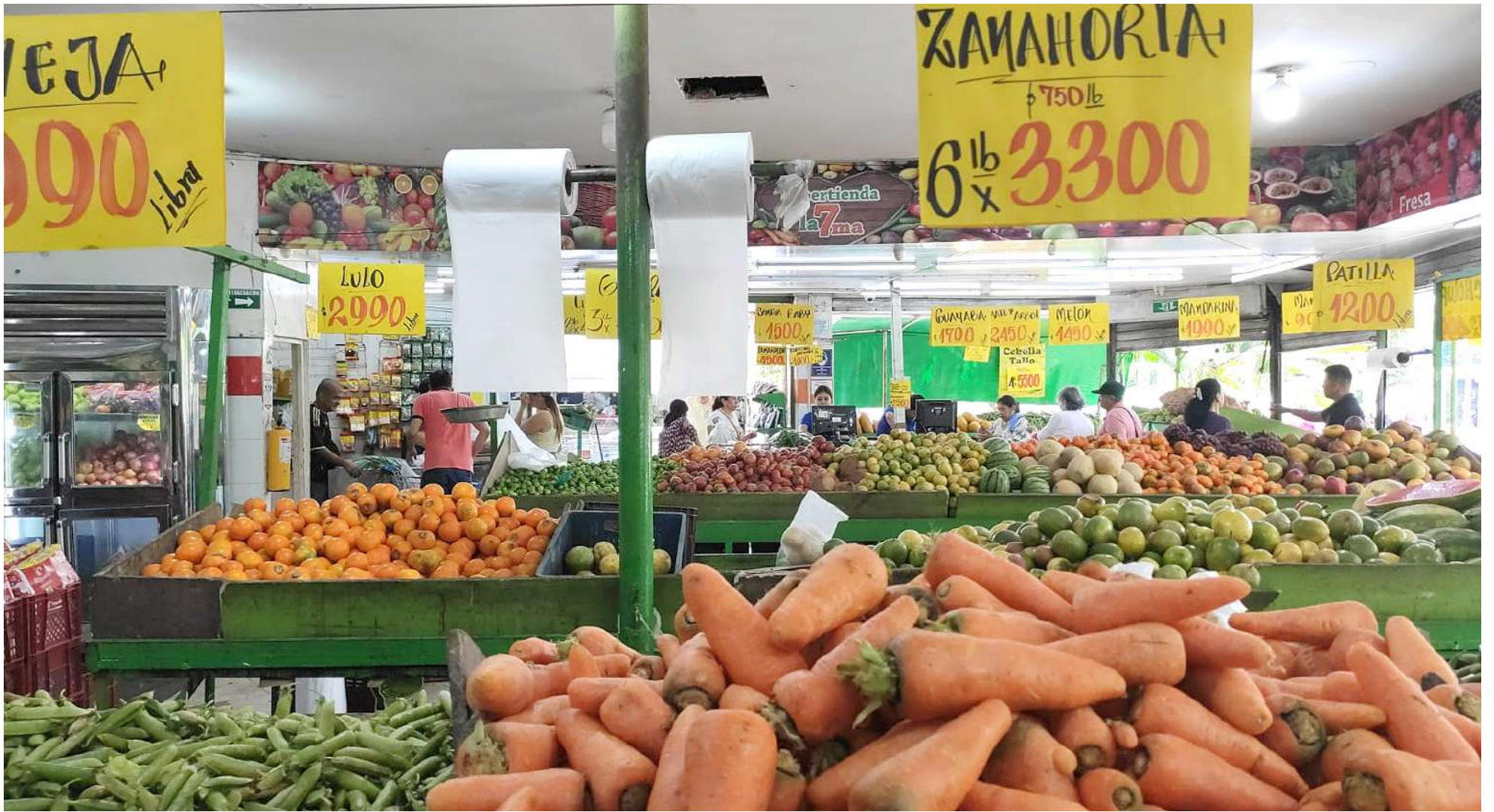
La dinámica alimentaria durante la vigencia del 2022, según algunos comerciantes, se tornó lenta y compleja dadas las variaciones registradas.