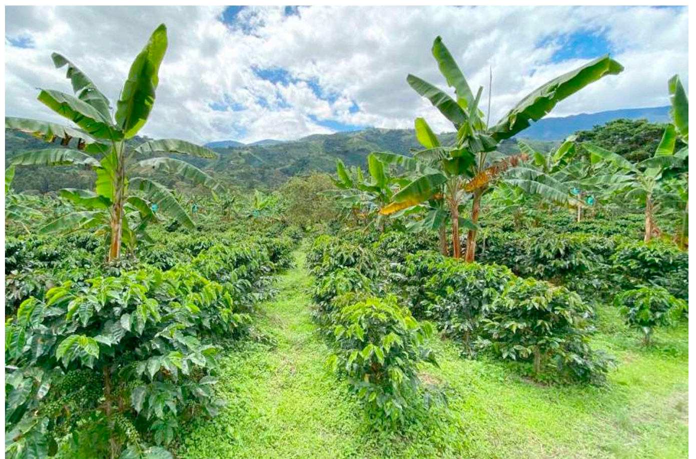
A pesar de la baja que se evidenció desde el orden nacional, el Huila no tuvo estos percances y la razón es simple, pues el gremio ha venido accionando de manera adecuada.

Esto desde luego al interior de la Federación de Cafeteros y, además, en el mejoramiento y articulación que se tiene que dar con las diferentes entidades o instituciones de orden público o privado, bien sea nacional o regional con el propósito de seguir generando desarrollo y bienestar de la actividad cafetera que le suma y le aporta al país y departamento del Huila.