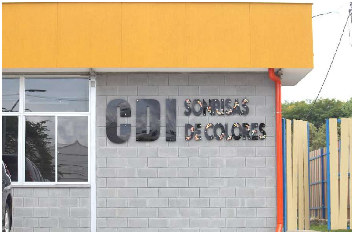
Hasta Neiva llegaron la ministra de Vivienda y el ministro de Educación para entregar el CDI.

La ministra destacó la respuesta de la comunidad huilense y la participación de las mujeres, porque, precisamente, “quienes somos madres entendemos la importancia de lo que significa contar con una infraestructura de estas caracterís-