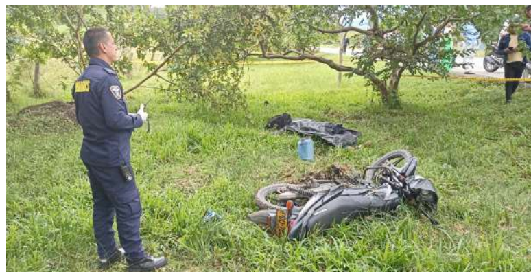
Accidente de tránsito donde pierde la vida una persona.

La Policía Nacional seguirá realizando estos controles con el fin de evitar que utilicen a los niños, niñas y adolescentes en la comisión de delitos; así mismo, se hace el llamado a la ciudadanía para que denuncien a través de la línea 3102069032 del grupo de infancia y adolescencia cualquier afectación de derechos a niños, niñas y adolescentes.