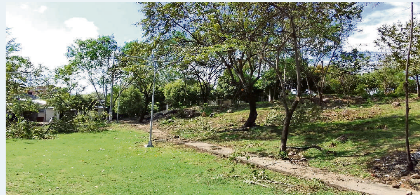
Limonar Bajo, donde nació el barrio.

El mensaje final a todos los Neivanos es para que embellezcamos entre todos nuestra ciudad, comenzando por nuestros barrios, nuestras casas, si estos están bonitos, la ciudad será el reflejo de nuestra cultura. Si nuestra casa está fea nuestra ciudad está fea, concluyó”.