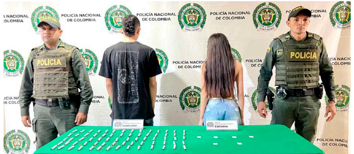
Pareja capturada con estupefacientes en el Parque de los niños.

En otro hecho se registró la captura en flagrancia de un adolescente de 15 años, quien portaba 344 dosis Marihuana y 360 dosis de Bazuco listo para su comercialización.