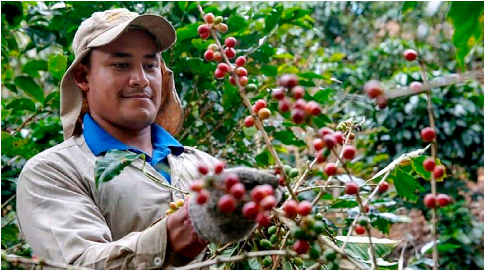
Los precios se han mantenido alrededor de los $2 millones, un buen precio del café, los cuales, esperamos se mantenga en el 2023.

también sucede en Pitalito, pero no con tanta avidez como sucede en el norte y occidente de la región, en donde son más tecnificados. Insisto, sin embargo, que claramente por la calidad del producto y número de hectáreas, el sur del departamento se destaca