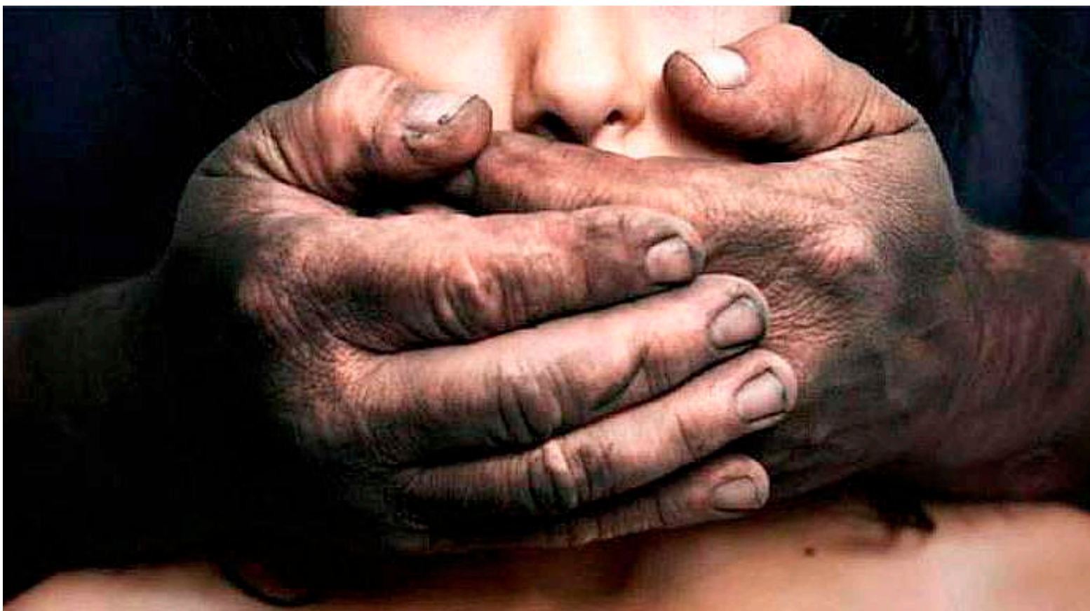
En Colombia hay registradas 15.738 víctimas de violencia sexual entre 1958 y 2018.

Para la Procuraduría se evidencian esfuerzos institucionales, pero se presentan situaciones que pueden conllevar a mayores índices de impunidad de la violencia sexual y deben revisarse, tales como el alto porcentaje de archivos, el aumento de absoluciones y preclusiones, el bajo número de sentencias y de capturas; y la dificultad en el avance procesal de los casos, ya que la mayoría se encuentran en etapa de indagación.